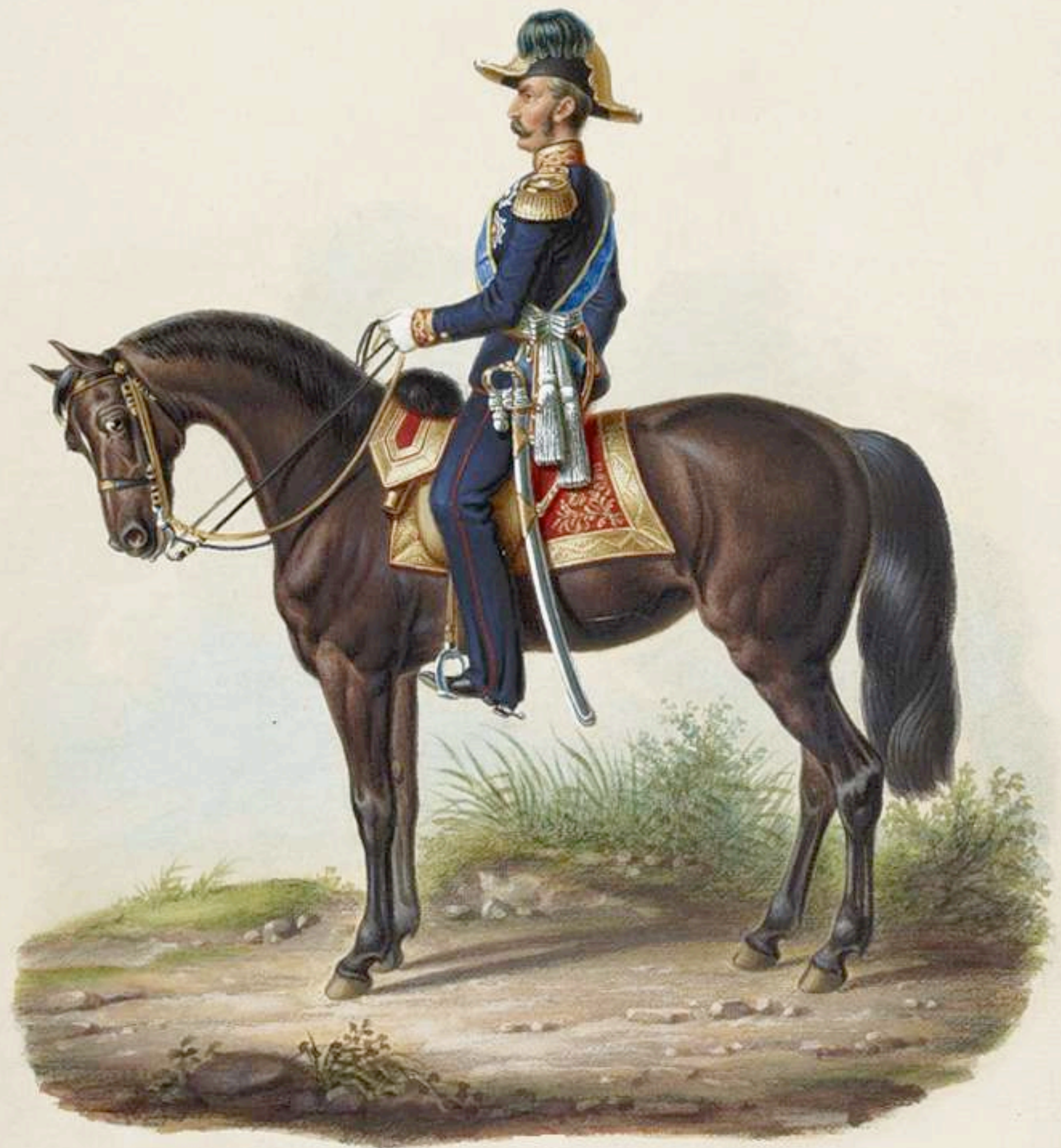
General Mayor de Infantería- Gala