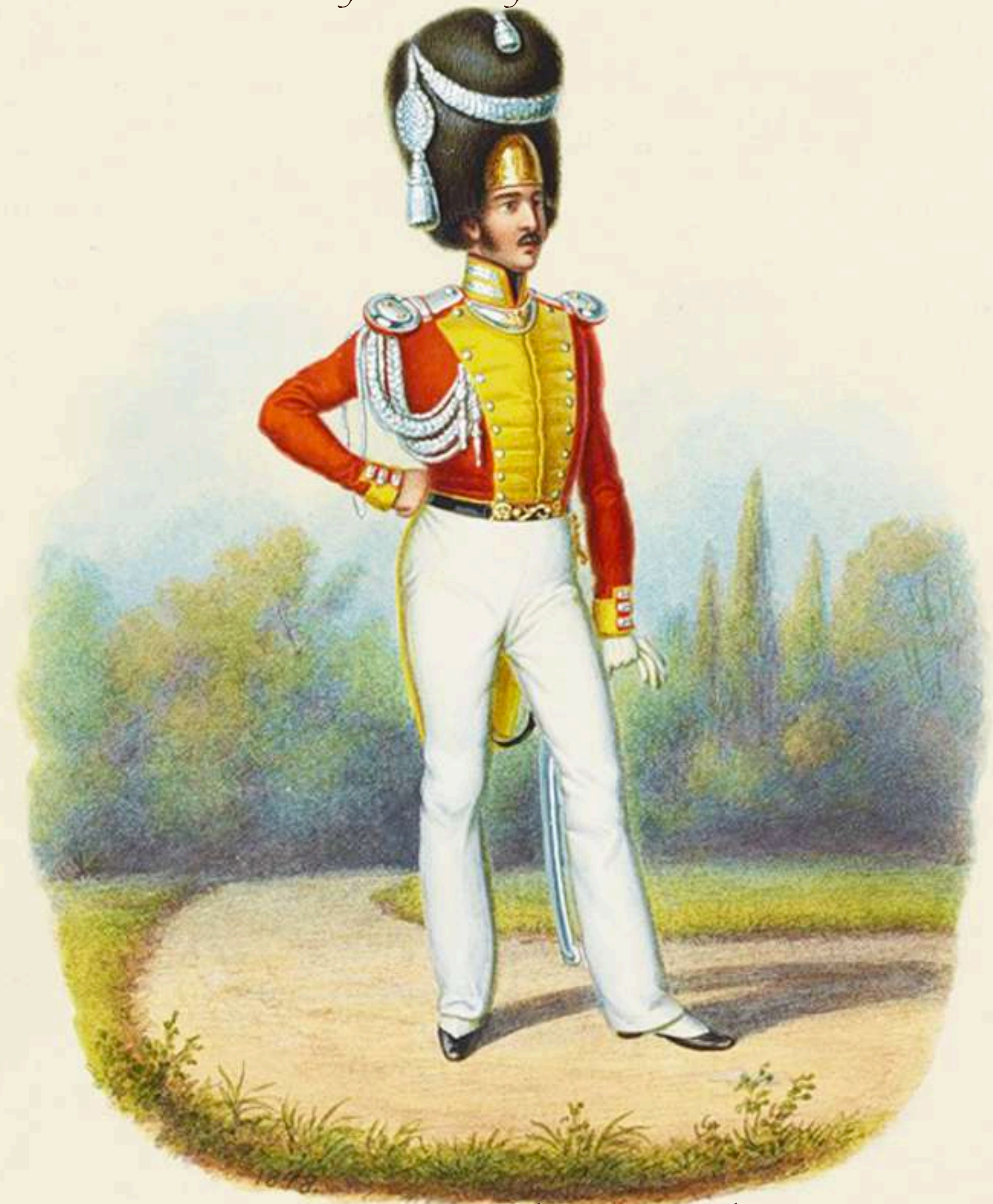
Vieja Guardia, Gran Gala