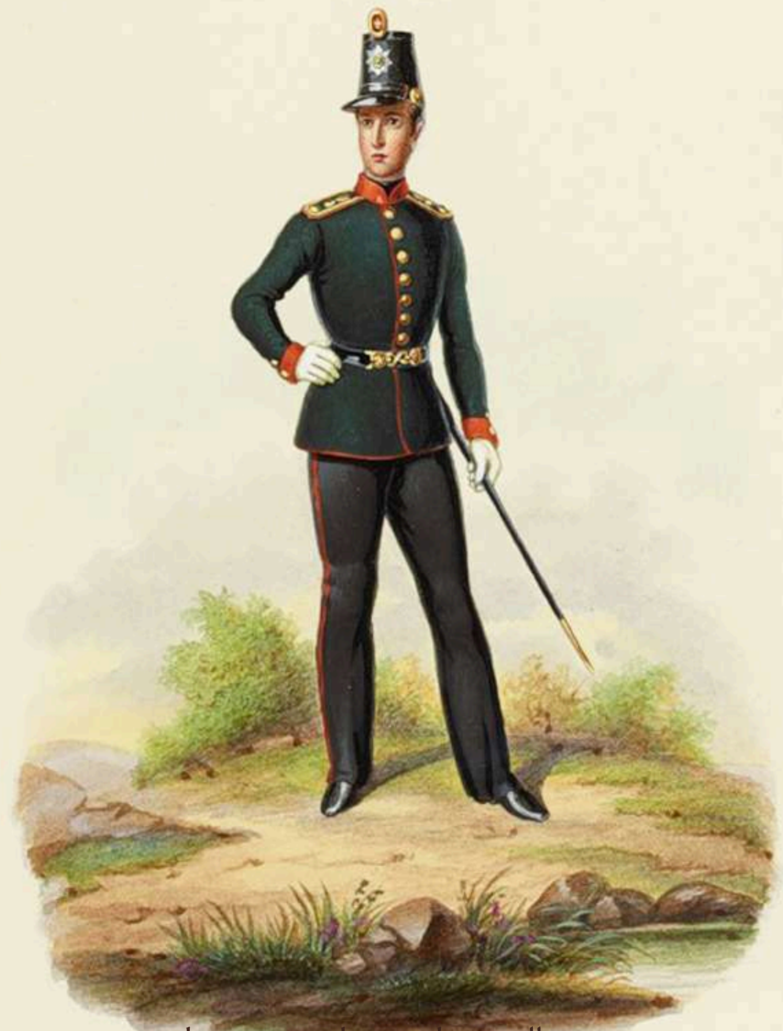
Cadete, Academia de Artillería