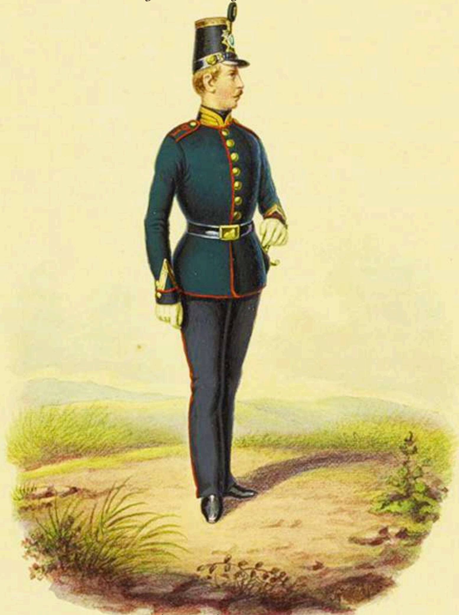
Intendente de Cazadores