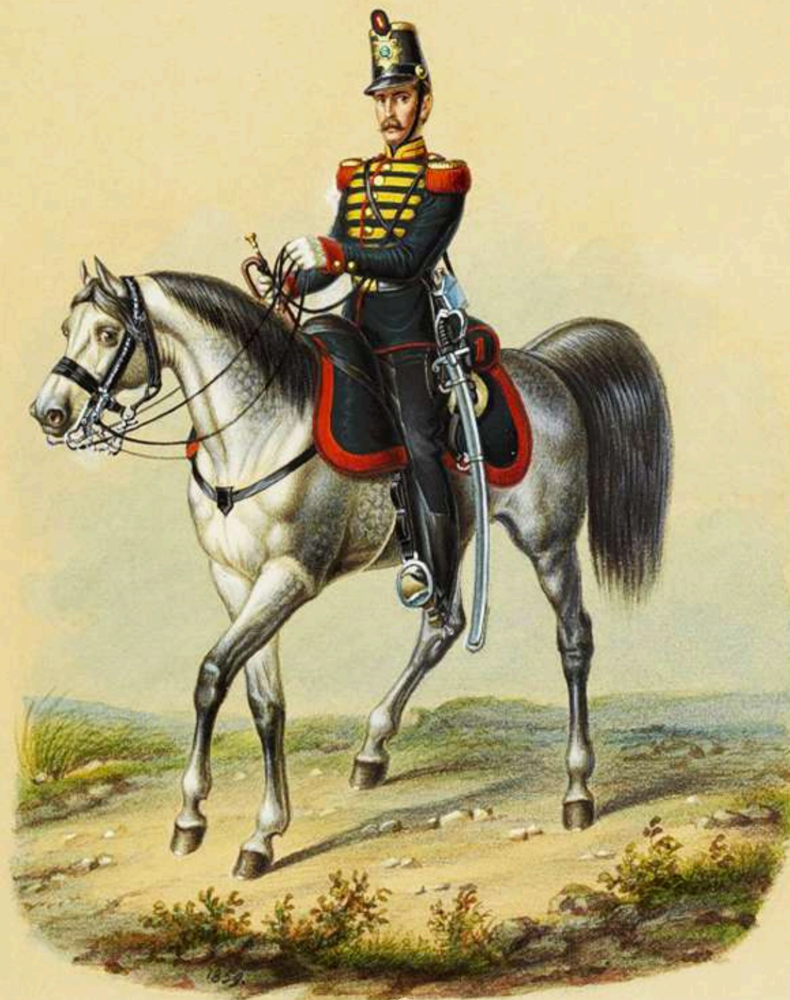
Sargento trompeta de Artillería a pie