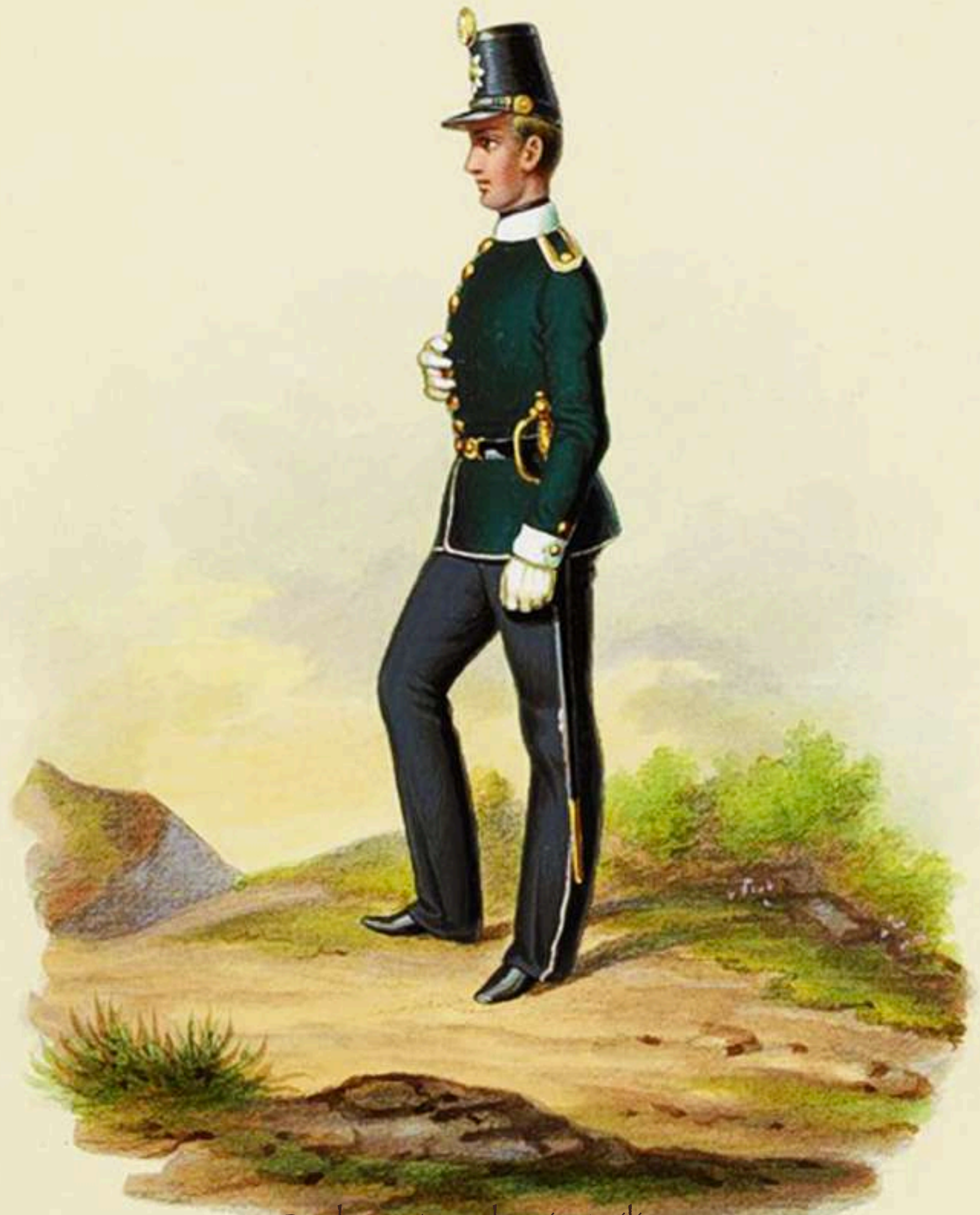
Cadete Academia Militar