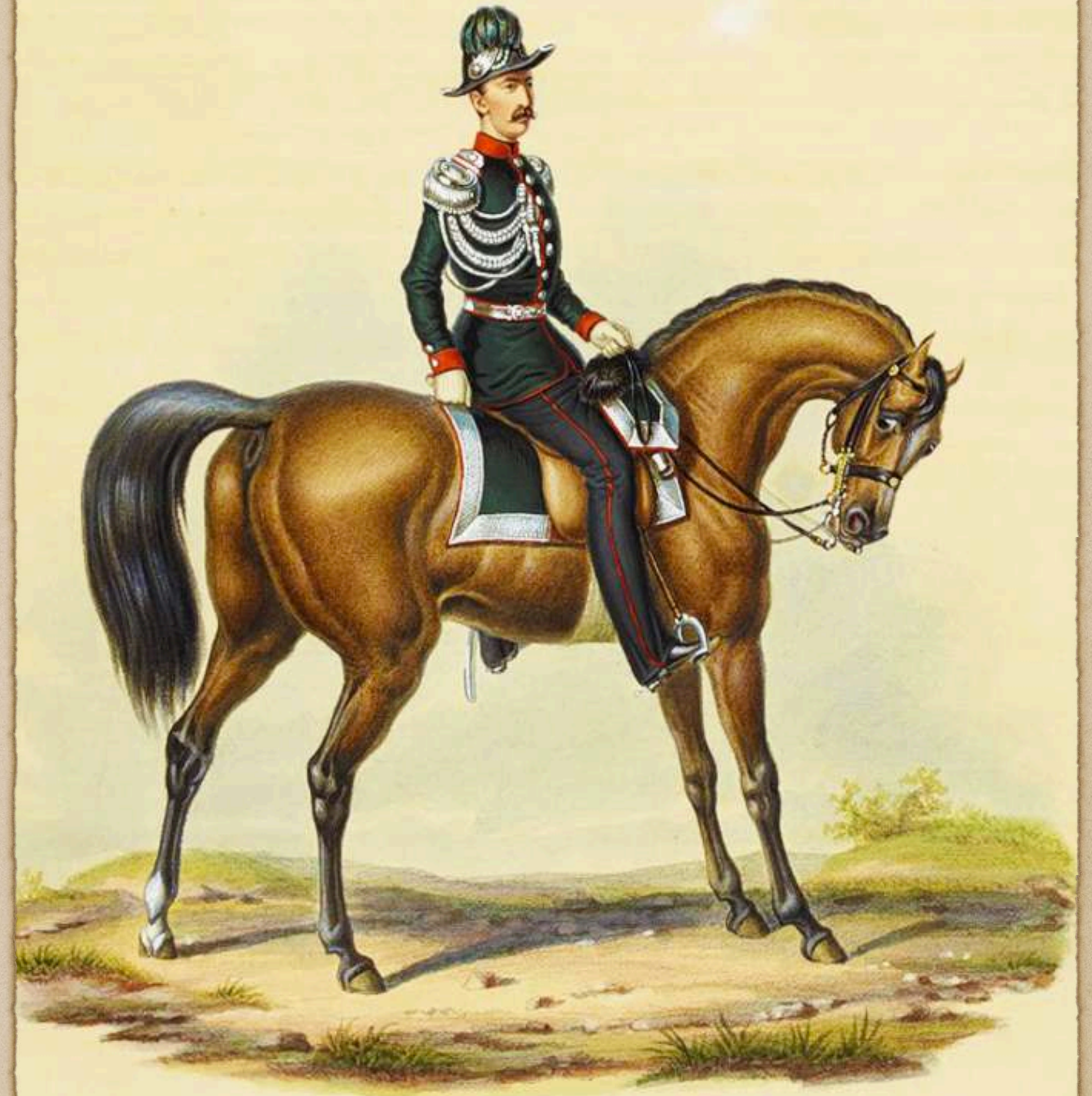
Tte. Coronel Ingenieros, Estado Mayor