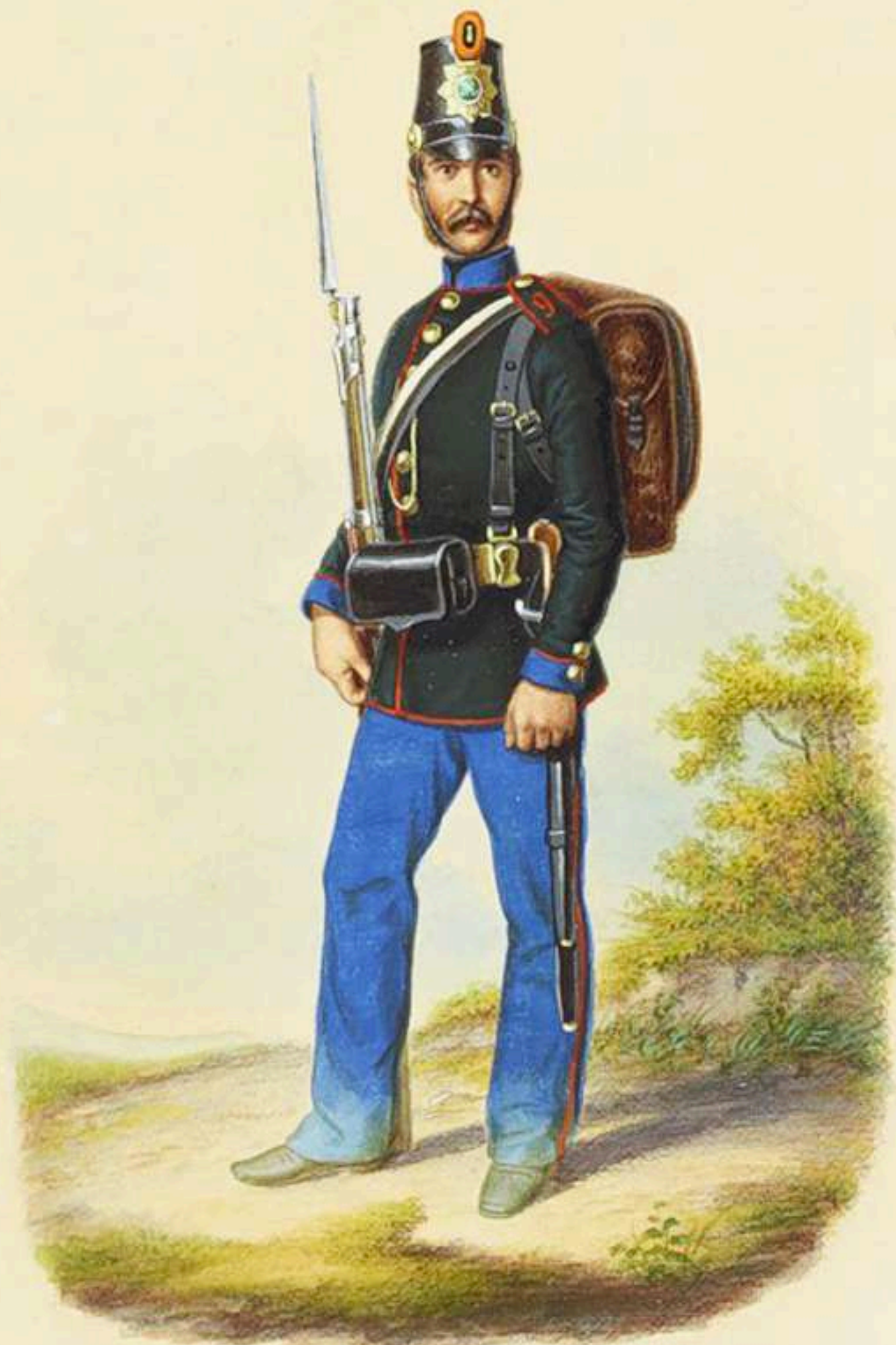
Soldado, 3ª brigada 9º Batallón