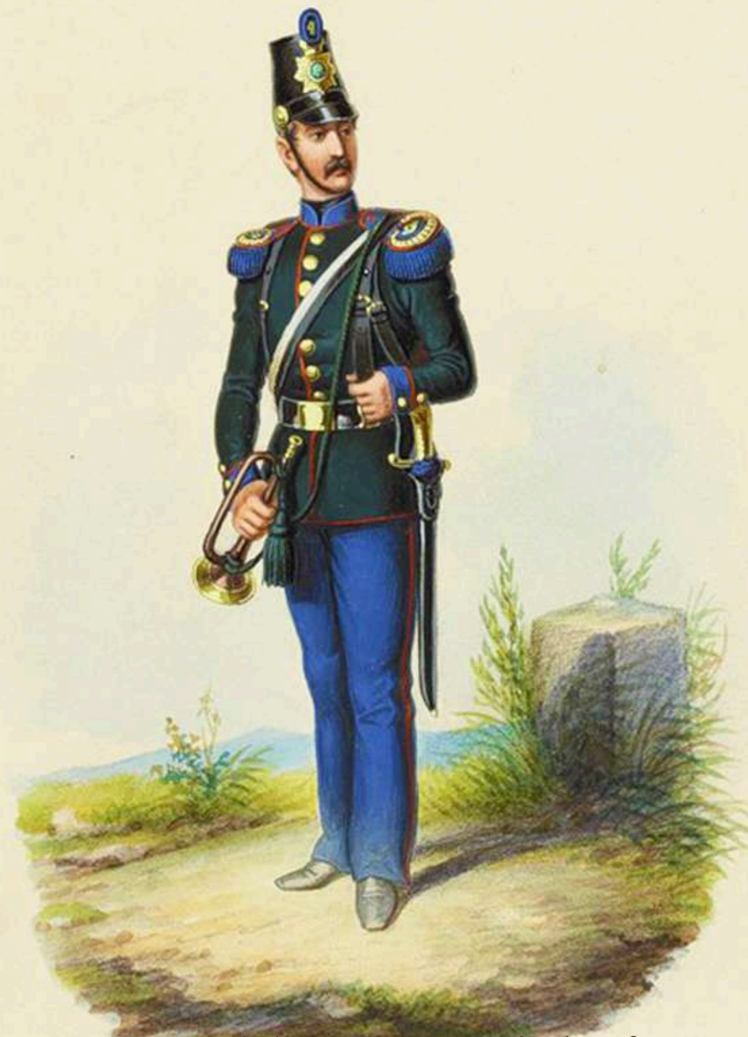
Corneta de la primera Brigada de Infantería