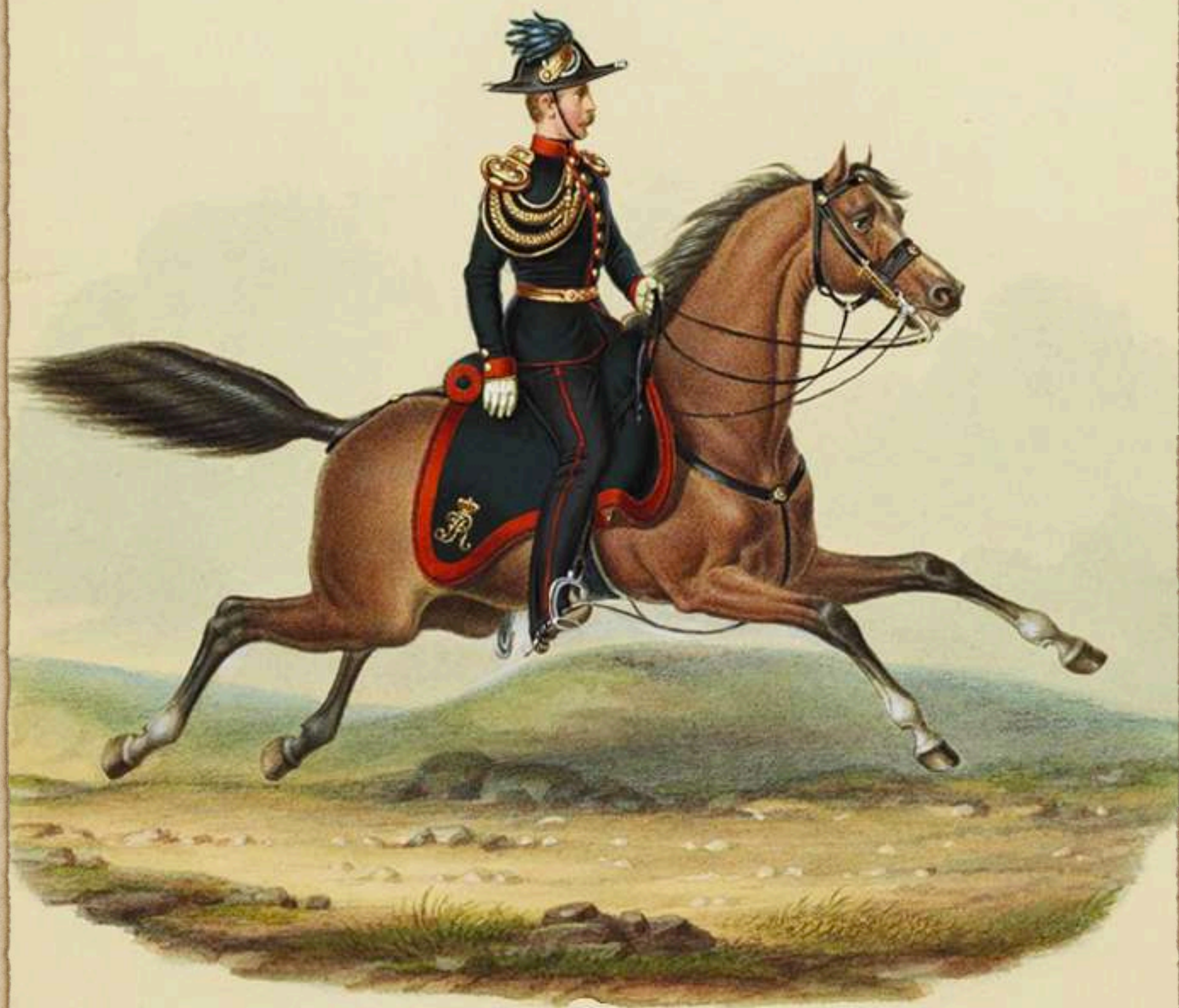
Ayudante de División, Artillería a pie