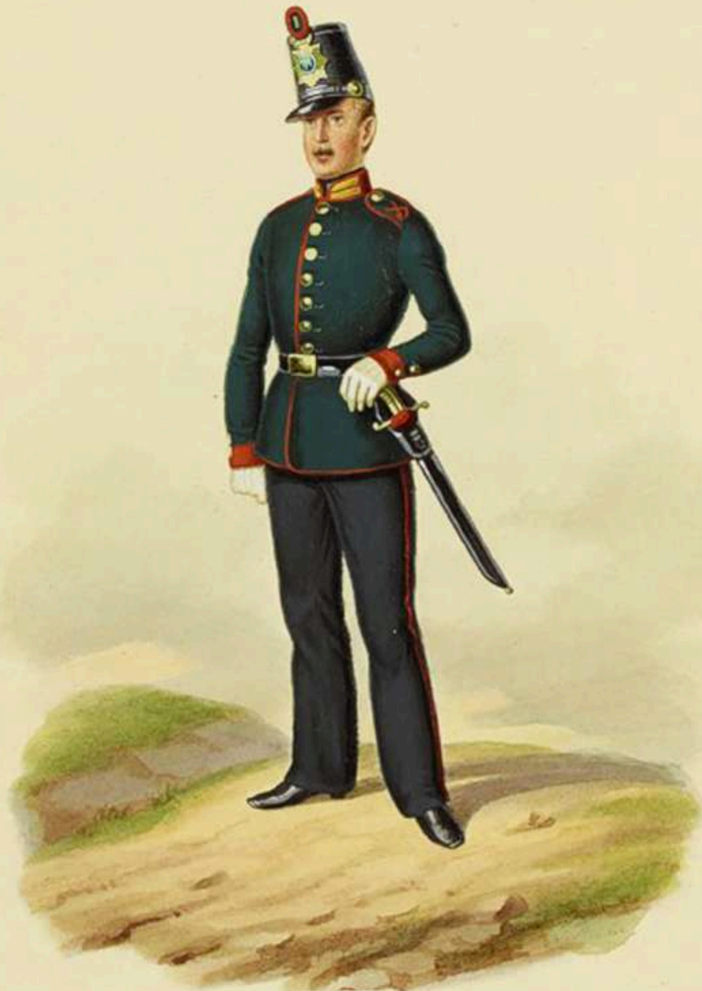
Zapador, batallón de gastadores