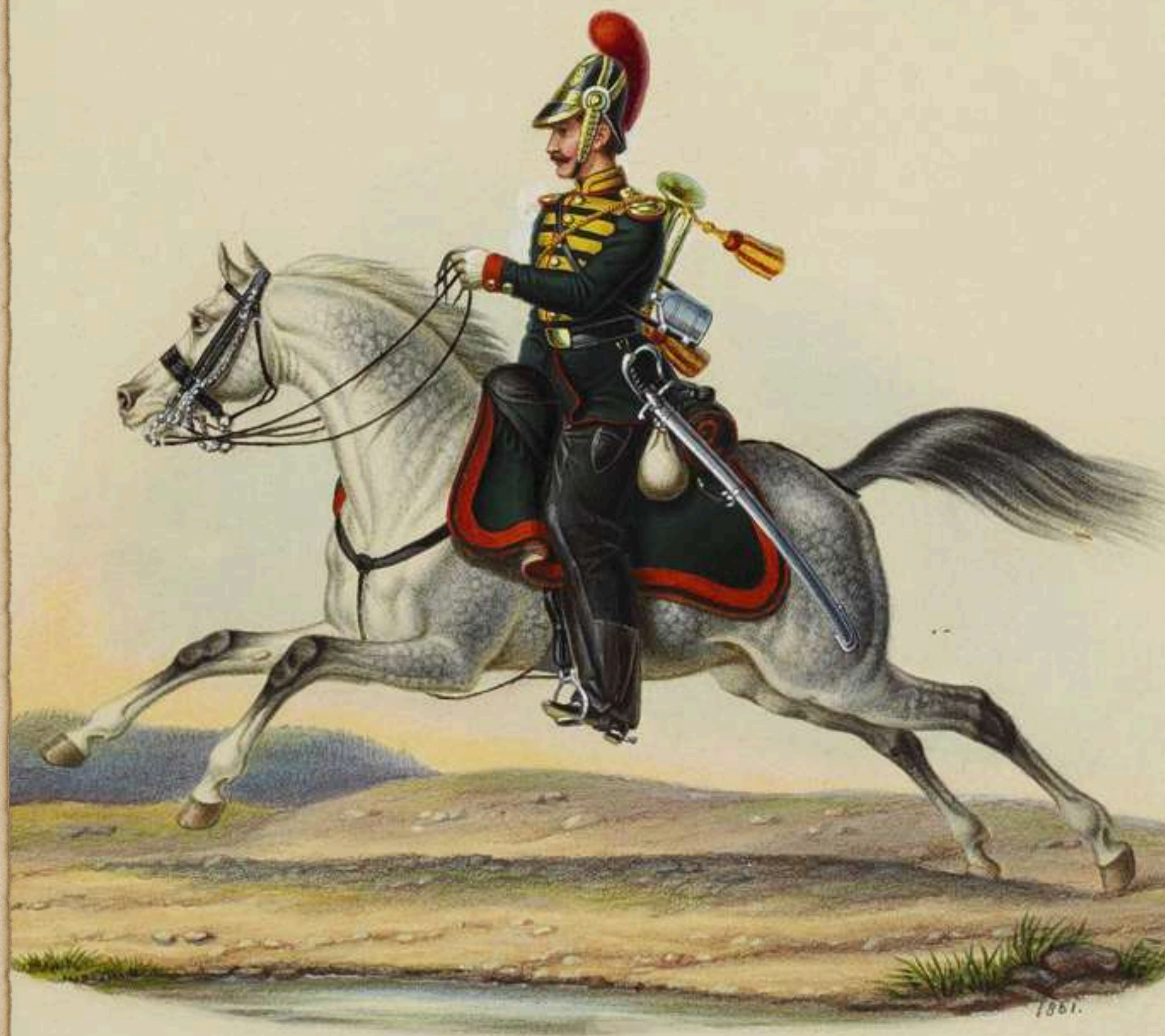
Trompeta, Artillería a caballo