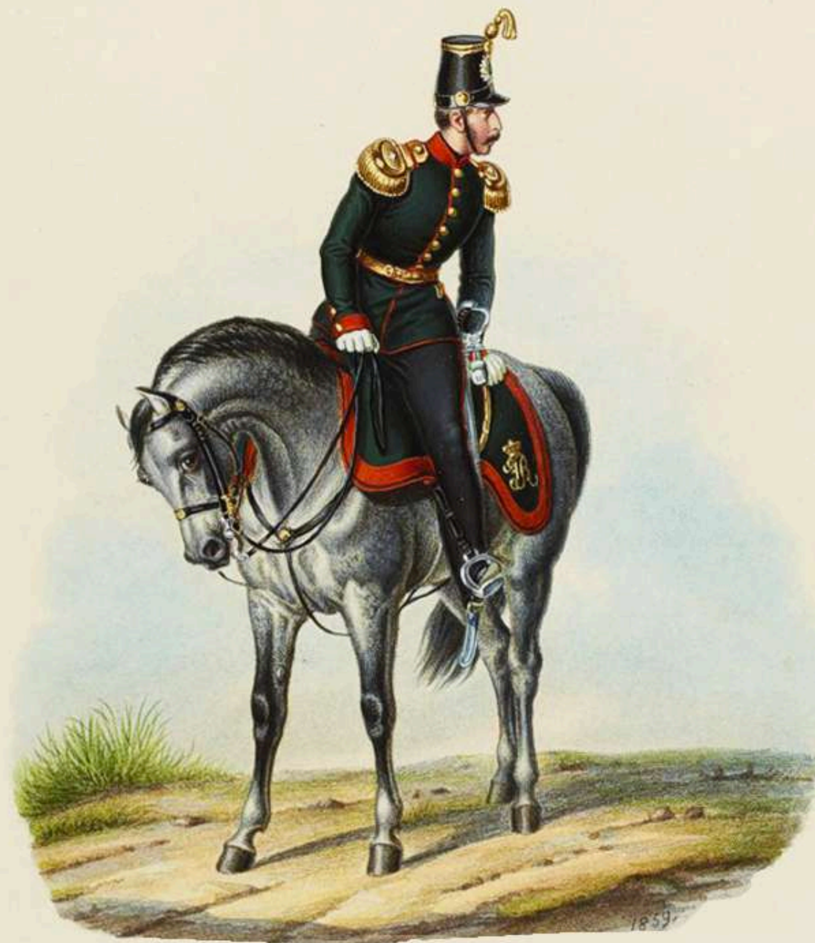
Mayor de Artillería a pie