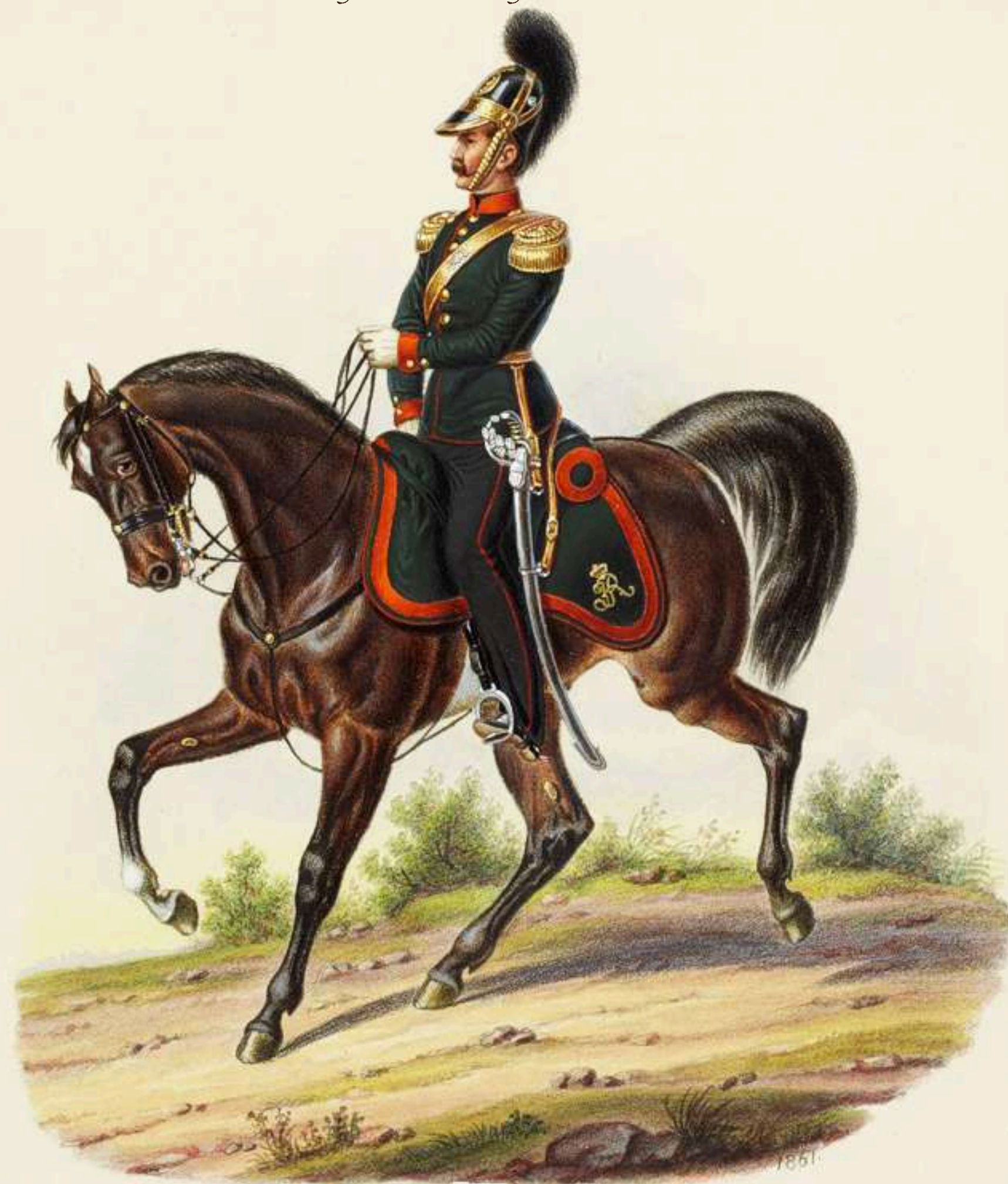
Oficial, Artillería a caballo