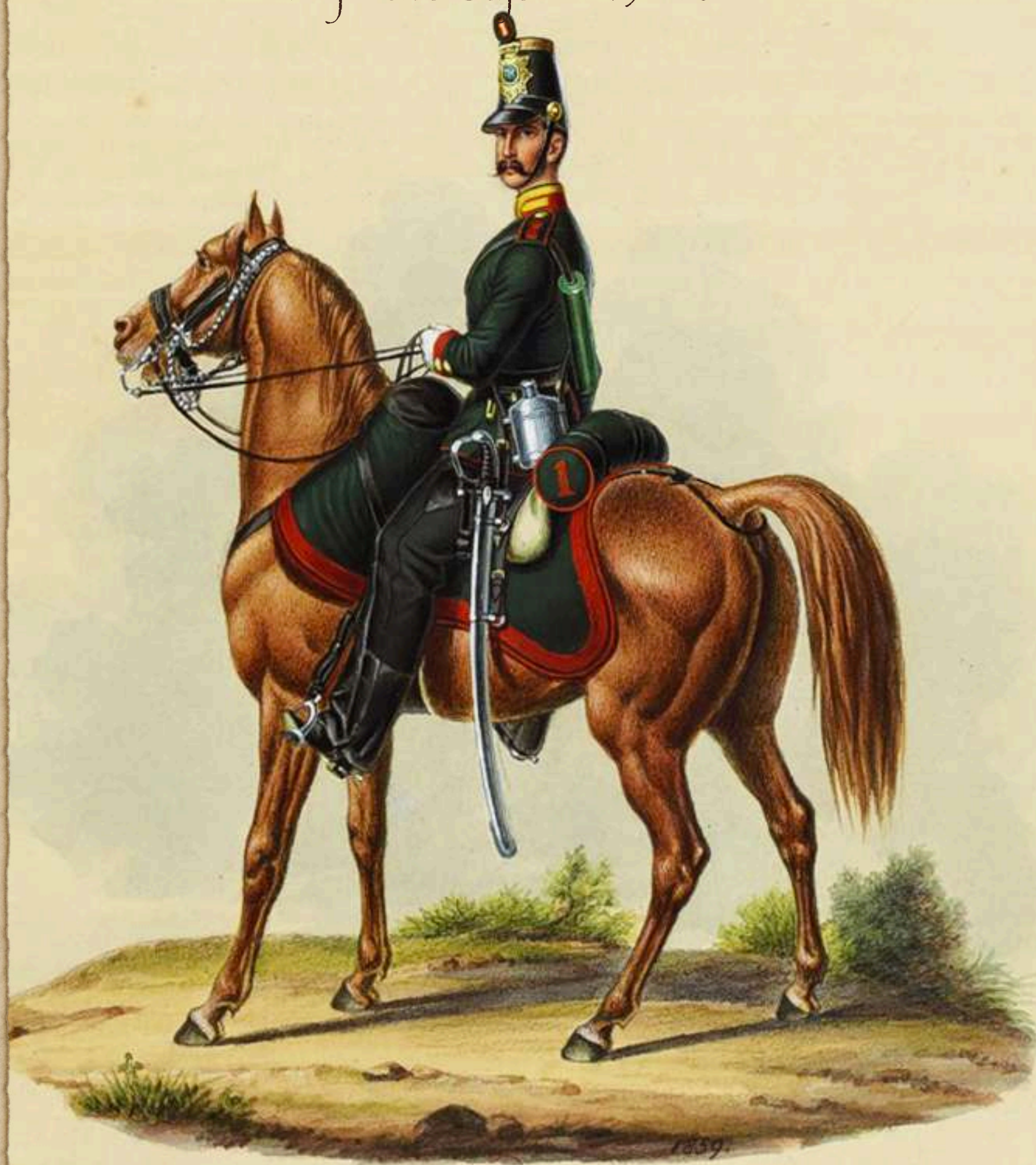
N.C.O. de Artillería a pie