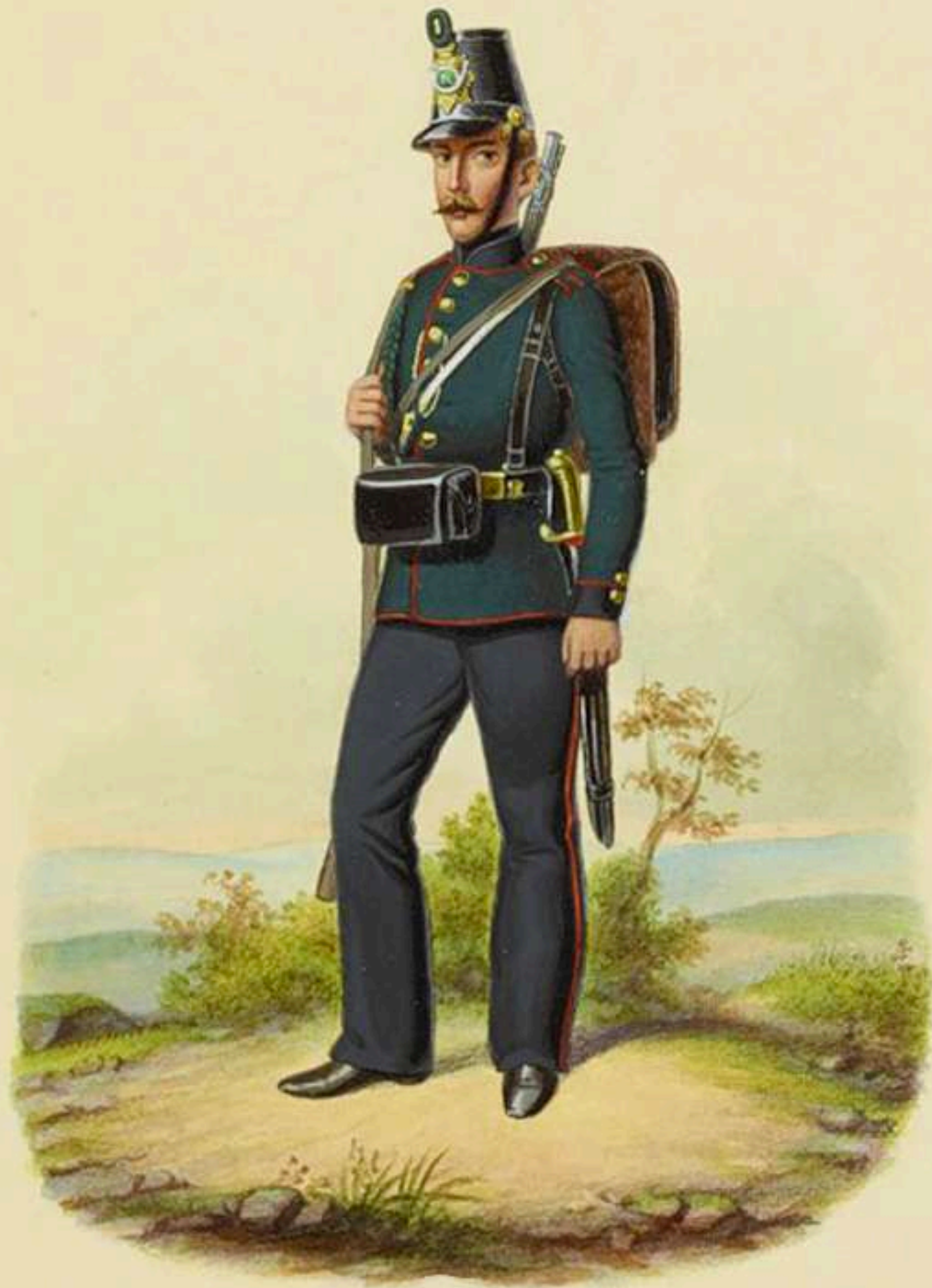
Cazador 1er Batallón