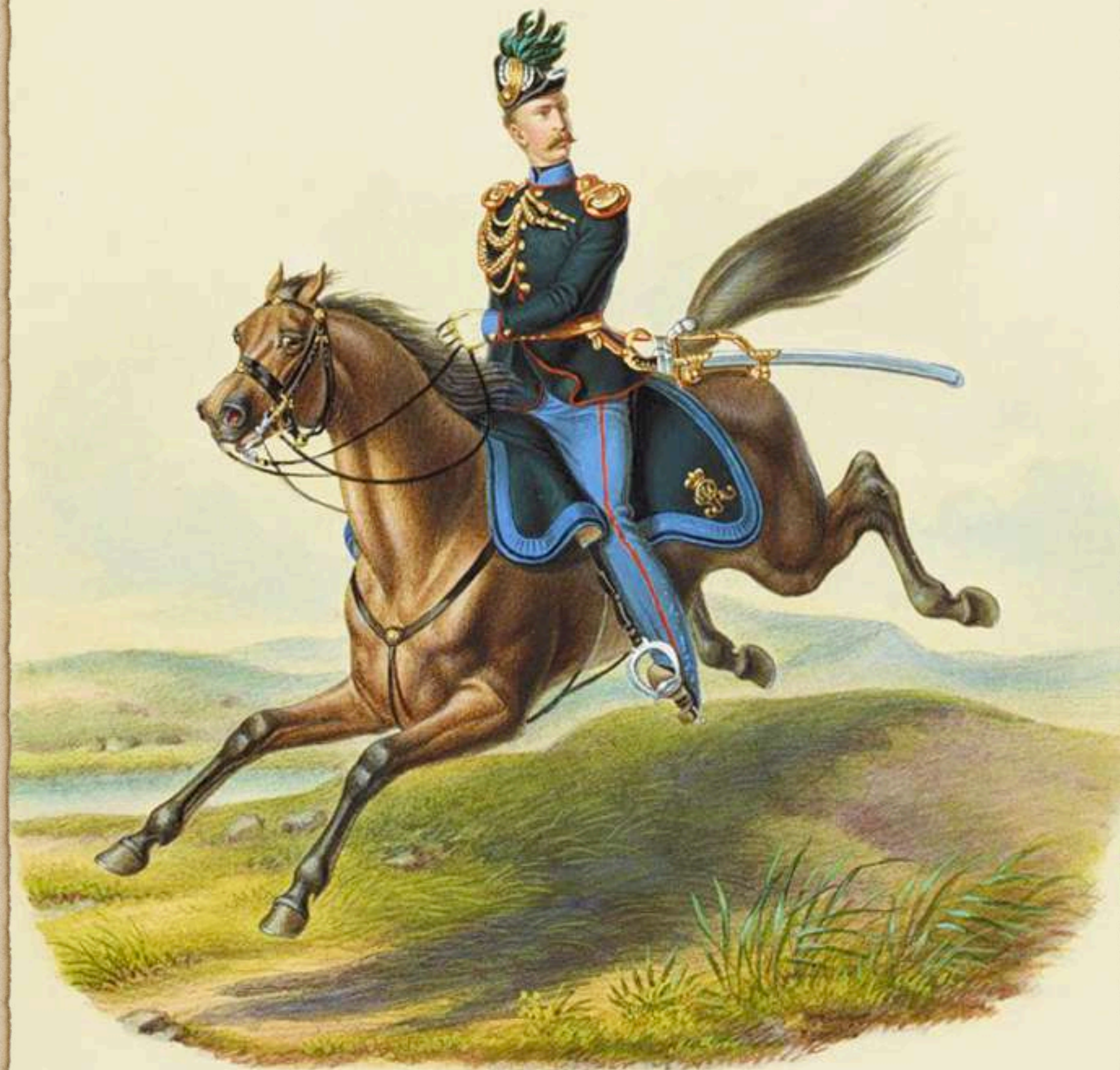
Ayudante División de Infantería