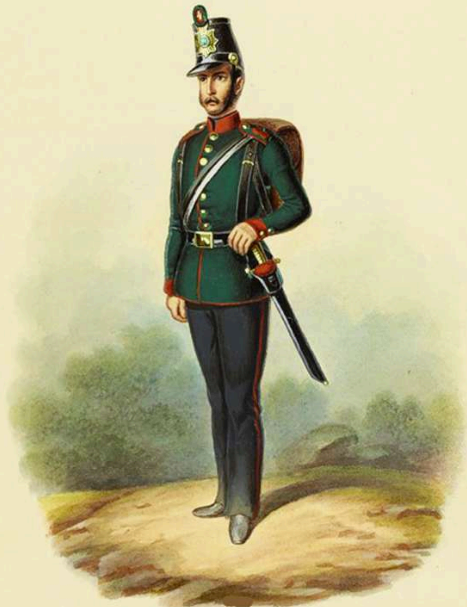
Artillero de Artillería a pie