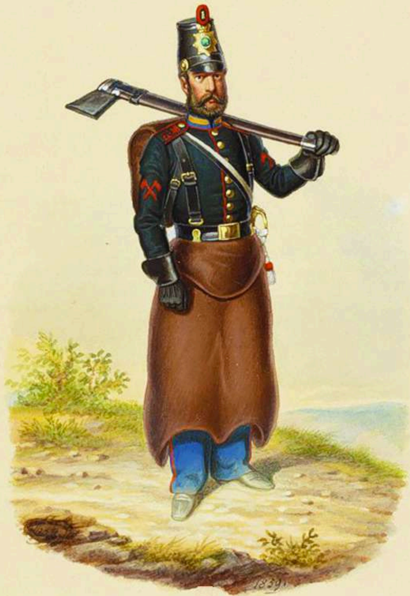
Gastador 4ª Brigada de infantería