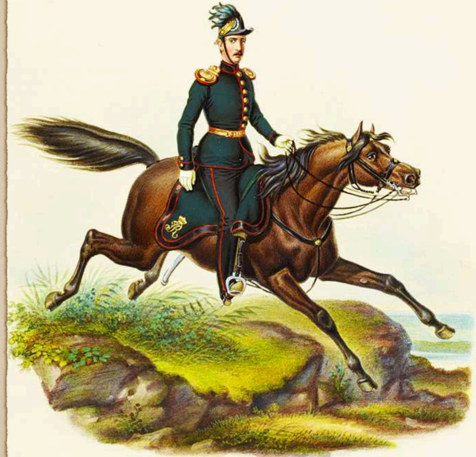
Ayudante de Brigada de Cazadores