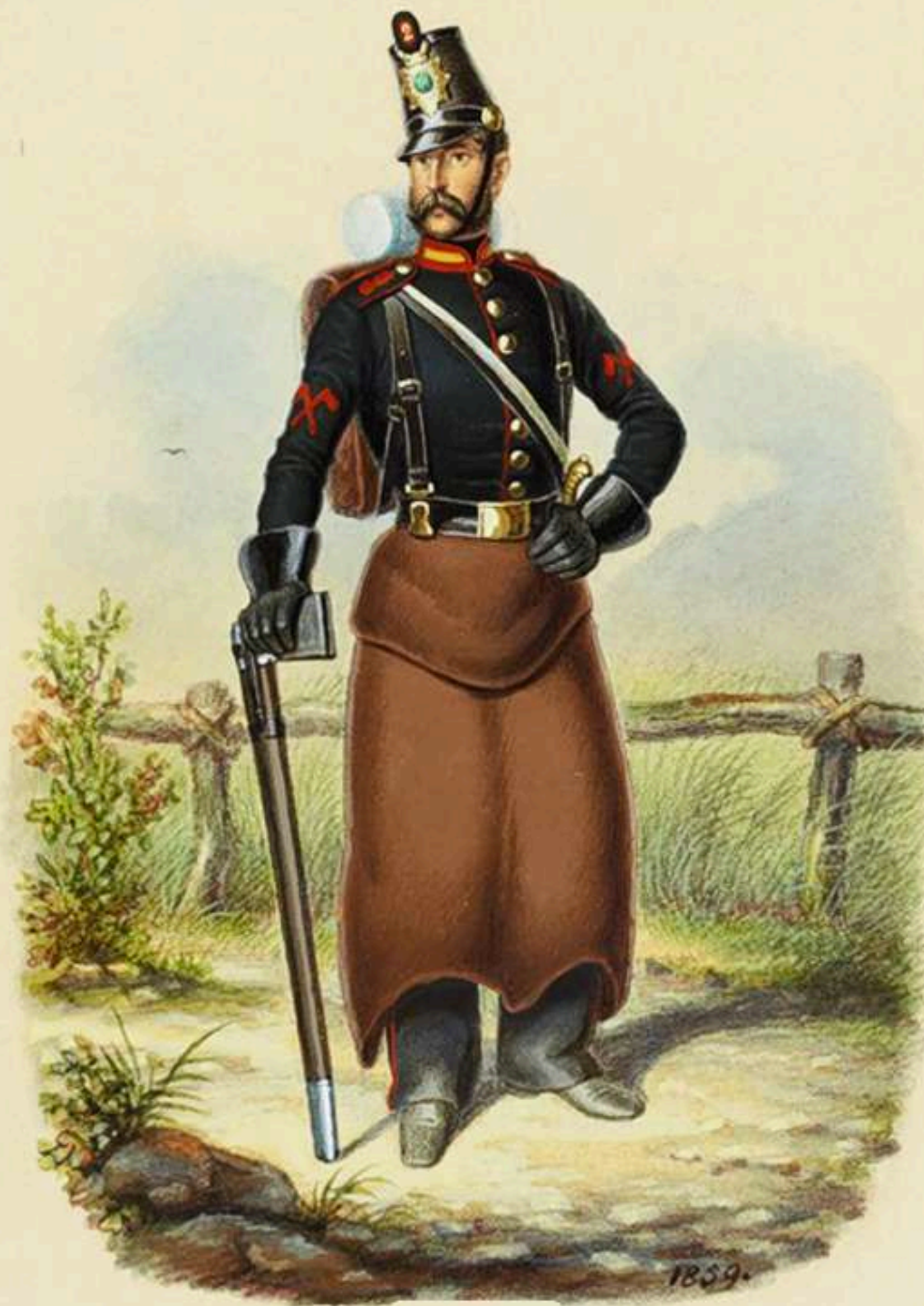
Gastador de Artillería a pie