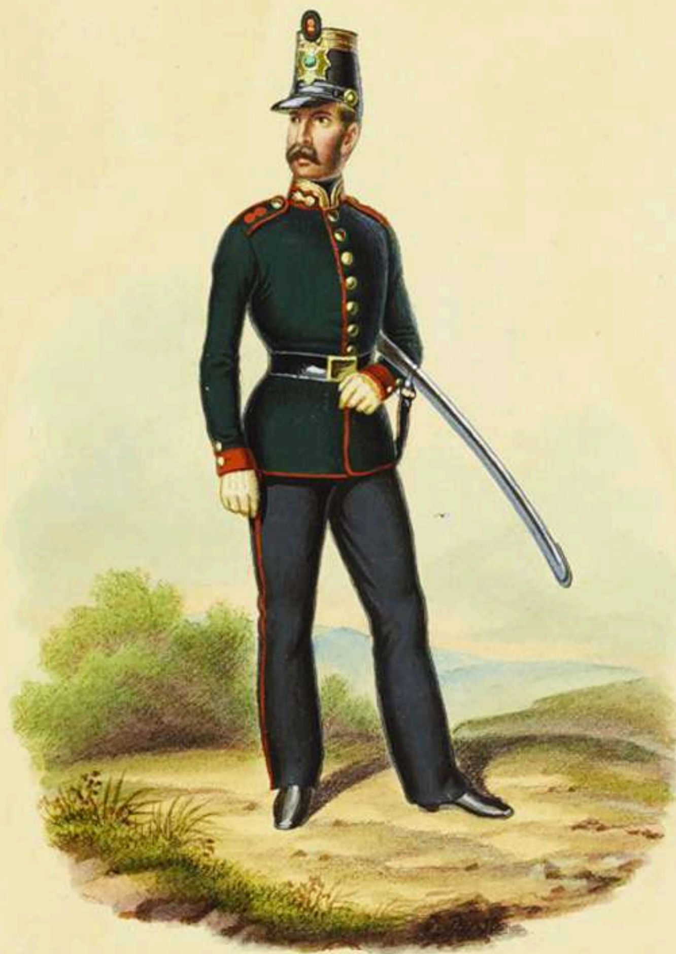
Maestro artillero de Artillería a pie