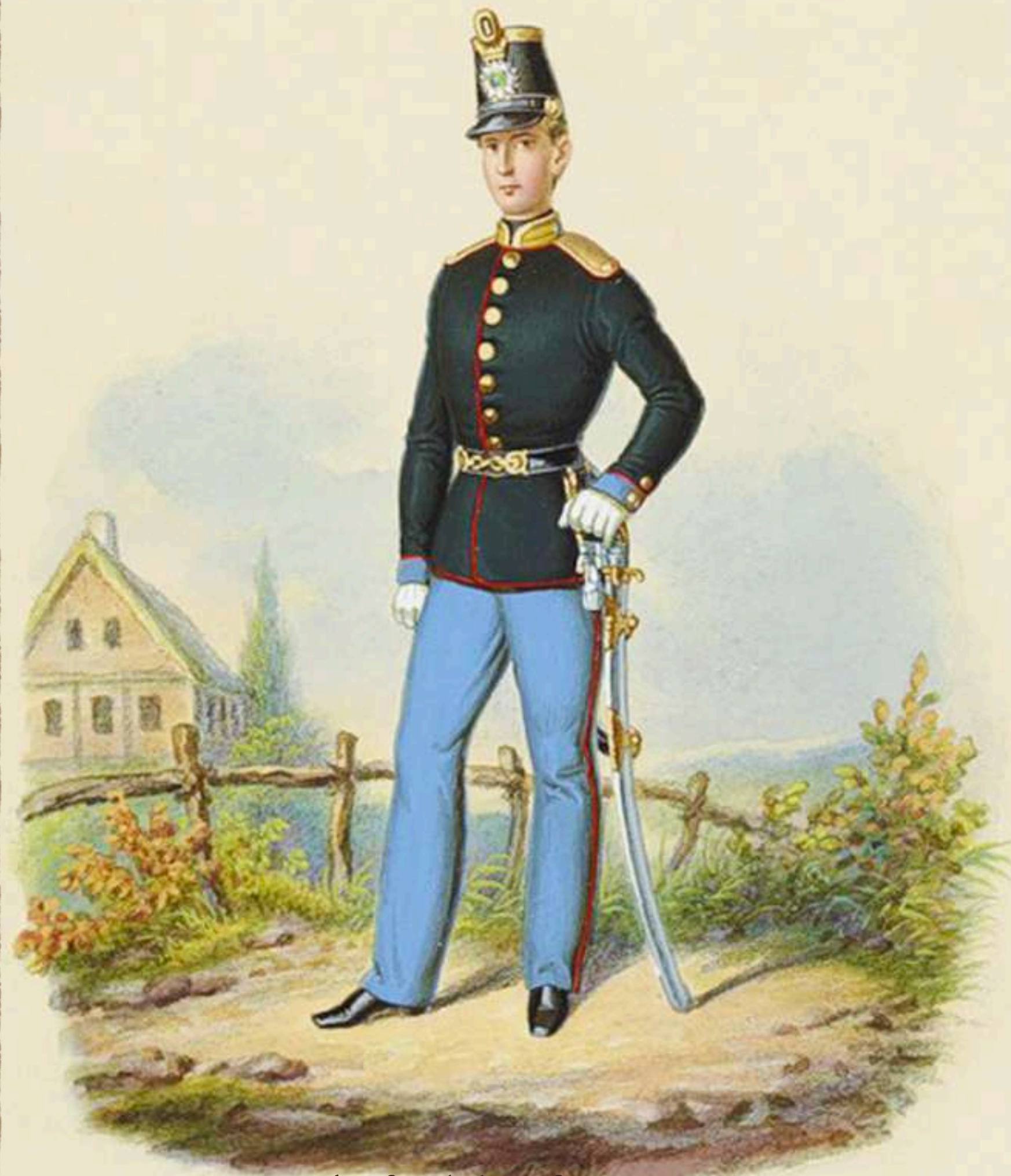
Suboficial de Infantería