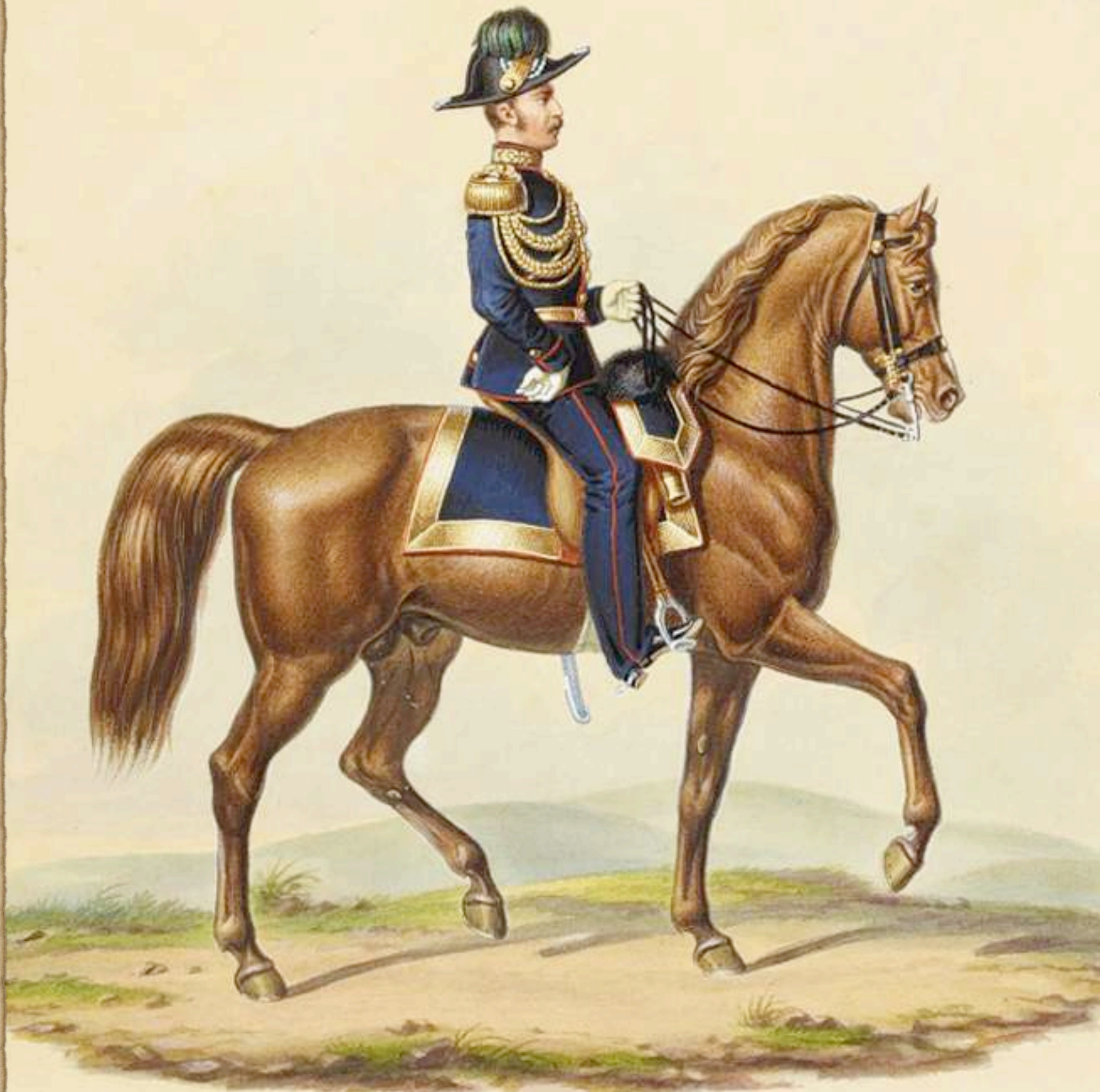
Mayor, Ayudante del Príncipe Real