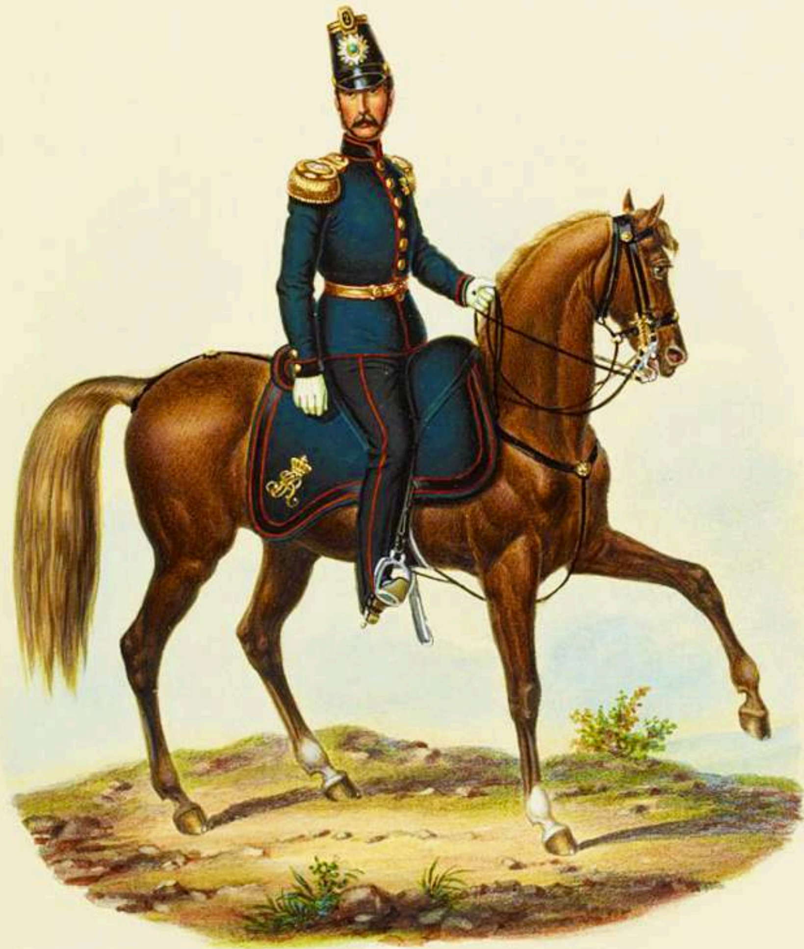
Mayor del 2º Batallón de Cazadores