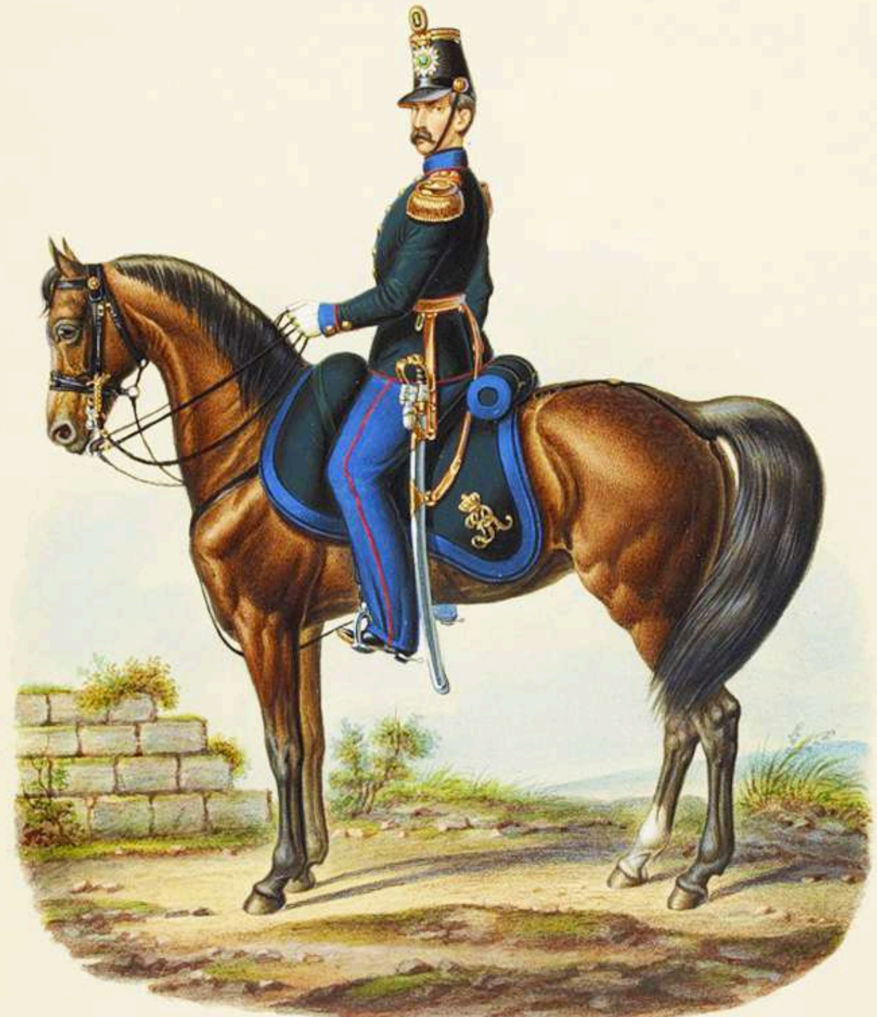
Mayor, 1ª Brigada de Infantería