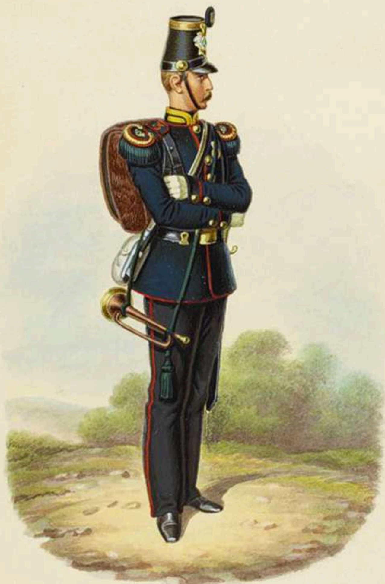
Cabo corneta del 3er Batallón Cazadores