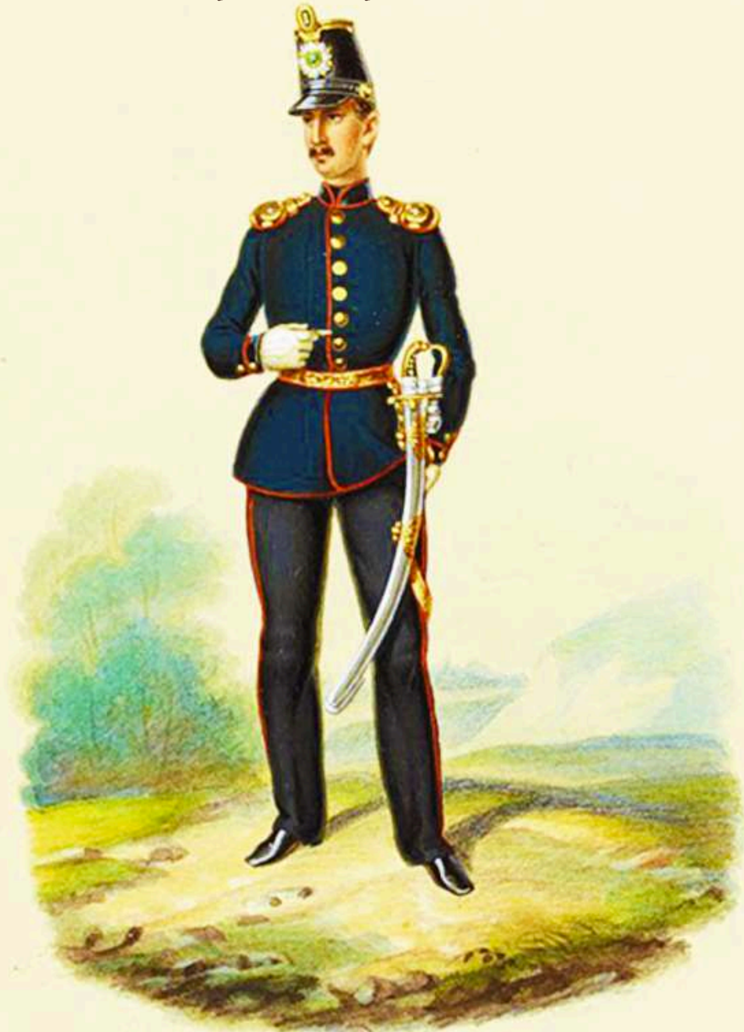
Teniente 1er Batallón de Cazadores