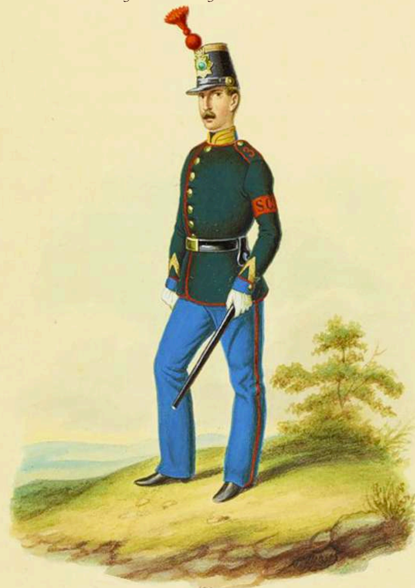
Intendente del Cuerpo Médico