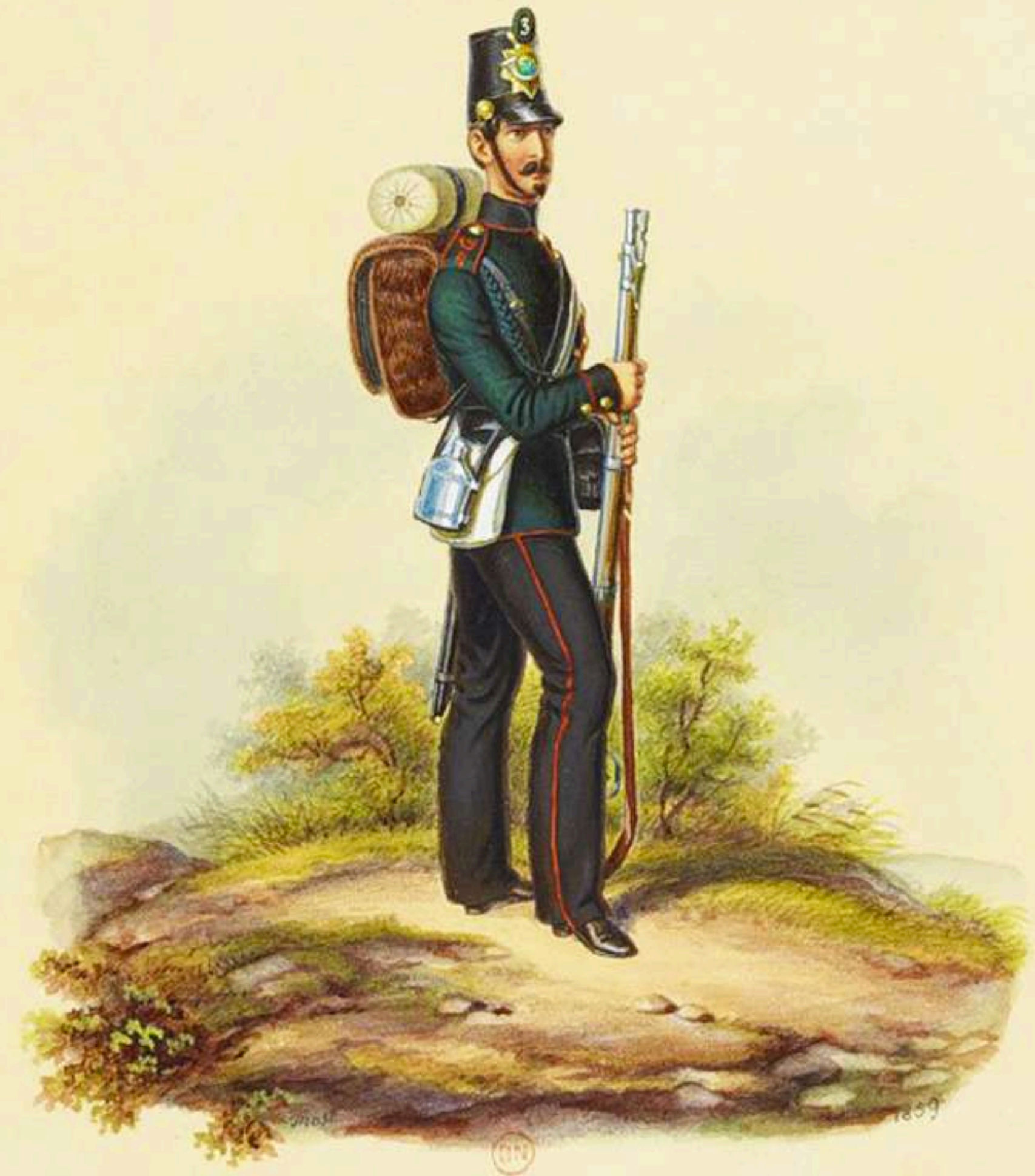
Cazador 3er Batallón