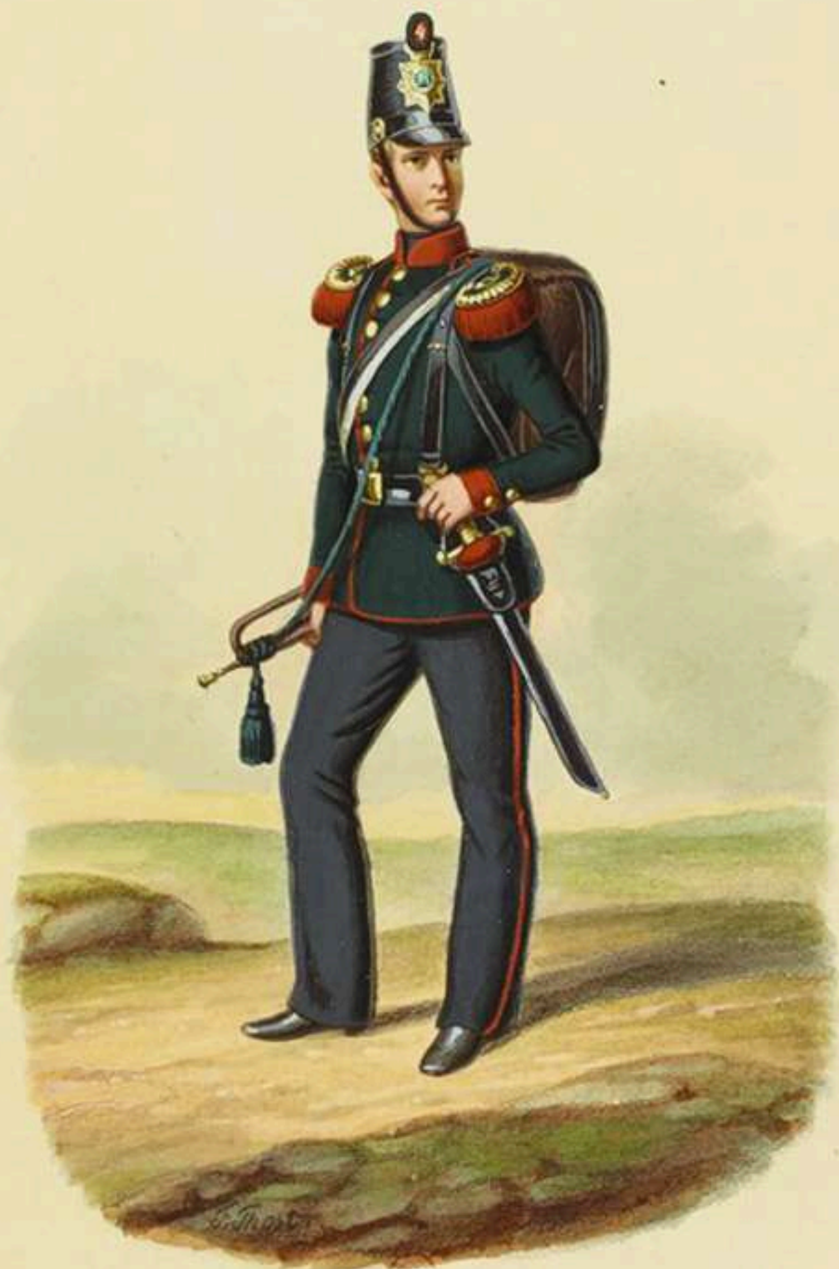
Trompeta de Artillería a pie