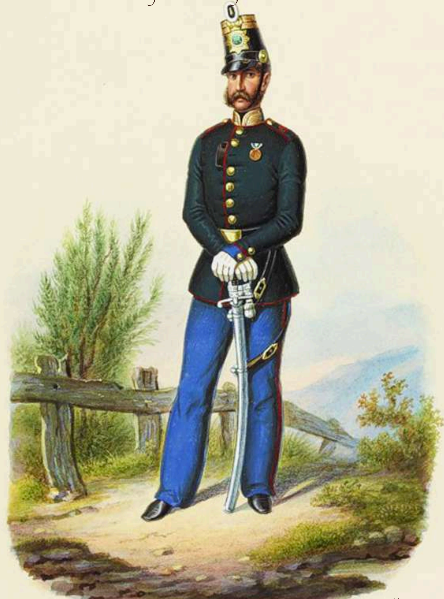
Sargento Mayor, 3ª brigada 9º Batallón