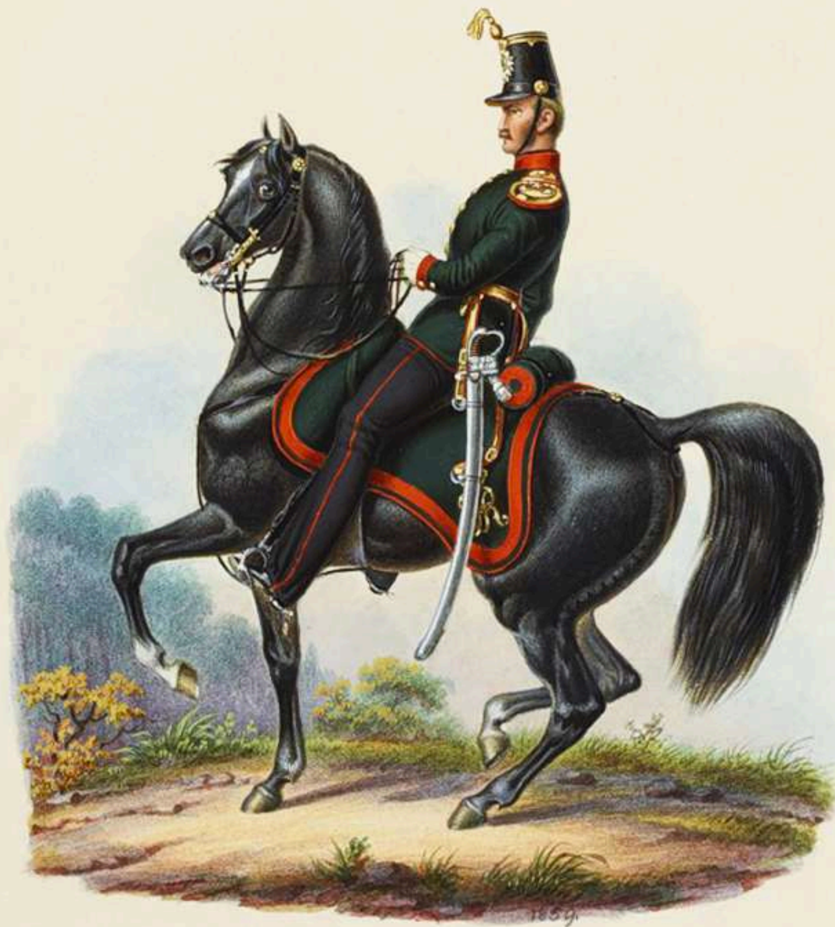
Capitán de Artillería a pie