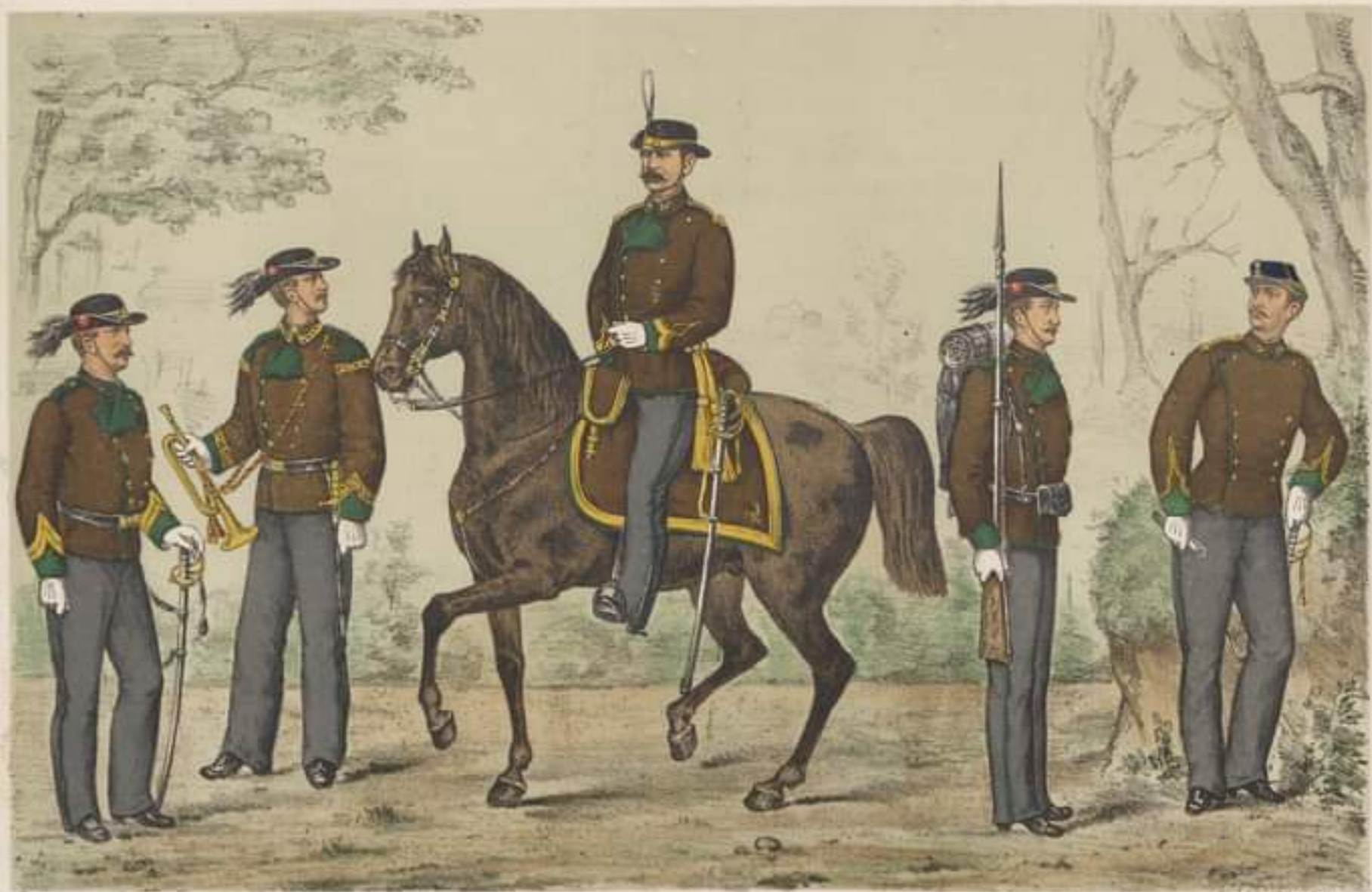
SERGEANT-MAJOR mare flaută.