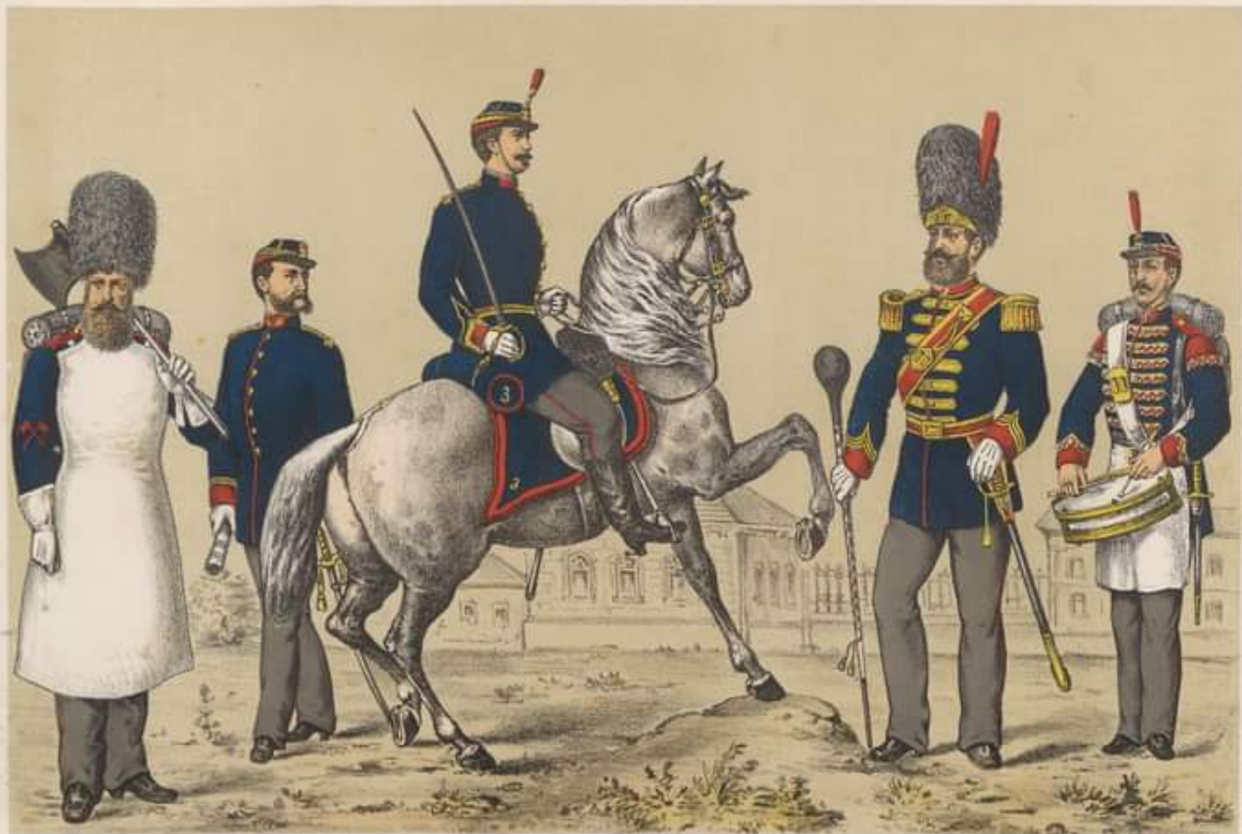
SAPEUR mare ținută