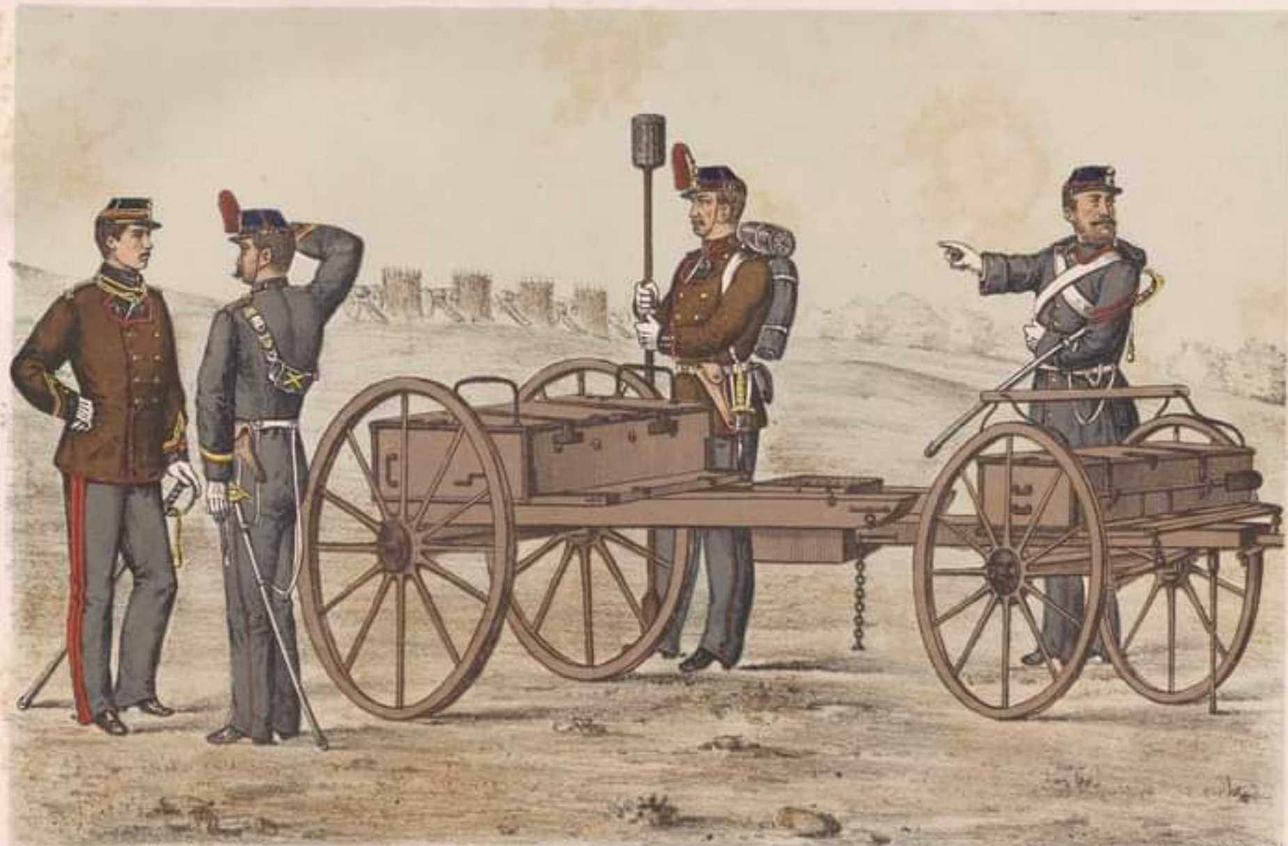
LOGOTENENT ținută ordinană.