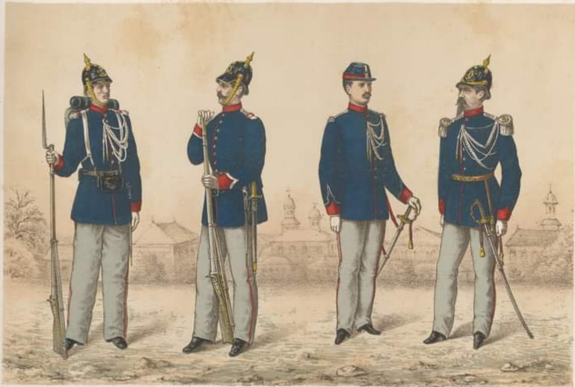
SOLDAT Mare ținută.