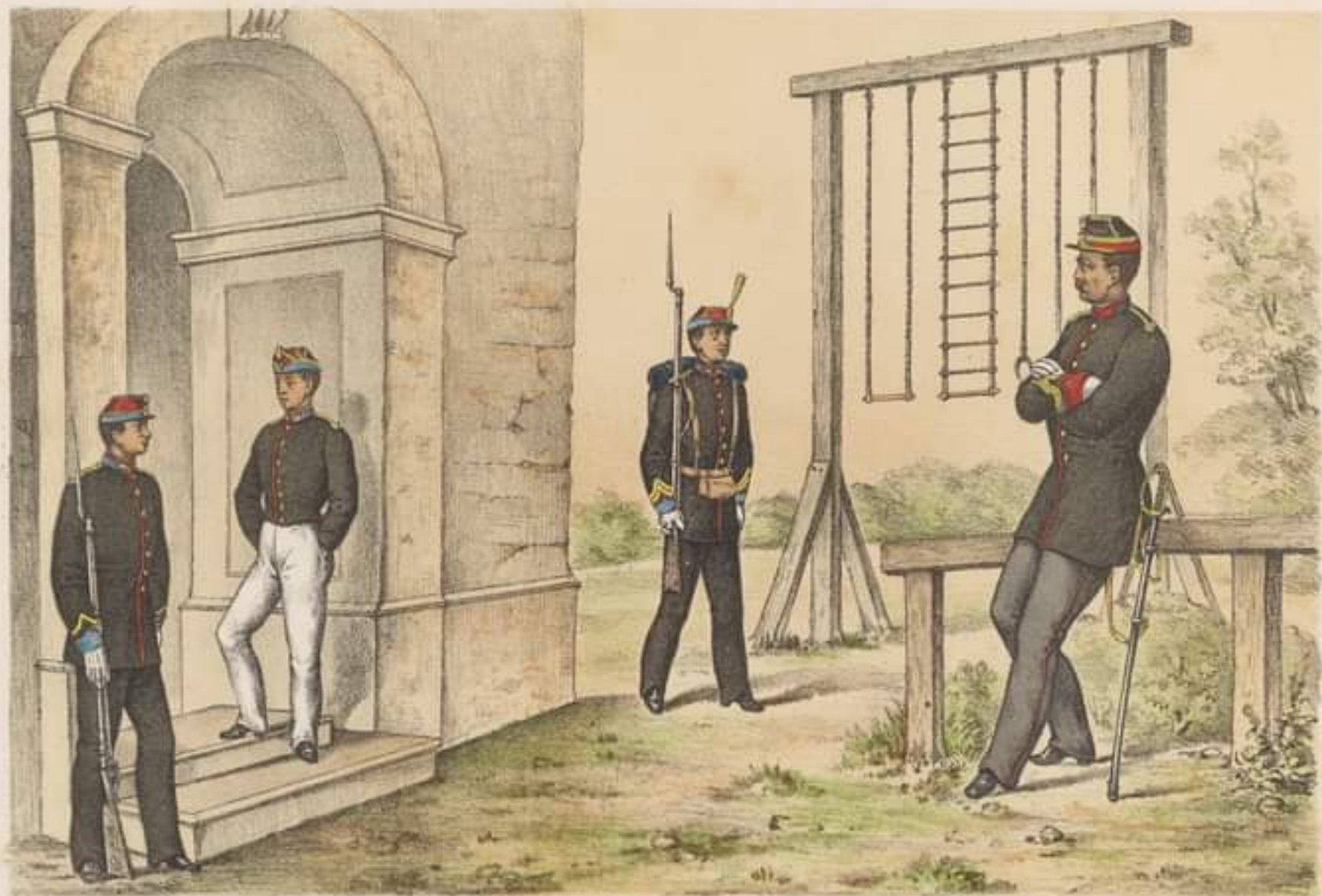
ELEV SERGENT fînătă ordinară