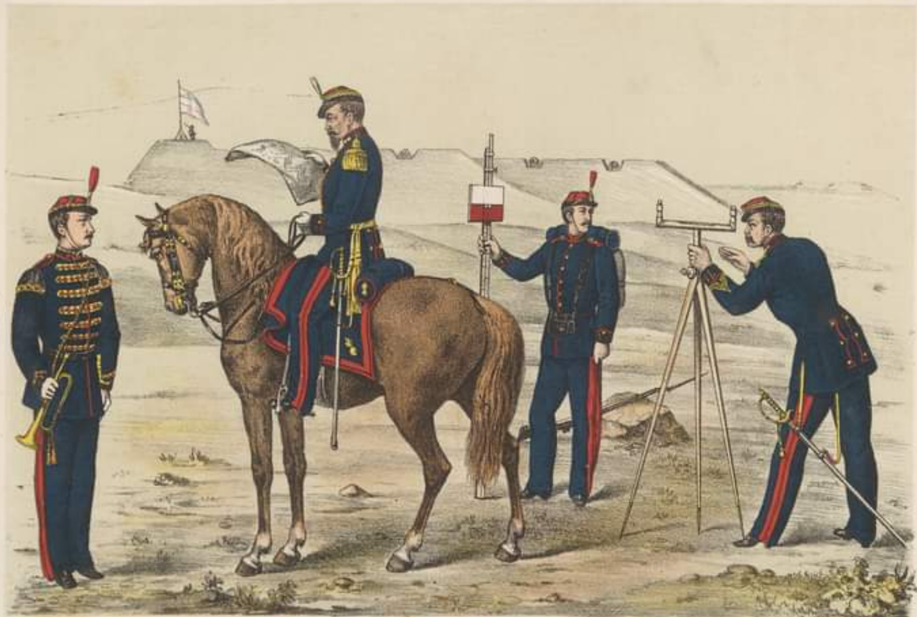
TROMPET mare ținută