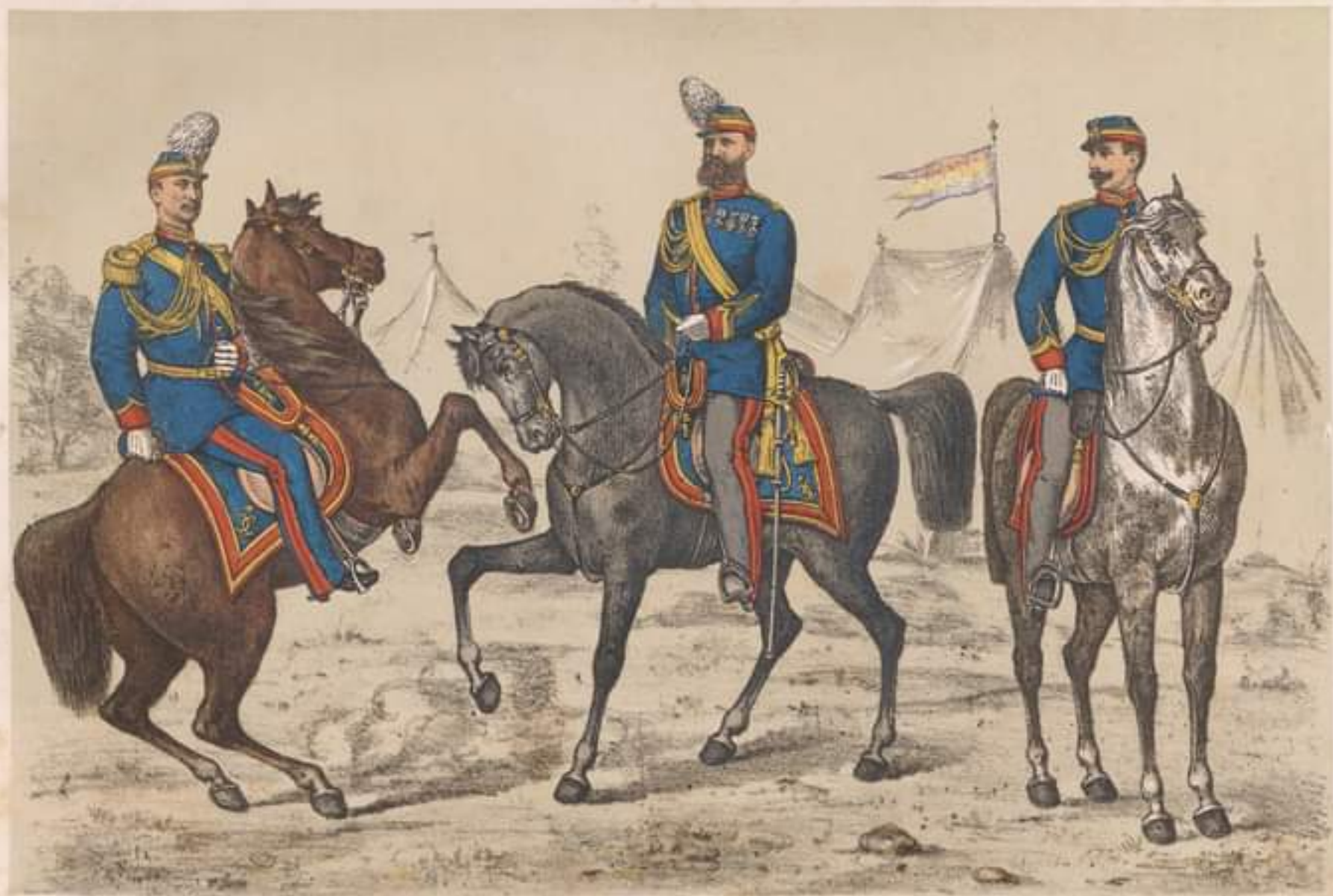
MAJOR mare tinuta