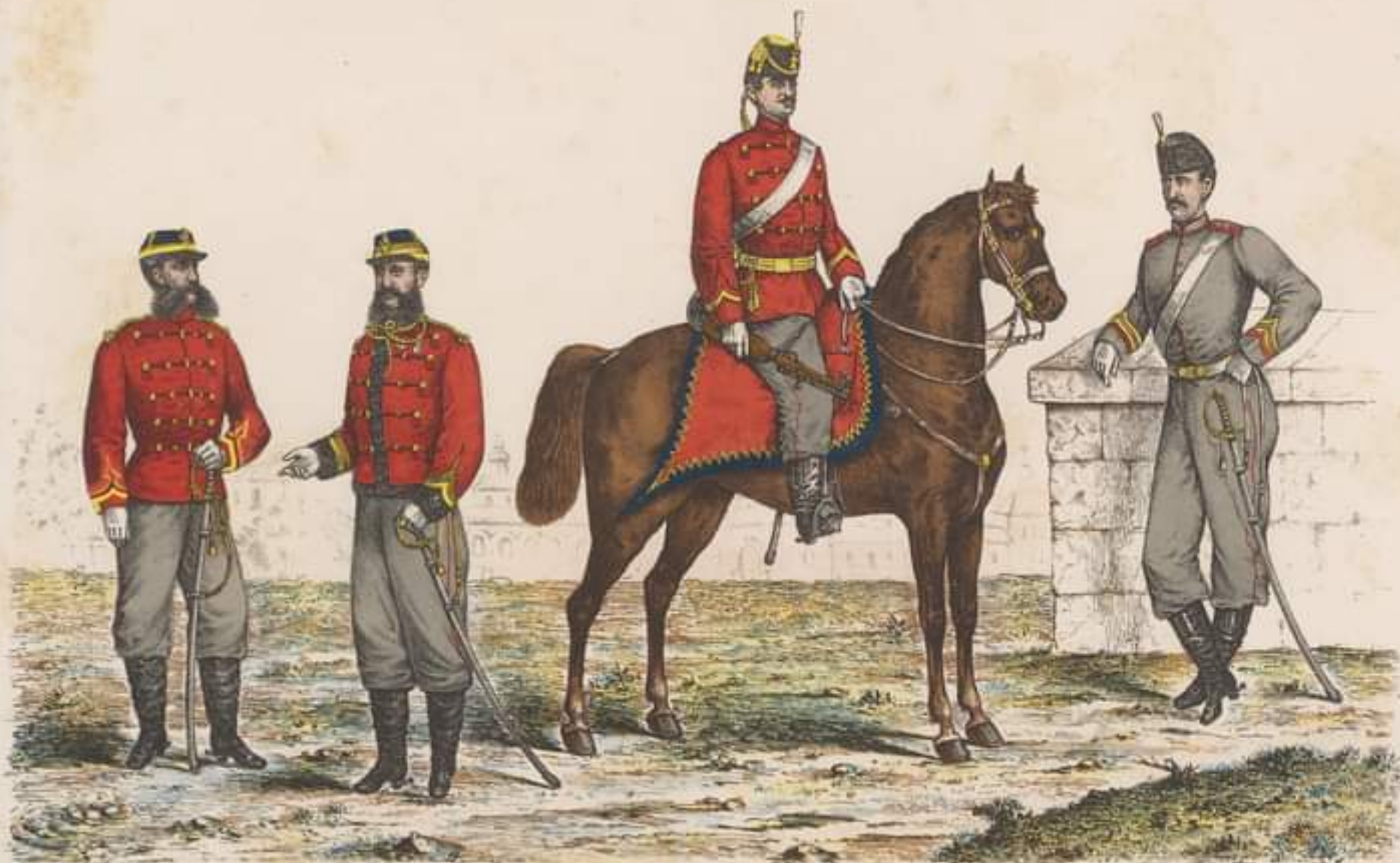
MAJOR din Școala de Cavalerie mică tinută.