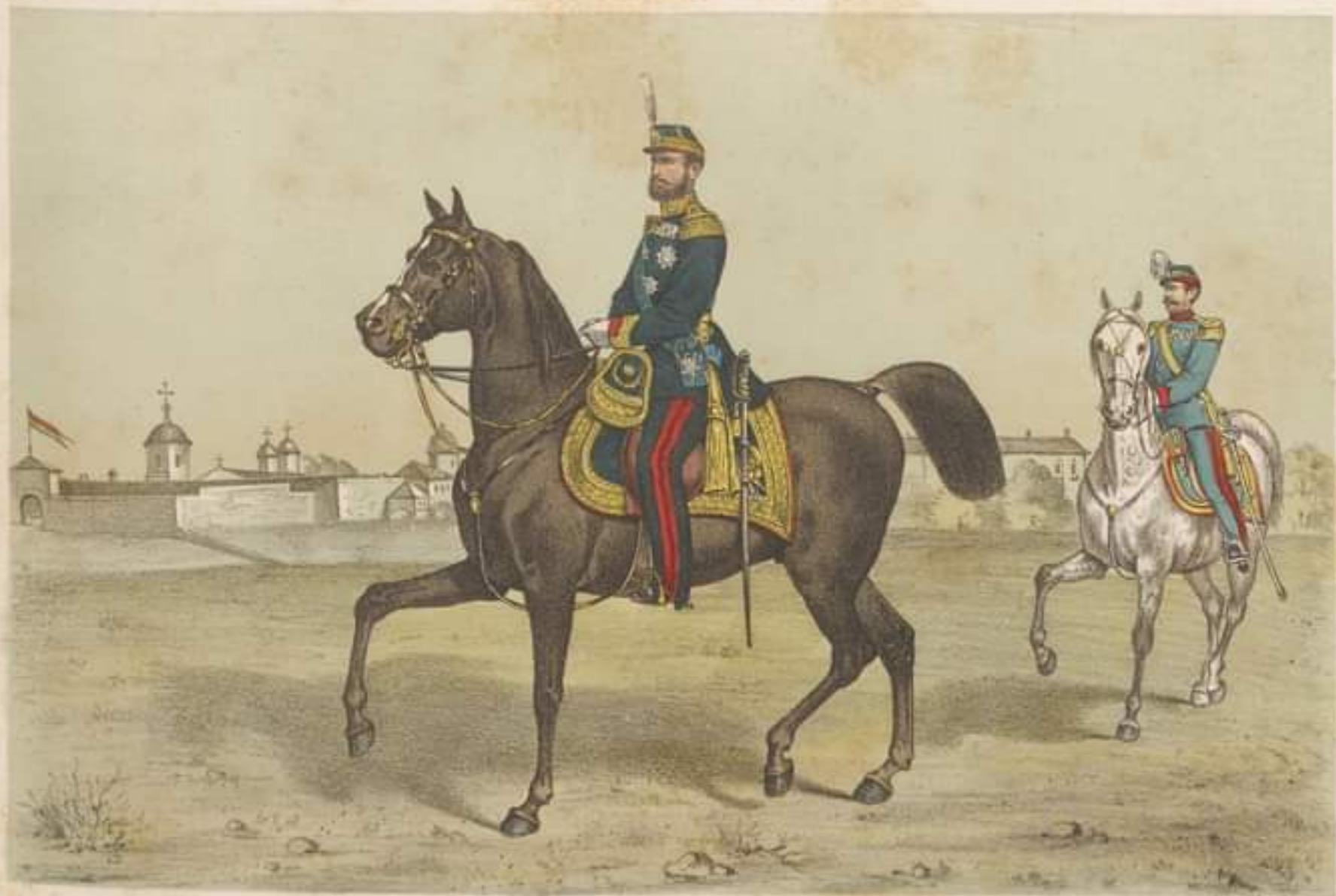
ÎNĂLȚIMEA SA DOMNITORUL CAROL I ȘEFUL SUPREM AL ARMATEI.