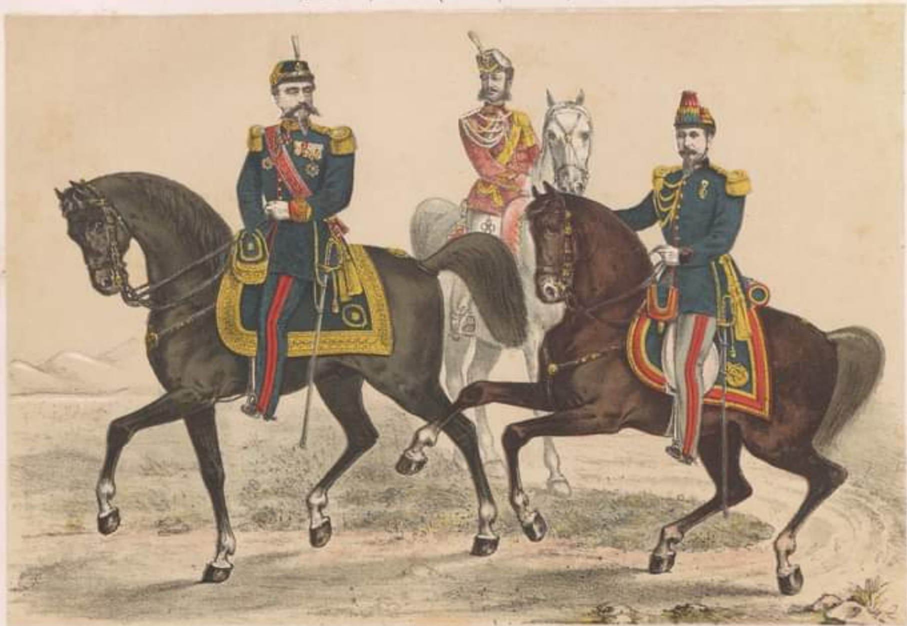
GENERALUL ION EM FLORESCU Ministru de Război Mare ținută de Ceremonie.