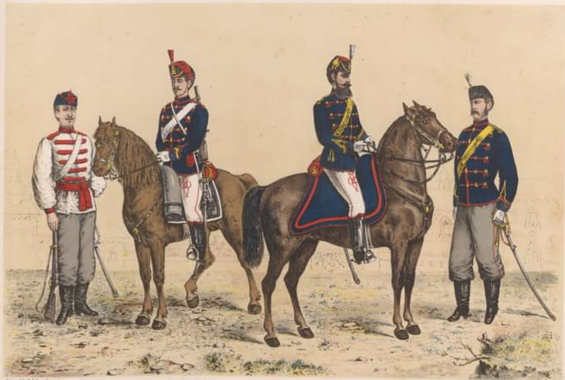
SOLDAT ținută de vară