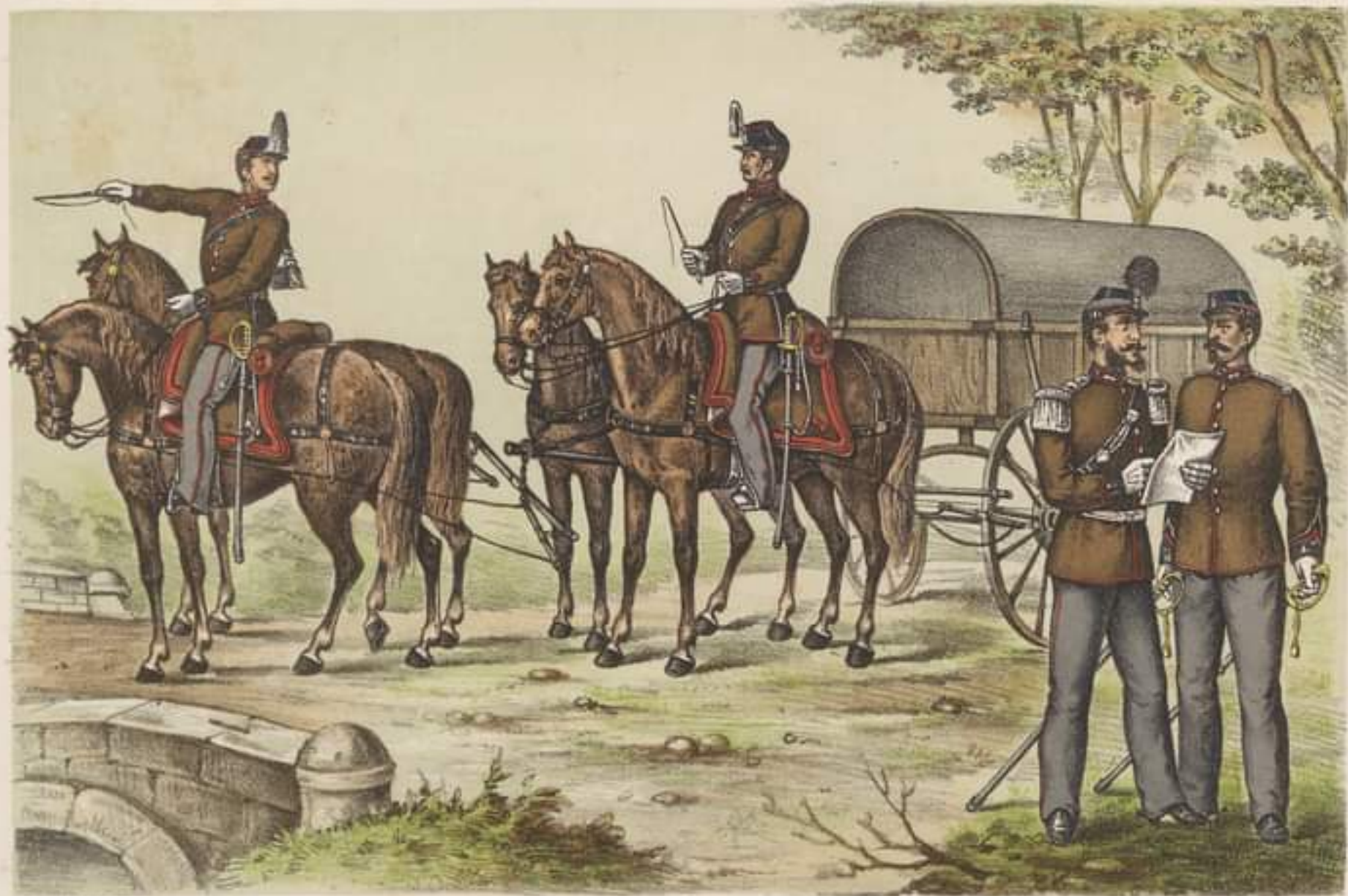
SOLDAȚI CONDUCTORŪ mare finută