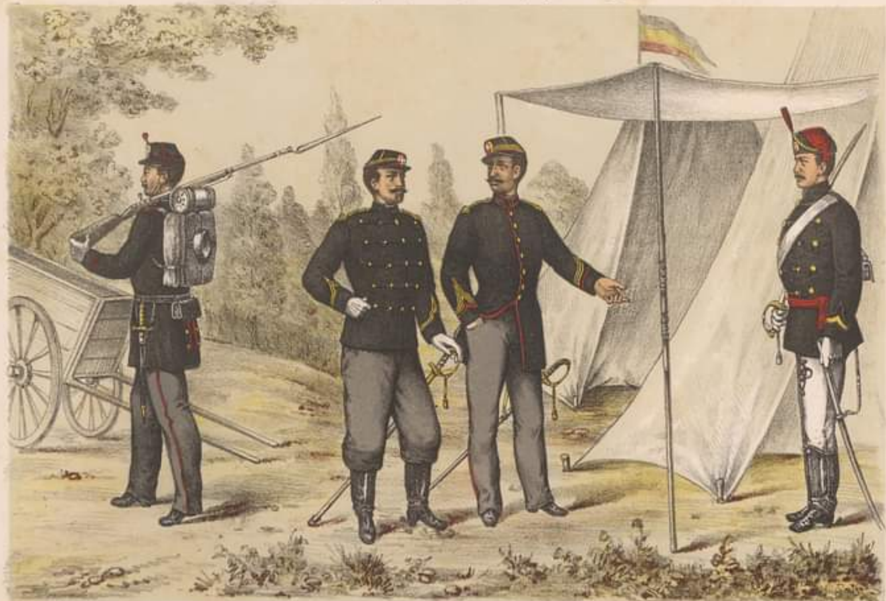
SOLDAT din guarda orășenească