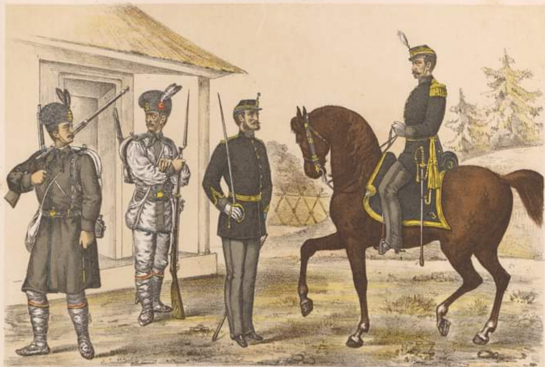
SOLDAT ținută de iarnă