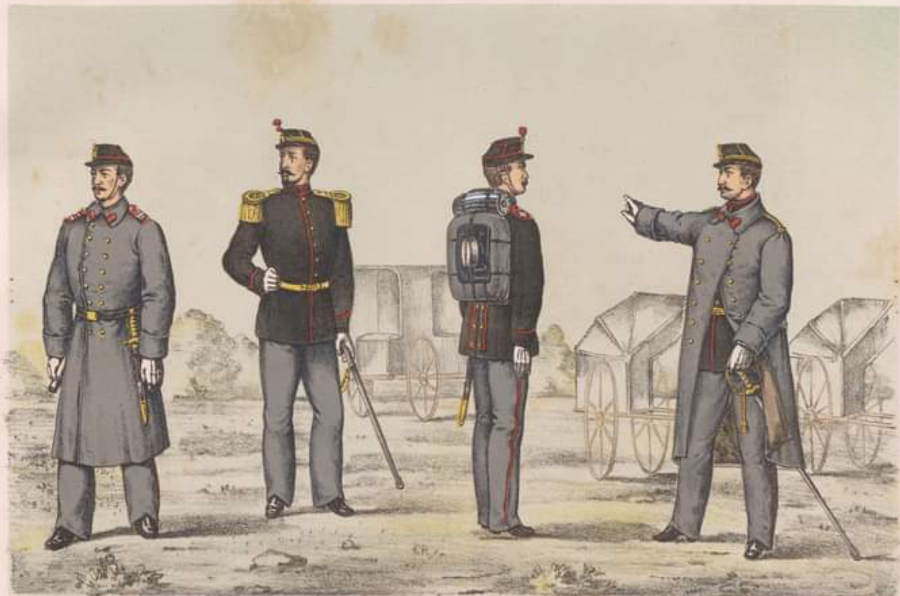
SOLDAT ținută de iarnă