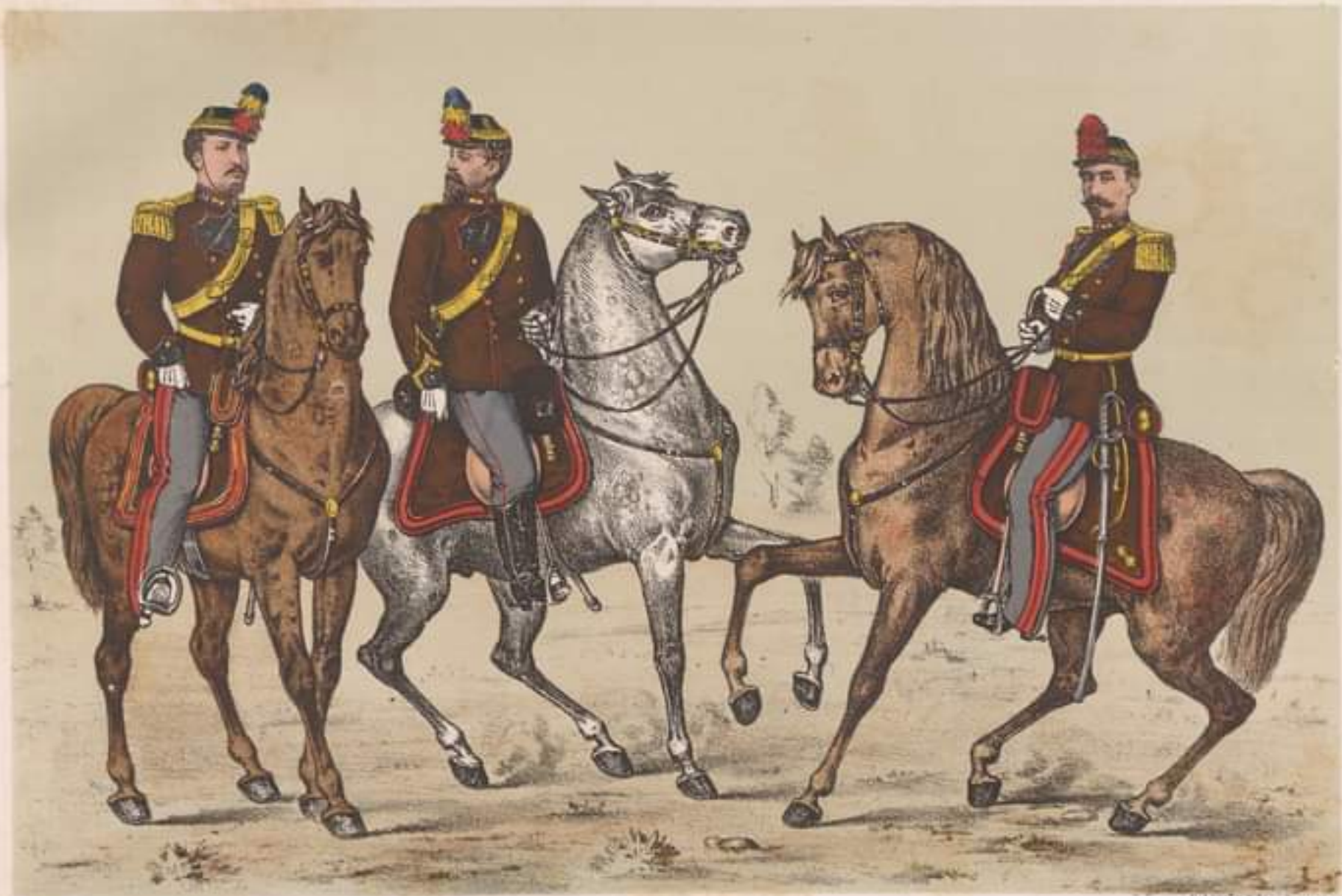
LOCOTENENT-COLONEL Ținută de Ceremonie