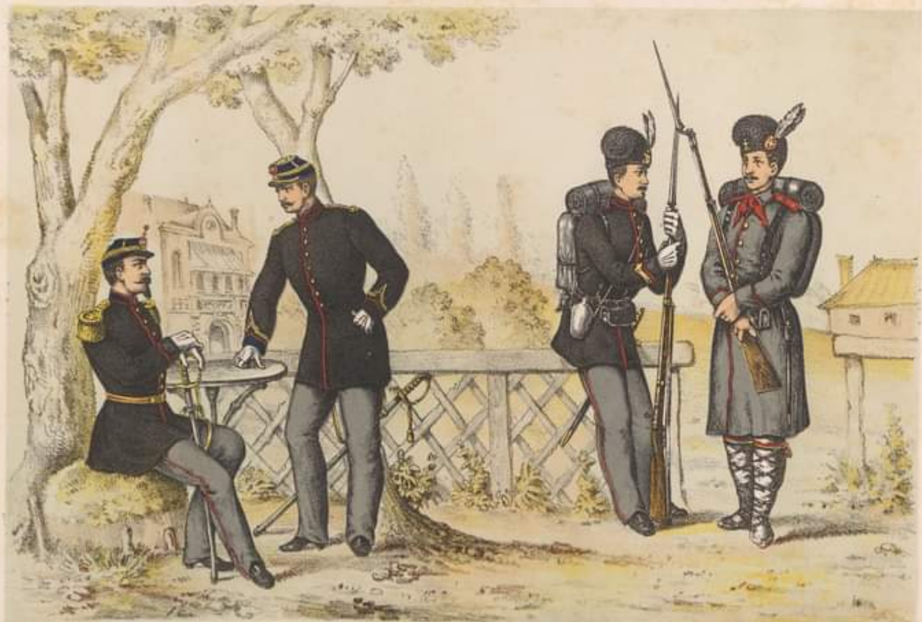
CĂPITAN ținută de ceremonie