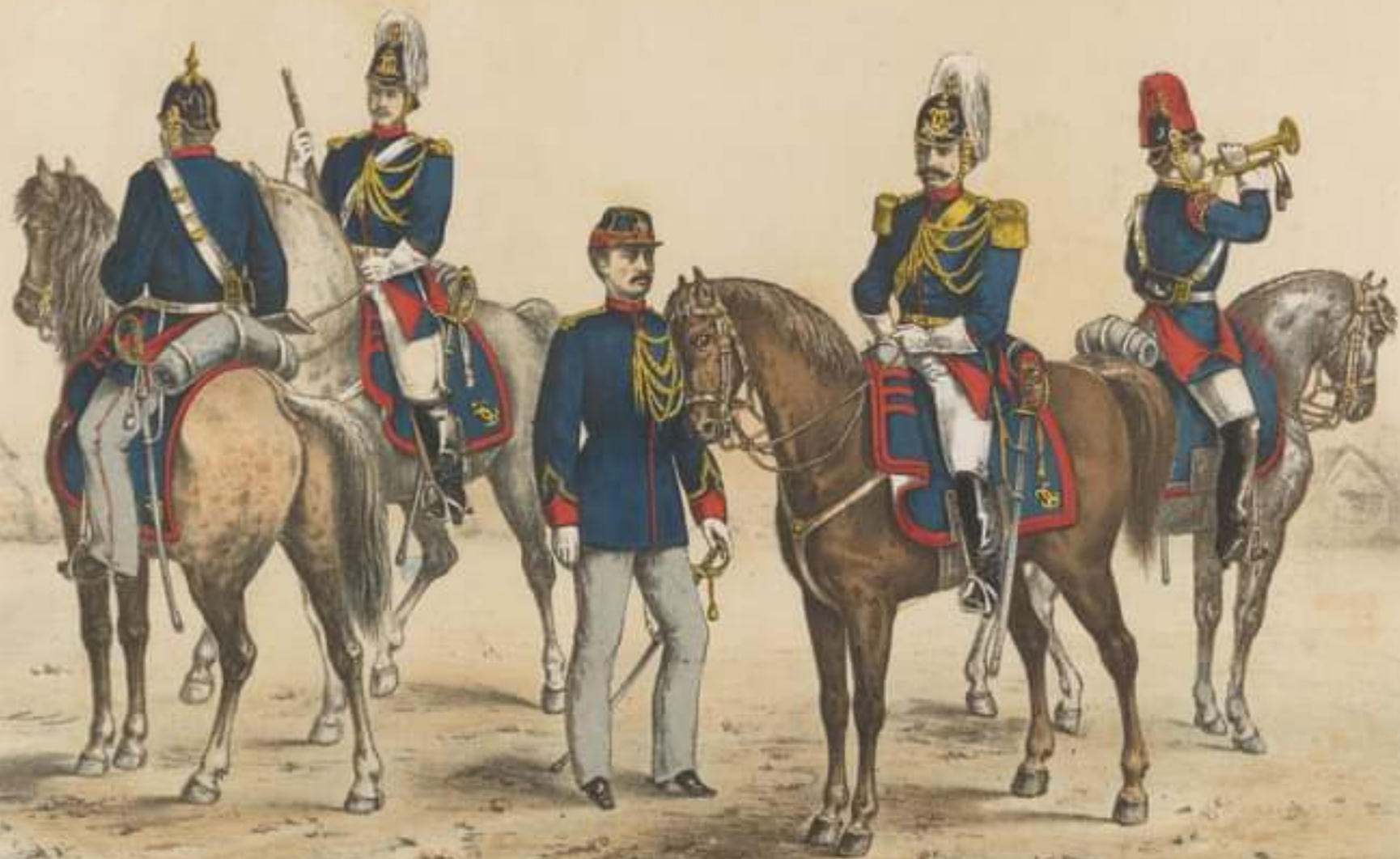
SOLDAT Mică ținută.