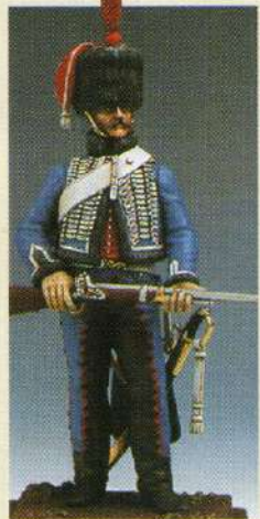
H10: Hussard du 10 ème RGT Cie d'élite 1808