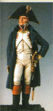
OF: Officier en redingote 1805