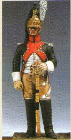
OFDRA: Officier du 13 ème RGT de dragons 1807