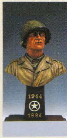
BUSR: Ranger U.S 2 ème Bataillon 6 Juin 1944 Pointe du Hoc