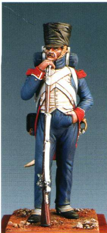
FCG1 : FUSILIER- CHASSEUR DE LA GARDE 1810 FUCILIERE - CACCIATORE DELLA GUARDIA 1810 MM79 : FUSILIER - CHASSEUR OF THE GUARD 1810