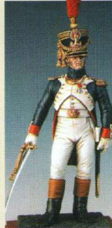
OFGJI: Officier de la jeune garde 1809