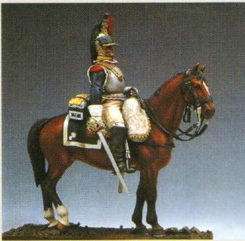
C7CUIR: Cuirassier du 7 ème régiment 1805