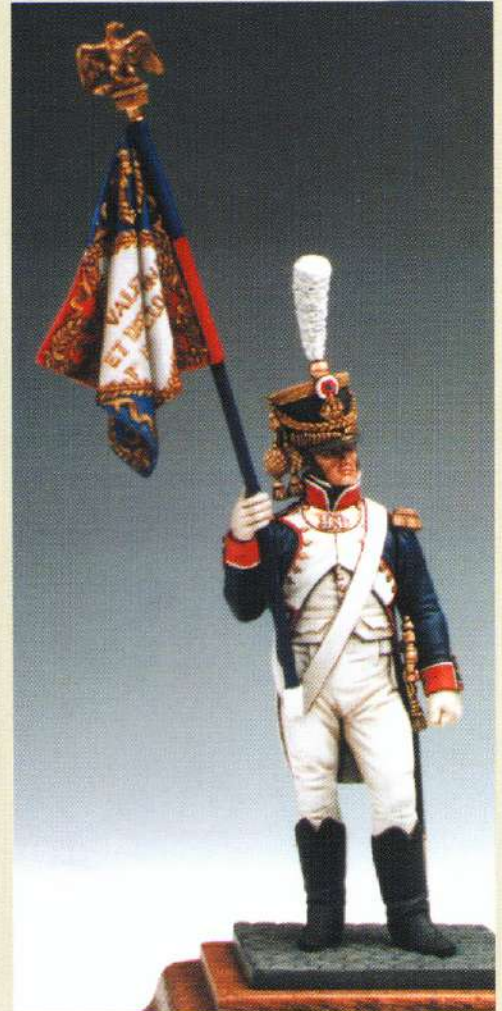
PA: Porte-Aigle 1808