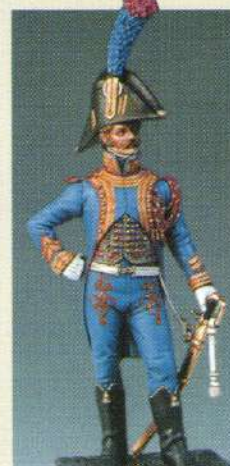
TMCGI: Trompette - Major des chasseurs à cheval de la Garde (tenue de ville) 1807