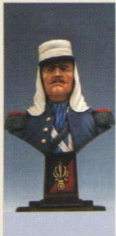
BL2M: Fusilier Mexique 1863