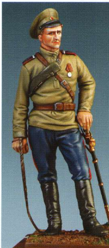
GG20 : CAPORAL DES COSAQUES DU DON CAPORALE DEI COSACHI DEL DON MMGG20 : CORPORAL, DON COSSACKS