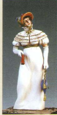
BEF: Bourgeoise 1 ère Empire