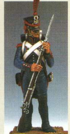
SAPG: Sapeur du génie 1807