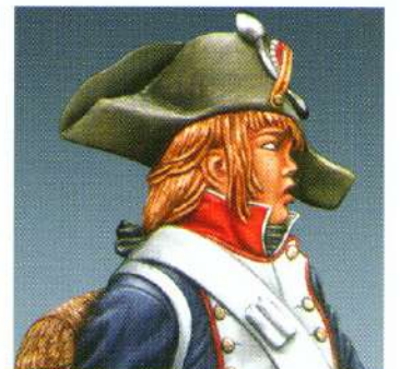
ETE9 : TAMBOUR EN BICORNE 1796 (4cm)