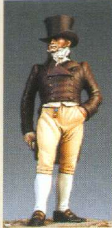
BEH: Bourgeois 1 ère Empire