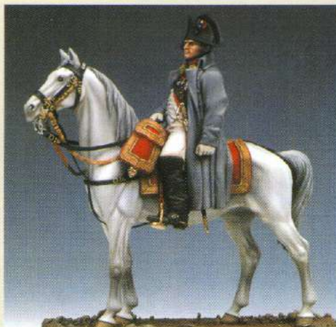
NAP1: Napoleon 1 er