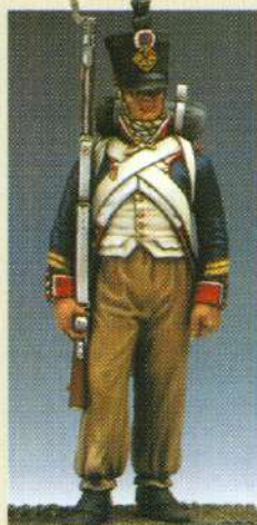
SFU: Sergent de fusiliers 1807