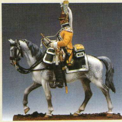
CTRDR: Trompette du 19 ème régiment de dragons 1807