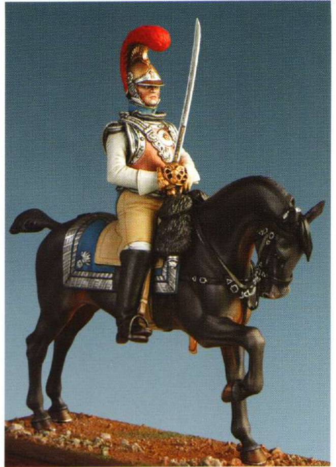
COFCAR : OFFICIER DU 1 er REGIMENT DE CARABINIERS 1812 UFFICIALE DEI CARABINIERI A CAVALLO DEL 1 o REGGIMENTO 1812 MM92: OFFICER, 1st REGIMENT OF MOUNTED CARABINIERS 1812