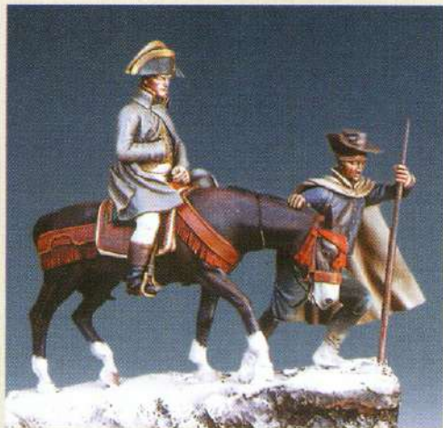
BFA: Bonaparte franchissant les Alpes le 20 Mai 1800