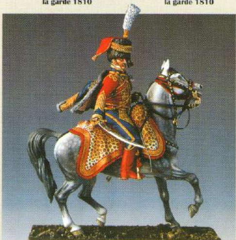
CCH: Colonel de hussards du 6 ème régiment 1809