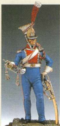
TRPOL: Trompette de cheveau-légers polonais de la garde 1810