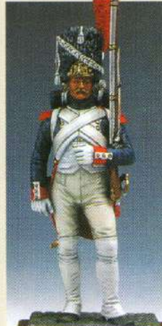
GREGI: Grenadier de la garde 1809