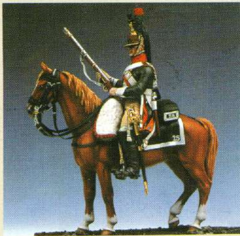
CDRA: Dragon du 25 ème régiment 1809