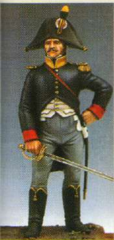
OFVOL: Officier de voltigeurs 1806