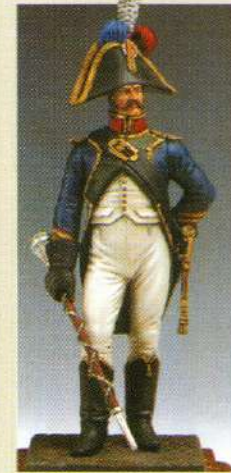
TBMA: Tambour - major du 4 e régiment