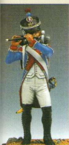
FI: Fife du 3 e RGT. 1809