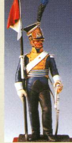
CLPL: Cheval-léger polonais de la ligne - Cie d'élite - 7 ème régiment 1811