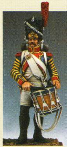
TBGR: Tambour de grenadiers 1809