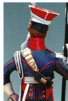
CLPGI : CHEVAU – LEGER POLONAIS DE LA GARDE 1813