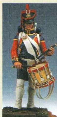
TBAR: Tambour d'artillerie 1809