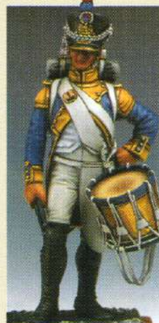
TBFU: Tambour de fusiliers du 42 e RGT. 1807