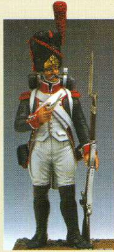
GBR: Grenadier en bonnet 1805