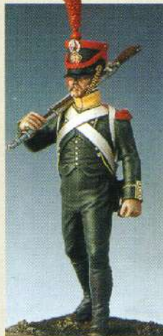
CBI: Carabinier, bataillon irlandais 1807