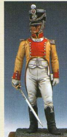
OFBN: Officier du bataillon de Neuchâtel 1808