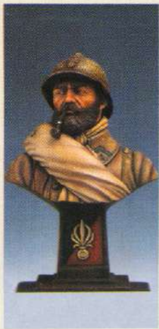
BL5F: Fusilier France 1918