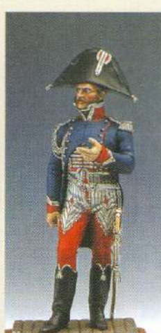
OFPTV: Officier de cheveau-légers polonais de la garde 1810