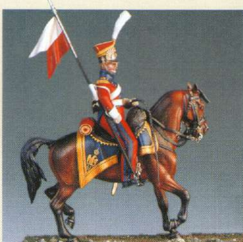
CLRGI: Lancier rouge de la garde 1813