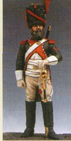
SAPDRA: Sapeur du 30 ème RGT de dragons 1809