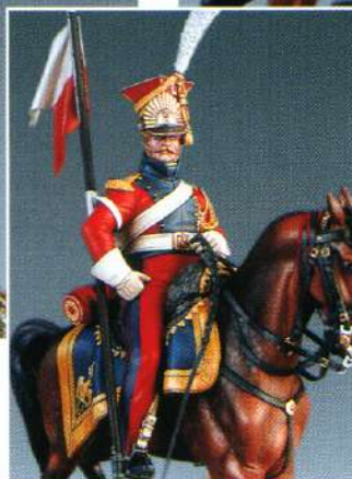
CLRG1 : LANCIER ROUGE DE LA GARDE 1813 LANCIERE ROSSO DELLA GUARDIA 1813 MM81 : RED LANCER OF THE GUARD 1813