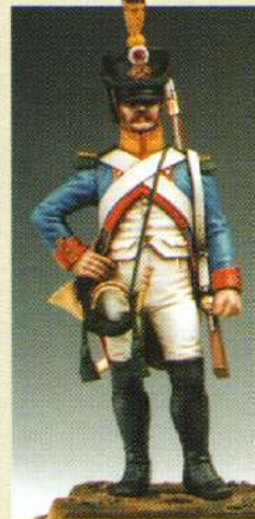
CORVOL: Cornet de voltigeurs 3 e RGT. 1809