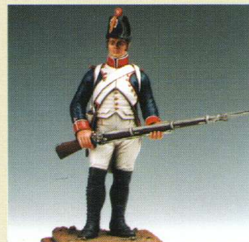
FU: Fusilier 1804 - 1807