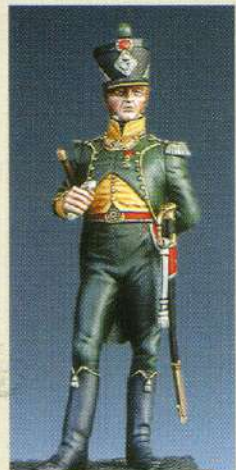
OFCI: Officier de chasseurs 1 er RGT d'infanterie légère du Royaume d'Italie 1807