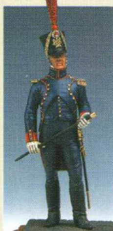
OFART: Officier d'artillerie 1809