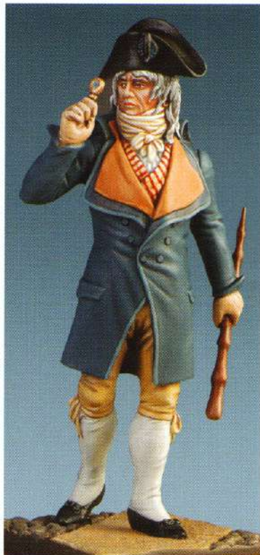
INC : INCROYABLE MM93 : "INCROYABLE"