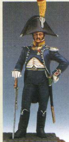
ILOF: Infanterie légère, officier de voltigeurs 1809