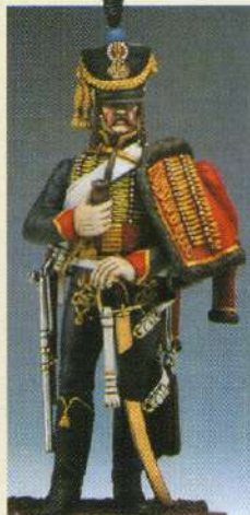
H4: Hussard du 4 ème RGT 1807