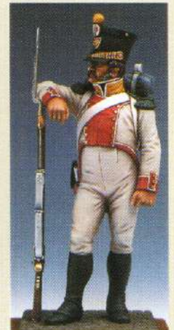
VOLNAP: Voltigeur du 8 ème RGT de ligne - Royaume de Naples 1813