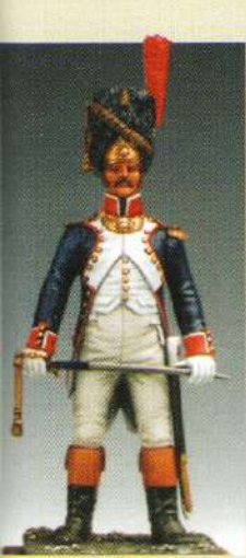
OFGRE: Officier de grenadiers 1806