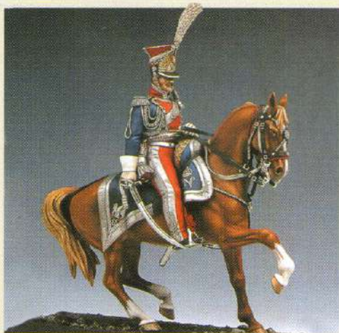
COFPOL: Officier supérieur de cheveau-légers polonais de la garde 1810

LES FIGURINES PRÉSENTÉES DANS CE CATALOGUE SONT COMMERCIALISÉES EN KIT À MONTER ET À PEINDRE