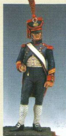
CAPAR: Caporal d'artillerie 1807 (Tenue de ville)