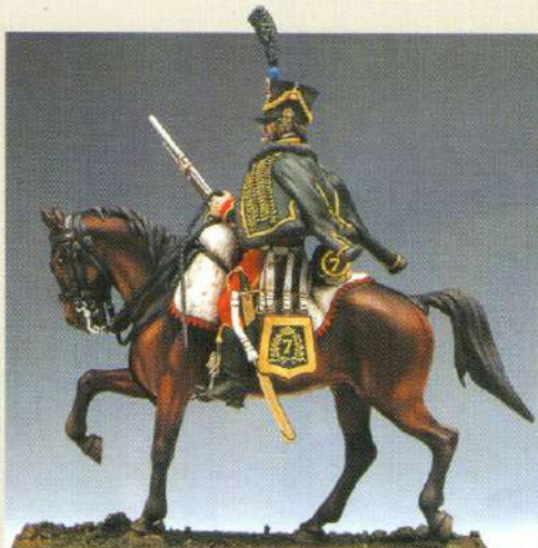
C7H: Hussard du 7 ème régiment 1808