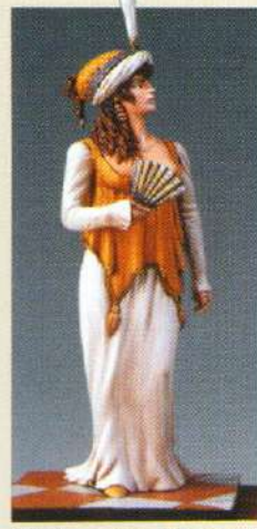
FERB: Femme 1 ère empire en robe de bal