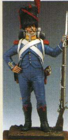
CAR2ET: Carabinier du 2 ème RGT étranger (Isenbourg) 1806