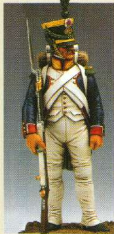
VOLS: Voltigeur en shako 1806