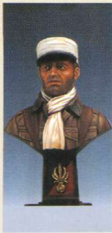
BL6L: 13 ème D.B.L.E Lybie 1942