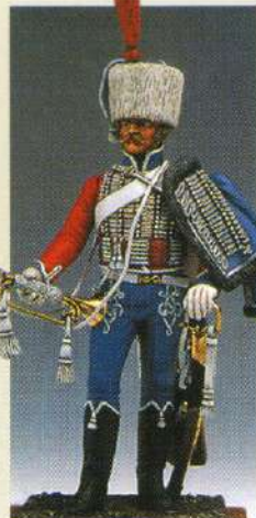
TH1: Trompette du 1 er RGT de Hussards Cie d'élite 1806