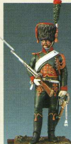
CHGI: Chasseur à cheval de la garde (tenue d'escorte) 1807