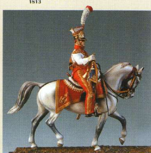
CTLRGI: Trompette de lanciers rouges de la garde 1813