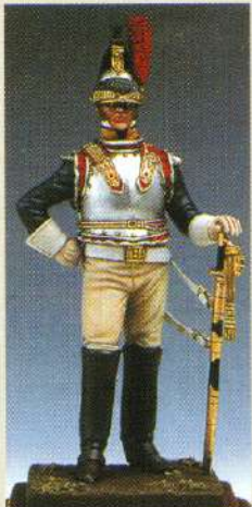
OFCUIR: Officier de cuirassiers 10 ème régiment 1809