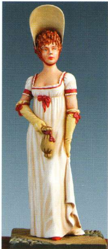
MER : MERVEILLEUSE MM94 : "MERVEILLEUSE"