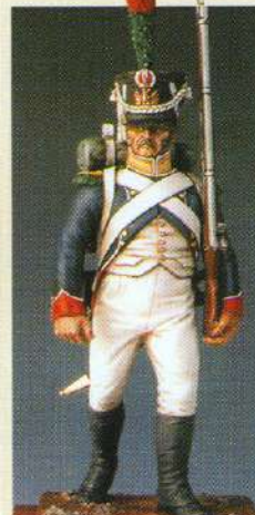
VOLGI: Voltigeur de la garde 1810