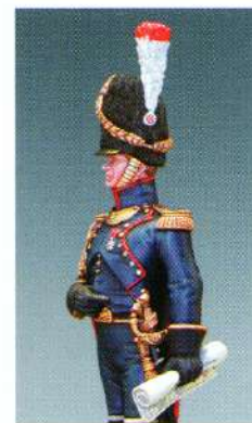
OFARGI : OFFICIER D'ARTILLERIE A PIED DE LA GARDE 1810

UFFICIALE D'ARTIGLIERIA A PIEDI DELLA GUARDIA 1810