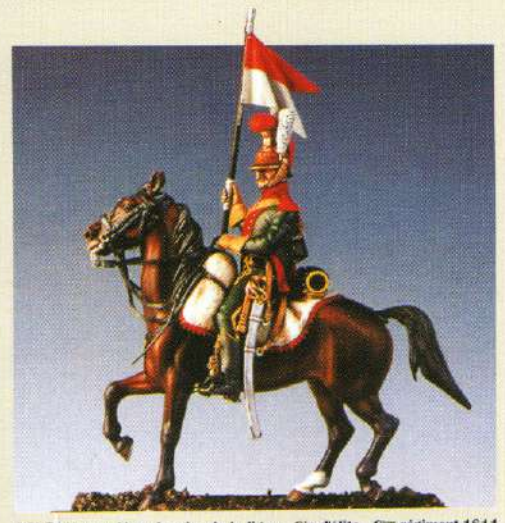
CCLF: Cheval-léger lancier de la ligne - Cie d'élite - 6 ème régiment 1811