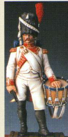
TBHG: Tambour des grenadiers hollandais de la garde 1812