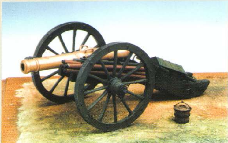
GRIB8: Canon de campagne. Piece de S. Système Gribeauval