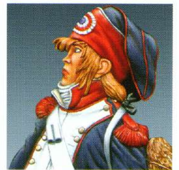
ETE8 : TAMBOUR EN BONNET DE POLICE 1796 (4,5cm)