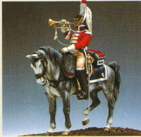
CTRCUIR: Trompette du 1 er régiment de cuirassiers 1809