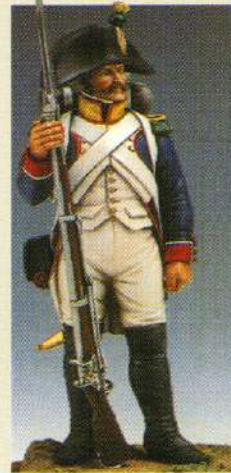
VOLB: Voltigeur en bicorne 1805