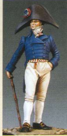
(Ce kit contient un bras droit, une canne et une tête en bicorne afin de réaliser une des deux versions).