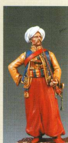
MA: Mameluk 1805