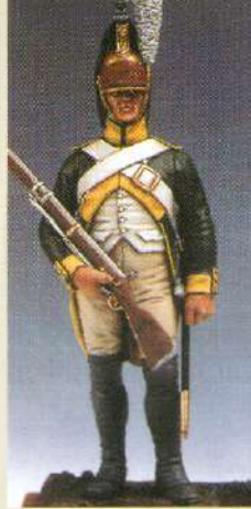
CPDRA: Dragon a pied du 19 ème régiment 1805