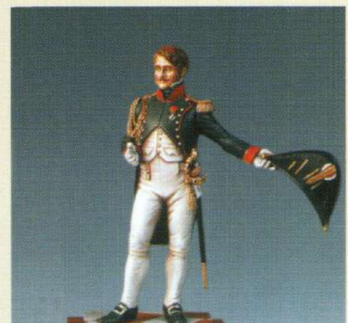
OFTBGI: Officier de chasseurs de la garde en tenue de bal 1806