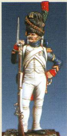
SCPGI: Sergent de chasseurs à pied de la garde 1806