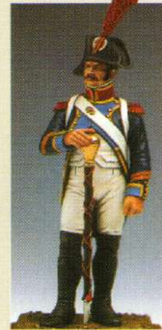
CAPTB: Caporal - tambour 1805