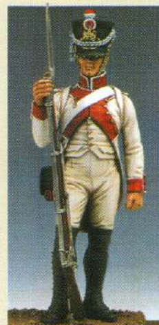
FUHB: Fusilier (habit blanc) 1807