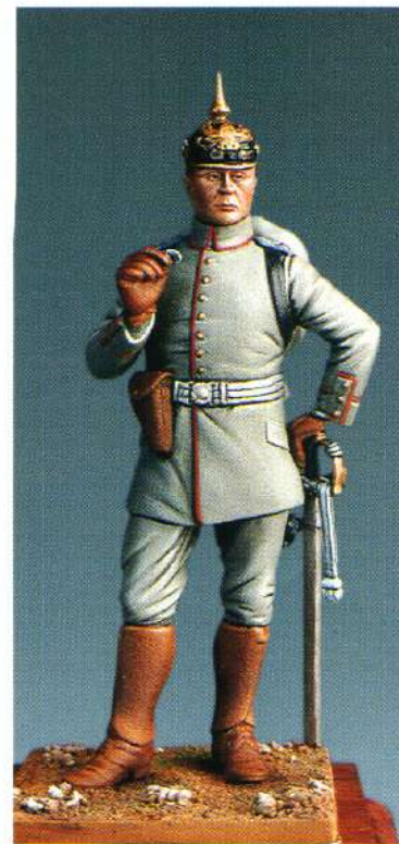
GG18 : OFFICIER D'INFANTRIE ALLEMAND 1914 UFFICIALE TEDESCO DI FANTERIA 1914 MMGG18 : GERMAN INFANTRY OFFICER 1914