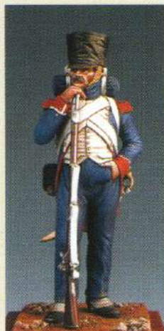
FCGI: Fusilier-chasseur de la garde 1810