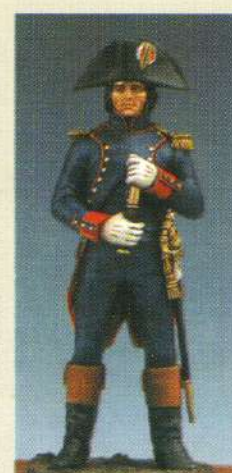
BON: Bonaparte au siège de Toulon 1793