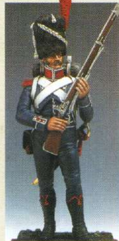
ILCAR: Infanterie légère, carabinier 1809