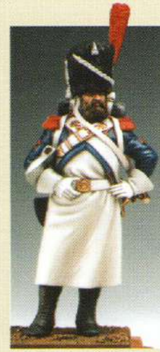
SAP1: Sapeur 1807