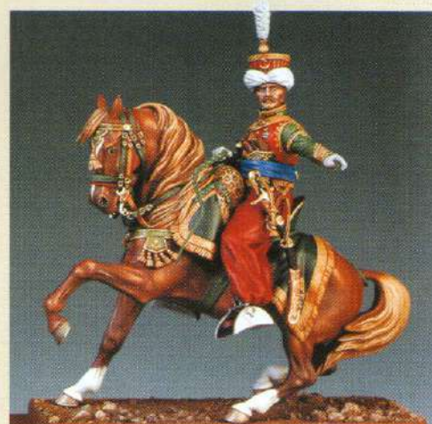
COFM: Officier de Mameluks 1809