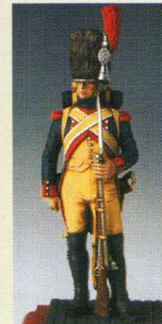
GEGI: Gendarme d'élite à pied de la garde 1806