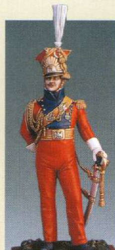
OFLRGI: Officier des lanciers rouges de la garde 1813