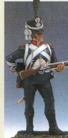
ILCC: Infanterie légère caporal de chasseurs 1809