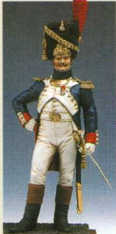
OFGGI: Officier de grenadiers à pied de la garde 1809