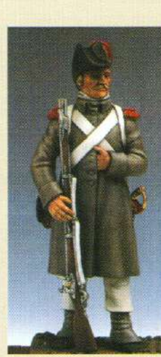
GRM: Grenadier en manteau 1806