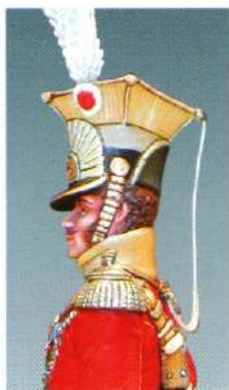
GHGN : OFFICIER DES GARDES D'HONNEUR DU ROYAUME DE NAPLES 1813

UFFICIALE DELLA GUARDIA D'ONORE , REGNO DI NAPOLI 1813