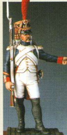
SFGGI: Sergent de fusiliers grenadiers de la garde 1809