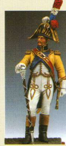
TBM67: Tambour-Major du 67 e régiment