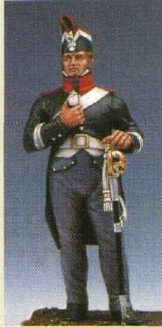
BRIDRA: Brigadier du 12 ème RGT de dragons 1808