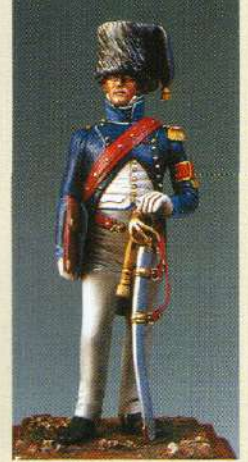
ACG: Aide de camp de Général 1810