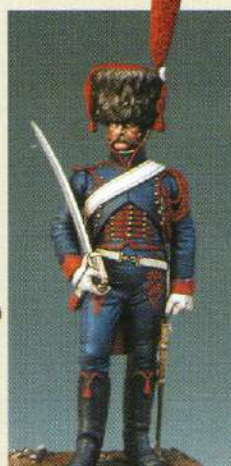
CAGI: Canonnière à cheval de la garde 1807