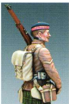
GG19 : FANTASSIN ECOSSAIS, GORDON HIGHLANDERS 1914