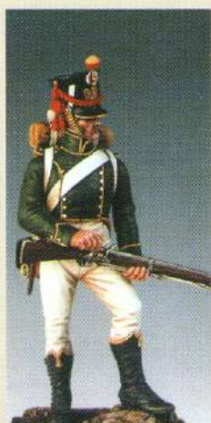
FGGI: Flanqueur - grenadier de la garde 1813