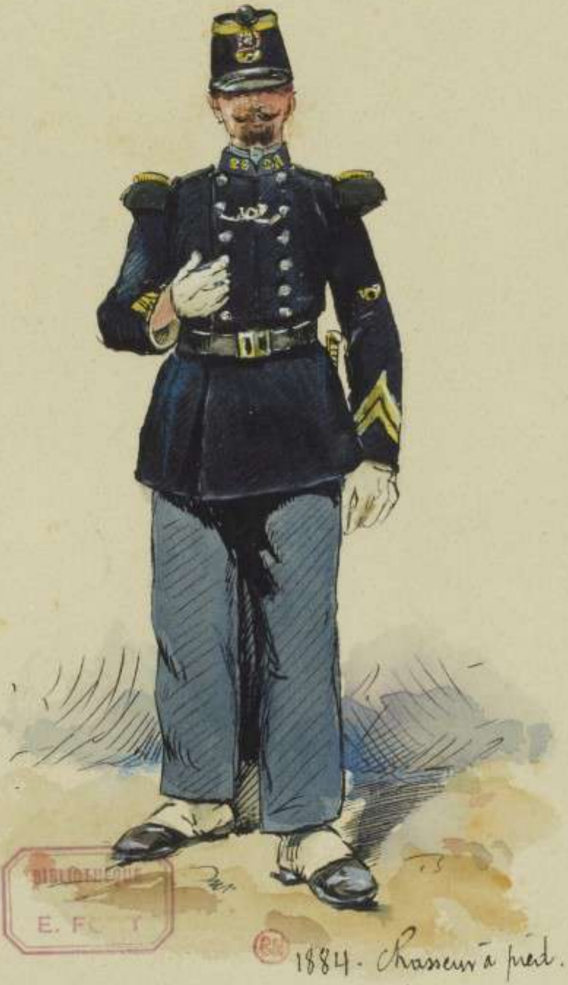
17°- Chasseur à pied en 1884