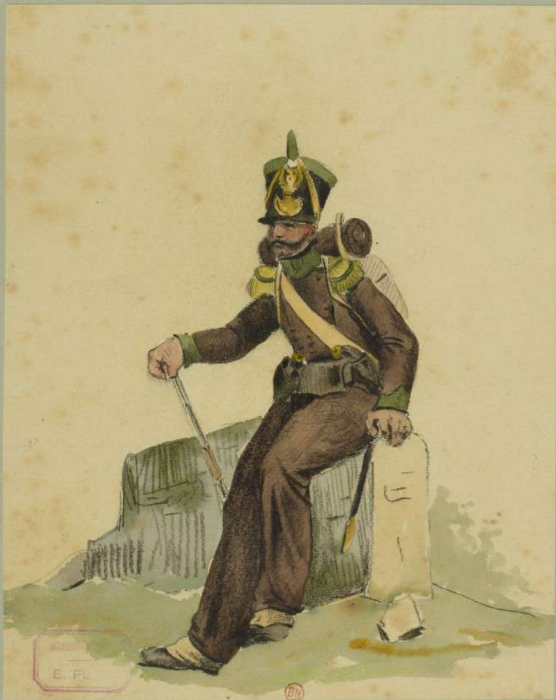
Voltigeur corse d'ap H. Bellangé