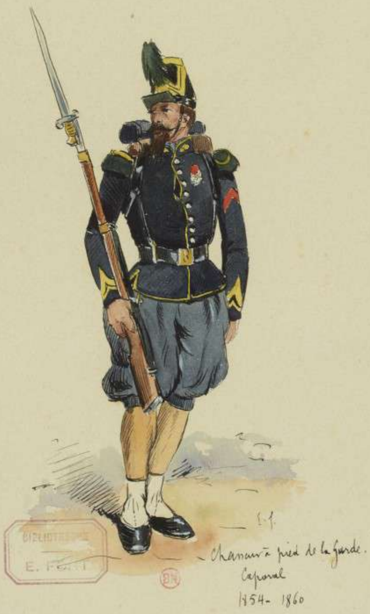
12° - Caporal des Chasseurs à pied de la Garde Impériale en 1854-1860