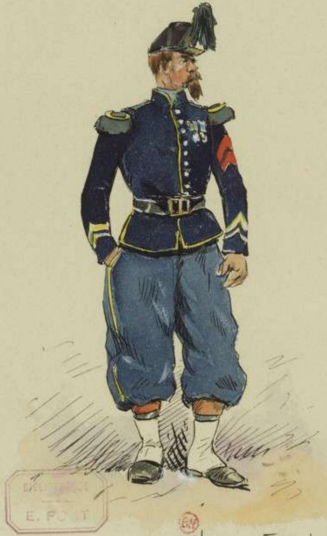
1860-1868 Chasseur à pied.