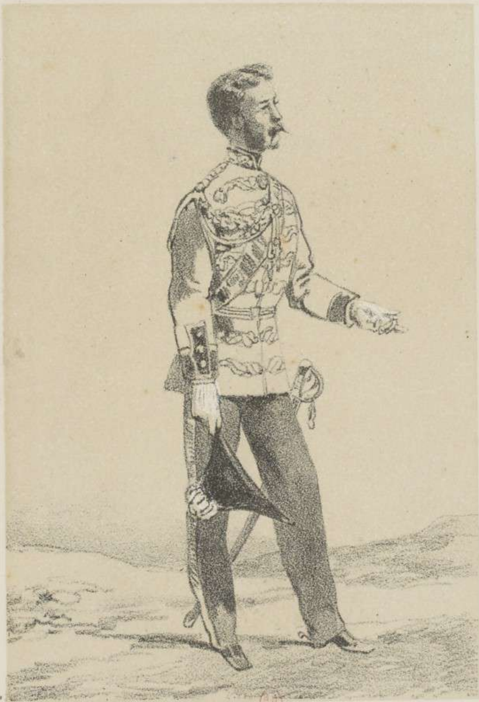
AIDE DE CAMP DE LA REINE