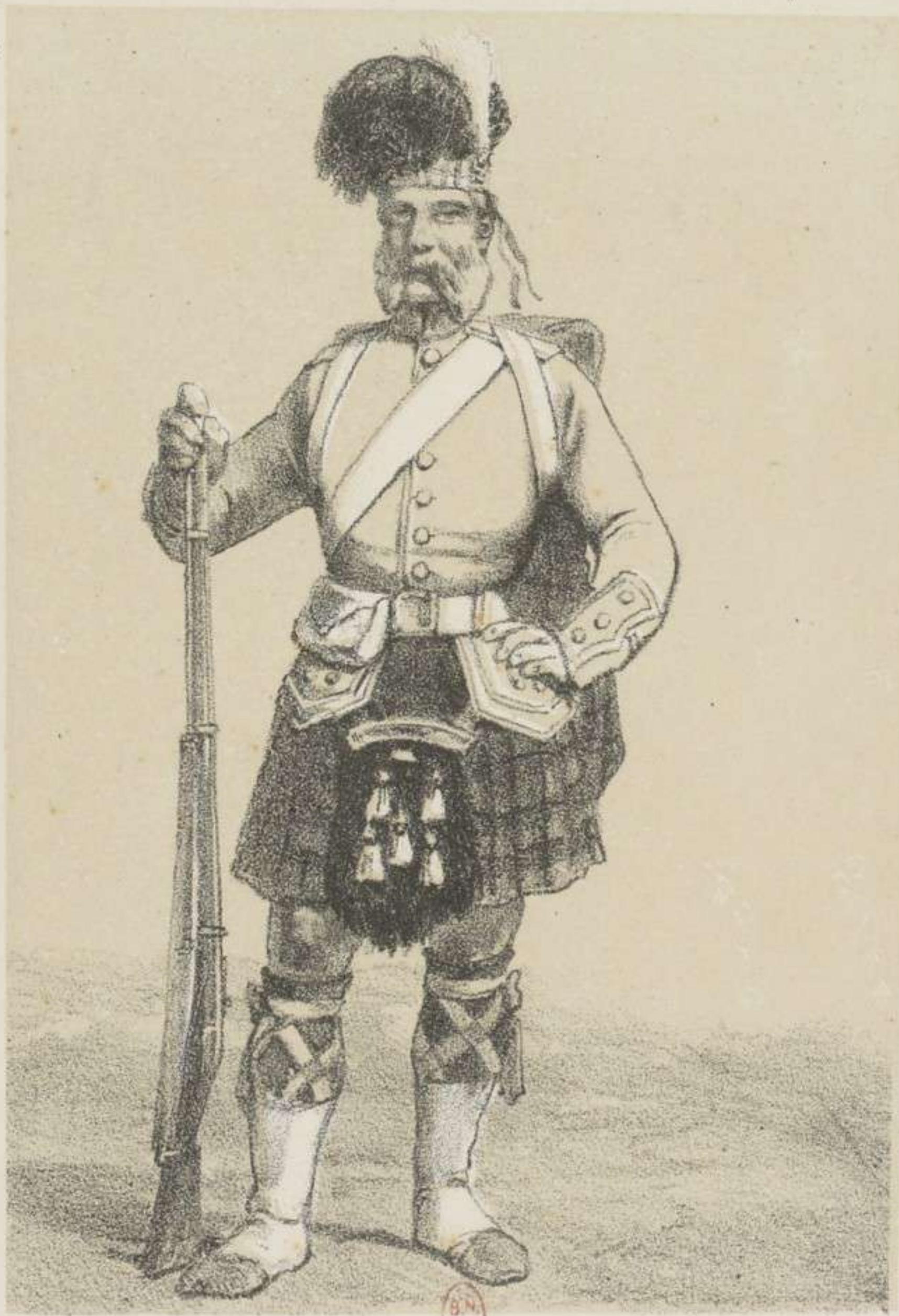
92 E . HIGHLANDER