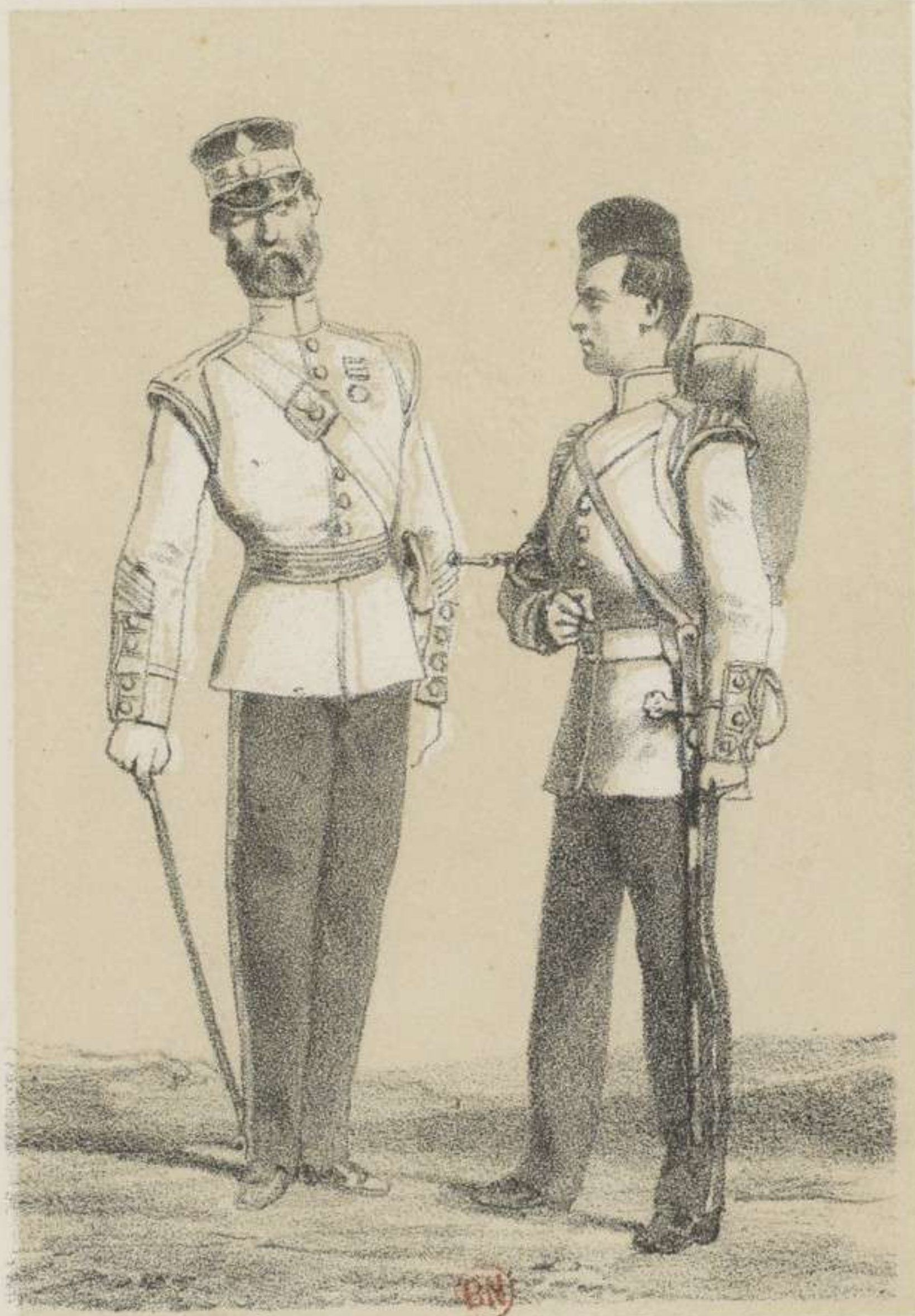
ROYAL FUSILIERS TAMBOUR-MAJOR & MUSICIEN.