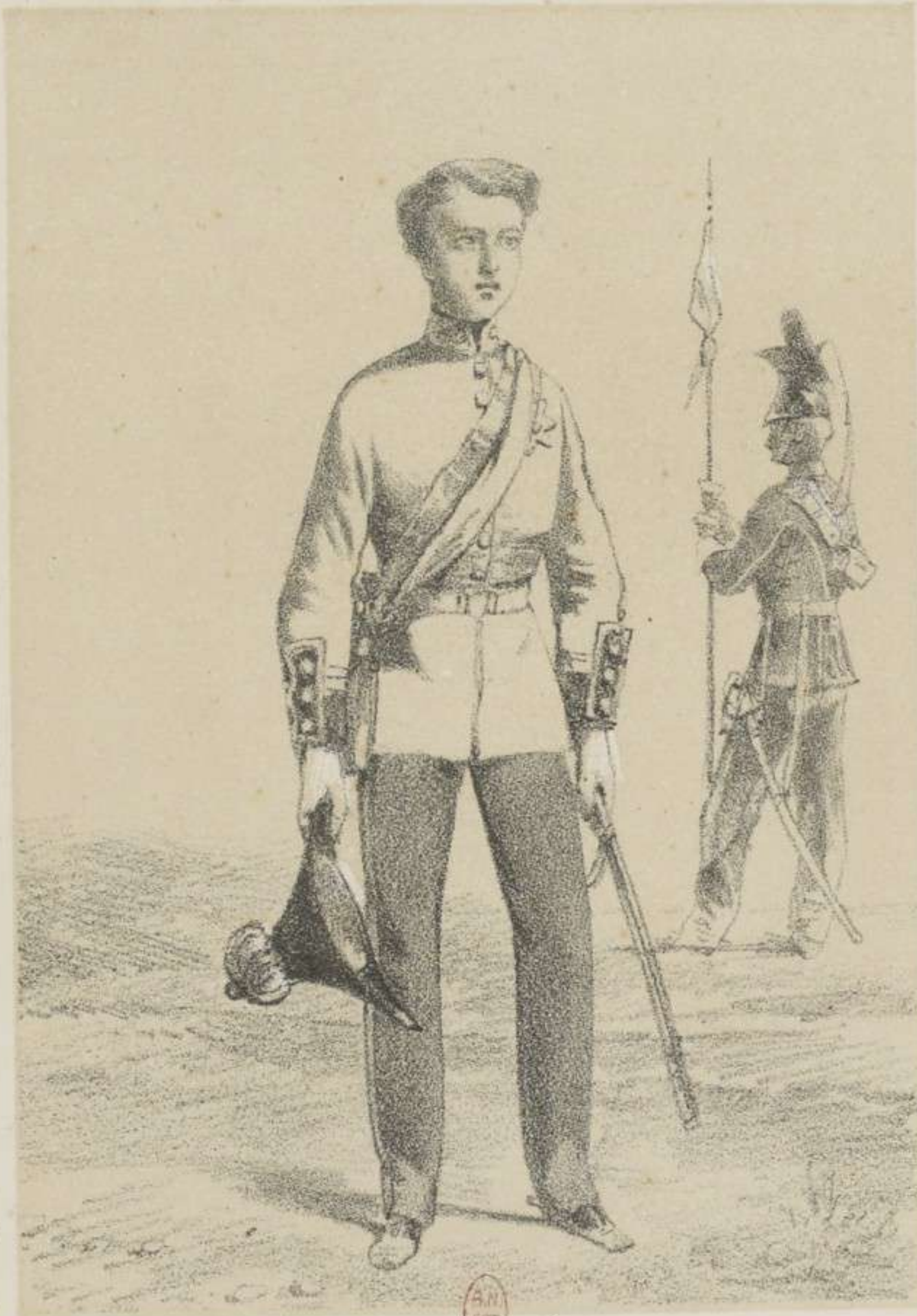
COLONEL (HORS CADRE)