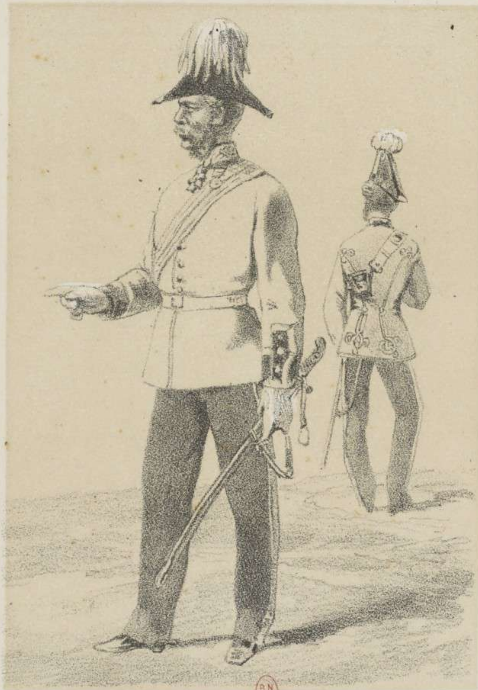
GÉNÉRAL DE DIVISION