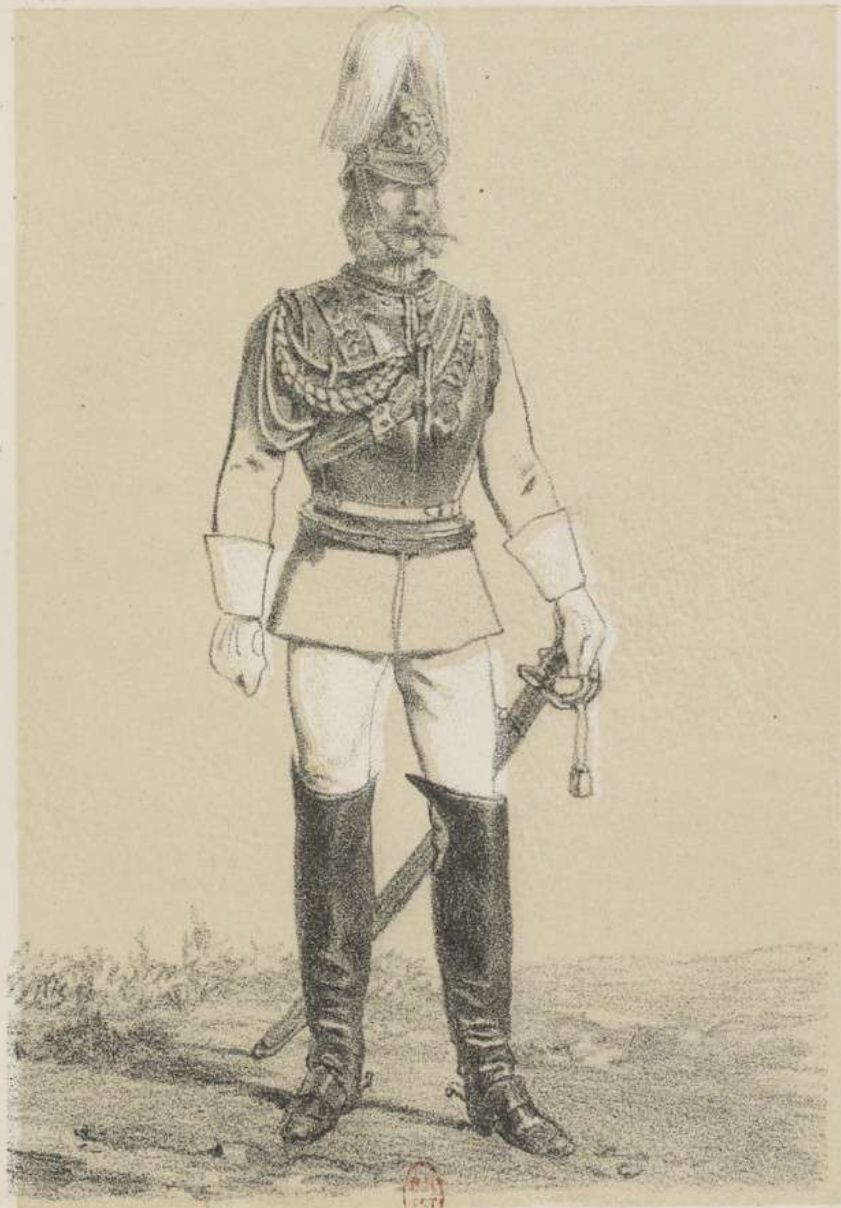
EST GARDE DU CORPS.