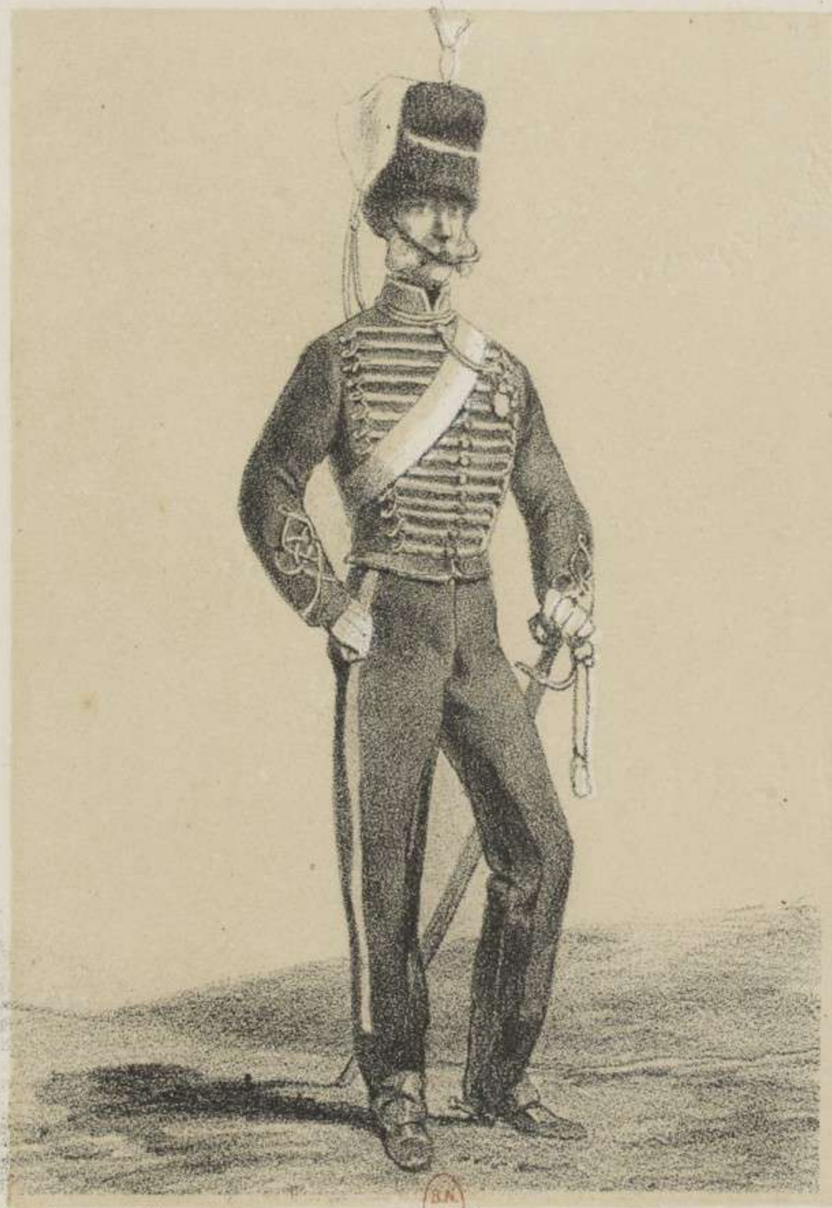
ARTILLERIE EST À CHEVAL