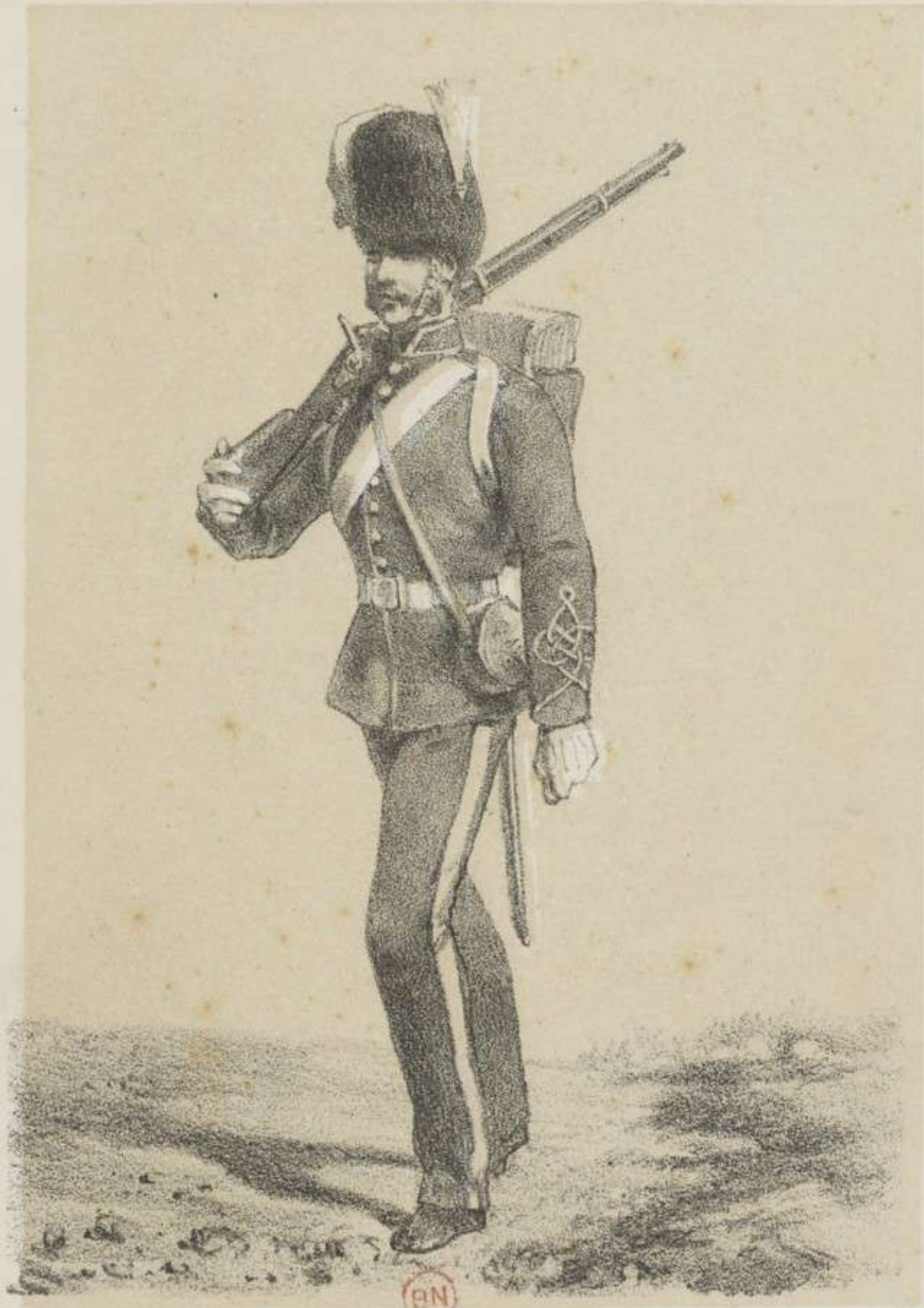
ARTILLERIE À PIED