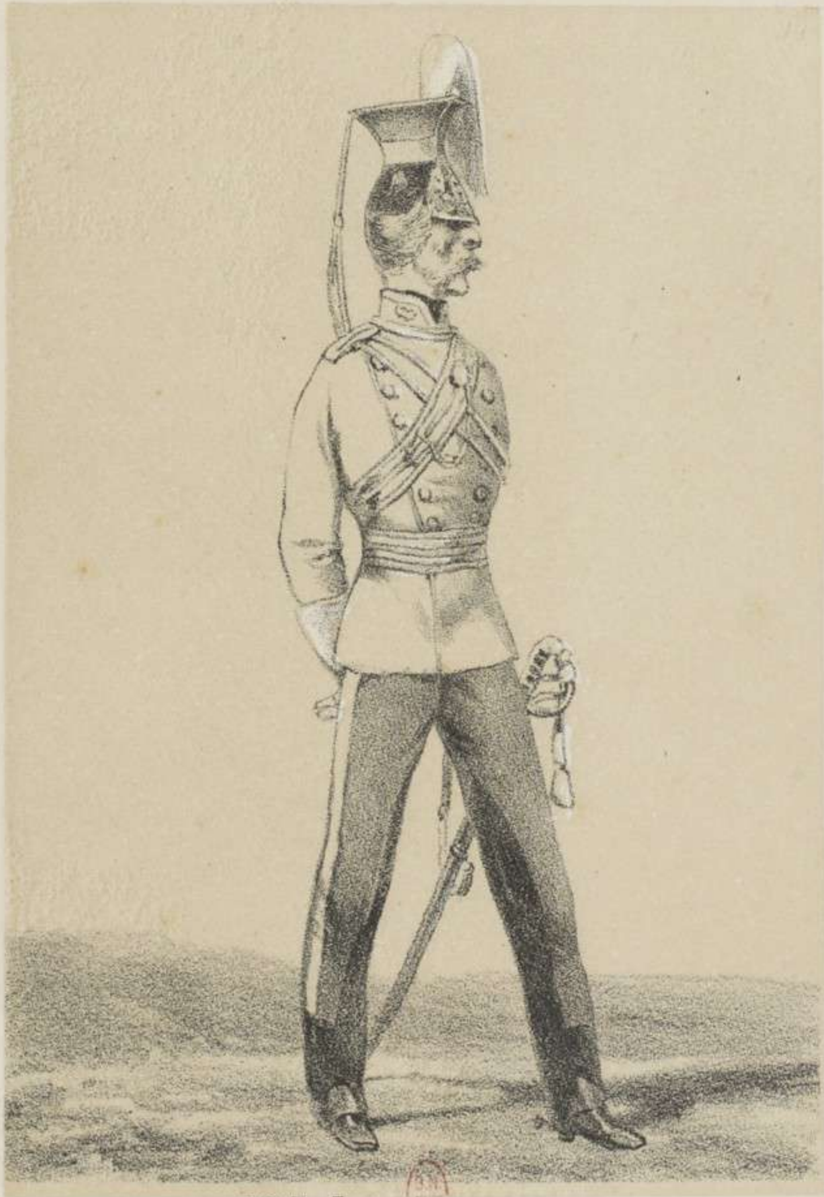
16 E LANCIERS