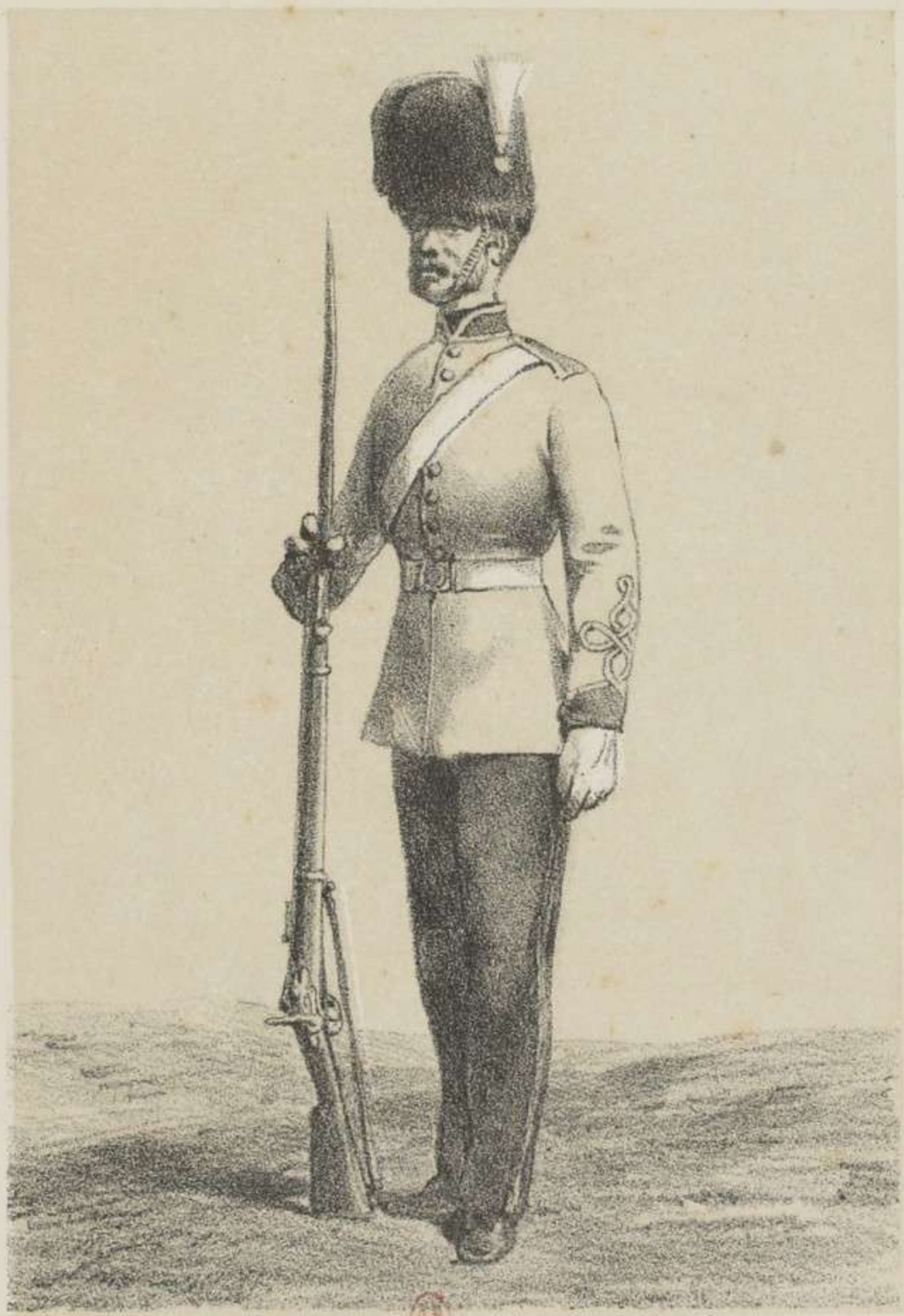
SOLDAT 54 EST DU GÉNIE