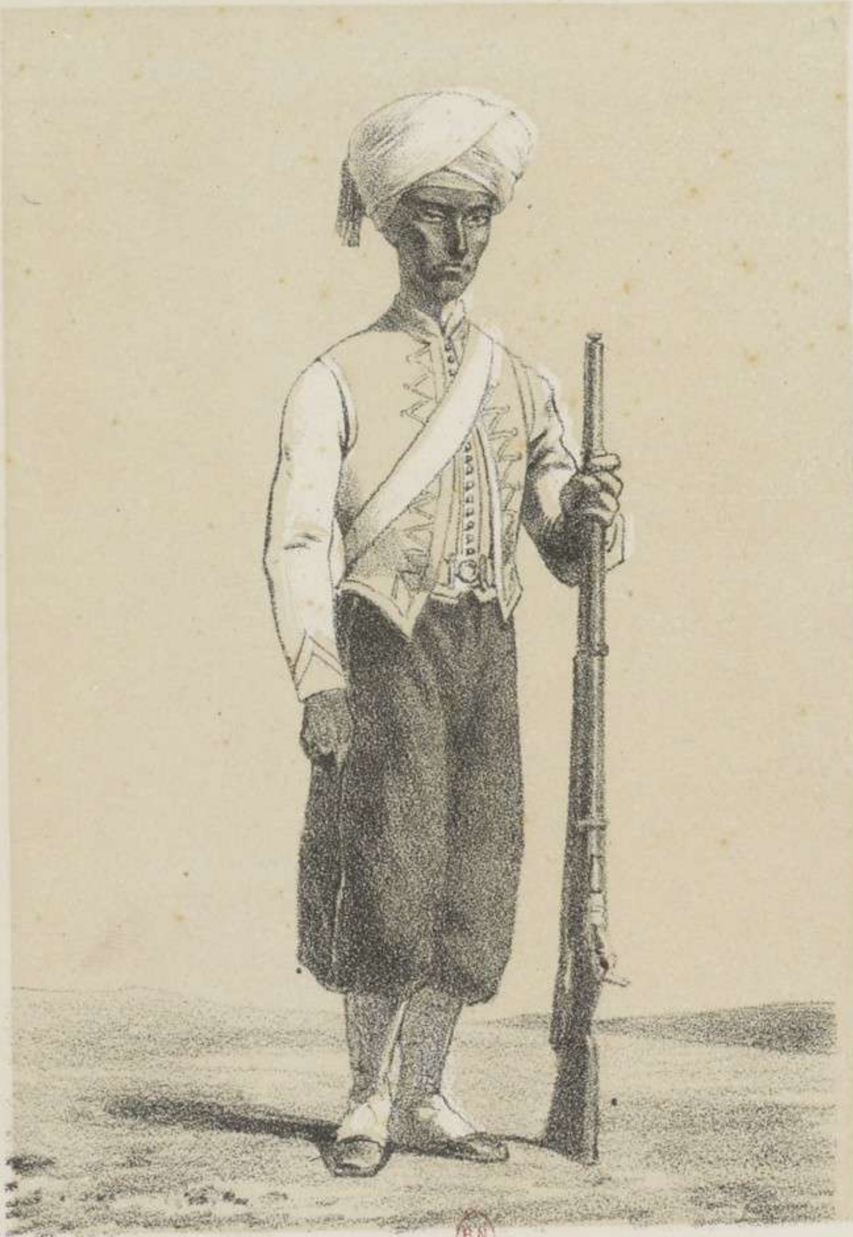
3 E RÉGIMENT INDES OCCIDENTALES