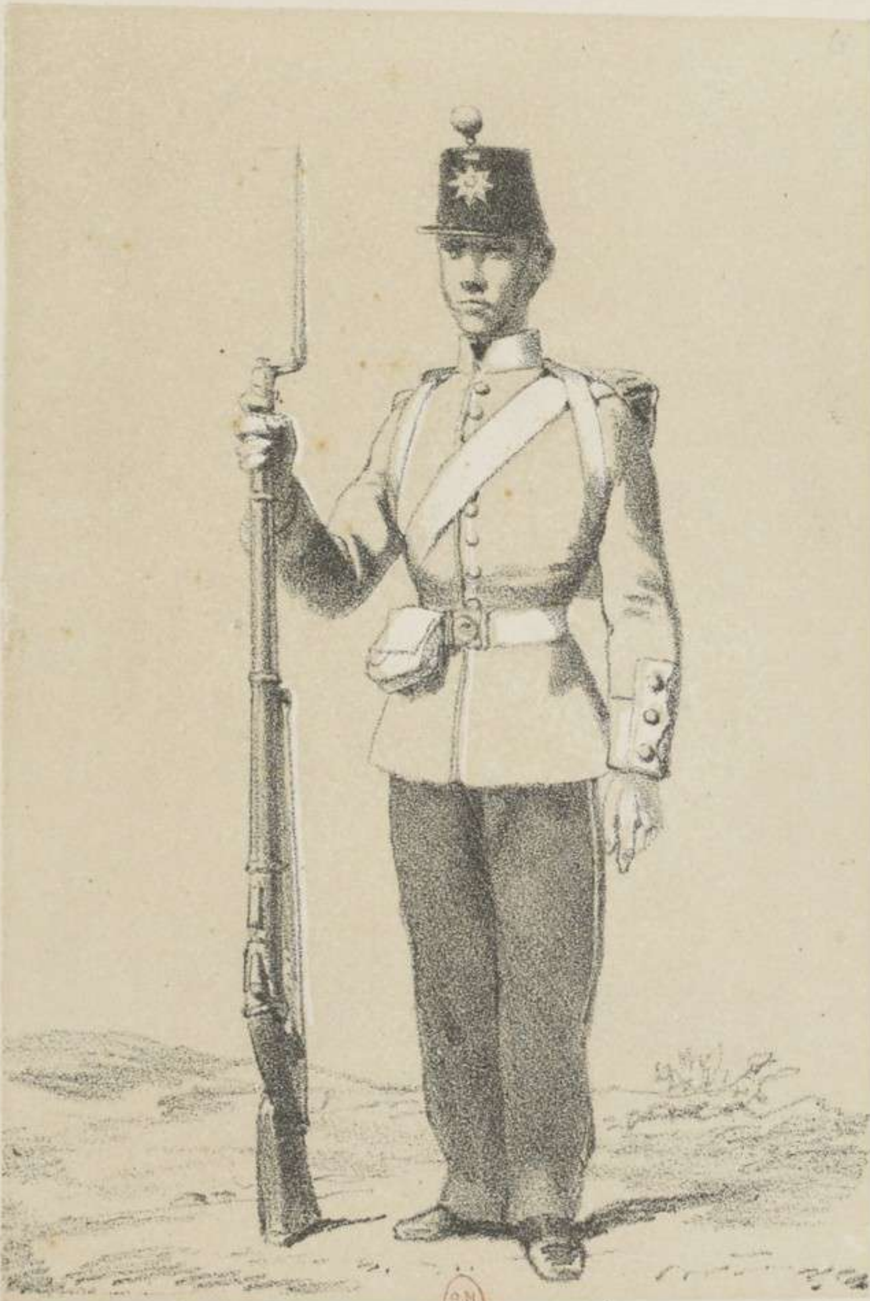
INFANTERIE DE LIGNE