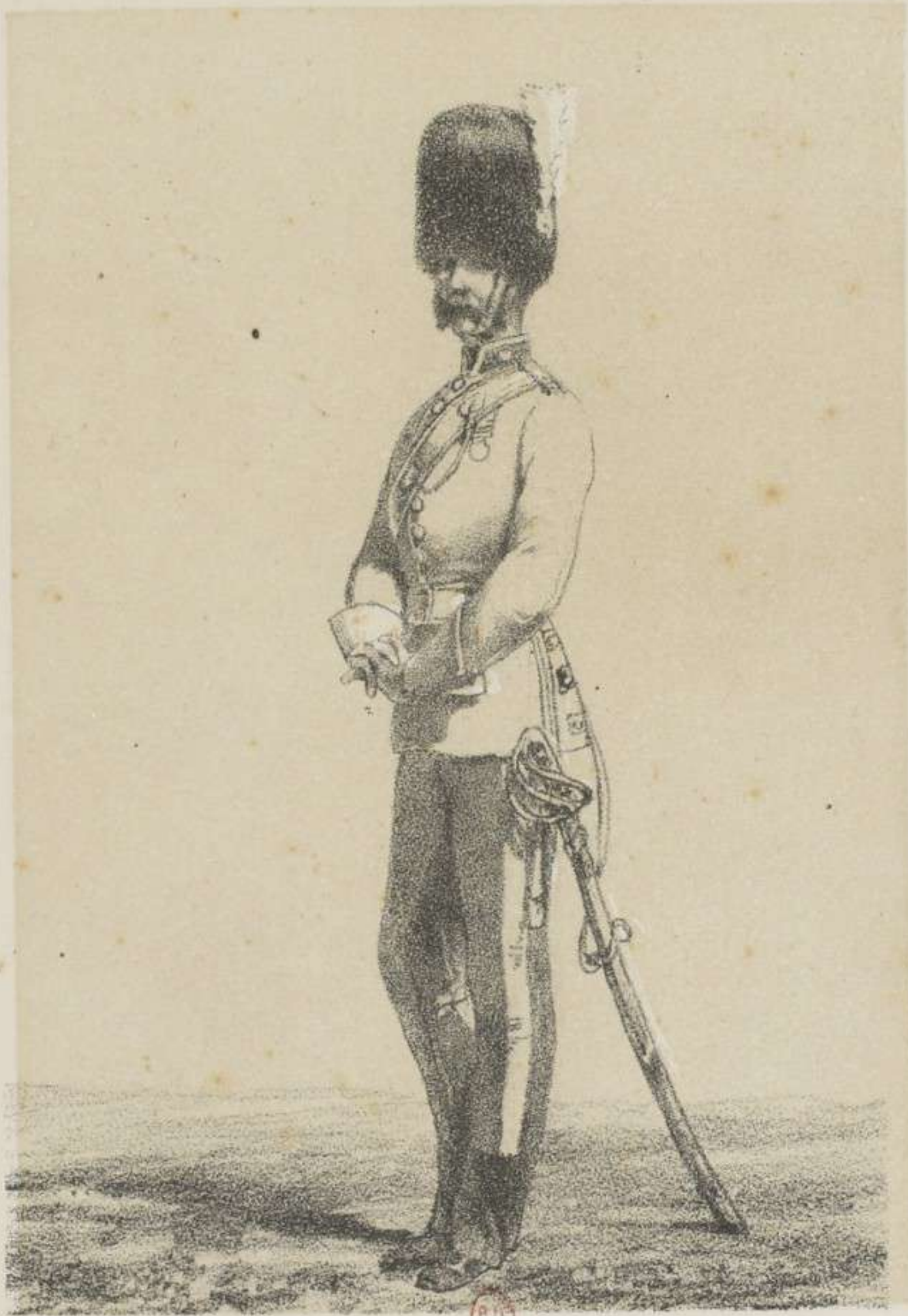
SCOTCH - GREYS