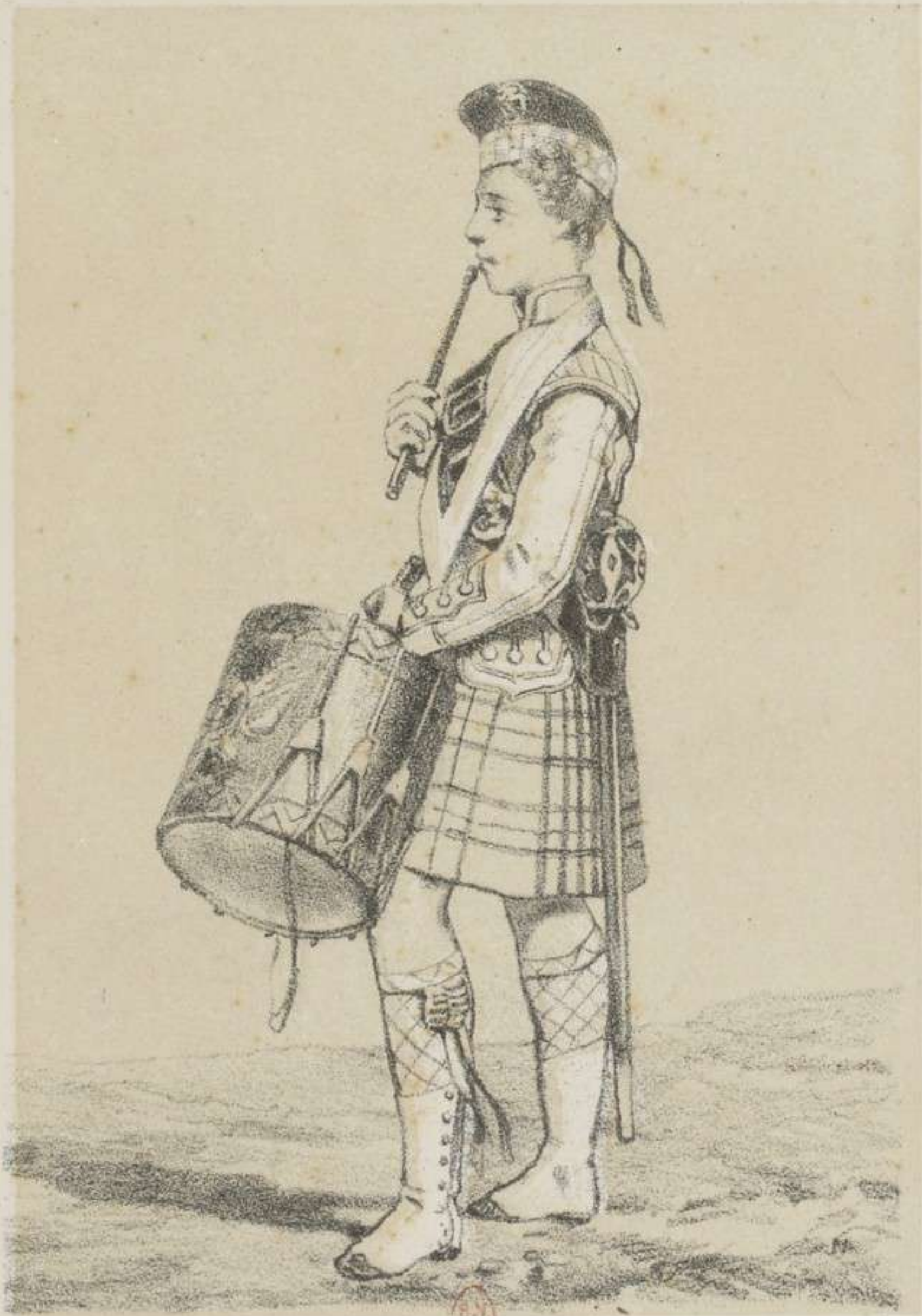
TAMBOUR DU 93 E . HIGHLANDER