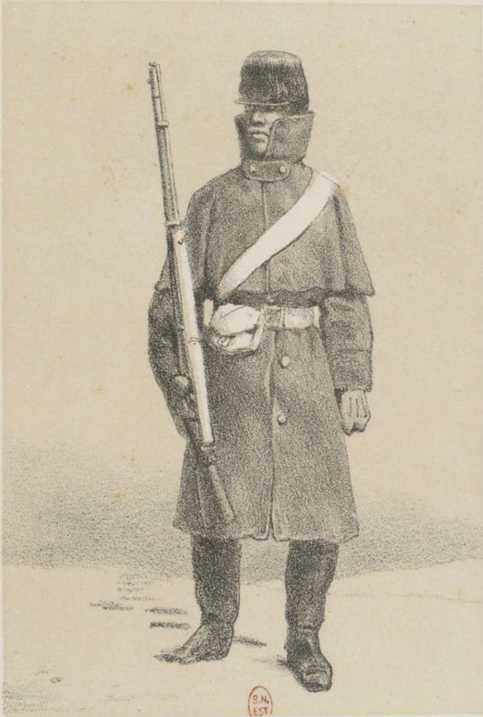
TROUPES DU CANADA 21 e RÉGIMENT.