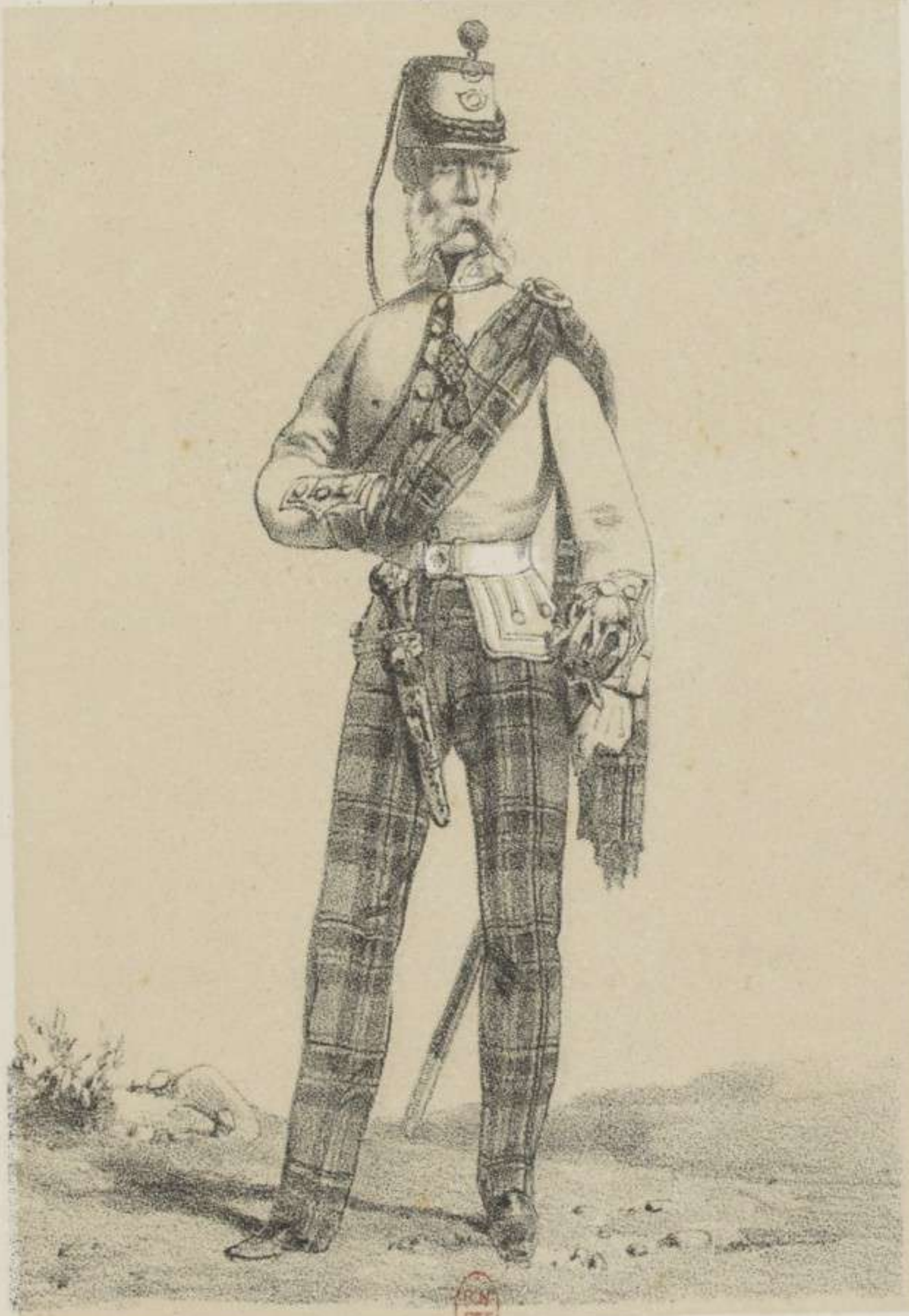
71 E HIGHLANDER