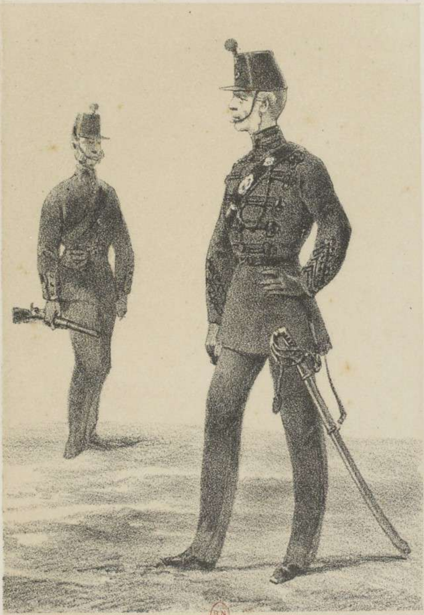
B.N. EST RIFLEMEN