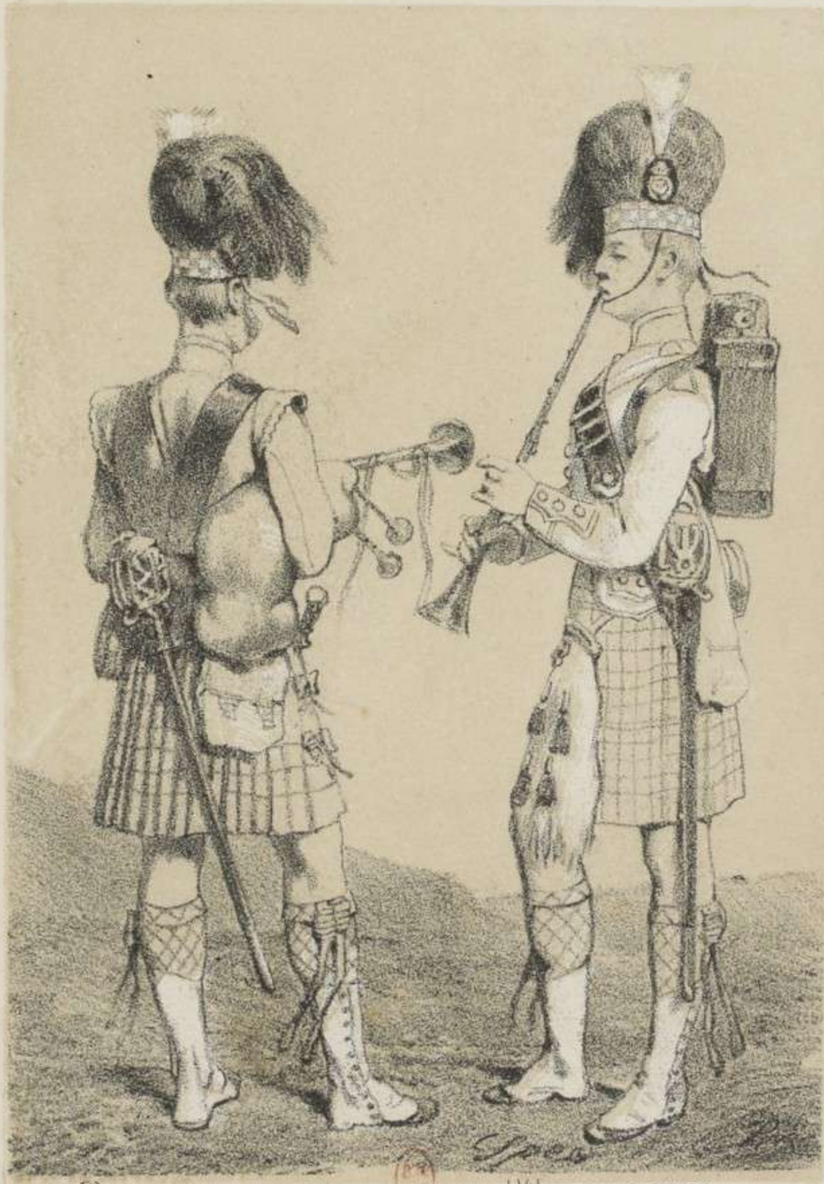
CORNEMUSE 42 e HIGHLANDER