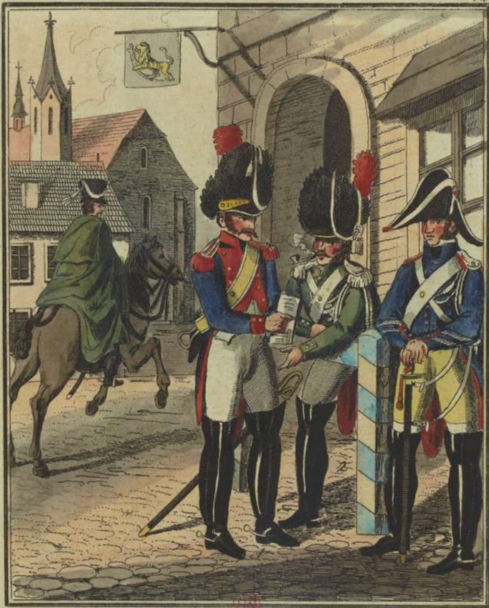
1. Carabinier. 2. Elite des Dragons. 3. Sergeant des Gens d'armes.