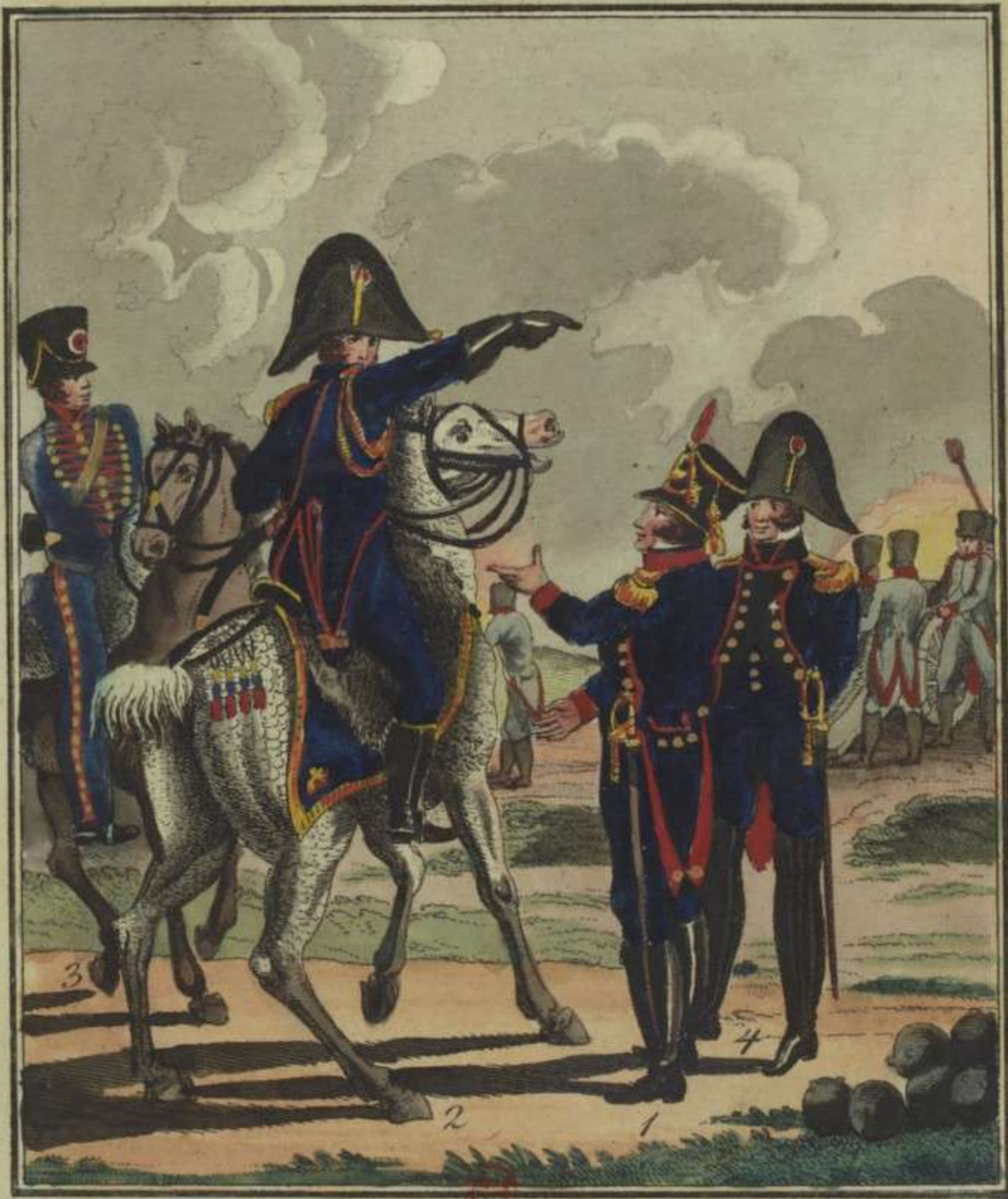
1. Officier de Cannonier à pied 2. Officier d'Artillerie à cheval 3. Cannonier à cheval. 4. Officier du Génie.