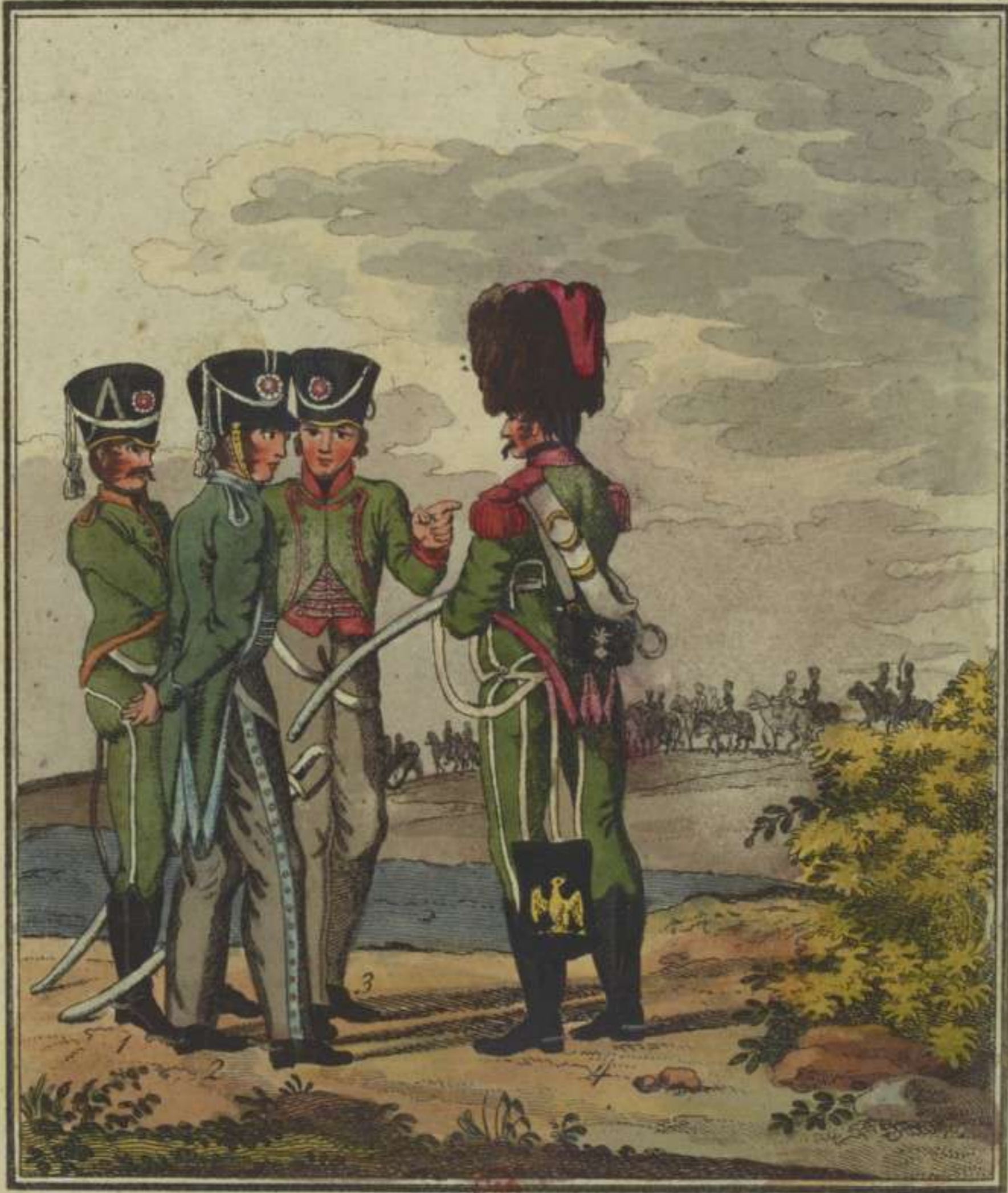
1. 2. 3. Chasseurs à cheval du 12 me 19 me & 27 me régiment. 4. Chasseur à cheval d'Elite du 6 me régim.