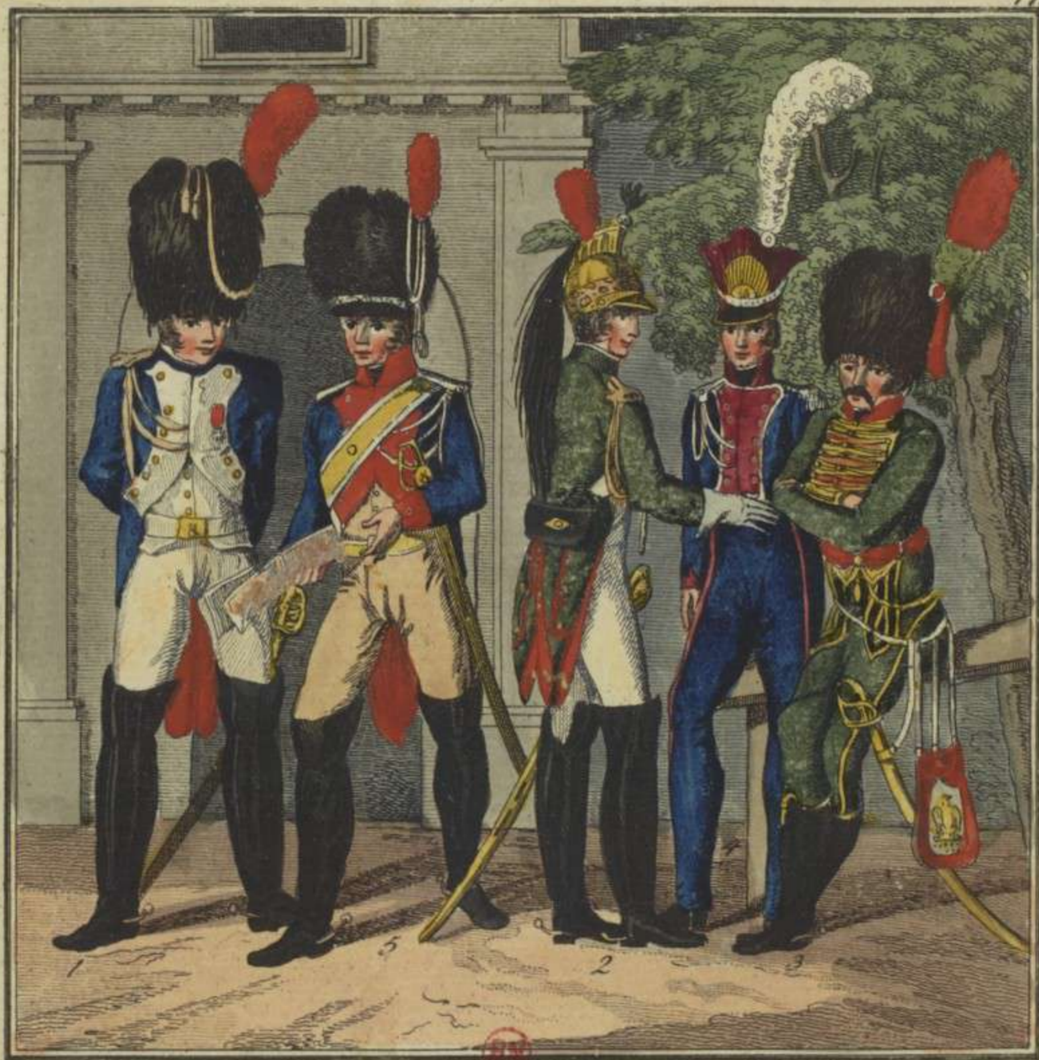
1. Grenadier à cheval de la Garde Impériale 2. Dragon 3. Chasseur à cheval 4. Garde Polonaise 5. Gens d'armes d'Elite.