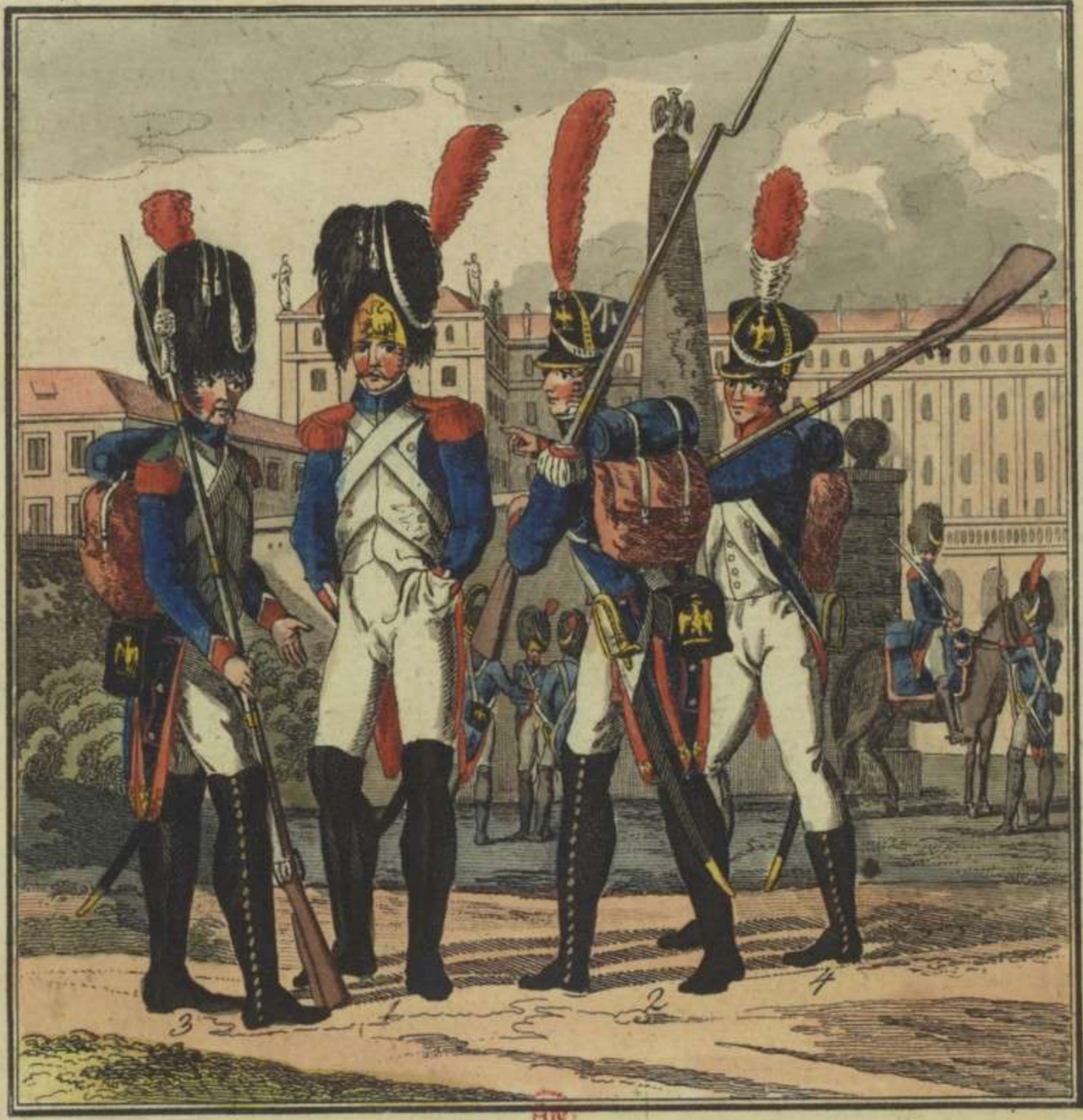
1. Grenadier de la Garde Imperiale 2. Fusilier. 3. Chasseur à pied 4. Tirailleur.