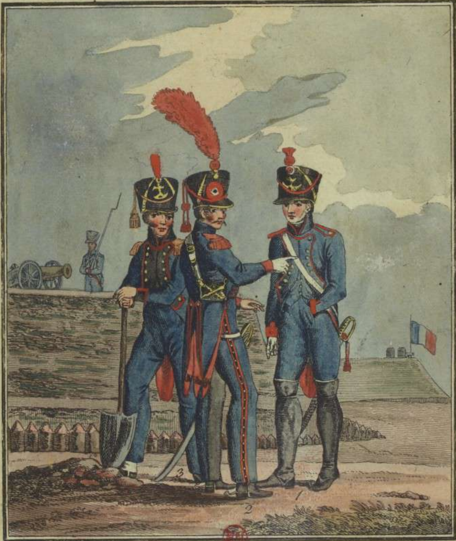
1. Cannonier à pied. 2. Cannonier à cheval 3. Mineur.