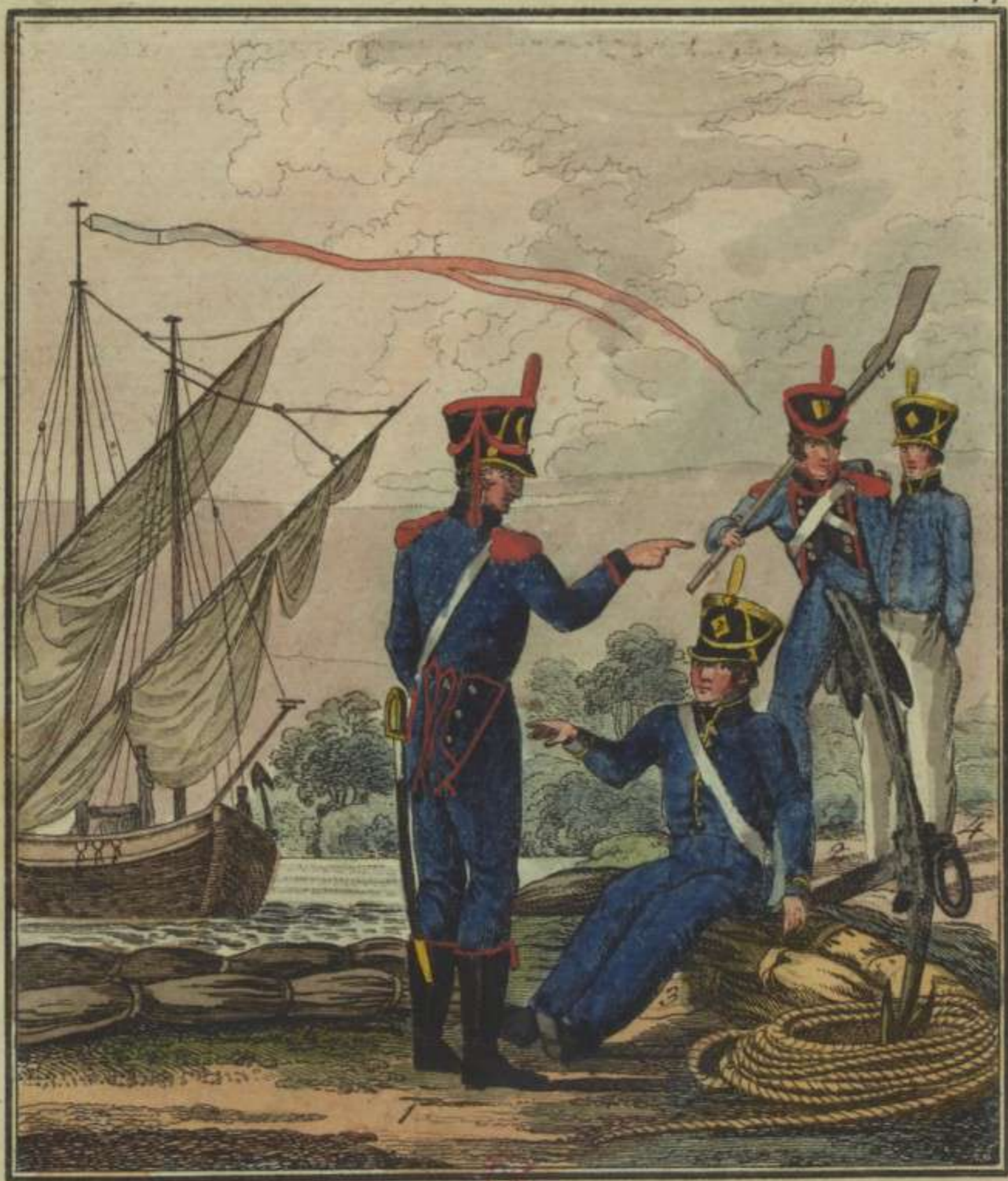
1. 2. Pontonniers. 3. 4. Mariniers.