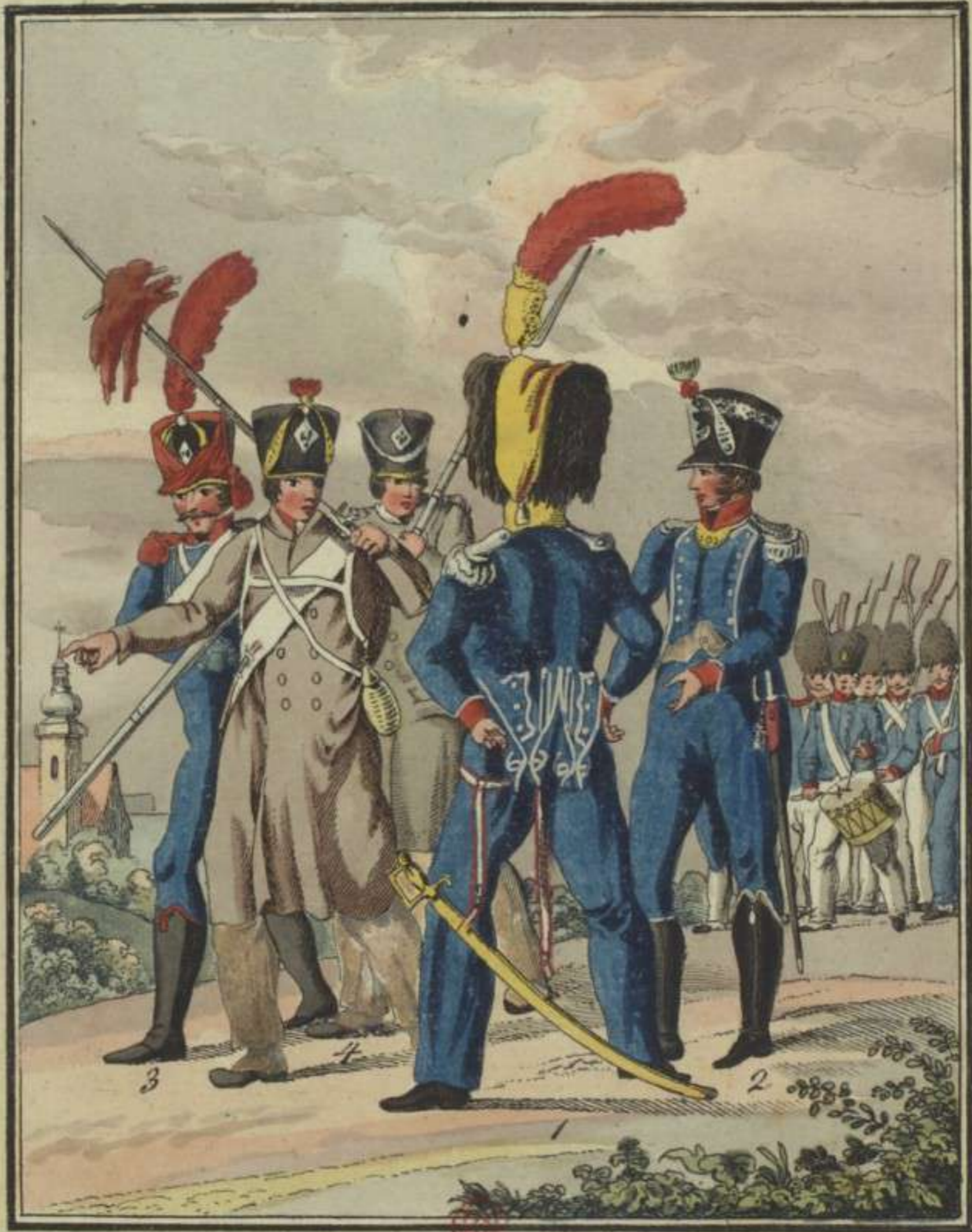
1. Officier des Voltigeurs d'Infanterie legere. 2. Officier de Chasseurs 3. Carabinier d'Infanterie legere. 4 Chasseur à pied.