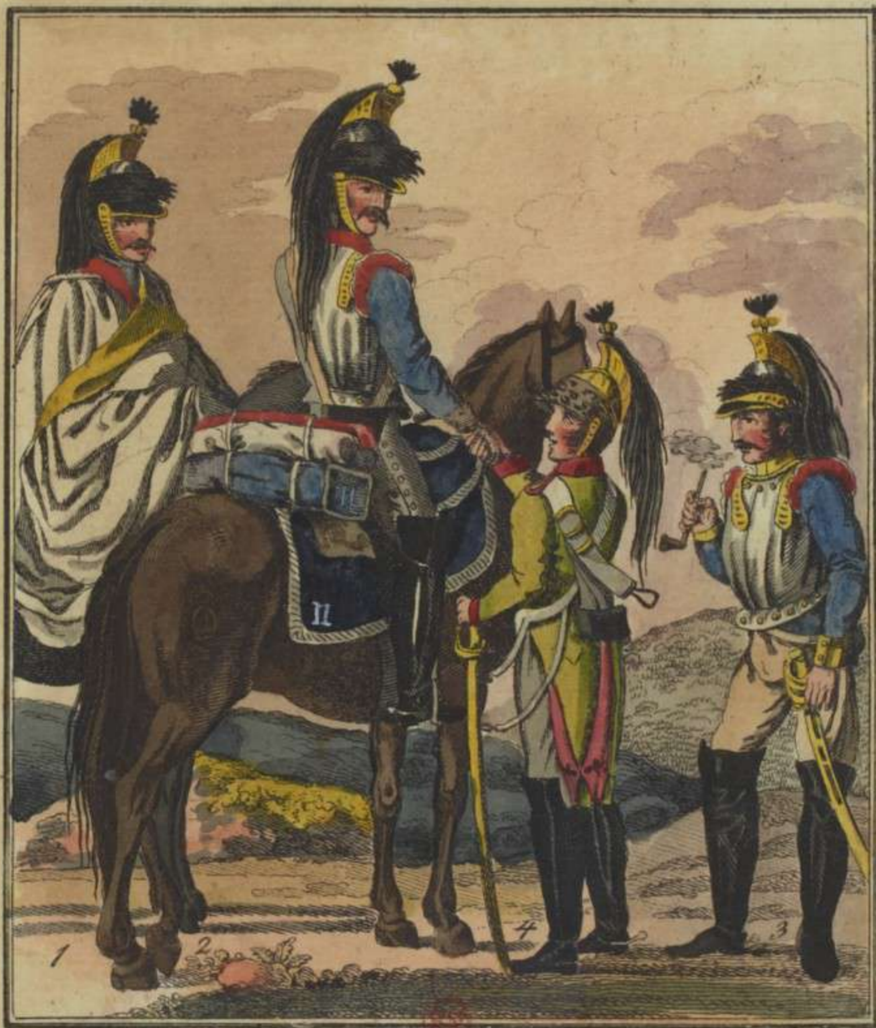
1. 2. Cuirassiers de la division du General Arigki Duc de Padoue 3. Cuirassier de la division du General Comte de Nansouty 4. Dragon.