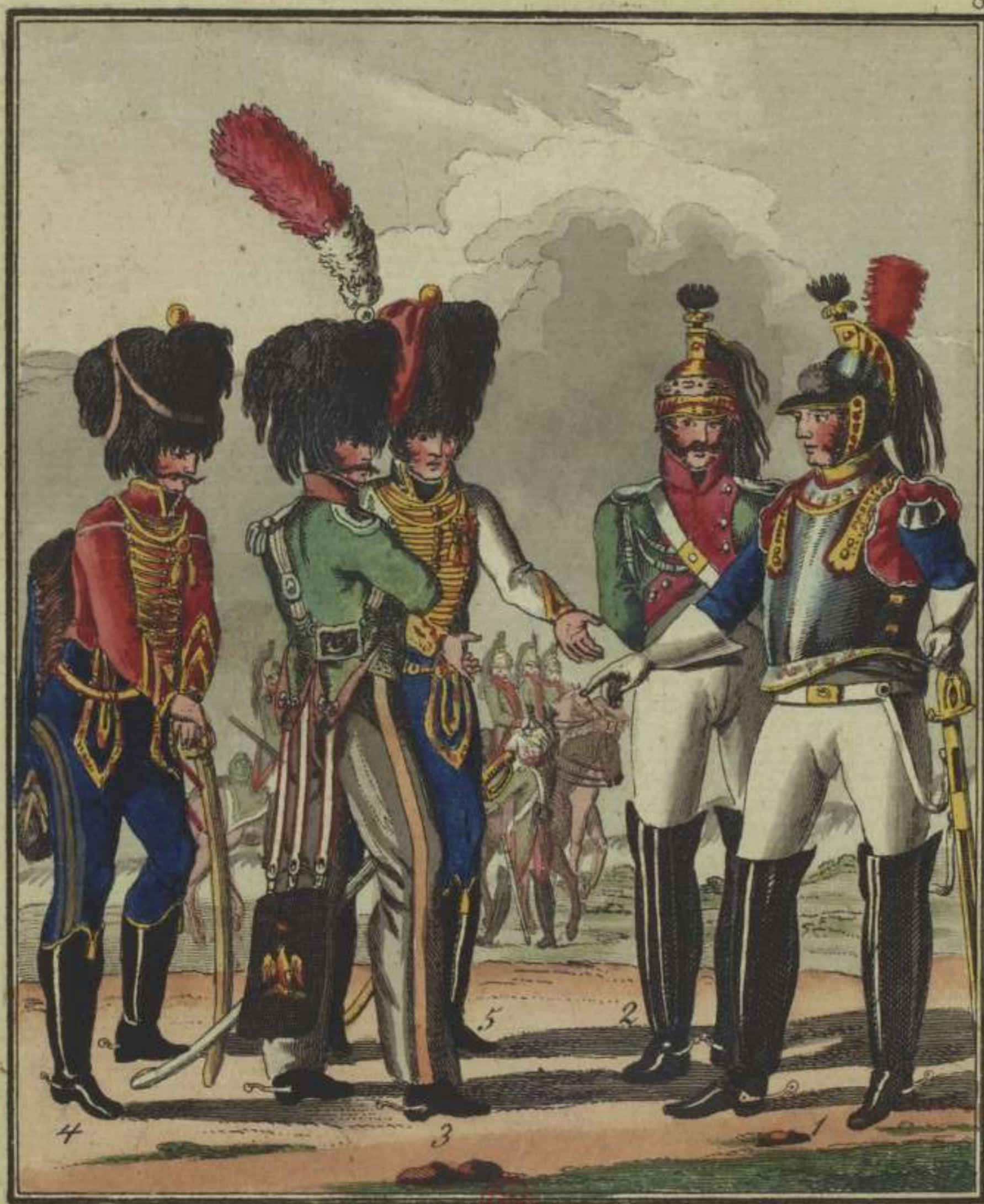
1. Officier des Cuirassiers. 2. Officier des Dragons. 3. Officier des Chasseurs à cheval. 4 & 5. Officiers des Houspards du 5 me et 9 me régiment.