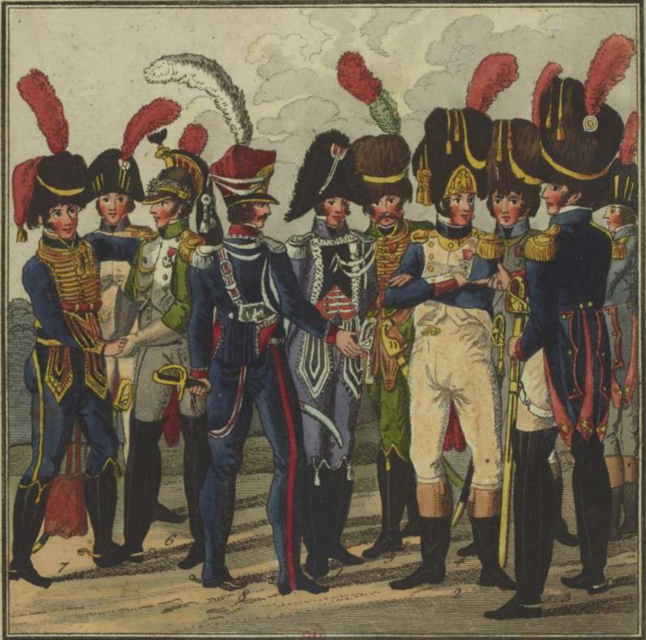
1. Officier d'ordonnance de l'Empereur. 2. Officier des Grenadiers à pied de la Garde Impériale. 3. Officier des Grenadiers à cheval. 4. Officier des Chasseurs à pied. 5. Officier des Chasseurs à cheval. 6. Officier des Dragons. 7. Officier de l'Artillerie à cheval. 8. Officier de la Garde Polonoise.