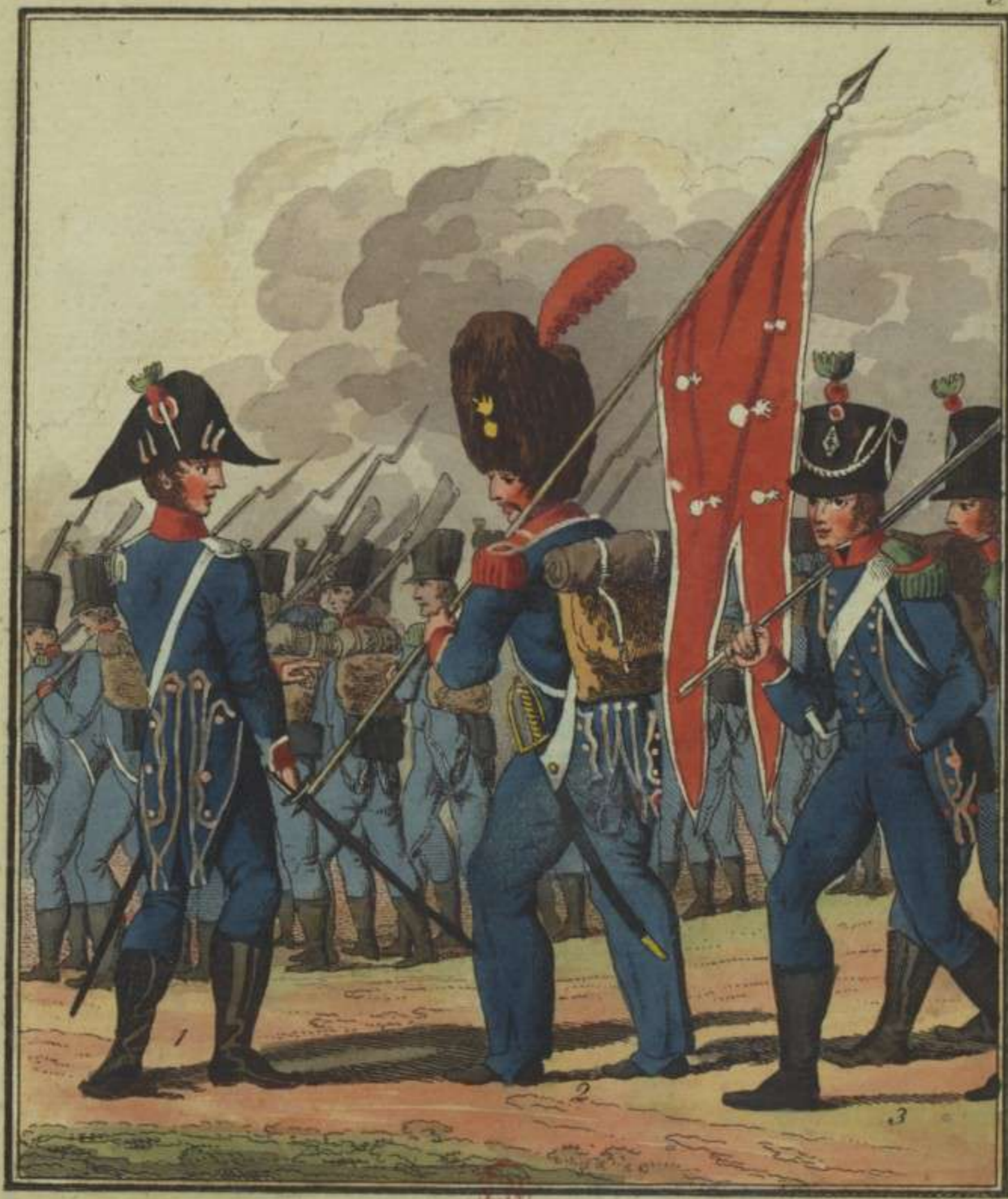
1. Officier des Carabiniers 2. Sergeant des Carabiniers portant le guidon. 3. Chasseur à pied.