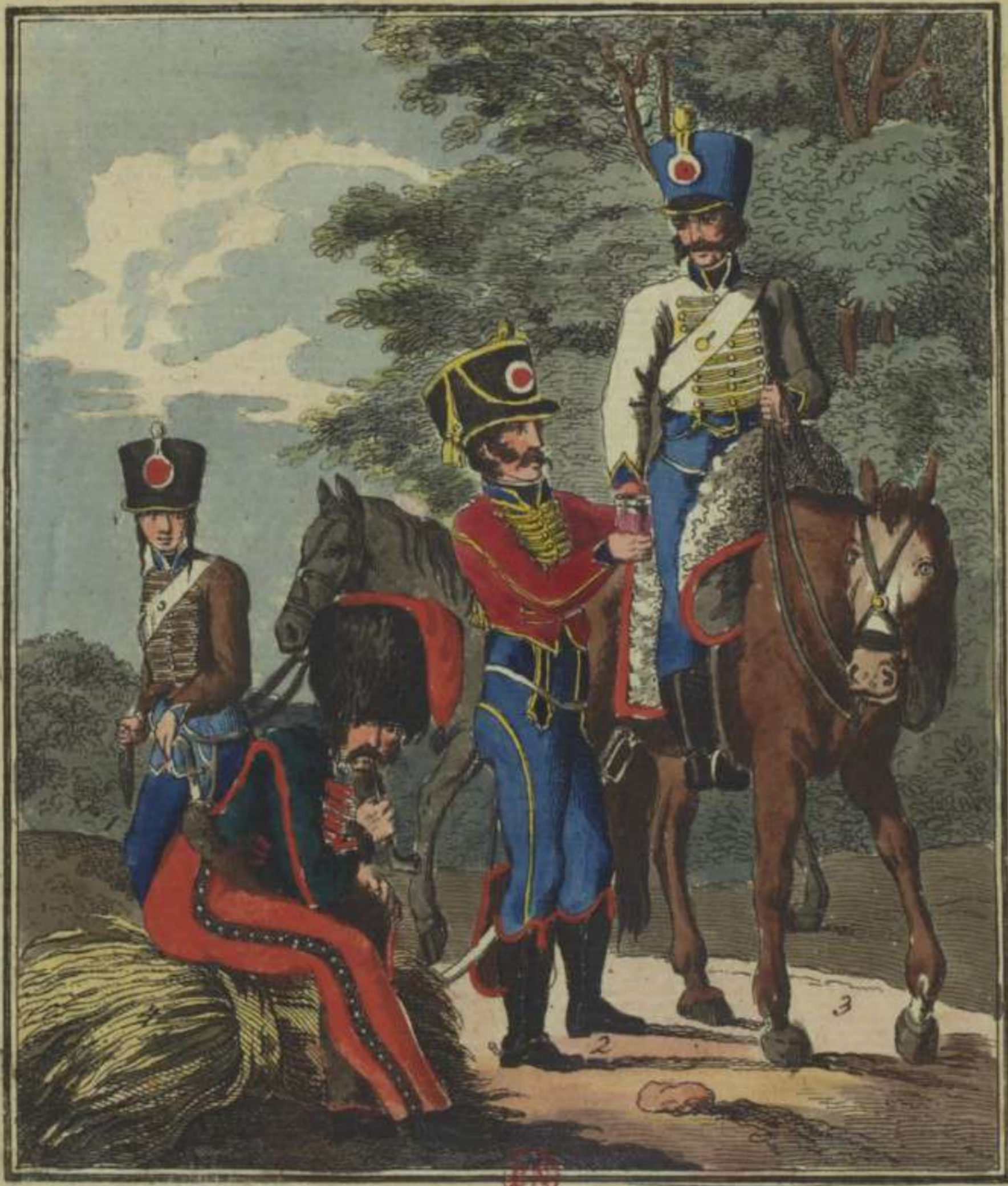
1. 2. 3. Hussards du 5 me 9 me et 13 me regiment 4. Elite des Hussards du 8 me regim.