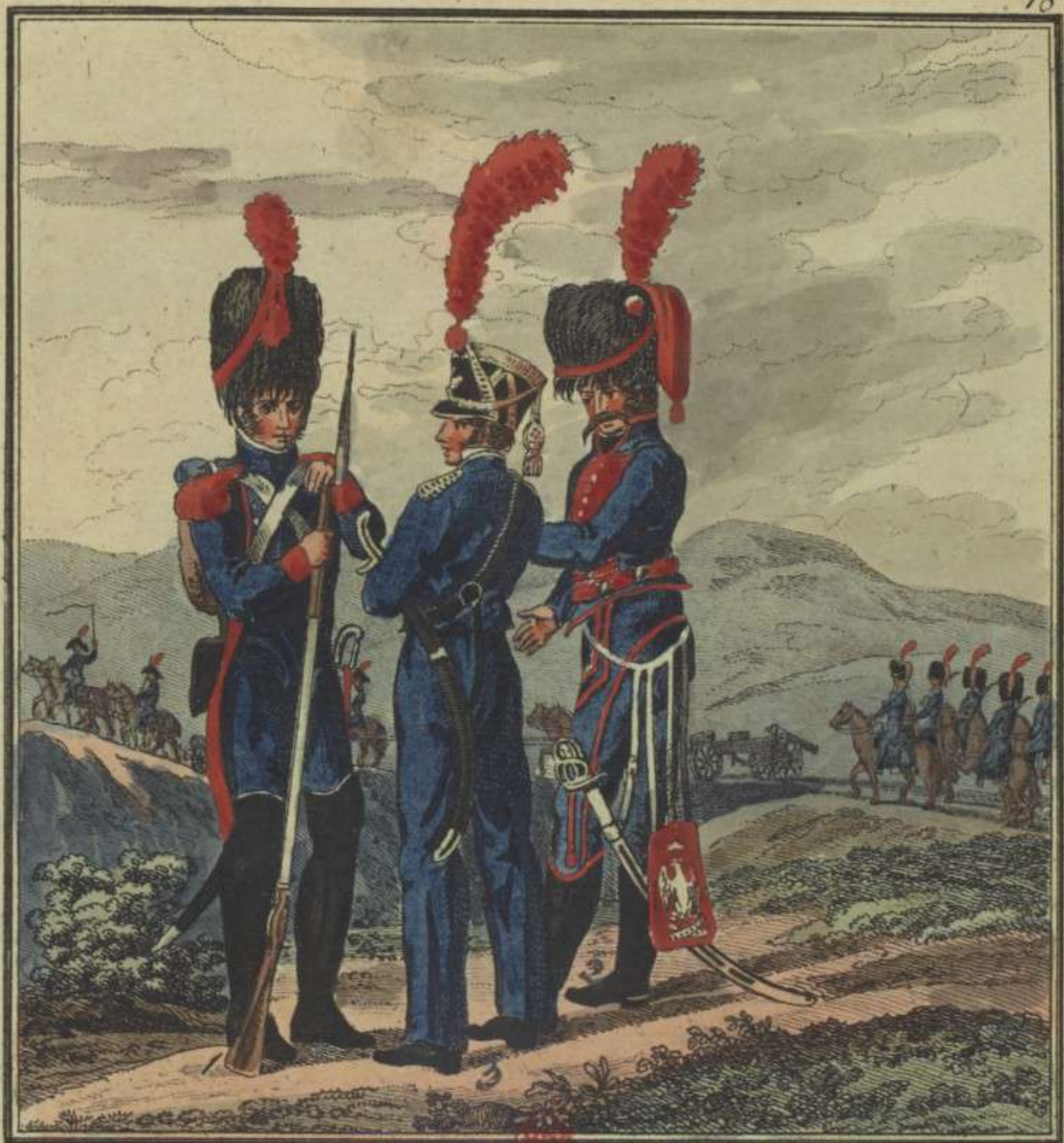
J. Berka fecit 1. Canonier à pied de la Garde Imperiale. 2. Canonier à cheval. 3. Marinier.