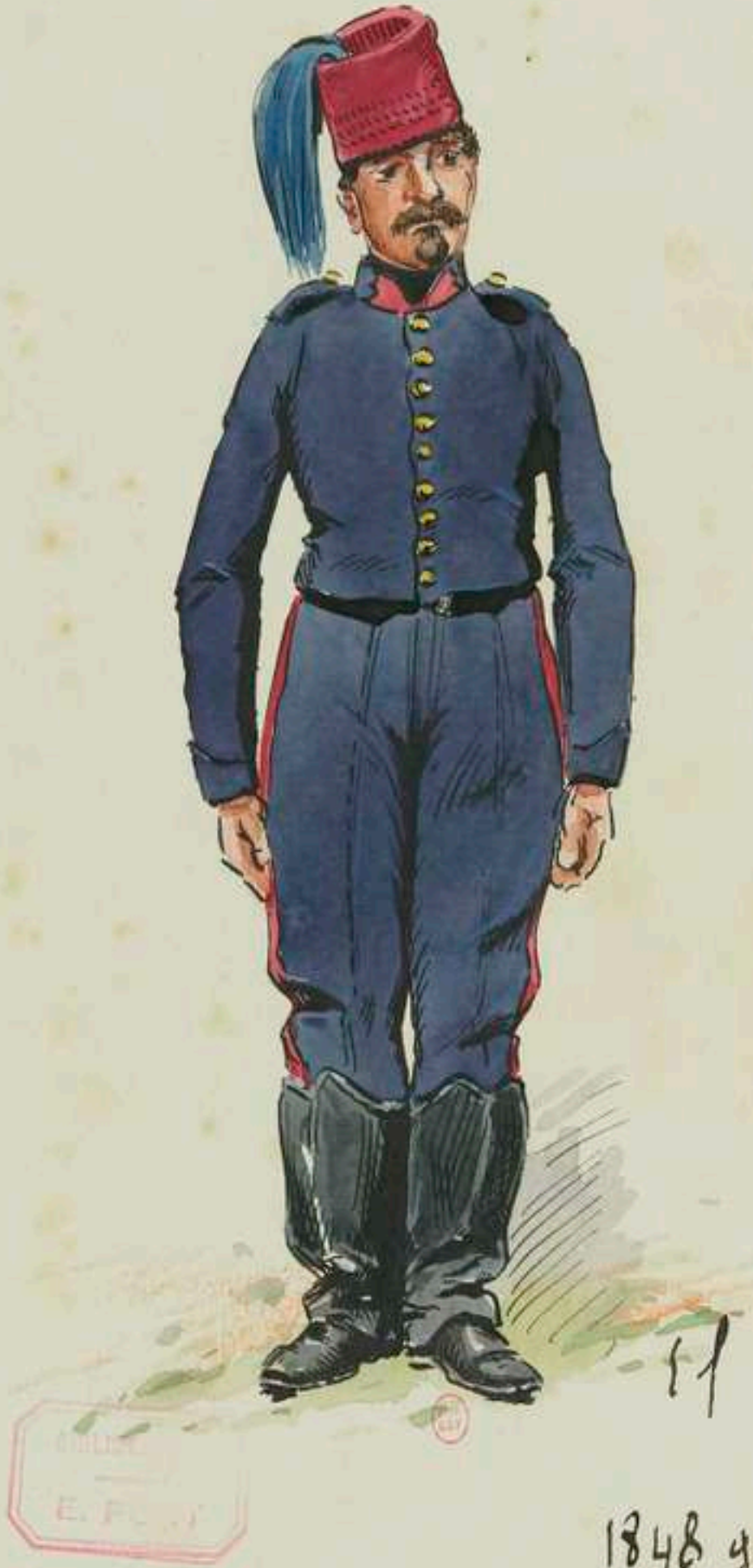
1848 guide d'état-major. Petite tenue -