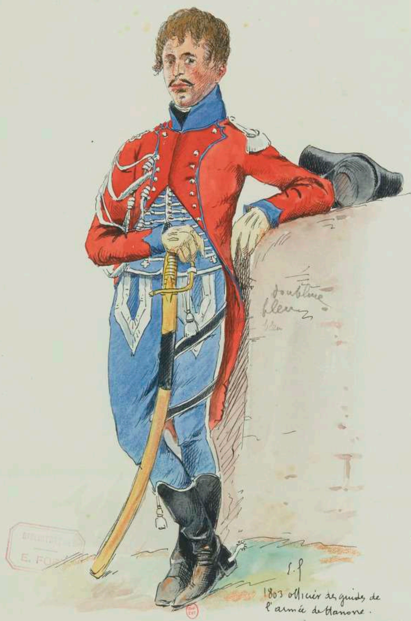
8° - Officier des Guides de l'Armée de Hanovre en 1803