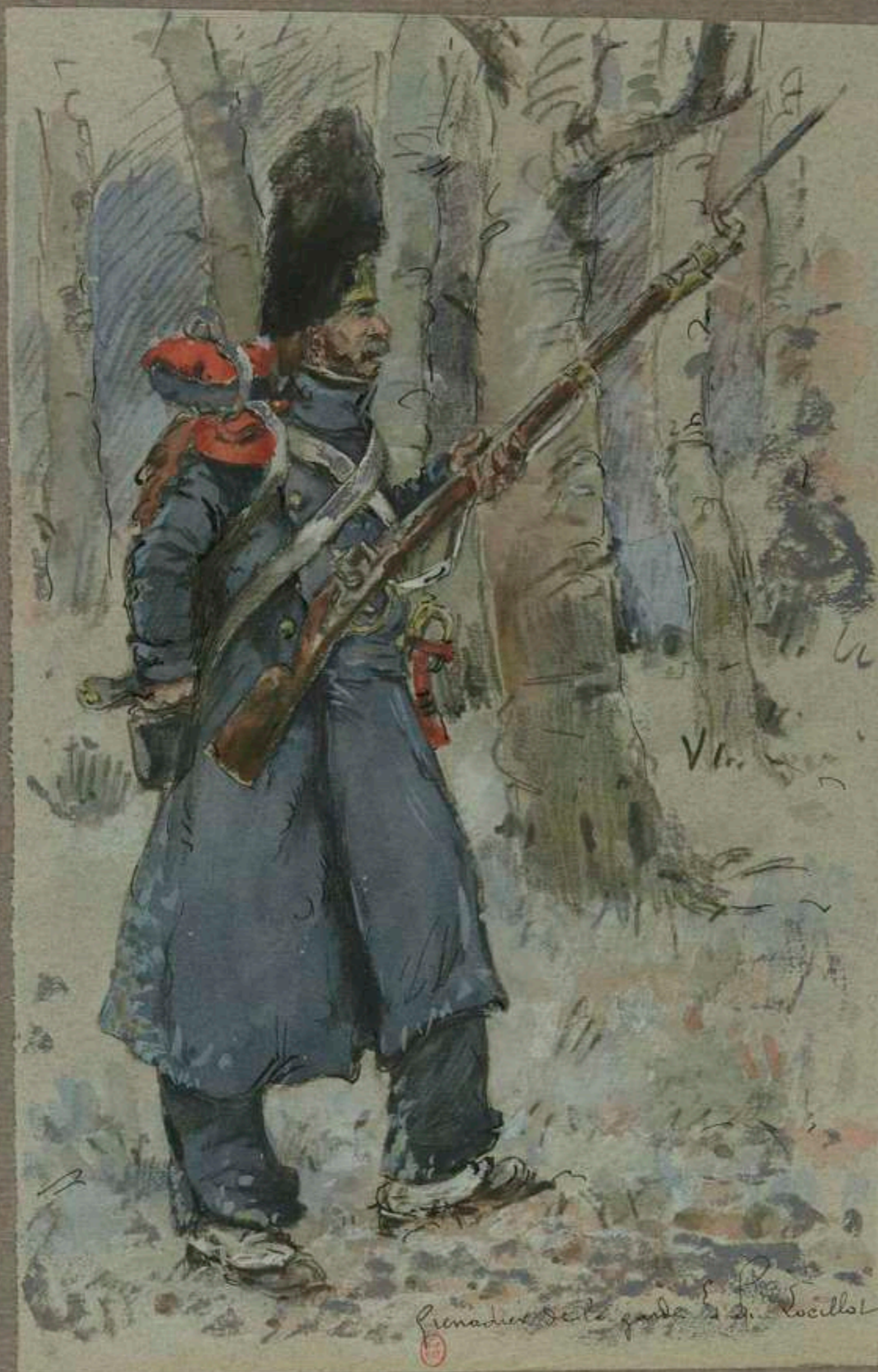
5° - Grenadier de la Garde en capote d'après Loeillot