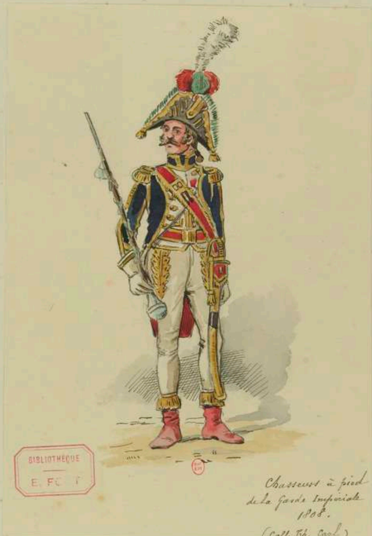
15°- Tambour-major des Chasseurs à pied de la Garde Impériale en 1808 d'après la collection Th. Carl