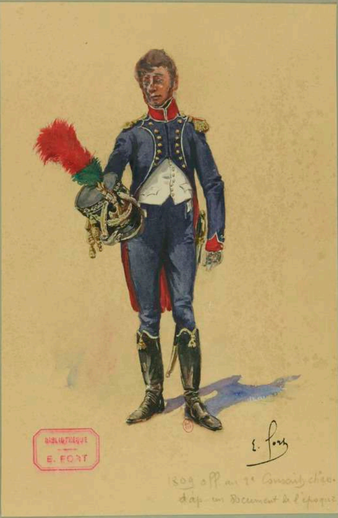
16°- Officier du 2 me Régiment de Conscrips-Chasseurs en 1809 d'après un document de l'époque