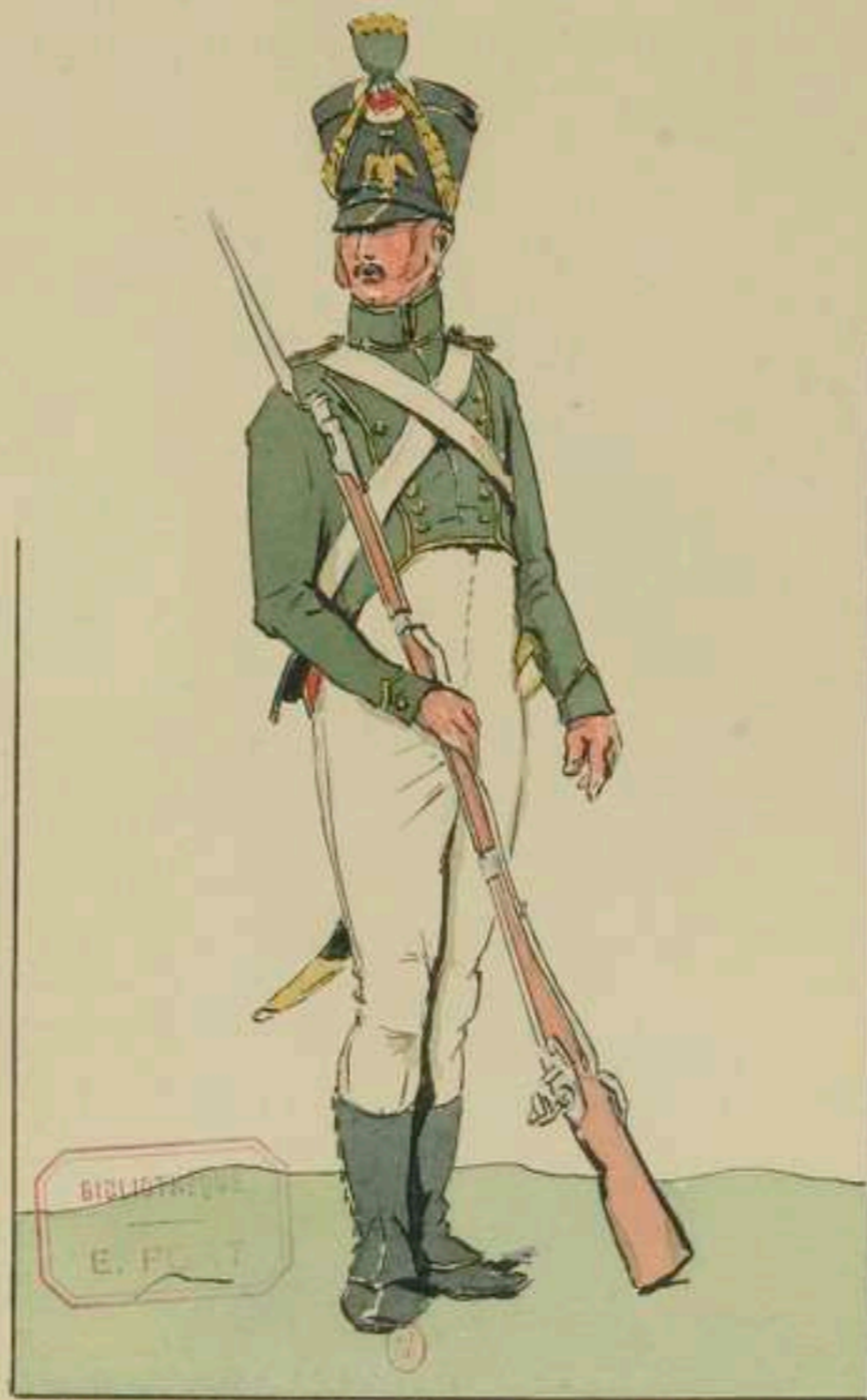
Flanqueur de la Garde - Weiland

19°- Flanqueurs de la Garde Impériale d'après Weiland