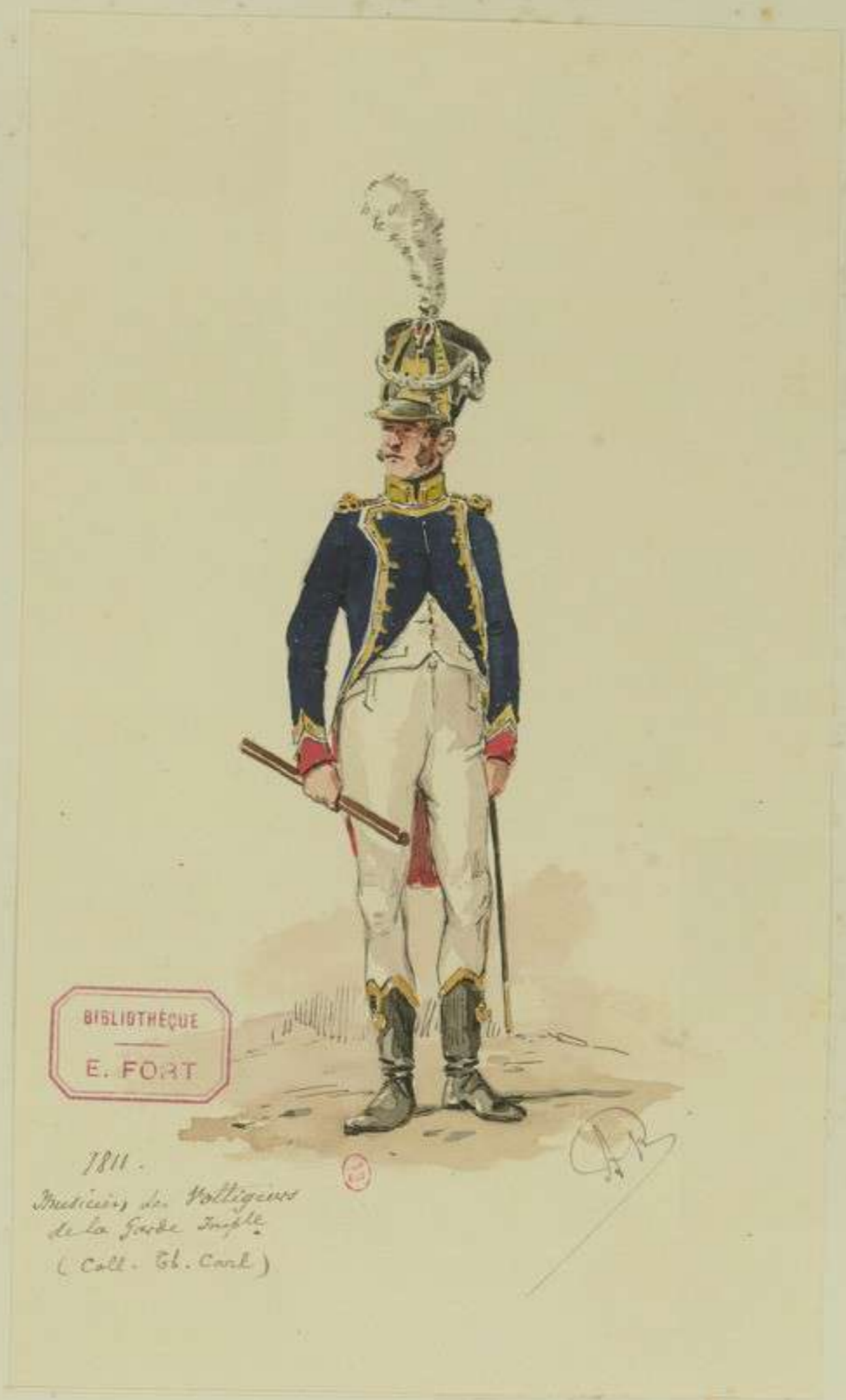
20°- Musicien des Voltigeurs de la Garde Impériale en 1811 d'après la collection Th. Carl