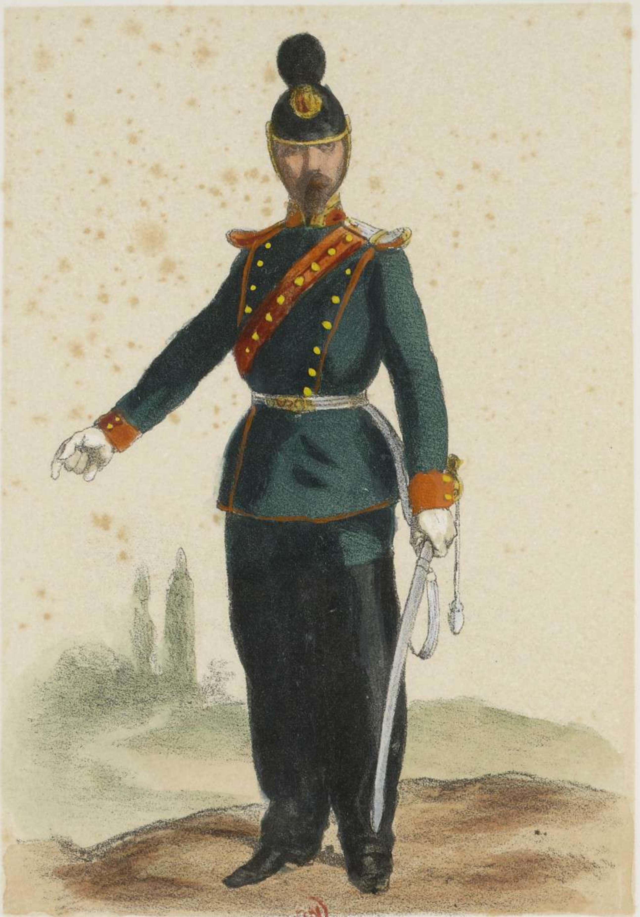
COLONEL DE CHEVAUX LÉGERS.