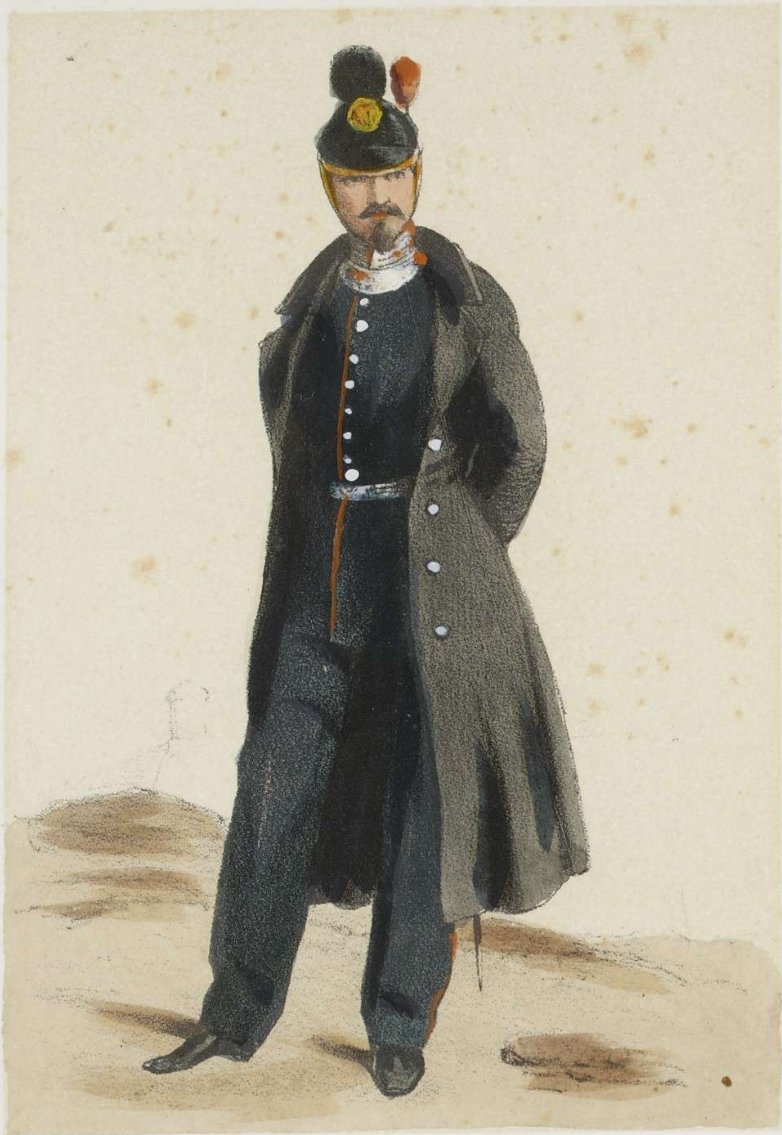
CAPITAINE DU GÉNIE.