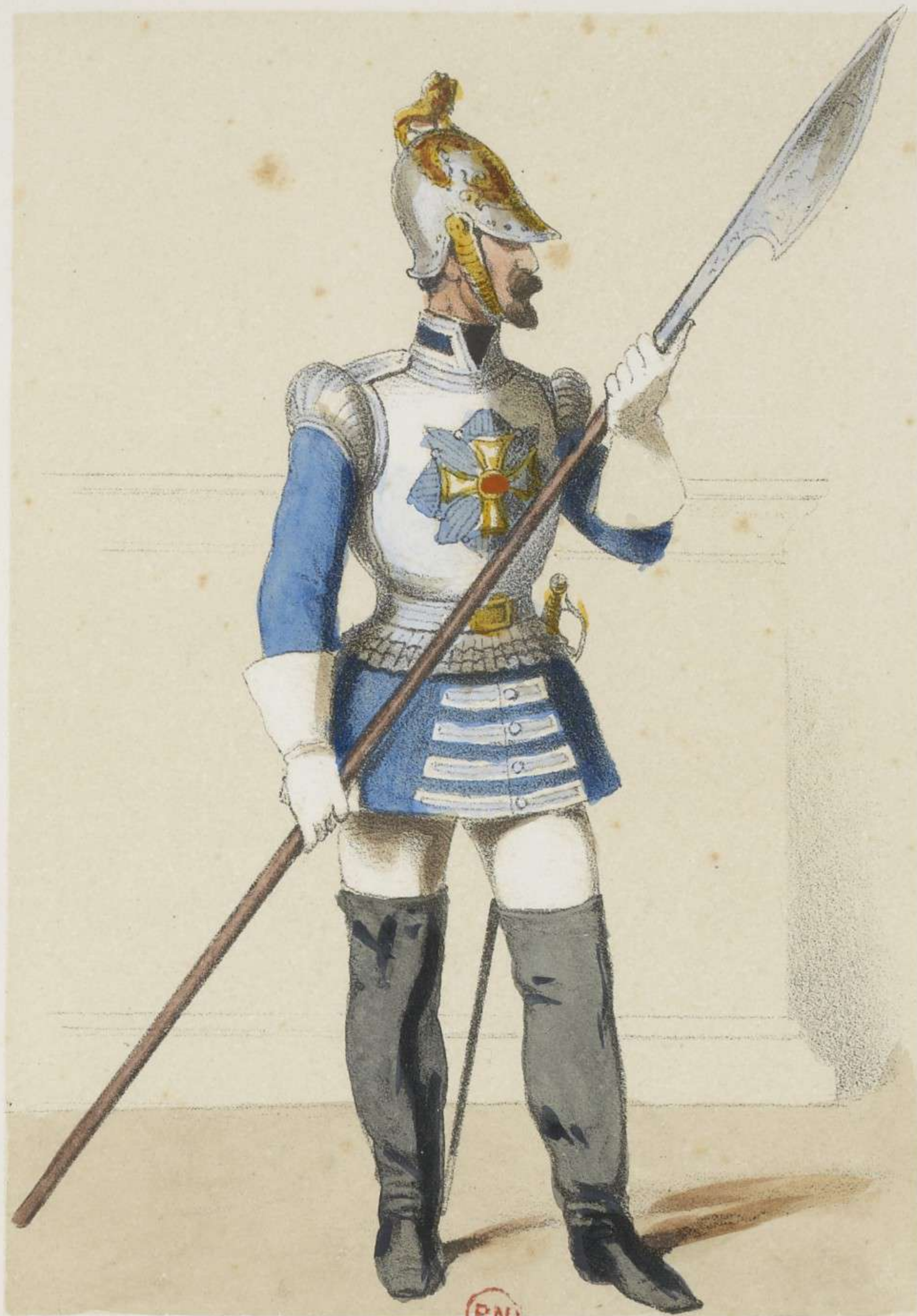
GARDE DU CORPS (GRANDE TENUE)