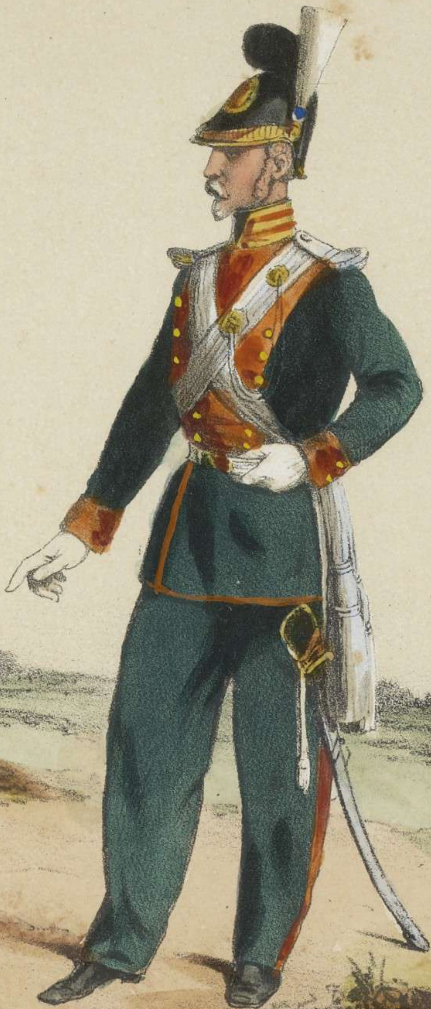
CAPITAINE ADJUDANT MAJOR.

Paris, Imp. Frick Frères, r. de l'Estrapade, 17, (près le Panthéon)