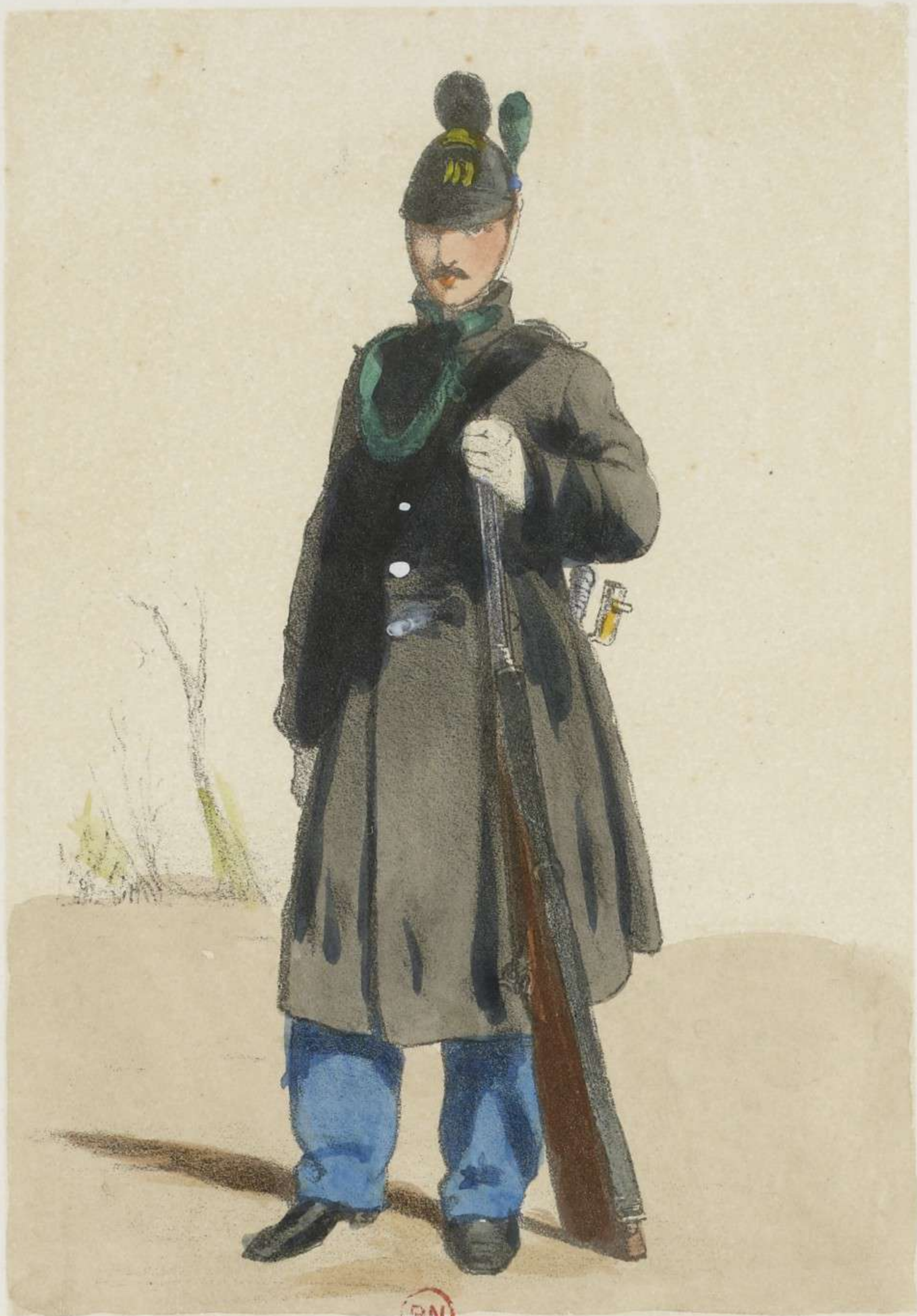
BN CHASSEUR À PIED.