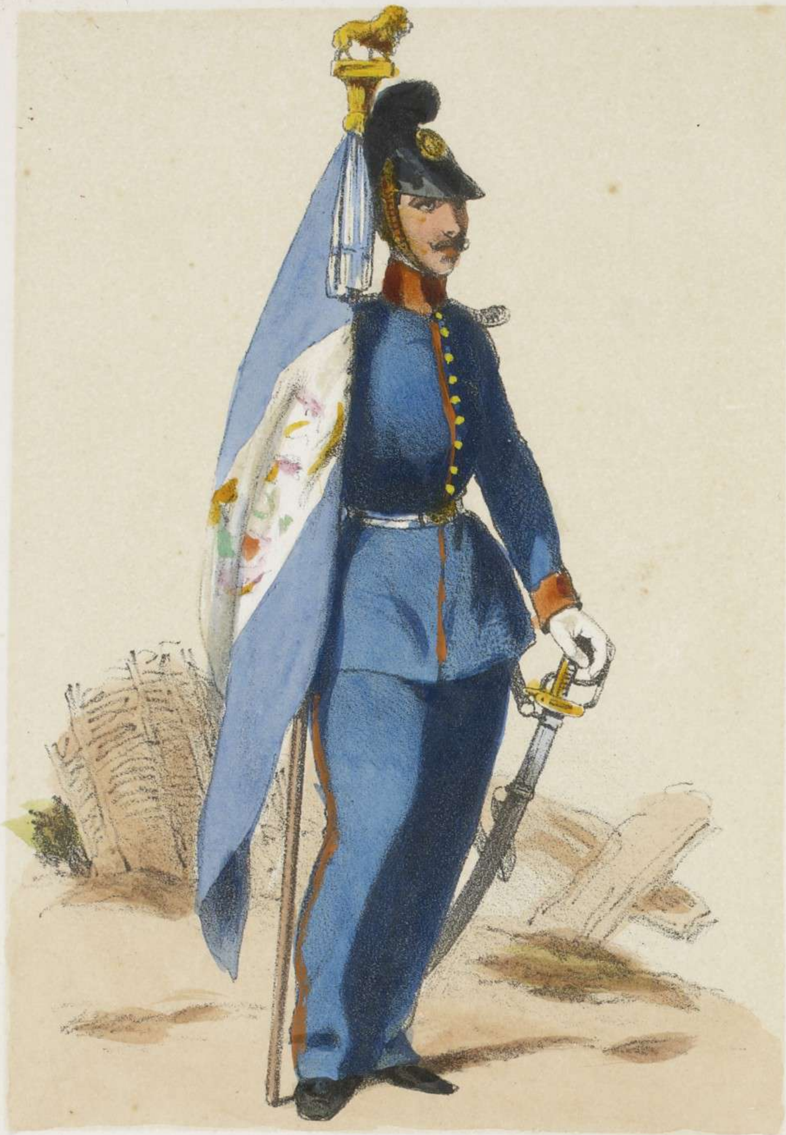
PORTE DRAPEAU 3 ME . RÉG T