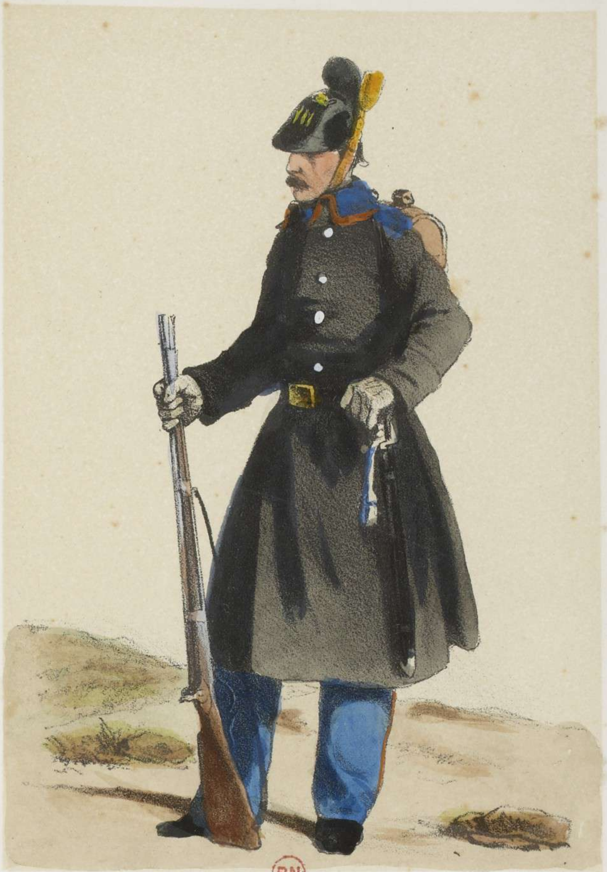
SOUS OFFICIER .