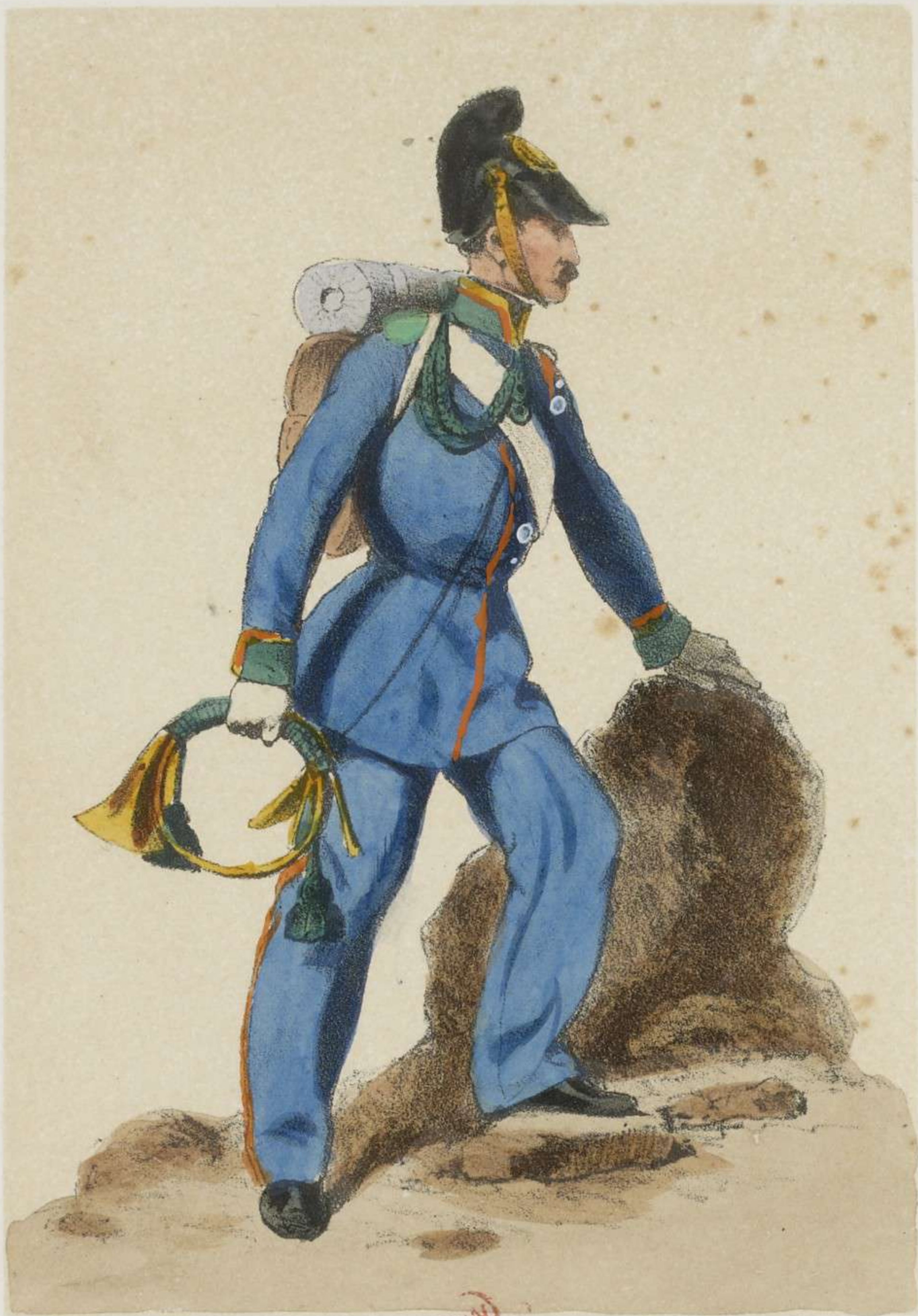
CORNET DES CHASSEURS À PIED.