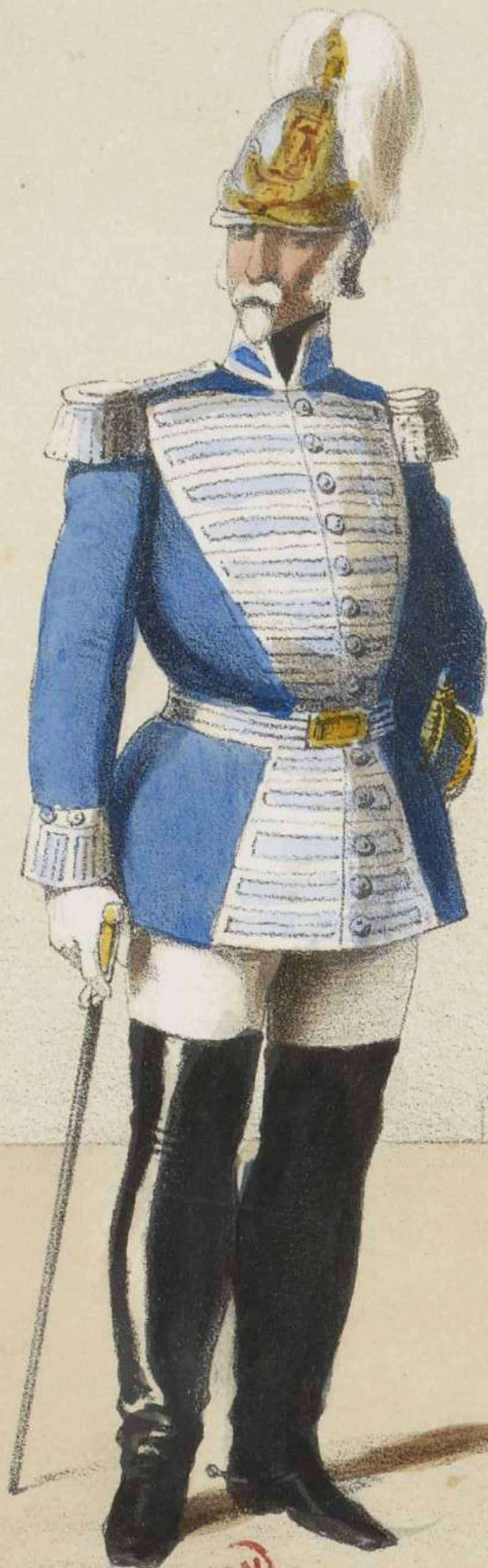
COLONEL DES GARDES DU CORPS.