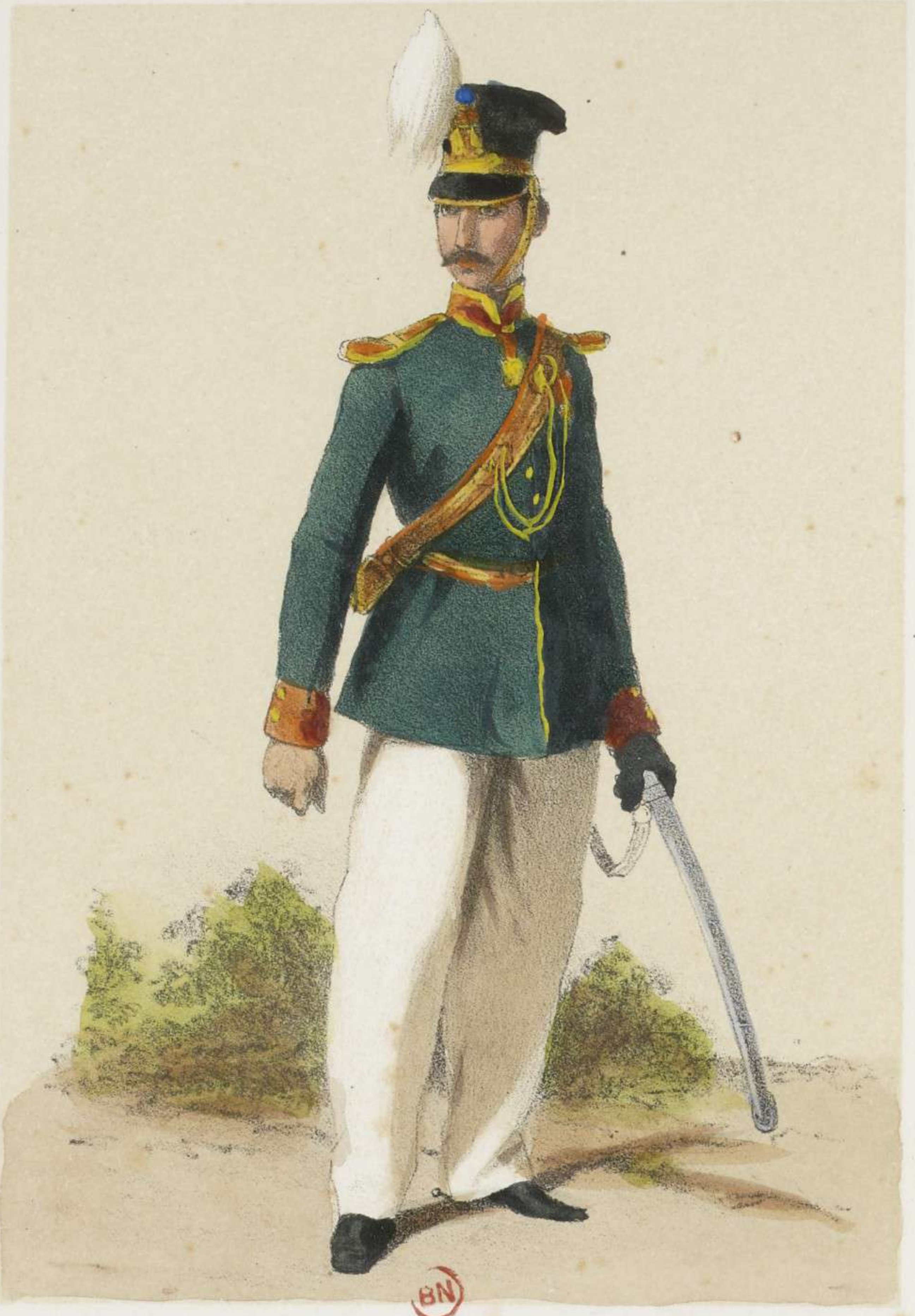
OFFICIER DE GENDARMERIE.