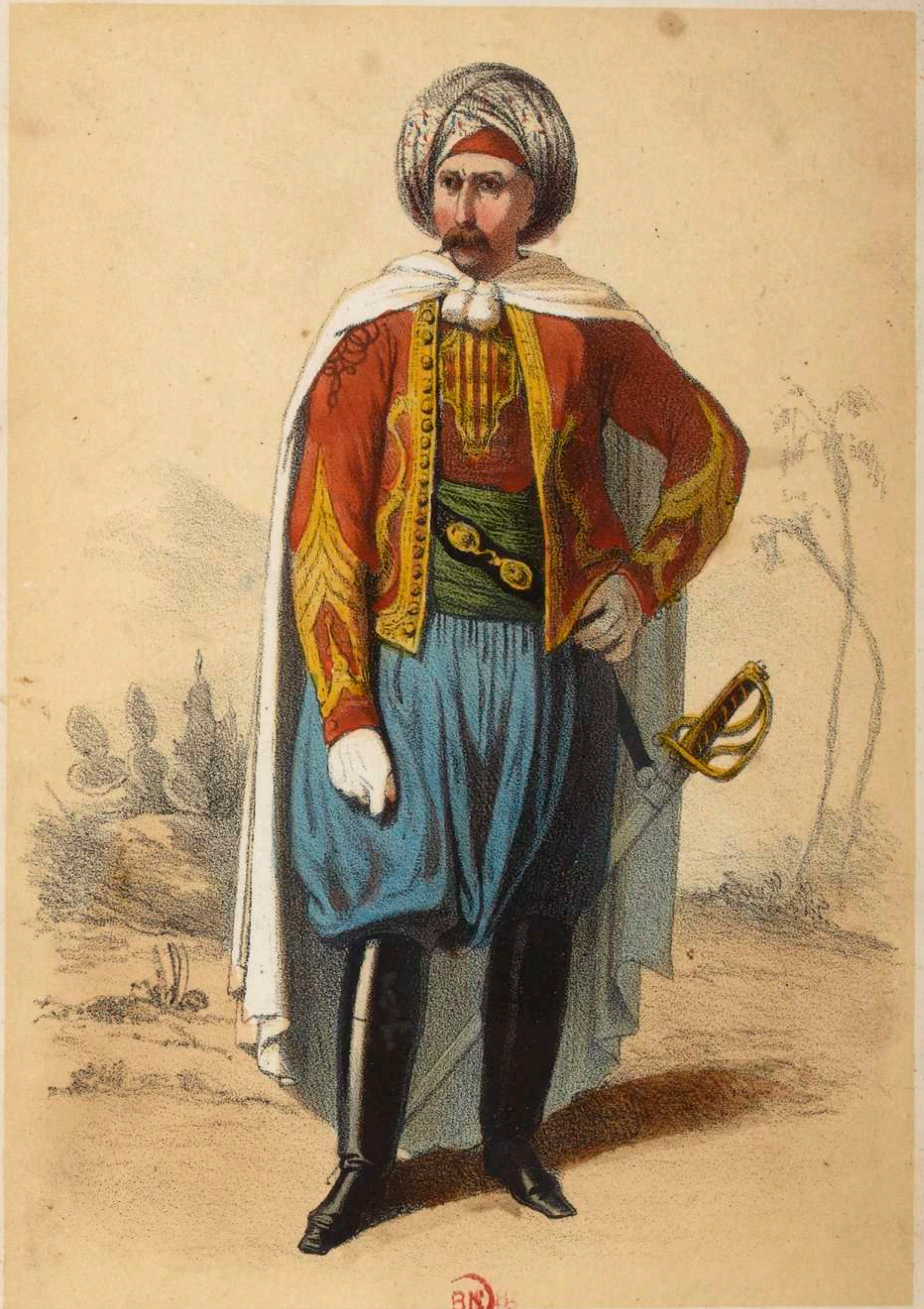
BN SPAHS .