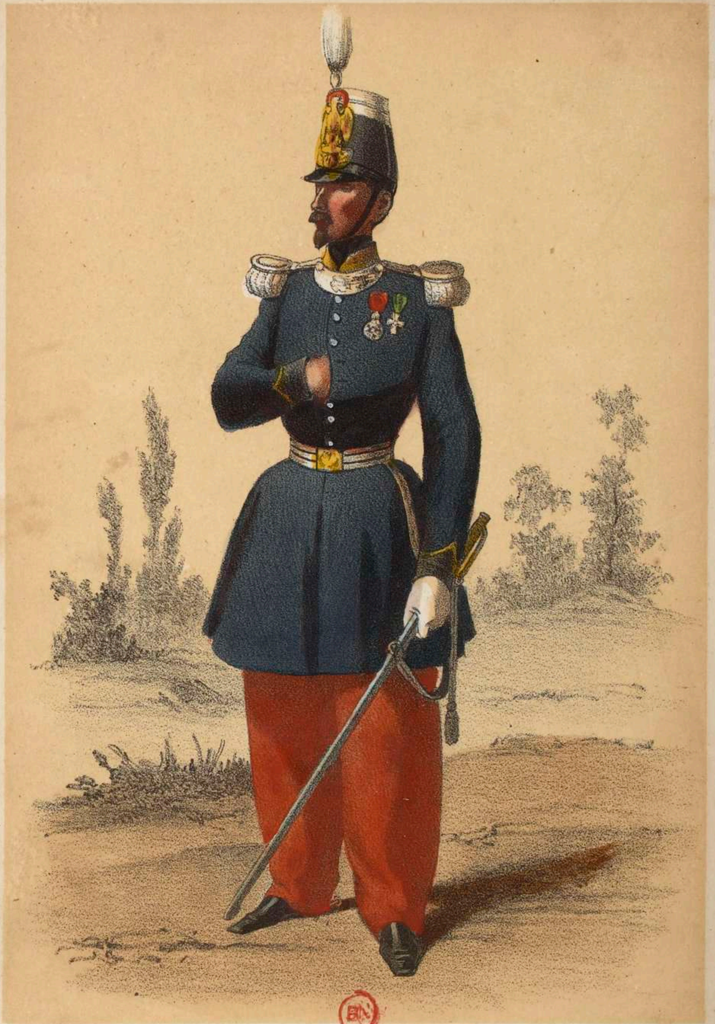
COLONEL D'INFANTERIE LÉGÈRE.