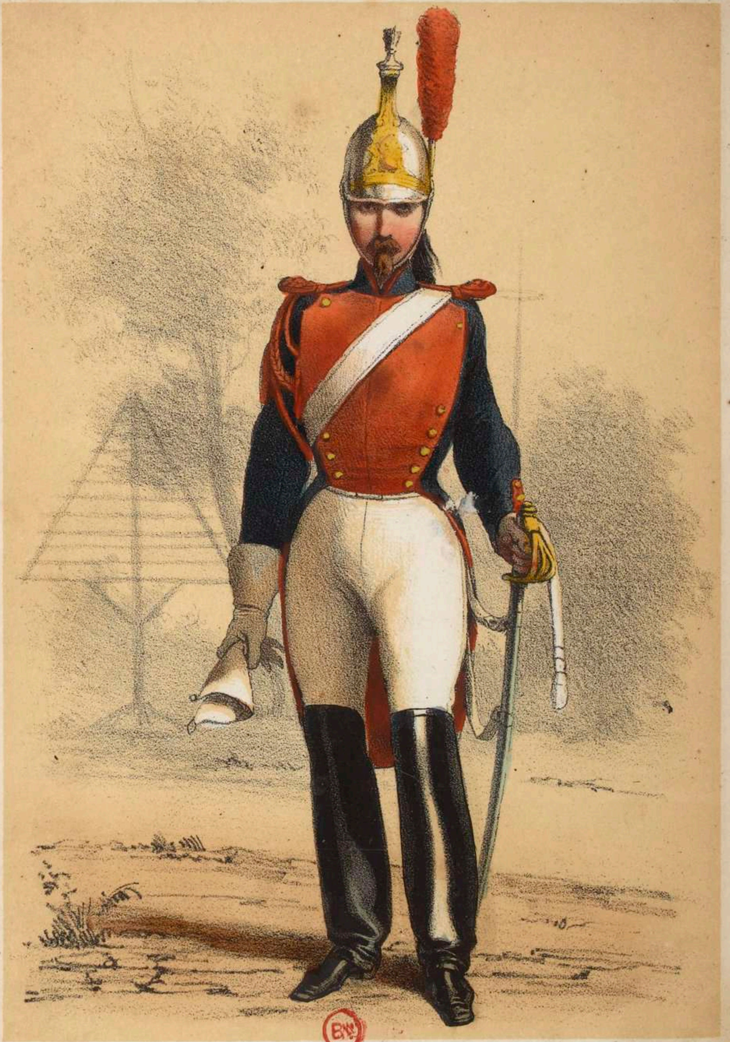
GARDE DE PARIS . ( Cavalerie )