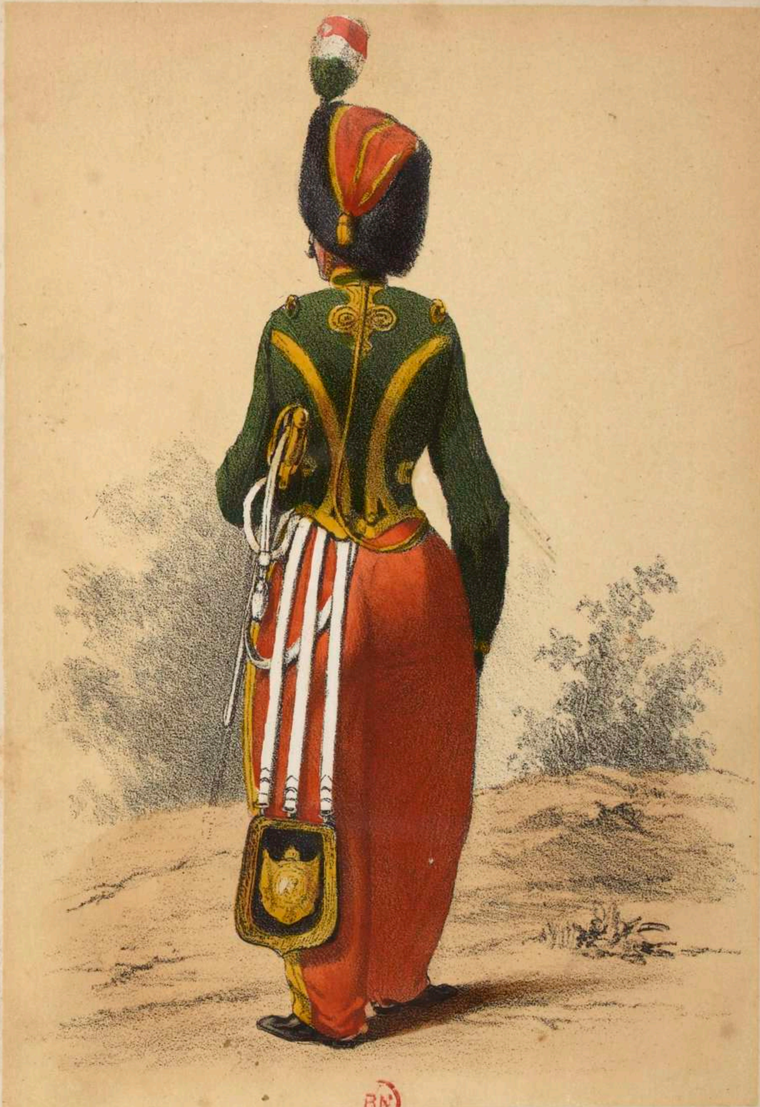
BN GUIDE .