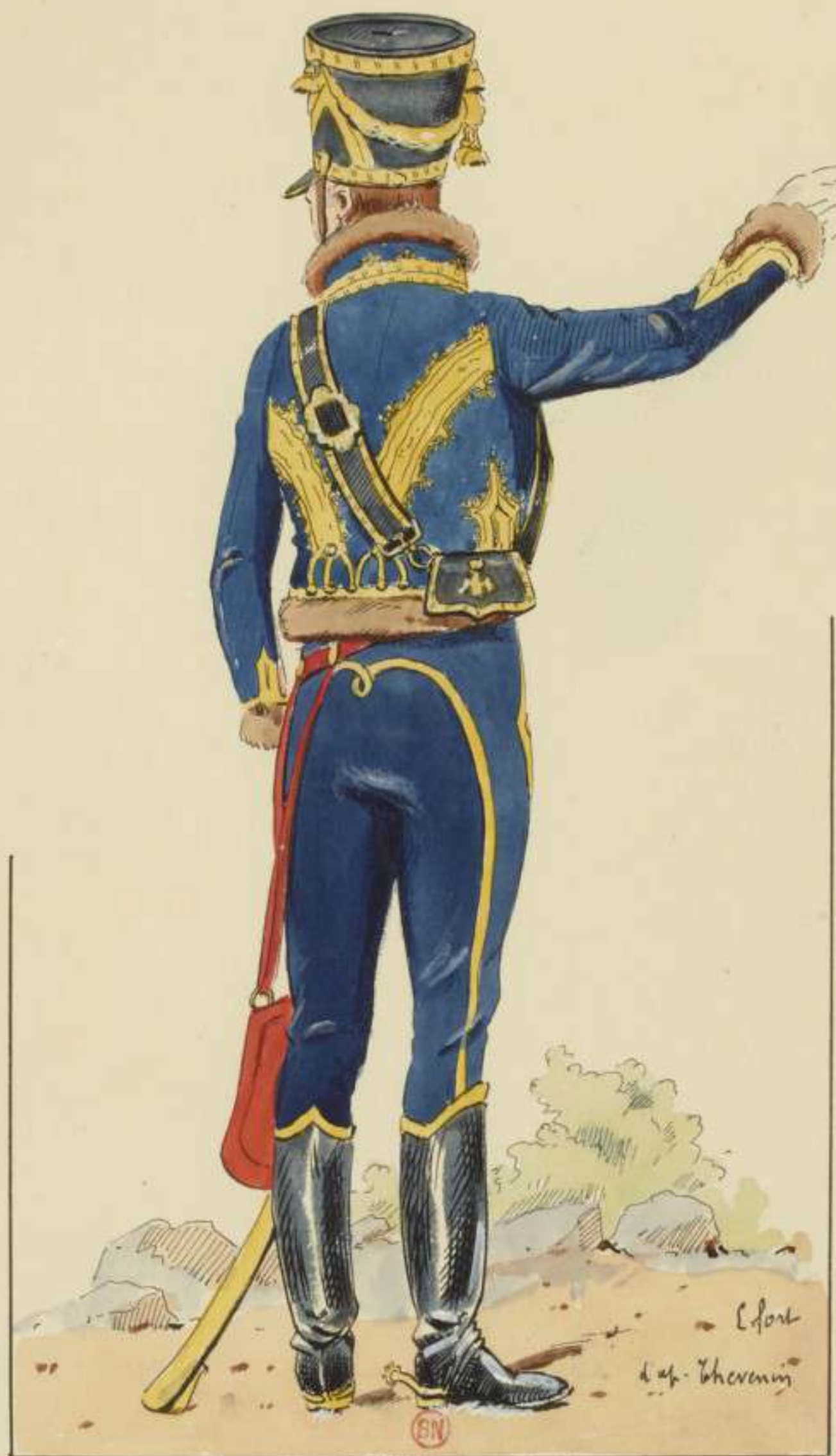
1809 aide de camp.