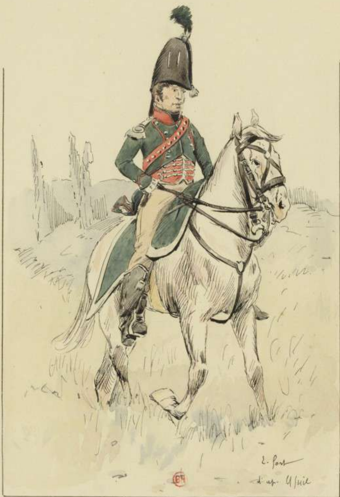
officier d'état major: (aide de camp.) Campagne d'Espagne