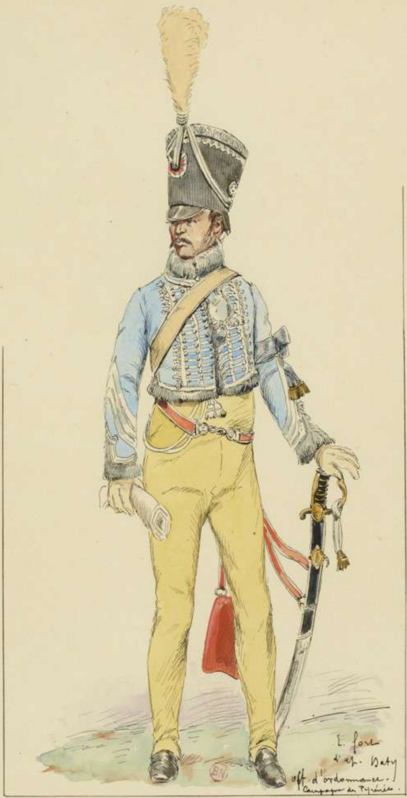
12°- Officier d'ordonnance pendant la campagne des Pyrénées d'après Baty