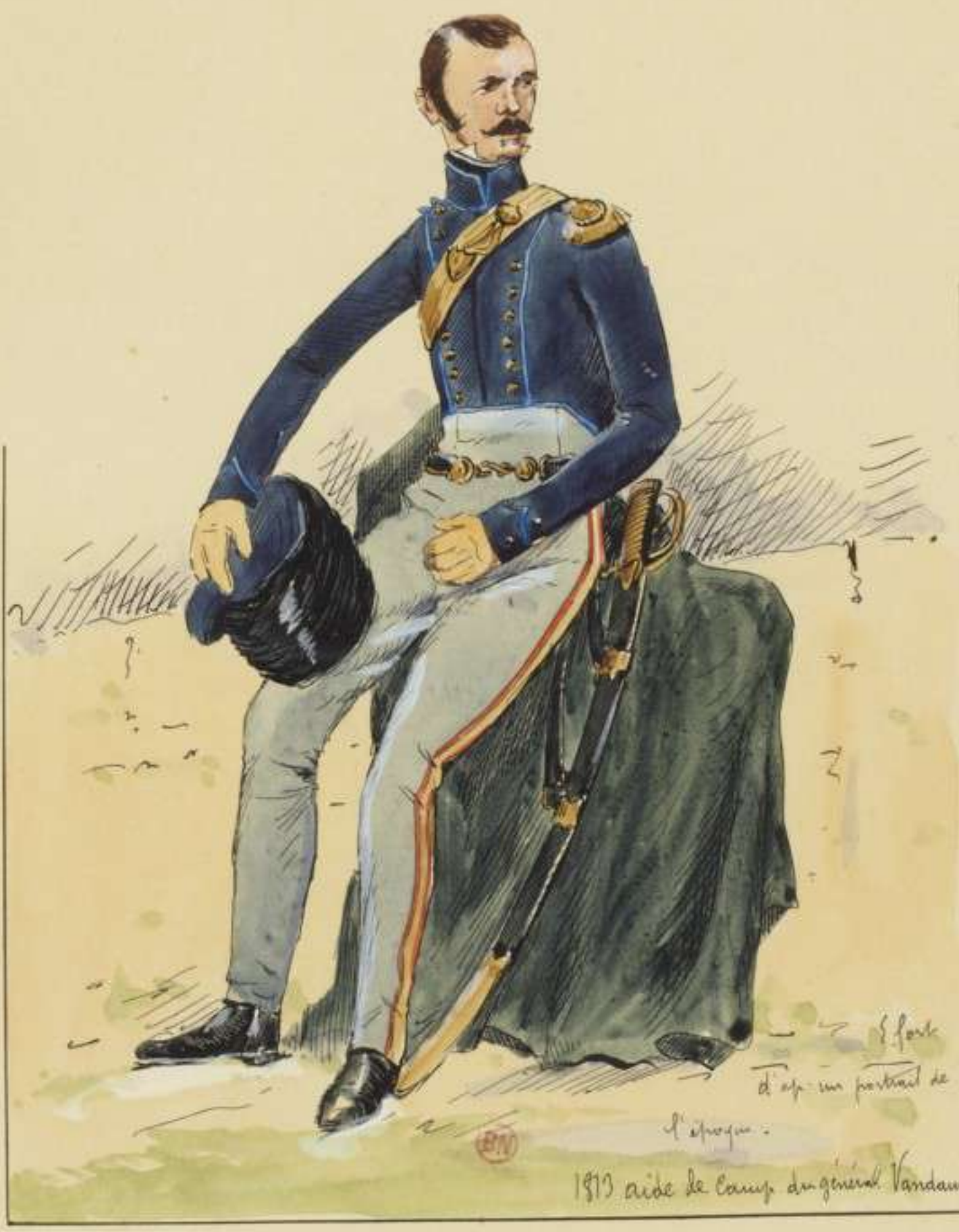
I3°- 1813 - Aide de camp du général Vandamme d'après un portrait de l'époque