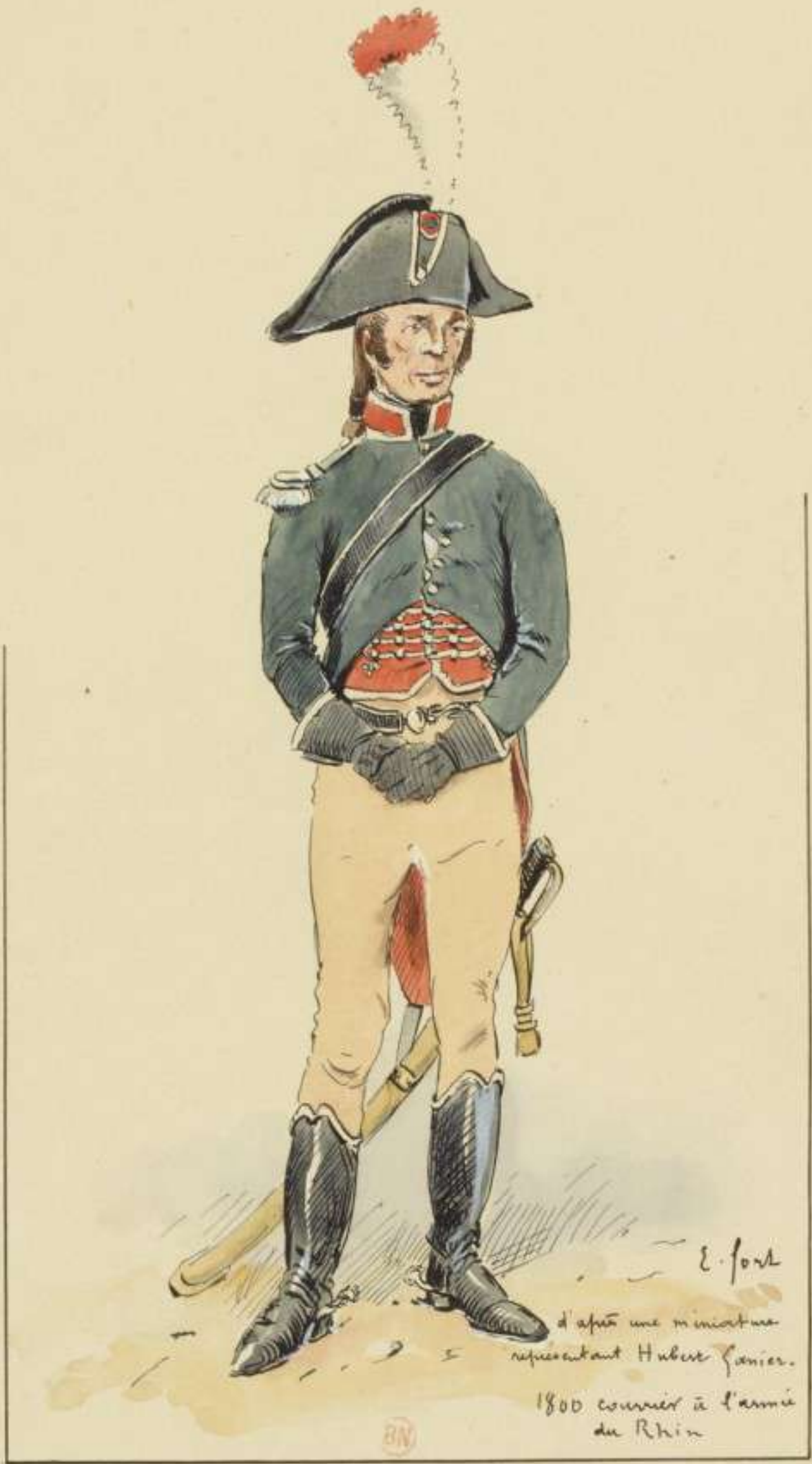
I4°- 1800 - Courrier à l'Armée du Rhin d'après une miniature représentant Hubert Ganier