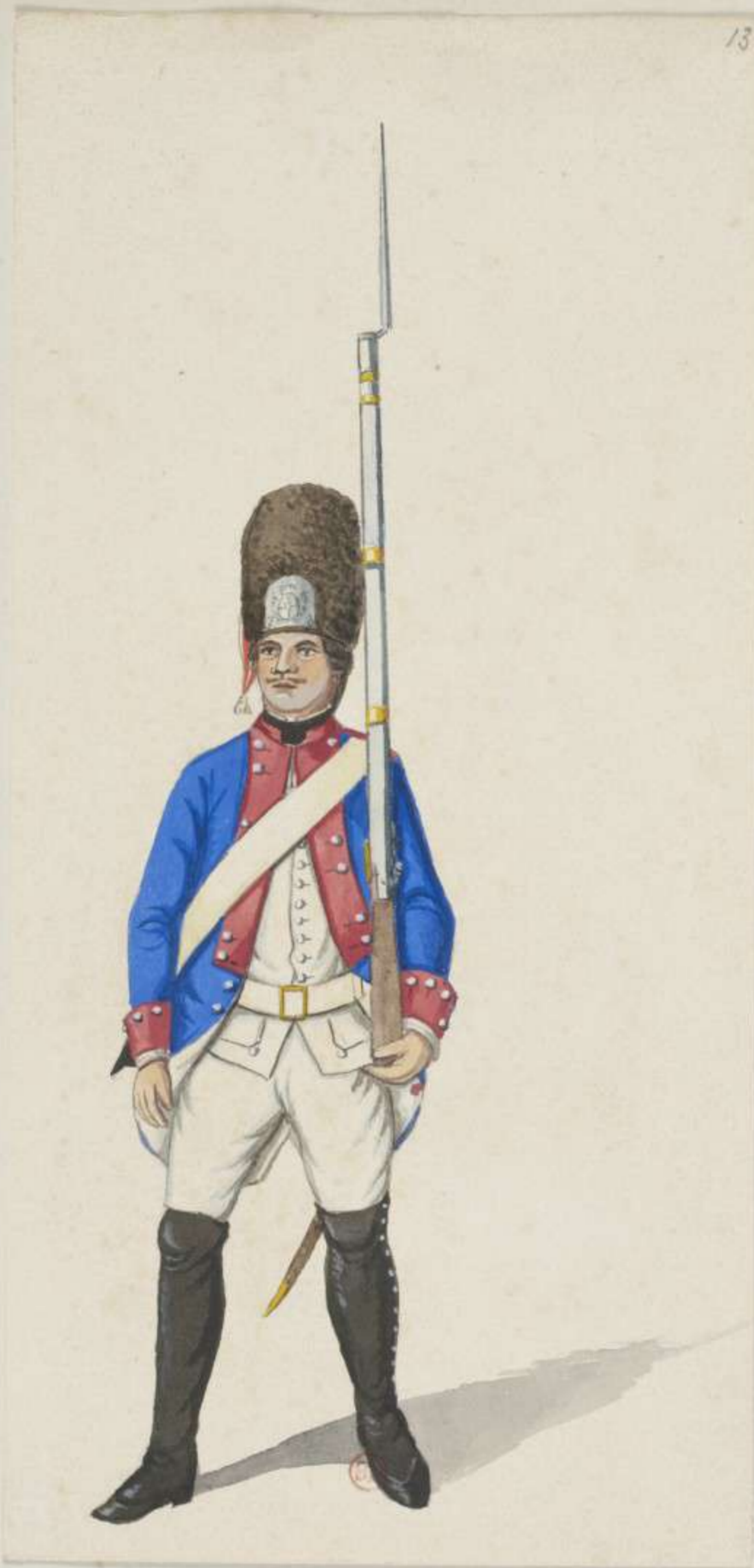
13 o - Grenadier vom 8. Infanterie Regiment von Daun