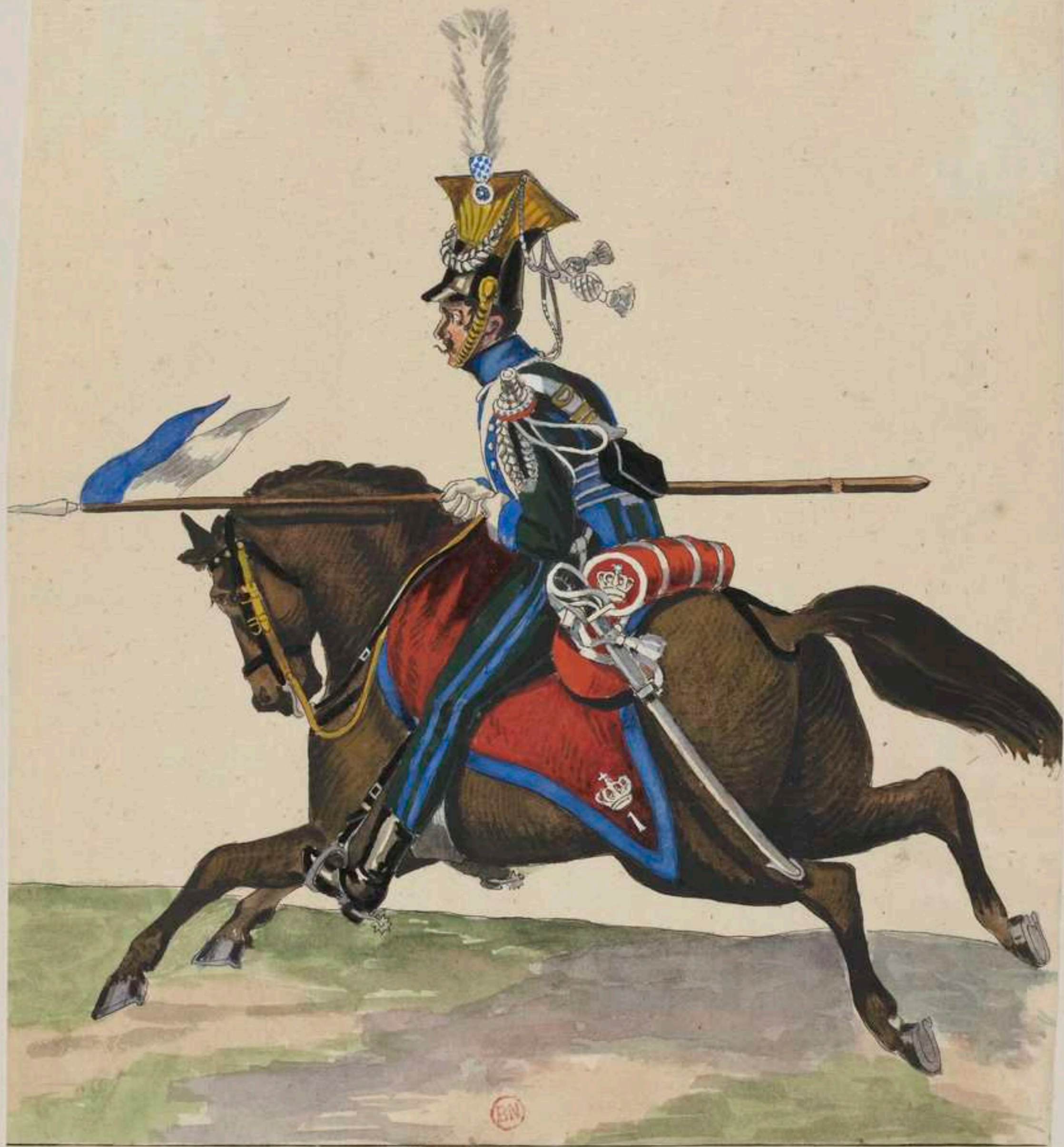
Ulan vom 1. Ulanen Regt.