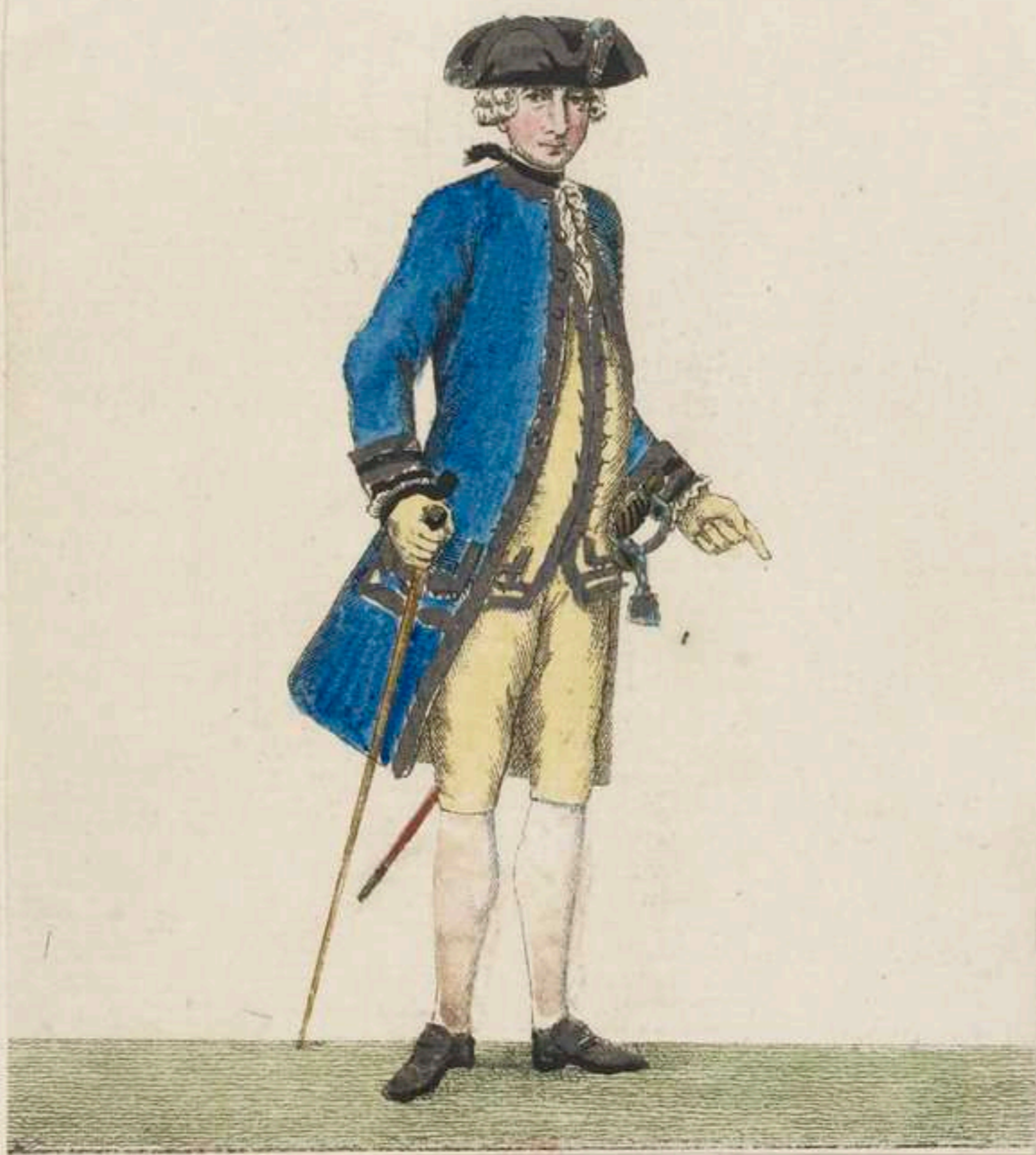
1° - Generalität