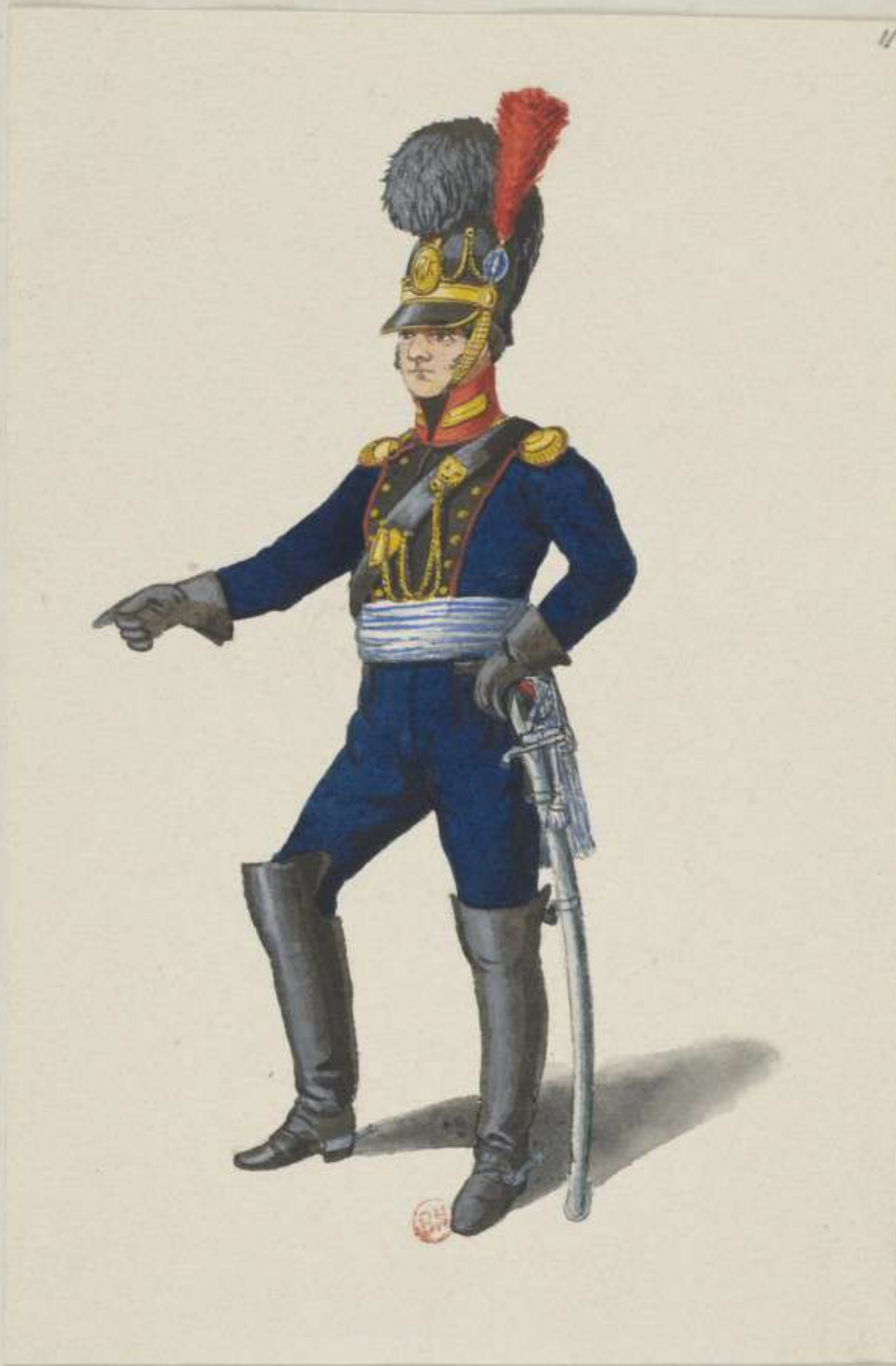
11 o - Reitende Artillerie - 1811