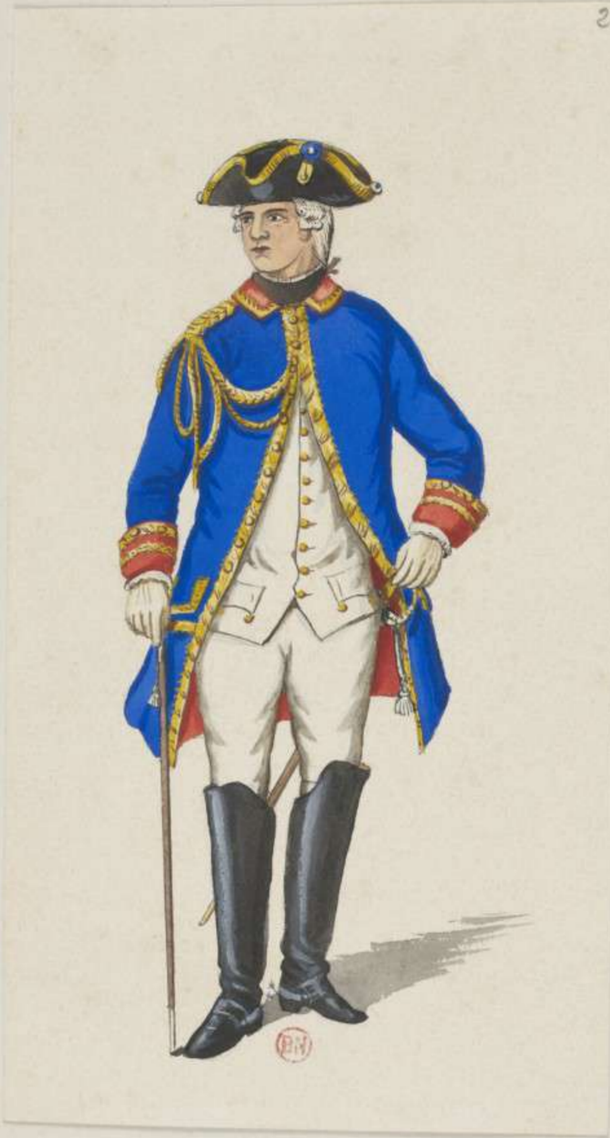
2° - General Adjutant