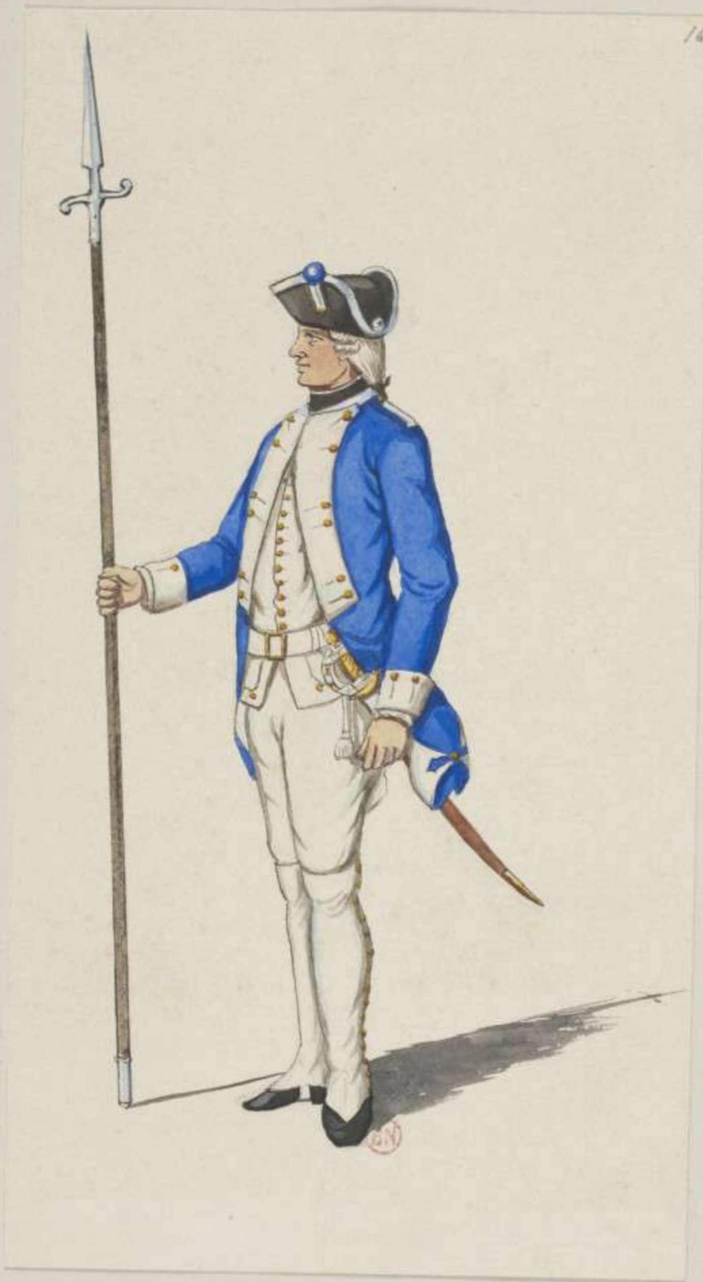
16°- 13. Infanterie Regiment von Hohenhausen - Unter Officier