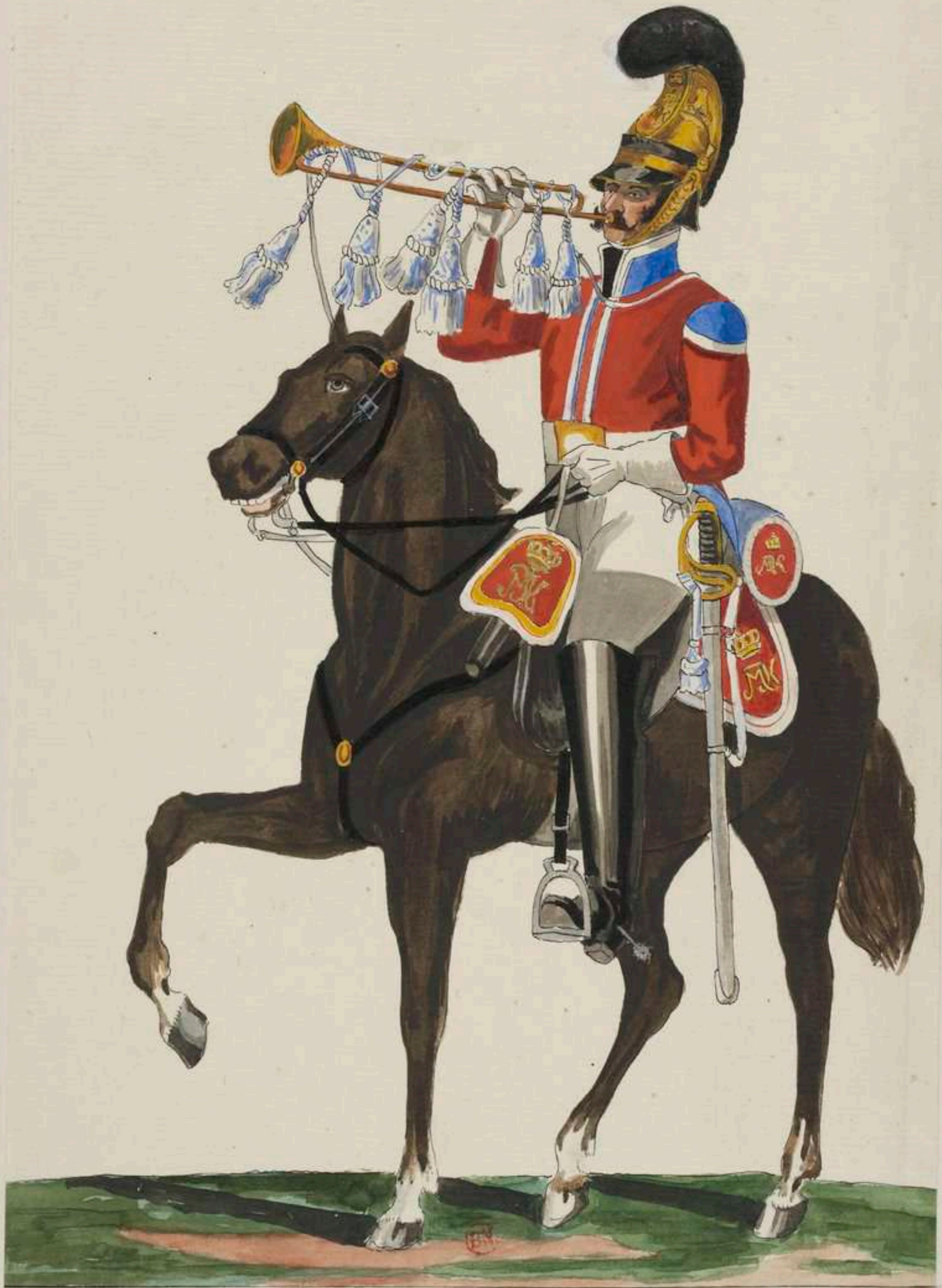
Trompeter v. Gardes du Corps.