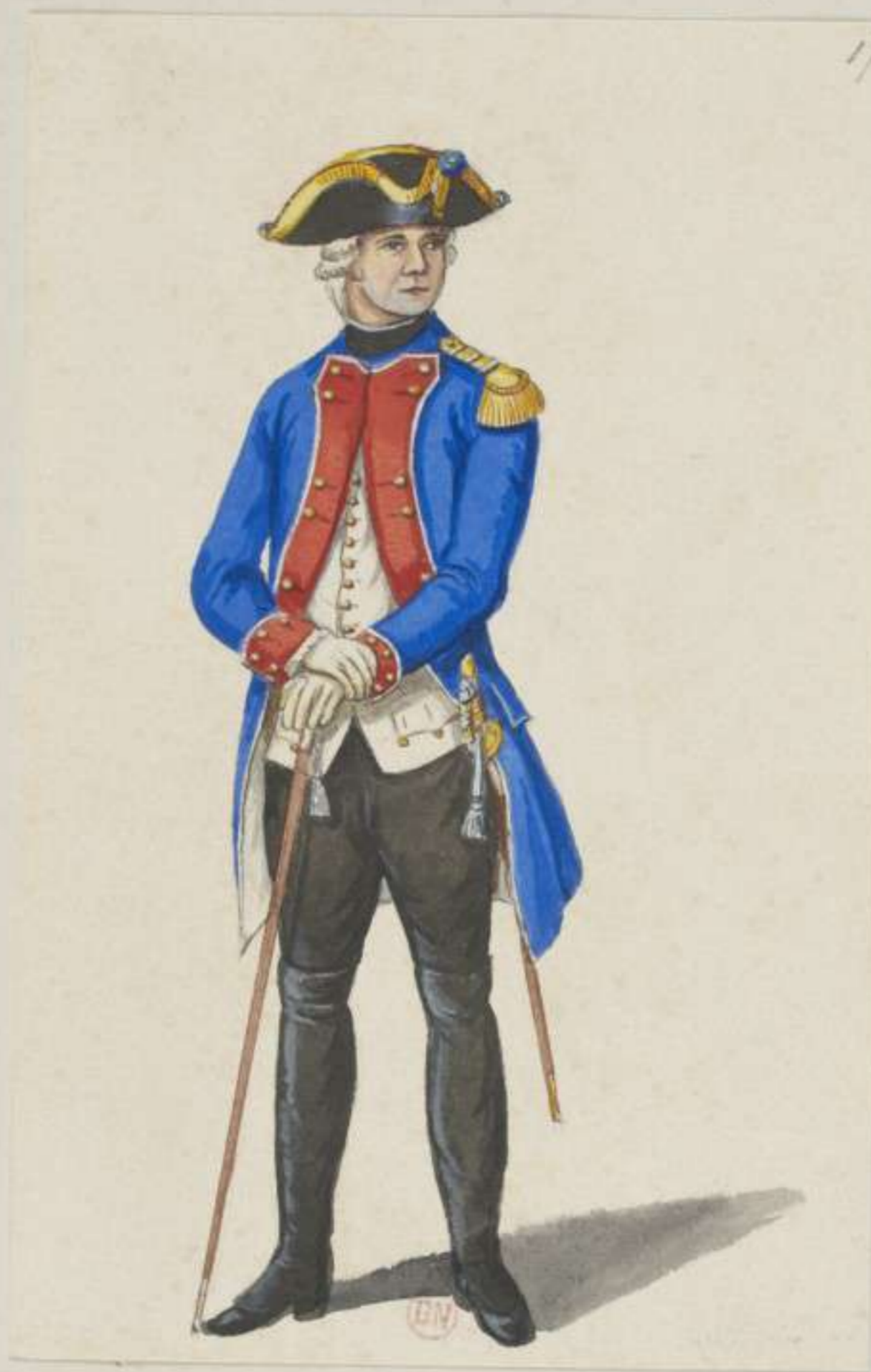
17 o - 14. Infanterie Regiment Rambaldi - Capitain. Ausserdienst Uniform