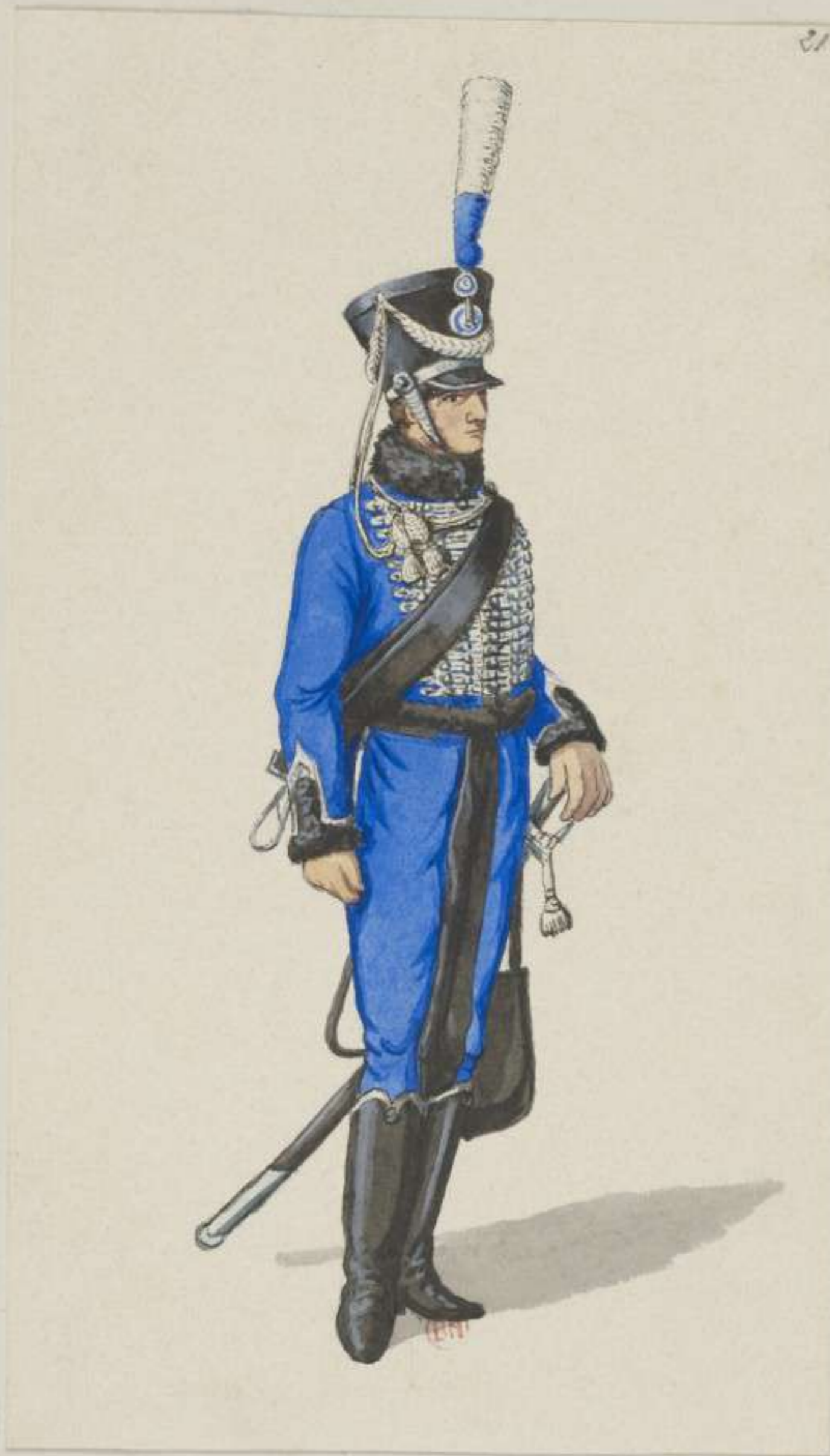
21°- 1. Husaren Regiment - 1813