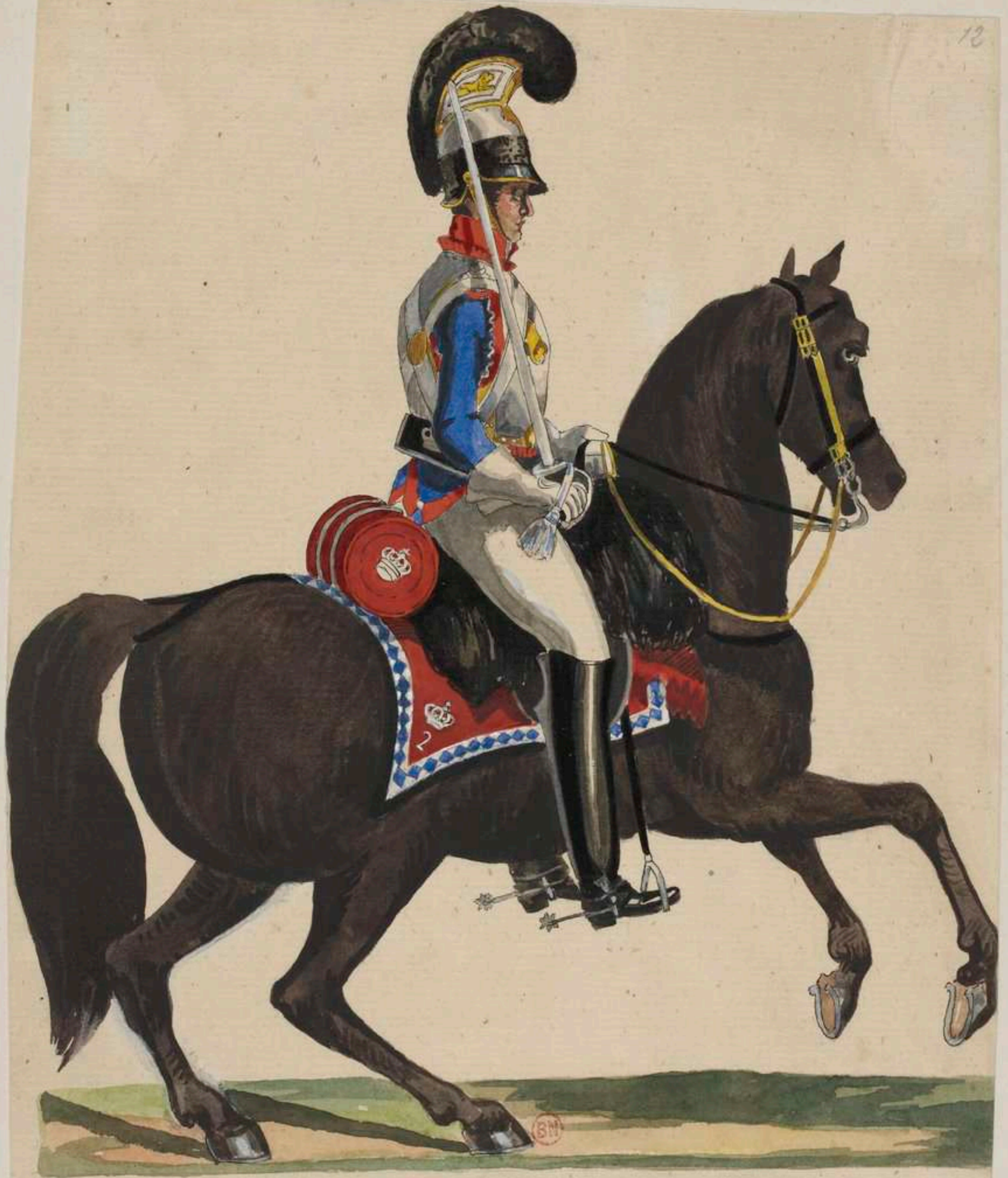
Cuirassier vom 2. Cuirassier Regt.