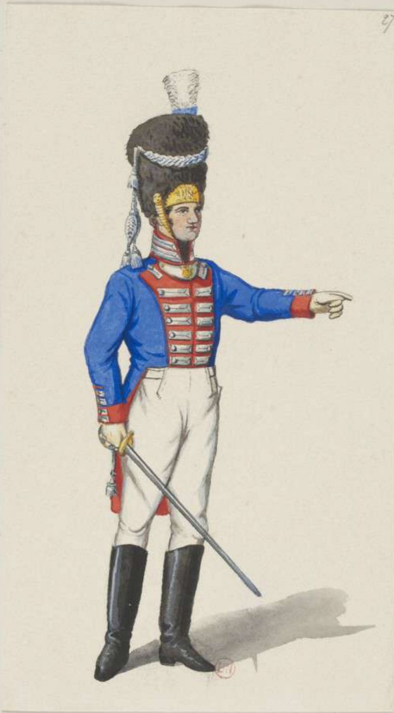
27°- Grenadier Garde Regiment - Ober Lieutenant - 1814