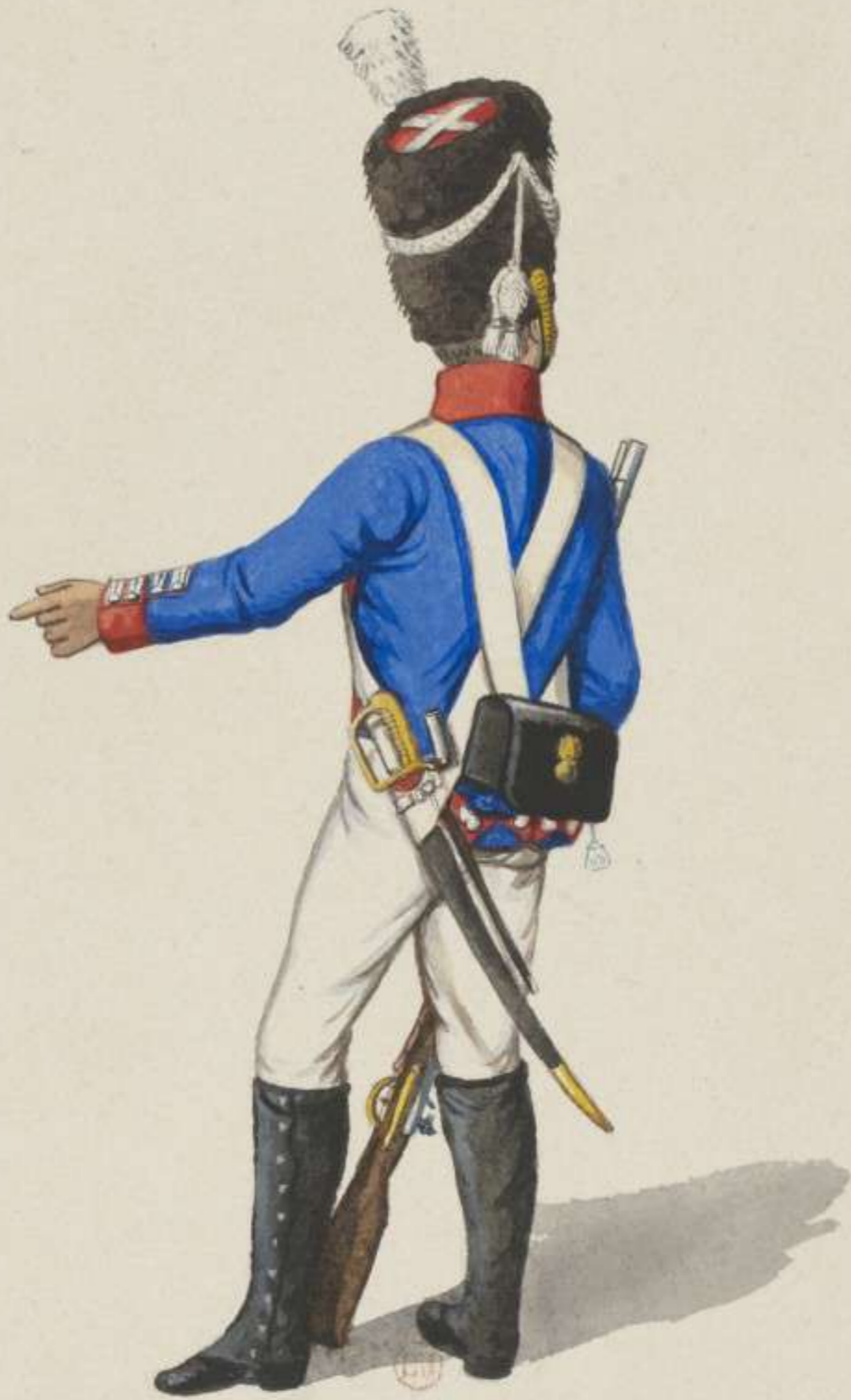
28 e - Grenadier Garde Regiment - 1814