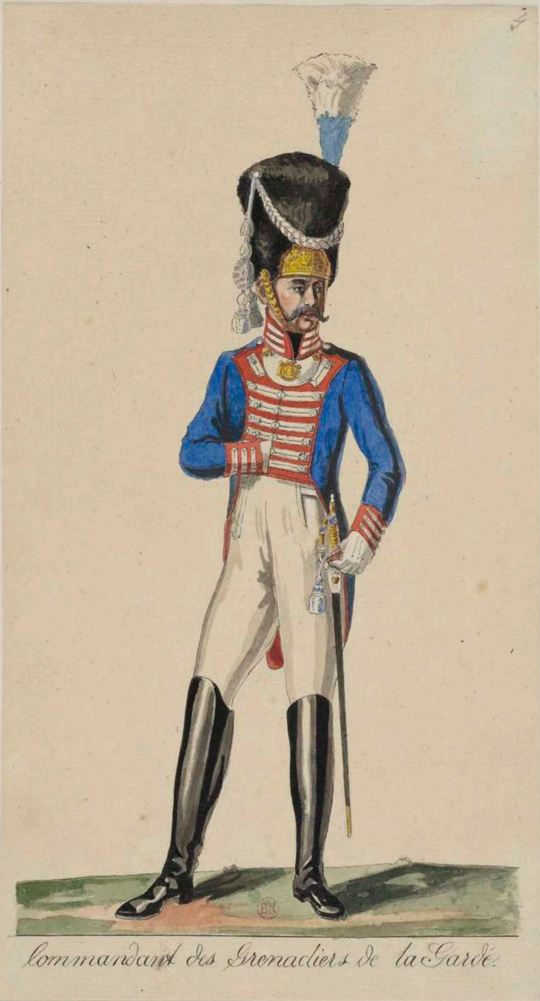
Commandant des Grenadiers de la Garde.