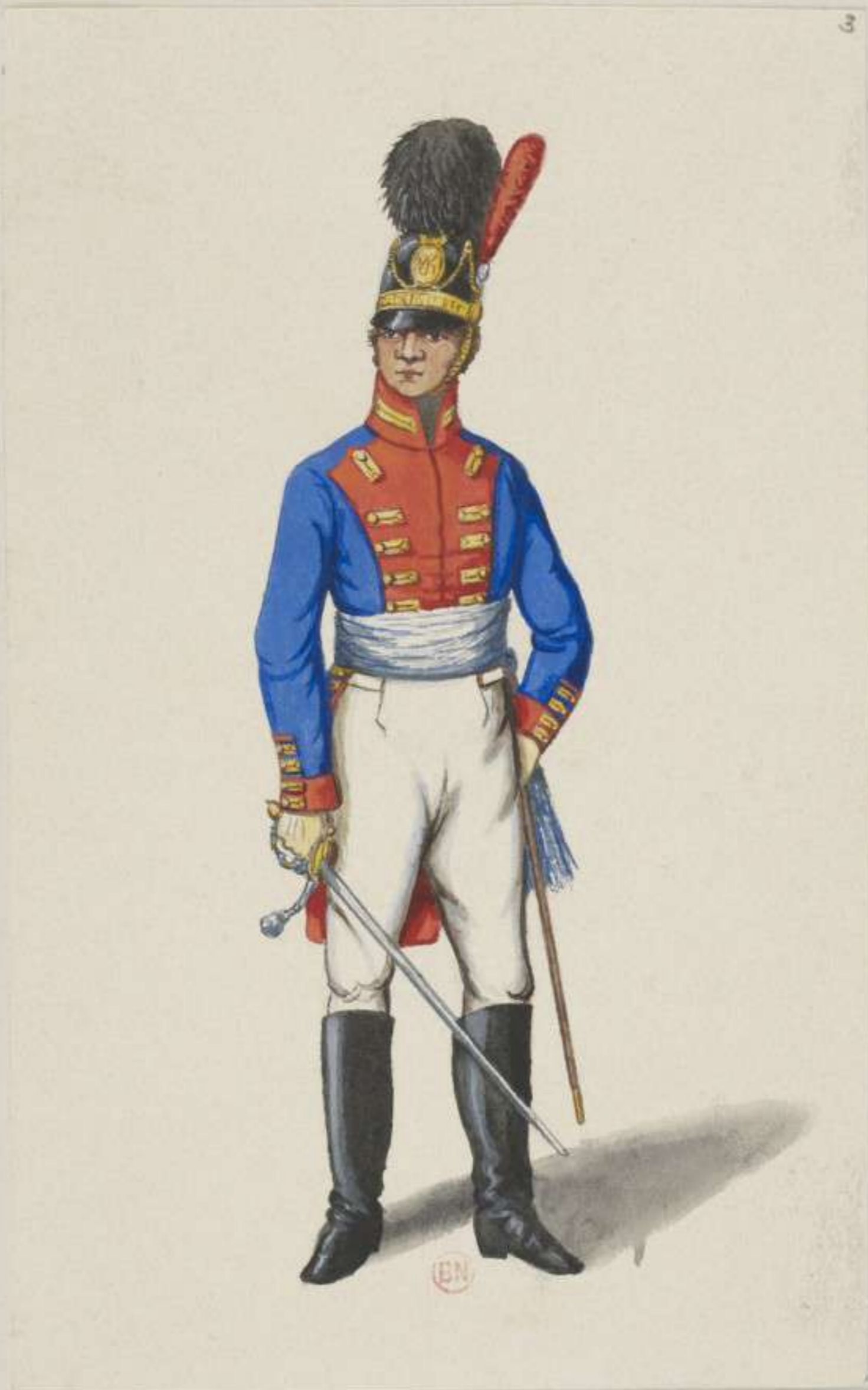
3° - Lieutenant vom 2. Infanterie Regiment Kronprinz - 1811