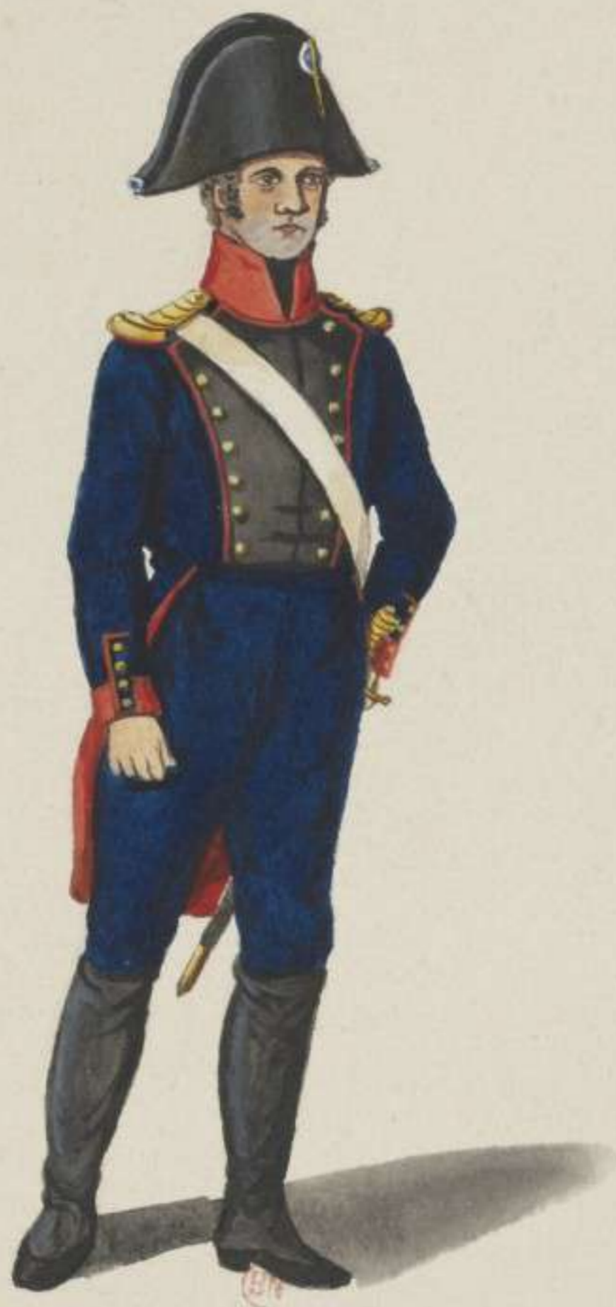
13 e - Ouvriers Compagnie - 1811