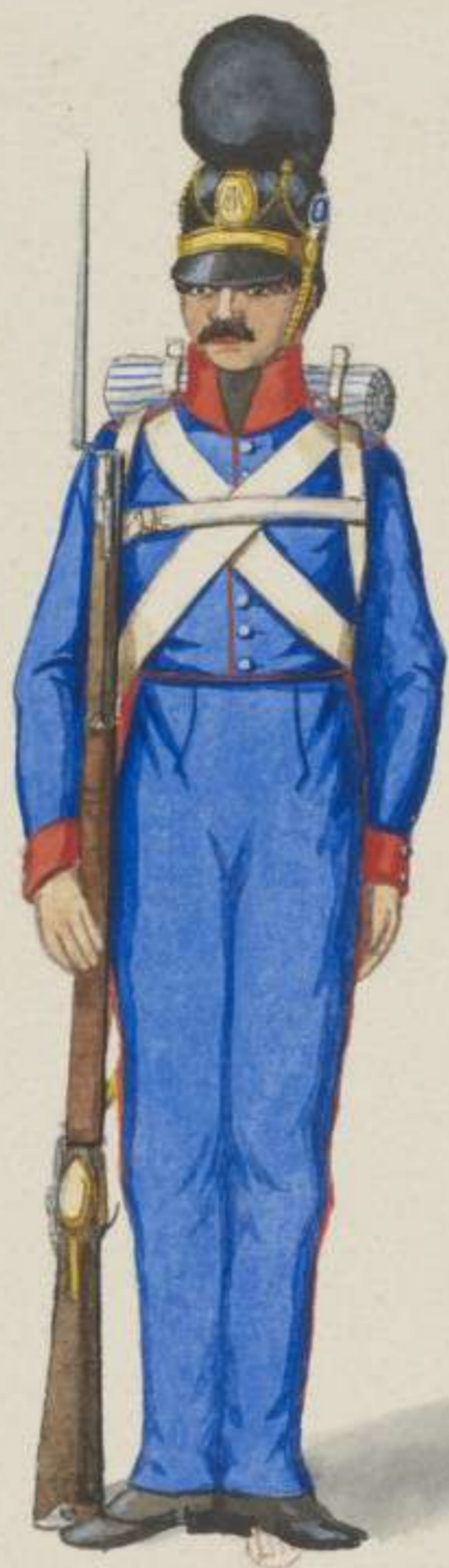
29°- Grenadier Garde Regiment - Felduniform 1814-1816