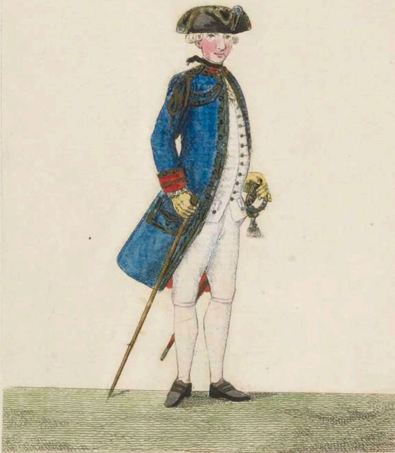
2° - General Adjutant