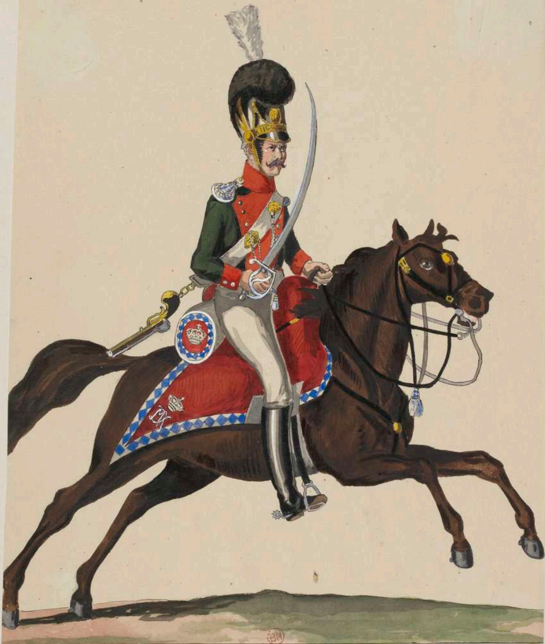
Chevauleger des Chevauleger-Regt-König.