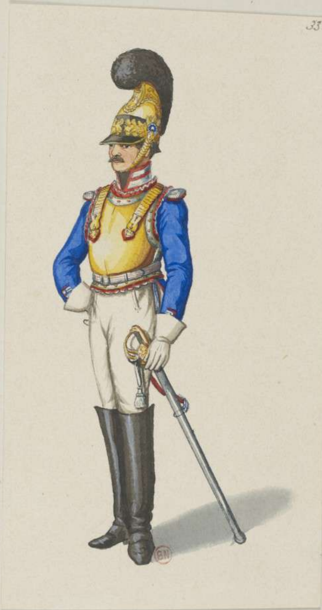
33°- Garde du Corps - Officier - 1814