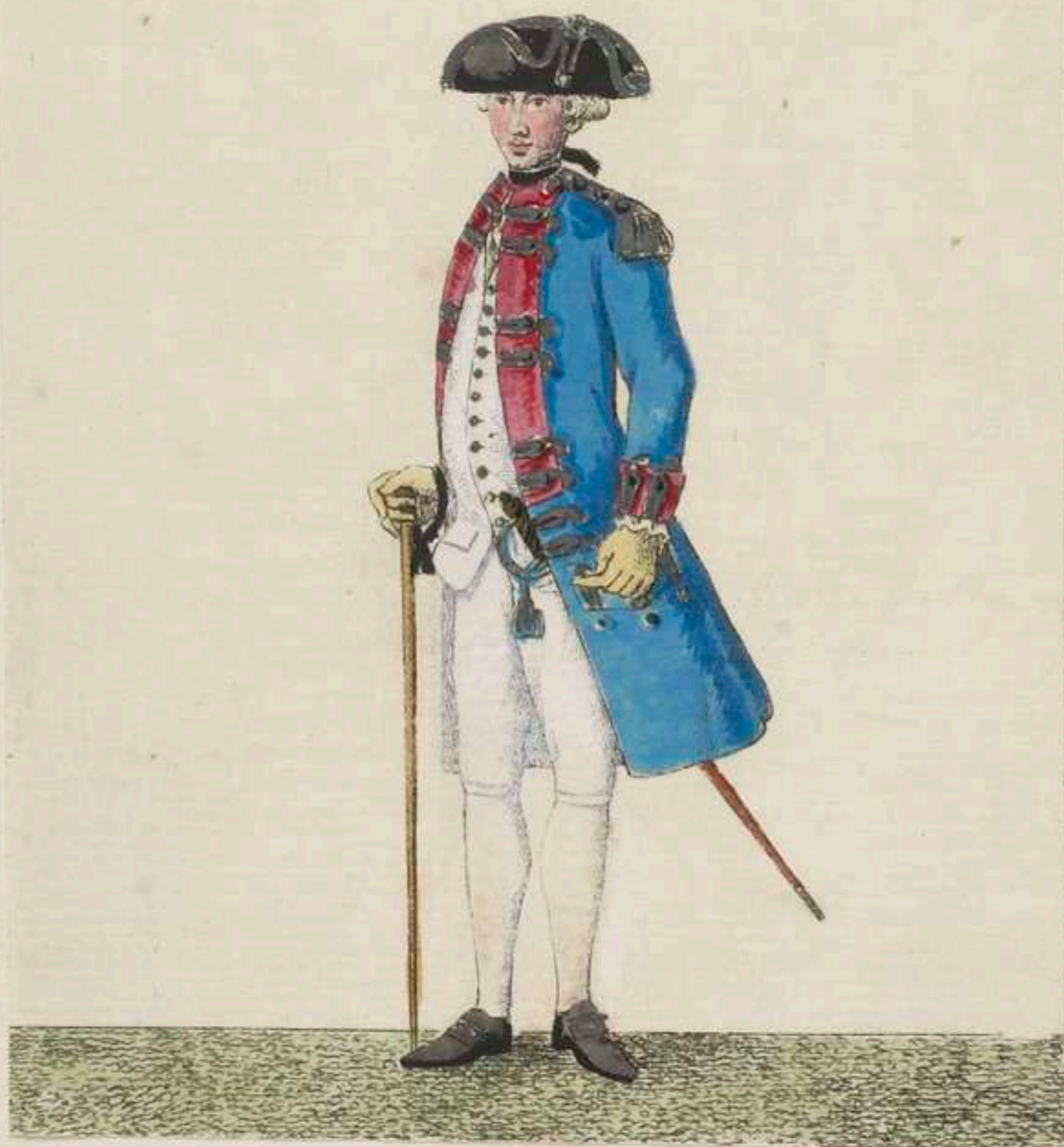
4° - Commandantschaft