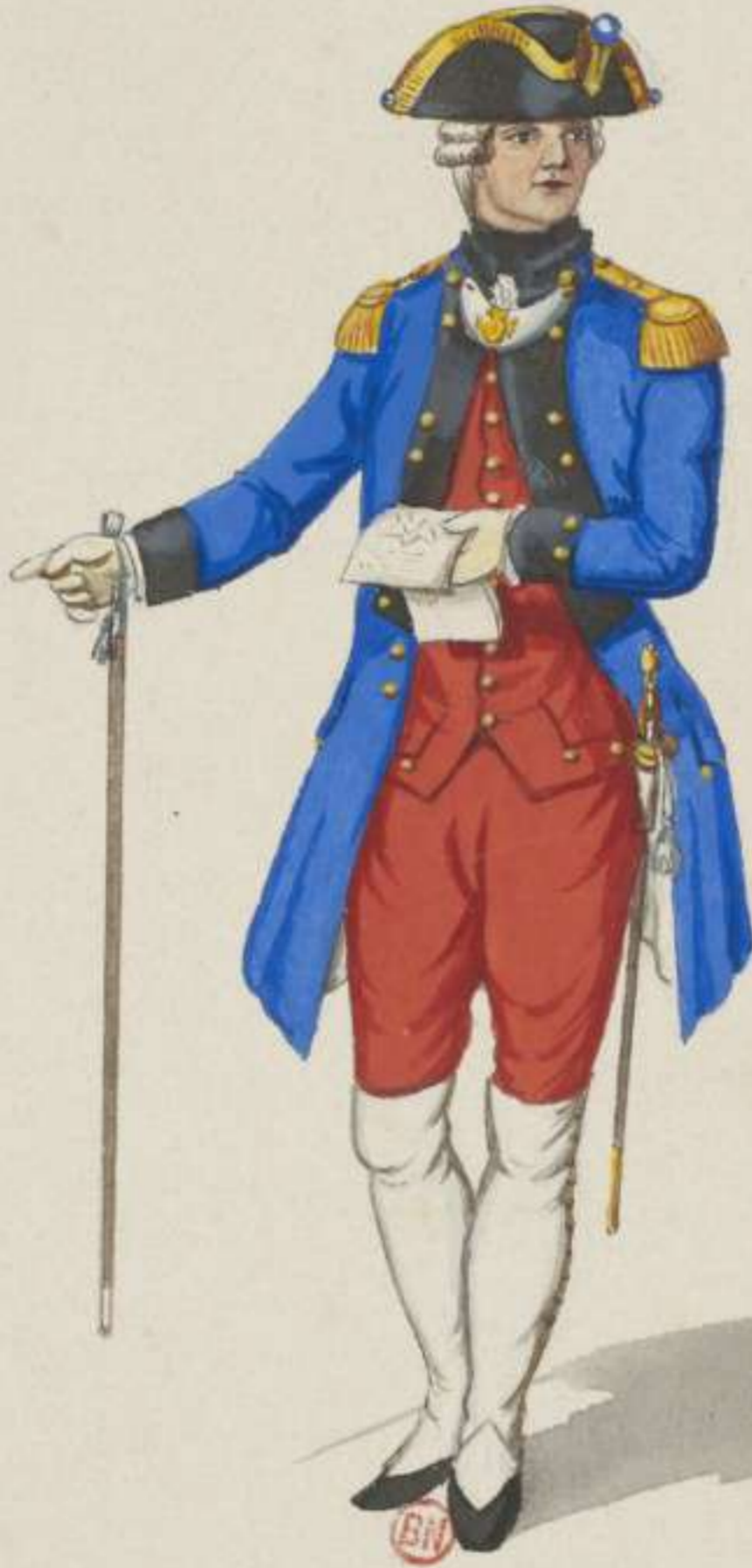
32°- Ingenieur Officier