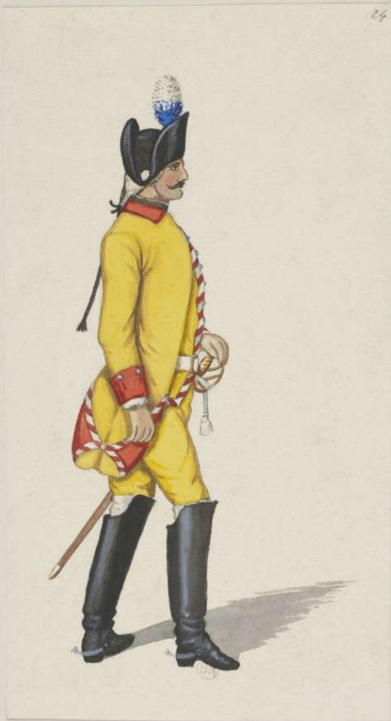
24°- Cürassier vom Regiment Prinz Carl August von Zweibrücken - Hofgala Uniform