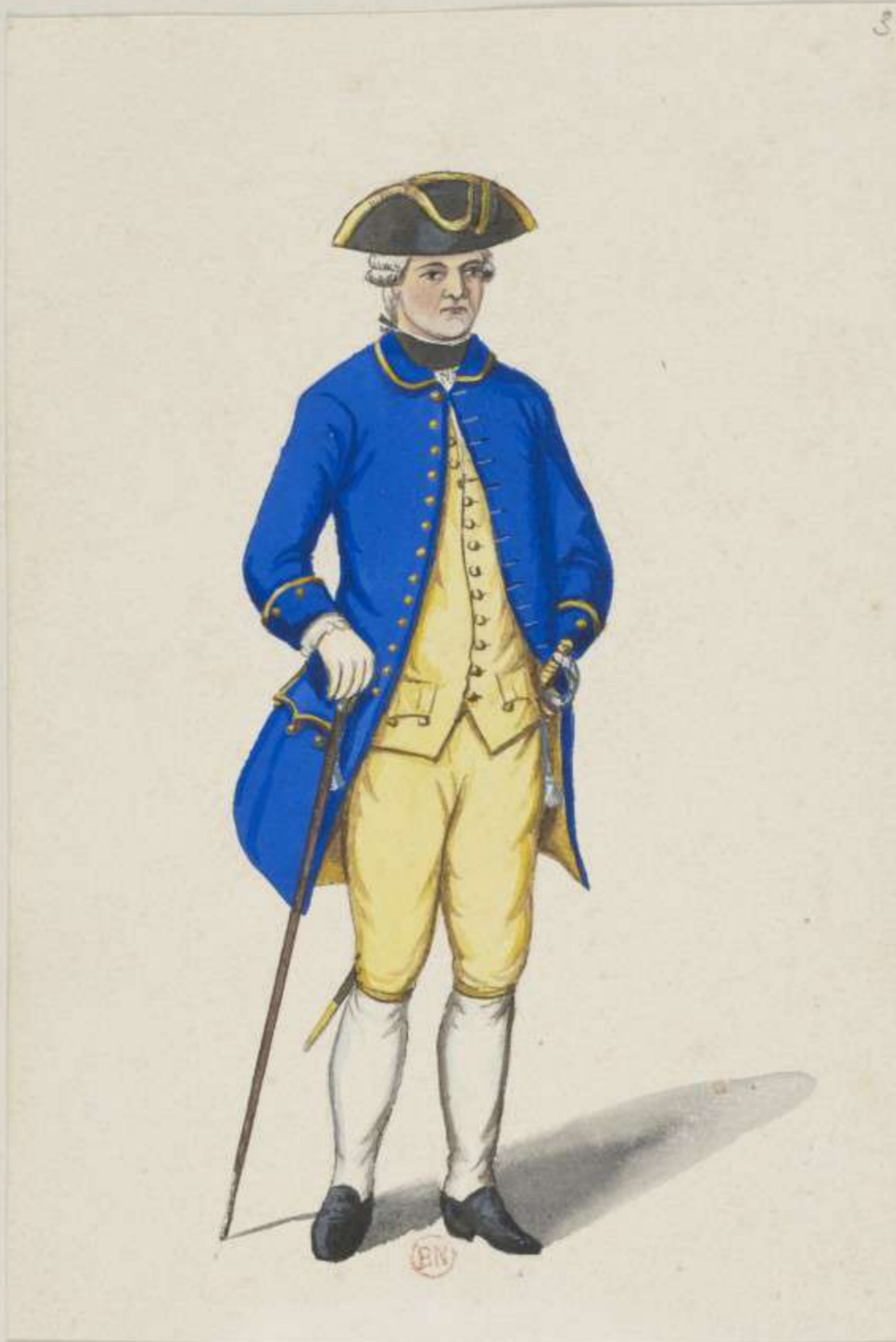
3° - Hof Kriegsrath