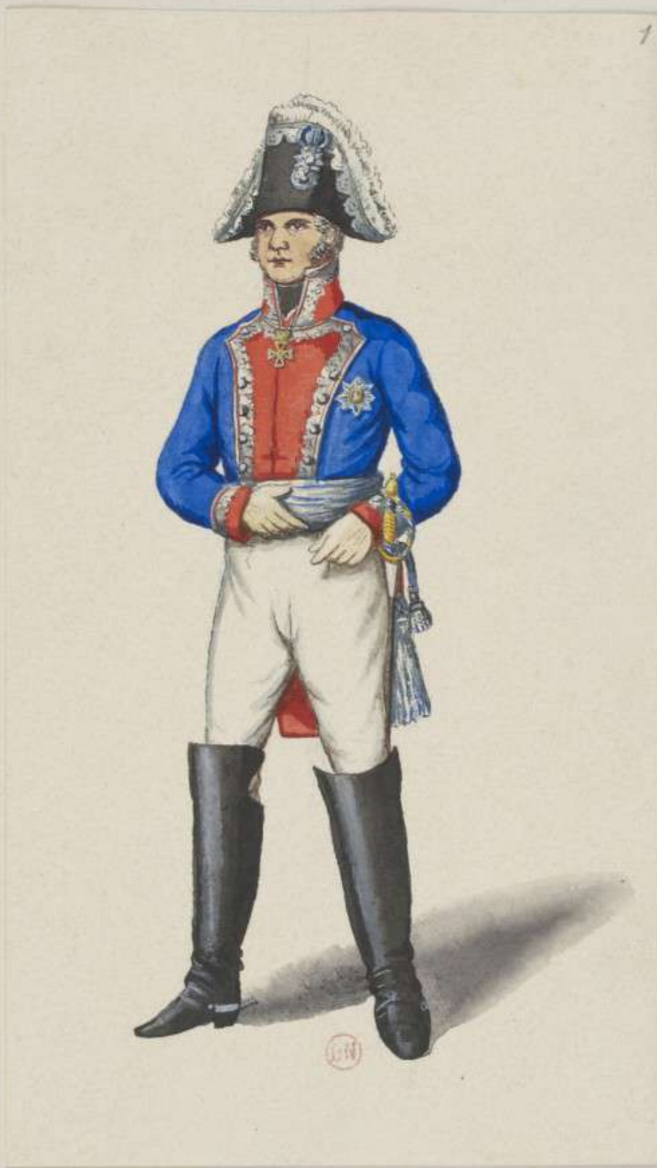
1° - General - 1810