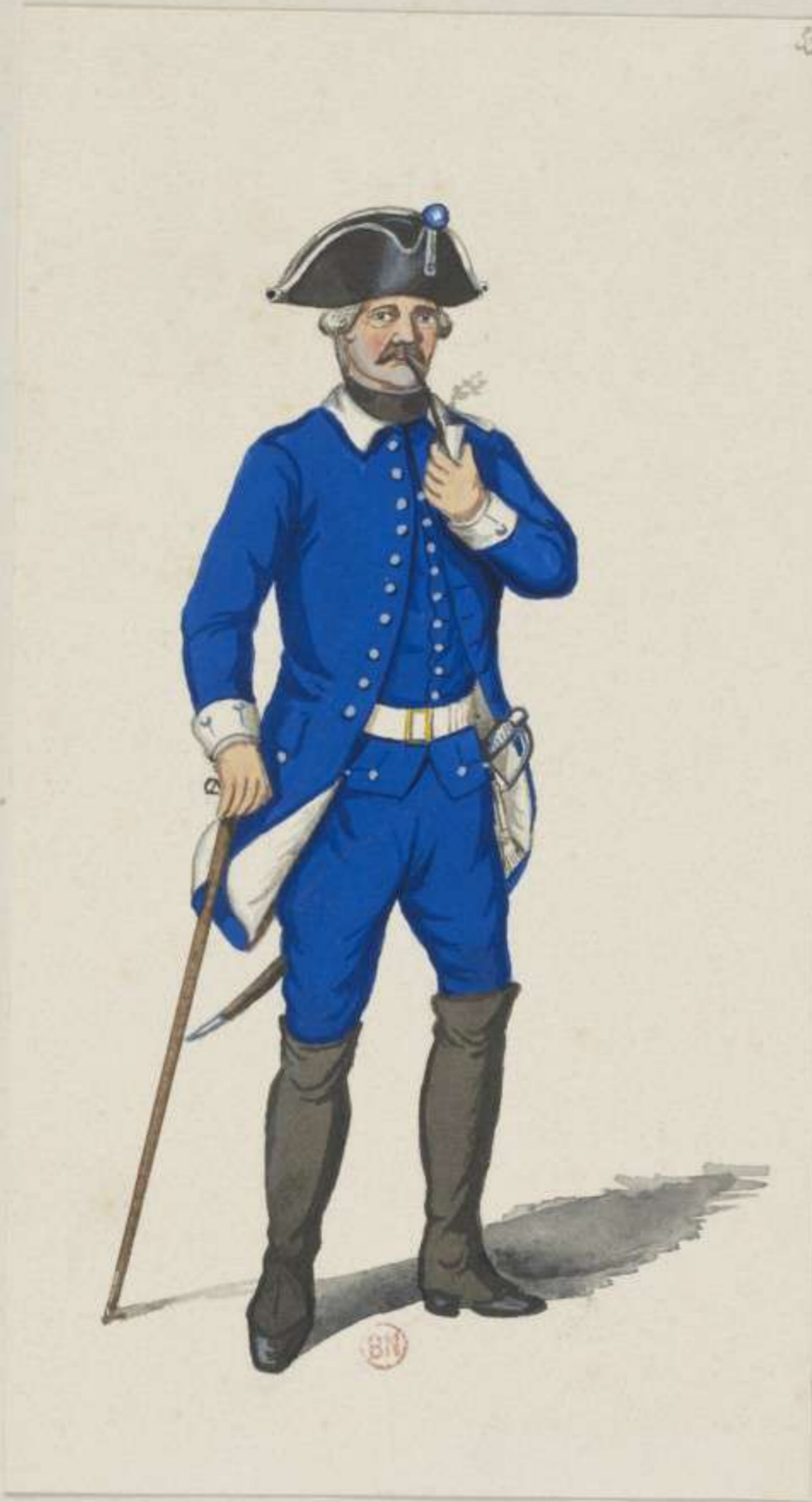
33 e - Invaliden Compagnie