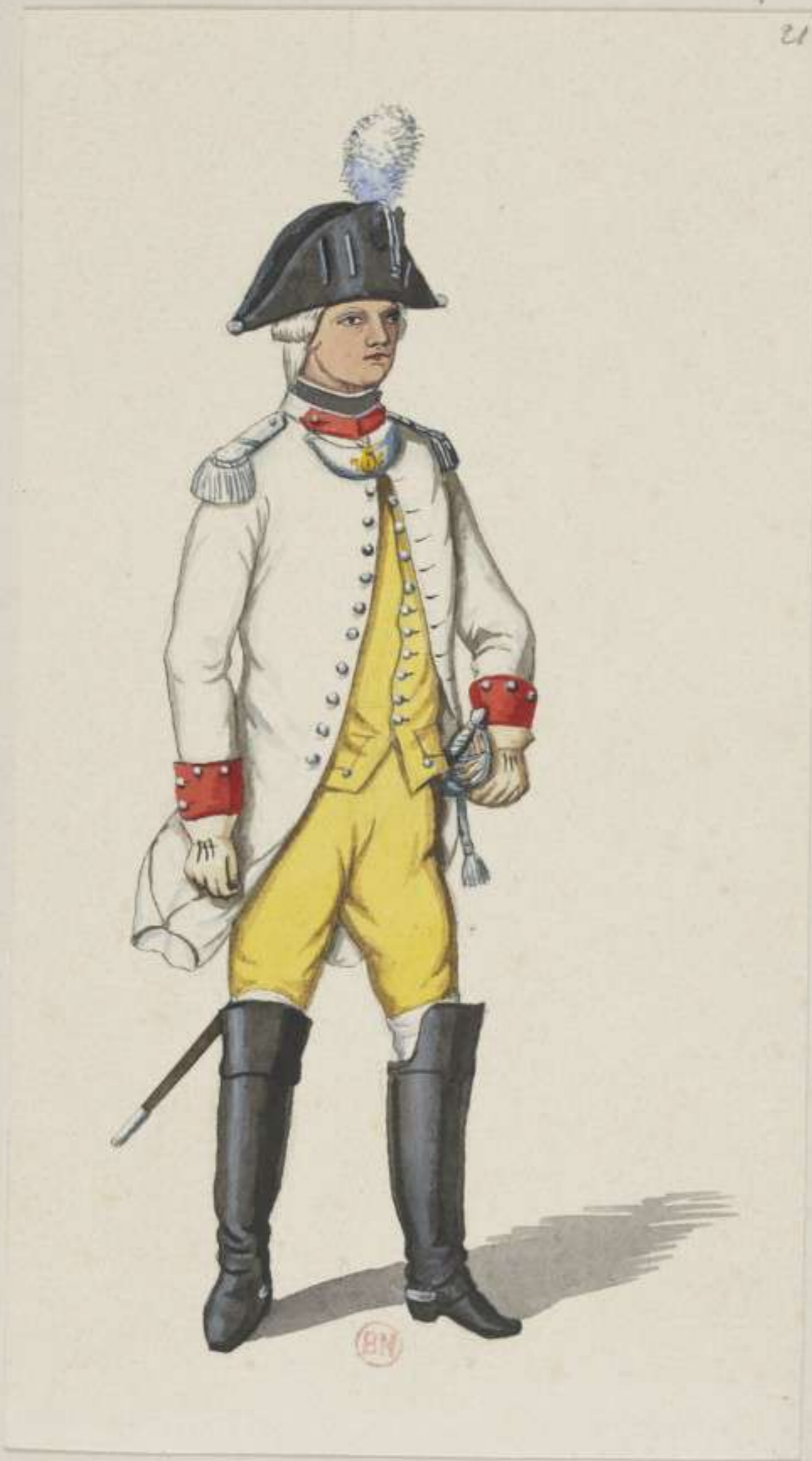
21 o - Officier vom 1. Cürassier Regiment von Ysenburg