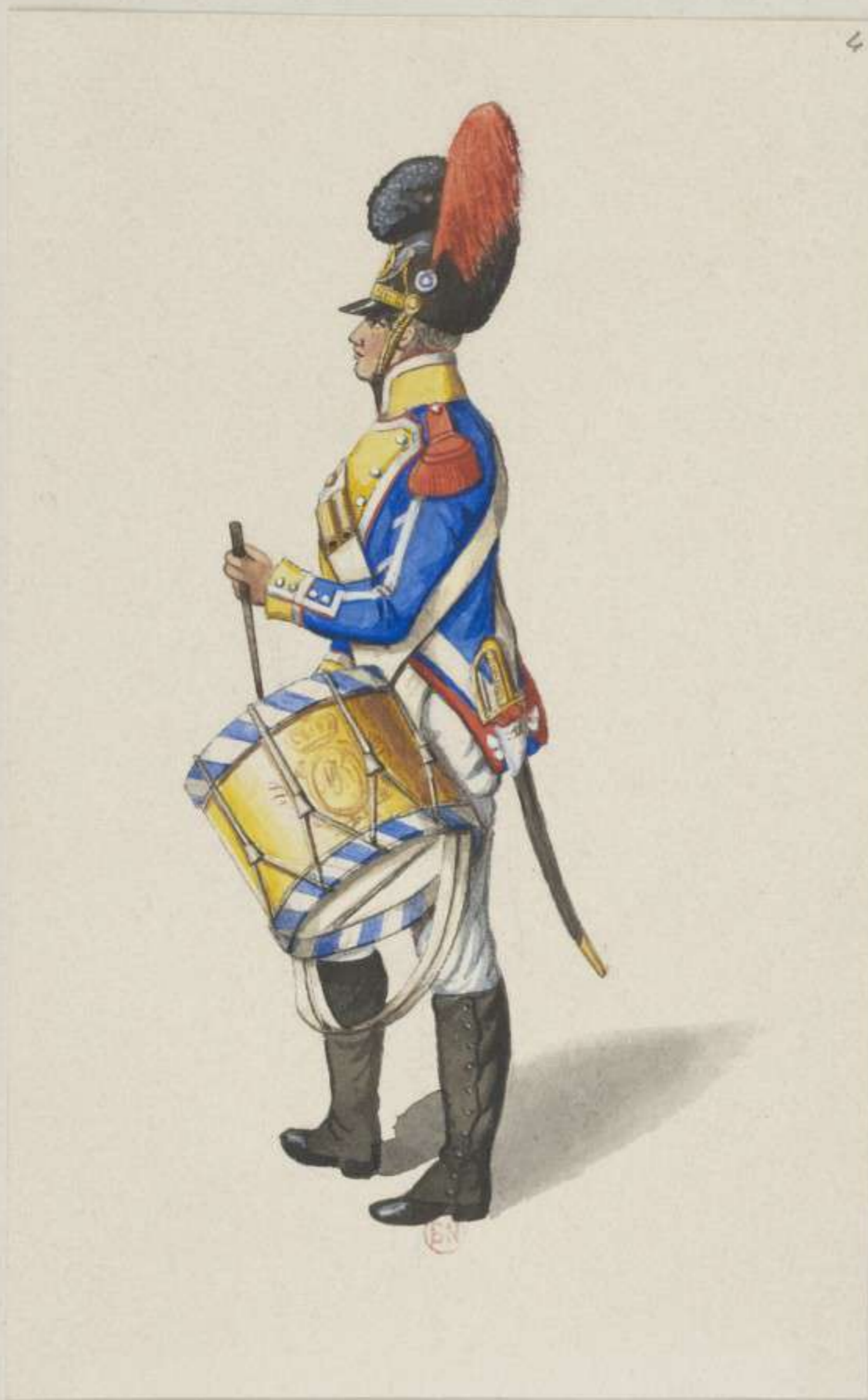
4° - Grenadier Tambour vom 4. Infanterie Regiment Hildburghausen - 1811