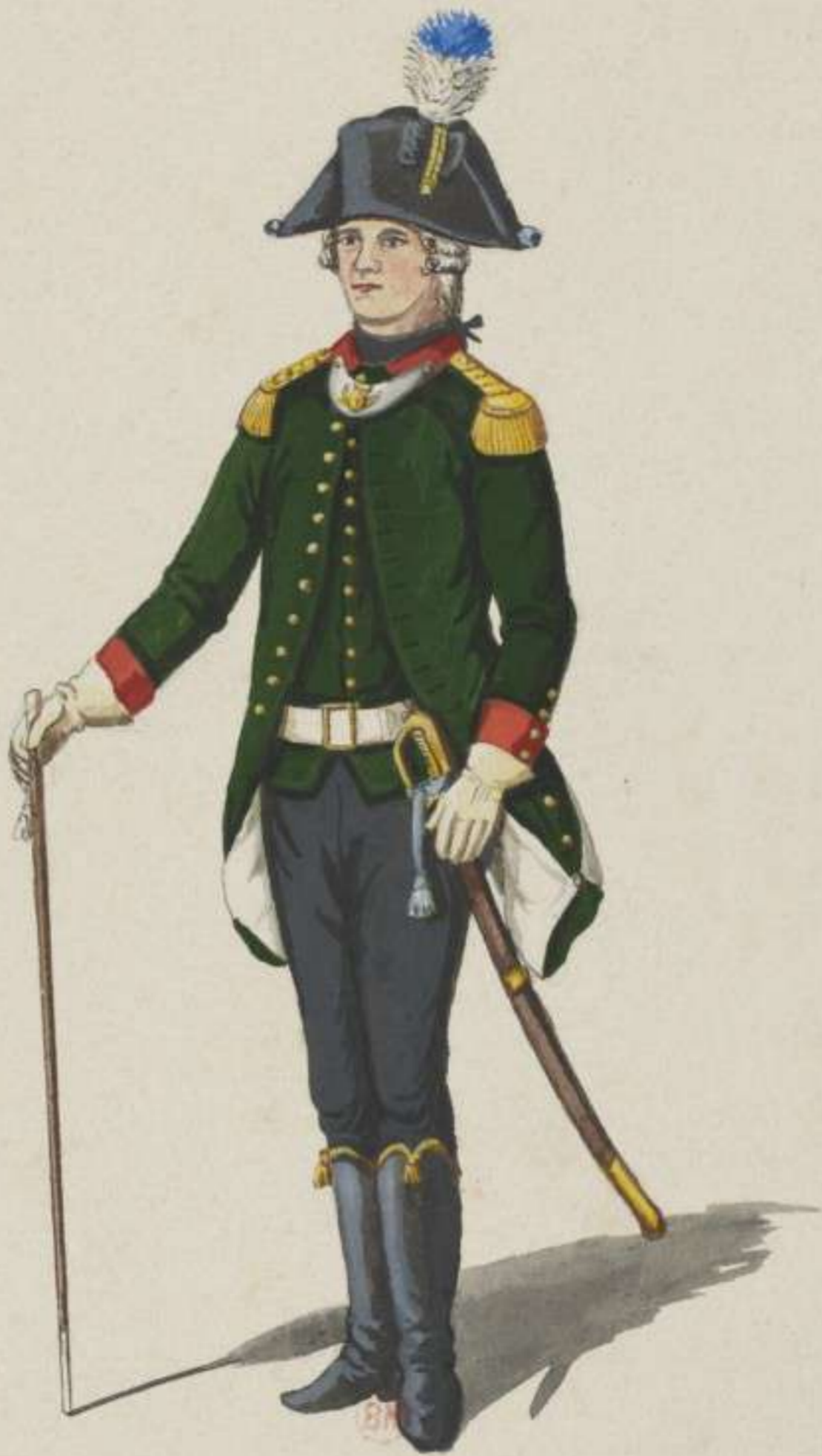
34°- Bayerisches Jäger Corps - Officier