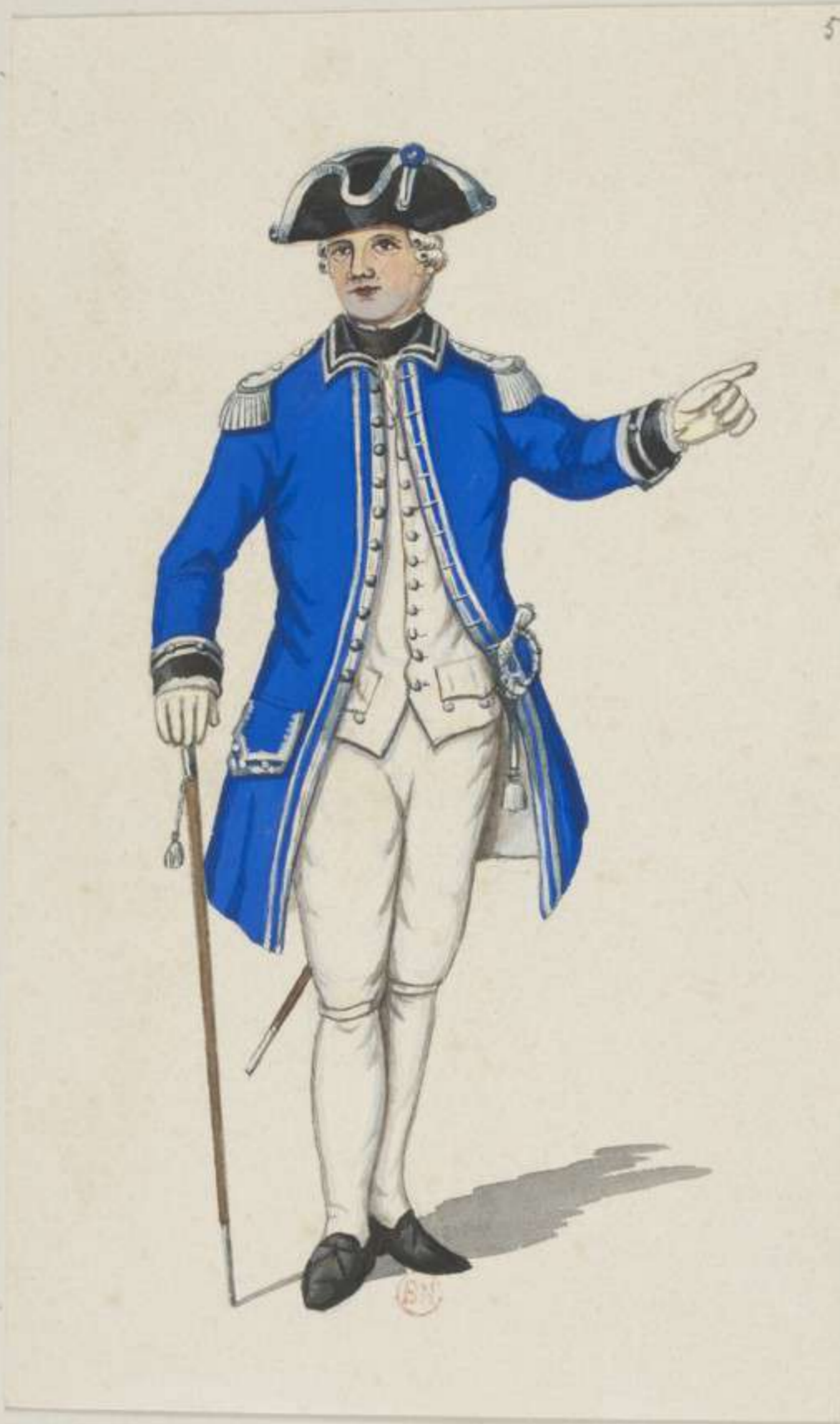
5° - Leibgarde der Trabanten - Officier