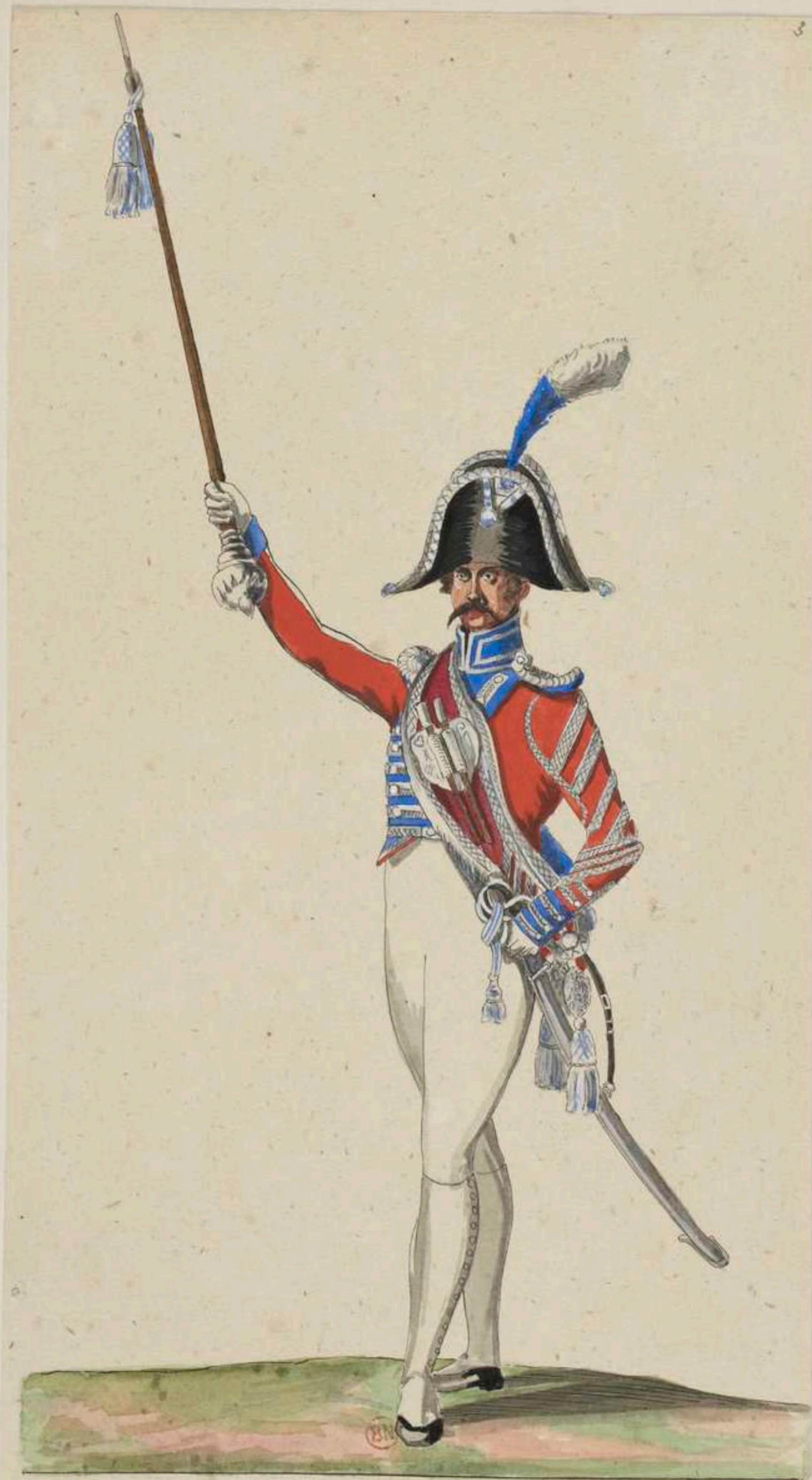
Tambour major des Grenadiers de la Garde