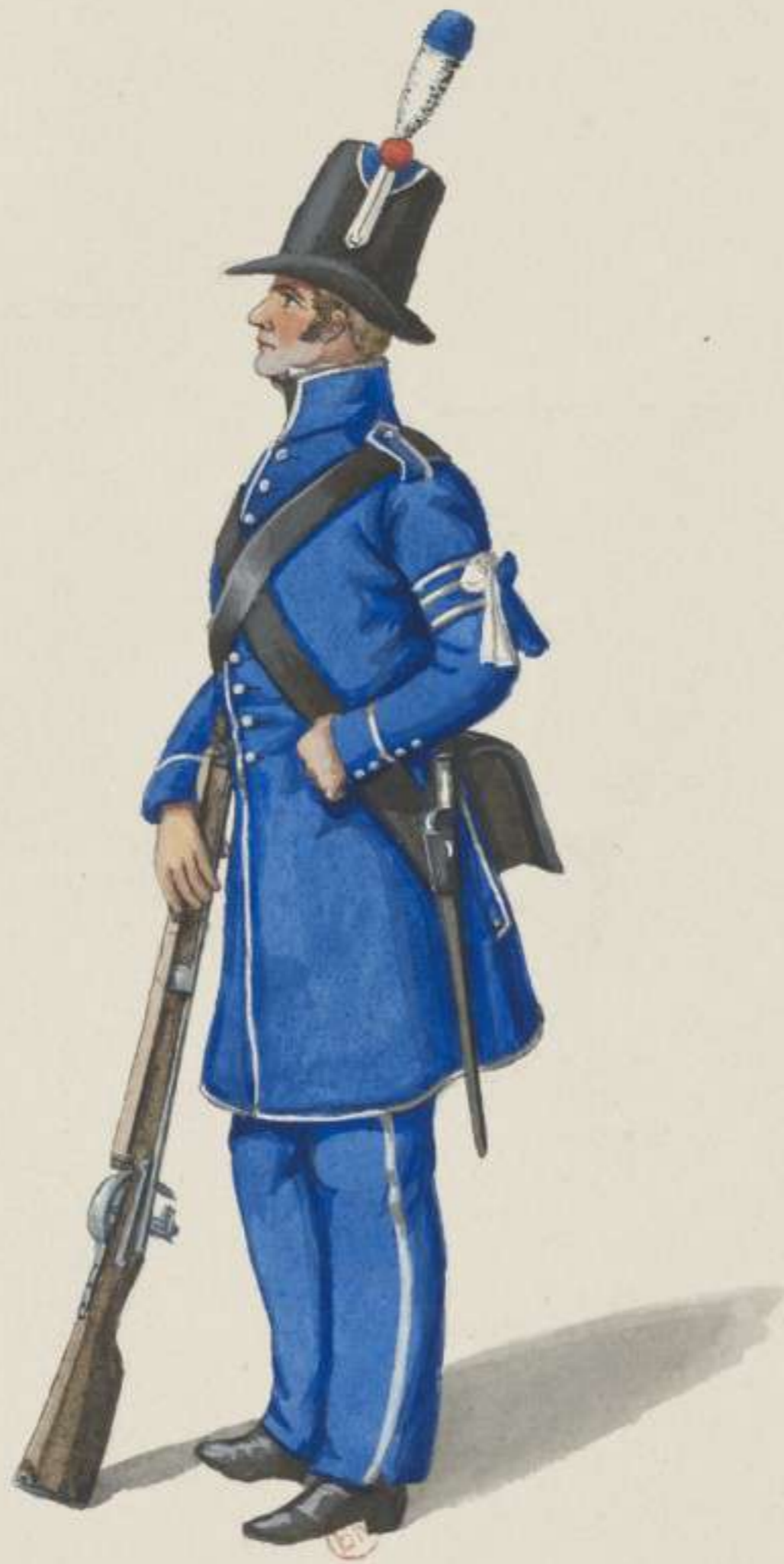
32°- Baierisches Königliches Bürger Militär - 1814