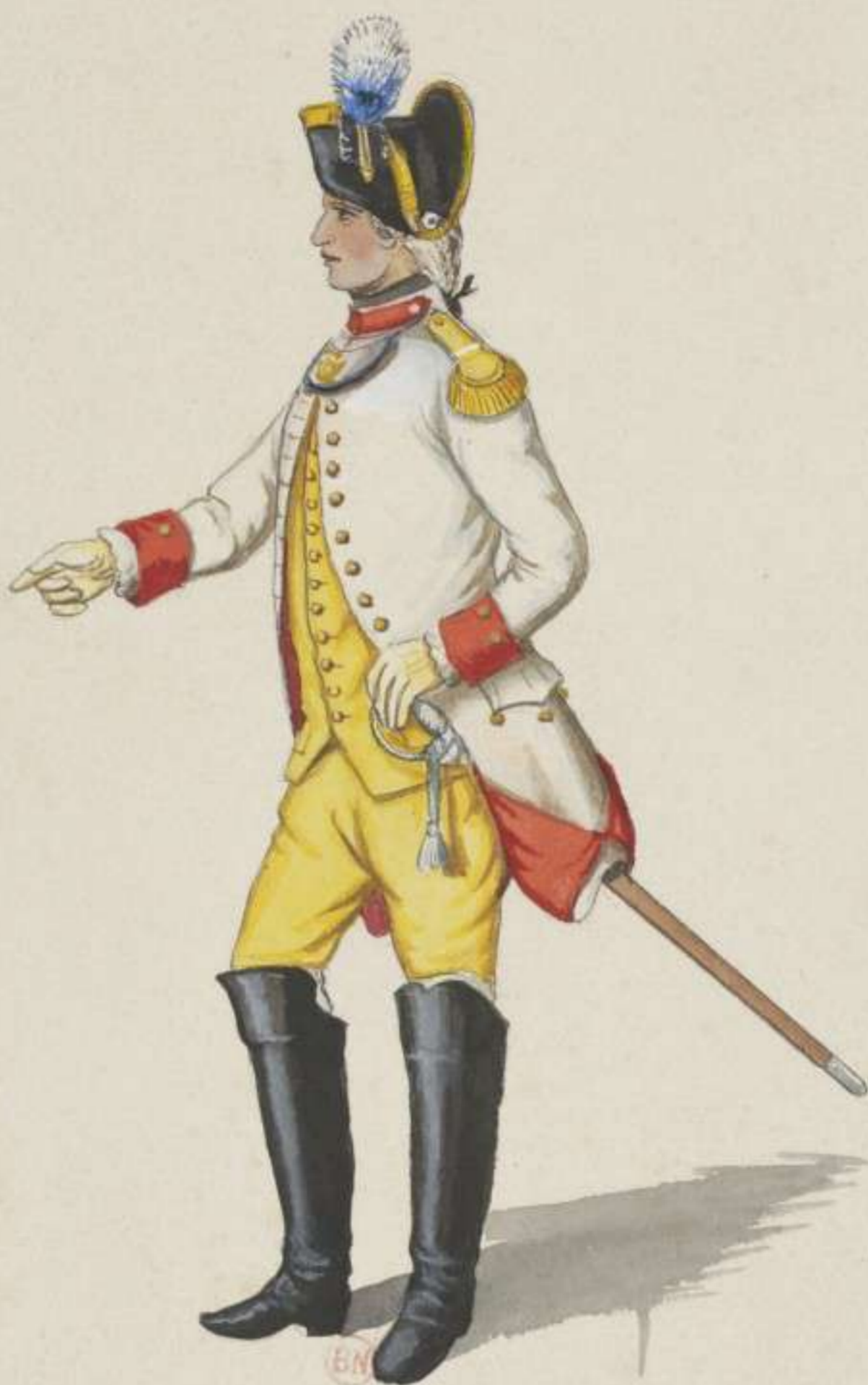
23 e - Officier vom 3. Cürassier Regiment Prinz von Pfalz Zweibrücken