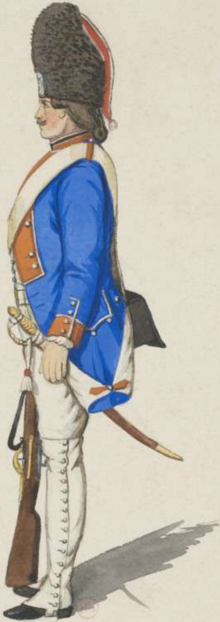
10 o - Grenadier vom 4. Infanterie Regiment von Rodenhausen