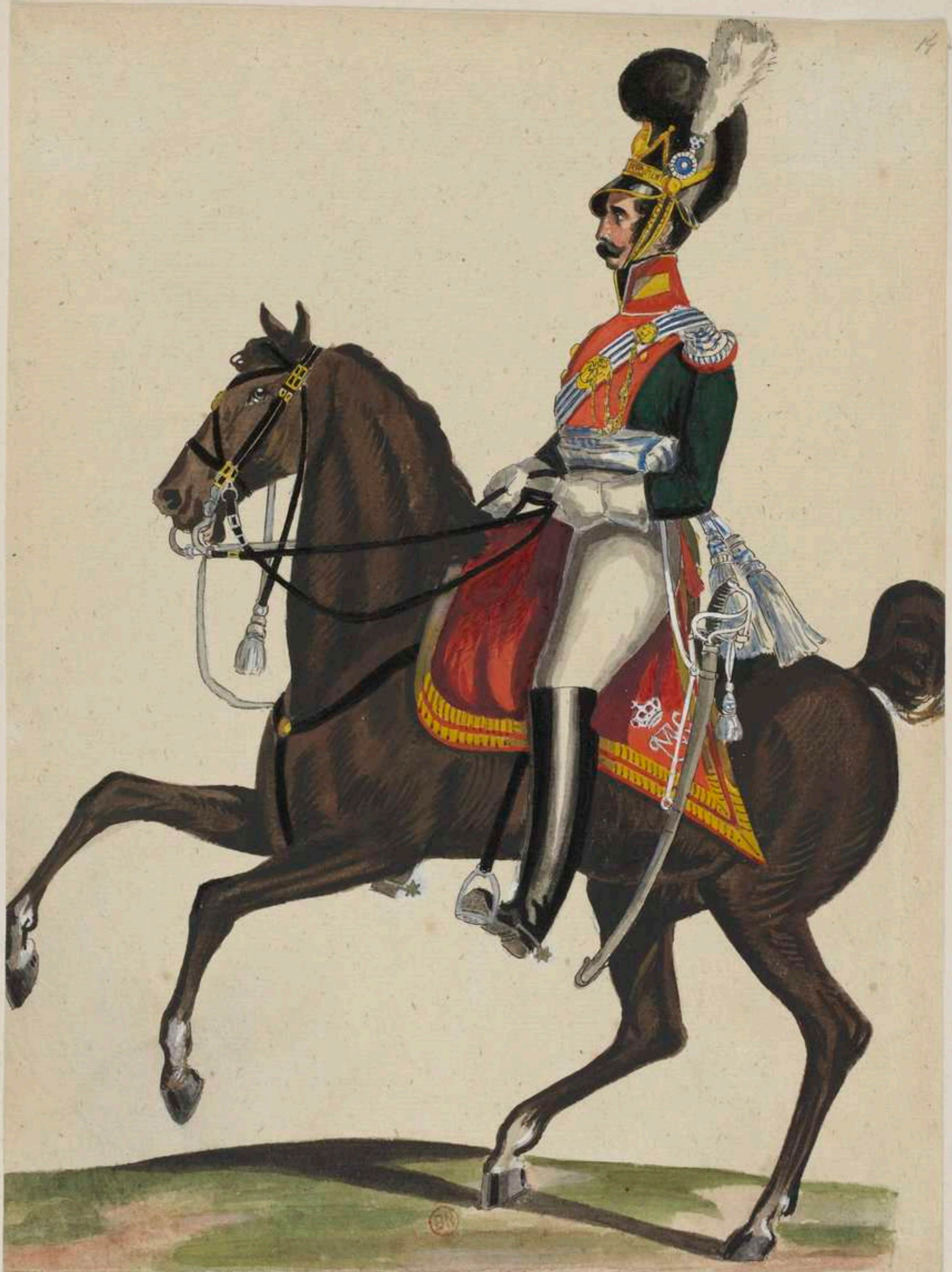
Lieutenant des Chevau-légers Leibniger.