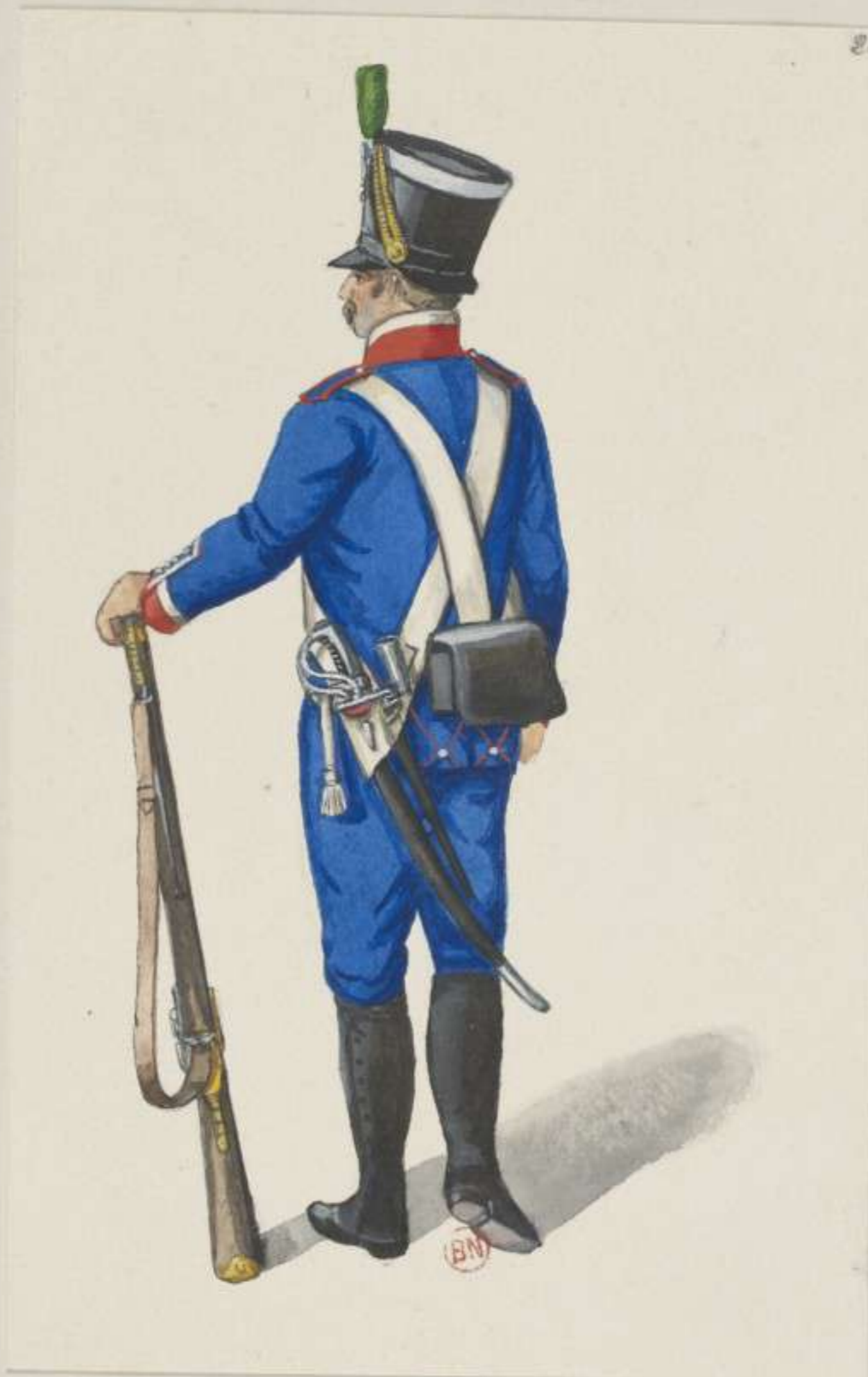
20°- Baierische Mobile Legion - Schützen Unter Officier - 1813