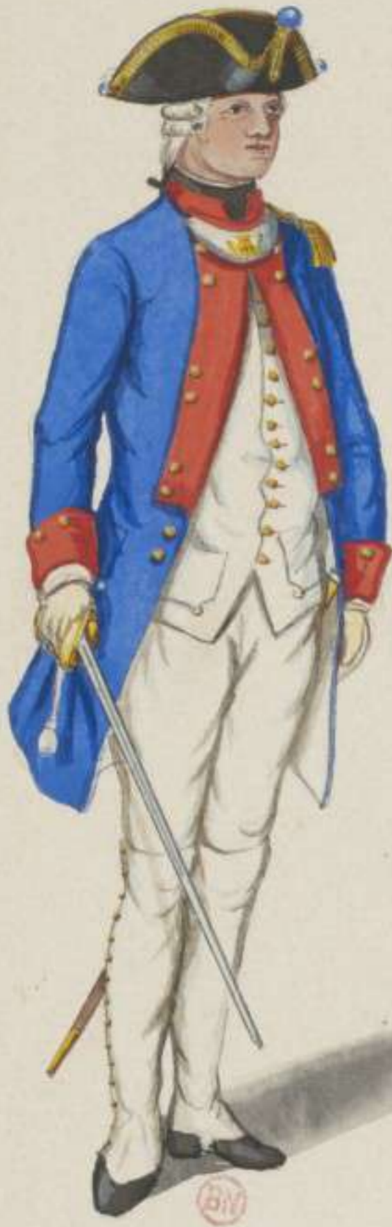
15 o . 11. Infanterie Regiment Campana - Füsilier Lieutenant