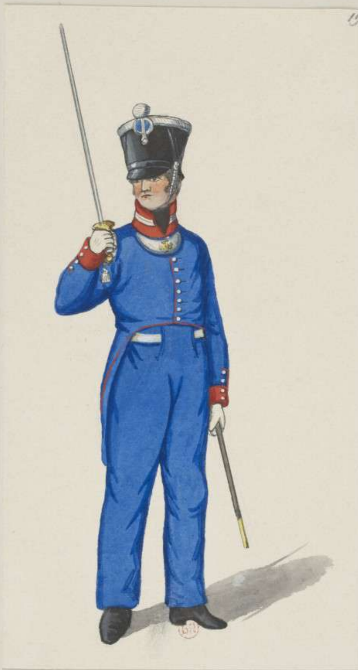
19°- Bayerische Mobile Legion - Officier - 1813