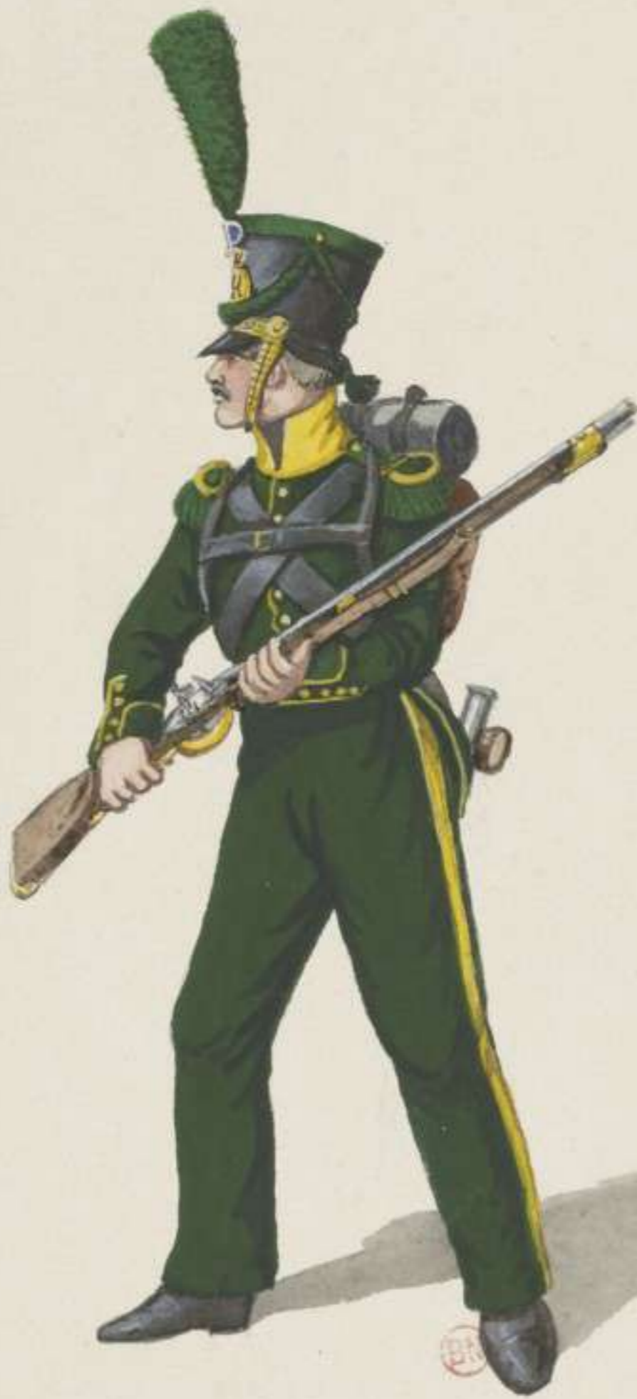
17 o - Baierische Freiwillige Jäger - Schütze - 1813