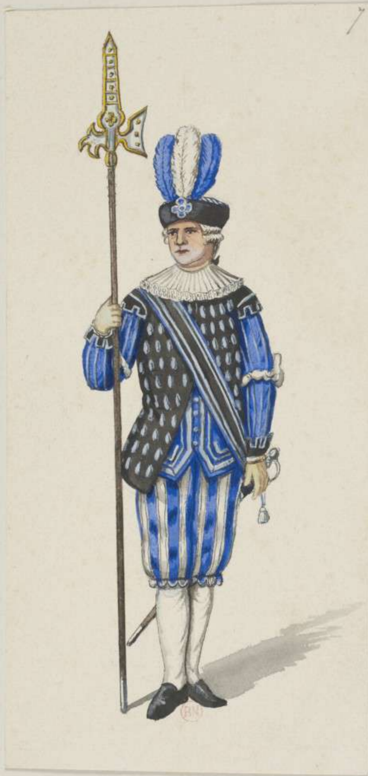
7° - Leibgarde der Trabanten - Hof Gala