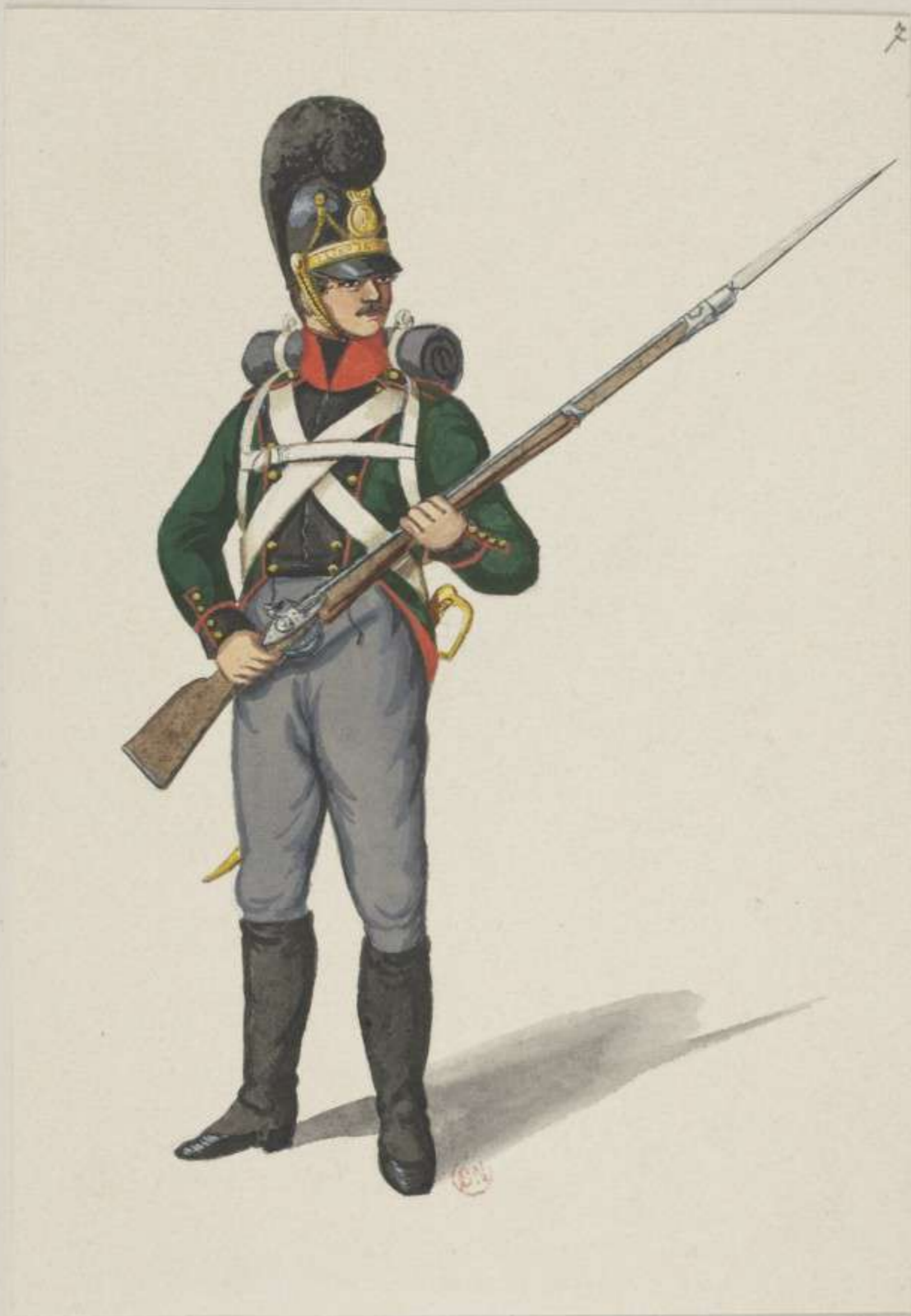
7° - Leichte Infanterie - 1. Bataillon Gedoni - 1811