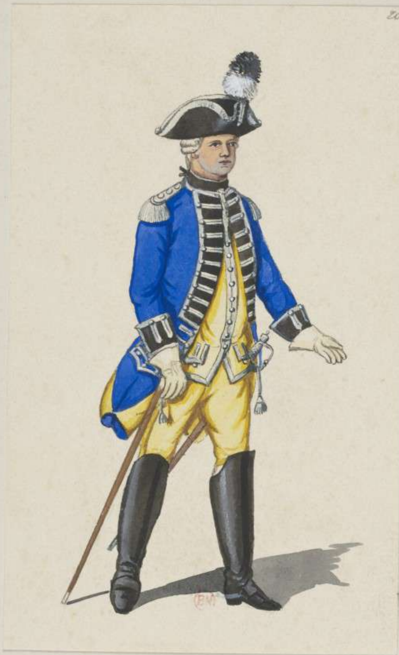
20 o - Officier der Hartschier Garde