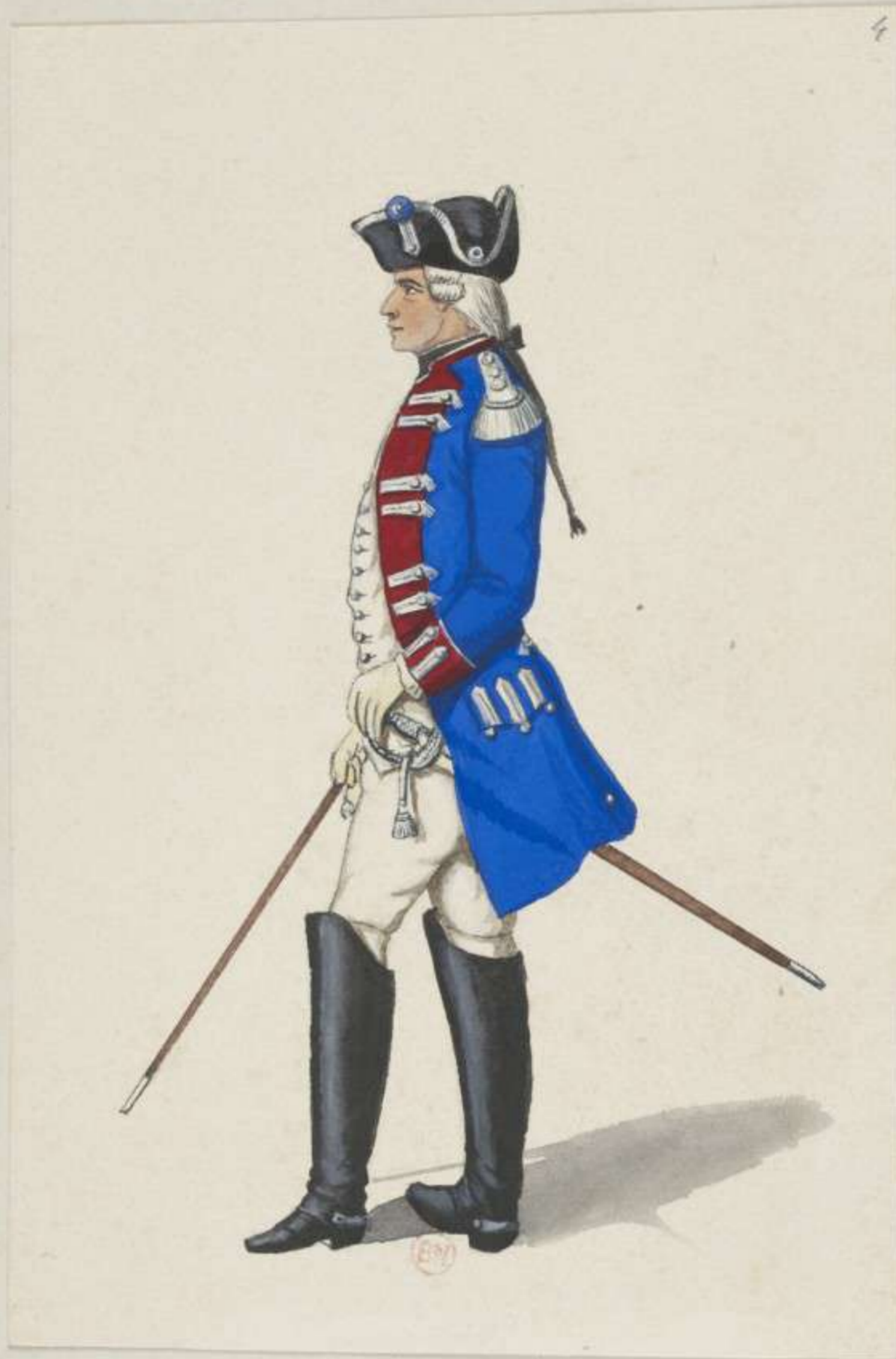
4° - Festungs Commandant