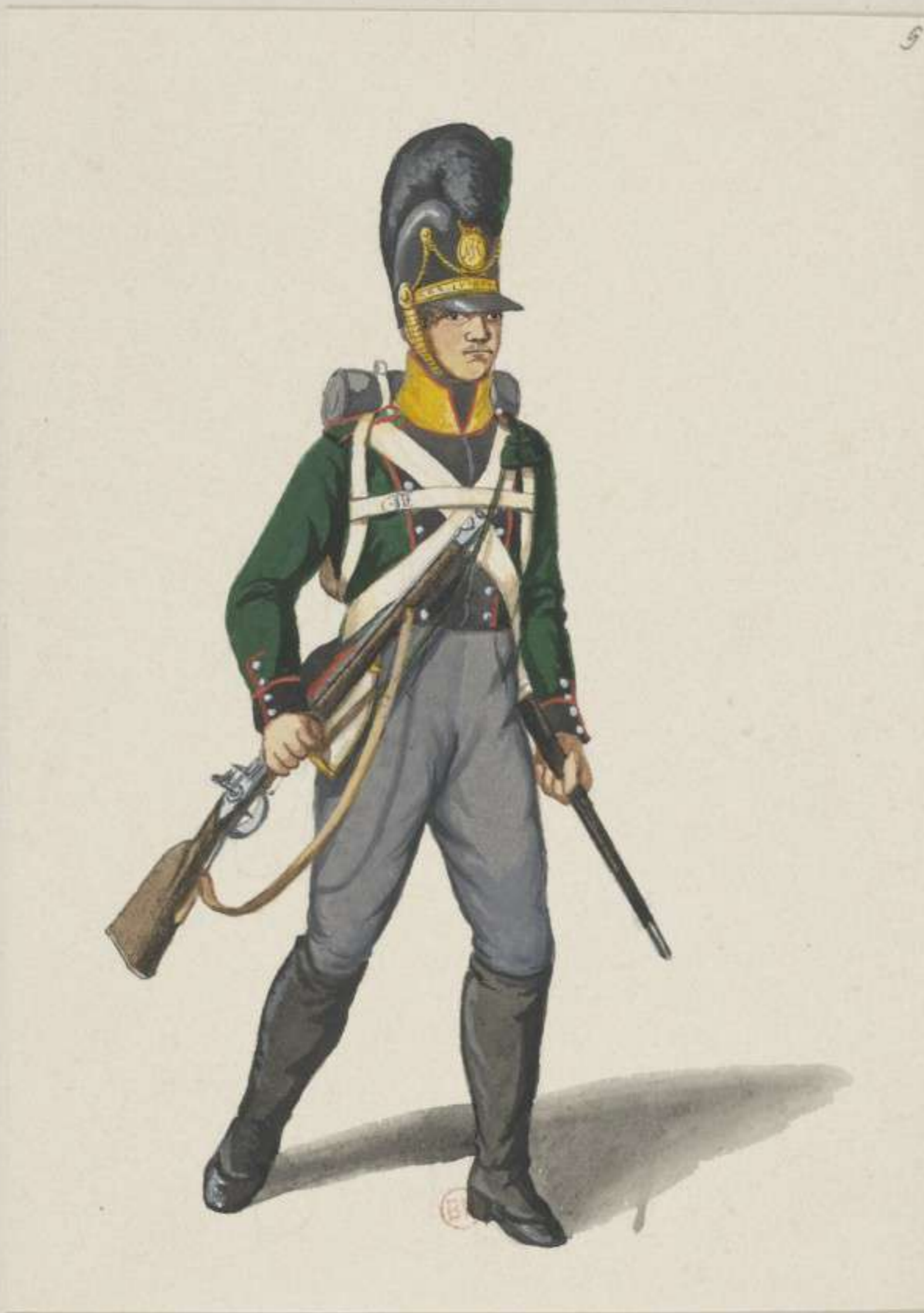
9° - Leichte Infanterie - 5. Bataillon Buttler - 1811