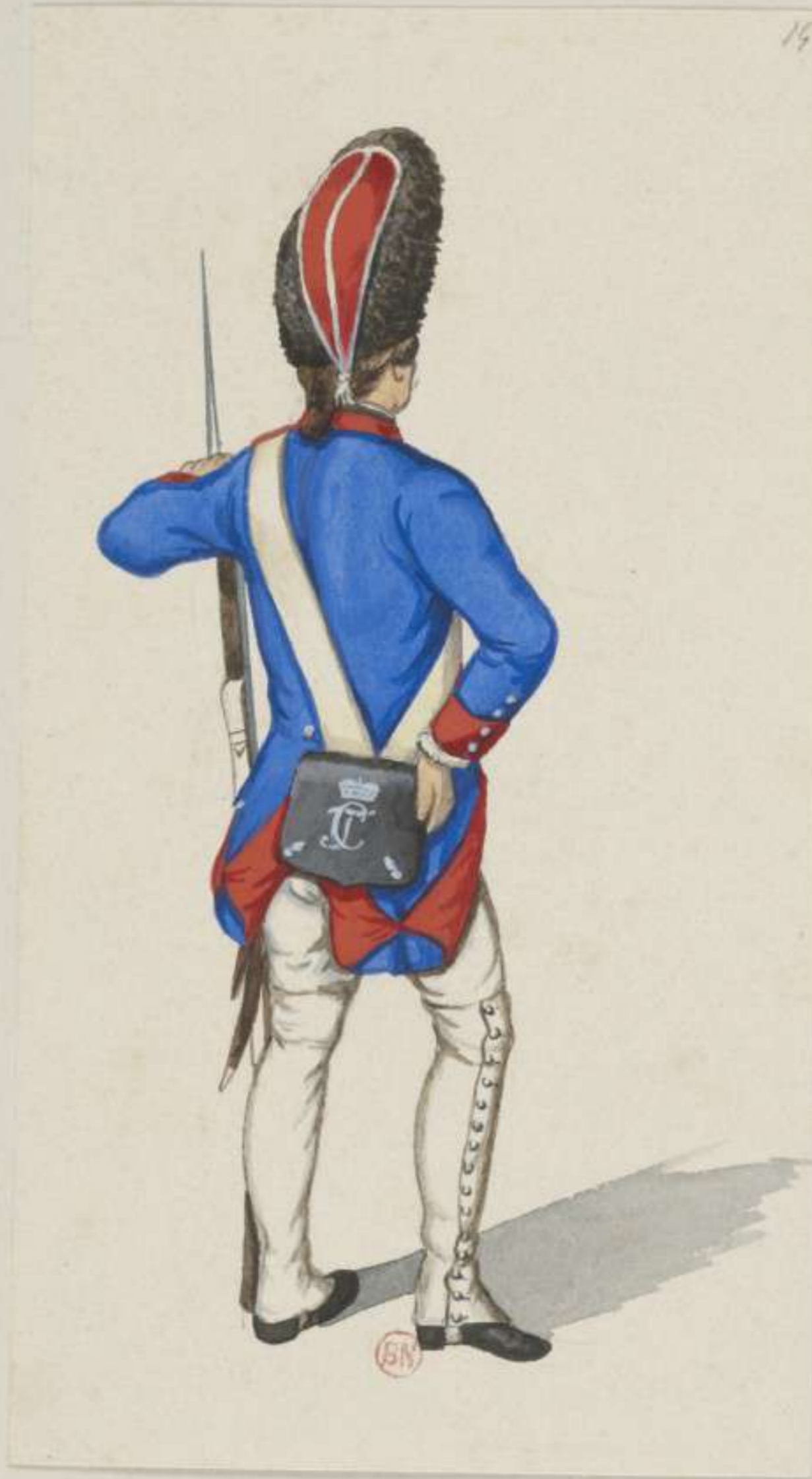
14 o - 10, Infanterie Regiment von Lodron