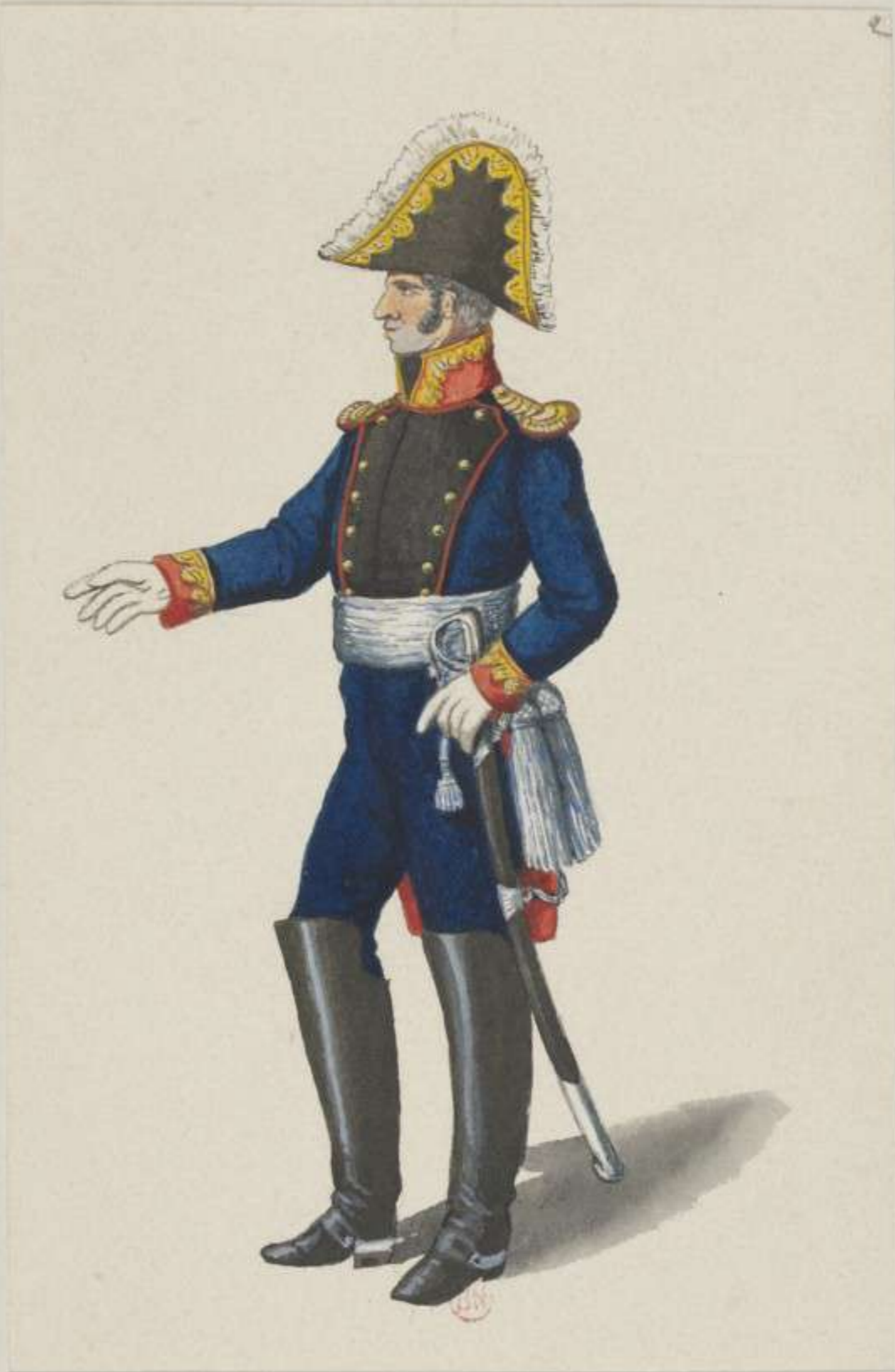
2°.- General-Major der Artillerie - 1811