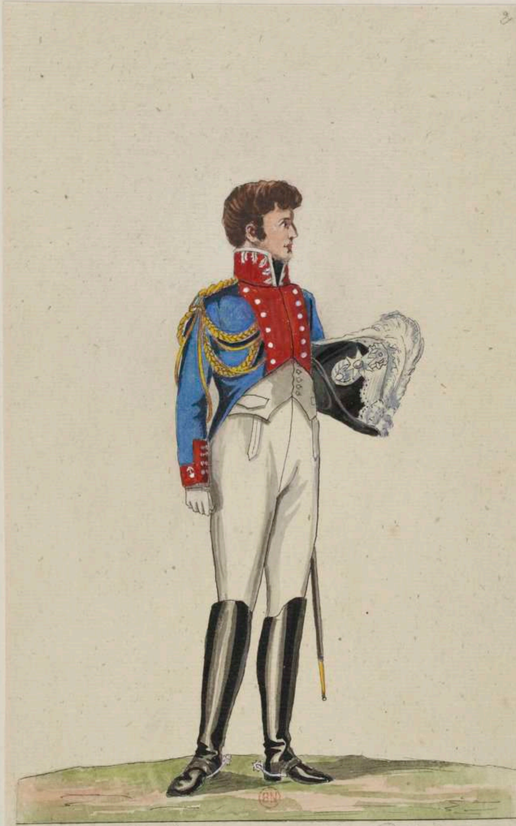
Adjutant superieur du Palais