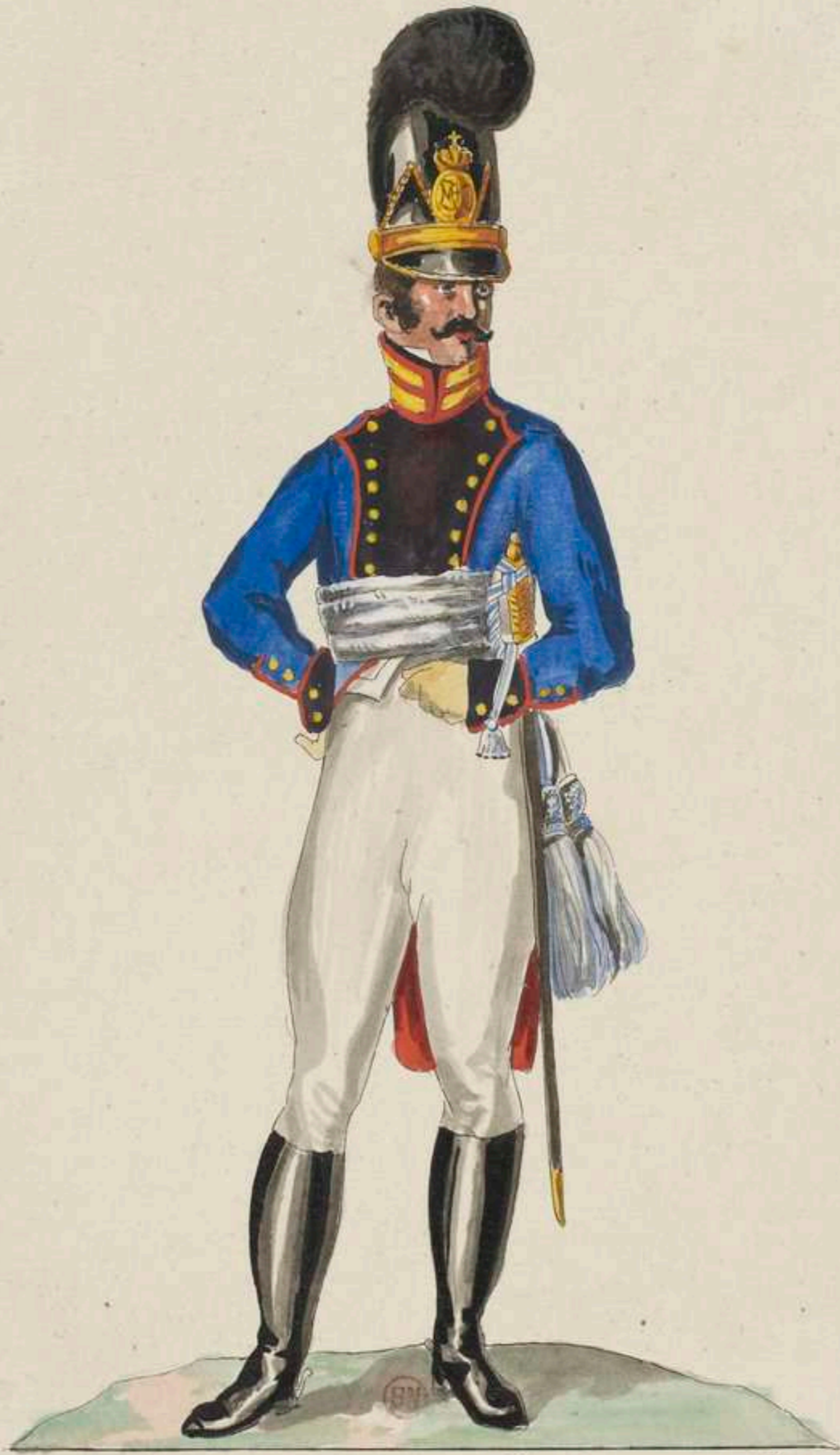
Adjutant v. 14 e Lin. Infanterie Reg t .