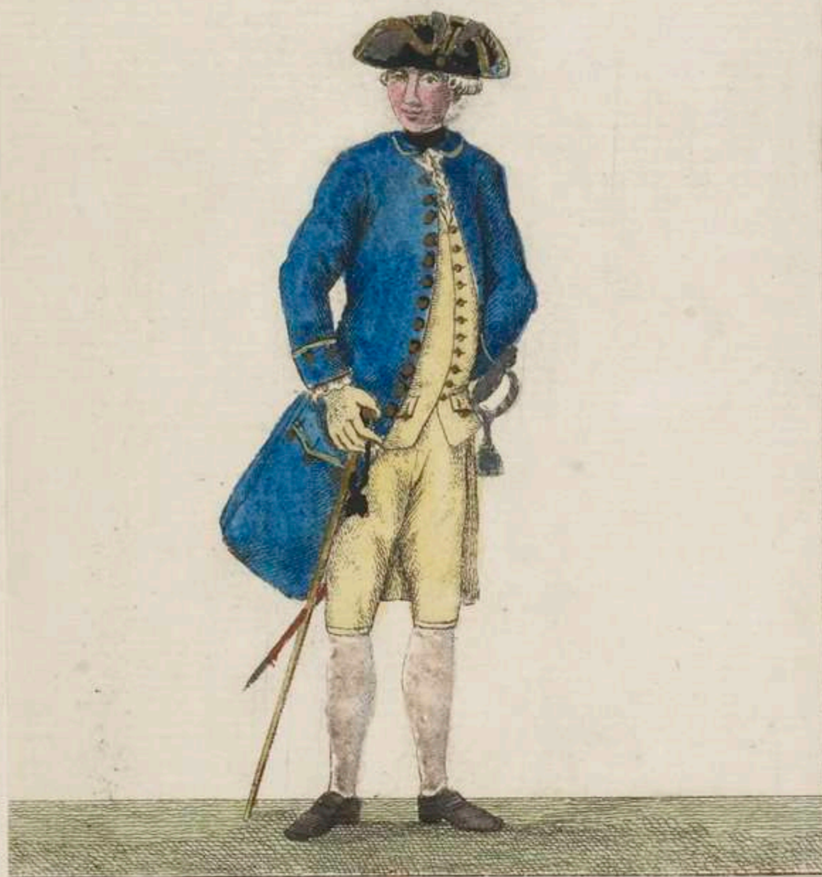
3 o - Hof Kriegs Rath