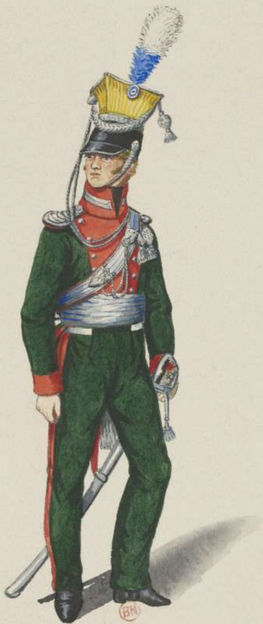
23°- 1. Ulanen Regiment - Lieutenant - 1813