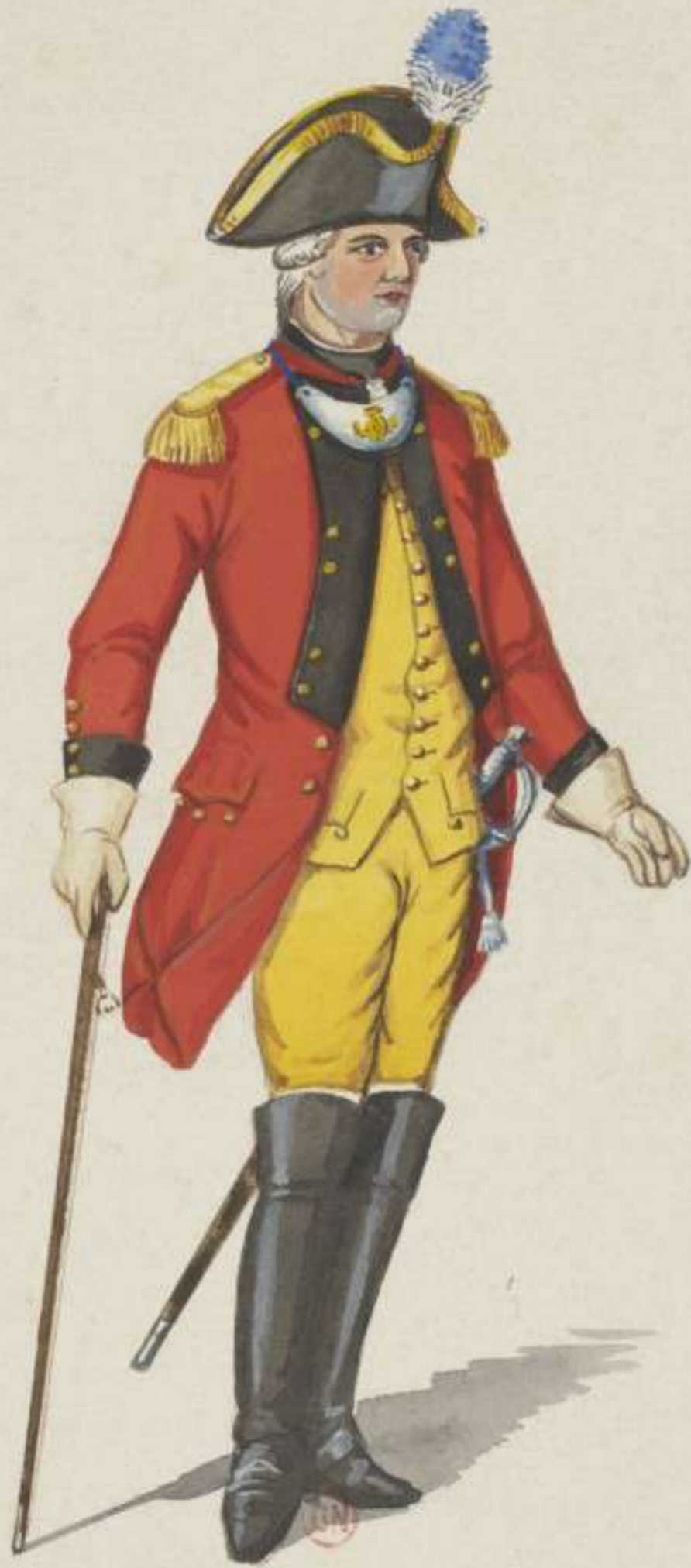
25°- 1. Leib Dragoner Regiment - Officier