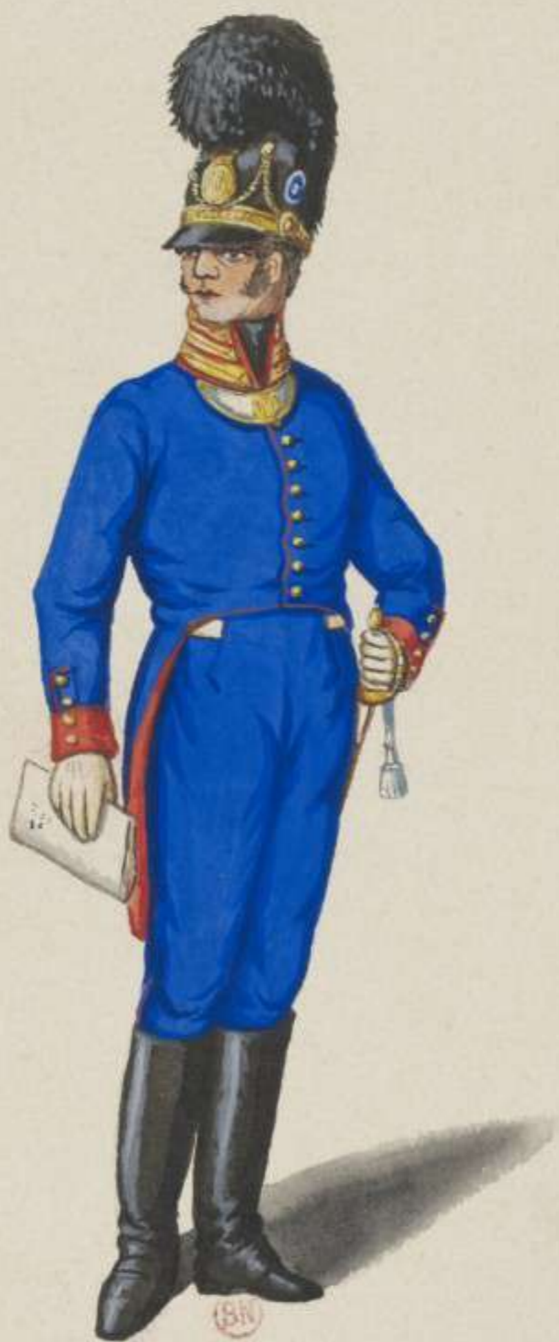
30 o - Infanterie Hauptmann im Frack - 1814