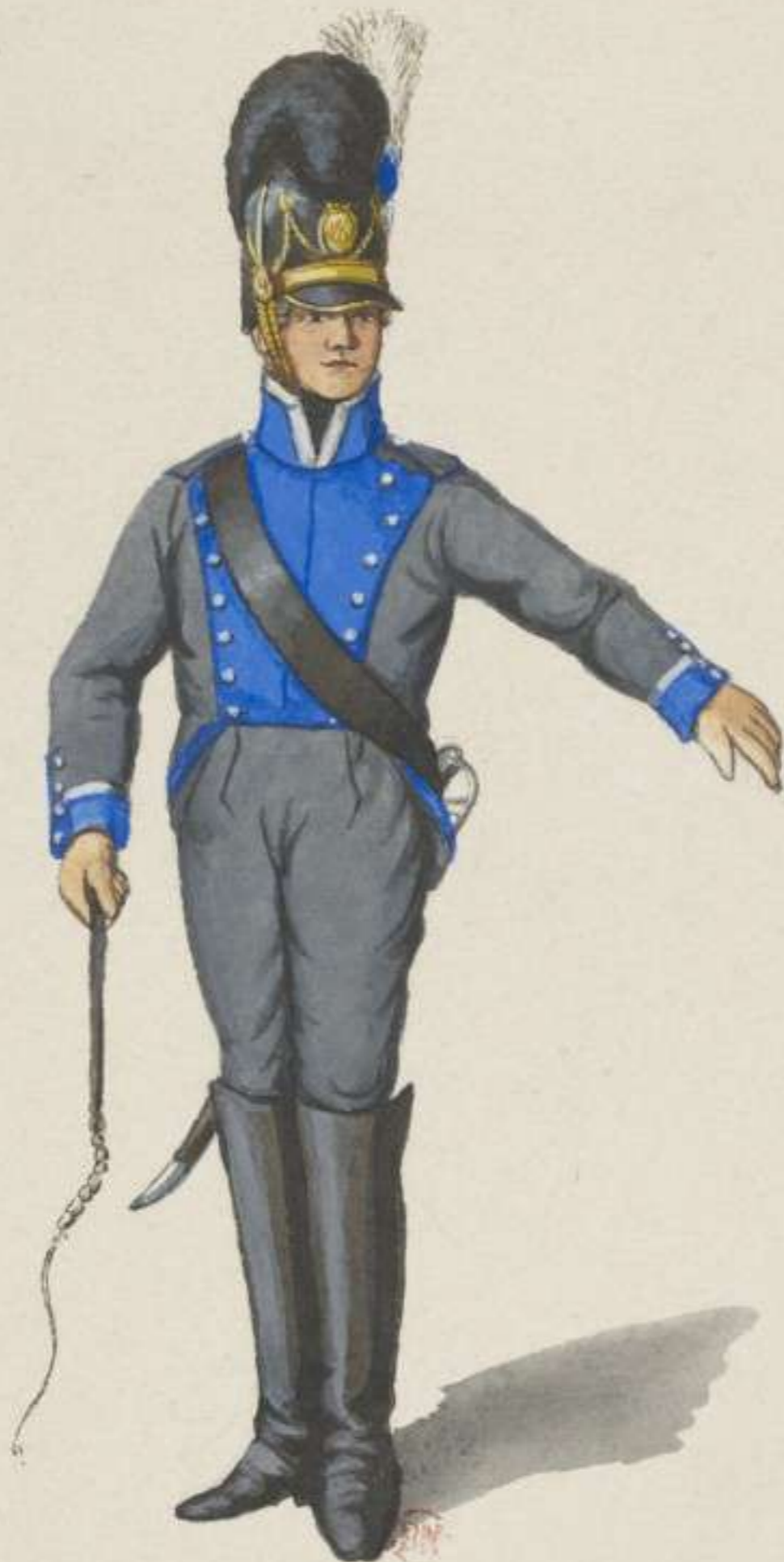
14 o - Korporal vom Fuhrwesen Bataillon - 1811