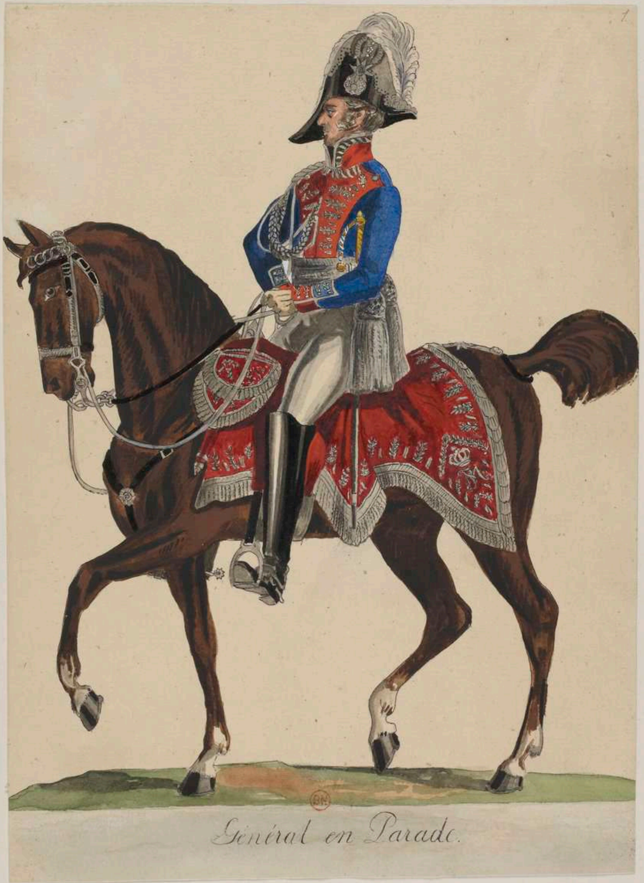
General en Parade.