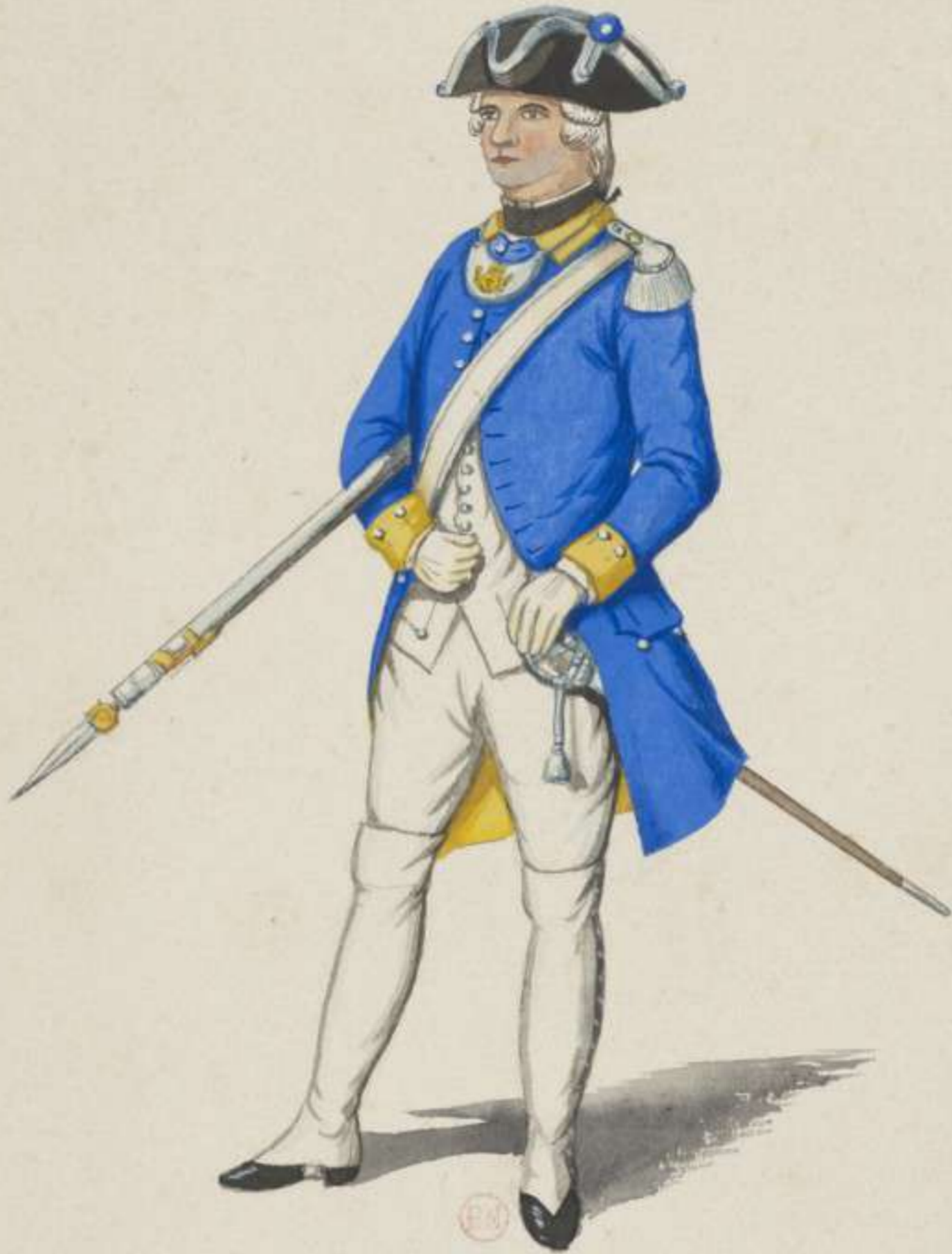
12 o - 7. Infanterie Regiment von der Osten - Grenadier Lieutenant