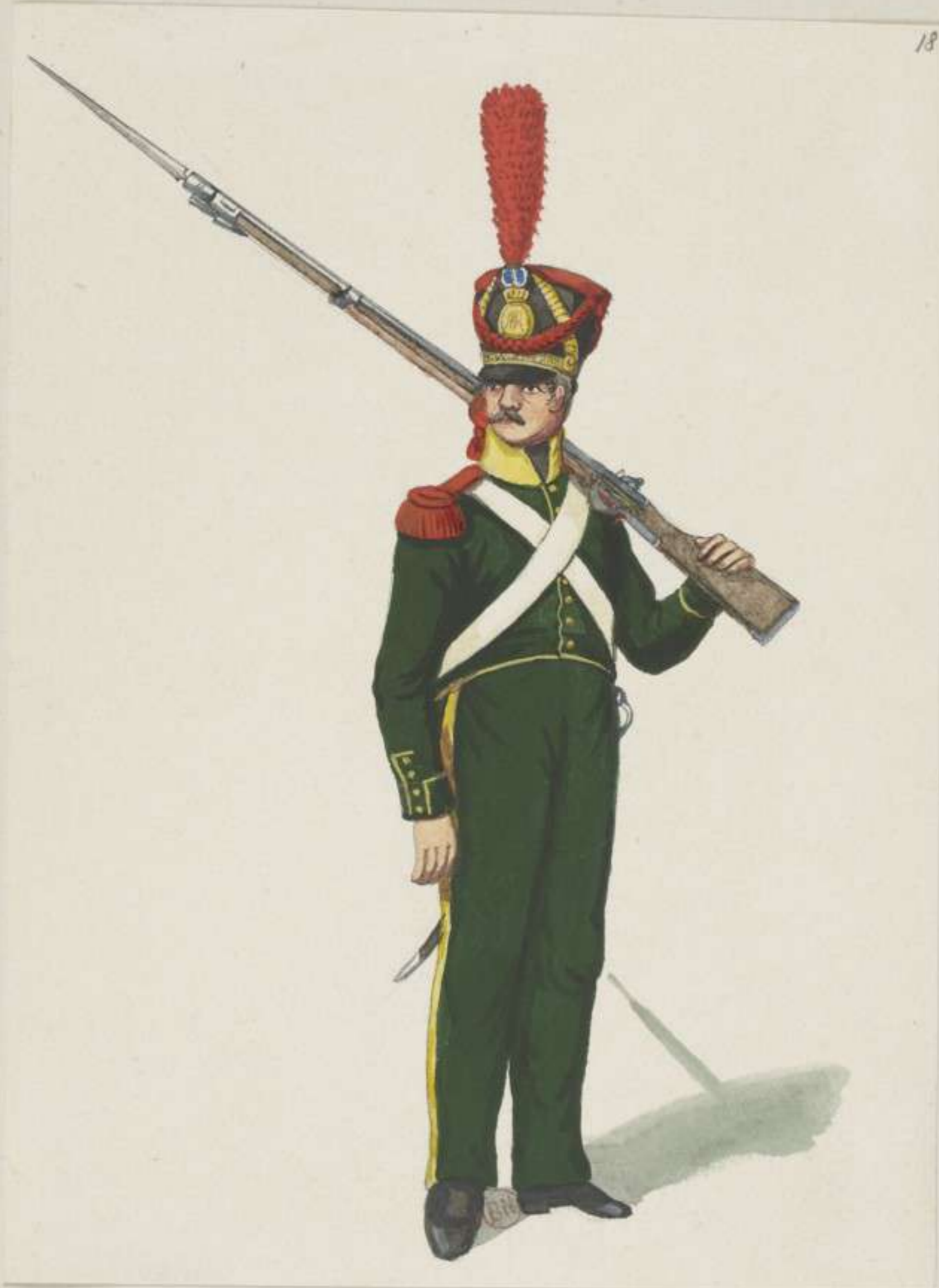
18 o - Baierische Freiwillige Jäger - Grenadier - 1813