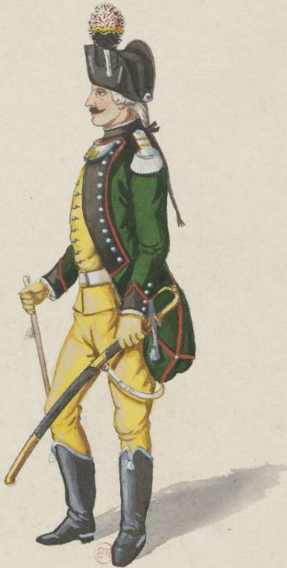
35°- Officier vom Bergischen Jäger Corps