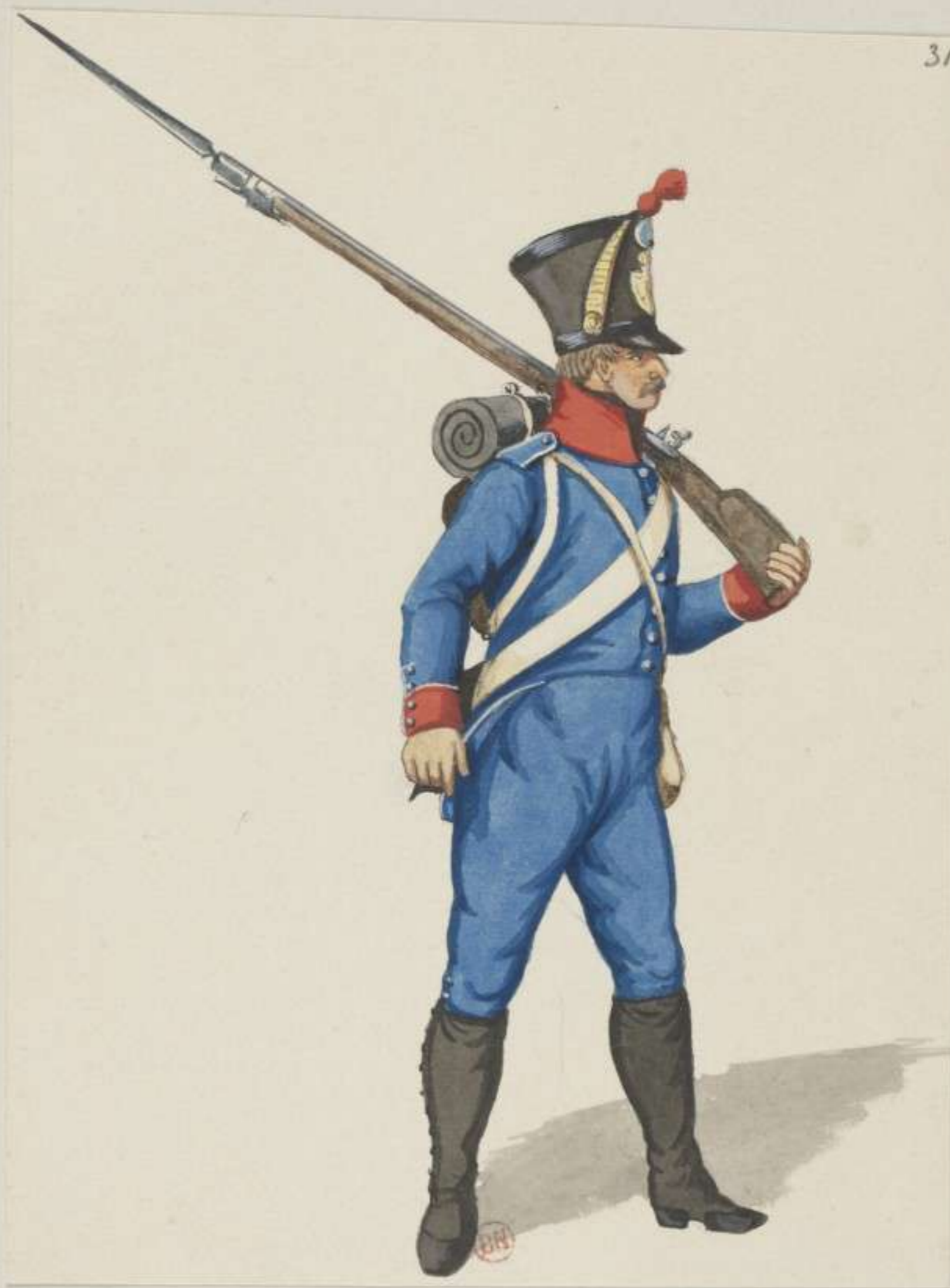
31 o - Baierische Mobile Legion - 1814