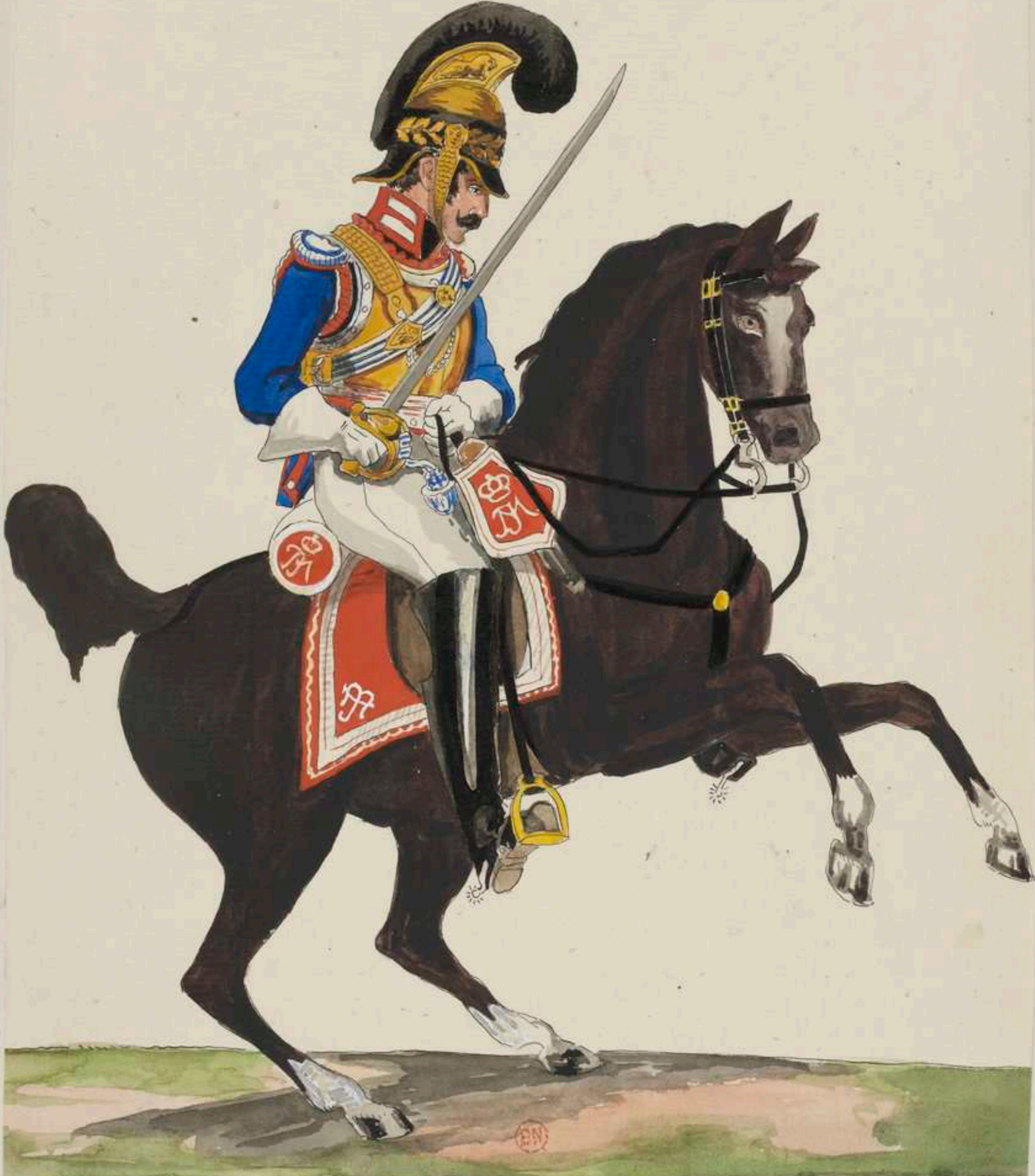
Lieutenant v Gardes du Corps