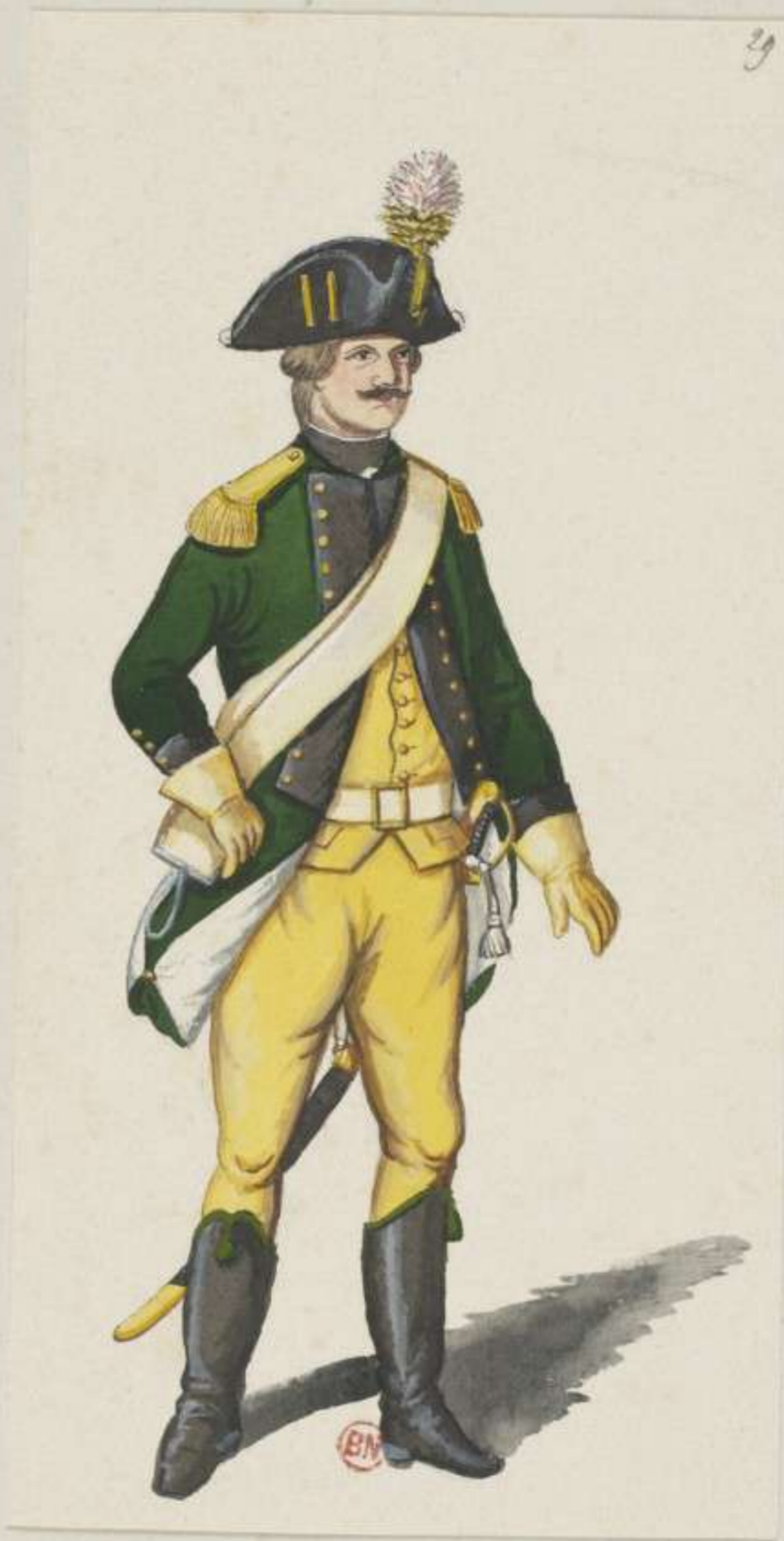
29 e . Leichtes Dragoner Corps im Herzogthum Jülich