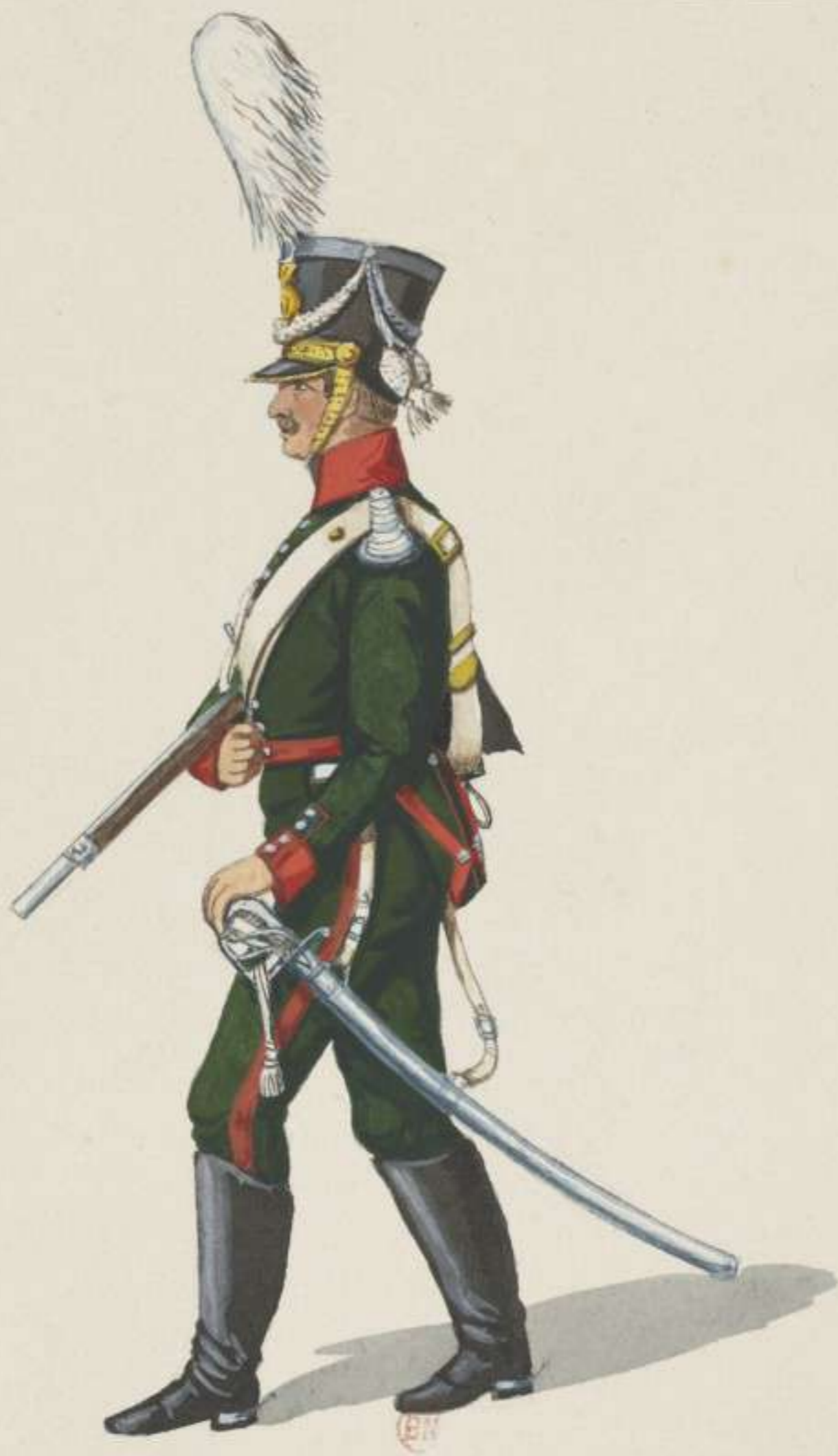
26°- Baierisches National Chevaulegers Regiment - 1813-1816