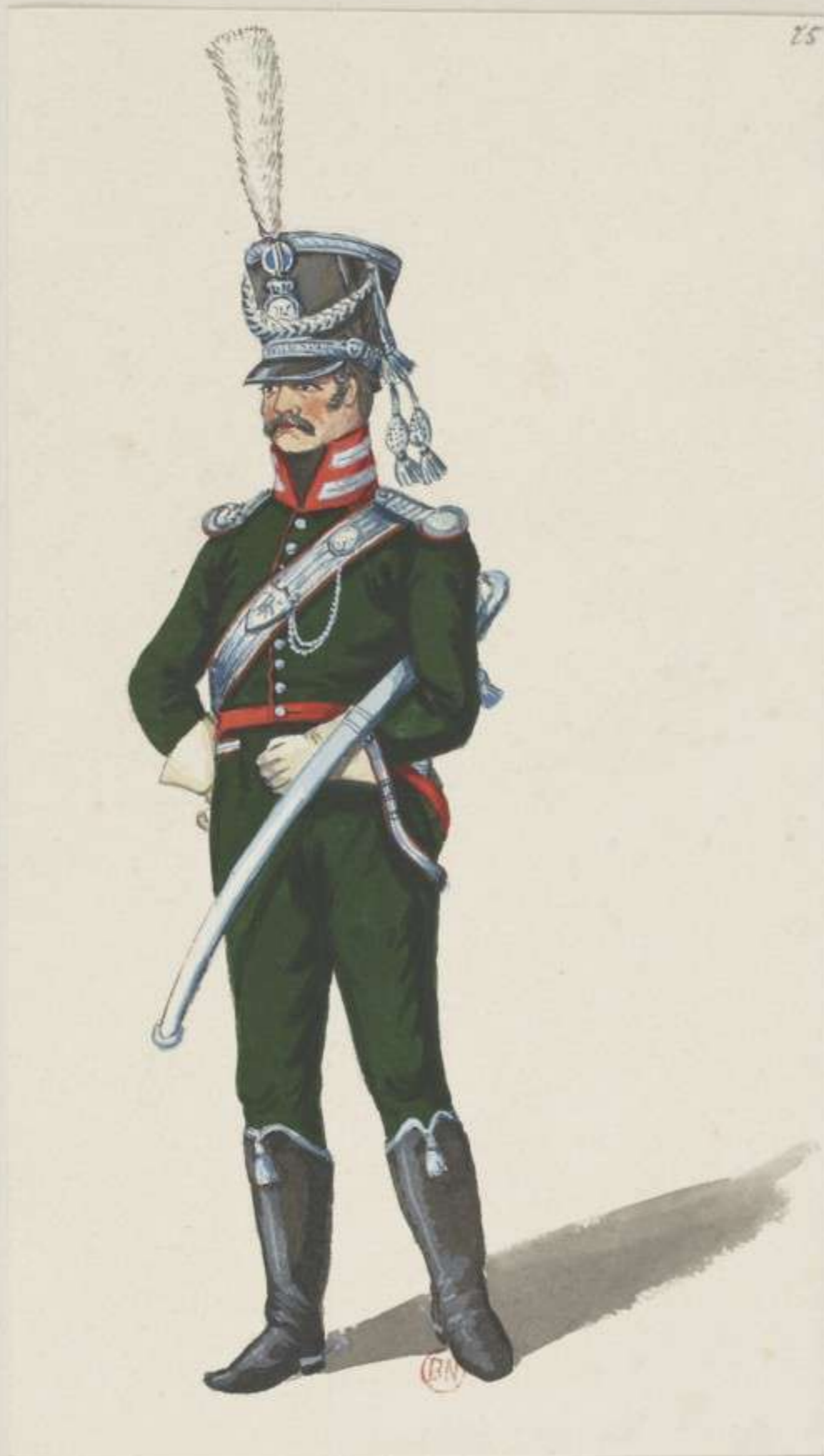
25°- Baierisches National Chevaulegers Regiment - Officier - 1813