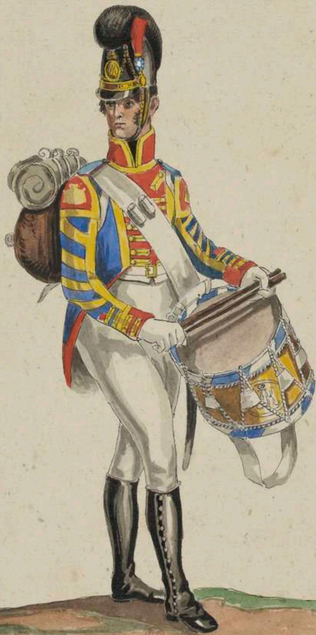
Tambour vom Regiment Kronprinz.