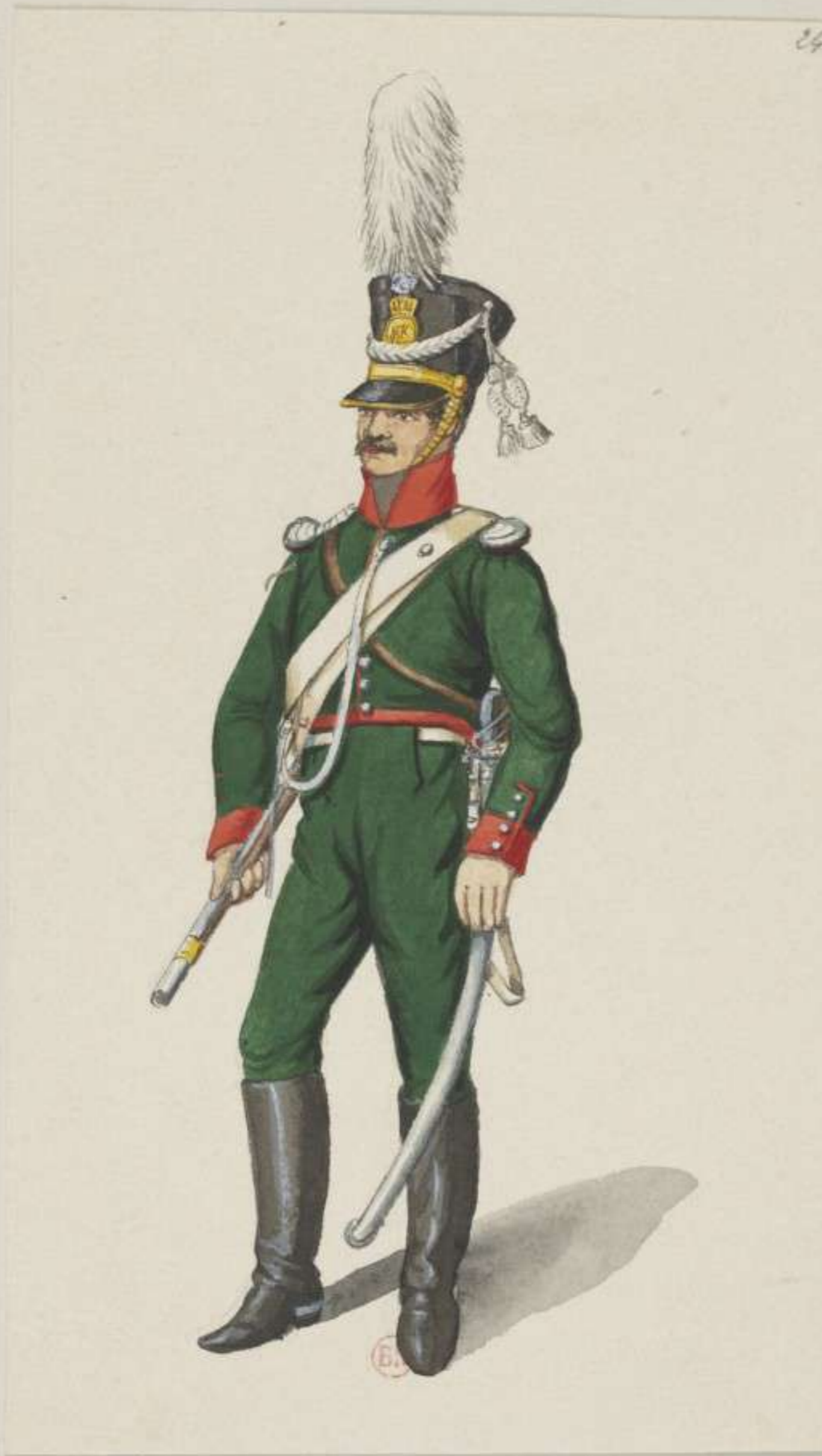
24°- 7. Chevaulegers Regiment Prinz Karl - 1813