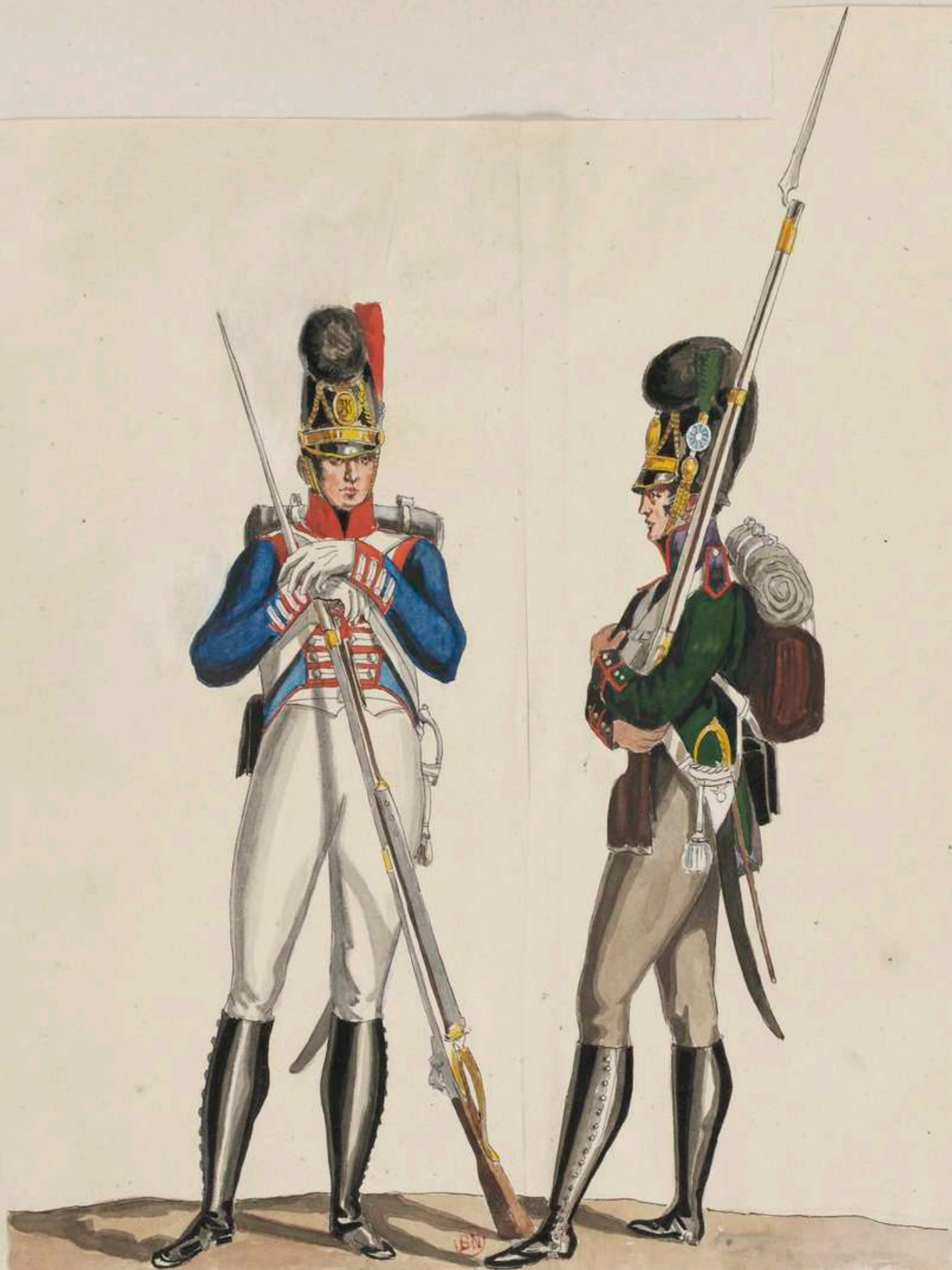
Unteroff. v. 1. Linien Inf. Leib-Regt.; Gemeiner d. 4. leicht. Inf. (Bat.)