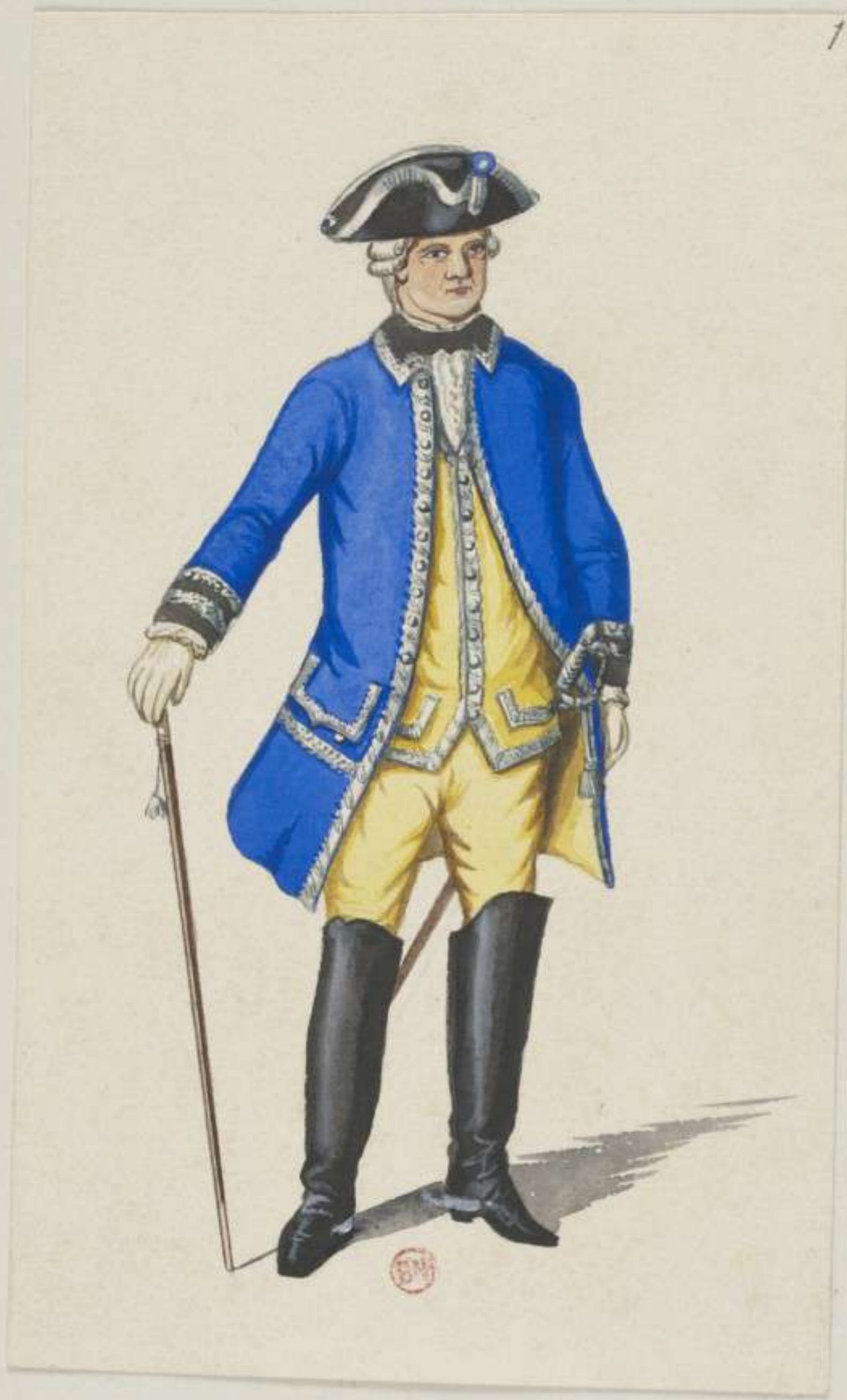
1° - General