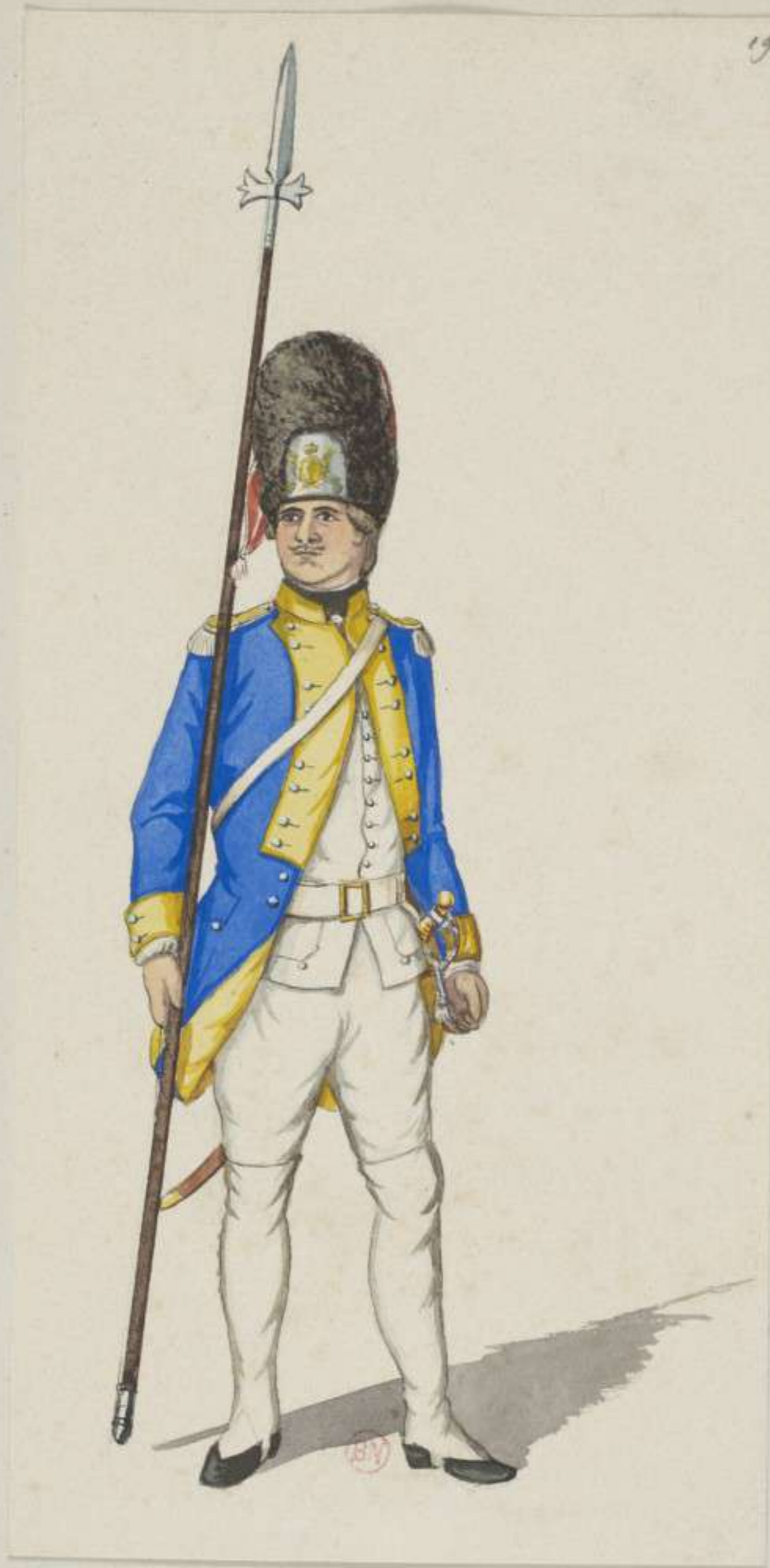
19°- 18. Infanterie Regiment von Weichs - Grenadier Unter Officer