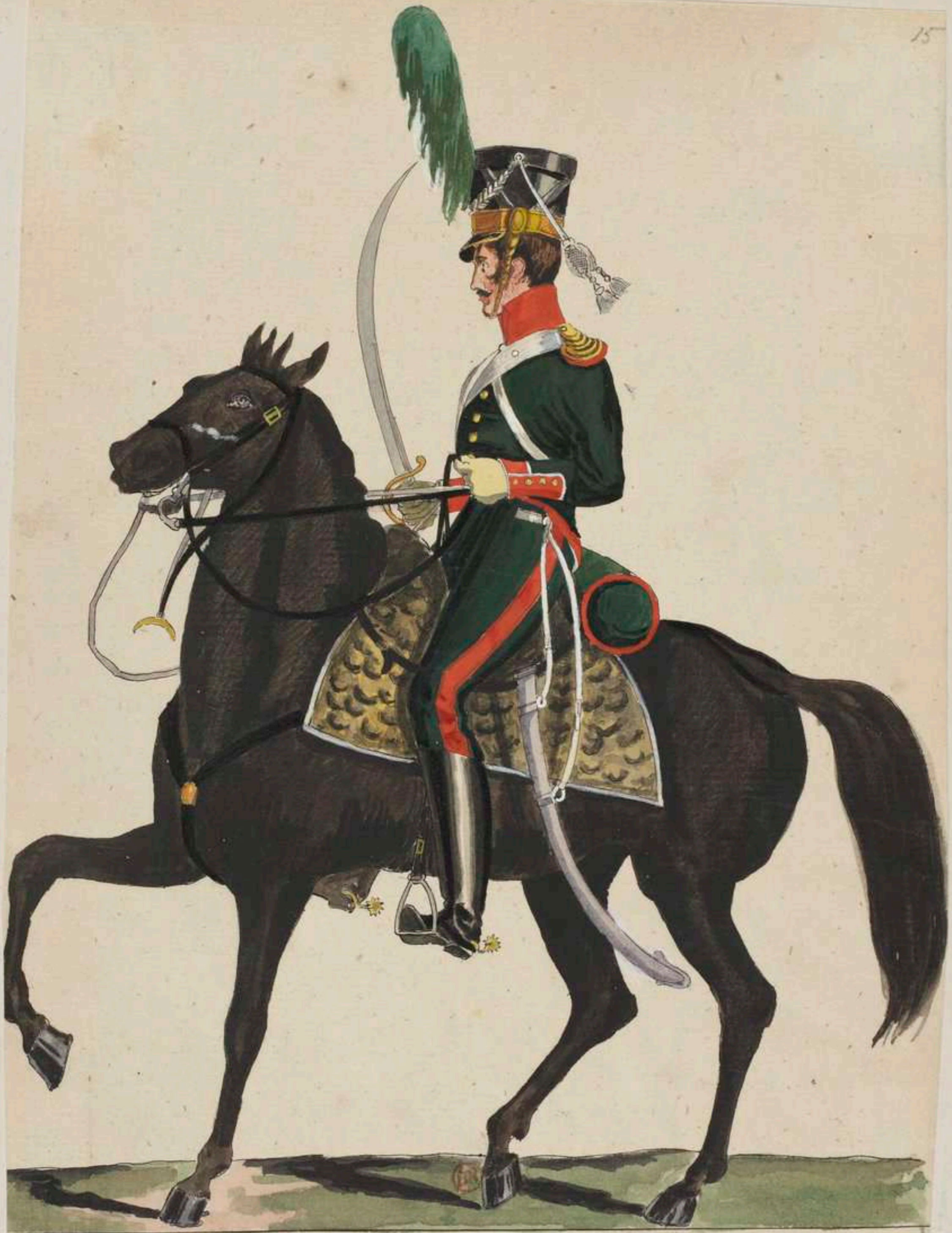
Soldat v. National-Chevaulegers,