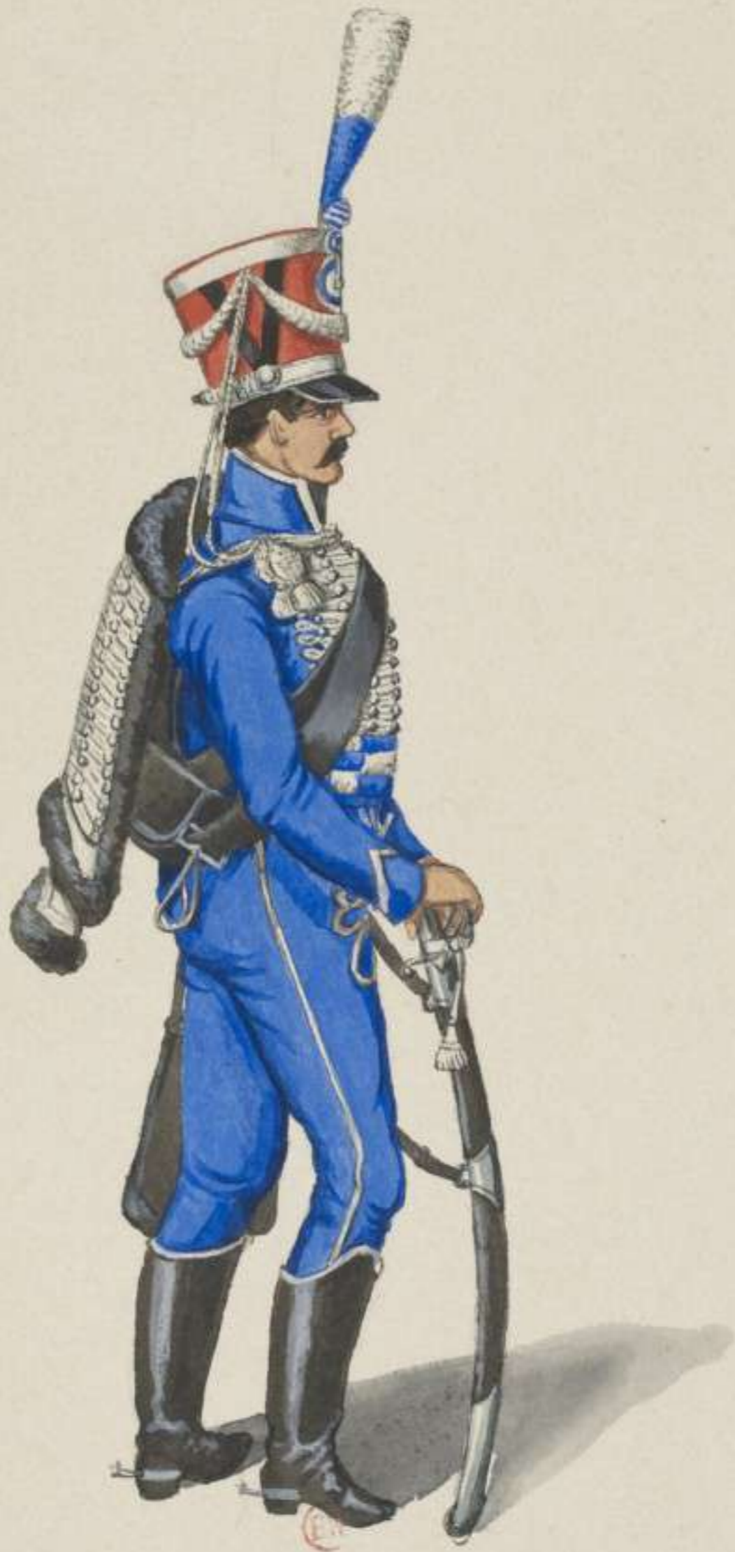
22 o - 2. Husaren Regiment - 1813