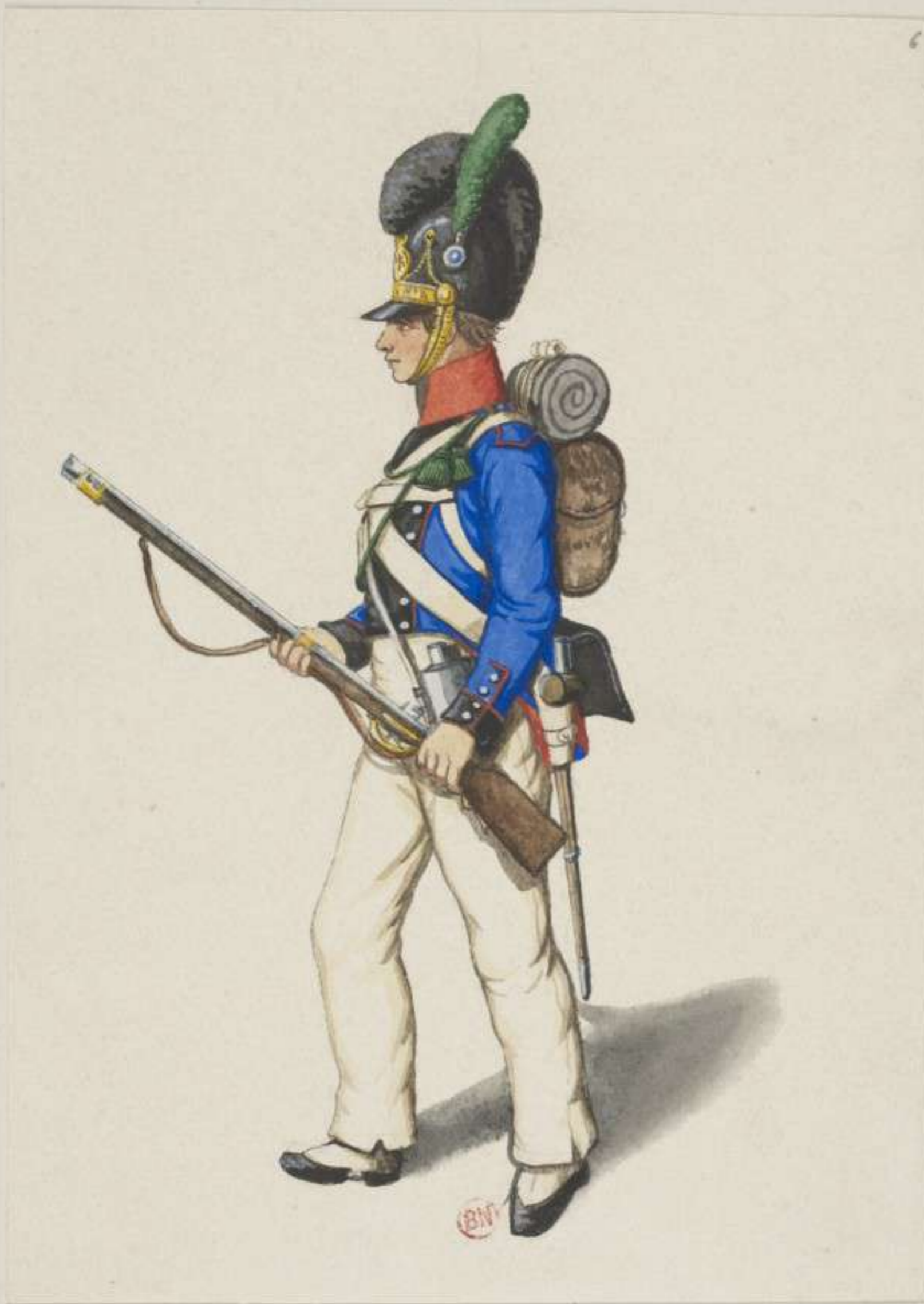
6° - Schütze vom 11. Infanterie Regiment Kinkel - 1811-1813