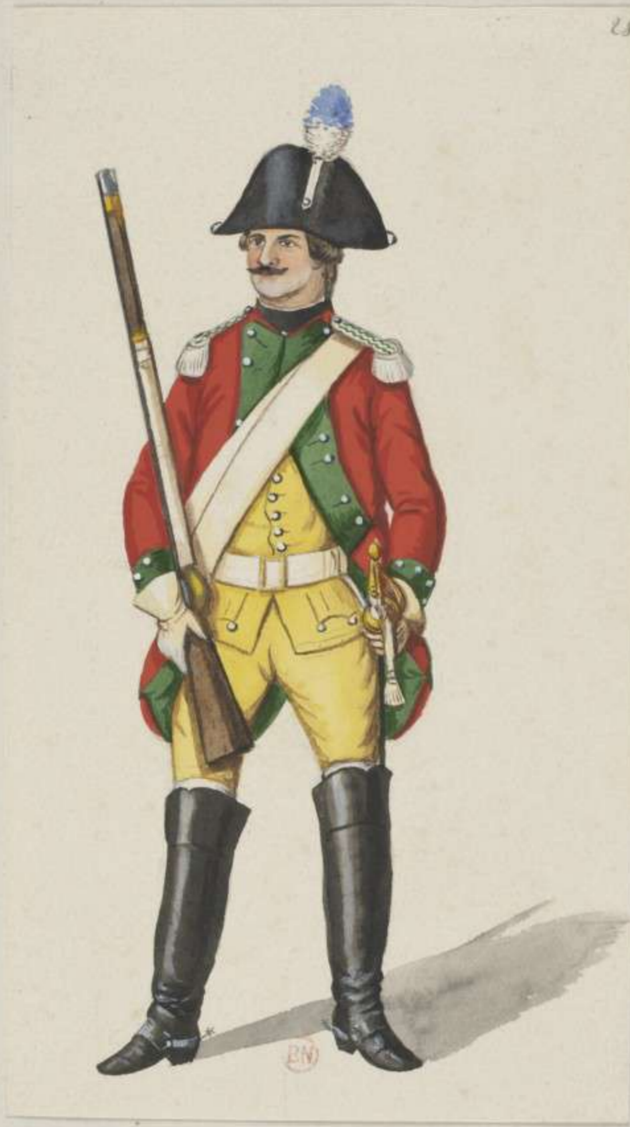
28 c - 4. Dragoner Regiment Leiningen