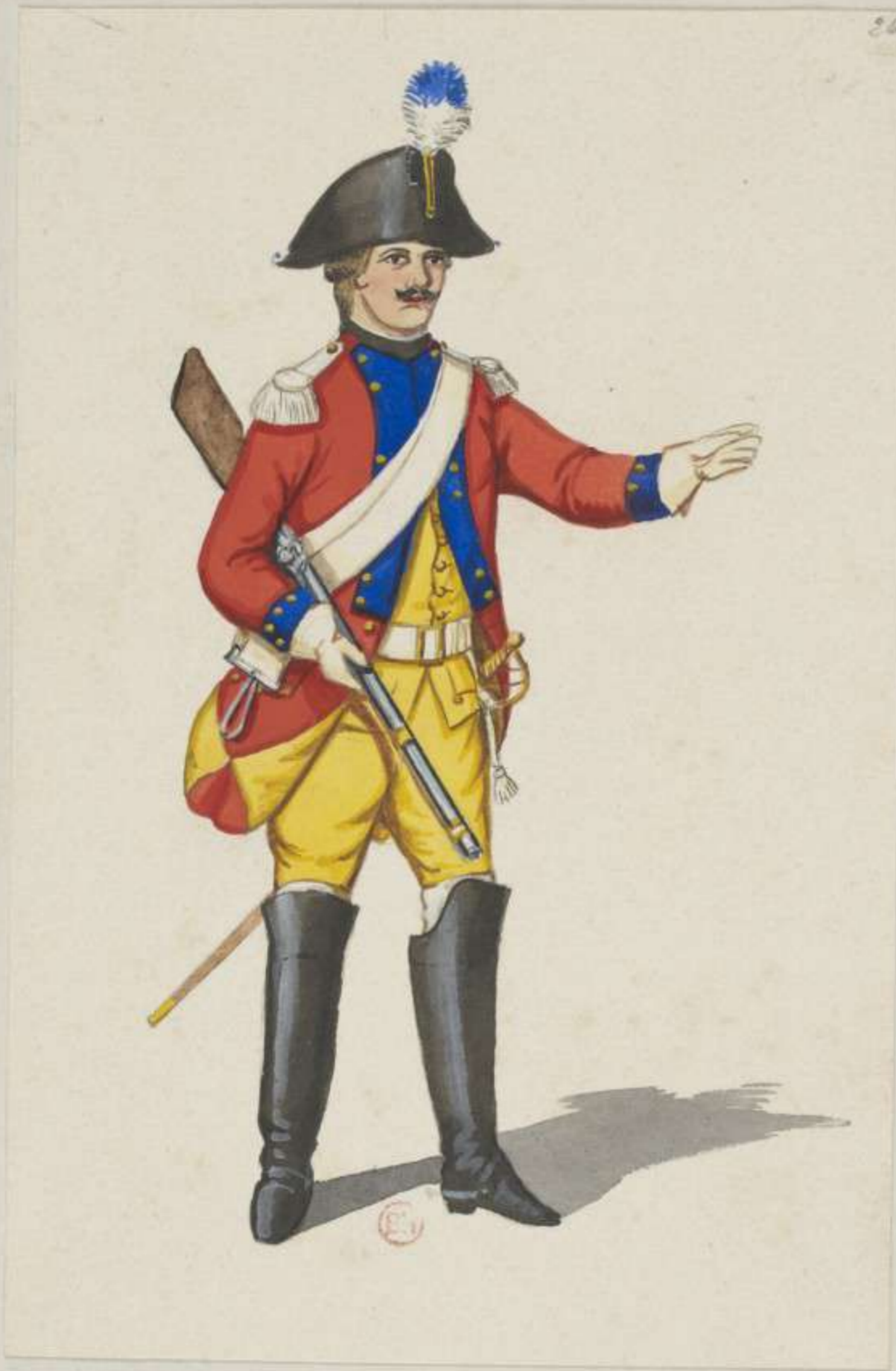
26°- 2. Dragoner Regiment La Rosée