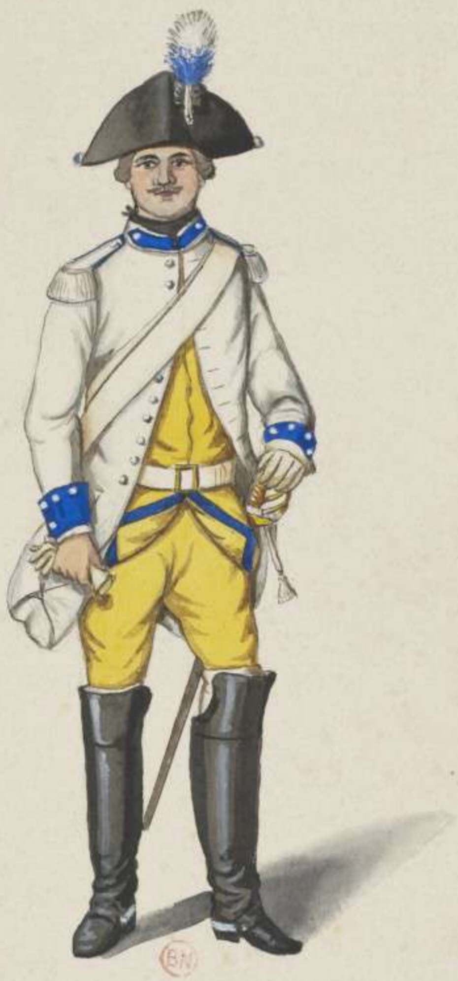
22 o - Cuirassier vom 2. Regiment von Thurn