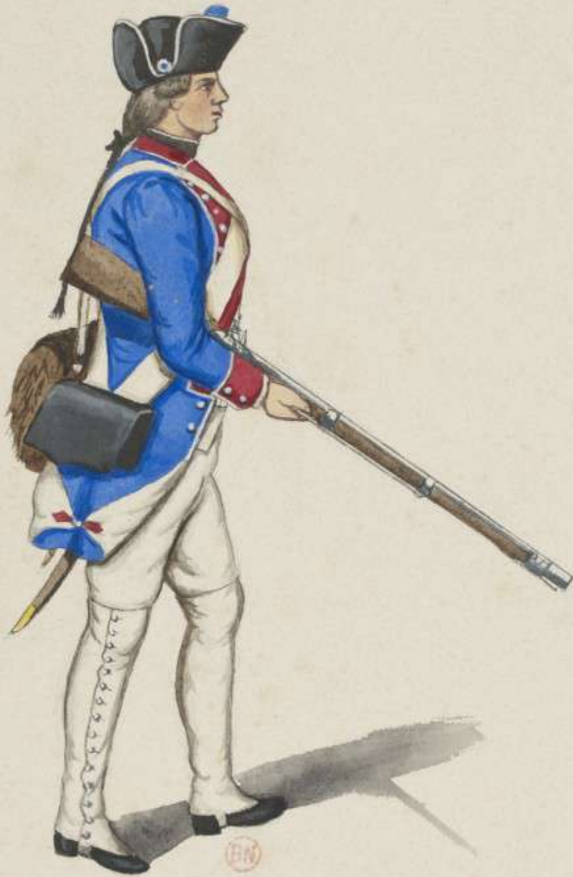
18°- 16. Infanterie Regiment von Preysing