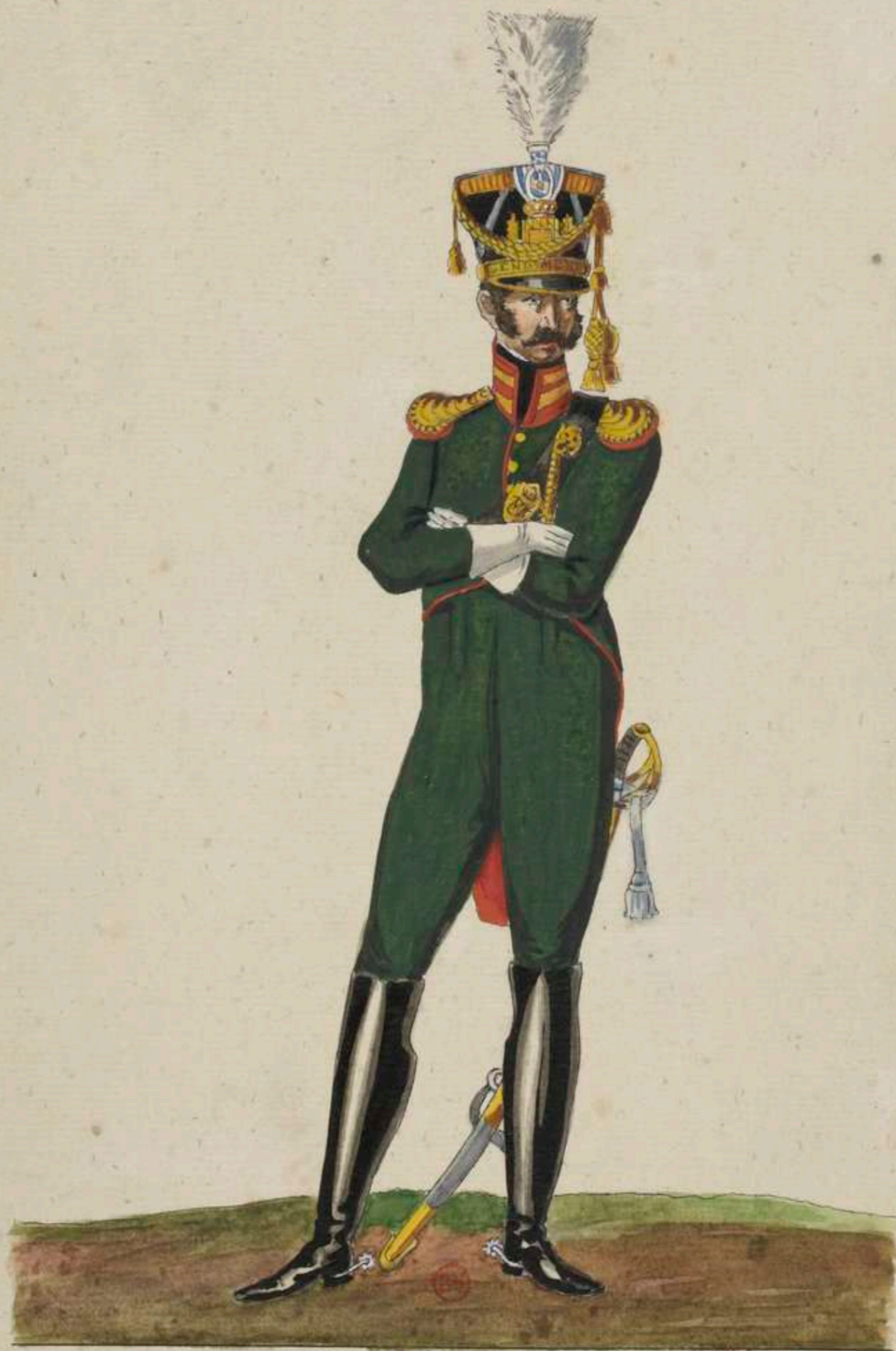
Commandant des Gendarmes.