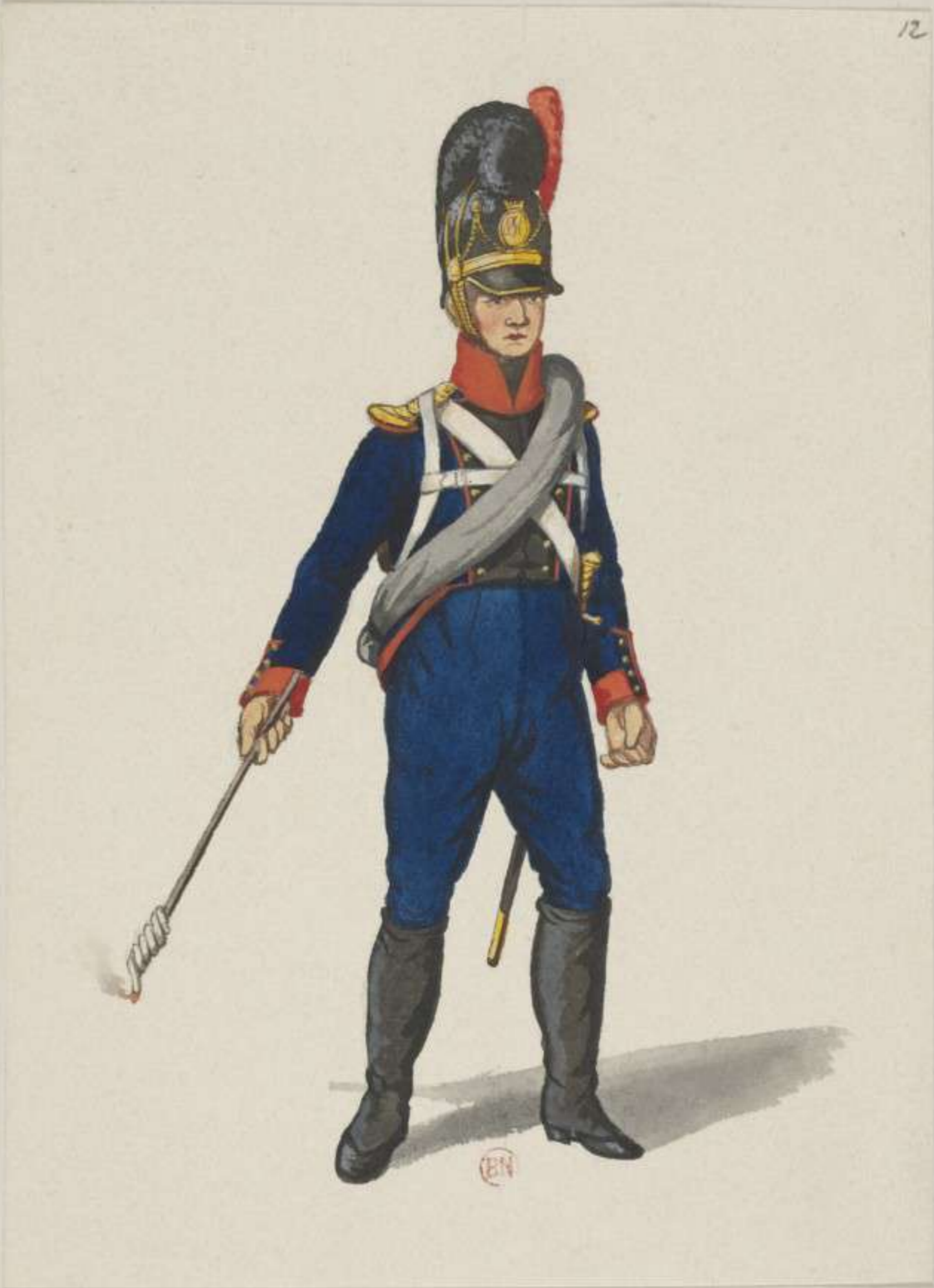
12 o - Fuss Artillerie - 1811