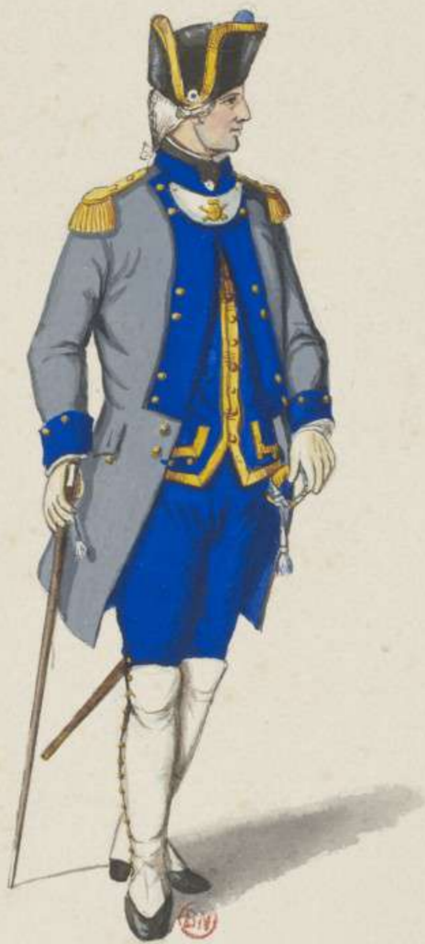
30 e - Stabs Officier der Artillerie