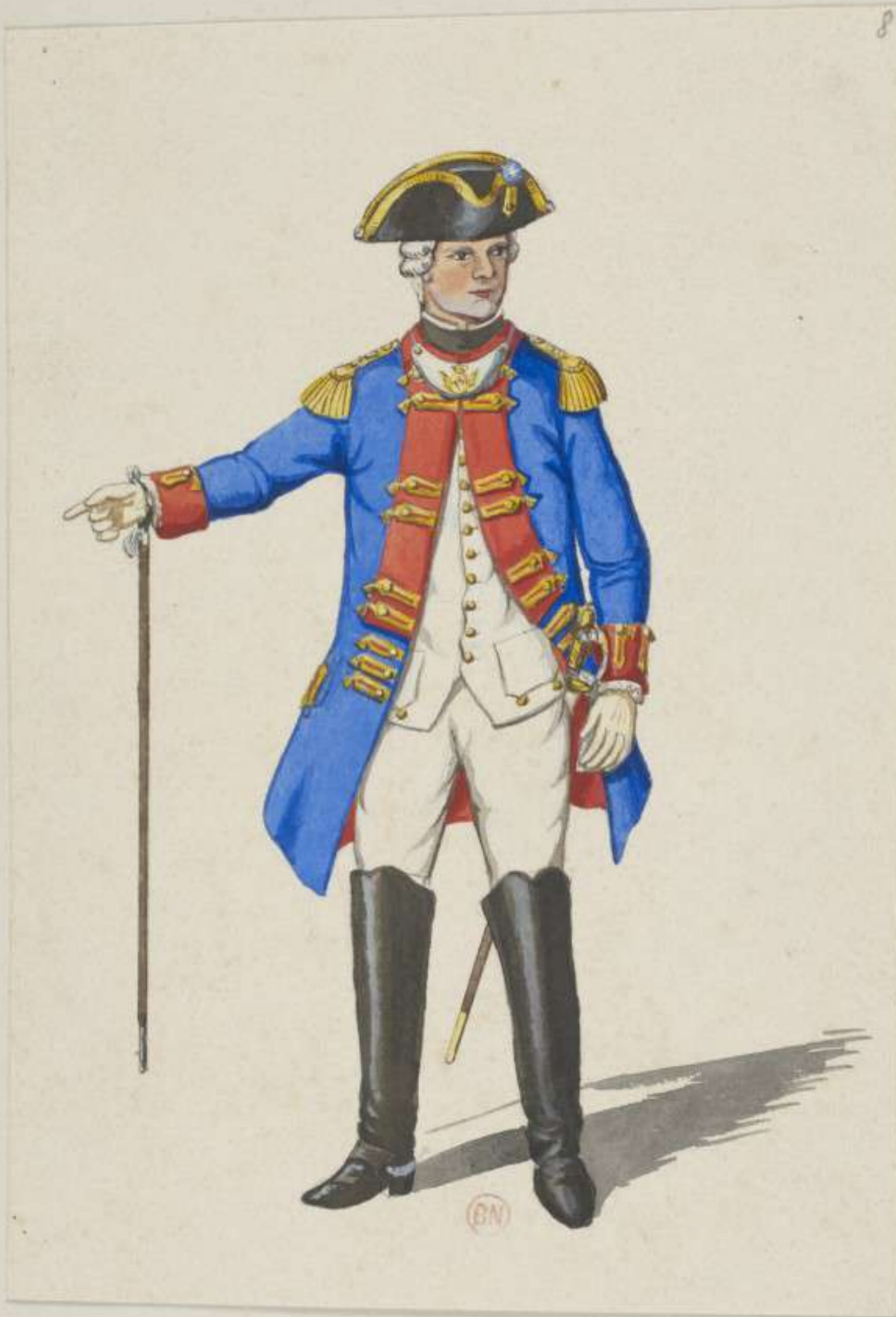
8° - Stabs Officier vom 1. Leib Infanterie Regiment