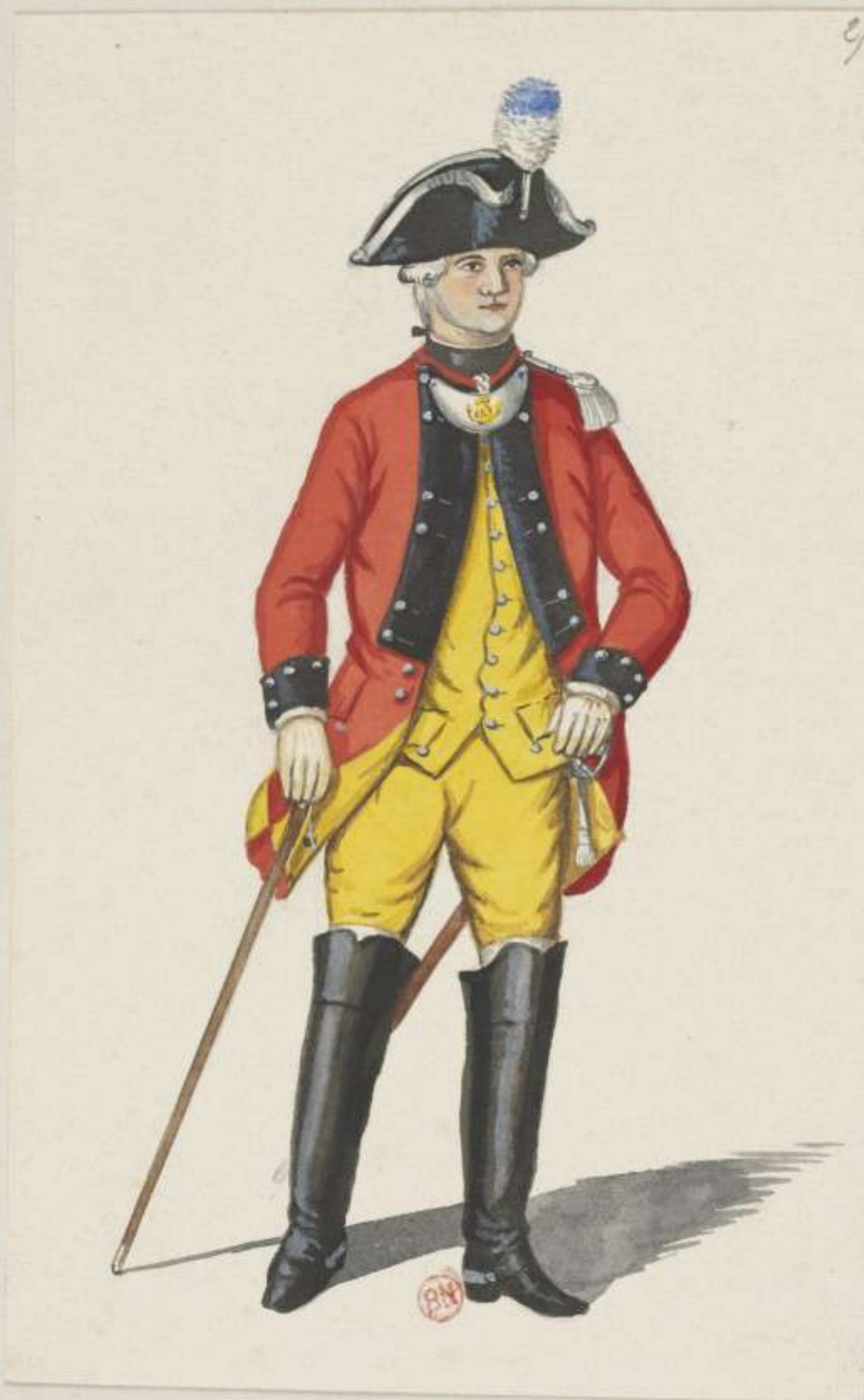
27°- 3. Dragoner Regiment von Wahl - Lieutenant