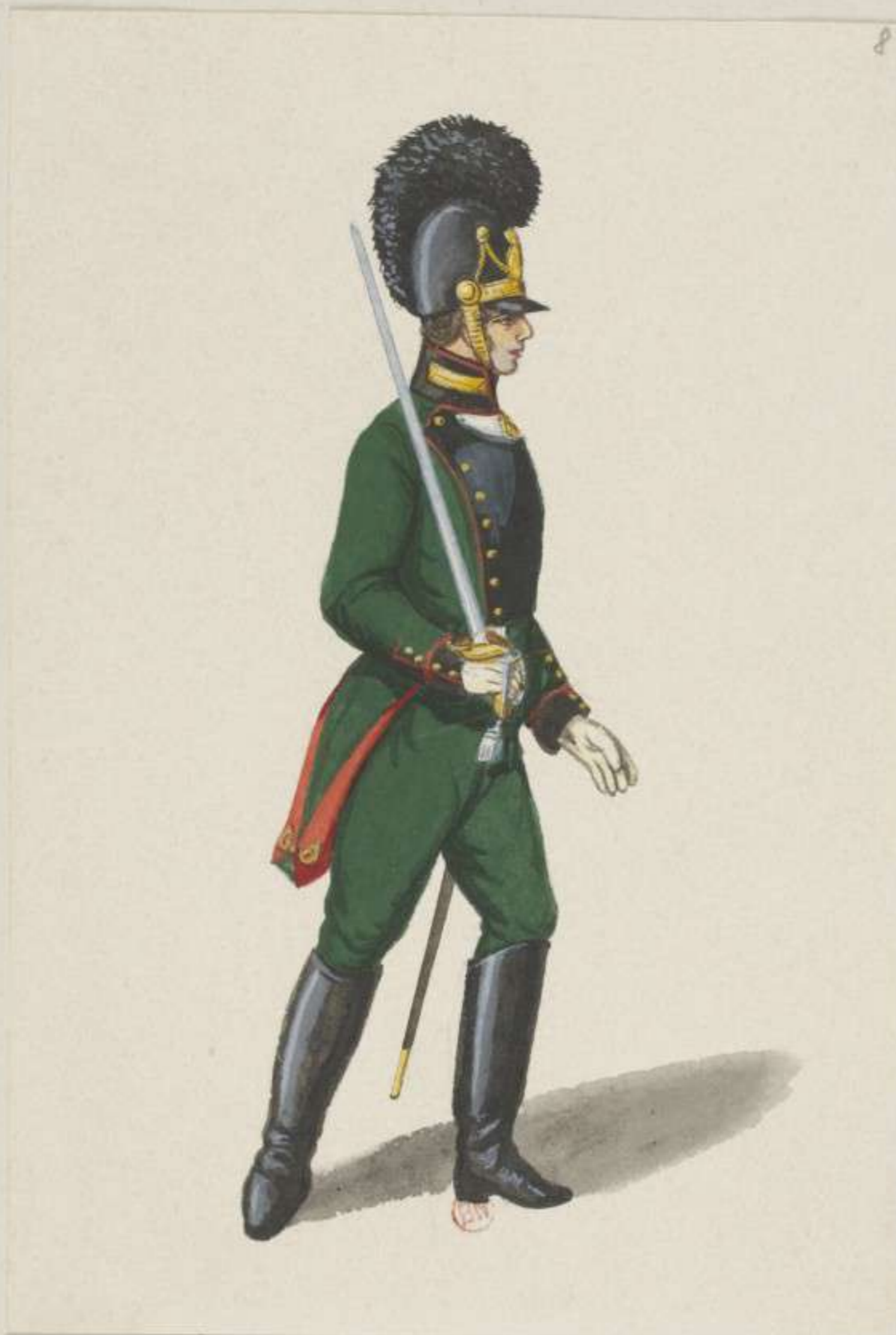
8° - Leichte Infanterie - 4. Bataillon Theobald - 1811