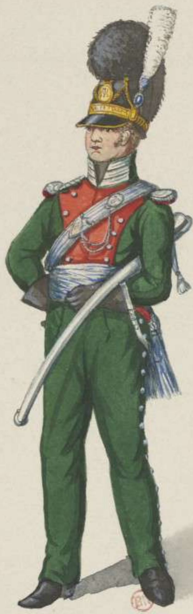
15 o - Rittmeister vom 1. Chevaulegers Regiment - 1812