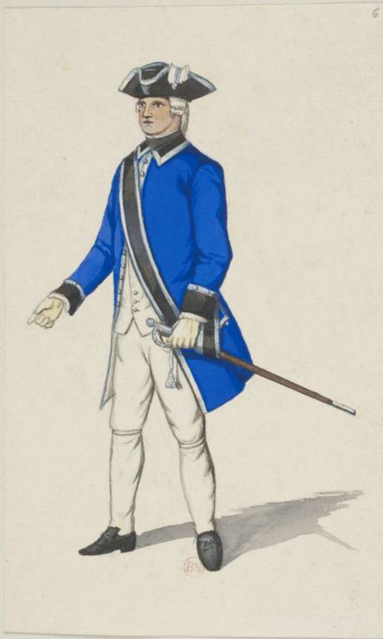
6° - Leibgarde der Trabanten