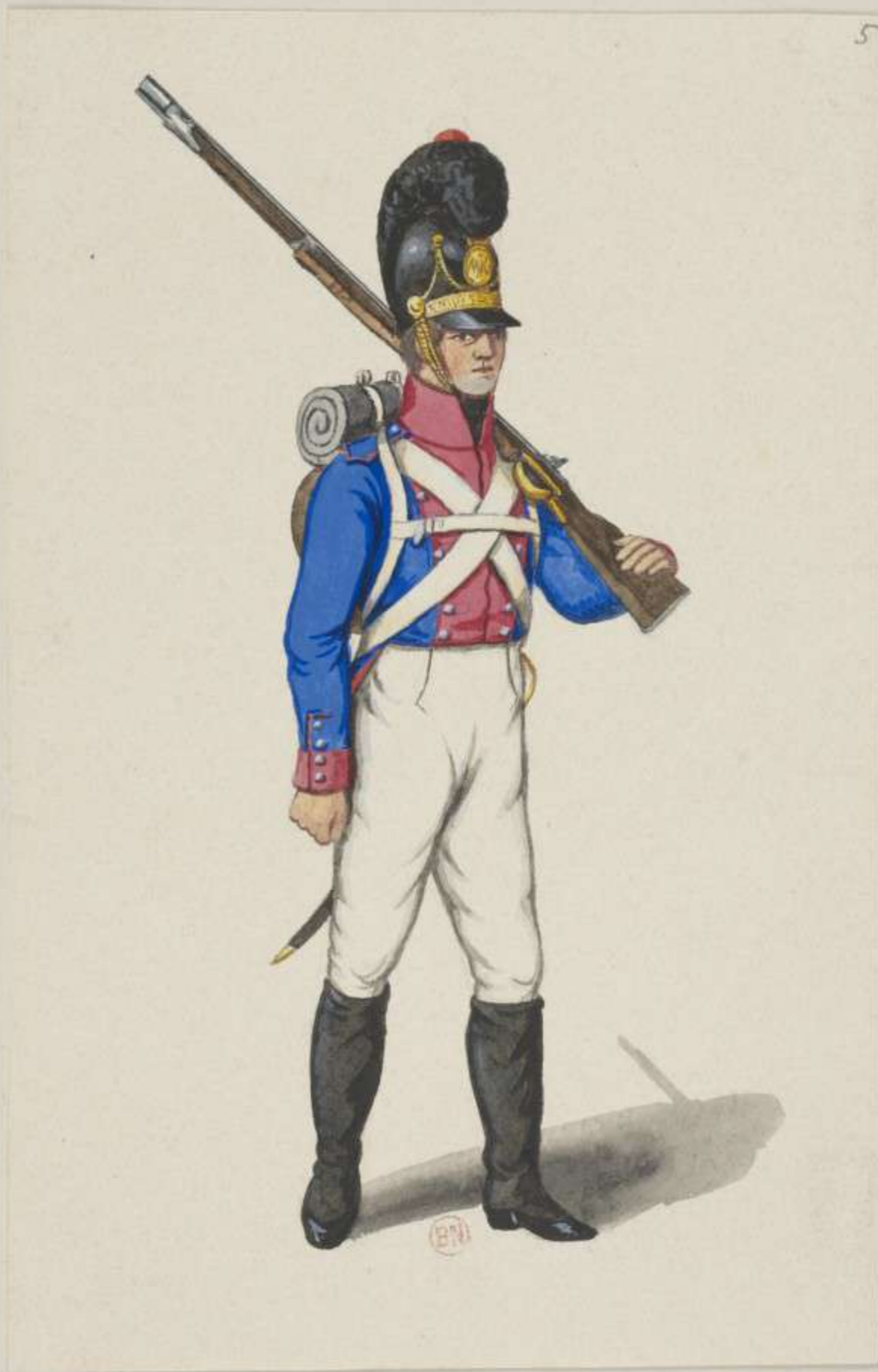
5° - Grenadier vom 5. Infanterie Regiment Preysing - 1811