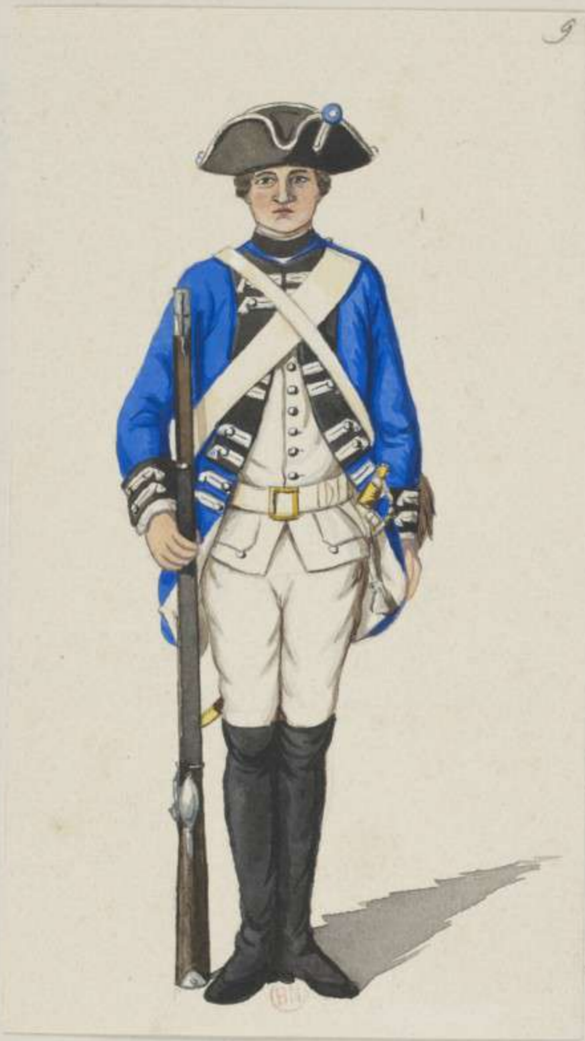
9° - 2. Infanterie Regiment Churprinz - Füsilier