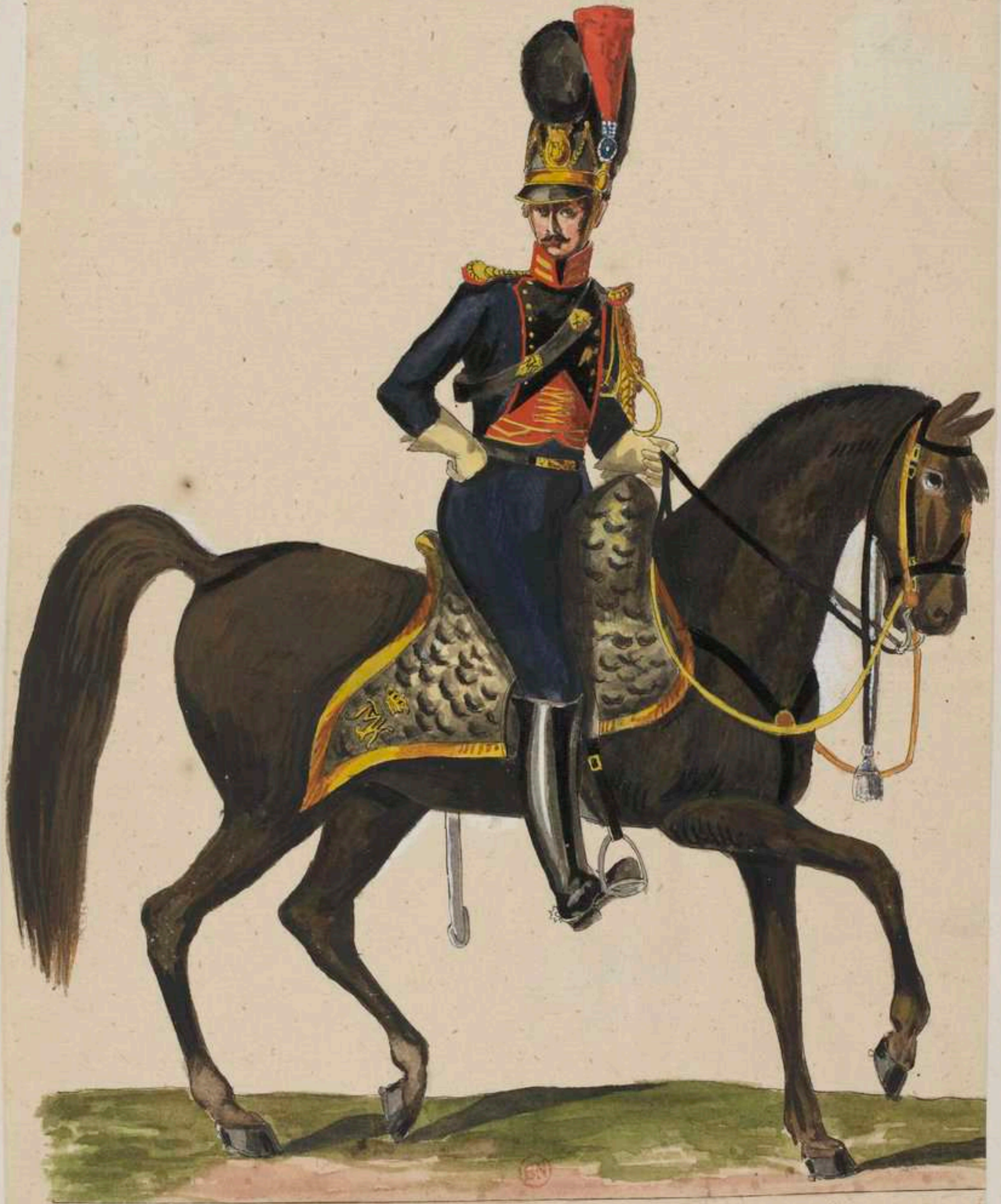
Lieutenant de l'Artillerie a cheval.