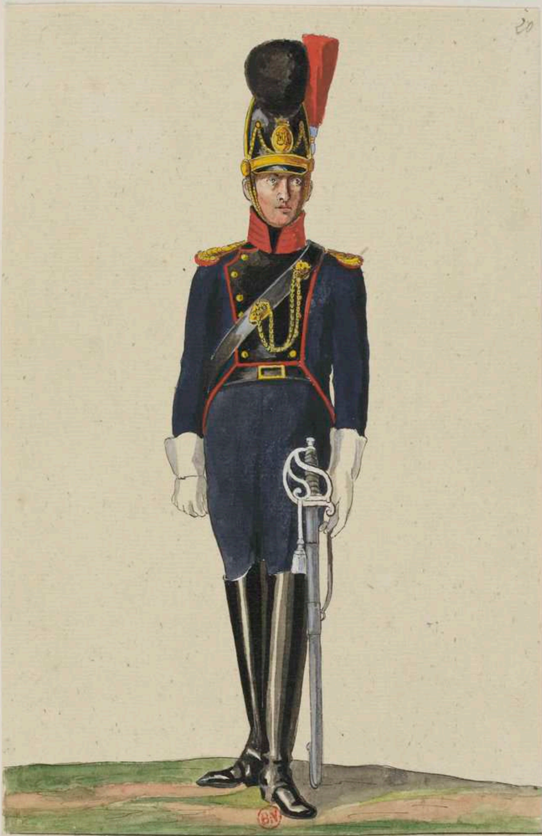
Soldat d. reitenden Artillerie