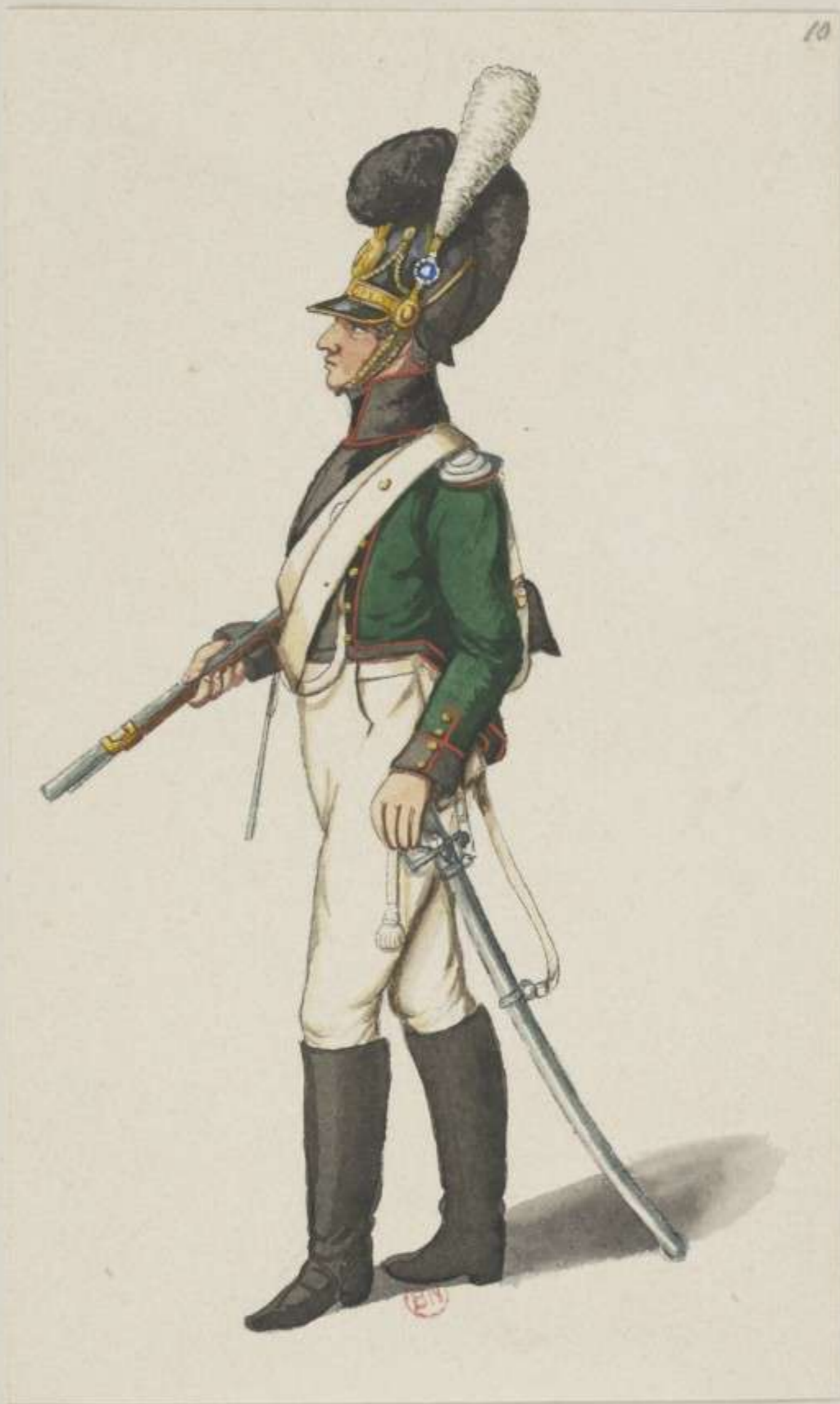
10 o - 3. Chevaulegers Regiment Kronprinz - 1811