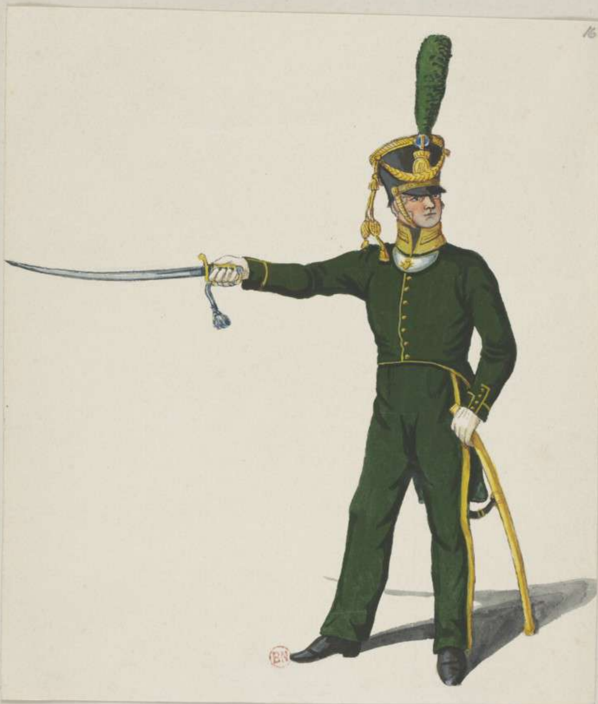
16°- Baierische Freiwillige Jäger zu Fuss - Officier - 1813