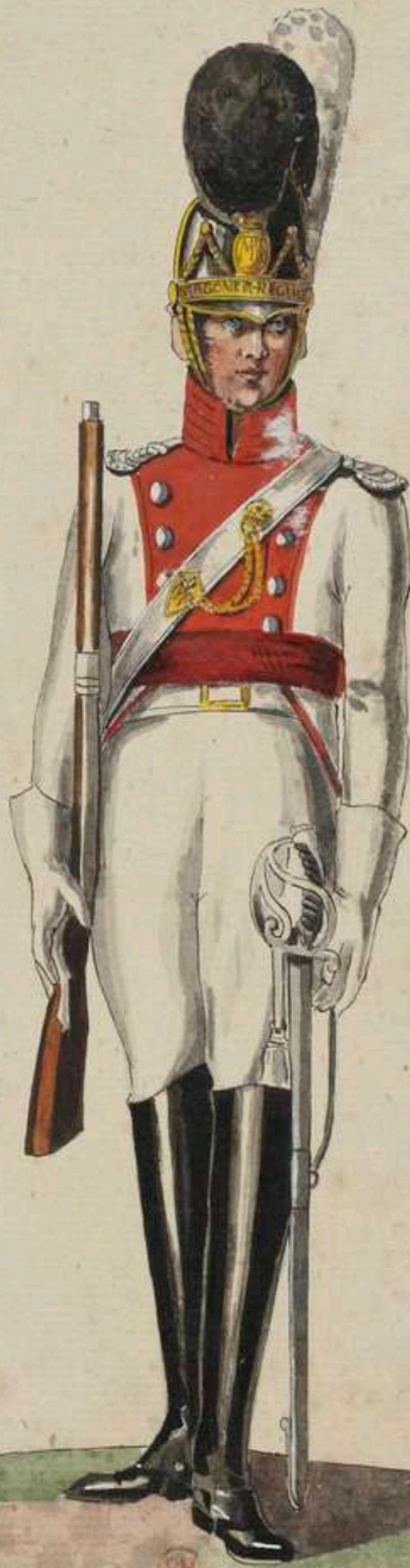
Dragoner u. 2. Dragoner-Regt. Jaxis