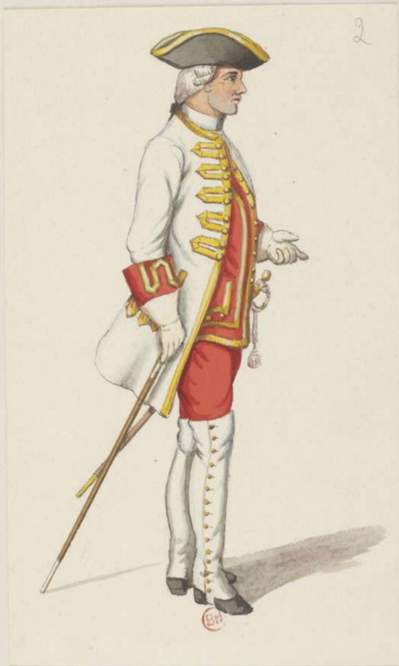
2° - General Major - 1735-1753