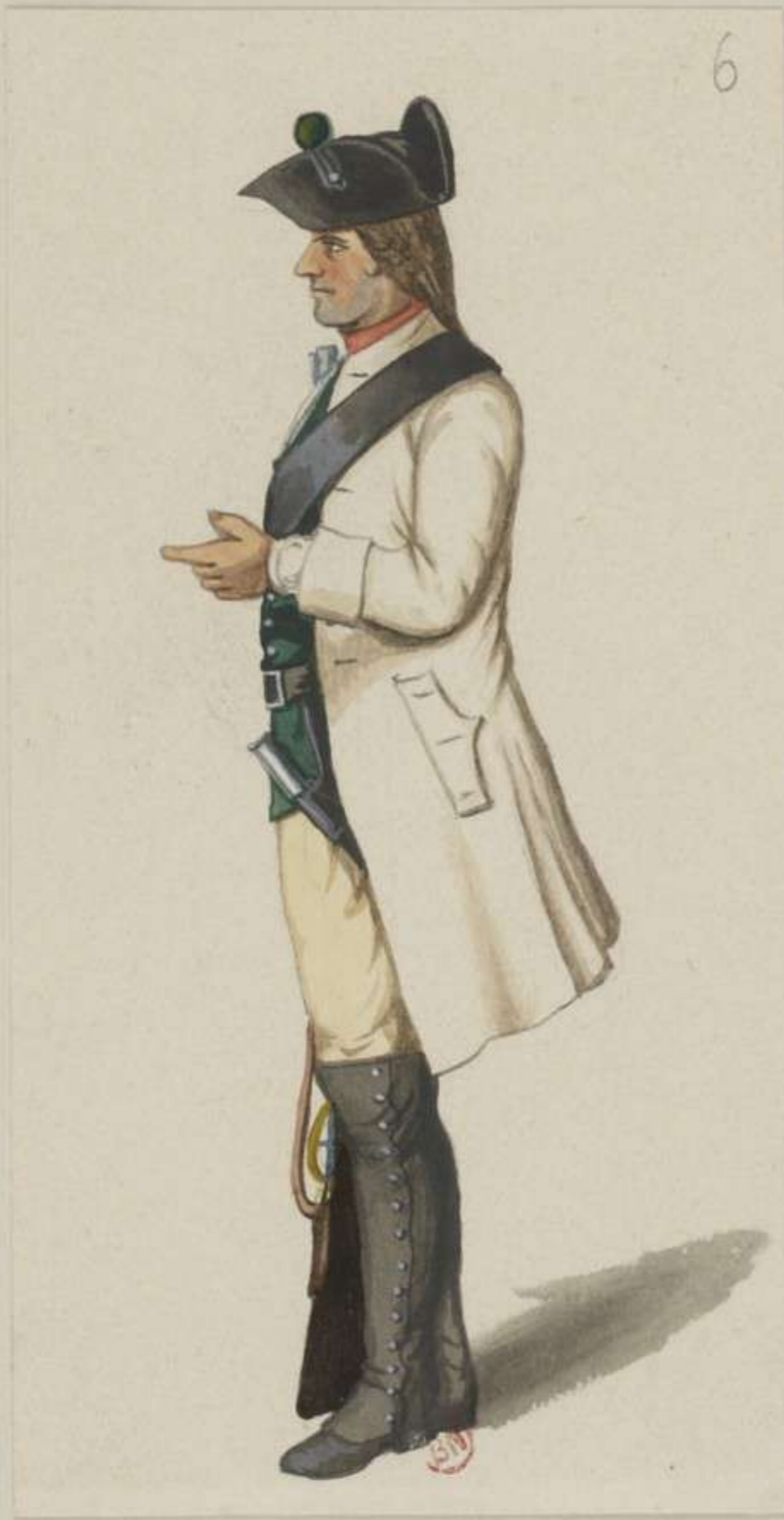
6° - 4. Kreis Regiment Freiberg - 1758