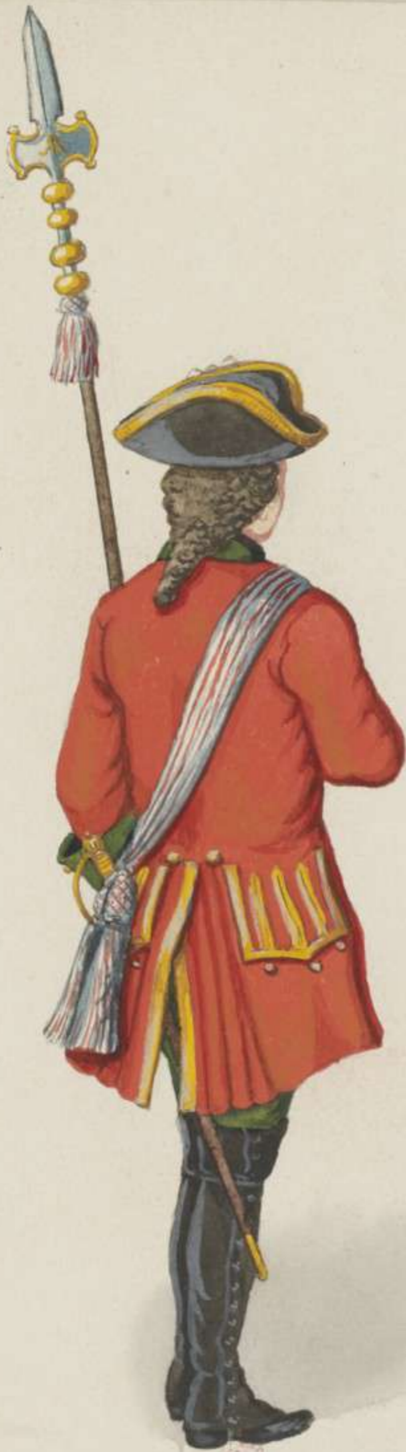
24 o - Muskettier Officier vom Regiment Friesen - 1717