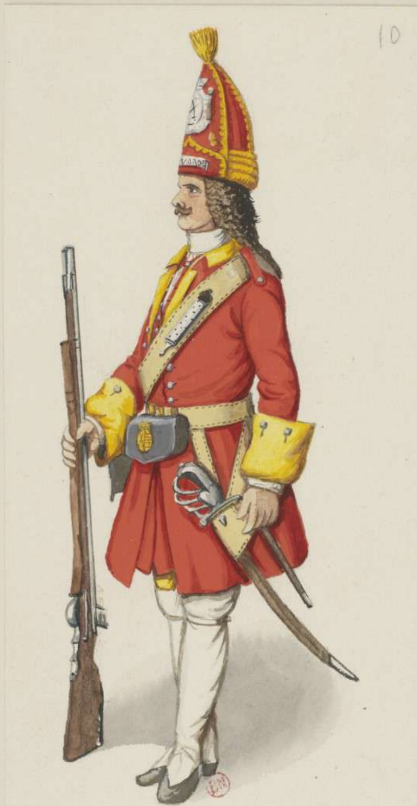
10° - Grenadier der Sächsischen oder Ersten Garde - 1701