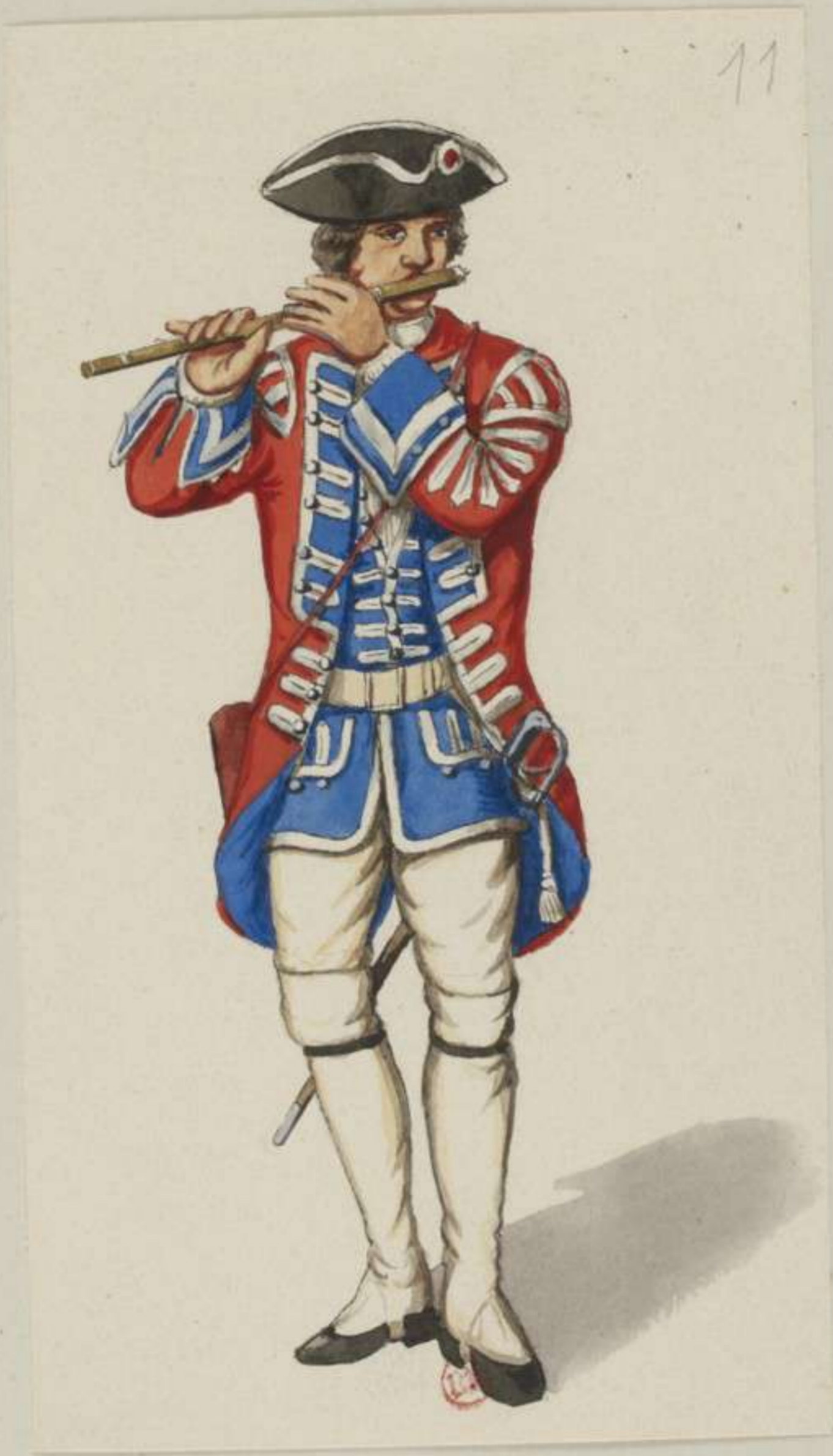
II o - Infanterie Regiment Löwendahl