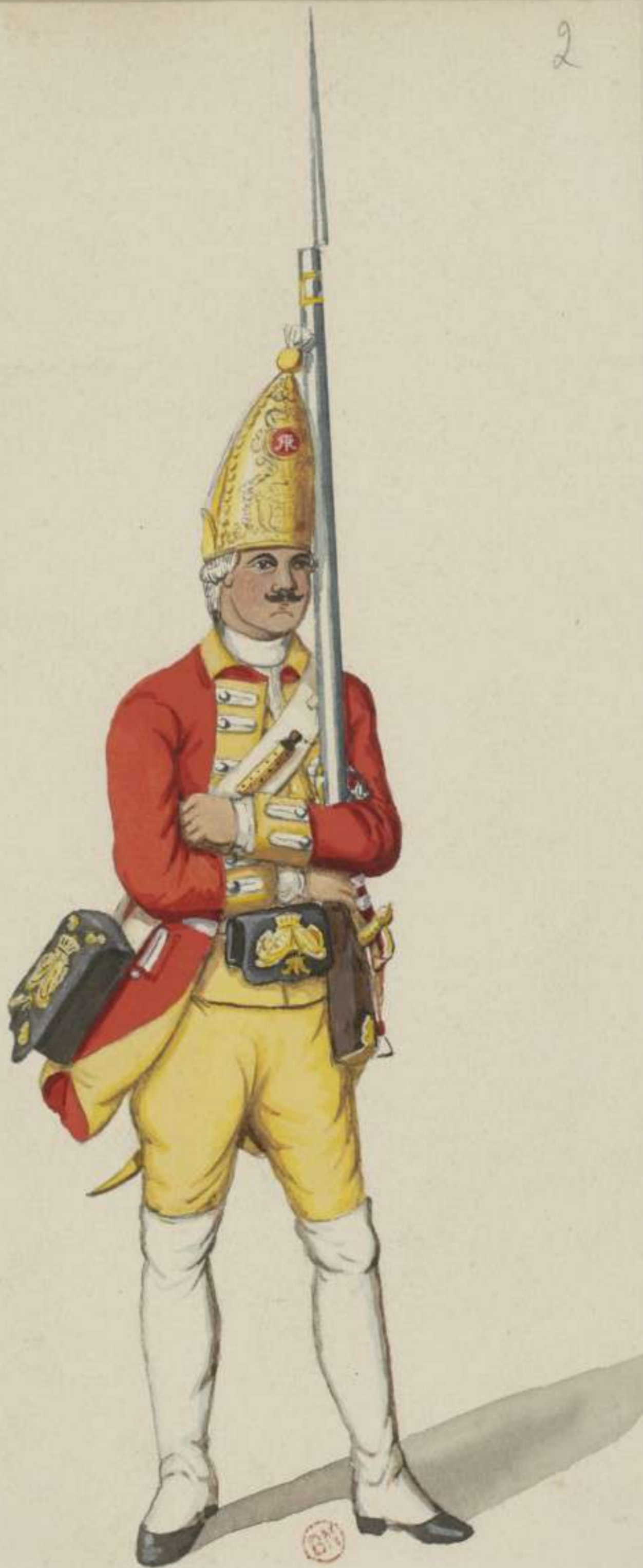
2° - Leibgarde Grenadier - 1750