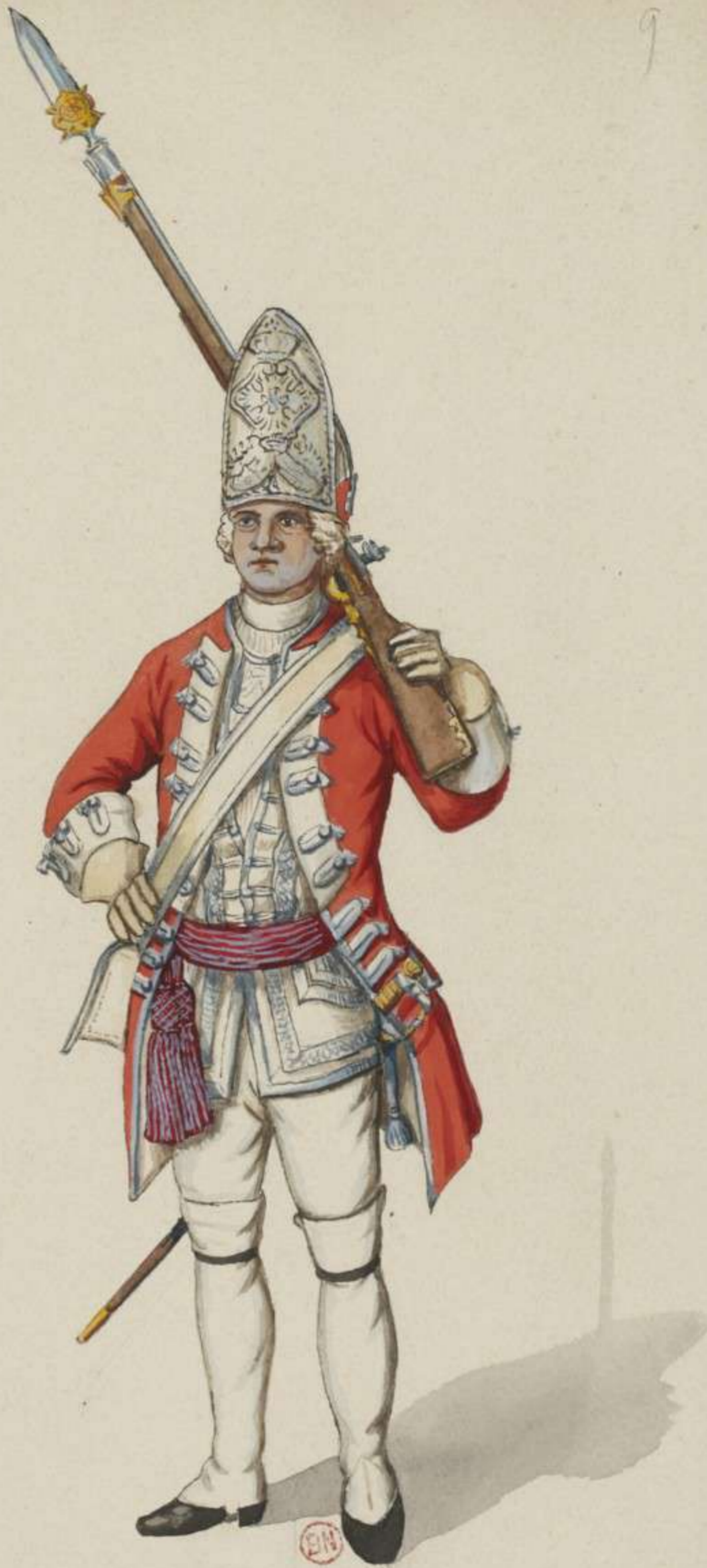
9° - Grenadier Officier vom Infanterie Regiment Marchen