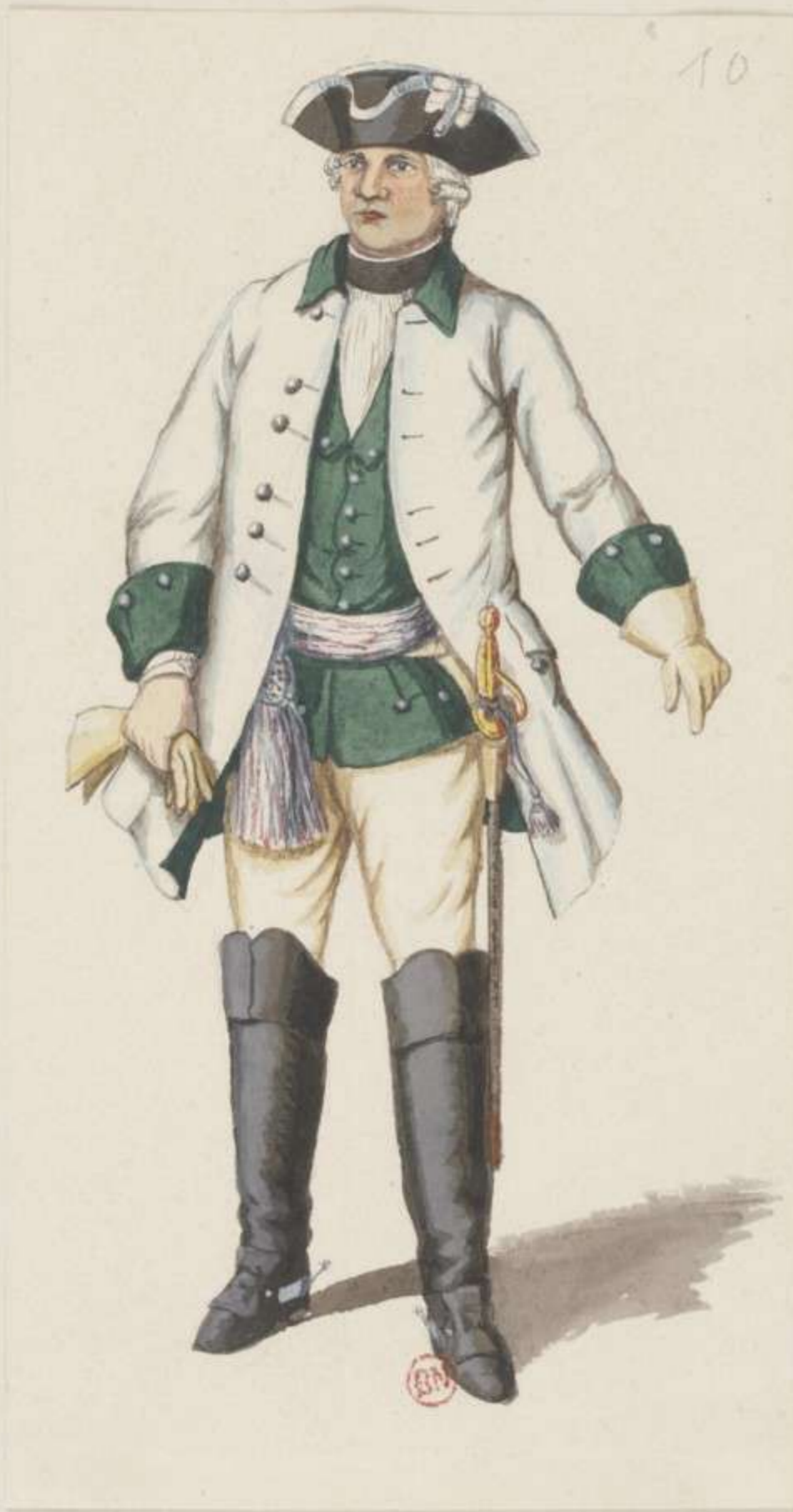
10°.- Officier vom Dragoner Regiment von Leipziger - 1740