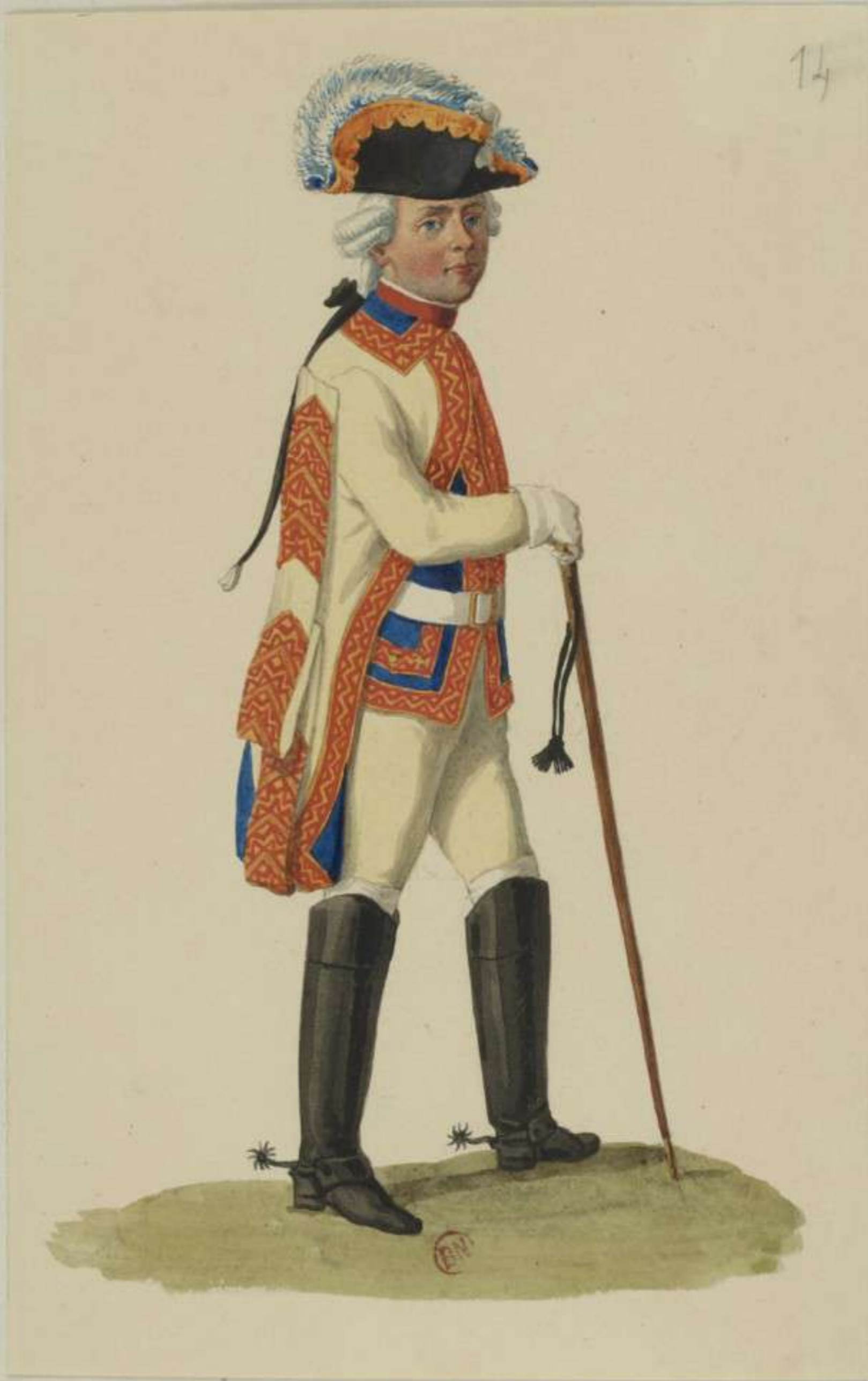
14° - Trompeter vom Garde du Corps Regiment