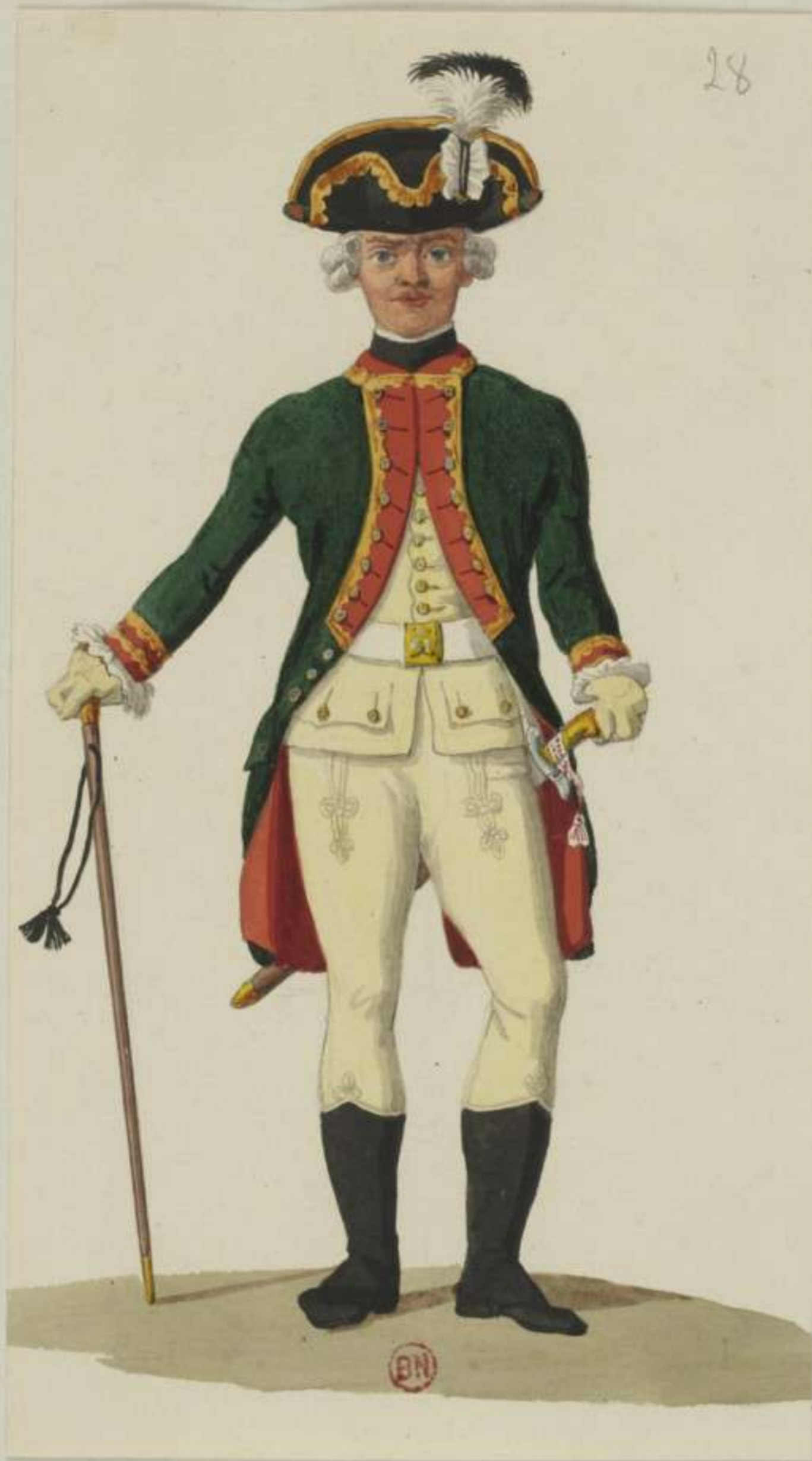
28°- Unterofficier vom Artillerie Corps