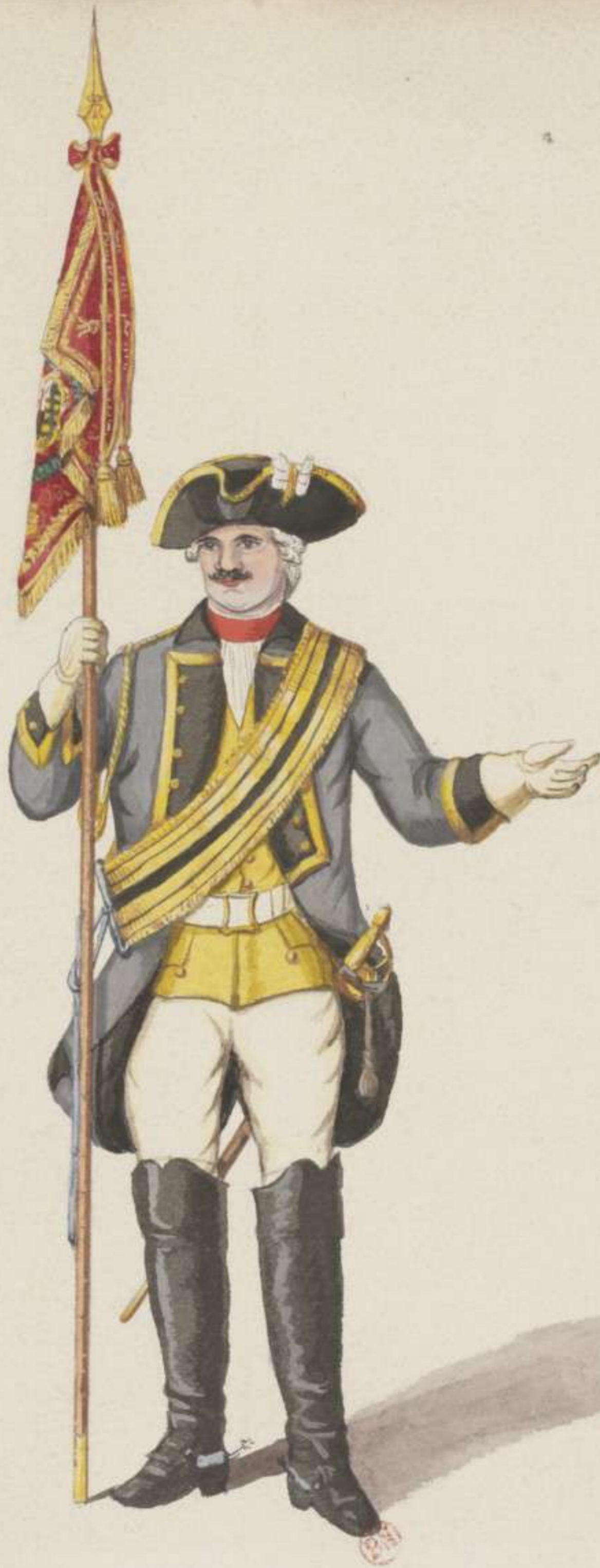
24 o - Chevaulegers Regiment Prinz Albert von Sachsen Teschen - 1745-1753