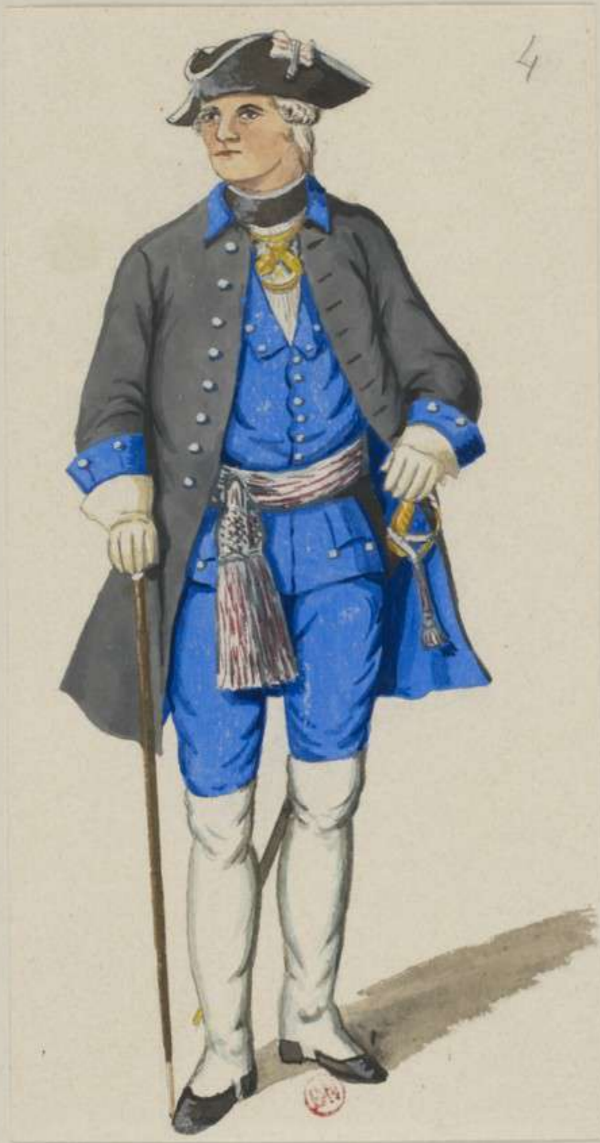
4° - 2. Kreis Regiment Oschatz - 1748-1763