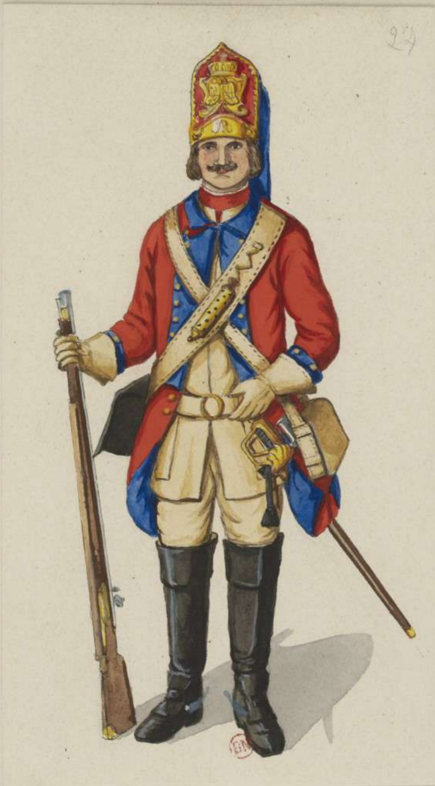
24 o - Grenadier vom Dragoner Regiment Arnstadt