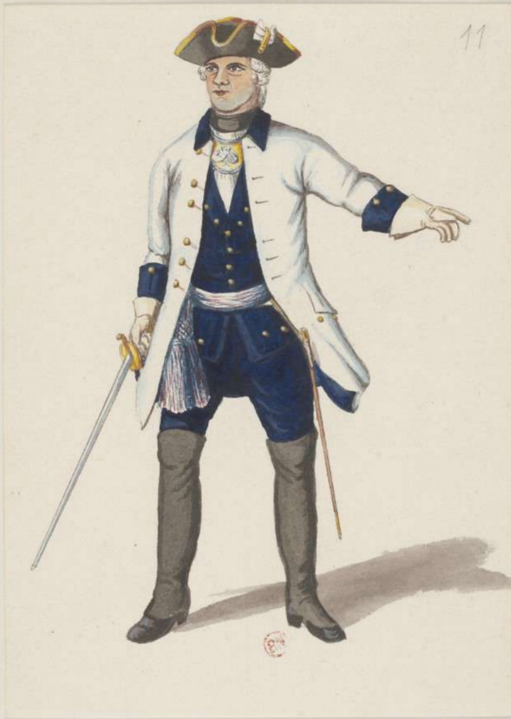
11°- Infanterie Regiment Graf Stolberg - 1748