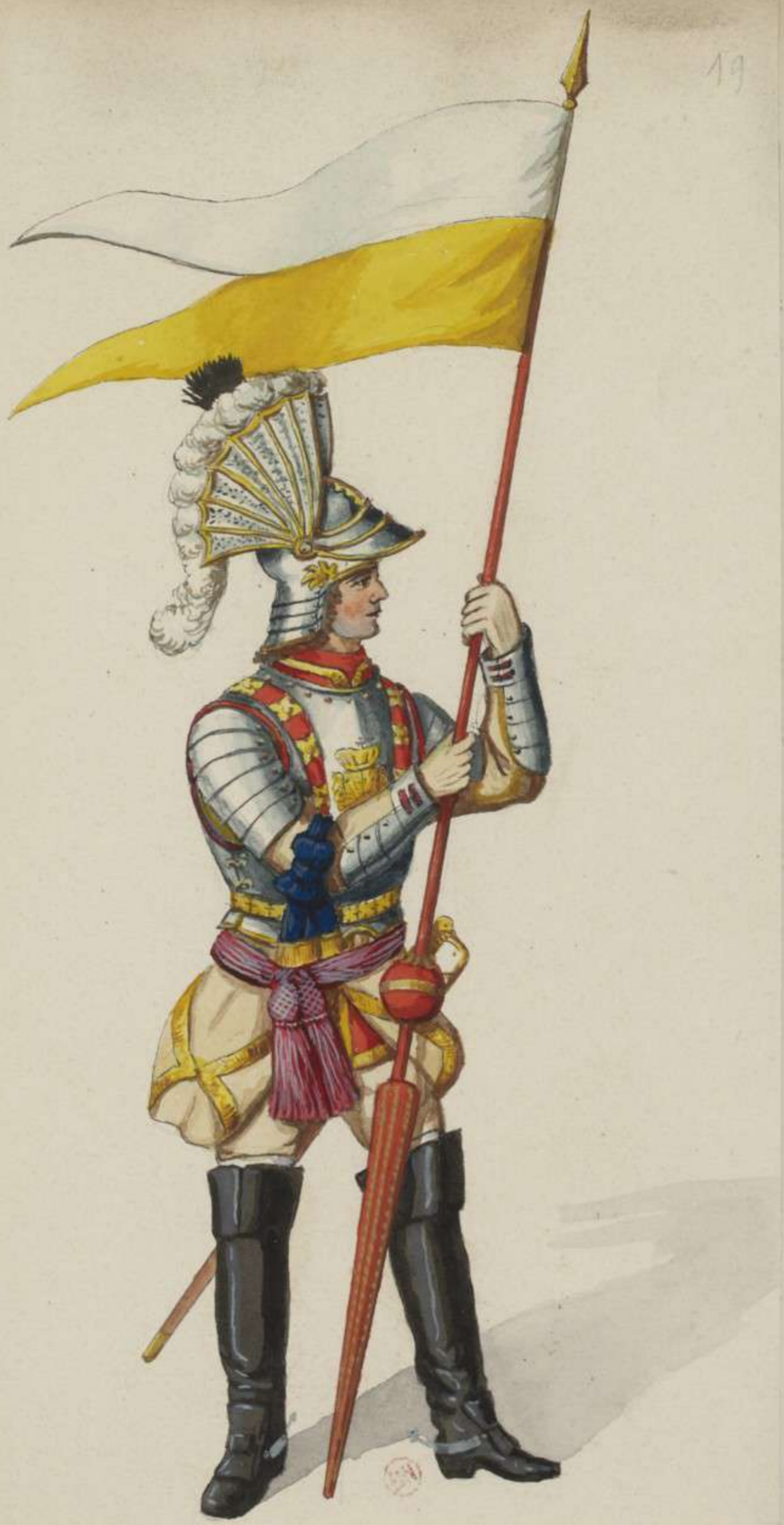
19° - Compagnie der Geharnischten beim Leib Cürassier Regiment