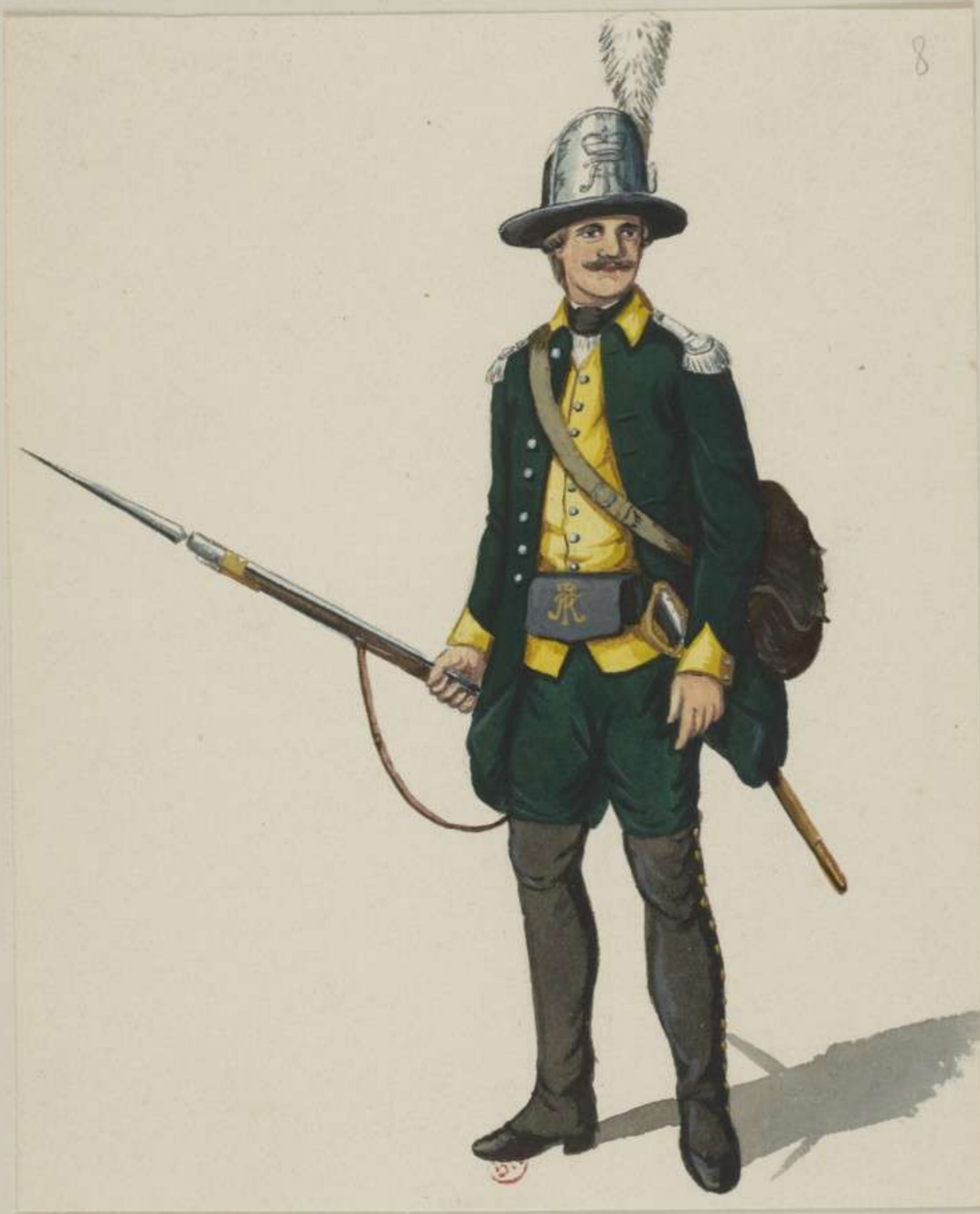
8° - Scharfschütz - 1775