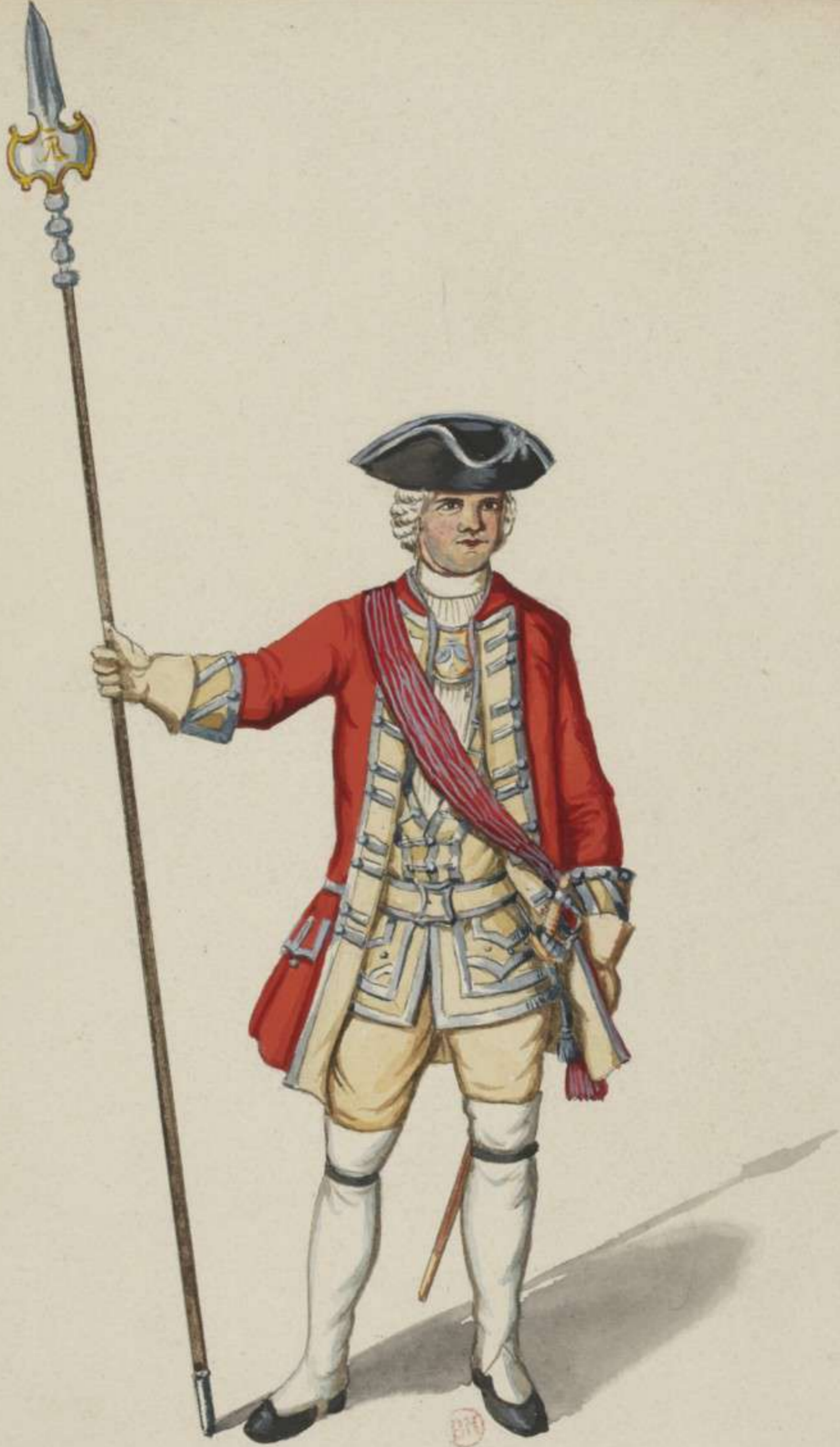
8° - Musketier Officier vom Regiment Böhn