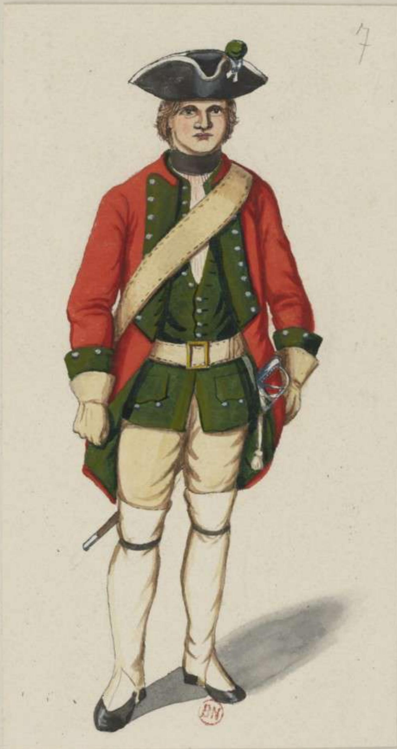
7° - Musketier vom Infanterie Regiment De Caila