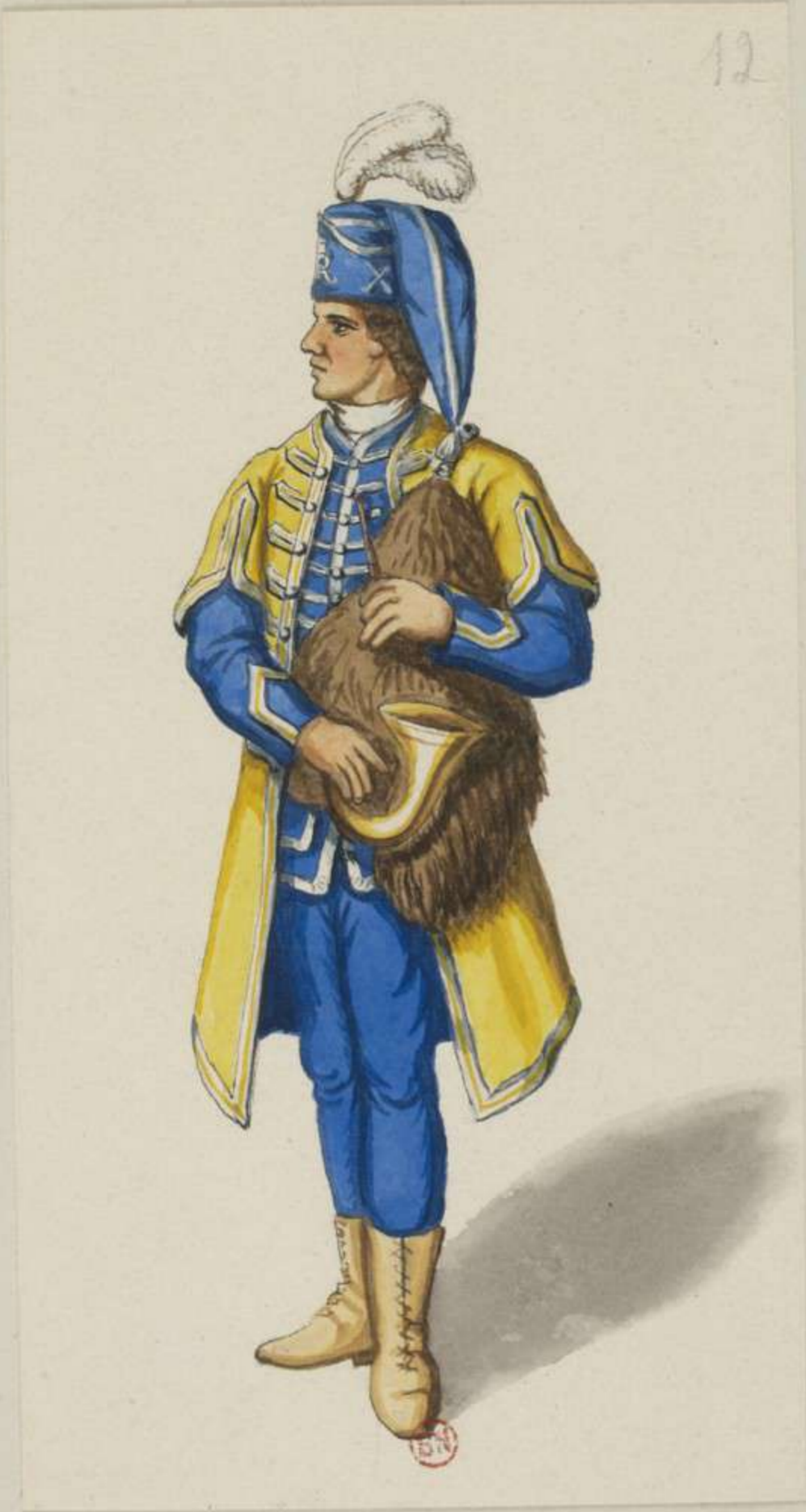
I2°- Sackpfeifer vom Infanterie Regiment Löwendahl