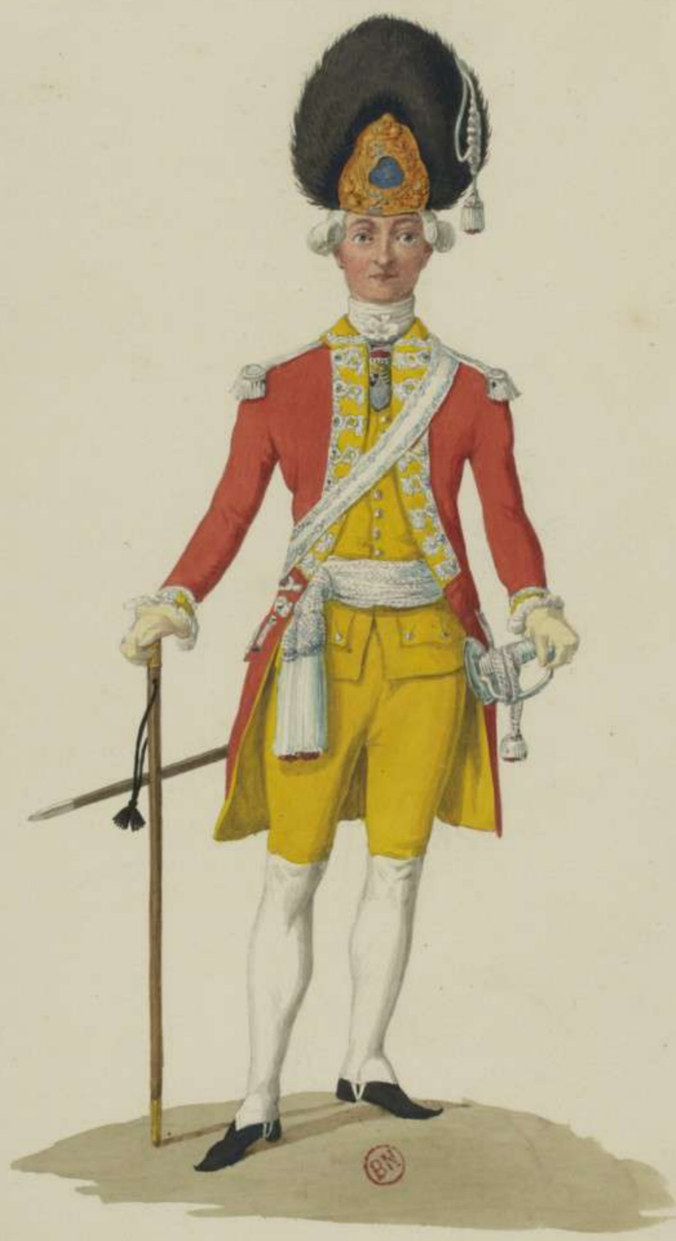
6° - Officier vom Leibgrenadier Garde Regiment