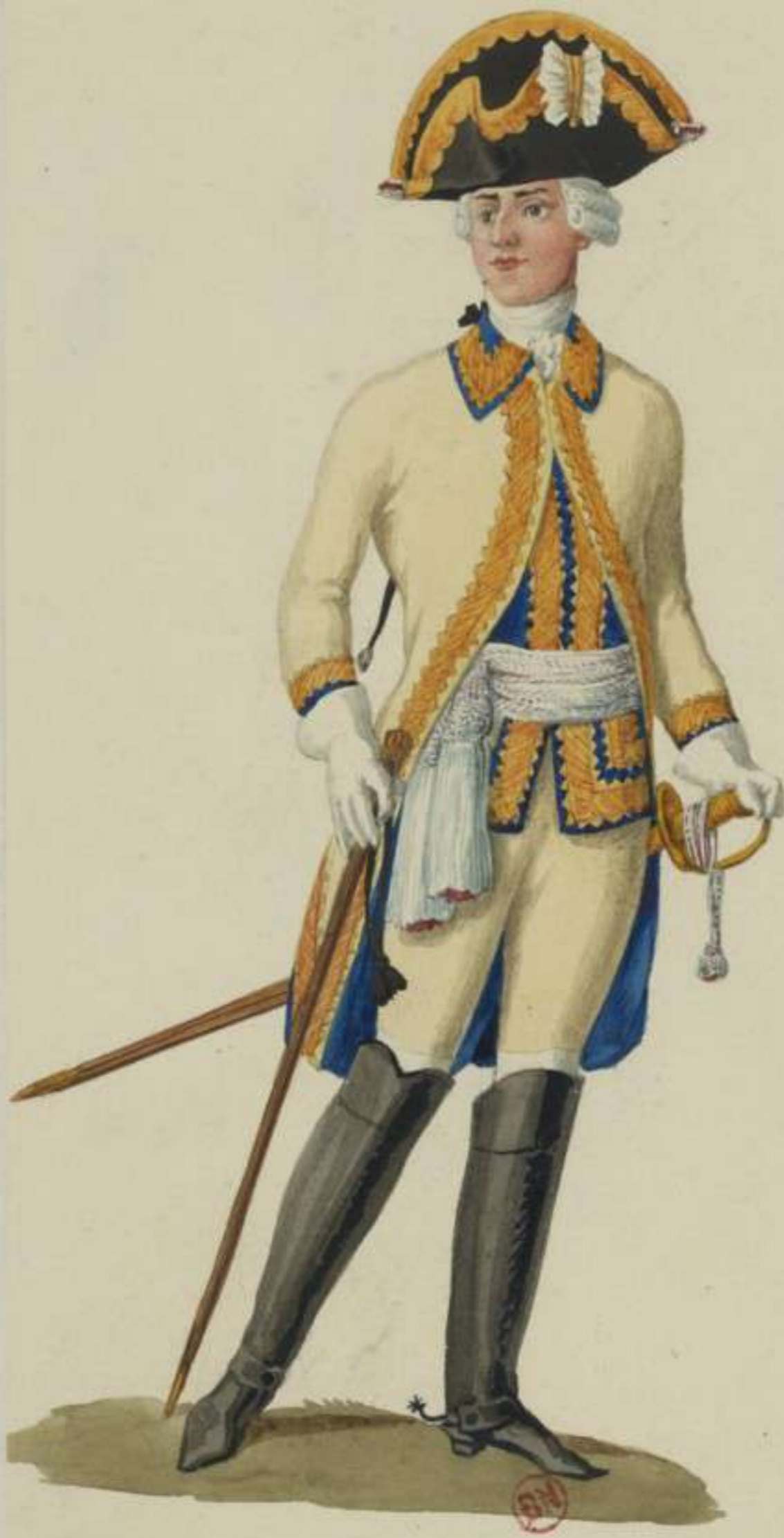
I5°- Officier vom Garde du Corps Regiment