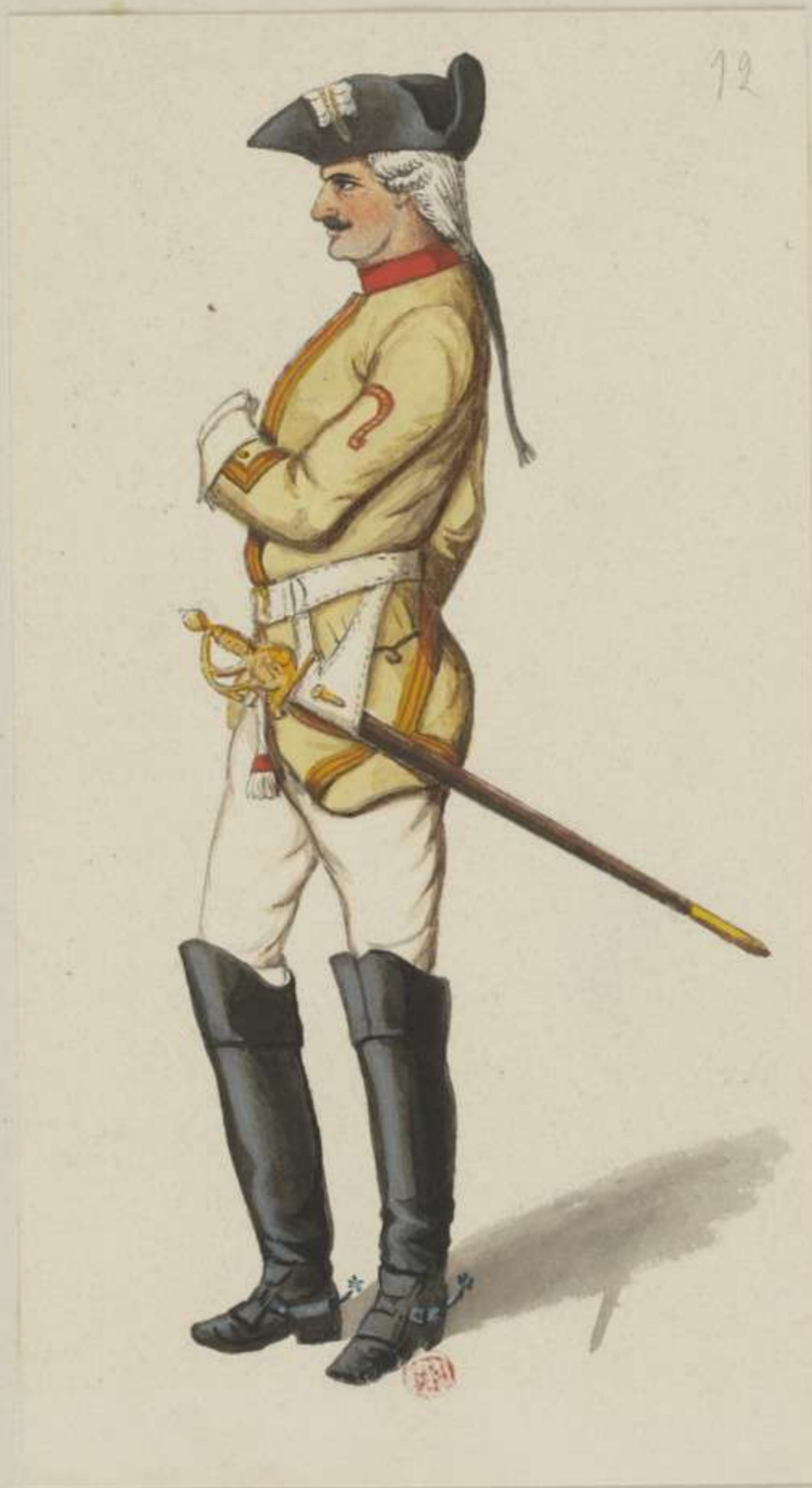
12 o - Fahnen Schmied vom Leib Cürassier Regiment - 1756