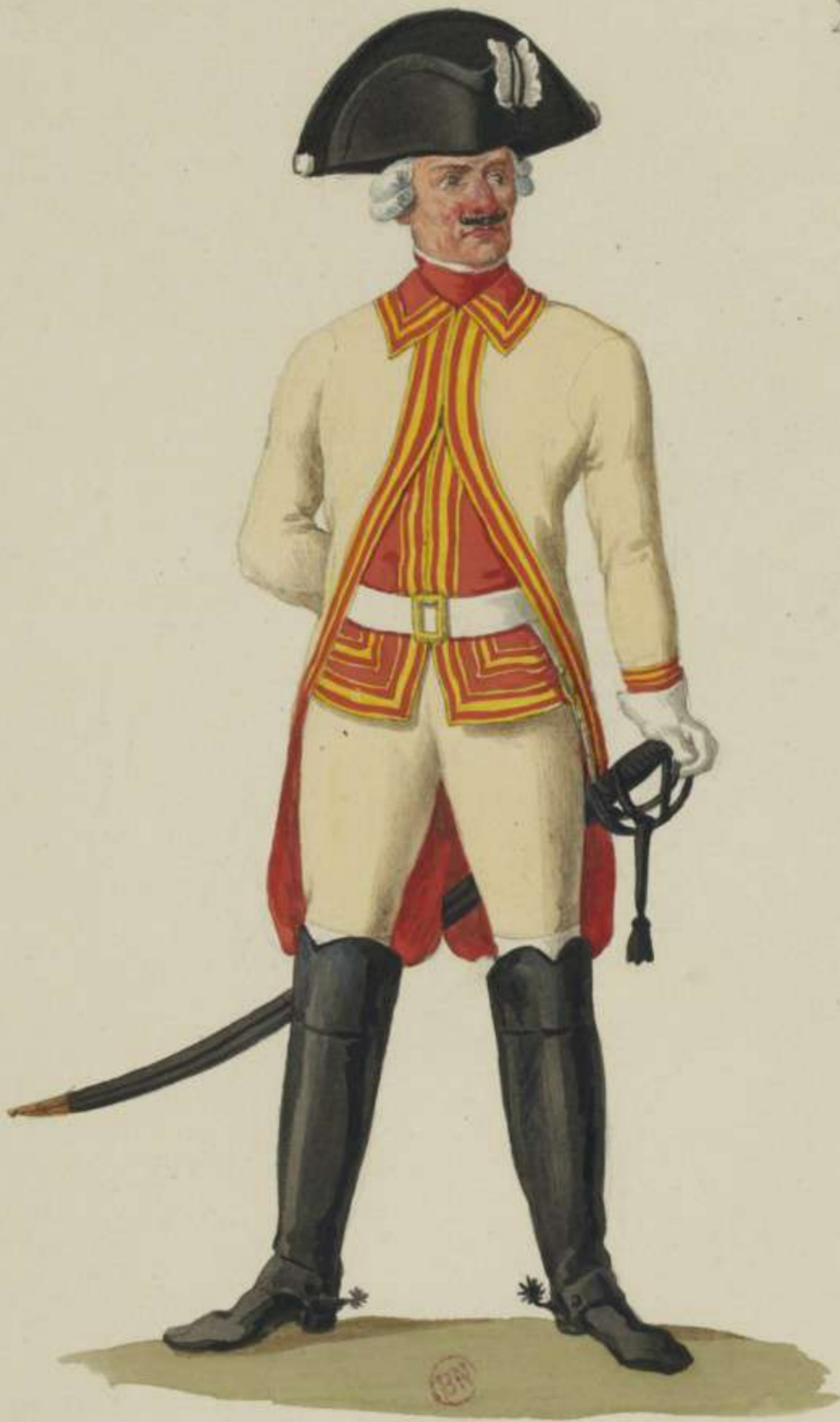
21 o - Reiter vom Cürassier Regiment Churfürst