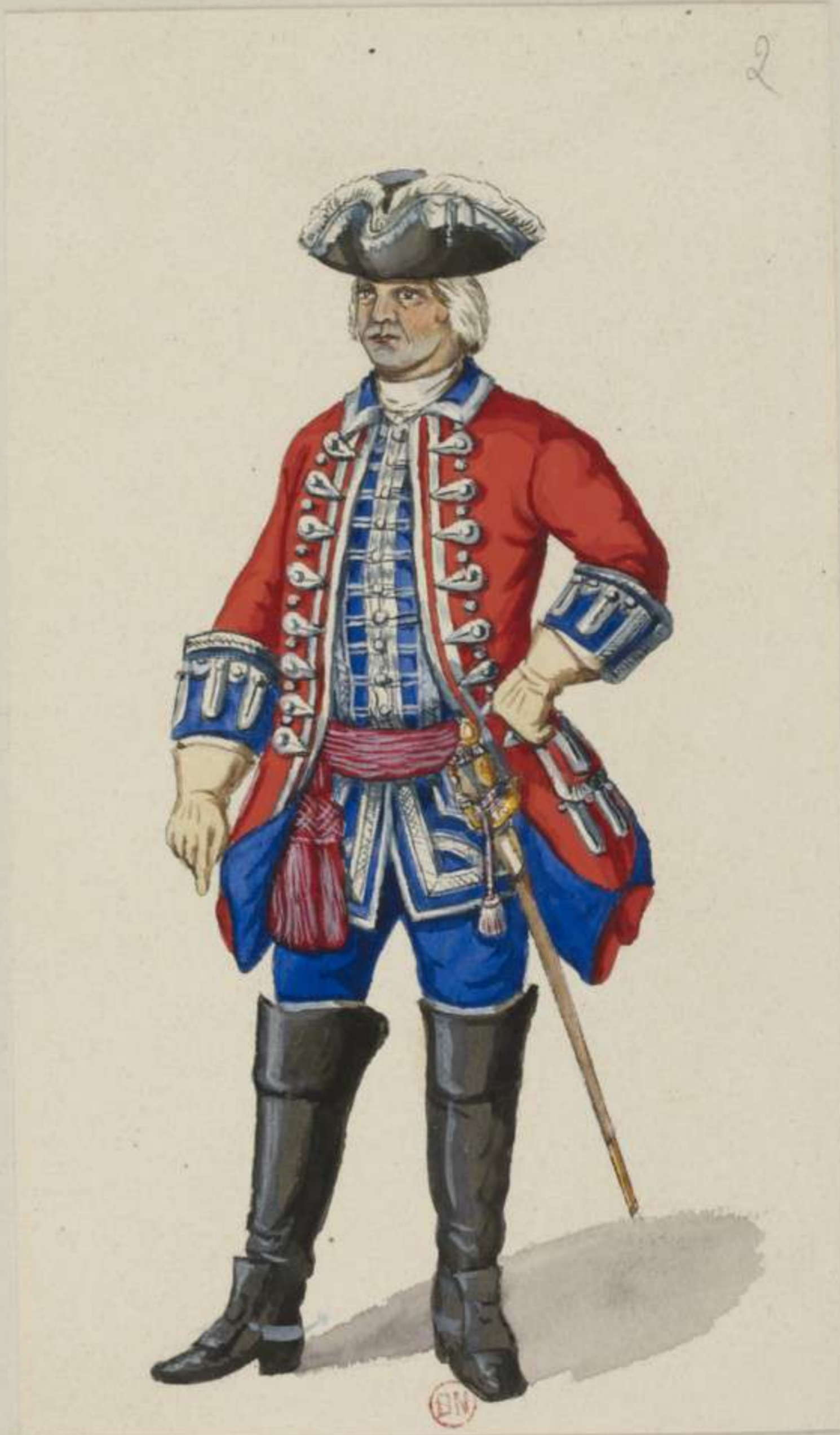
2° - General der Cavallerie