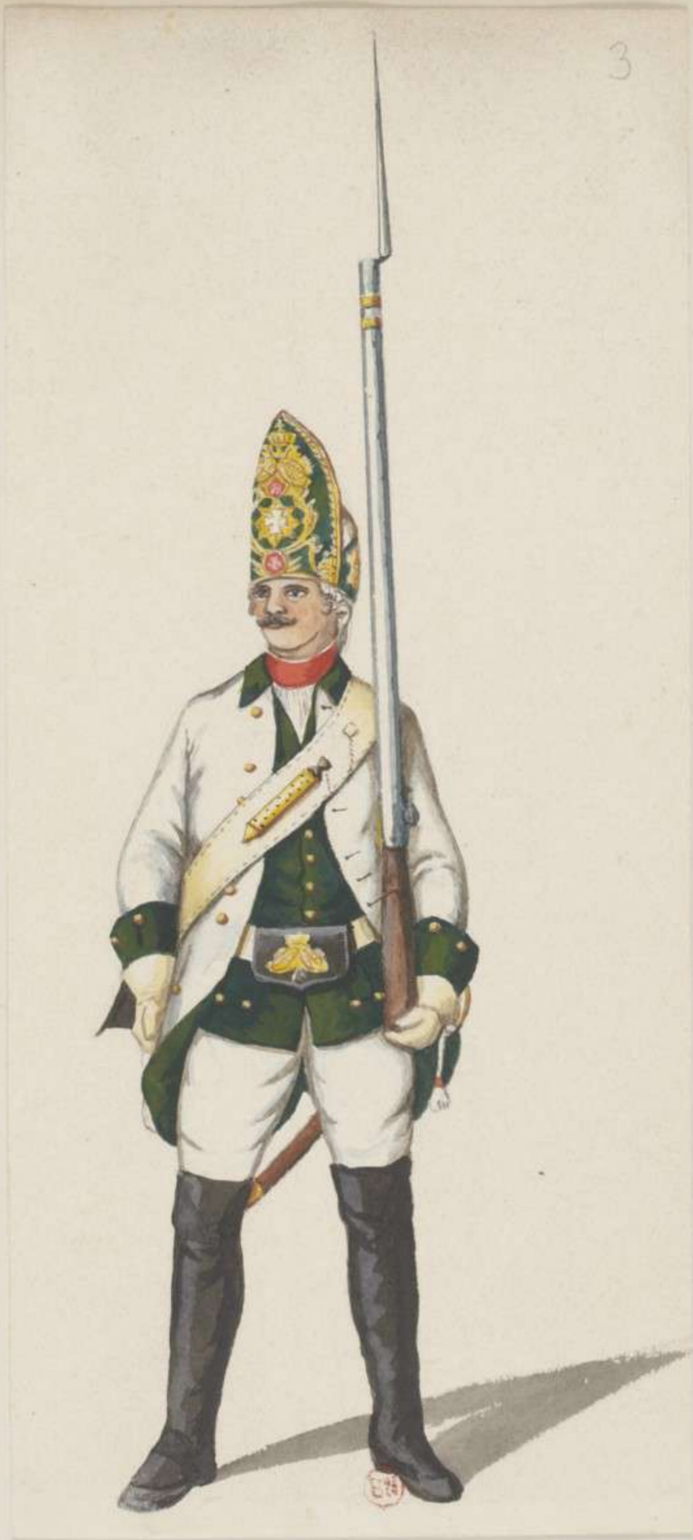
3 o - Grenadier vom Regiment Graf Cosel - 1740