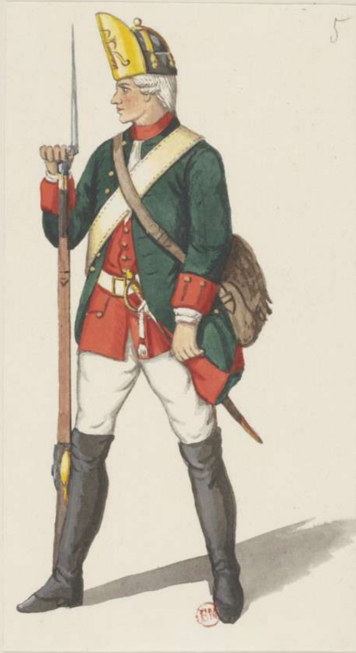
5° - Füsilier vom Regiment von Rochow - 1740