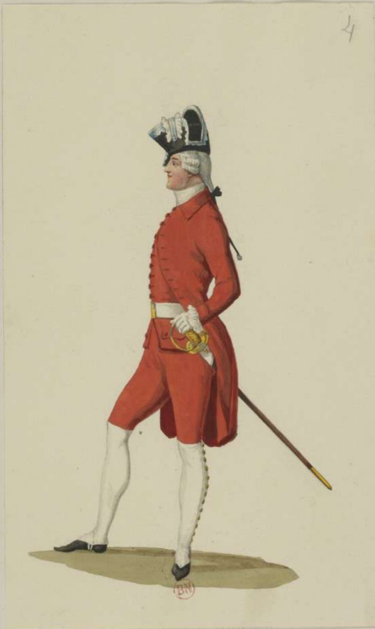
4° - Adeliges Cadetten Corps (Tägliche Uniform)