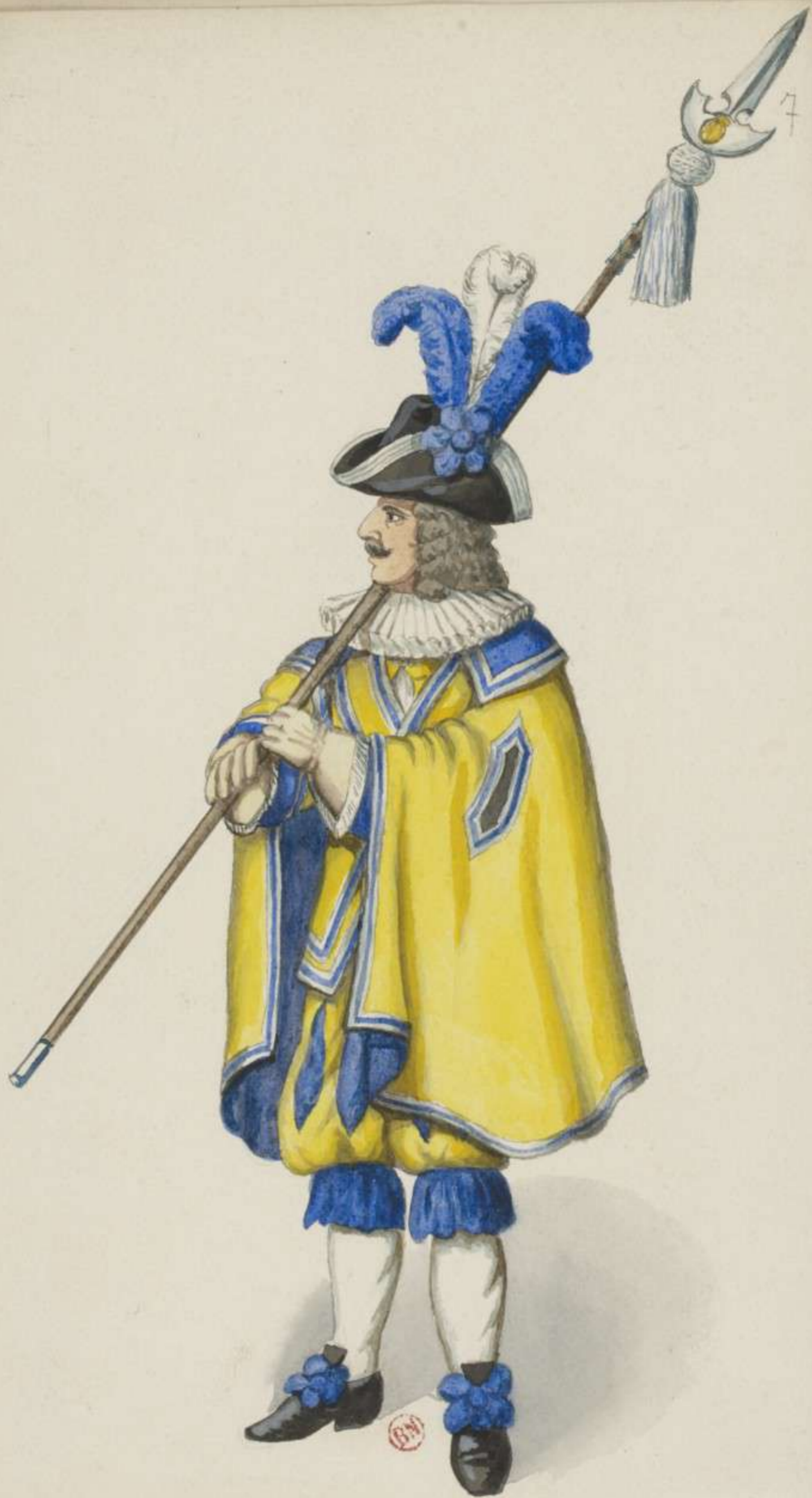
7° - Schweizer Leibgarde - 1700