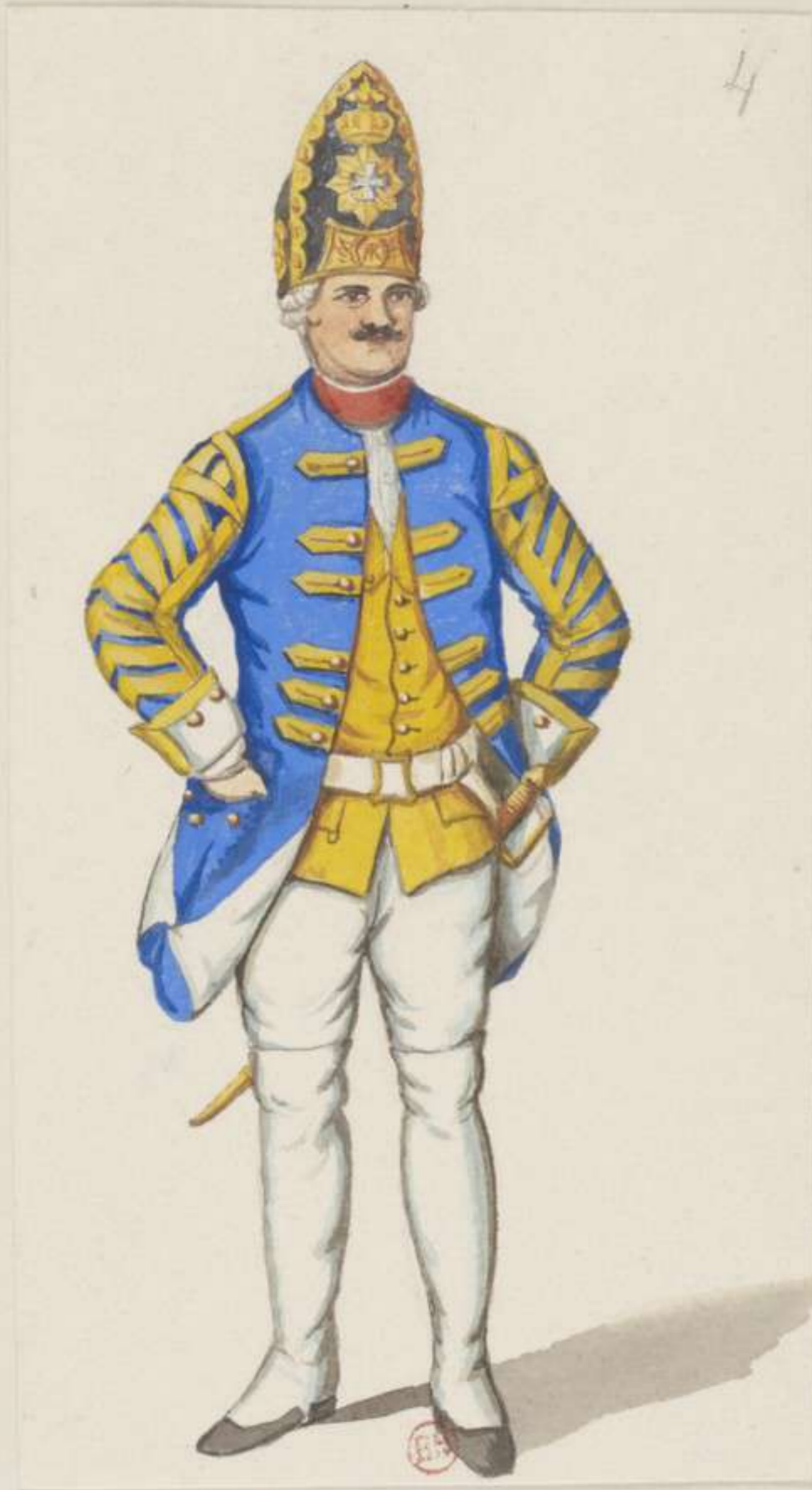
4° - Spielmann von der Grenadier Compagnie des Grafen Bomnitz auf Sorau - 1740