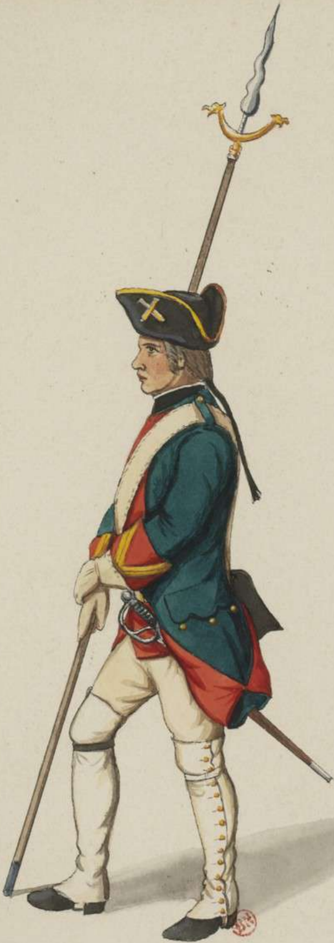
28°- Fuss Artillerie mit Luntenspiess