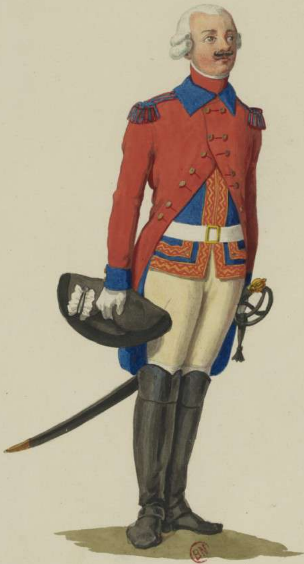
17 o - Reiter vom Garde du Corps Regiment (Interims Uniform)