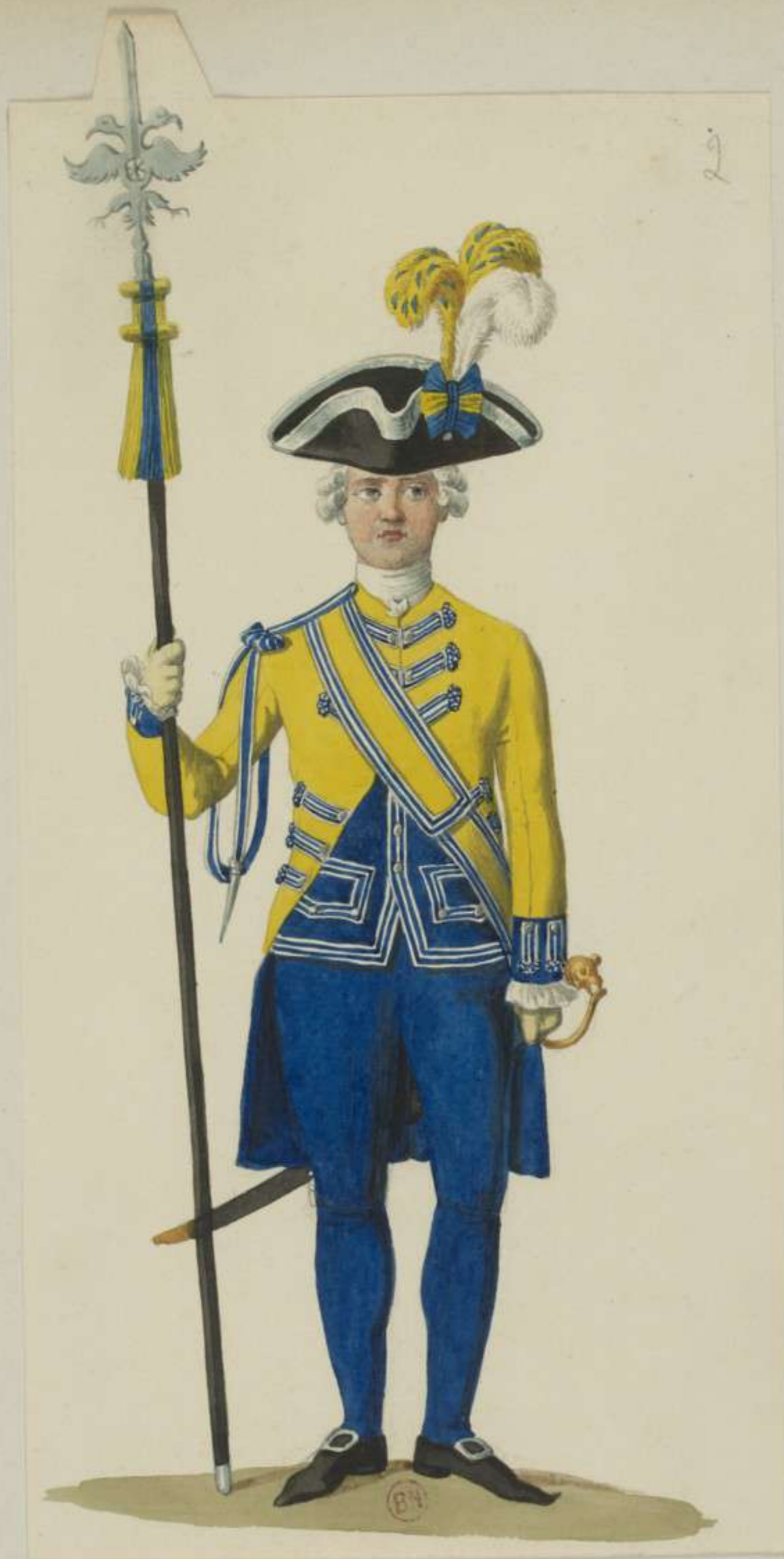
2° - Schloss Schweizer Garde (im täglichen Dienst)