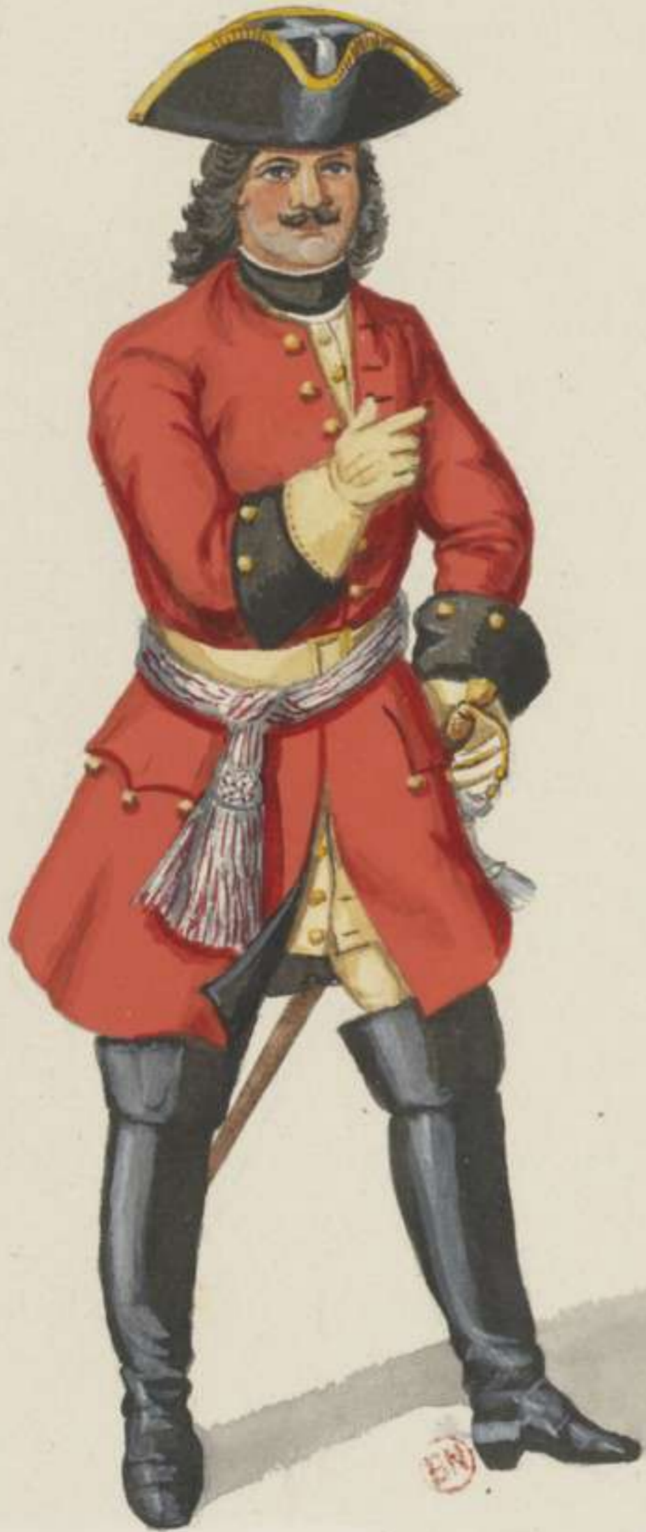
I7° - Officier vom Dragoner Regiment von der Goltz - 1707