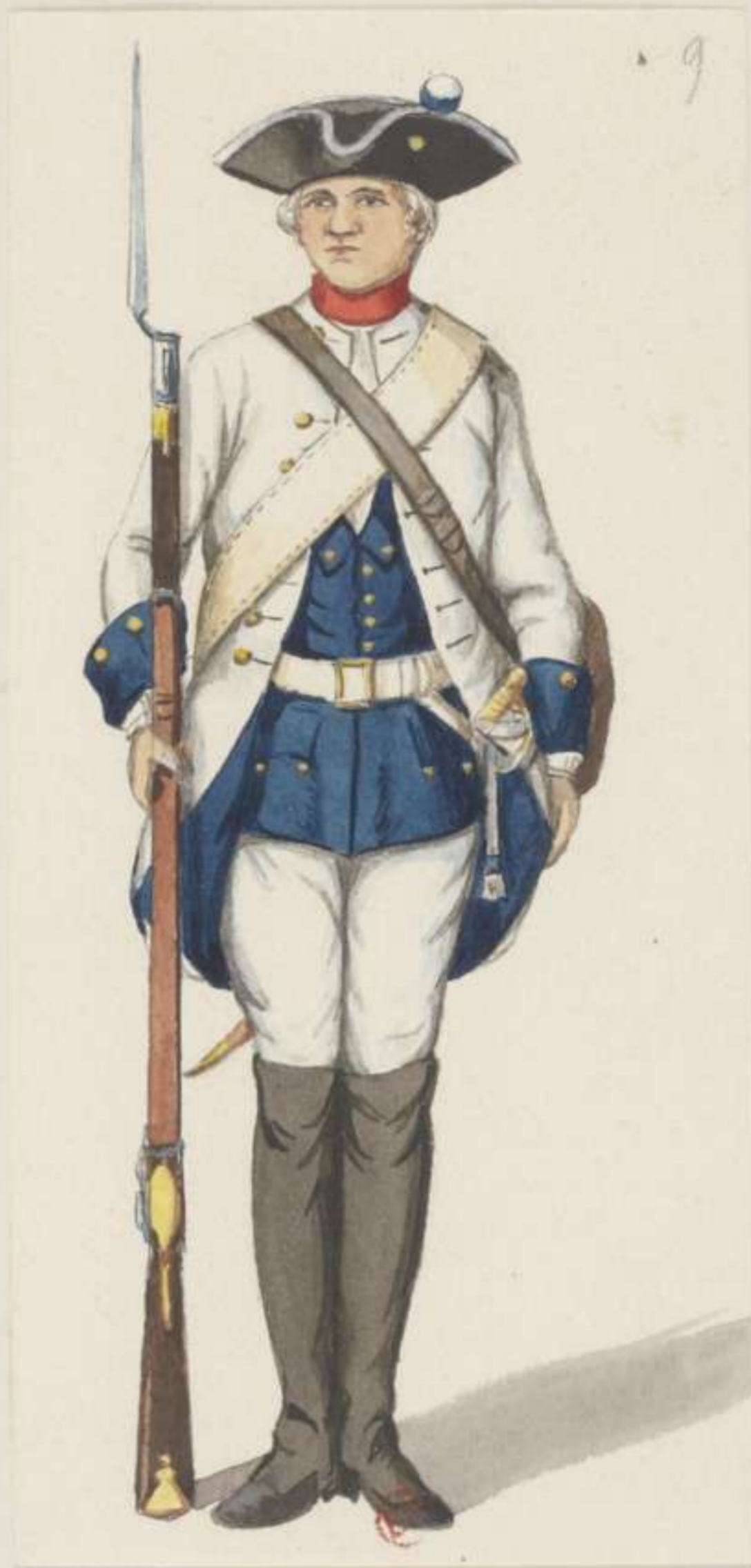
9° - Musketier vom Regiment Sachsen Weissenfels 1745