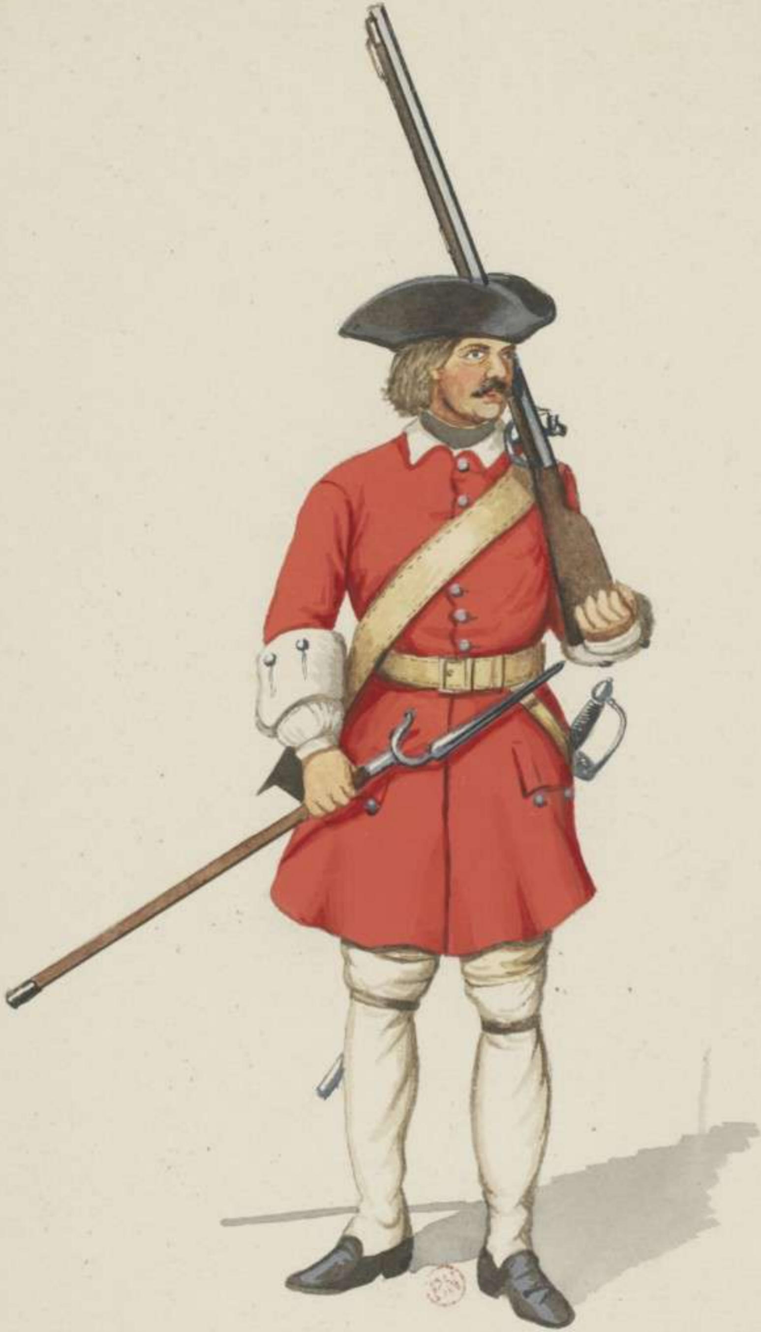
13 e - Feld Infanterie Regiment - 1705