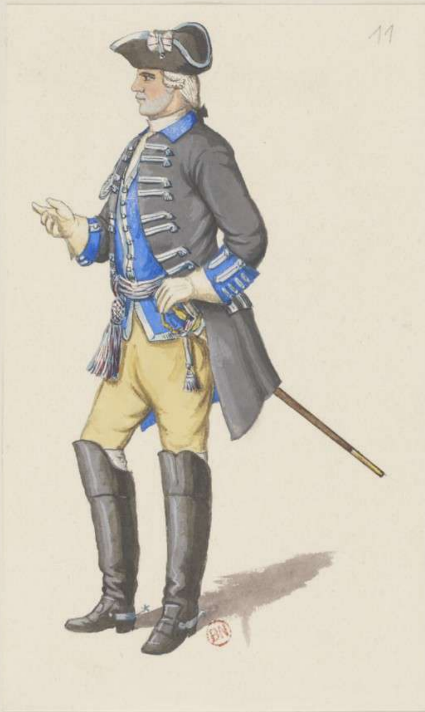
II o - Stabs Officier vom Chevauxlegers Regiment Graf Brühl - 1740