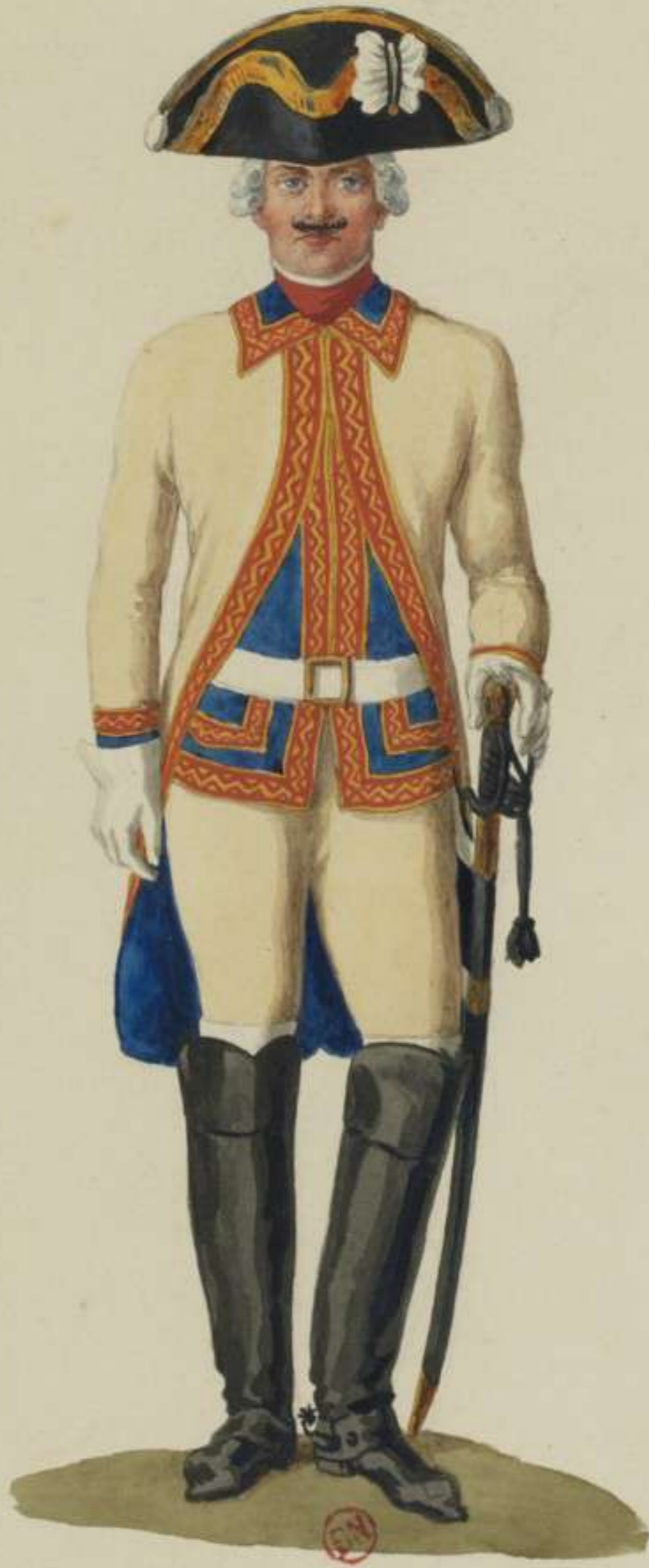
I6°- Reiter vom Garde du Corps Regiment.