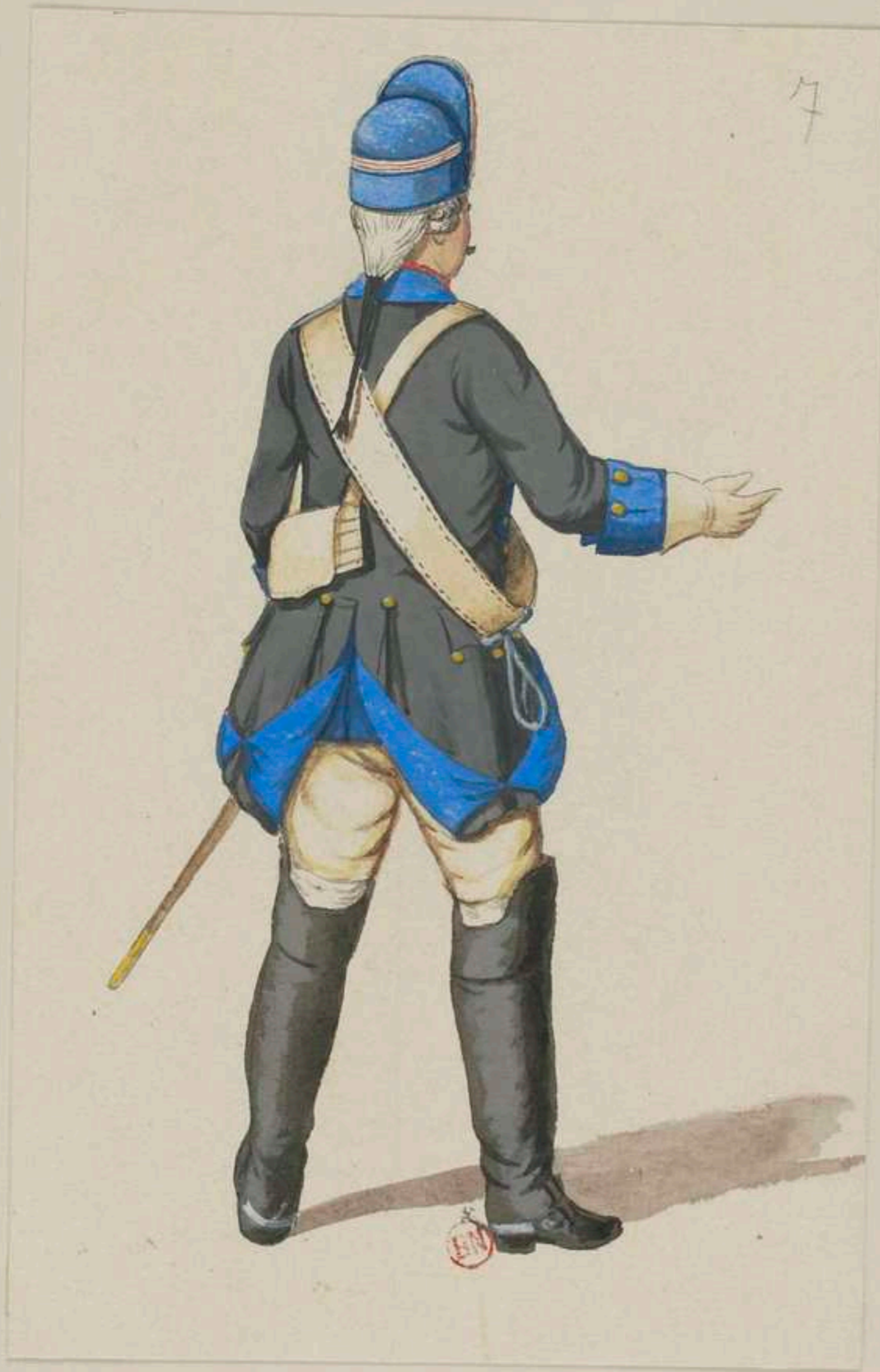
7° - Chevaulegers Regiment von Sibilsky - 1736