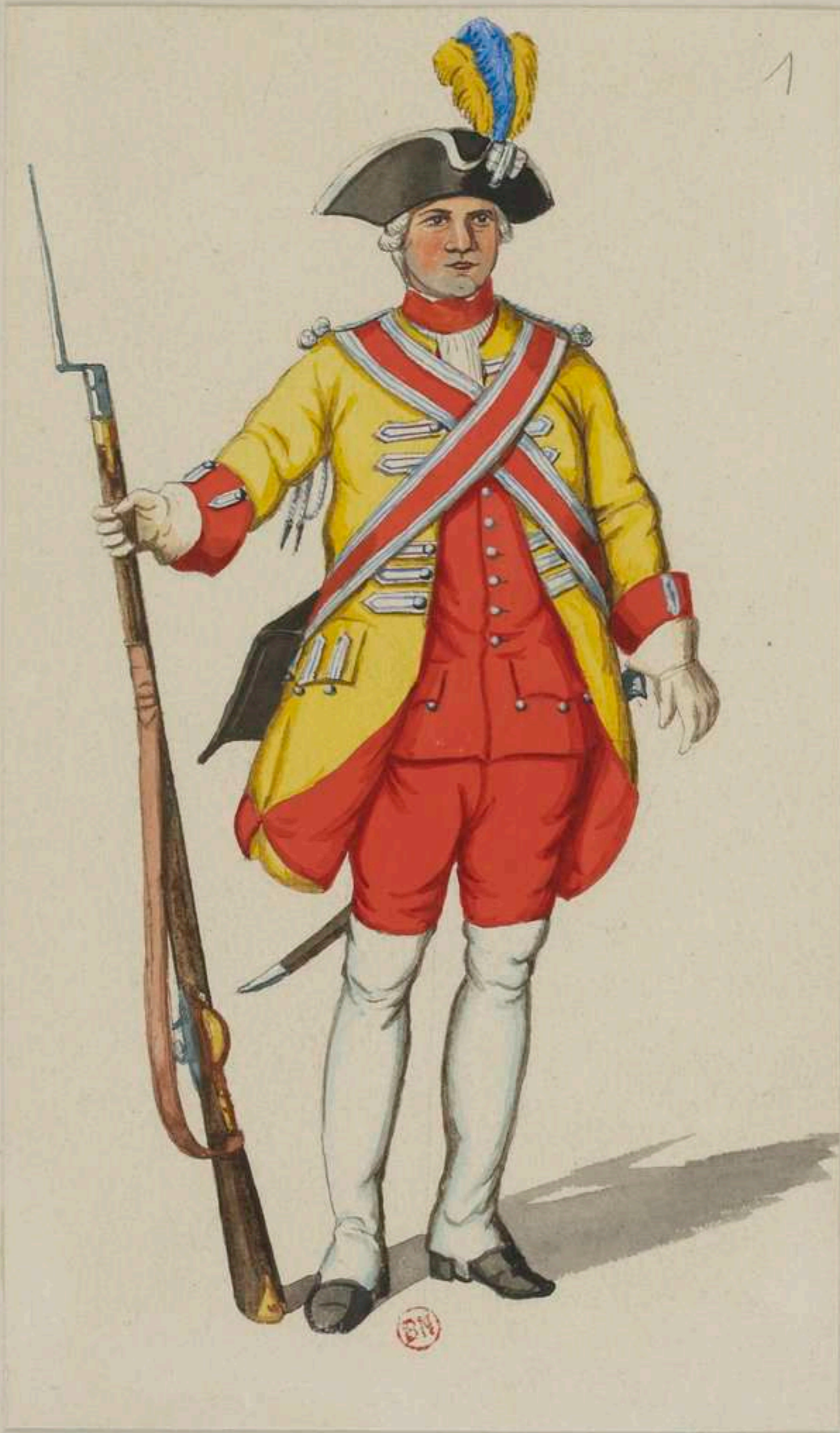
I° - Schweizer Leibgarde - 1735