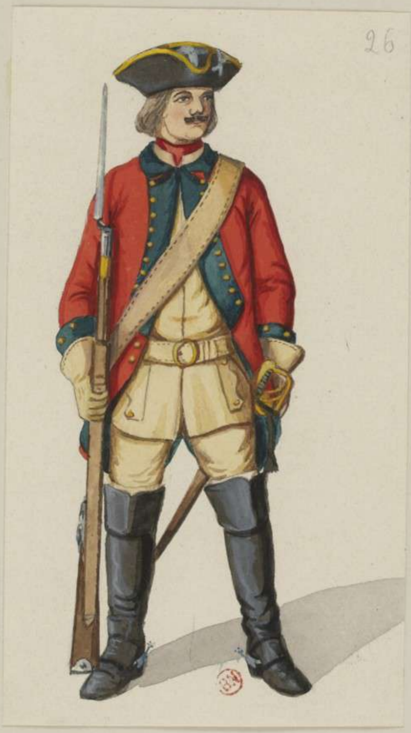
26 o - Dragoner Regiment von Goldacker