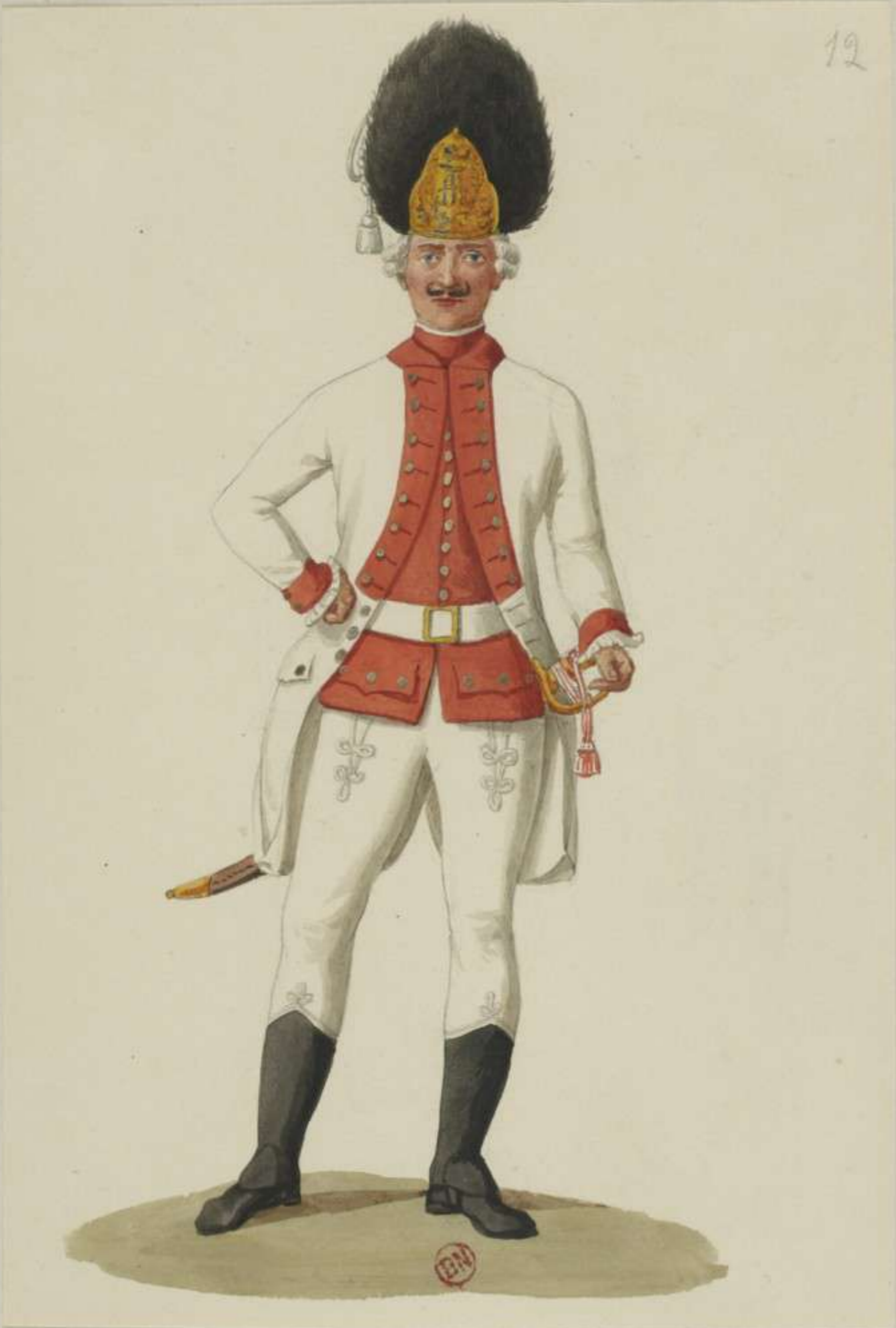
12°- Grenadier vom Infanterie Regiment Churfürst