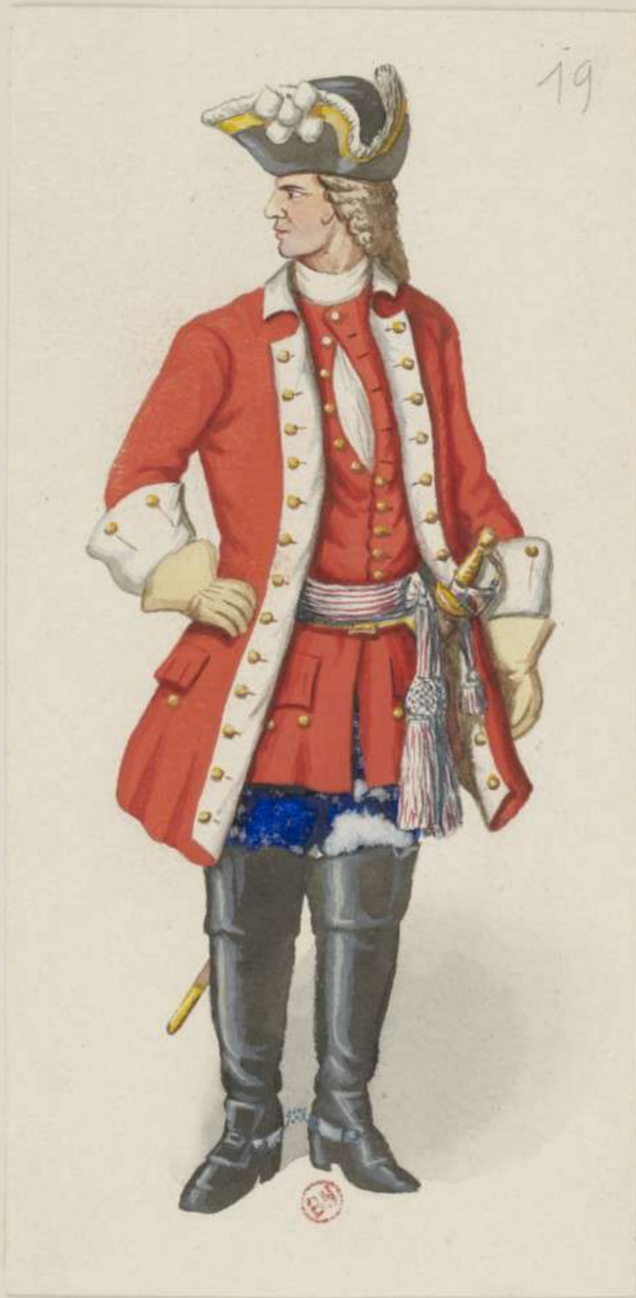
19° - Stabs Officier der Infanterie - 1711