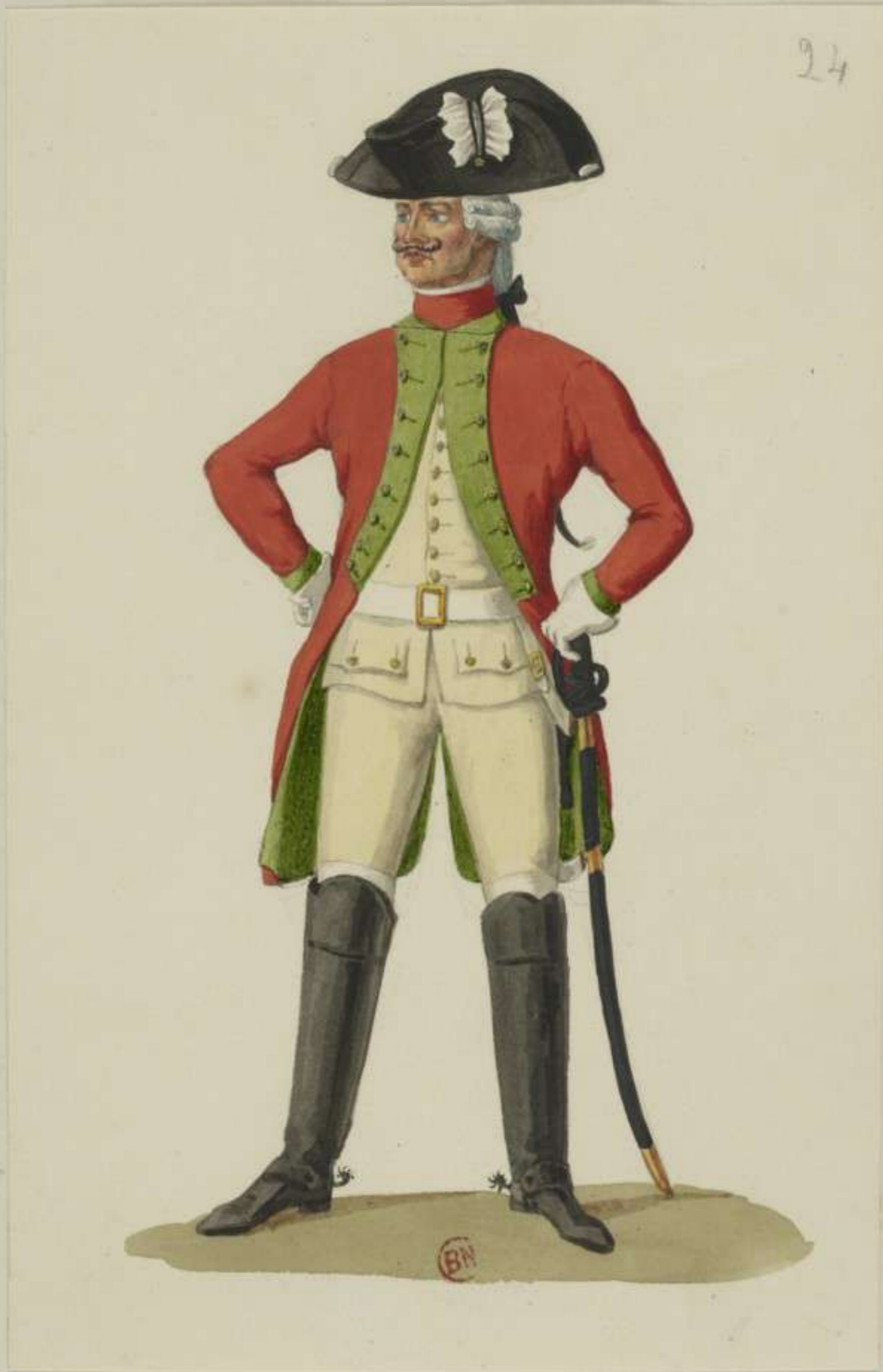
24° - Reiter vom Chevaulegers Regiment Herzog Curland