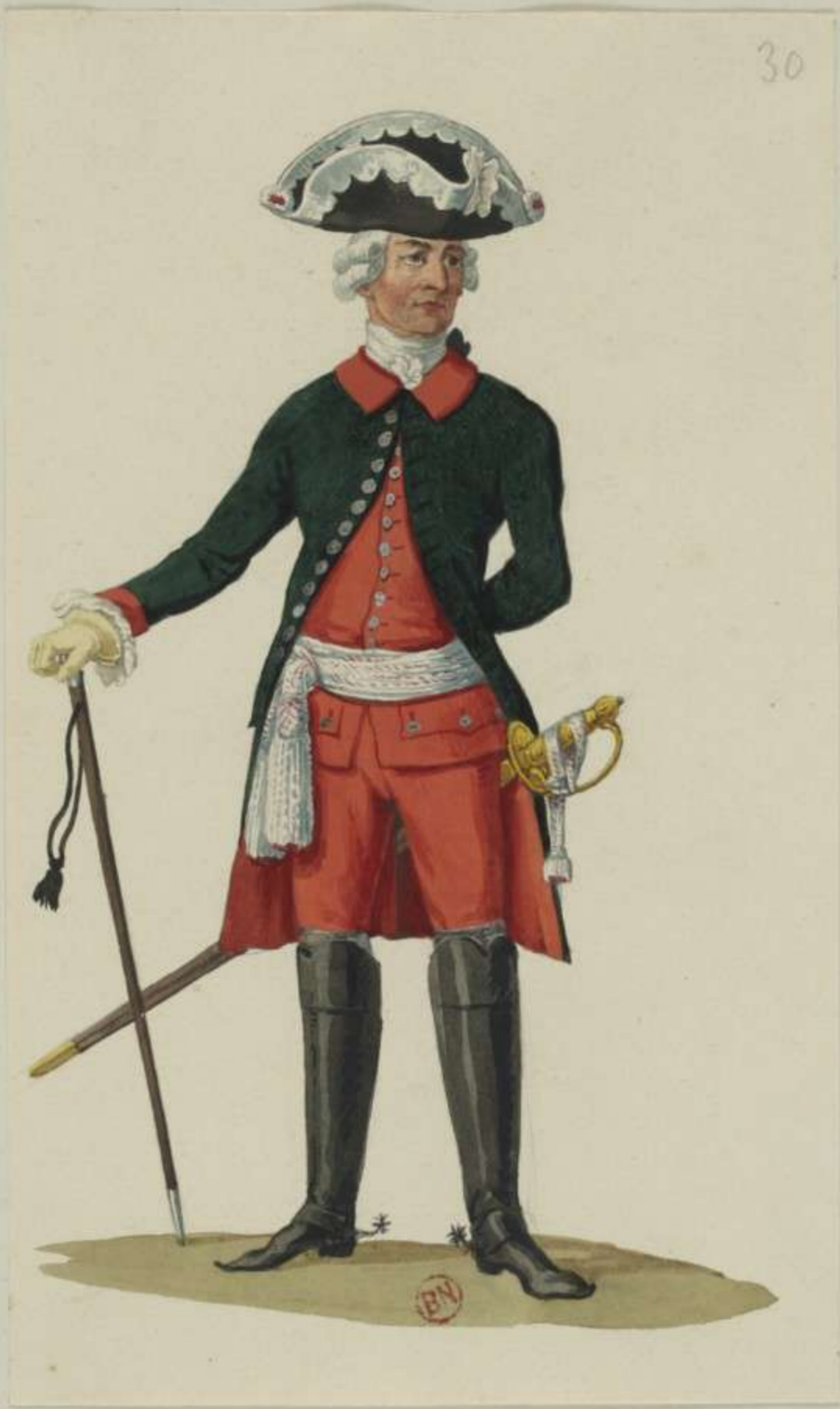
30°- Officier vom Ingenieurs Corps