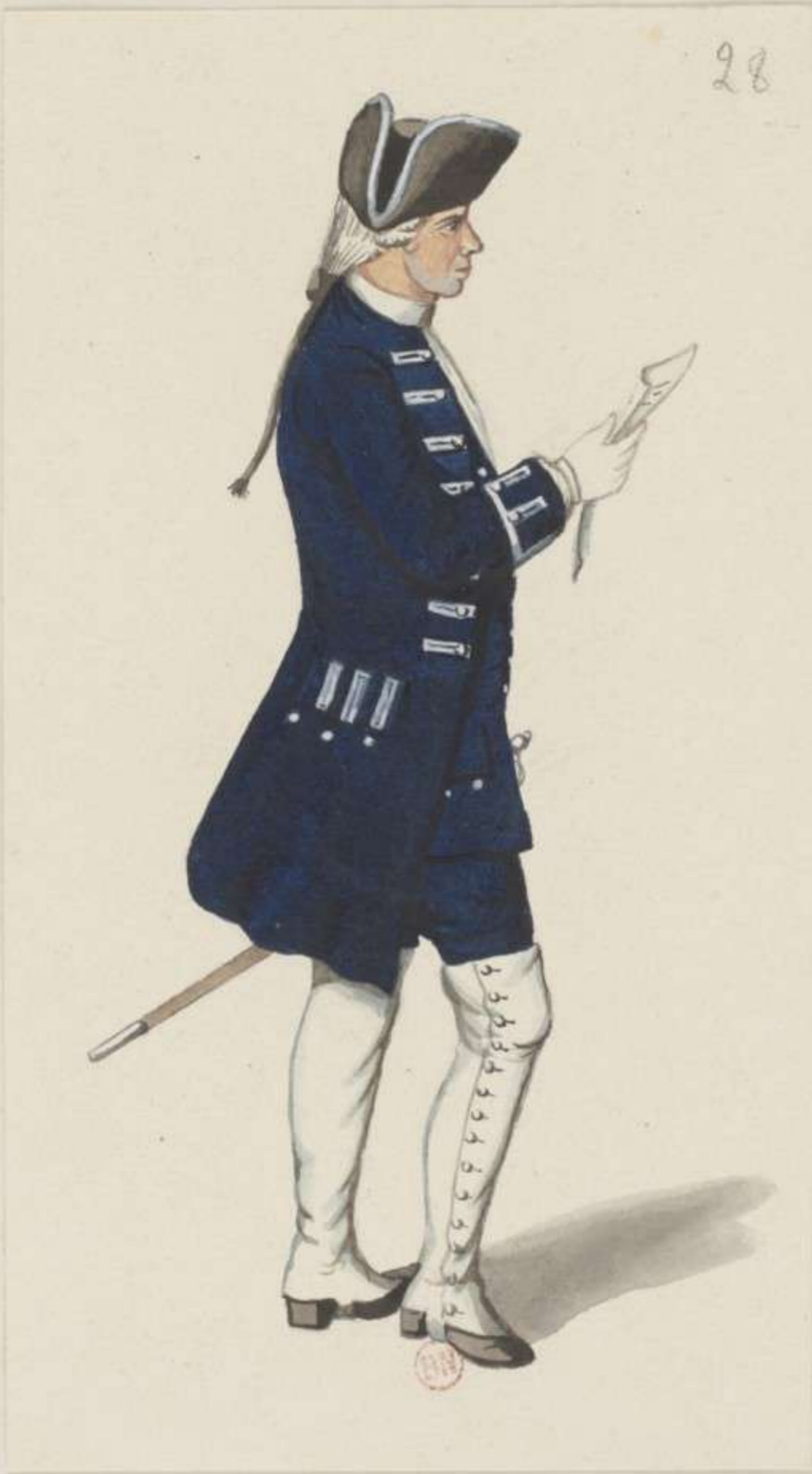
28°- Auditeur - 1745