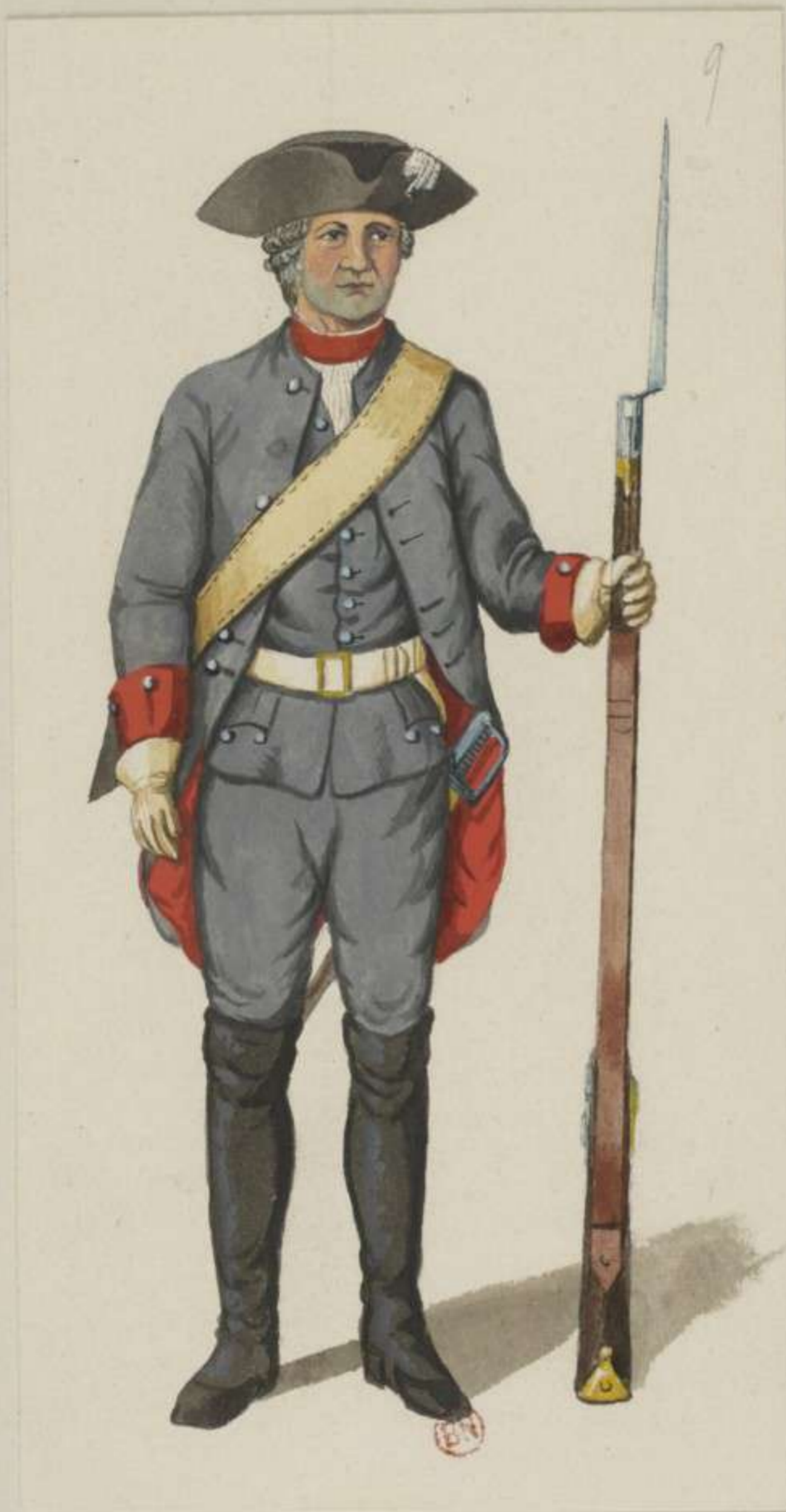
9° - Halb Invaliden Compagnie zu Waldheim - 1752