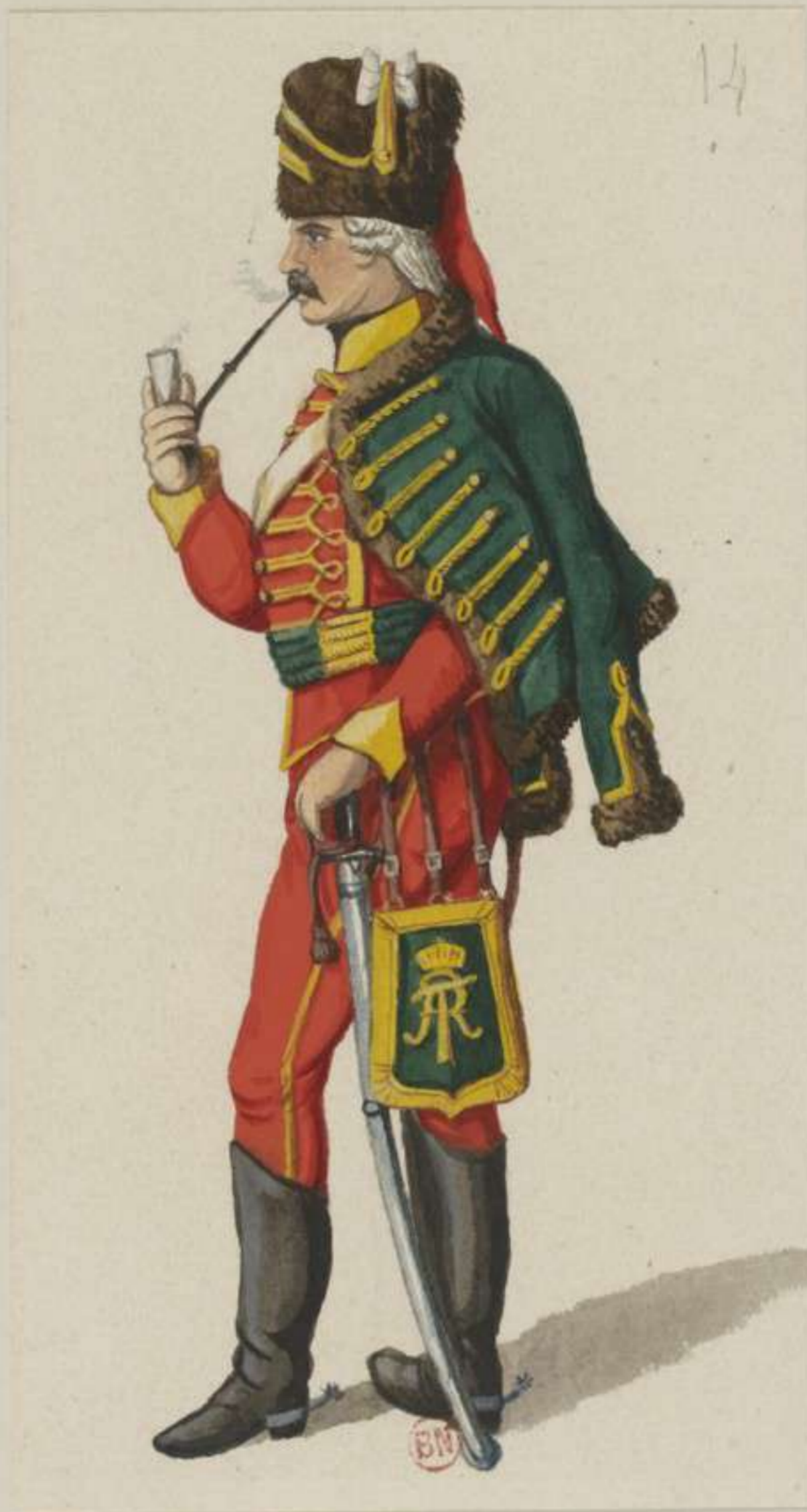
14°- Schill'sche Husaren - Deutsche Uniform - 1763-1766