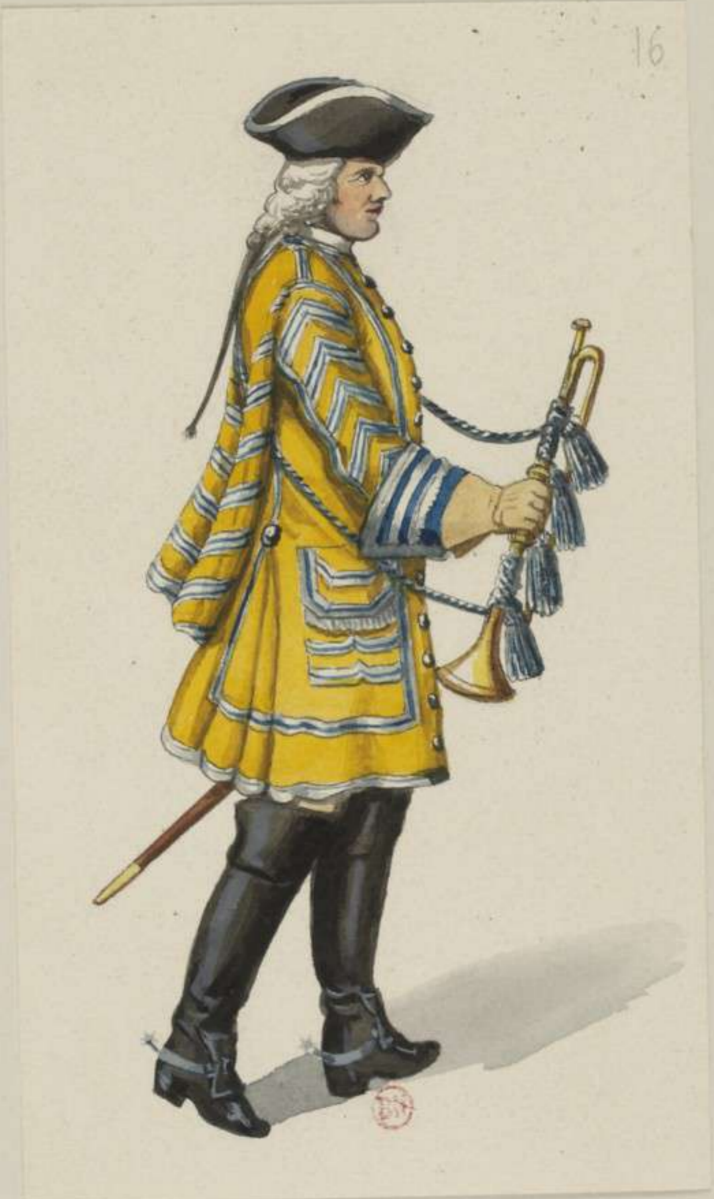
16° - Gardes du Corps - Trompeter