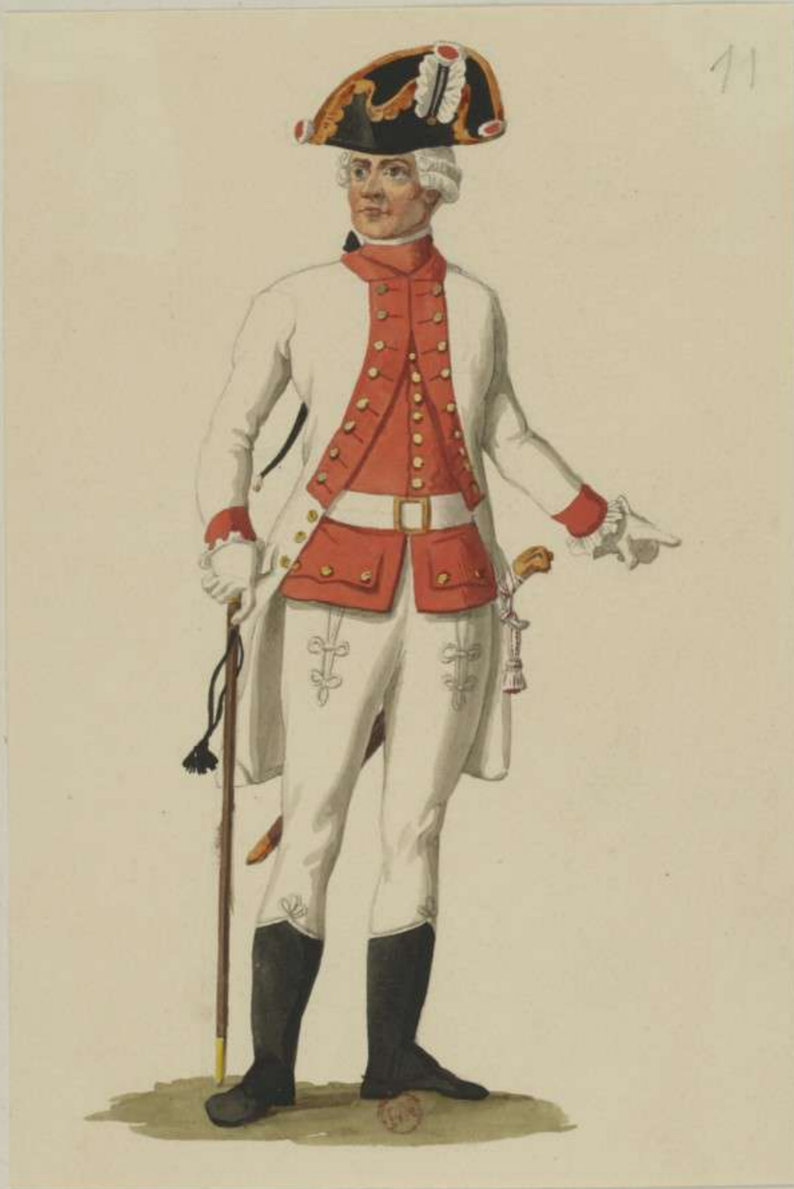
II o - Unterofficier vom Infanterie Regiment Churfürst