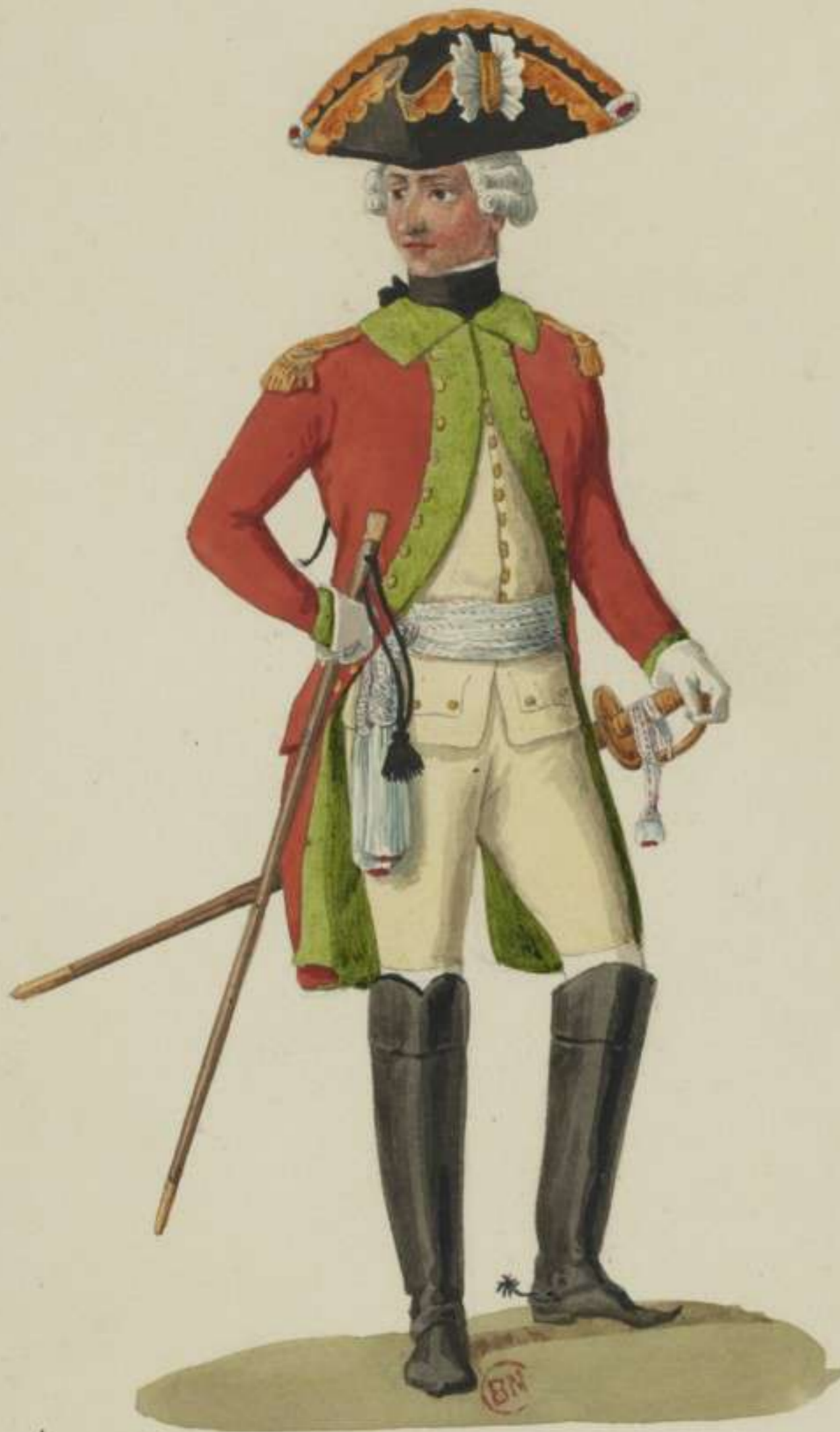
23°- Officier vom Chevaulegers Regiment Herzog Curland