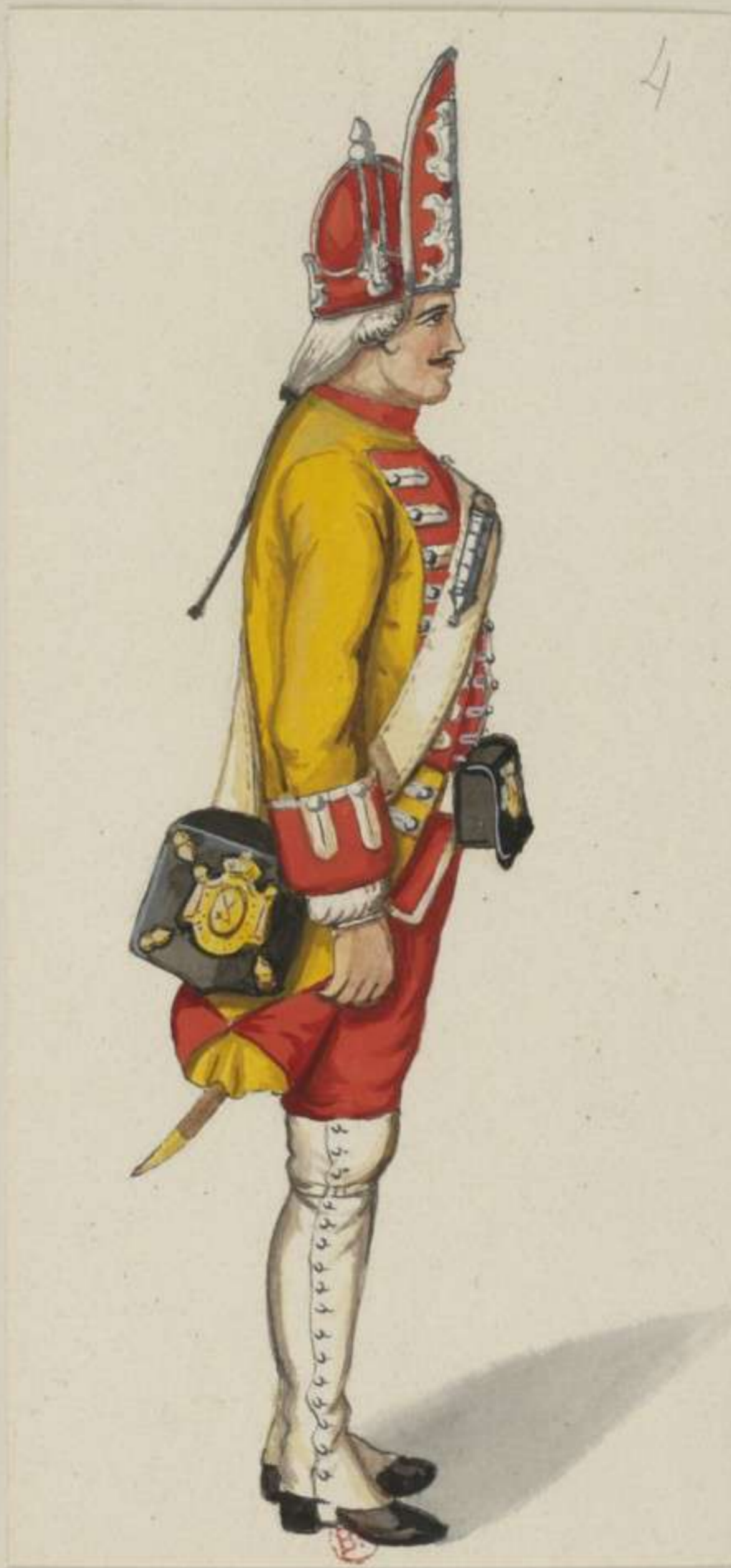
4° - Leib Grenadier Regiment von Rutowsky