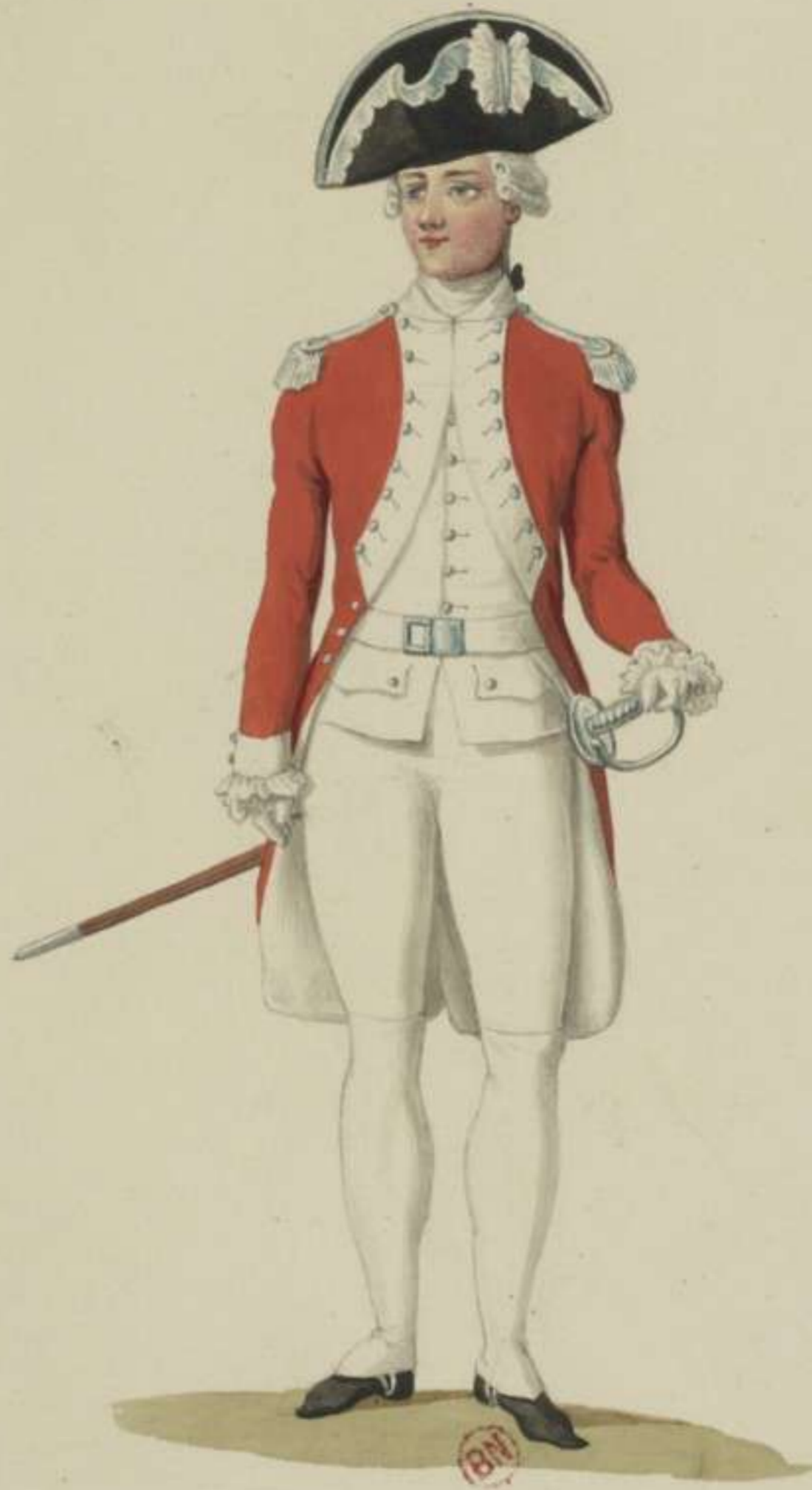
3° - Adeliges Cadetten Corps (Parade)