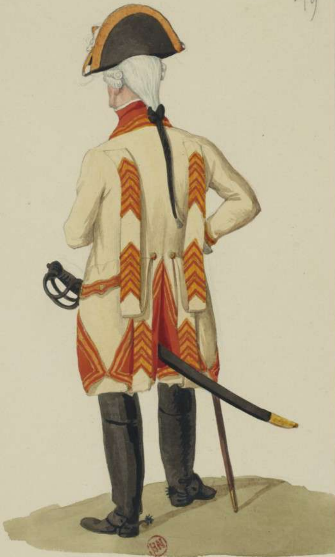
19 o - Trompeter vom Kürassier Regiment Churfürst