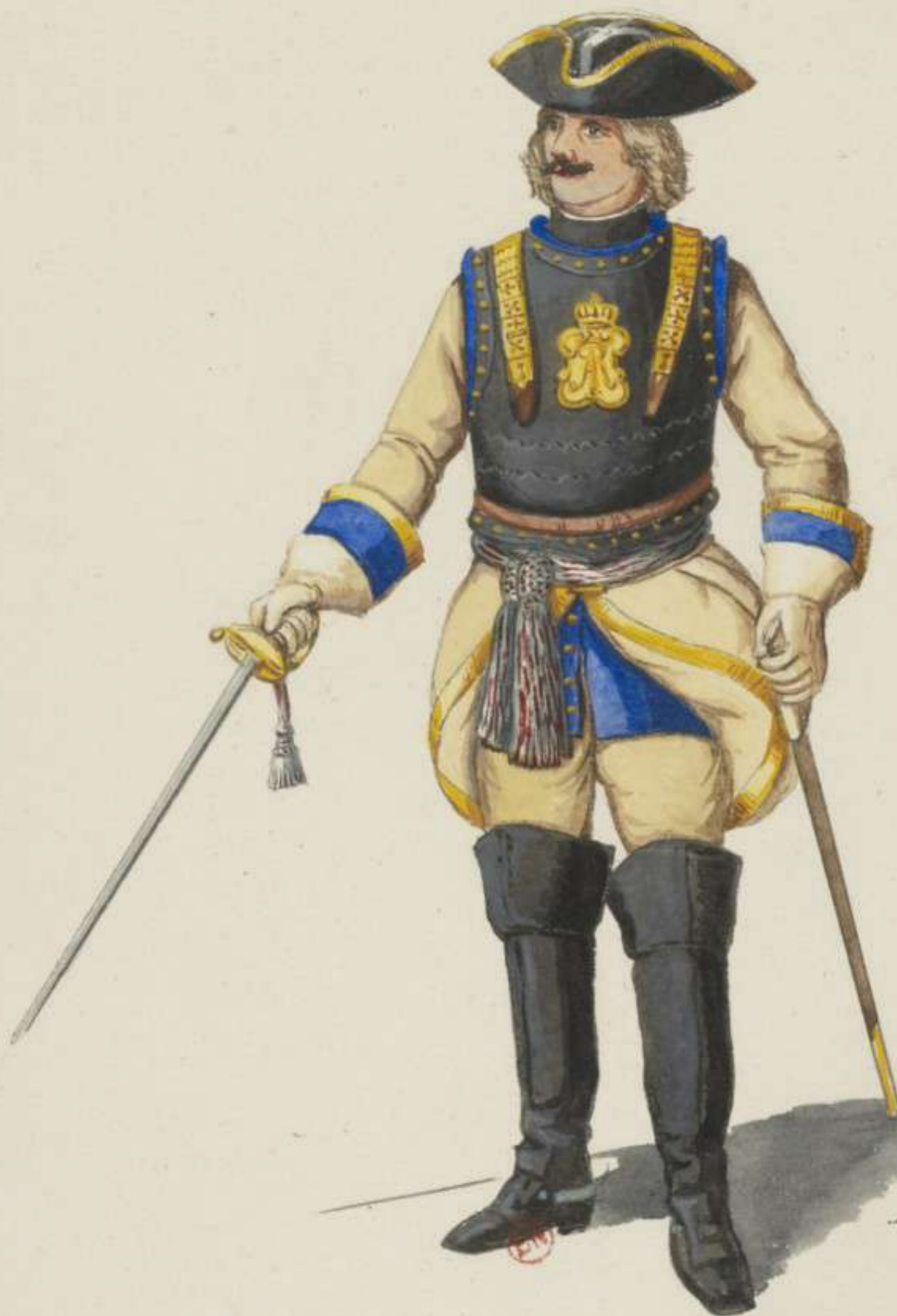
18 o - Officier vom Cürassier Regiment von Damitz - 1707