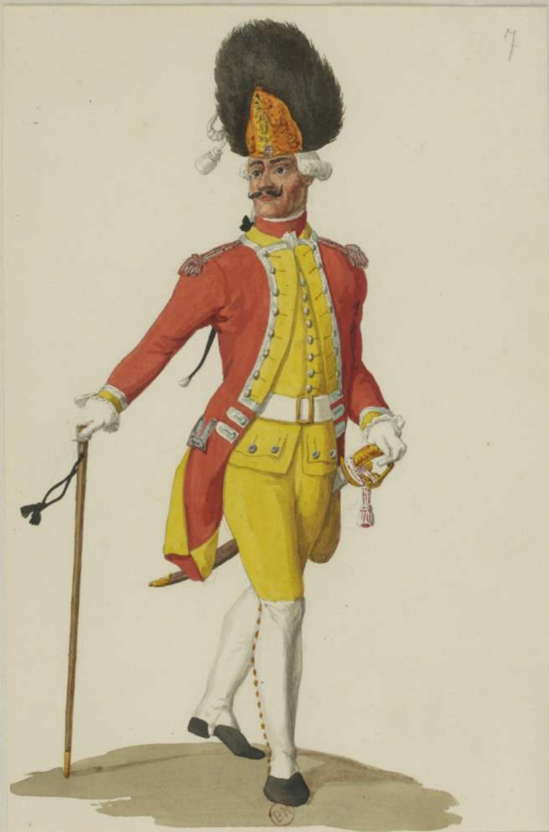
7° - Unterofficier vom Leibgrenadier Garde Regiment