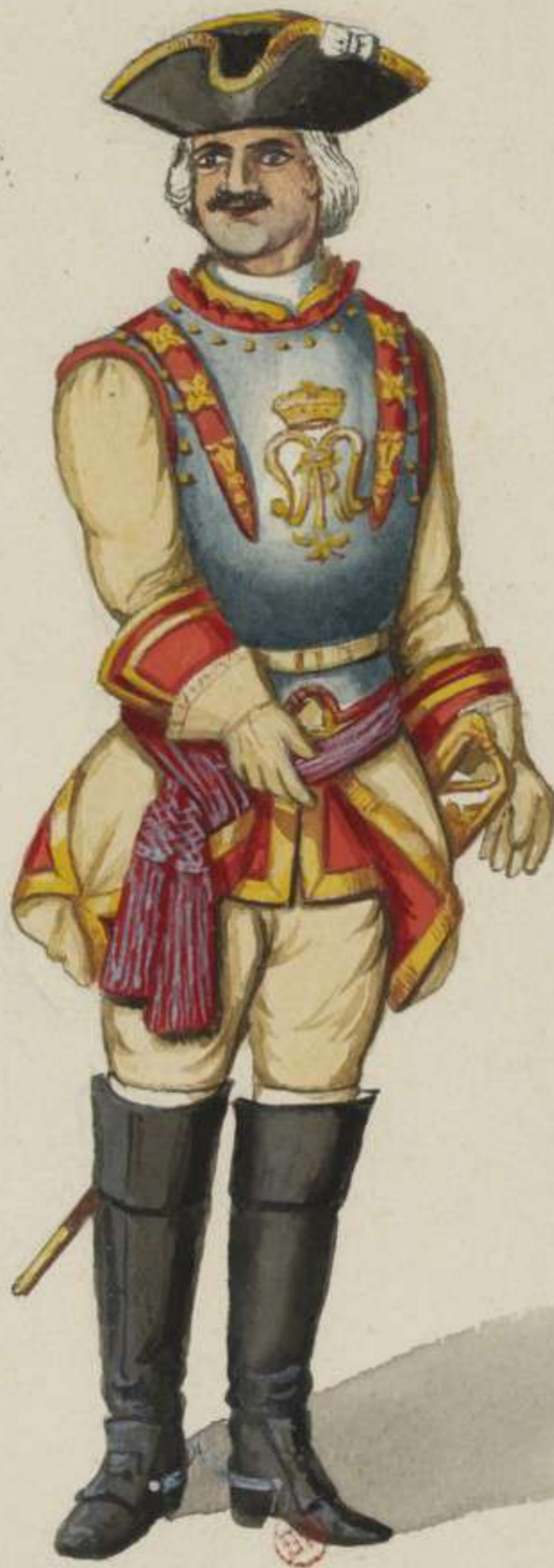
18°- Cürassier Officier