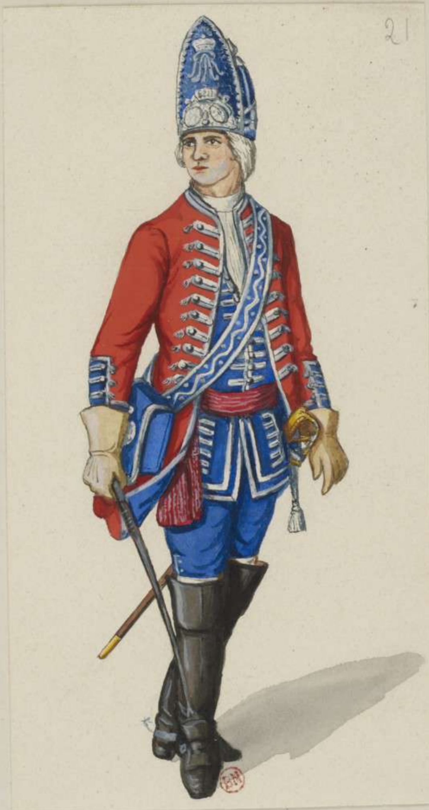
21°- Officier der Reitenden Grenadiere