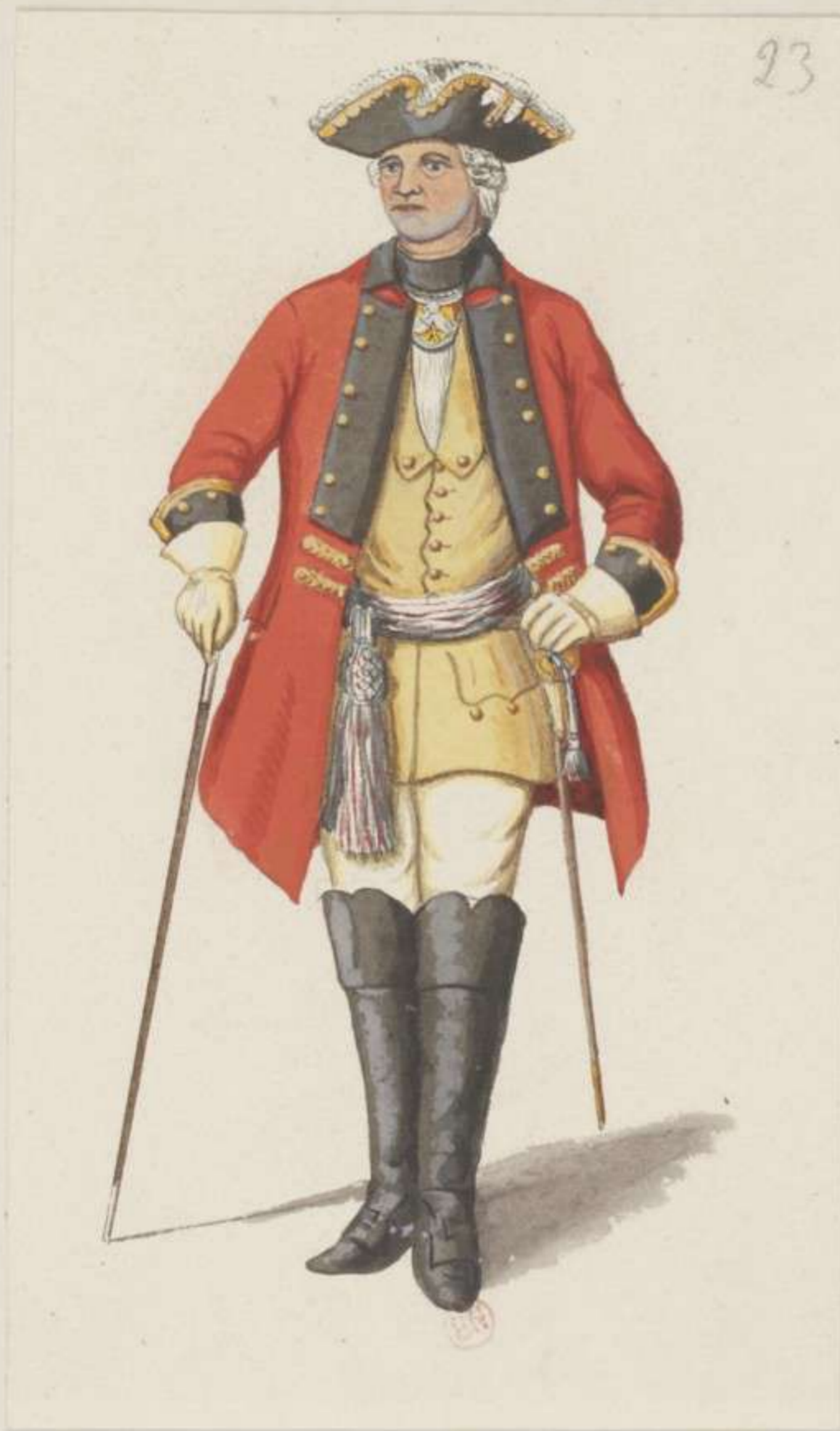
23°- Officier vom Chevaulegers Regiment von Rutowsky - 1745