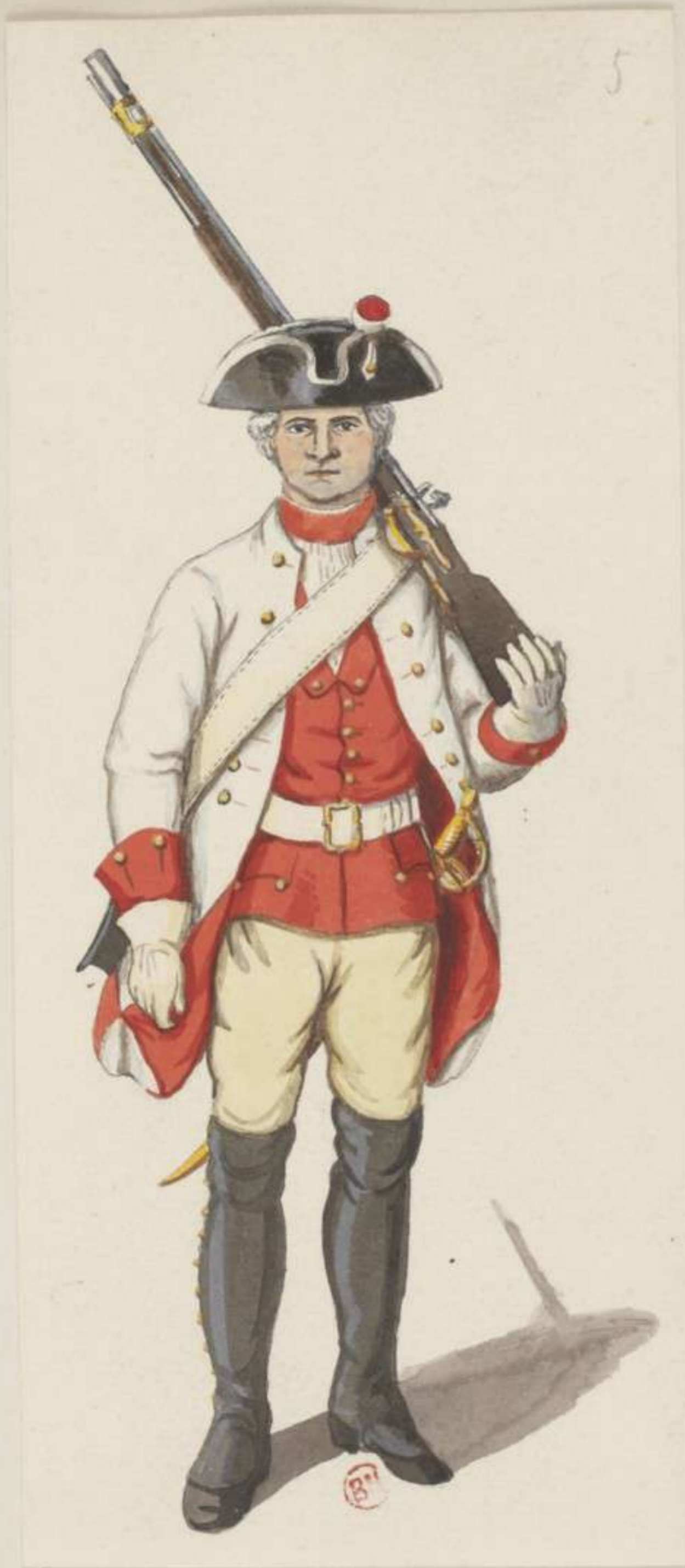
5° - Gardist vom Regiment Erste Garde - 1741