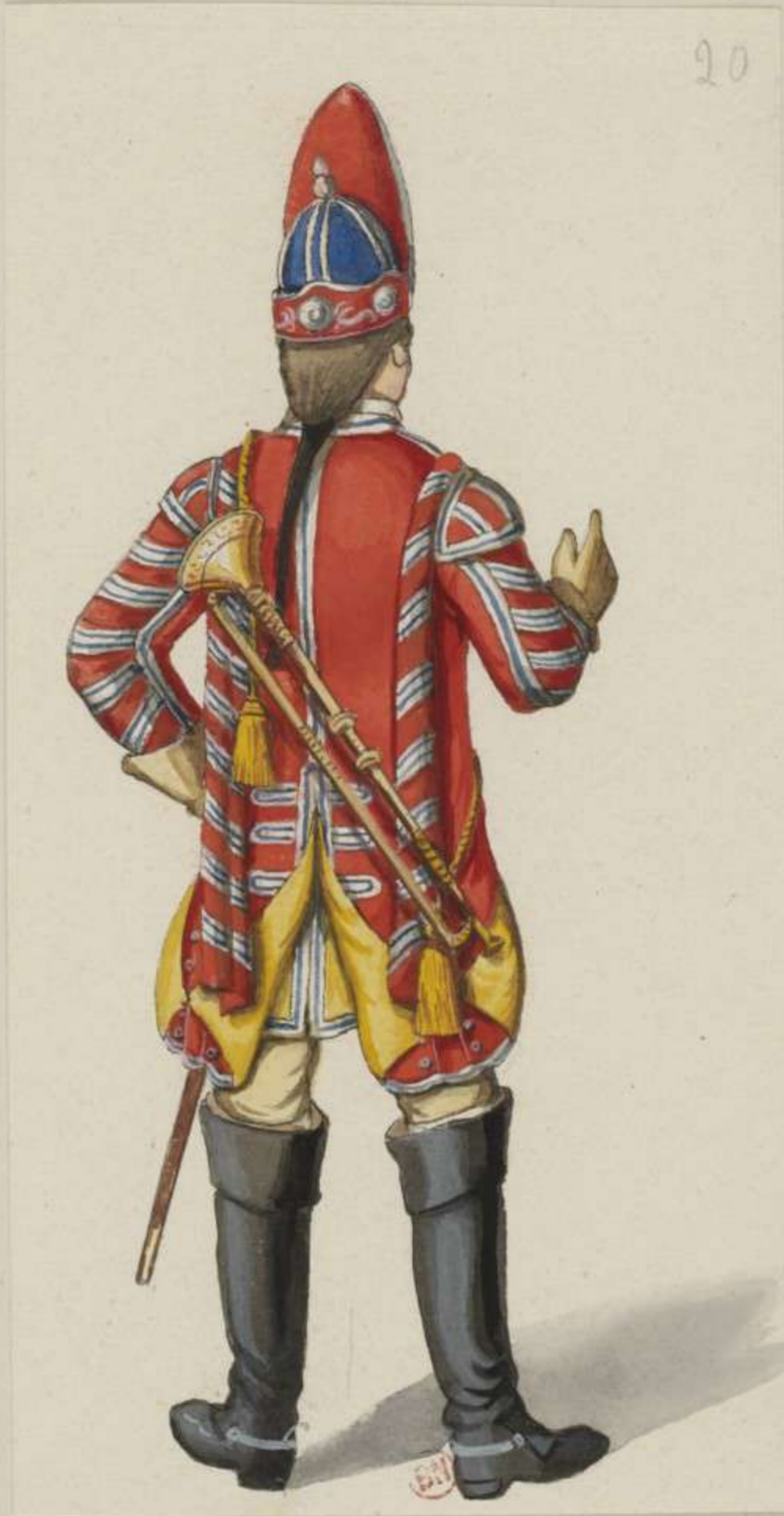
20°- Trompeter der Reitenden Grenadiere