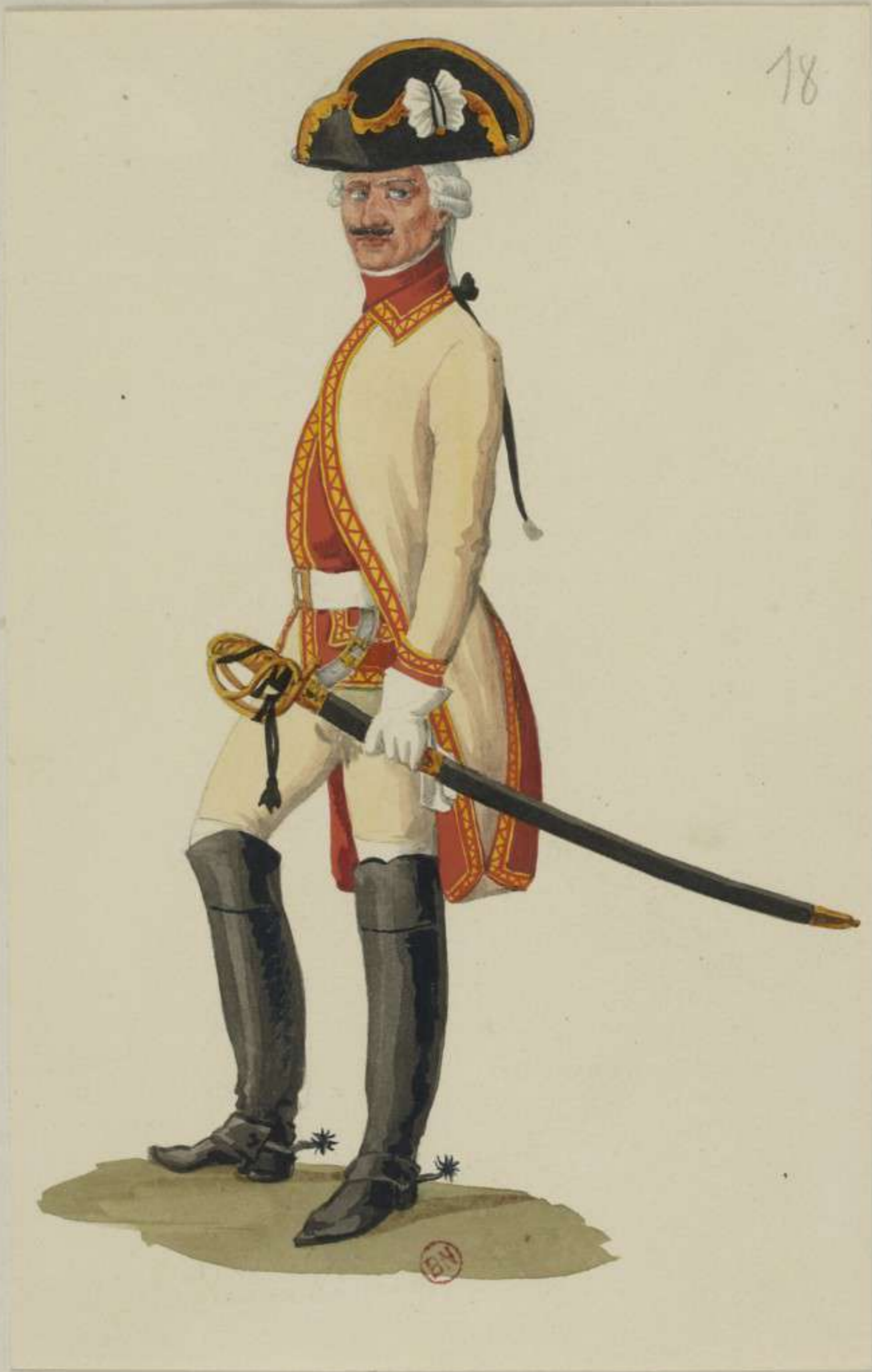
18°- Reiter vom Carabiniers Regiment