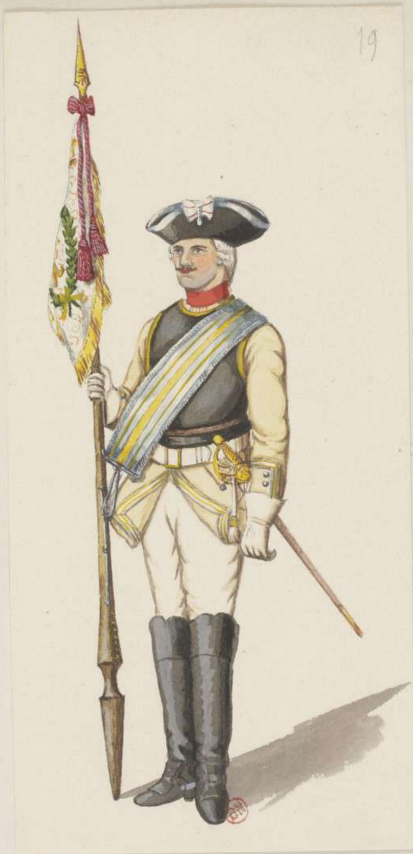
19 o - Standarten Junker vom Cuirassier Regiment von Rechenberg - 1745