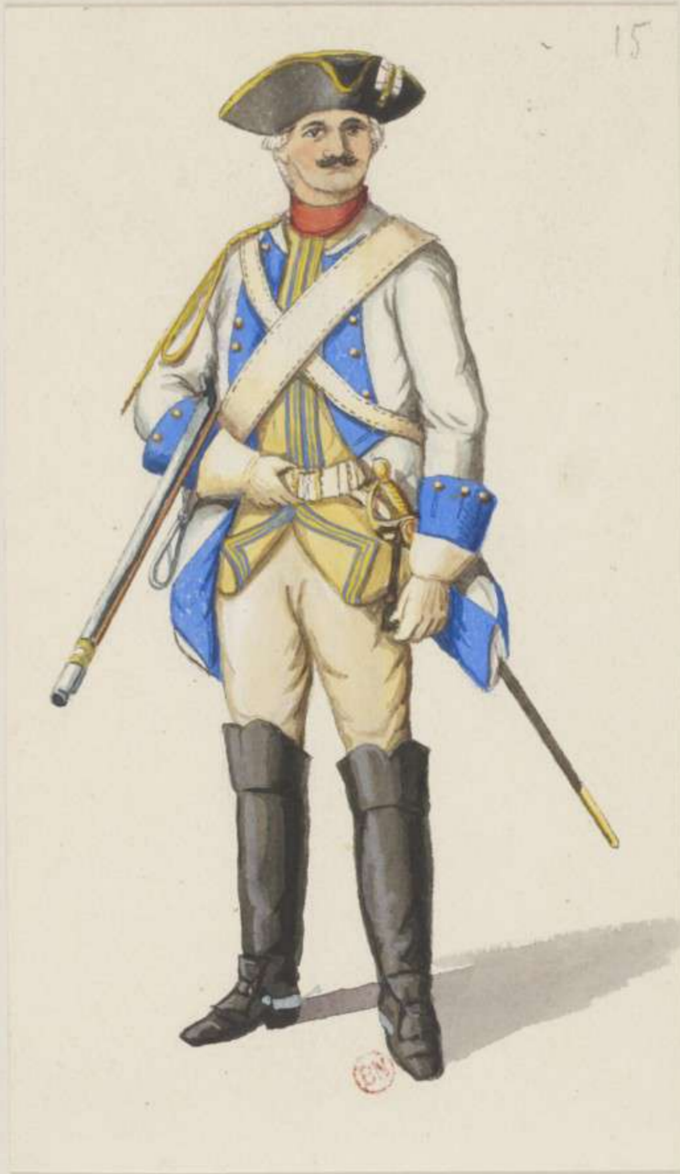
15°- Garde du Corps - Exercier Collet - 1745