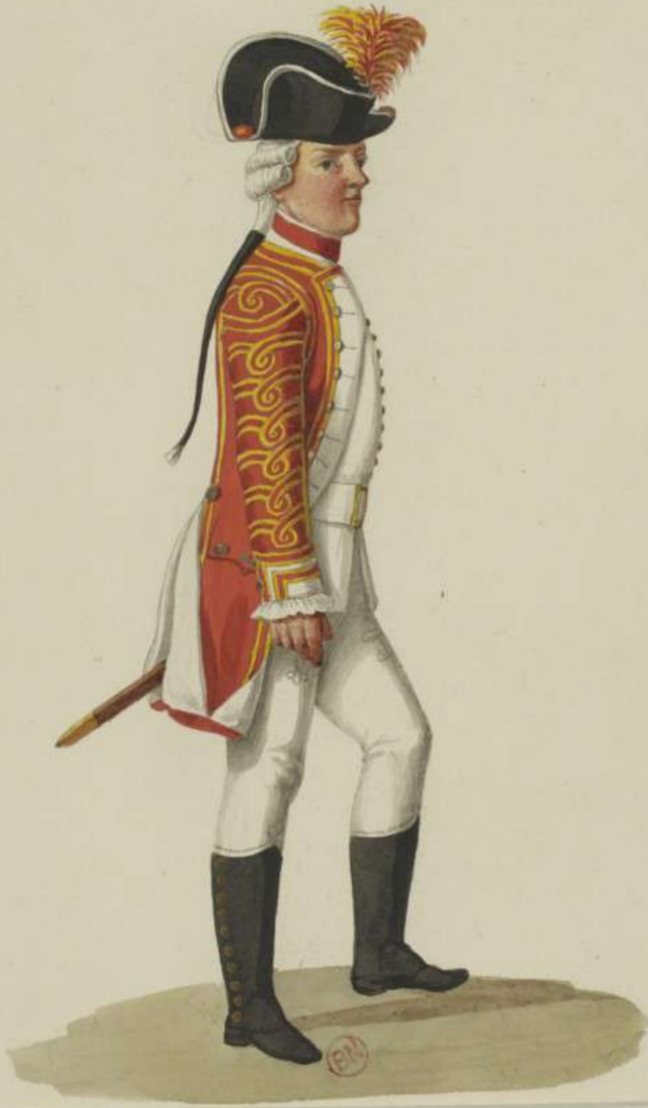
9° - Pfeiffer vom Infanterie Regiment Churfürst