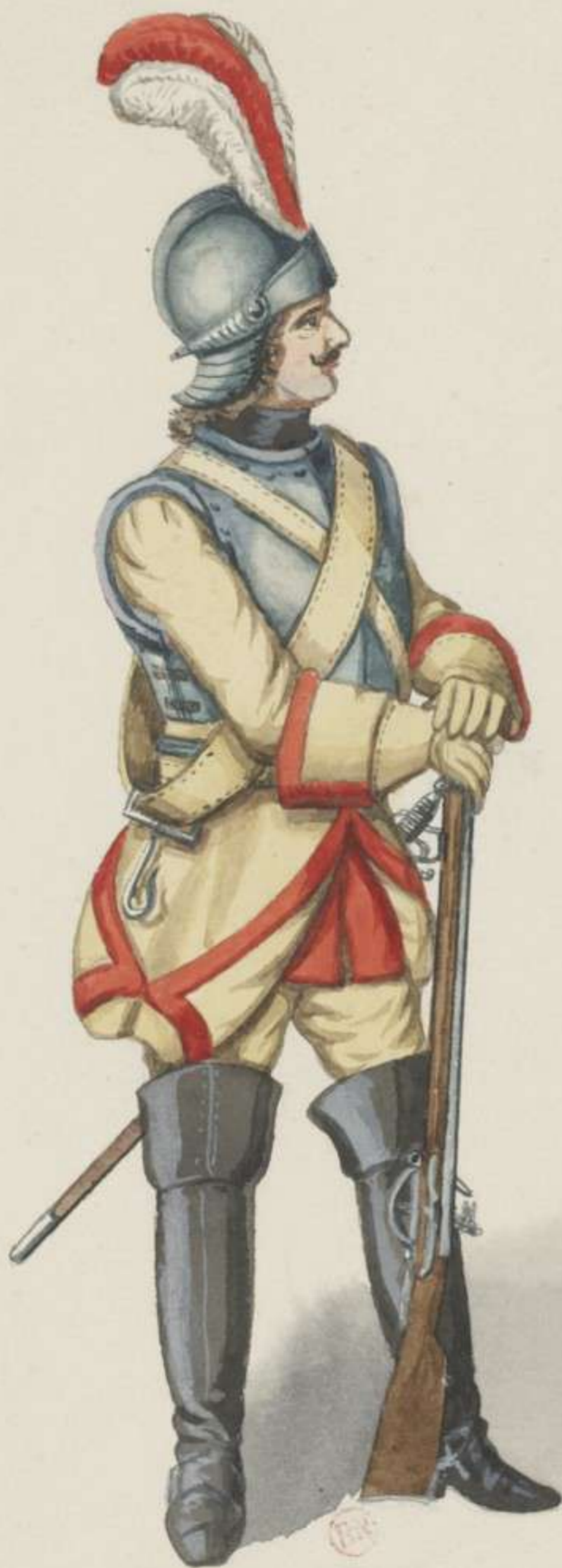
2° - Leib Cürassier Regiment - Dienst Anzug - 1699