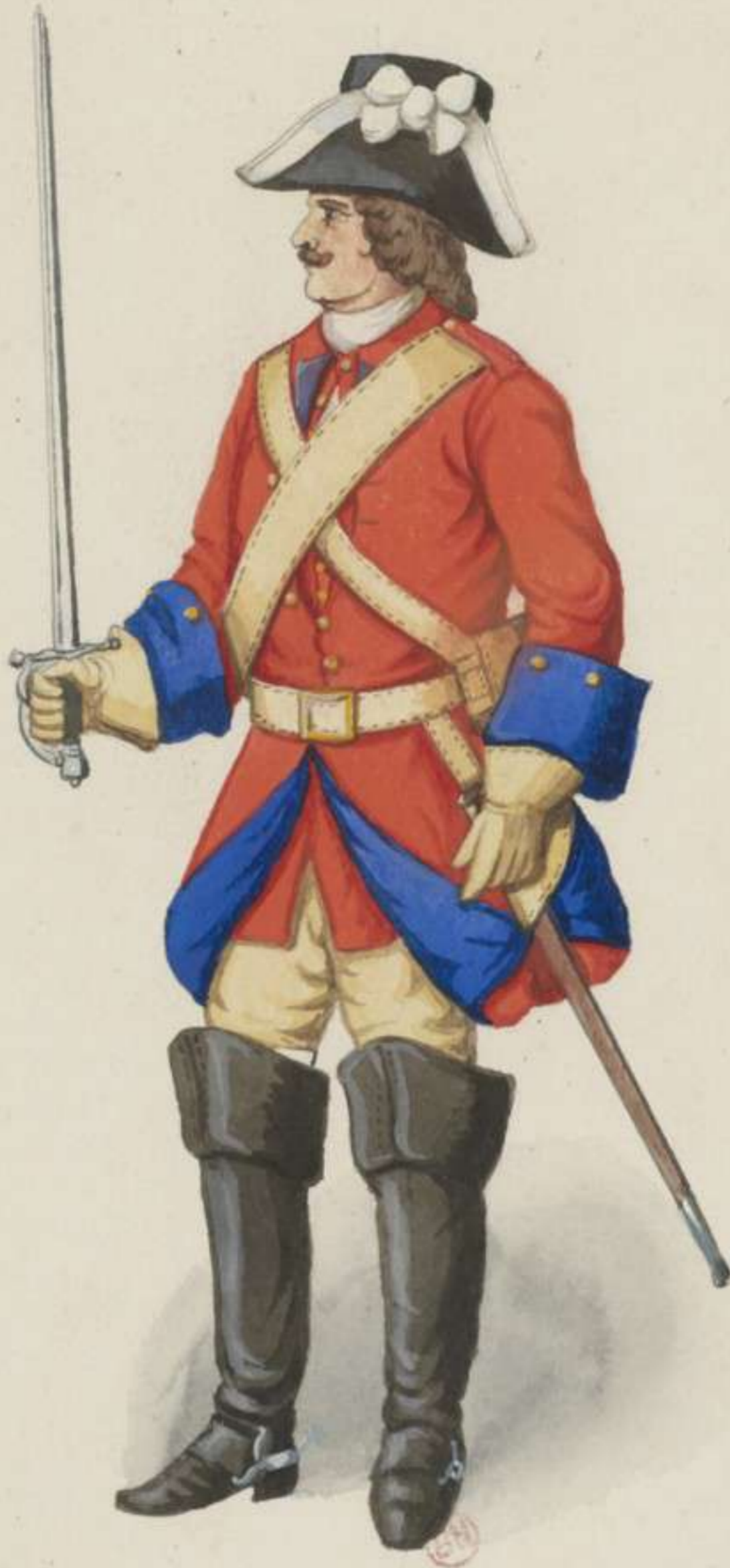
16 o - Dragoner - 1706