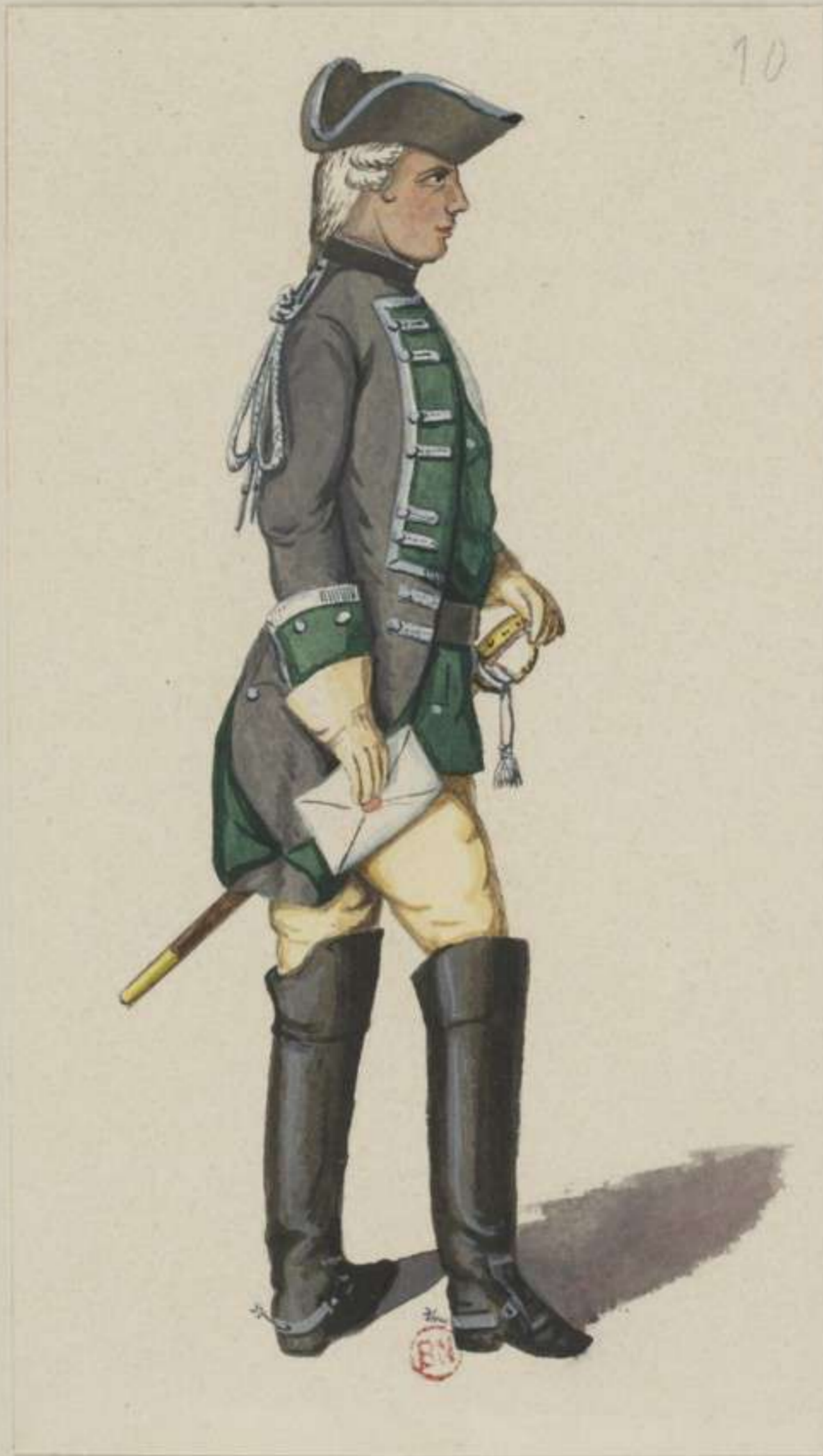
10 o - Reitende Feldjäger - 1750