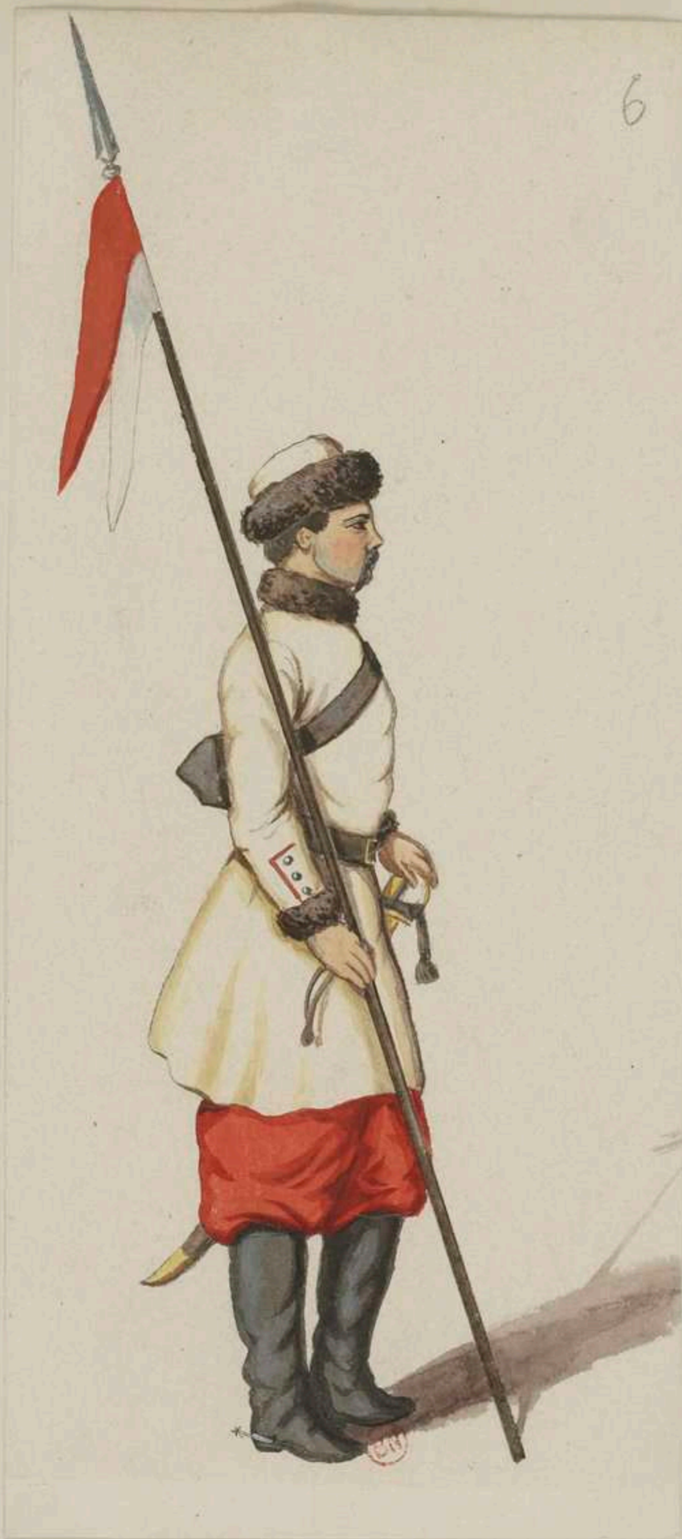
6° - Sächsisch Polnischer Uhlans - 1736