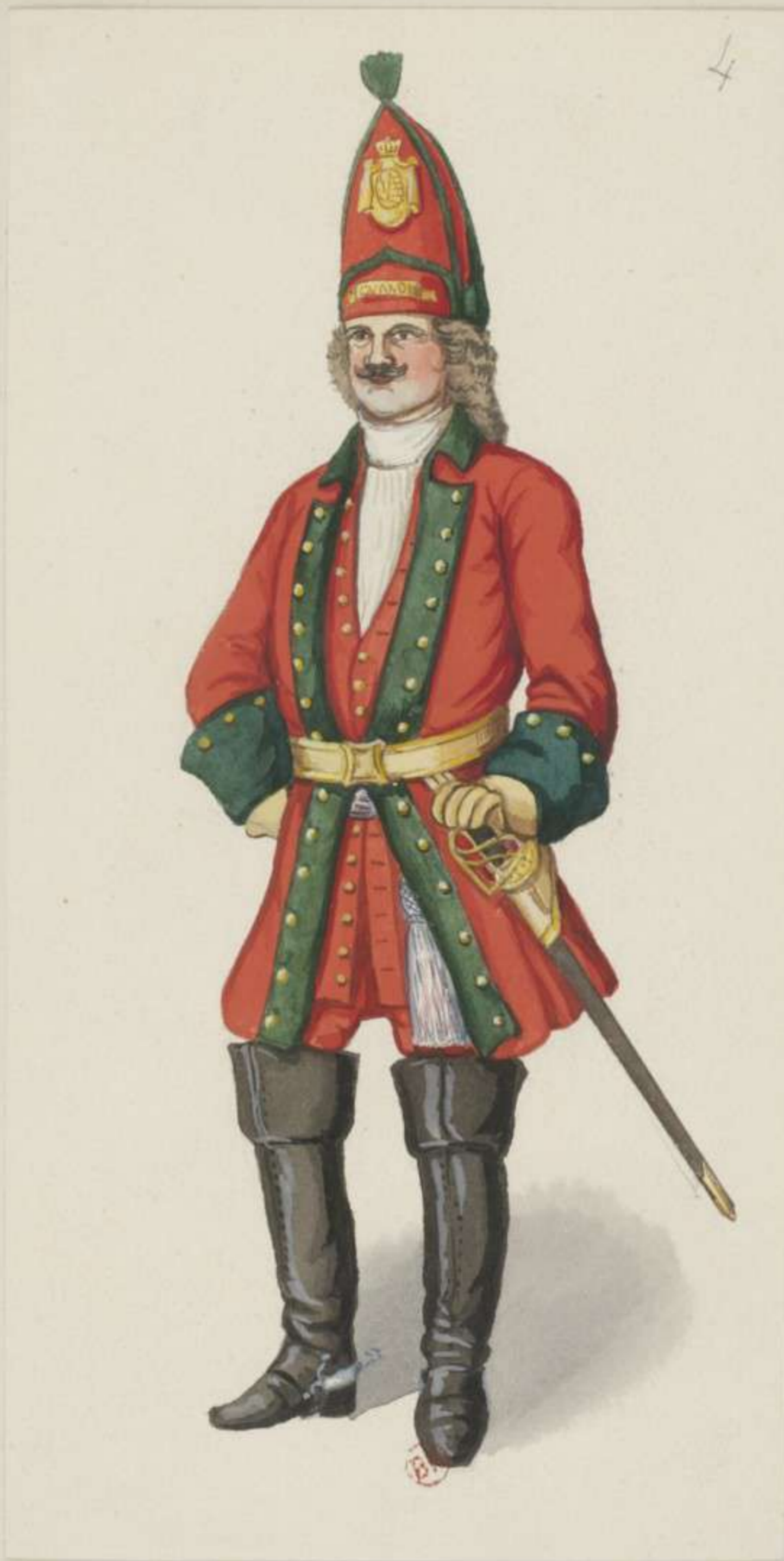
4° - Leibgarde zu Pferd - Officier - 1699