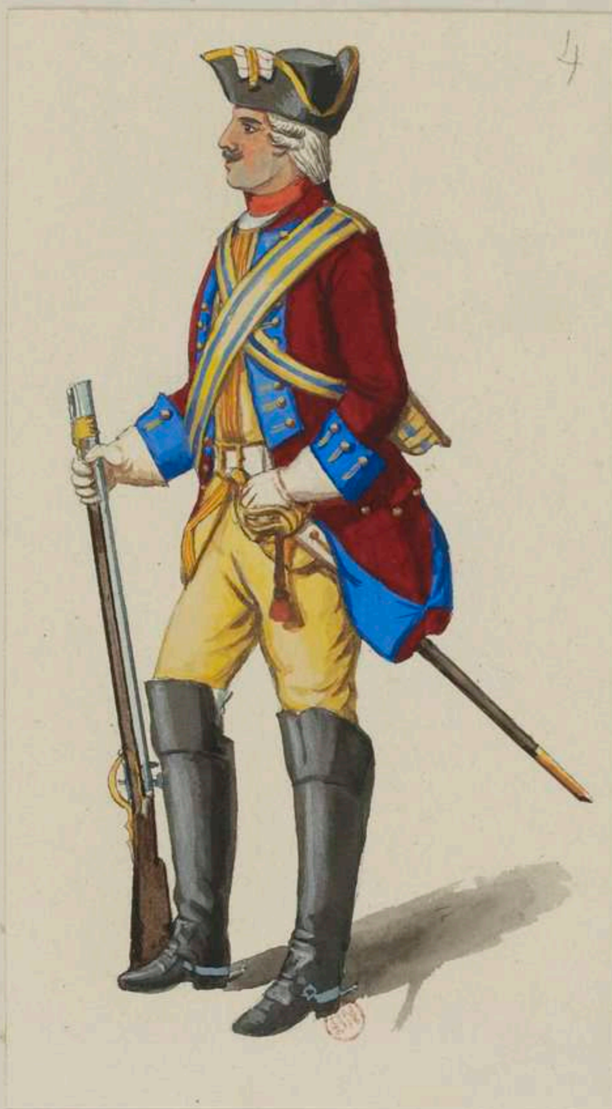
4° - Garde du Corps - Trabant - 1735-1738