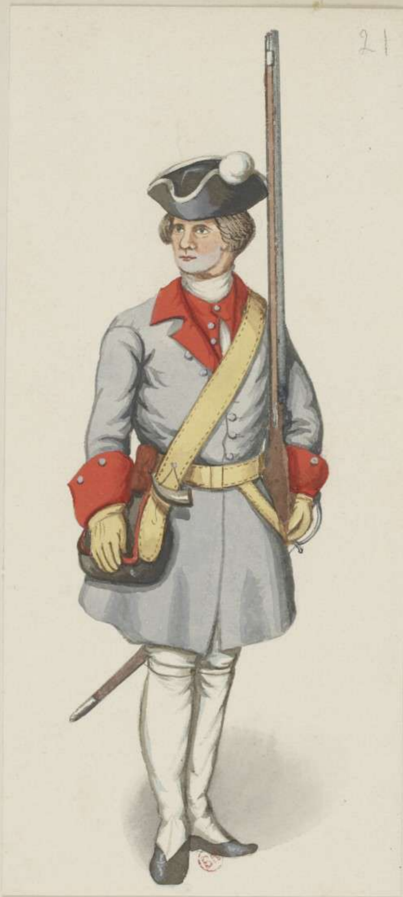
21°- Gemeiner von der Land Miliz - 1712