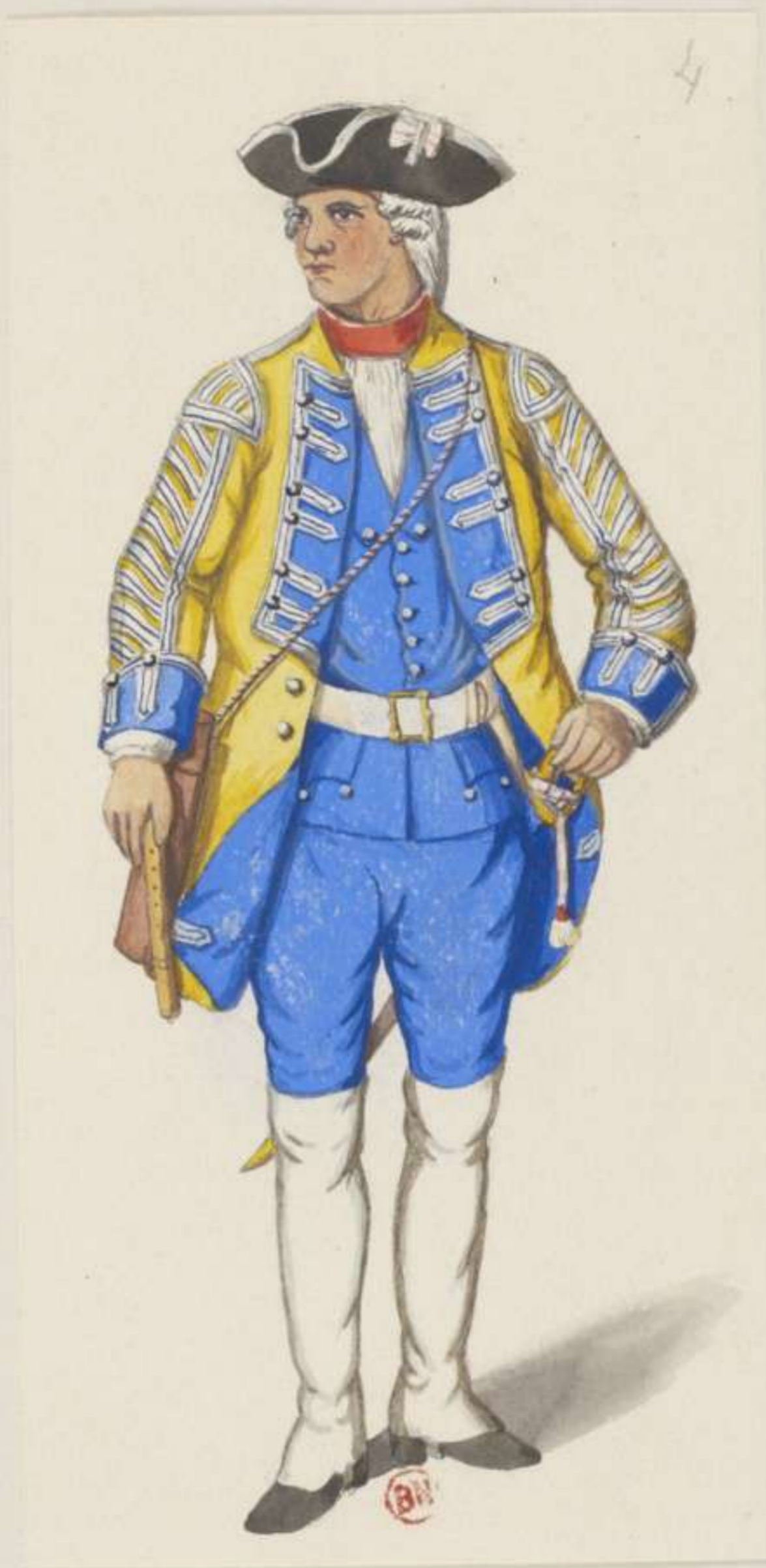
4° - Leib Grenadier Garde - Pfeifer - 1745