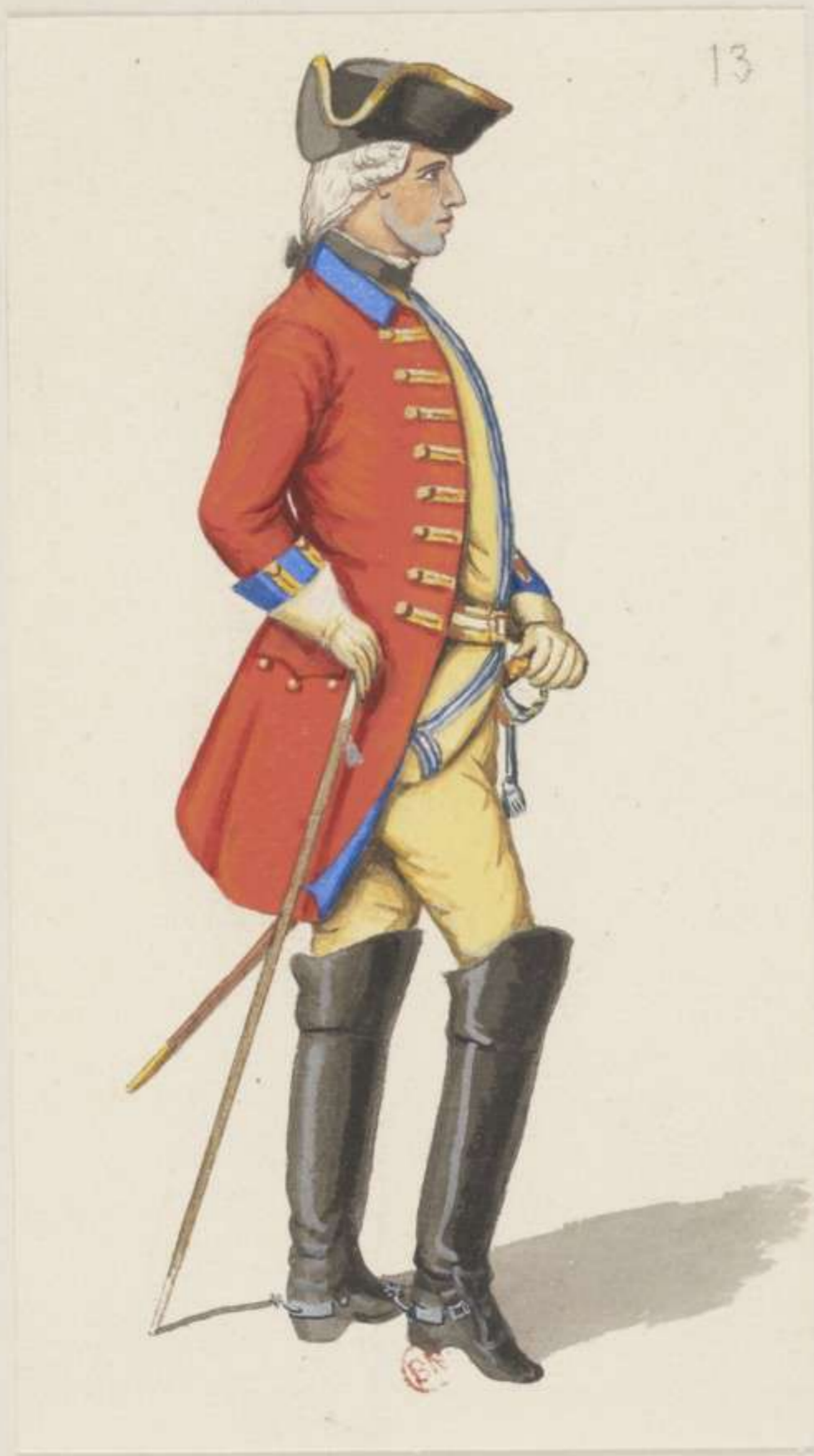
13°- Garde du Corps - Officier in Interims Uniform - 1745