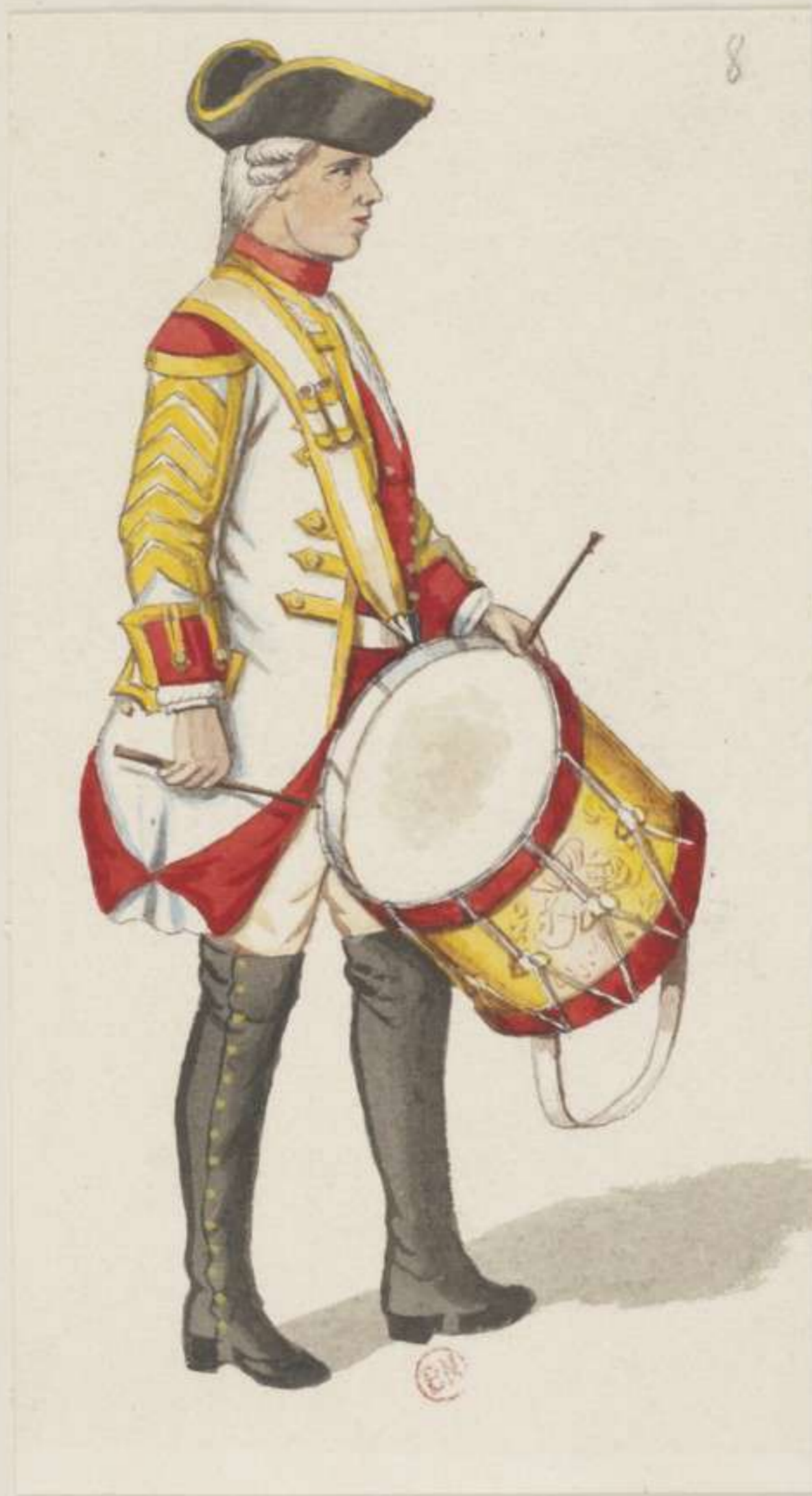
8° - Infanterie Regiment Königin - 1740-1757