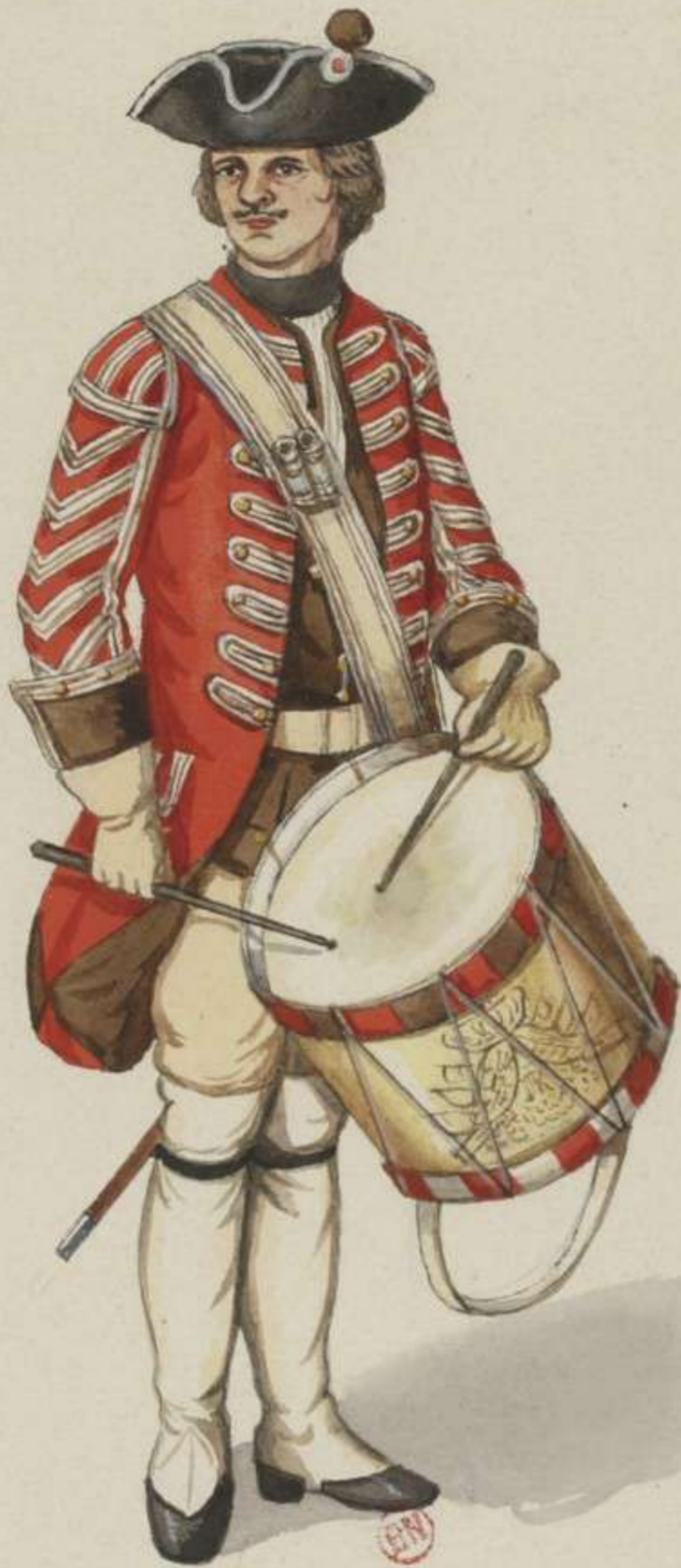
10°- Infanterie Regiment Wilcke