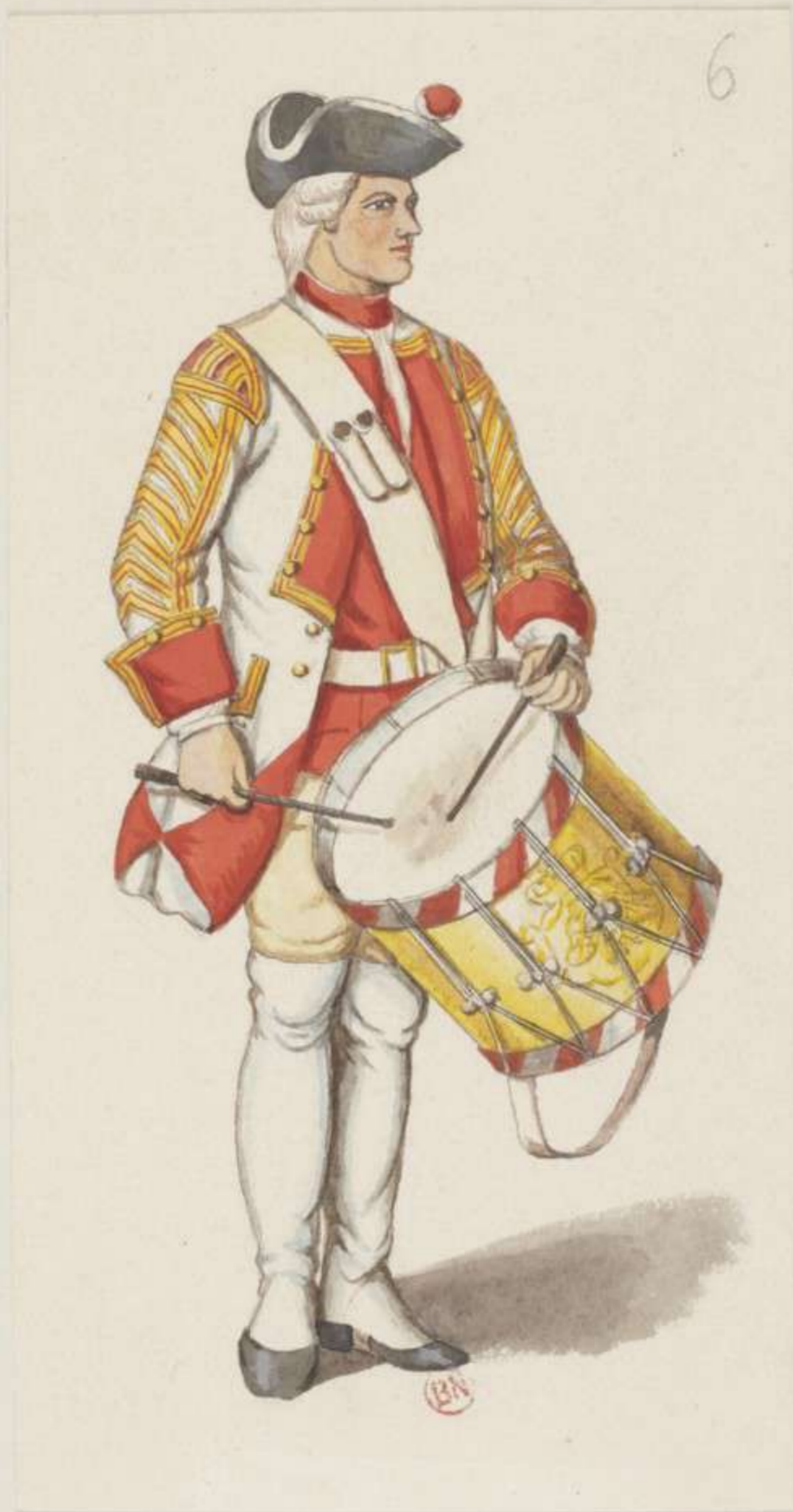
6° - Trommler vom Regiment Erste Garde - 1745