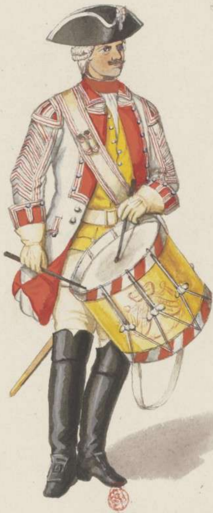
22°- Dragoner Regiment Chevalier de Saxe - 1743