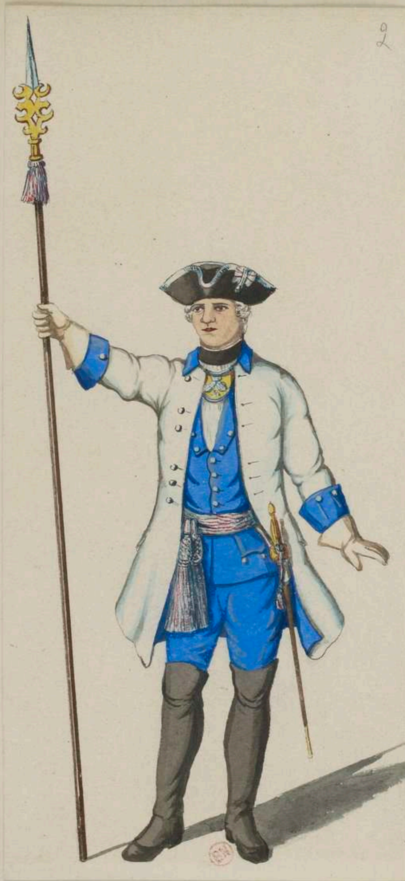
2° - Lieutenant vom Infanterie Regiment Prinz Xaver - 1735