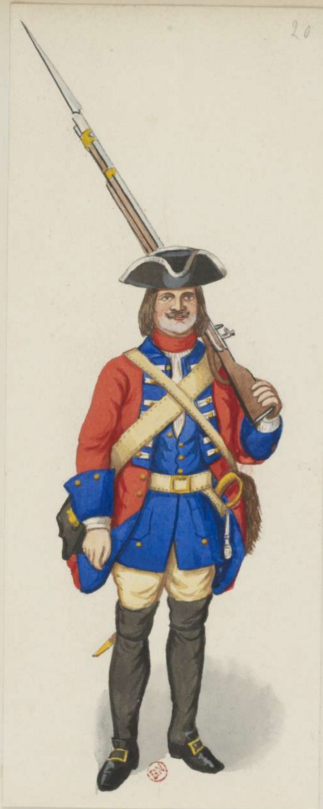
20° - Musketier vom Infanterie Regiment Graf Flemming - 1711