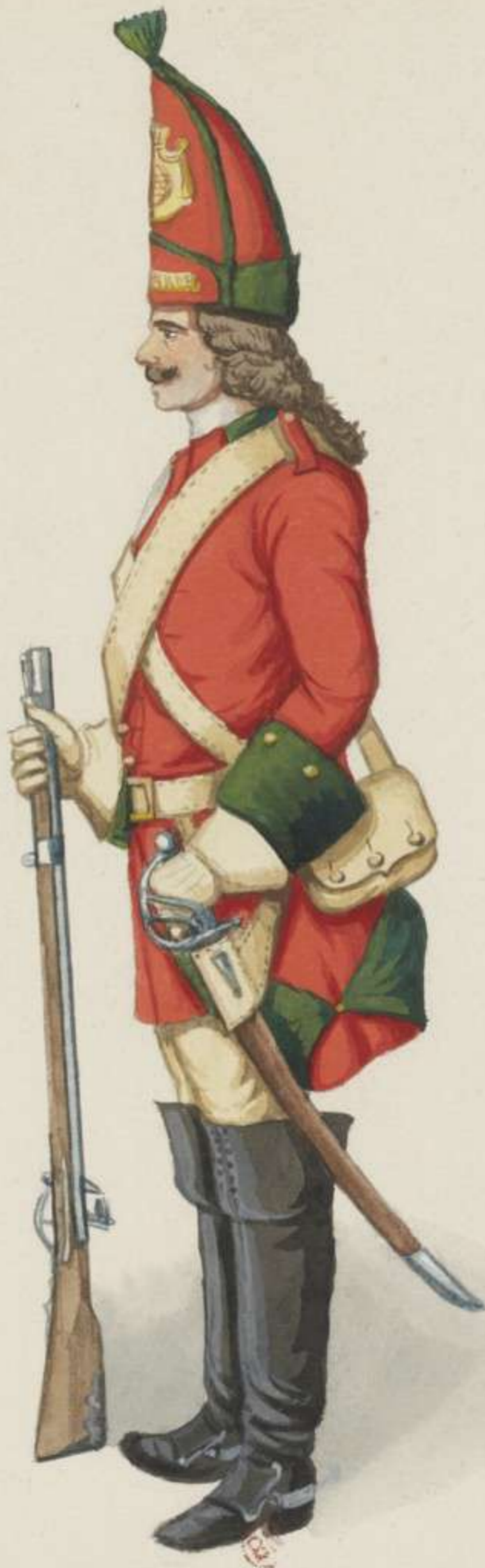
5° - Leibgarde zu Pferd - 1699