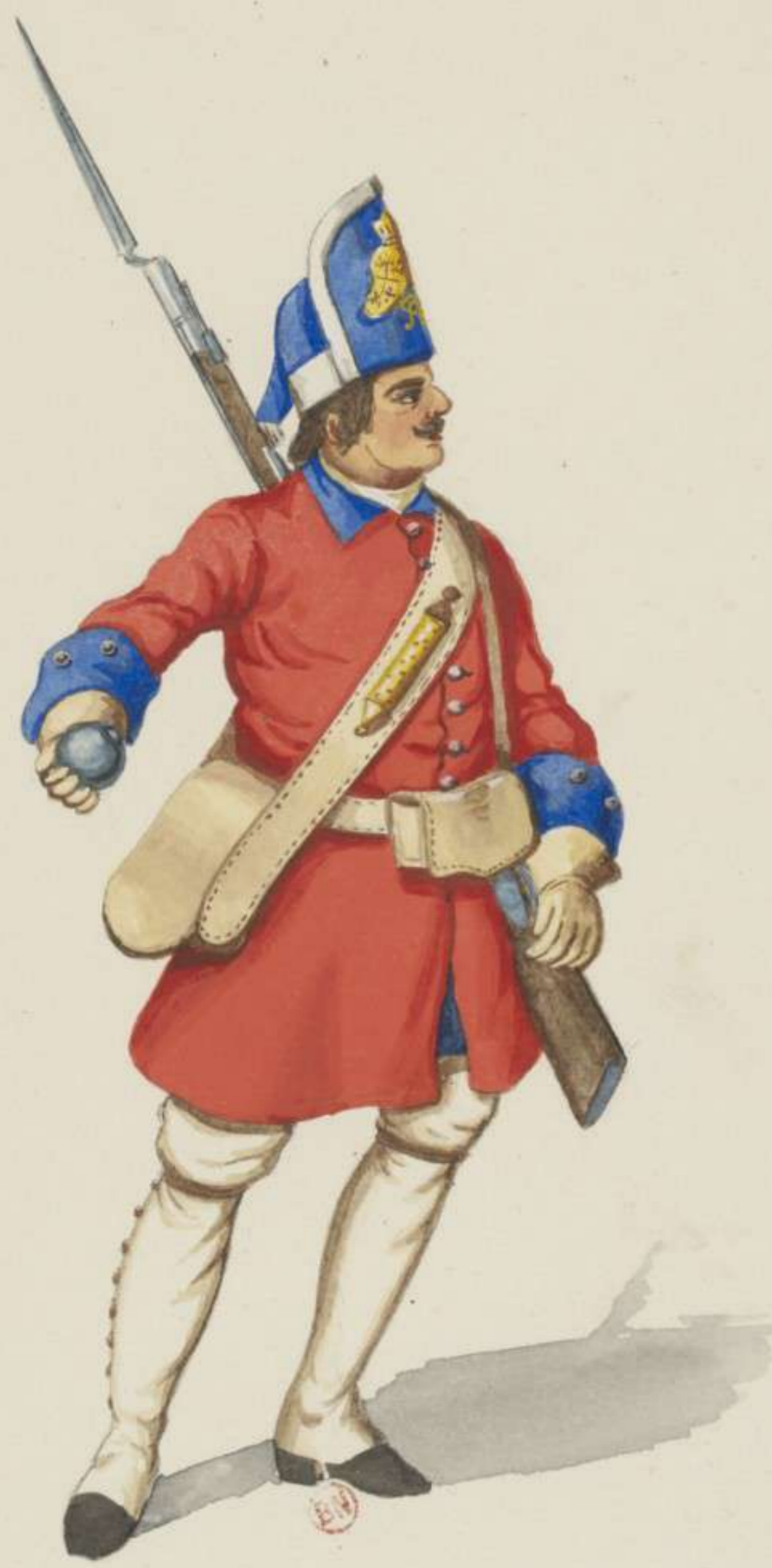
12° - Grenadier vom Leib Regiment - 1701