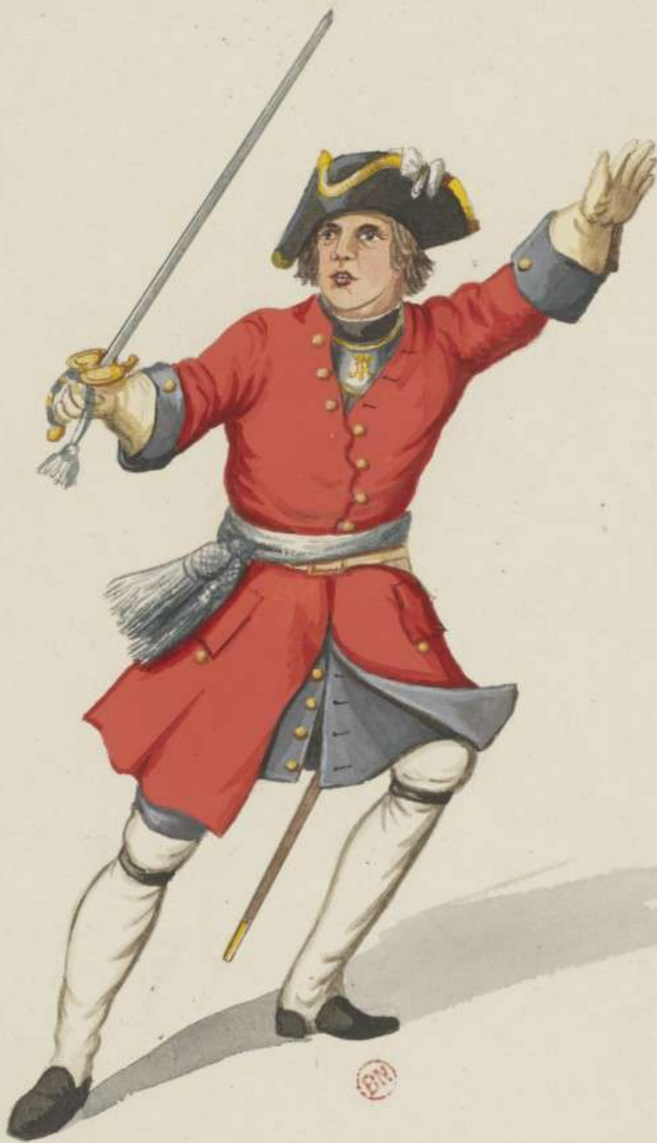
23° - Officier vom Infanterie Regiment von Beichlingen - 1715