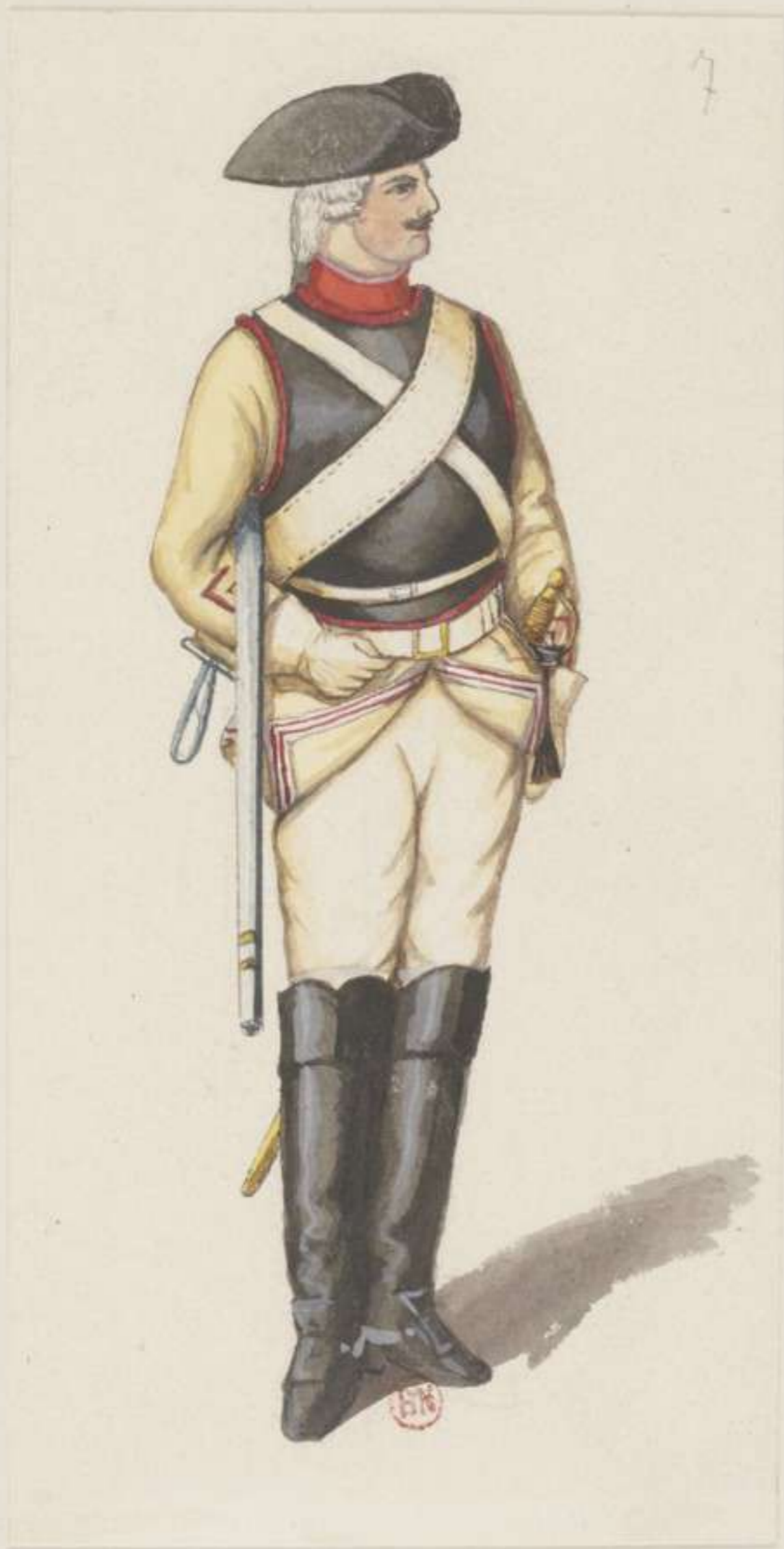
7° - Cürassier Regiment von Arnim - 1740