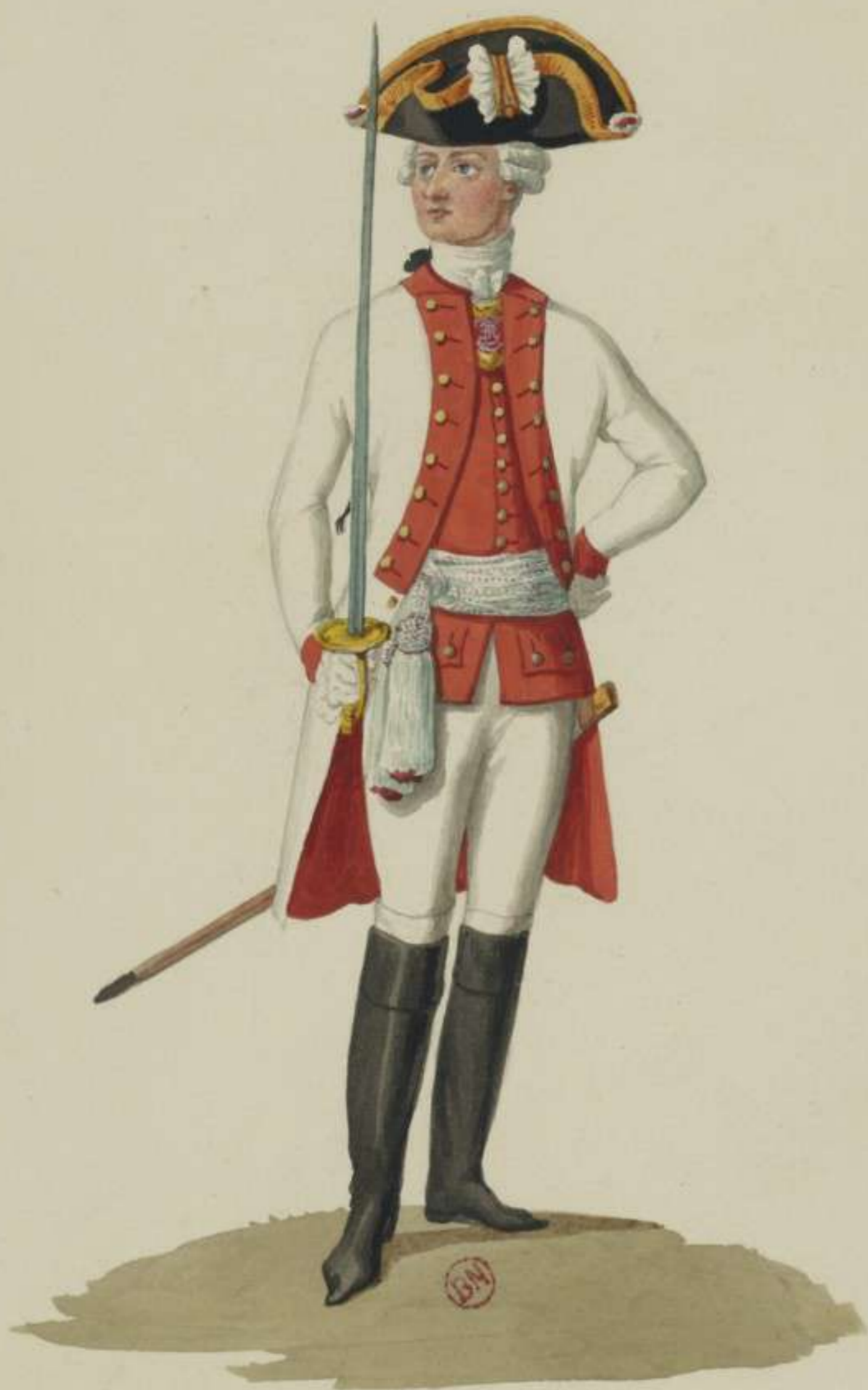
10°- Officier vom Infanterie-Regiment Churfürst