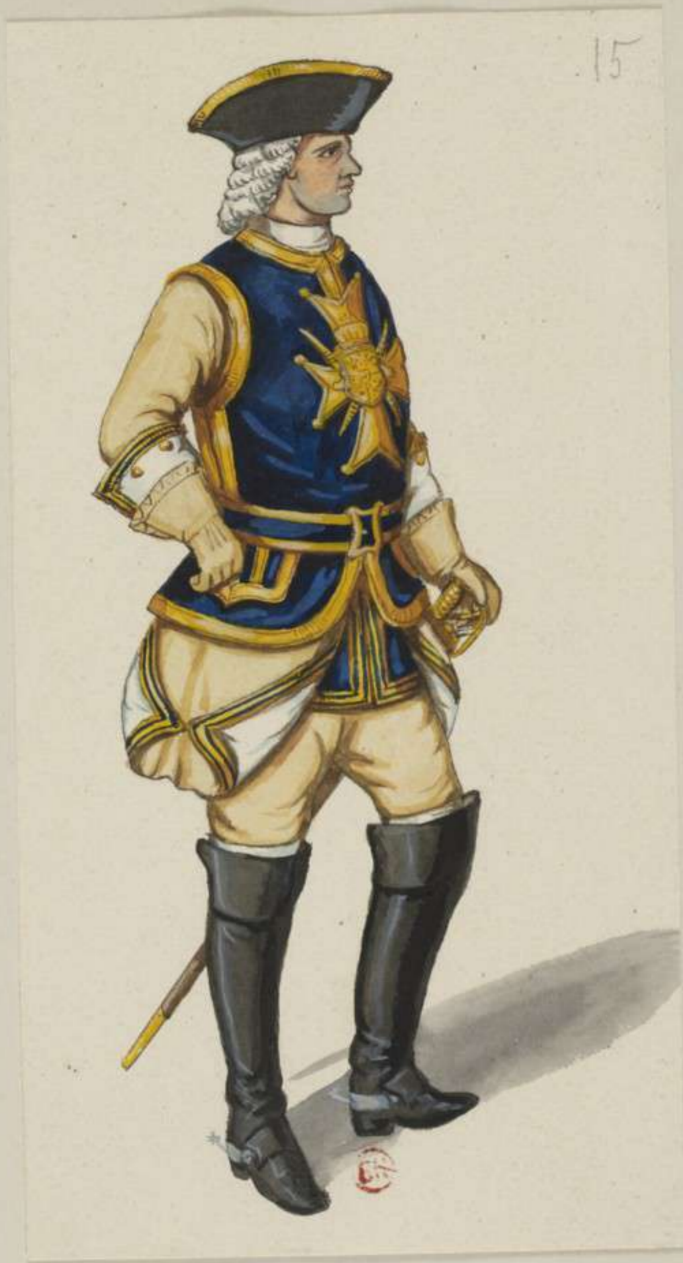
15°- Compagnie der Chevalier Gardes