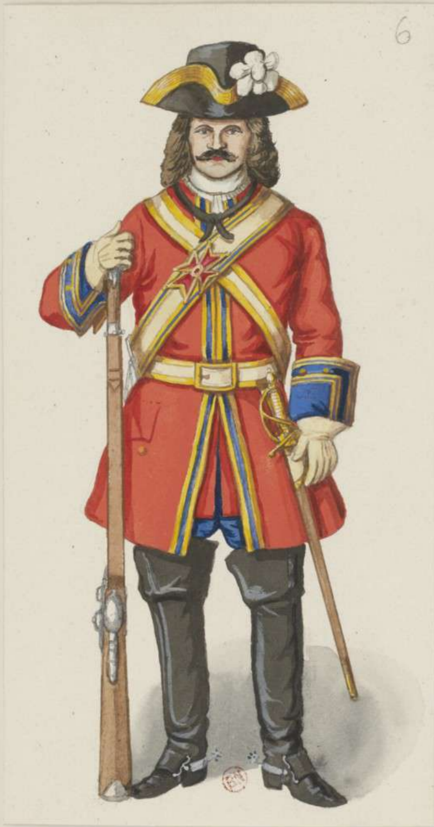
6° - Compagnie Grands Mousquetaires - 1700