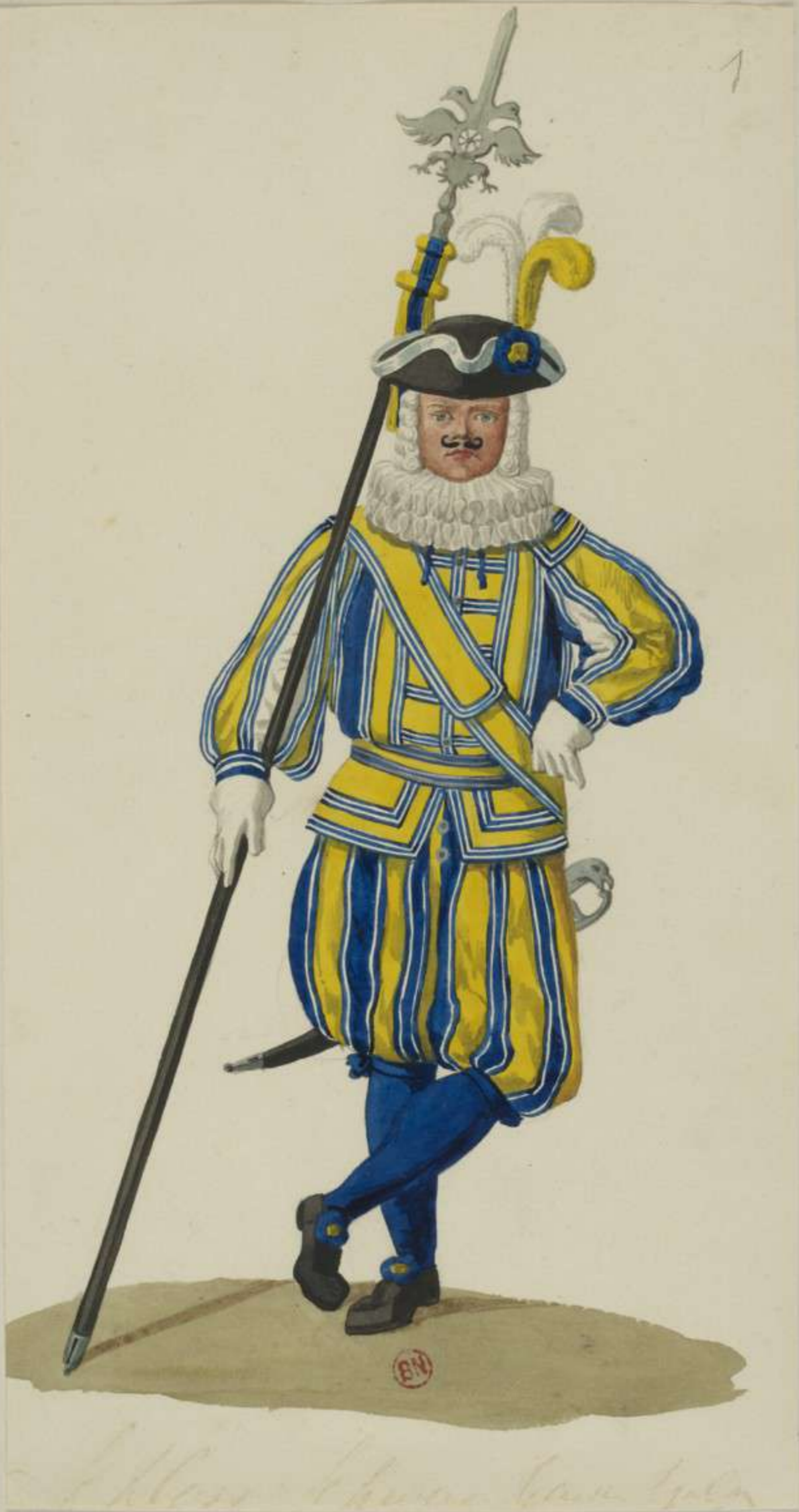
I° - Schloss Schweizer Garde - Gala