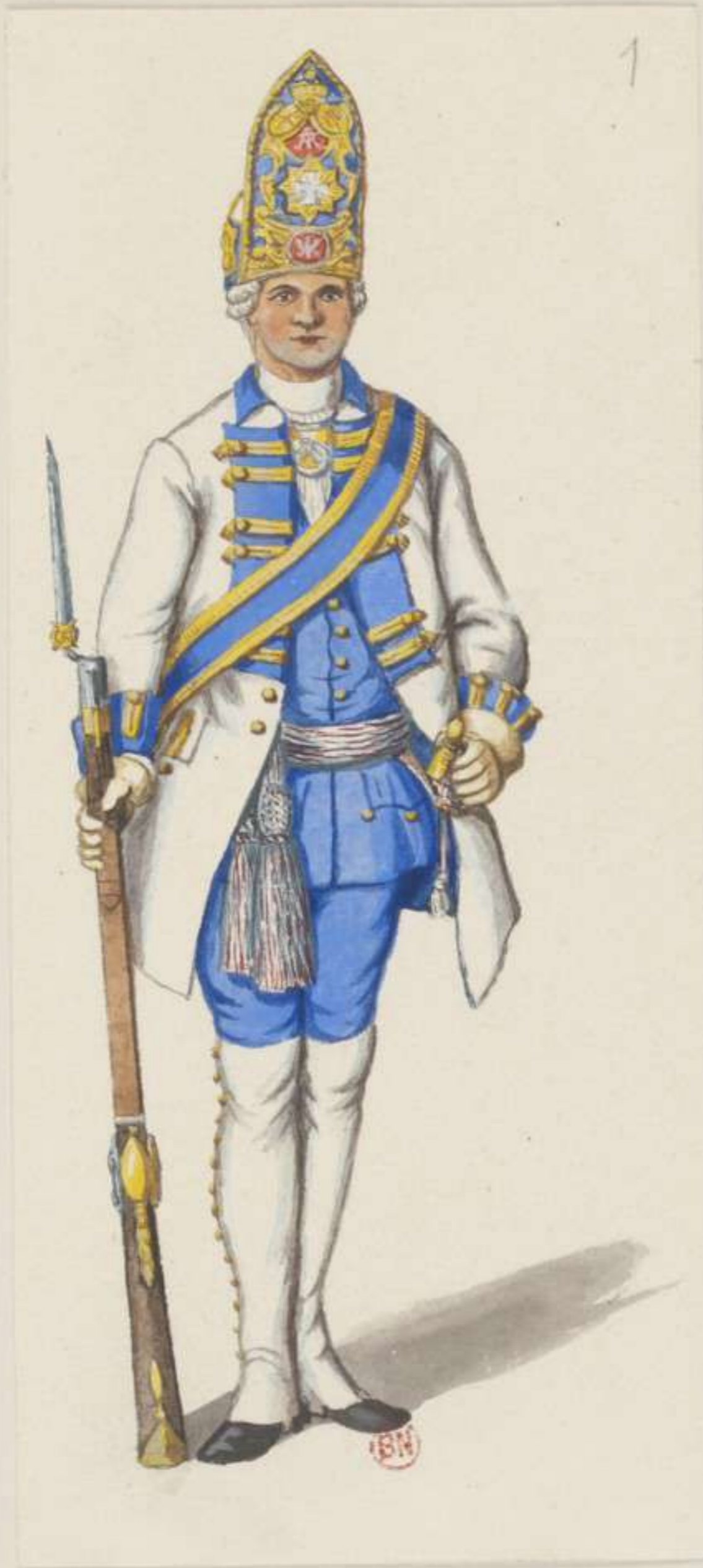
1° - Leibgrenadier Garde - Officier - 1740