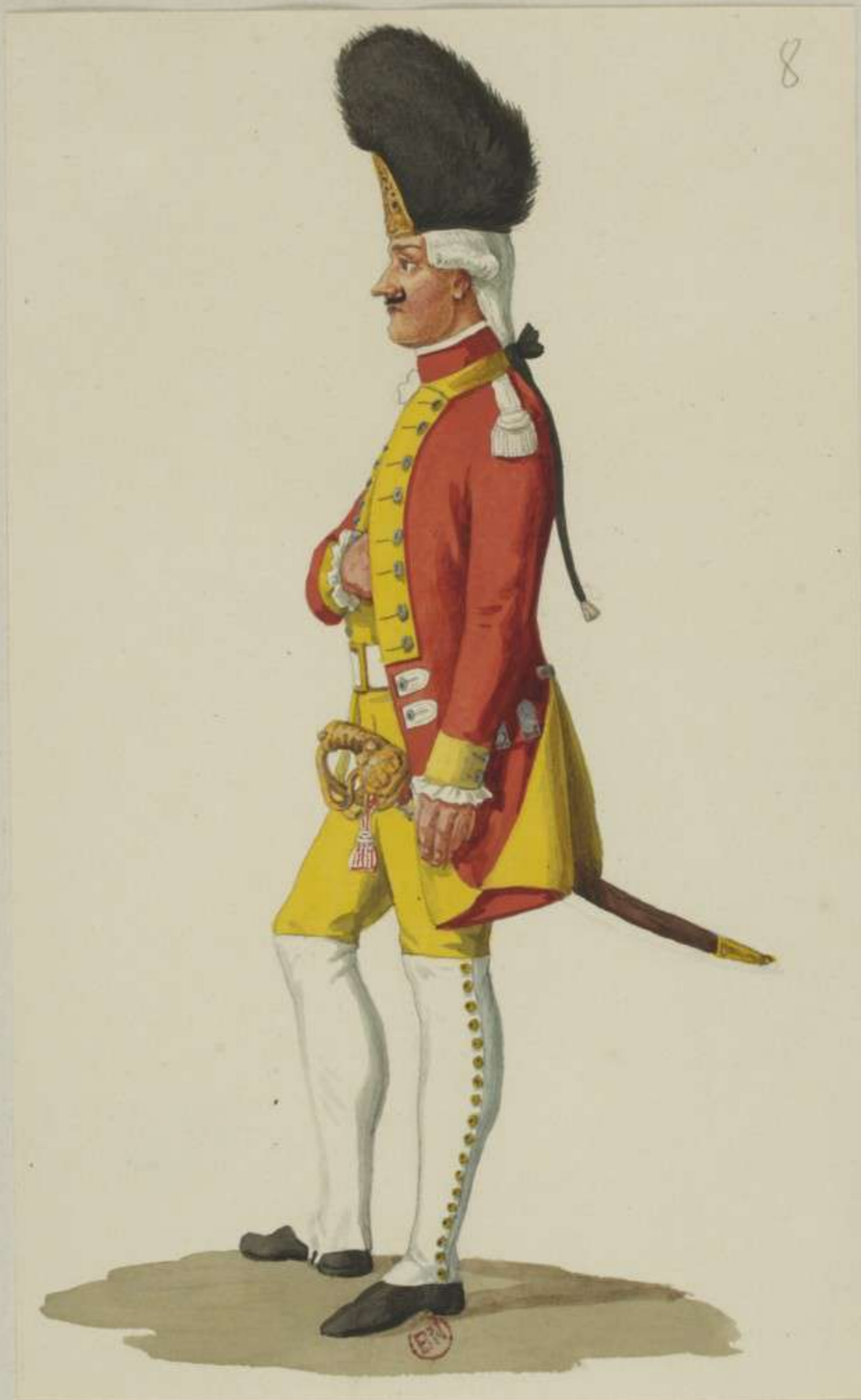
8° - Grenadier vom Leibgrenadier Garde Regiment