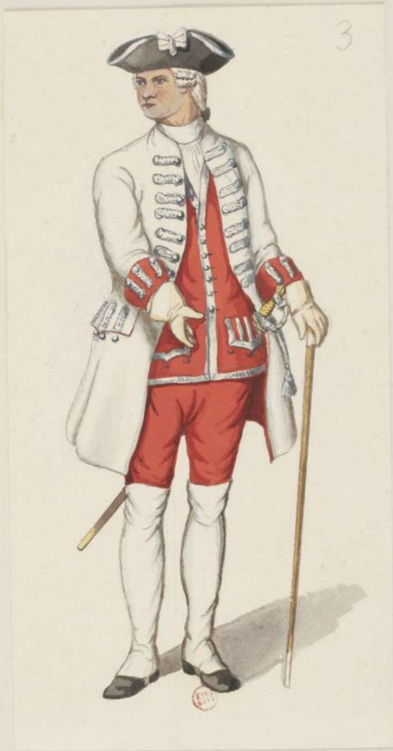
3° - Brigade Major und Exercier Meister 1735-1753