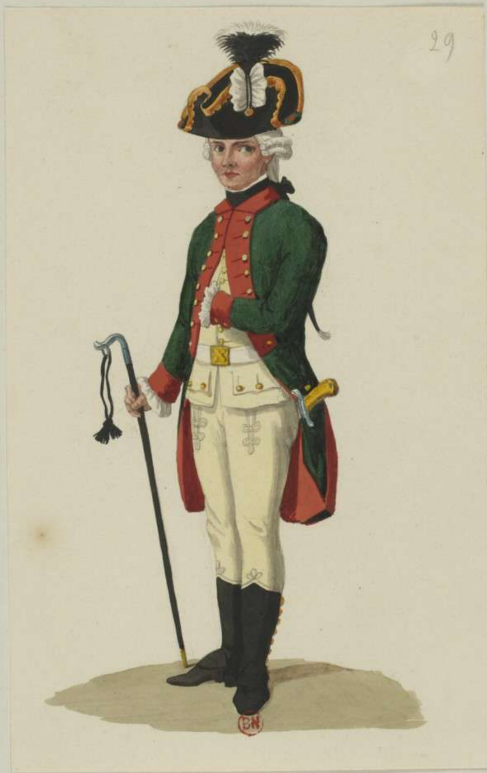
29° - Canonier vom Artillerie Corps