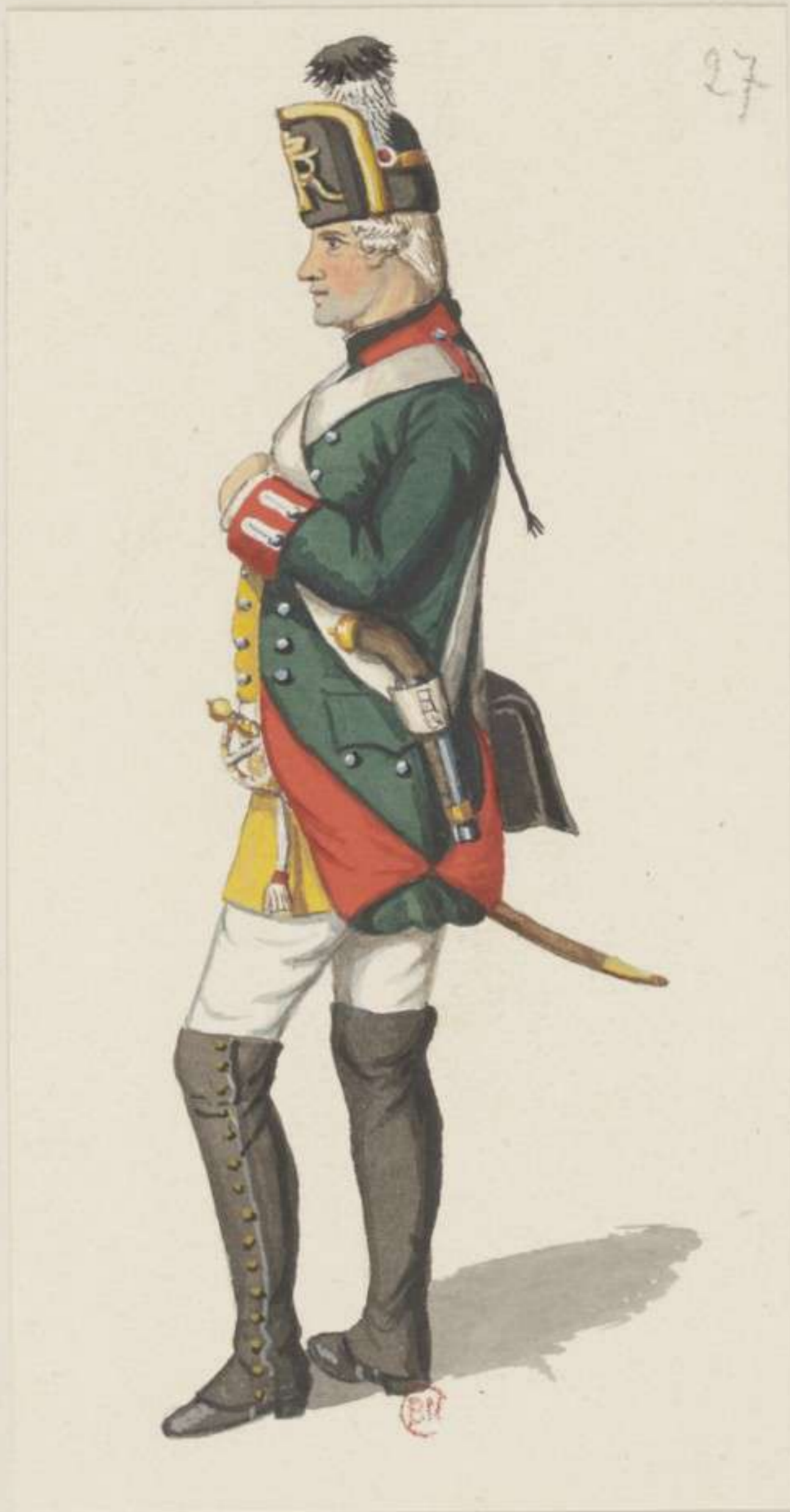
27°- Mineur Corps - 1748