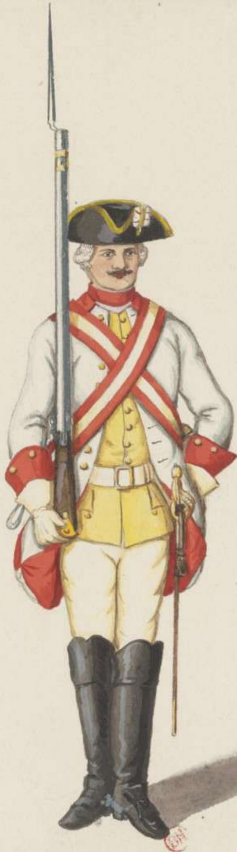
18°- Carabinier Garde - 1735-1758