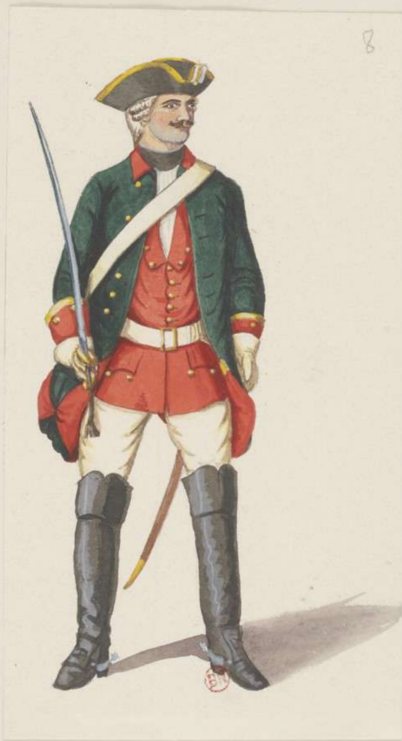
8° - Curland Dragoner Regiment - Unterofficier - 1740