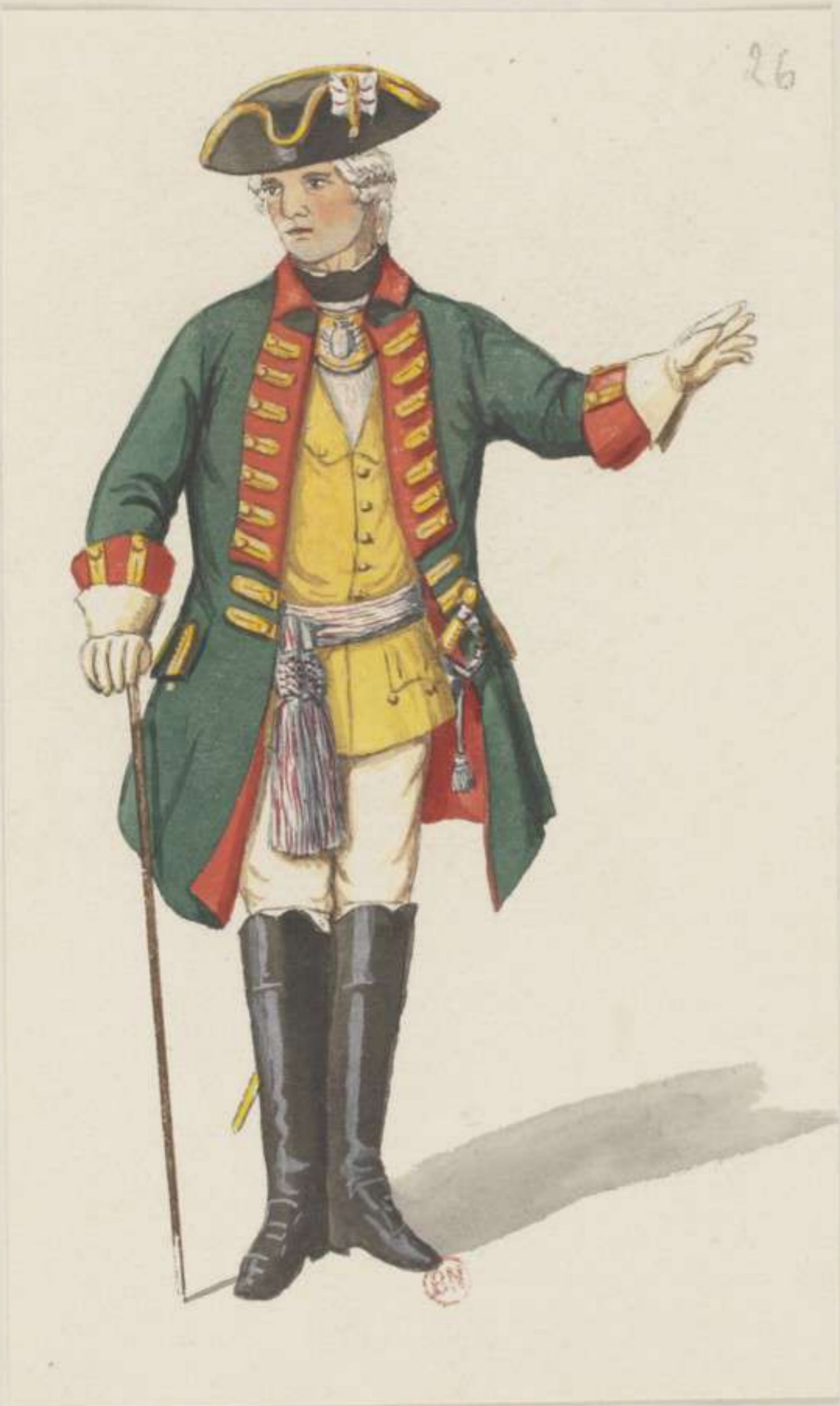
26°- Artillerie Officier - 1745