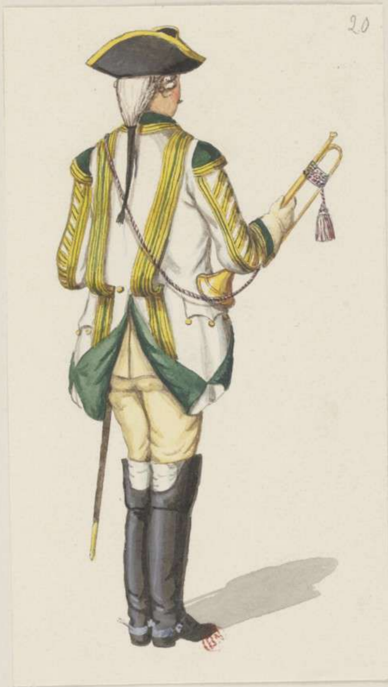
20°- Trompeter vom Cürassier Regiment von Plötz - 1745