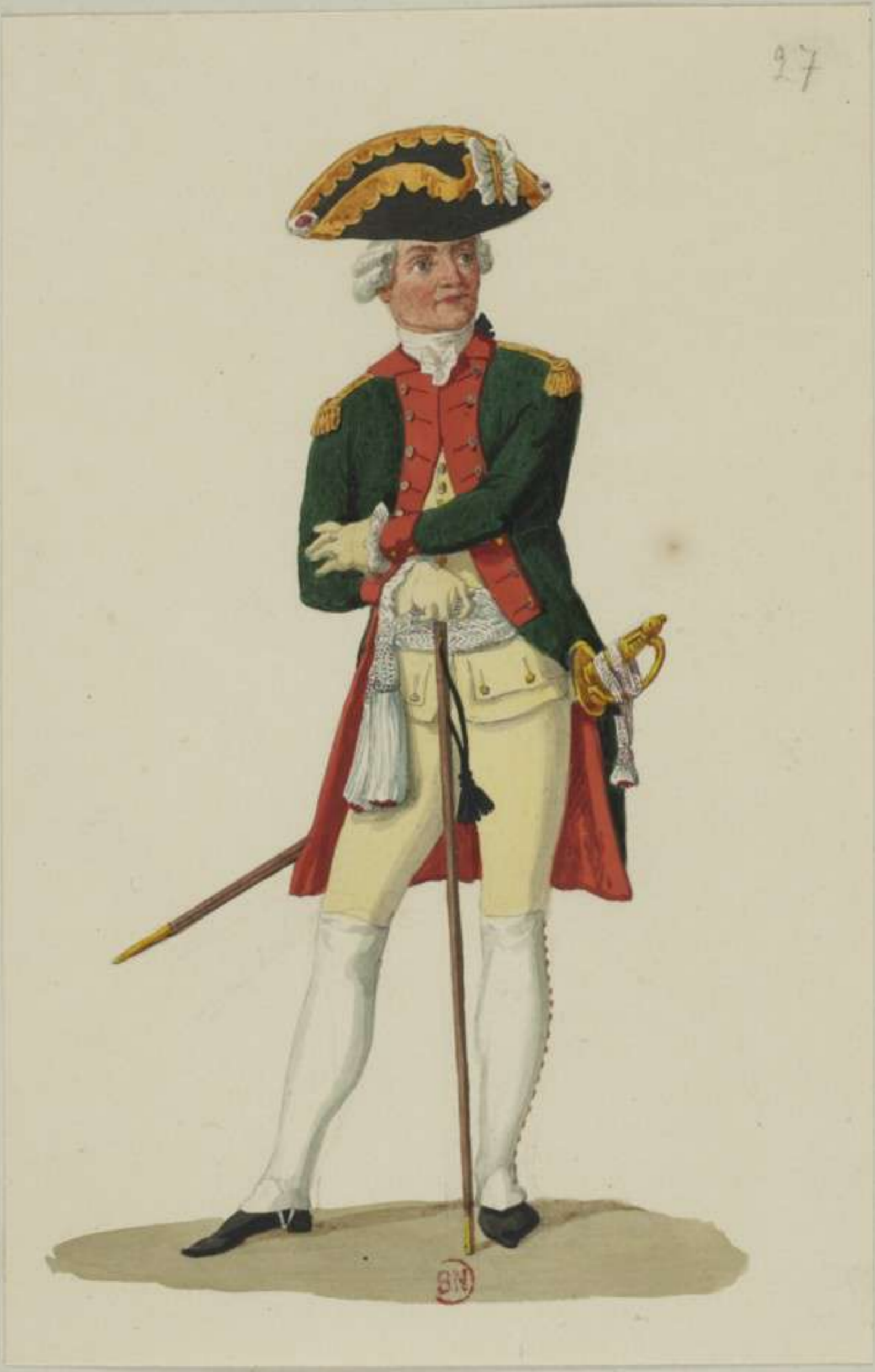
27°- Officier vom Artillerie Corps