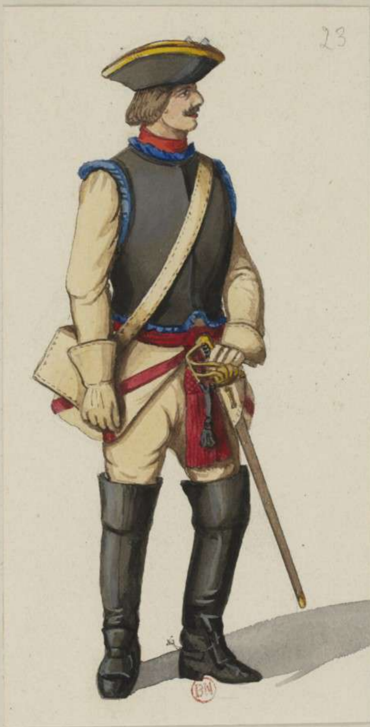
23° - Unterofficier vom Cürassier Regiment Königlicher Prinz