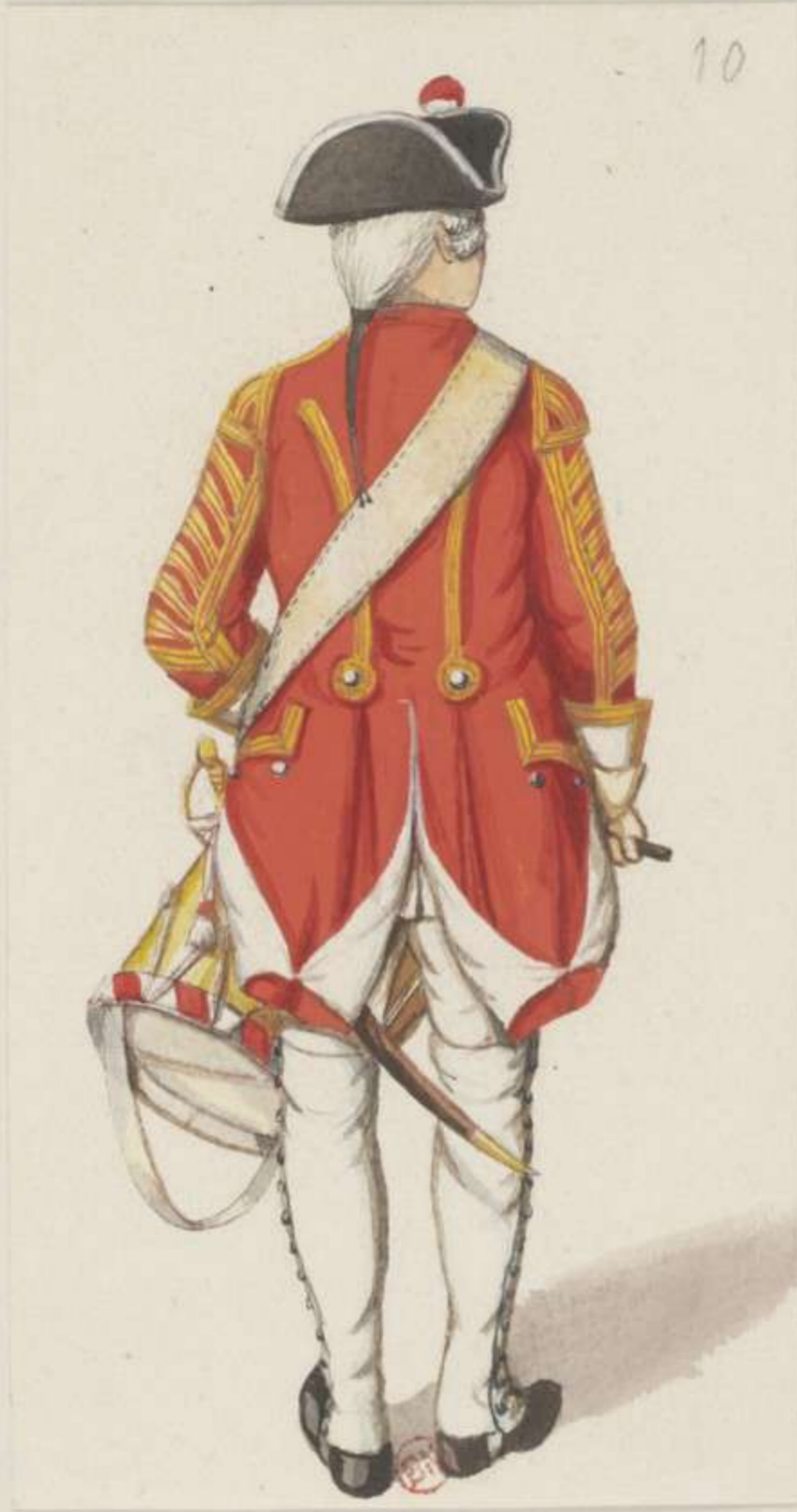
10°- Infanterie Regiment Graf Brühl - 1745