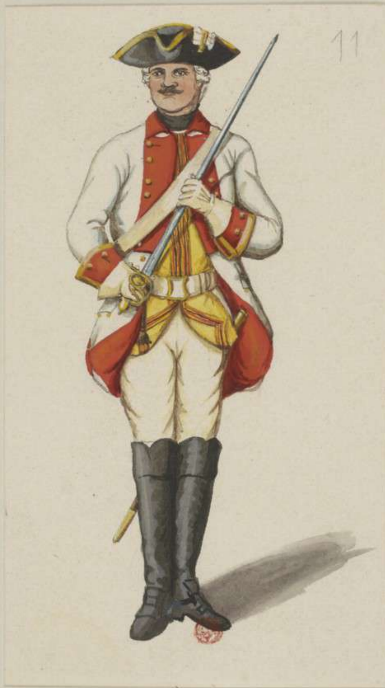
II e - Carabinier Regiment - Unterofficier - 1758