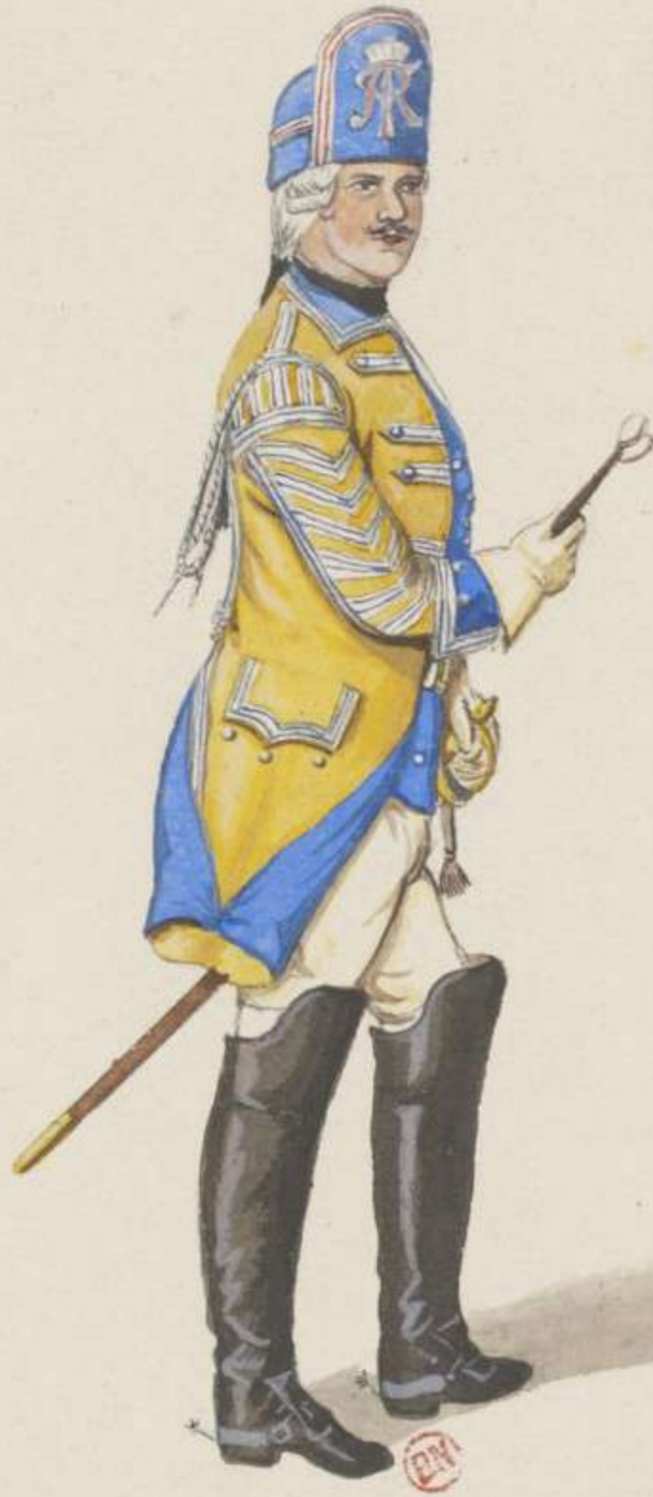
25 o - Pauker vom Graf Brühl Chevaulegers Regiment - 1745