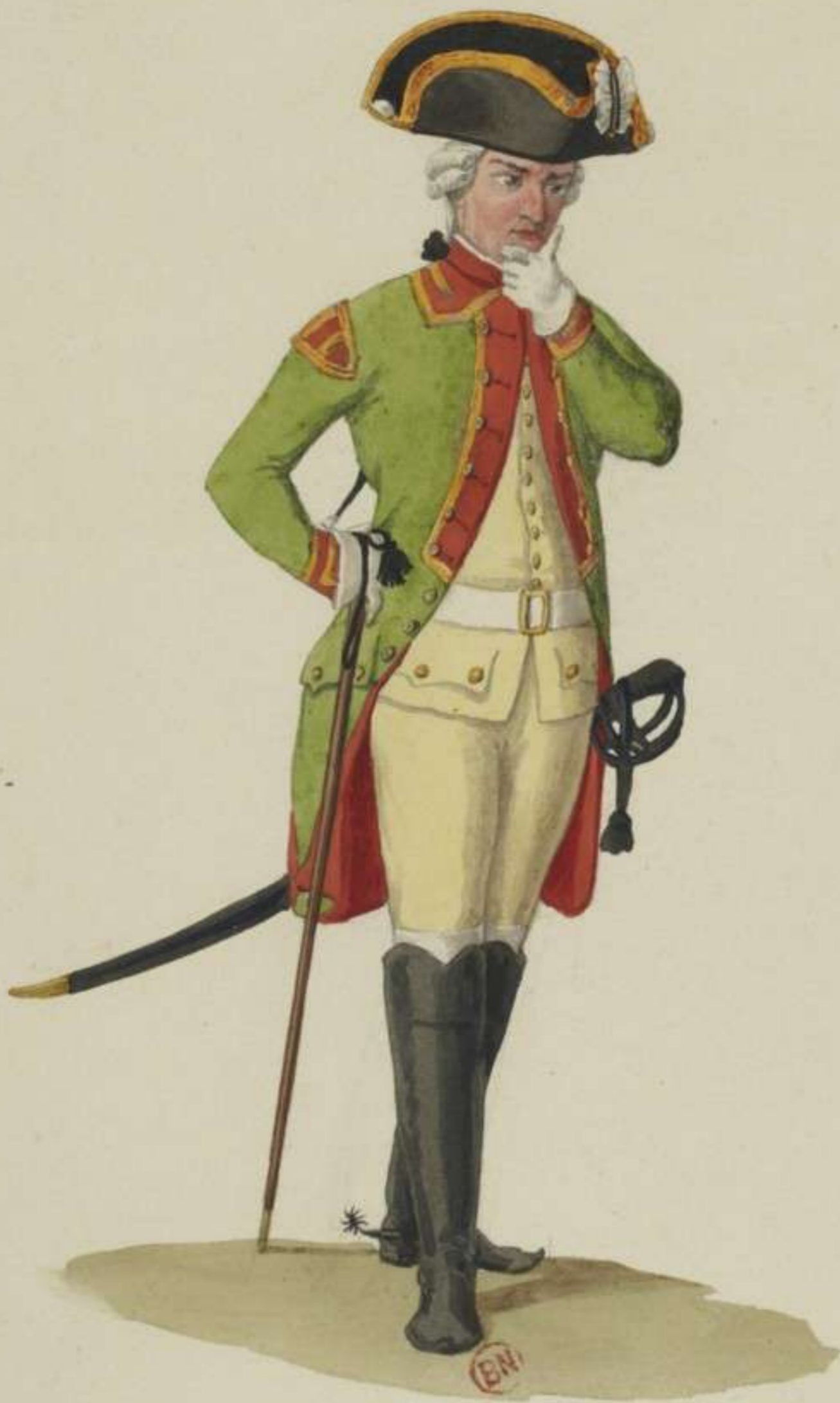
22°- Hautbois vom Chevaulegers Regiment Herzog Curland