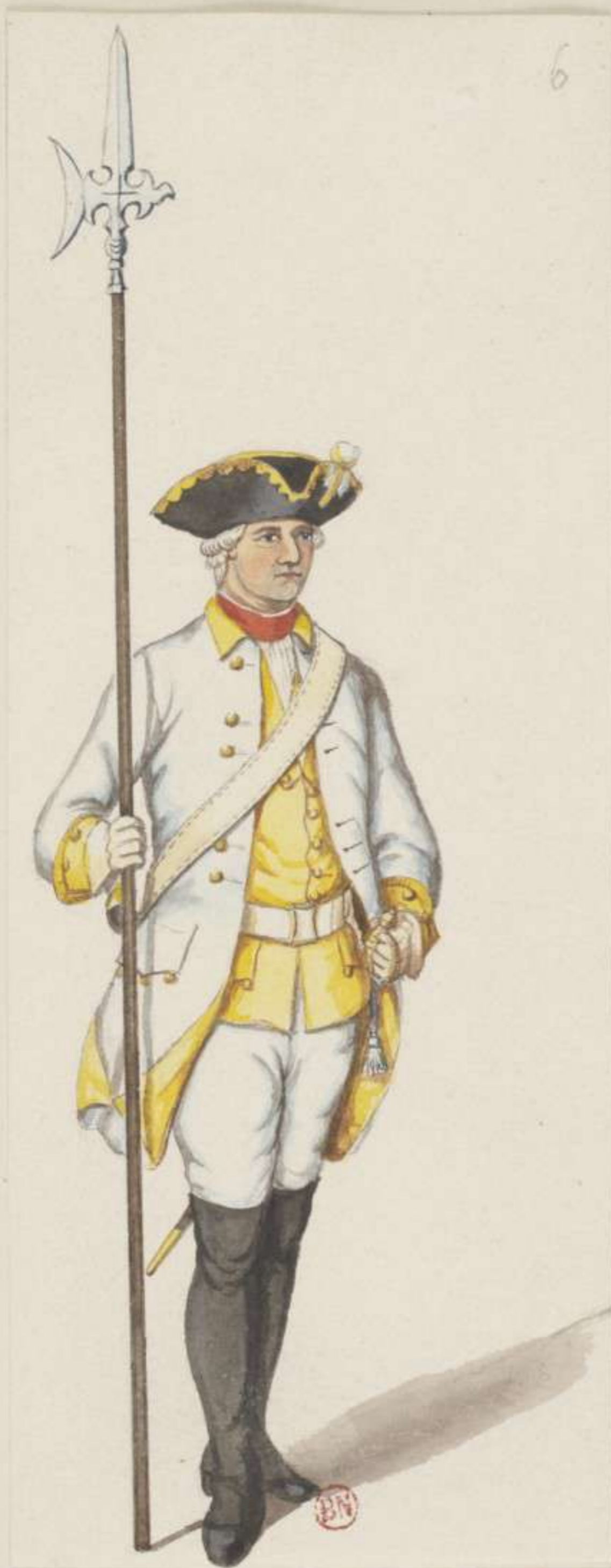
6° - Feldwebel vom Infanterie Regiment De Caila - 1740