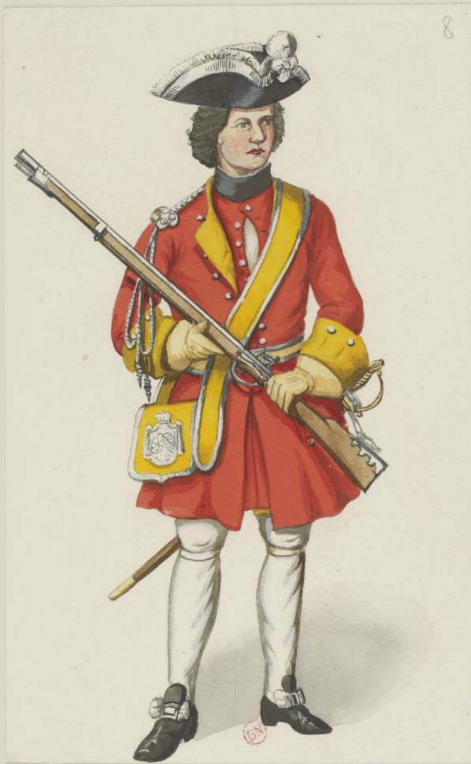
8° - Officier vom Regiment Erste Garde - 1701