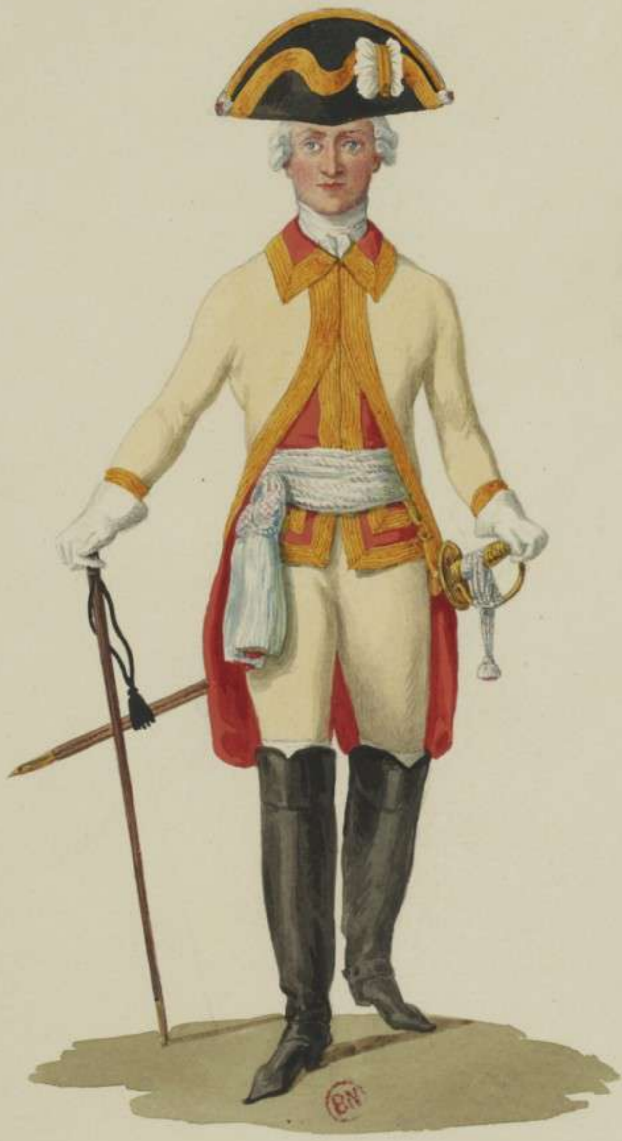
20°- Officier vom Cürassier Regiment Churfürst