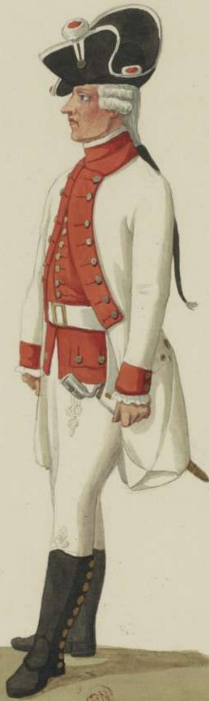
13 o - Musketier vom Infanterie Regiment Churfürst