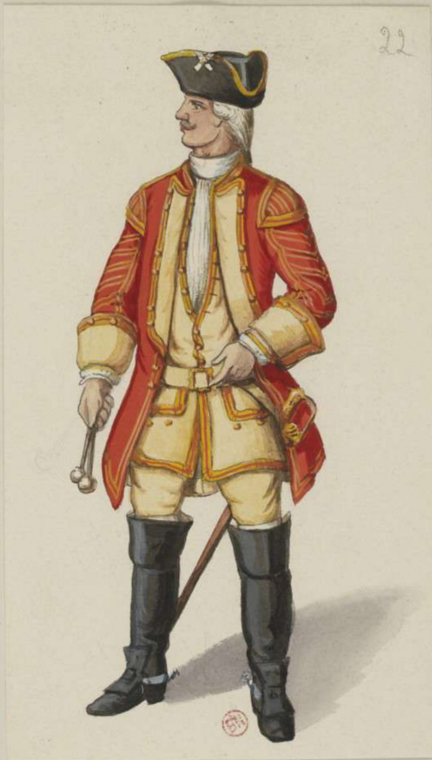
22° - Pauker vom Cürassier Regiment. Prinz Friedrich