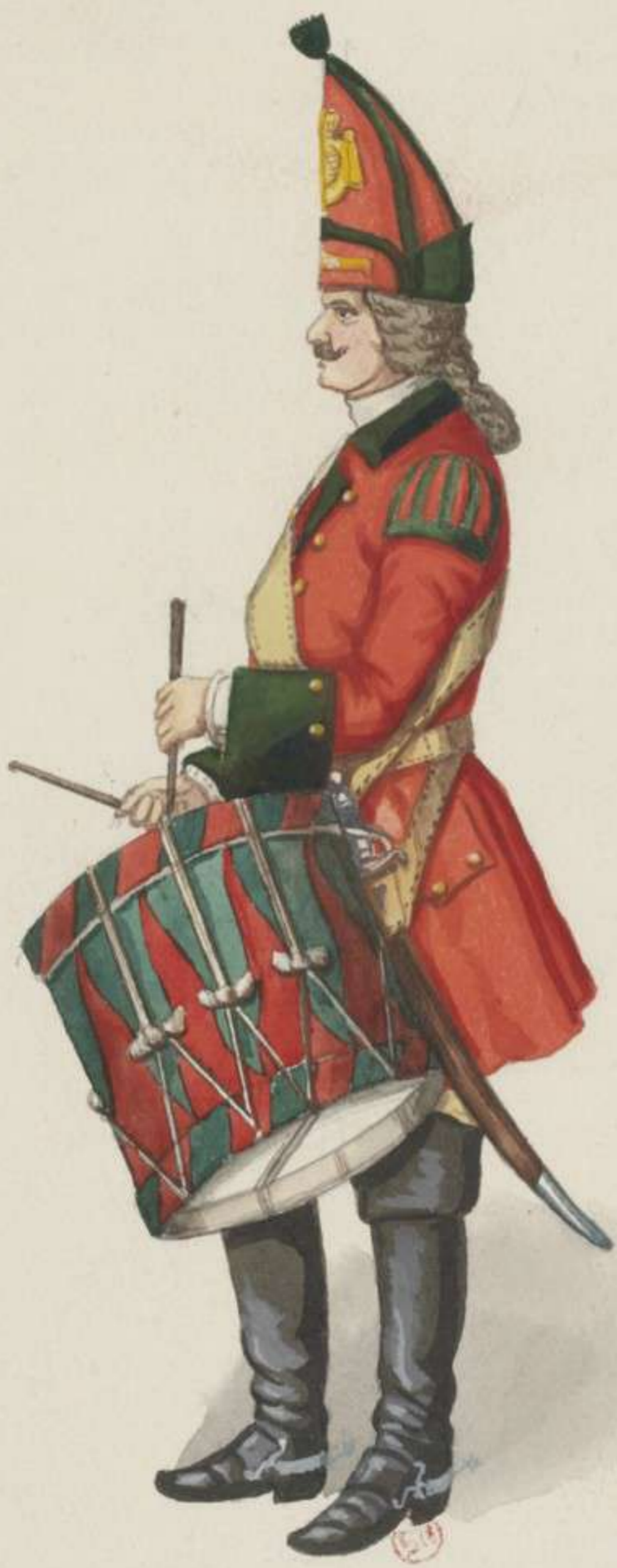
3° - Leibgarde zu Pferd - Trommler - 1699