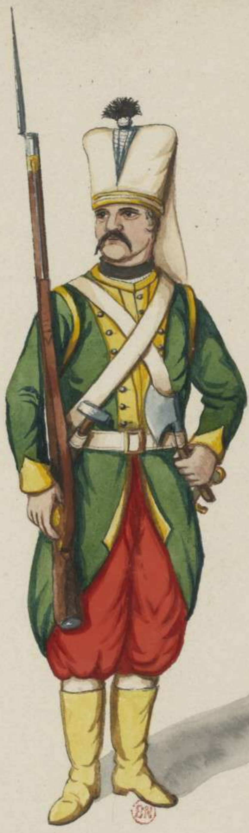
13 e - Janitscharen Corps