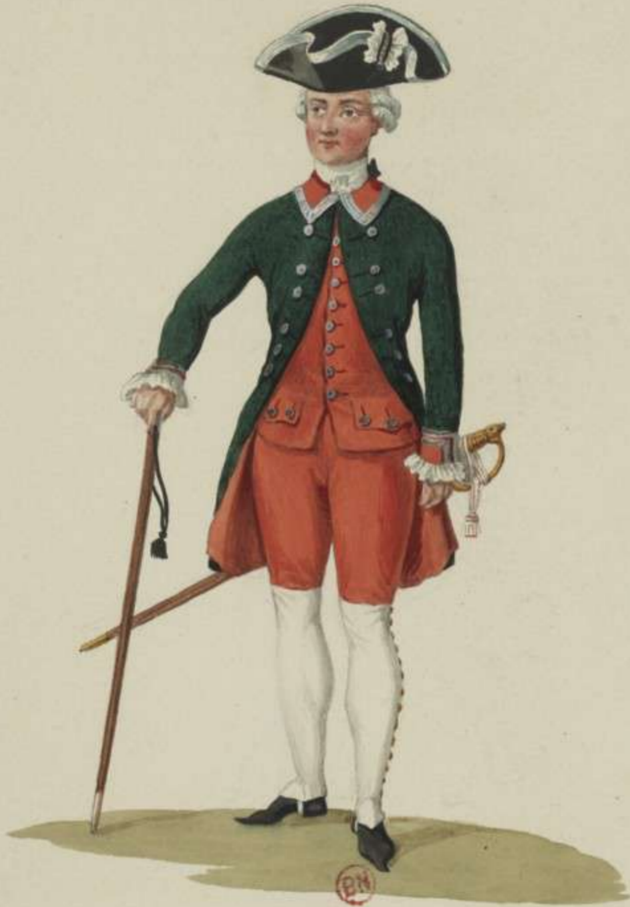
31° - Unterofficier vom Ingenieurs Corps