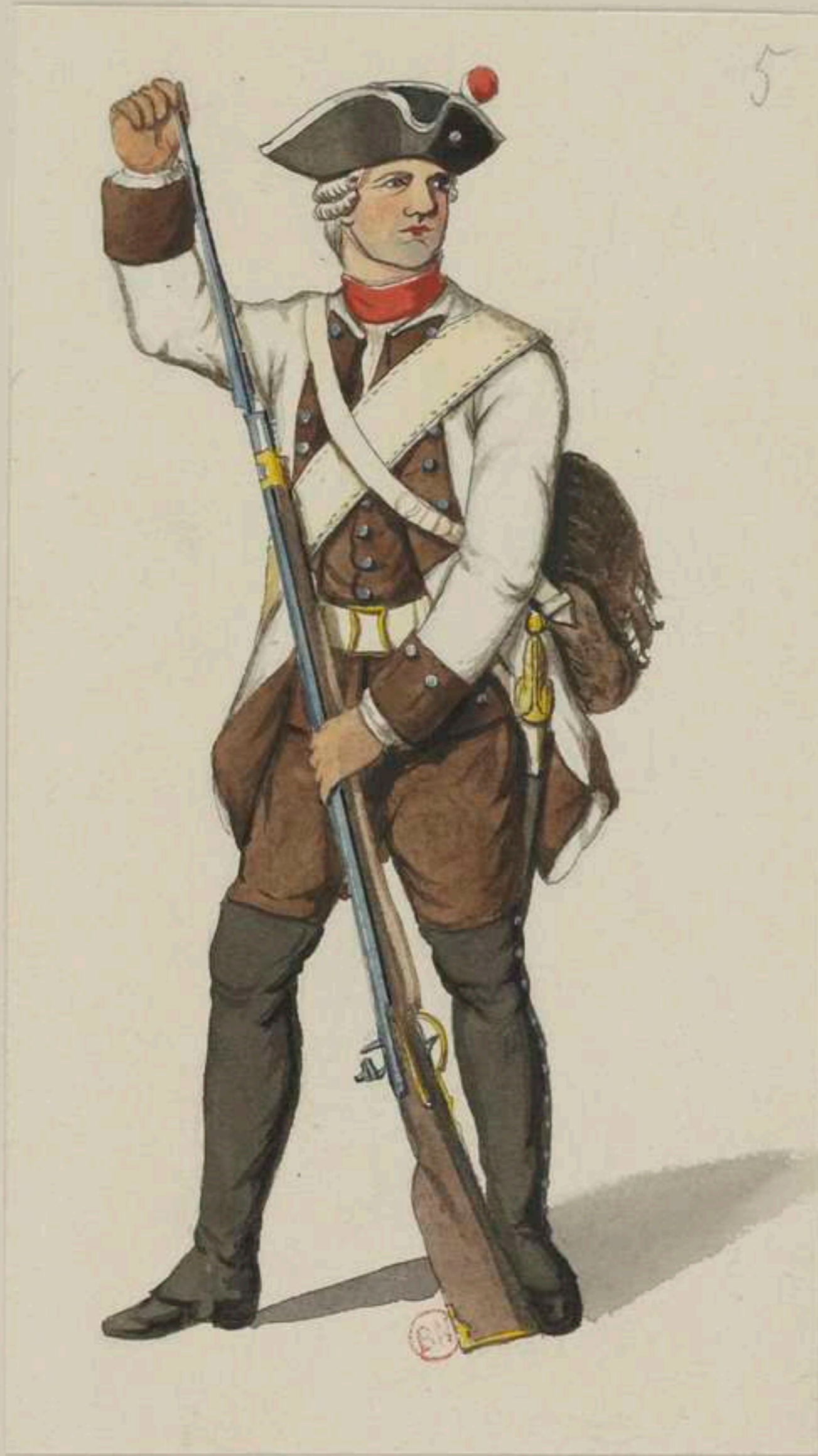
5° - Infanterie Regiment von Haxthausen - 1736