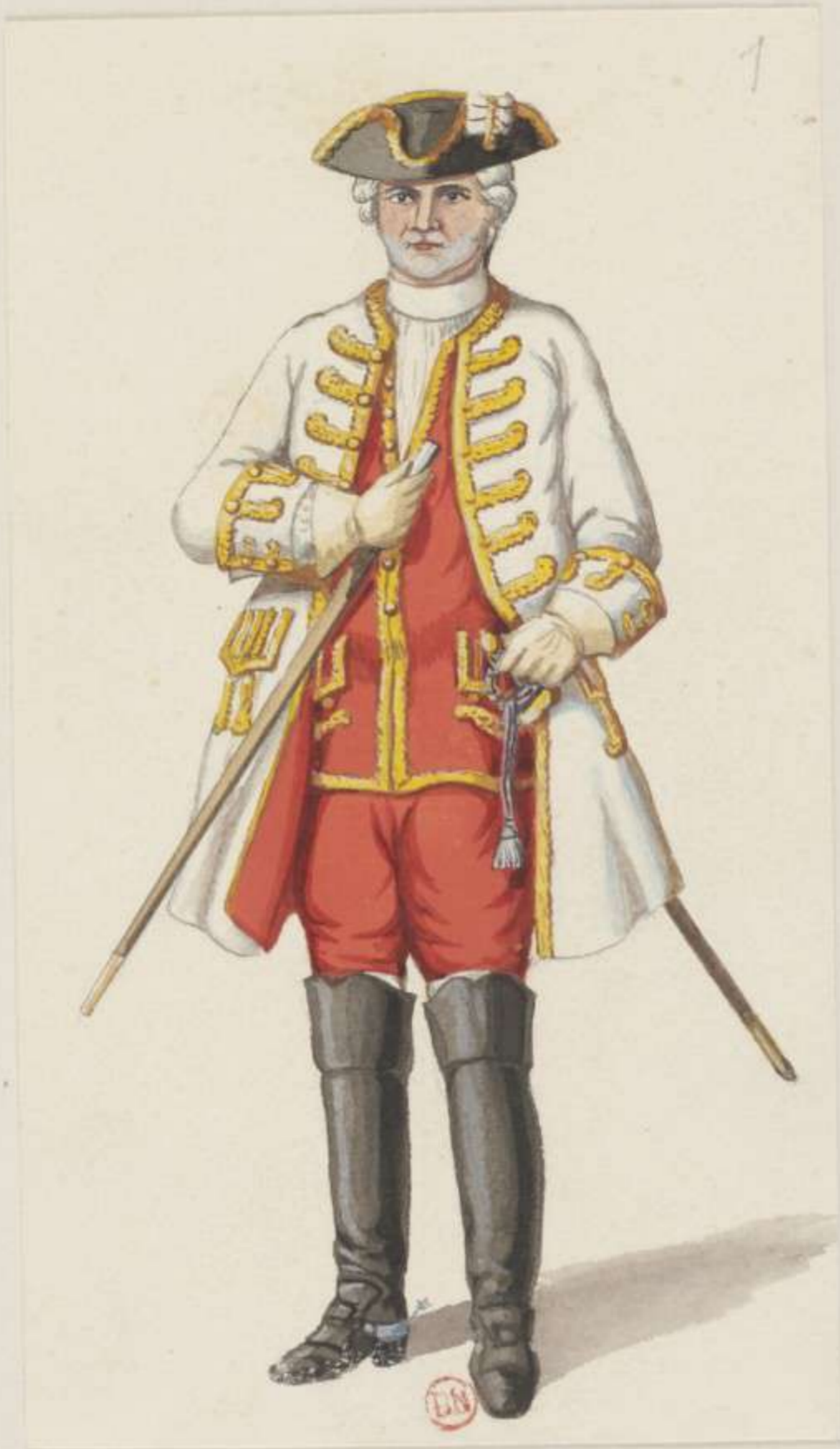
1° - General - 1735-53