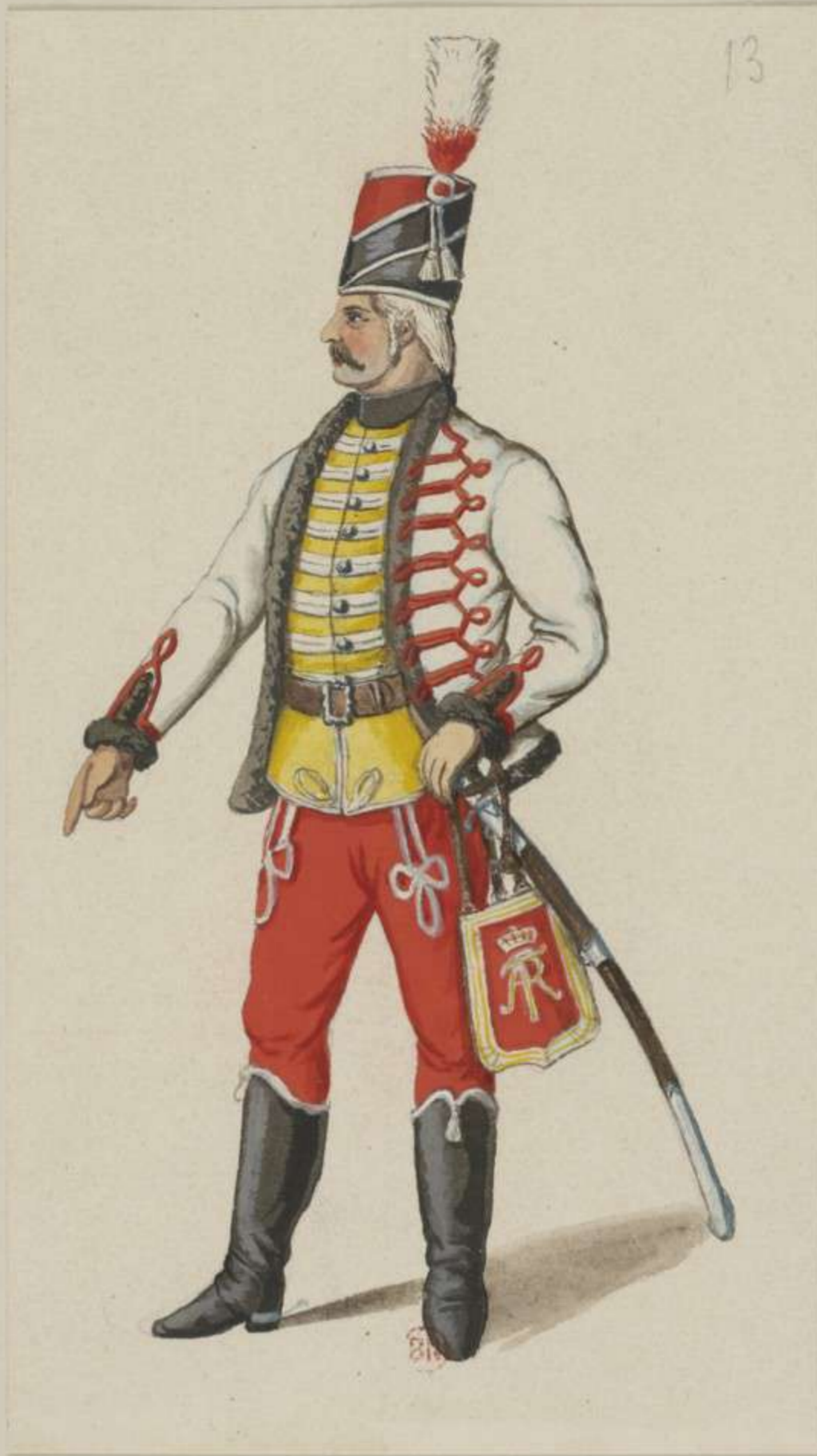
13°- Frei Husaren Escadron des Majors von Schill - Erste Französische Uniform - 1760