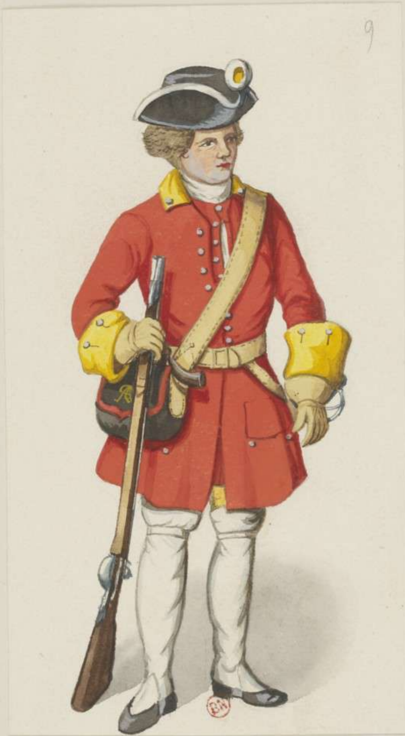
9° - Muskettier Unterofficier vom Regiment Erste Garde - 1701