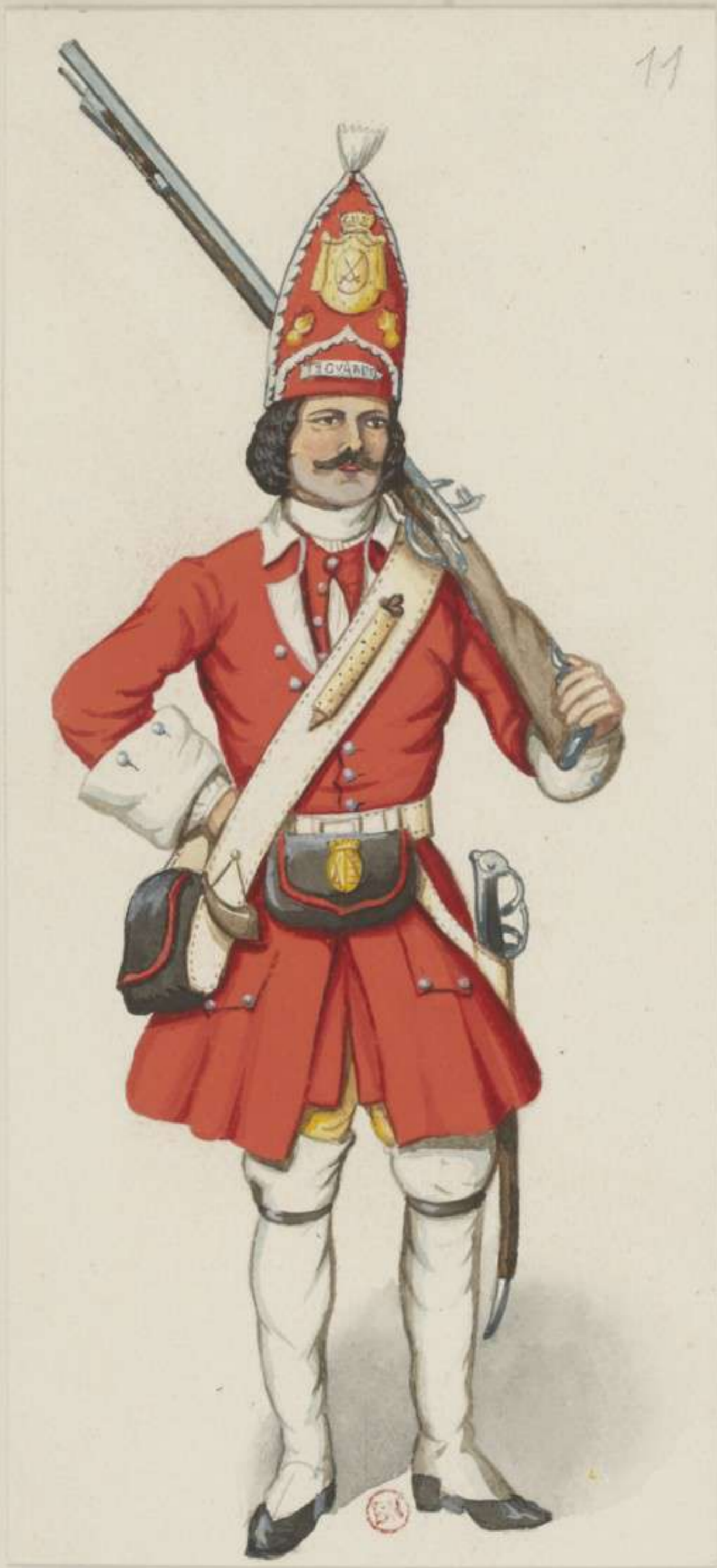
II° - Unterofficier vom Regiment Zweite Garde oder von Bose Grenadiere - 1701