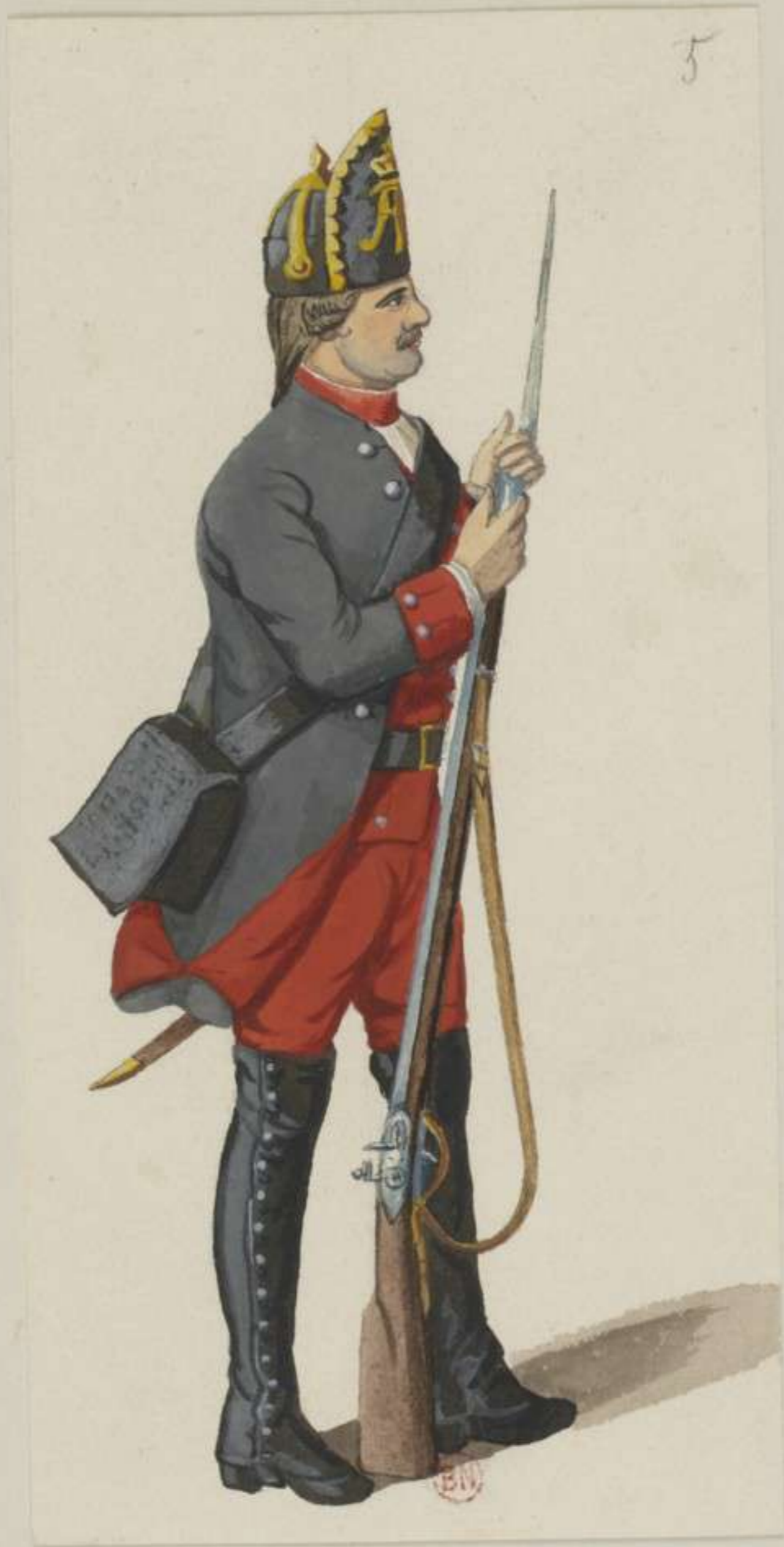
5° - 3. Kreis Regiment Weissenfels - 1758