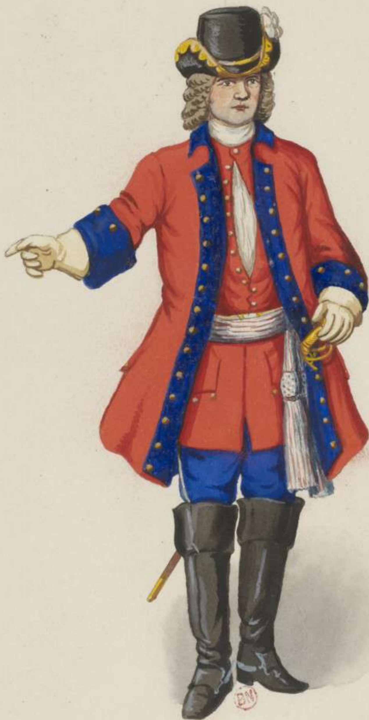
15° - Dragoner Officier - 1706