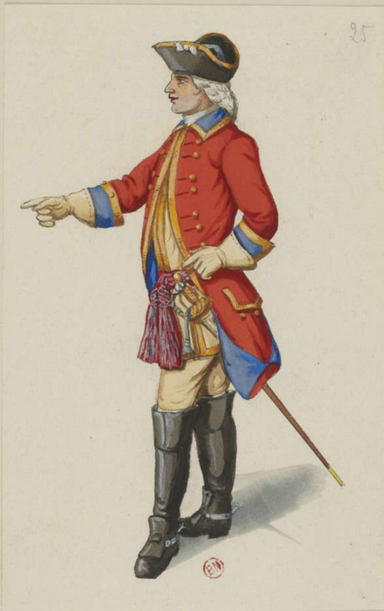
25°- Officier vom Dragoner Regiment Klingenberg