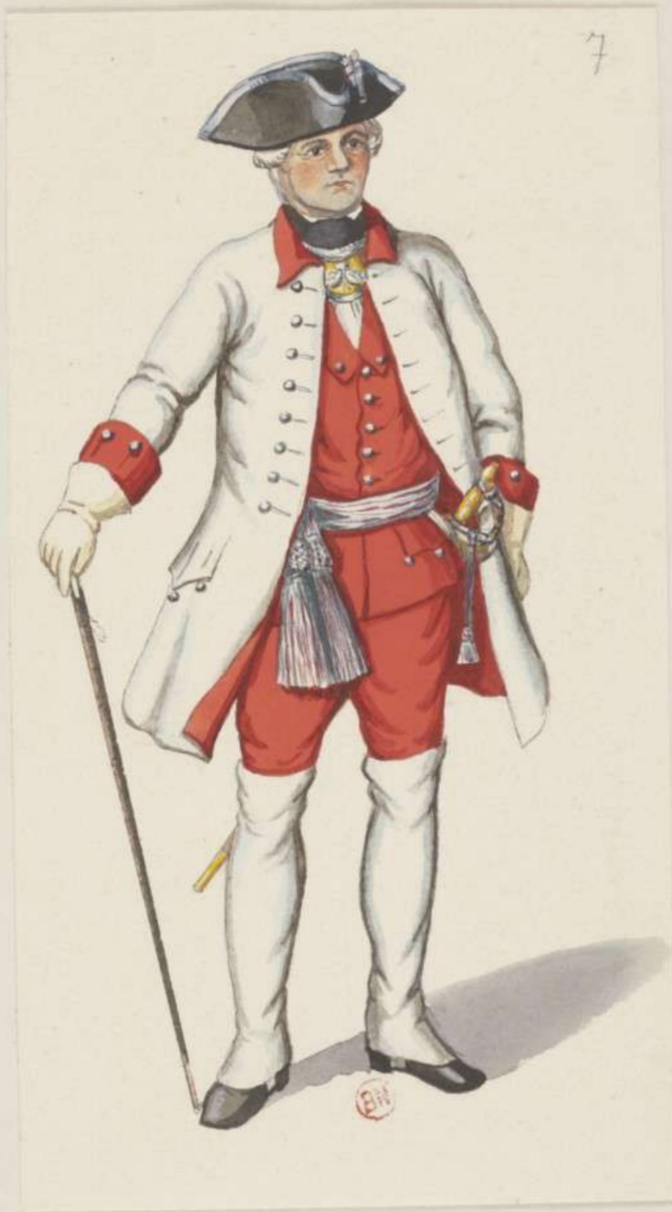
7° - Officier vom Regiment Zweite Garde - 1741