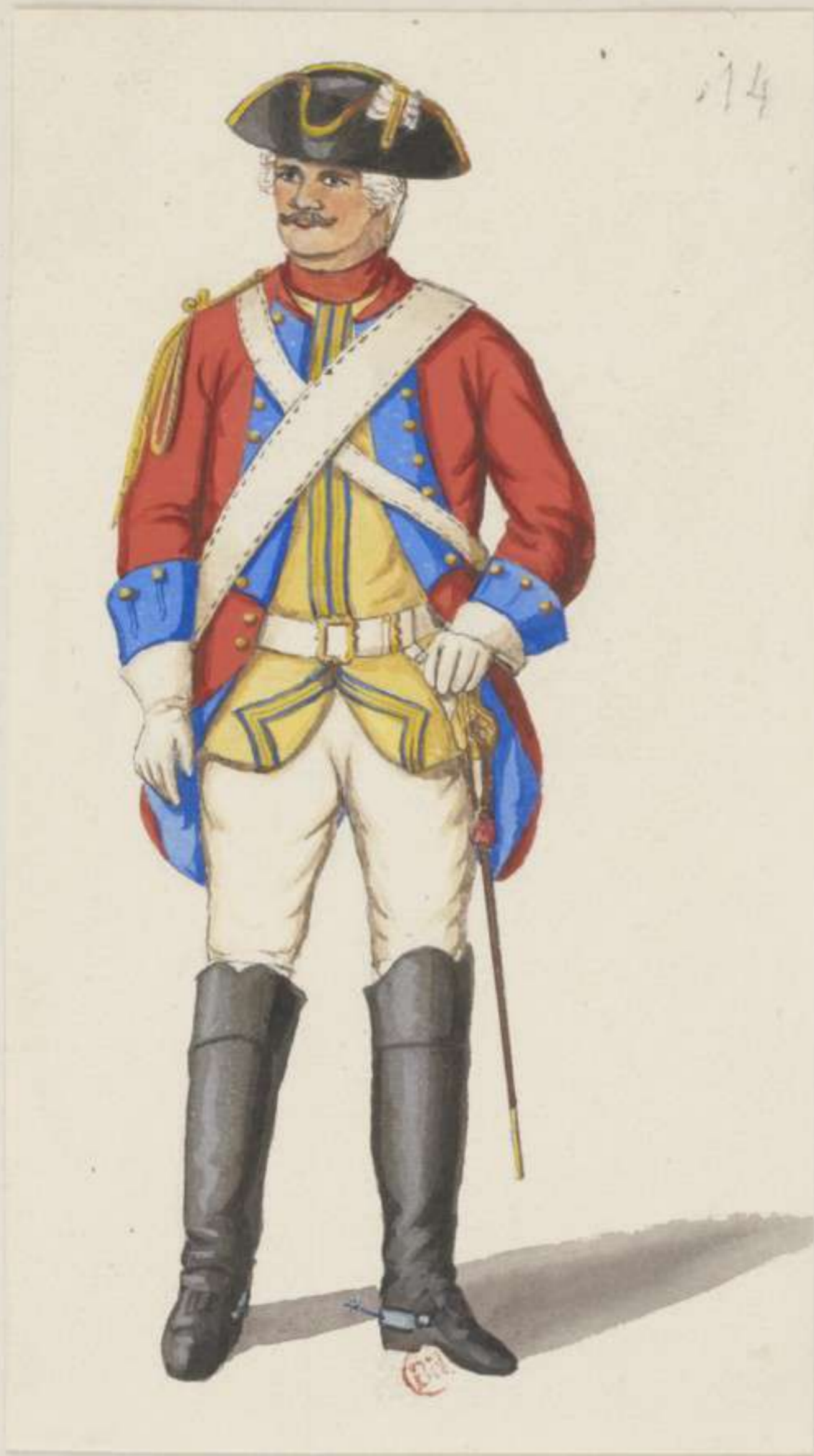
14 o - Garde du Corps - Dienst Uniform - 1745