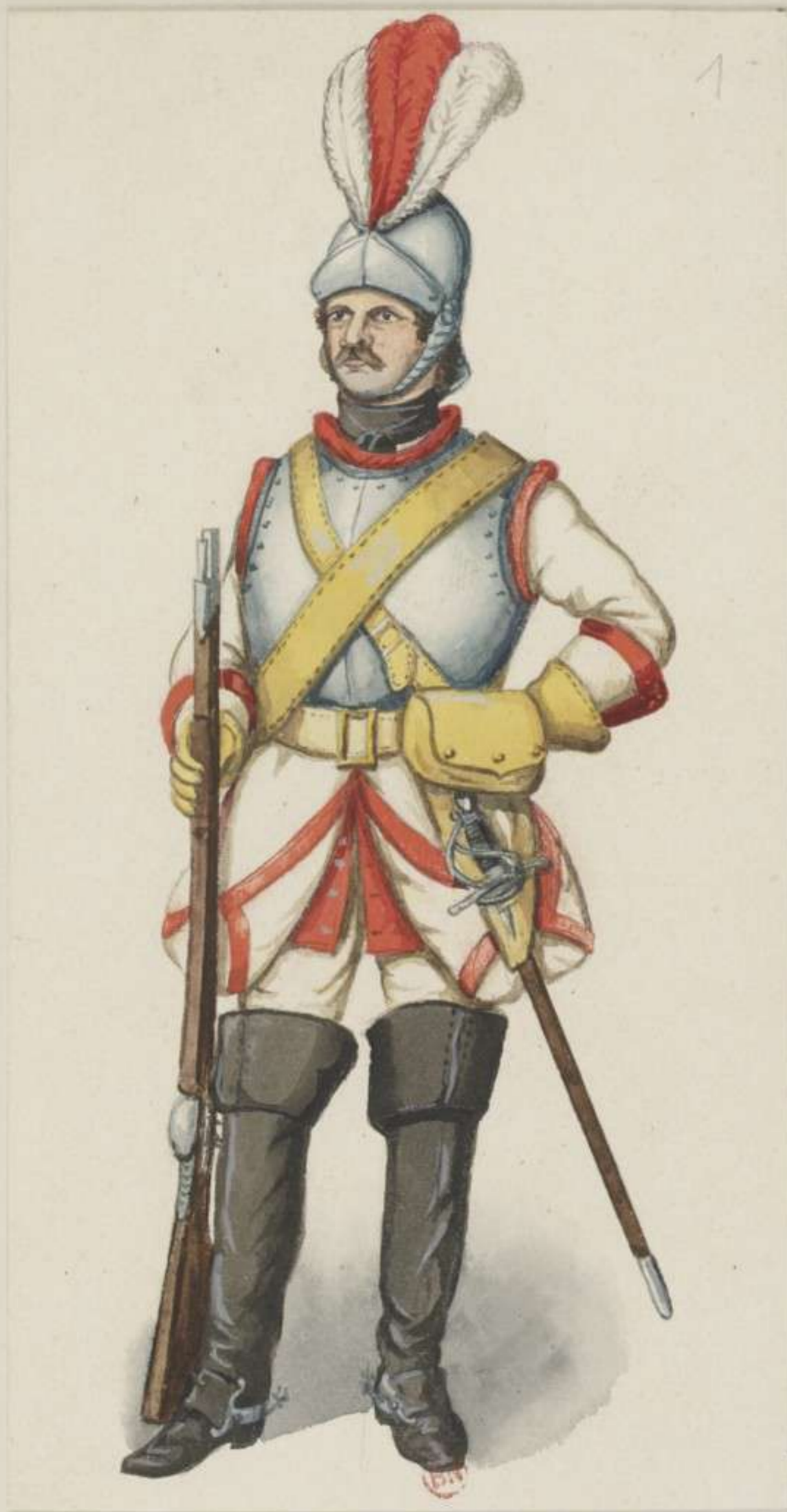
I° - Leib Cürassier Regiment in Gala - 1699