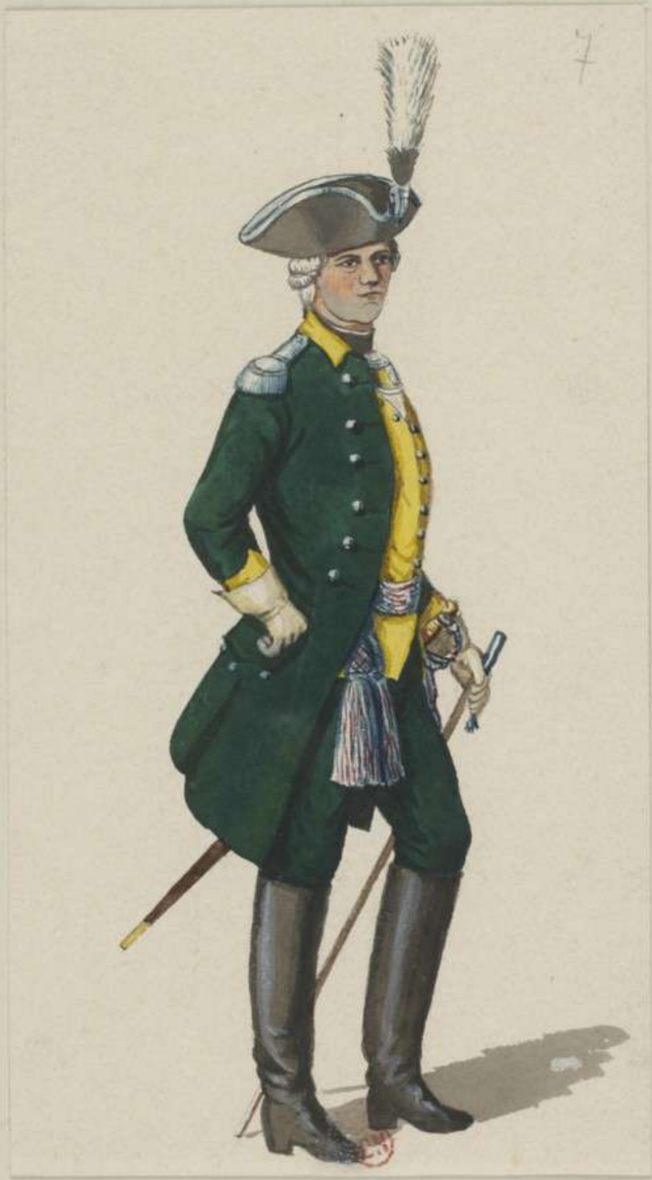
7° - Scharfschützen Corps - Officier - 1775