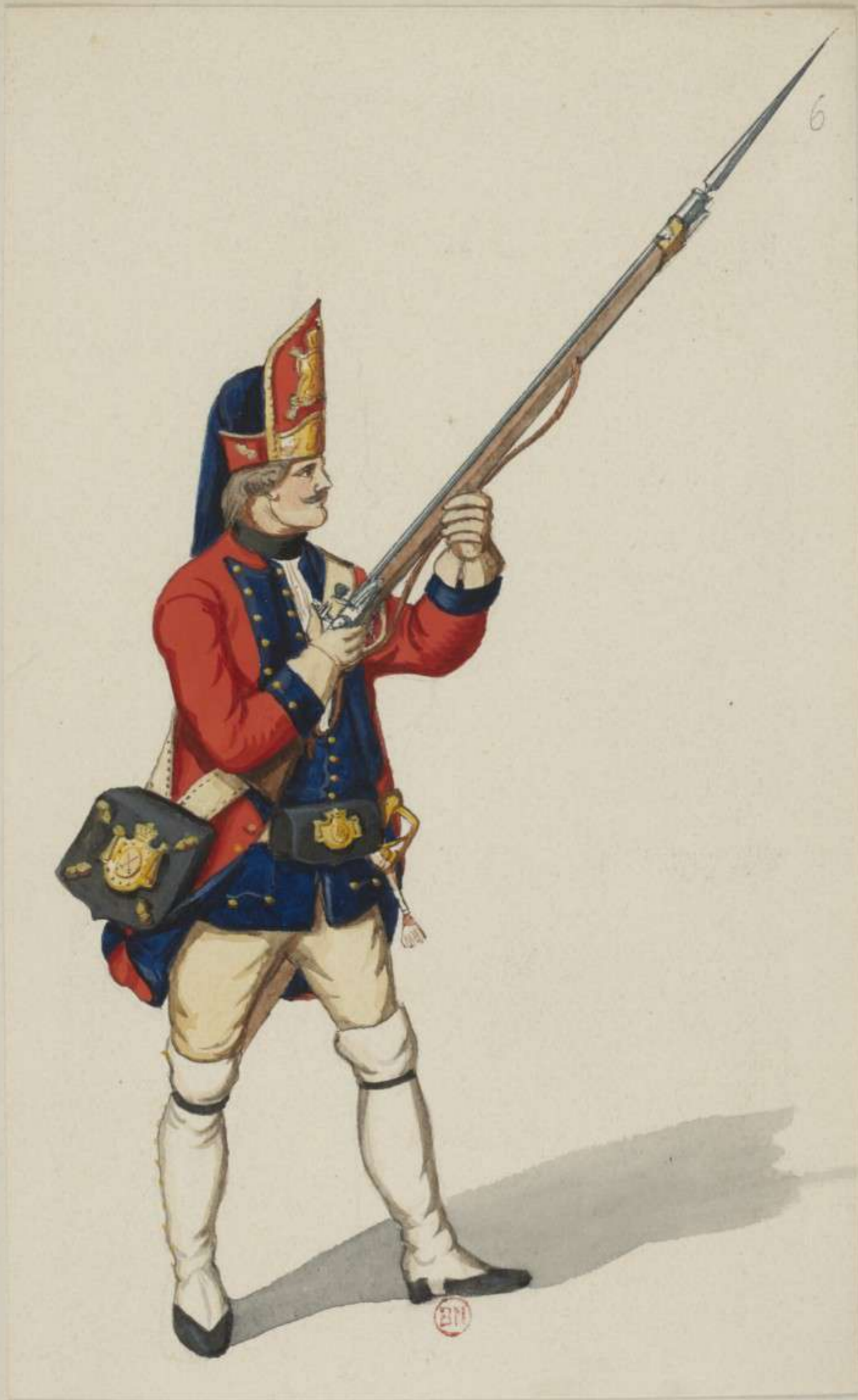
6° - Grenadier vom Infanterie Regiment Sachsen Gotha