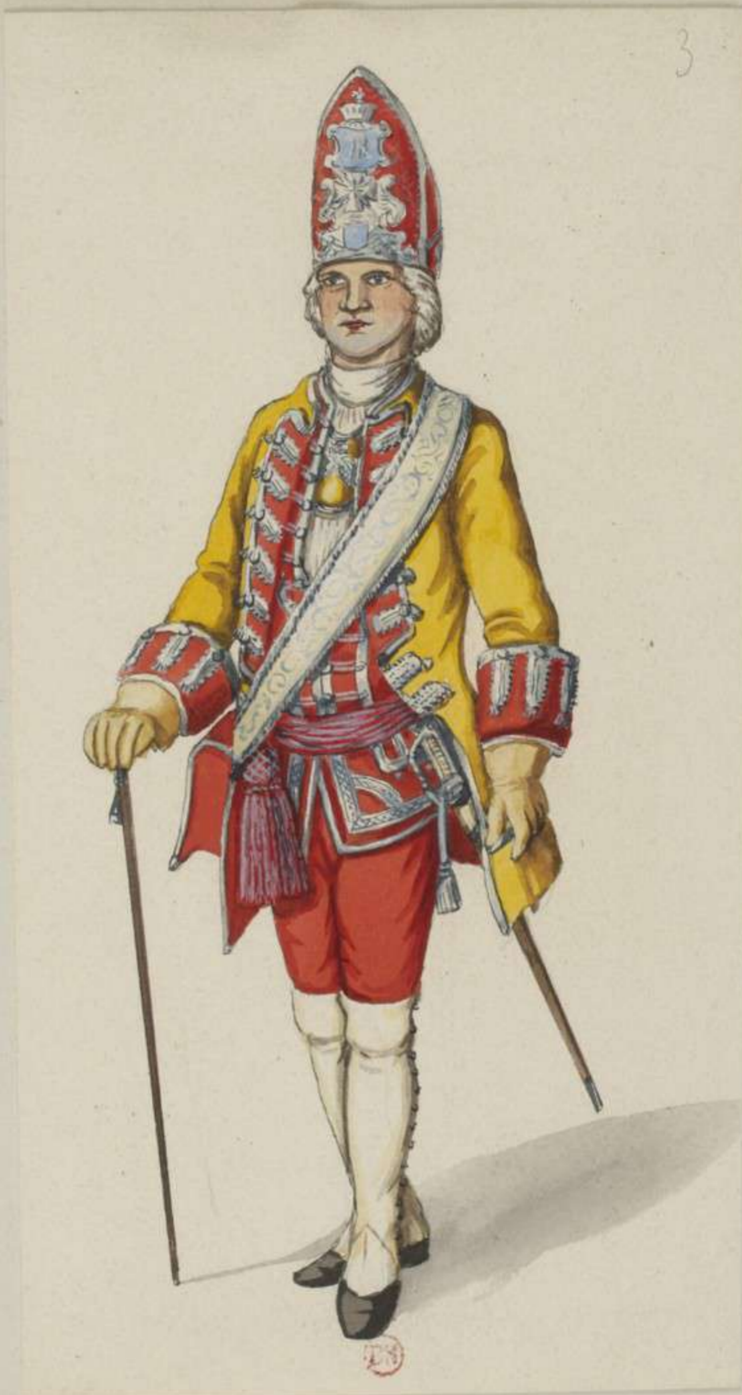
3° - Leib Grenadier Regiment von Rutowsky - Officier