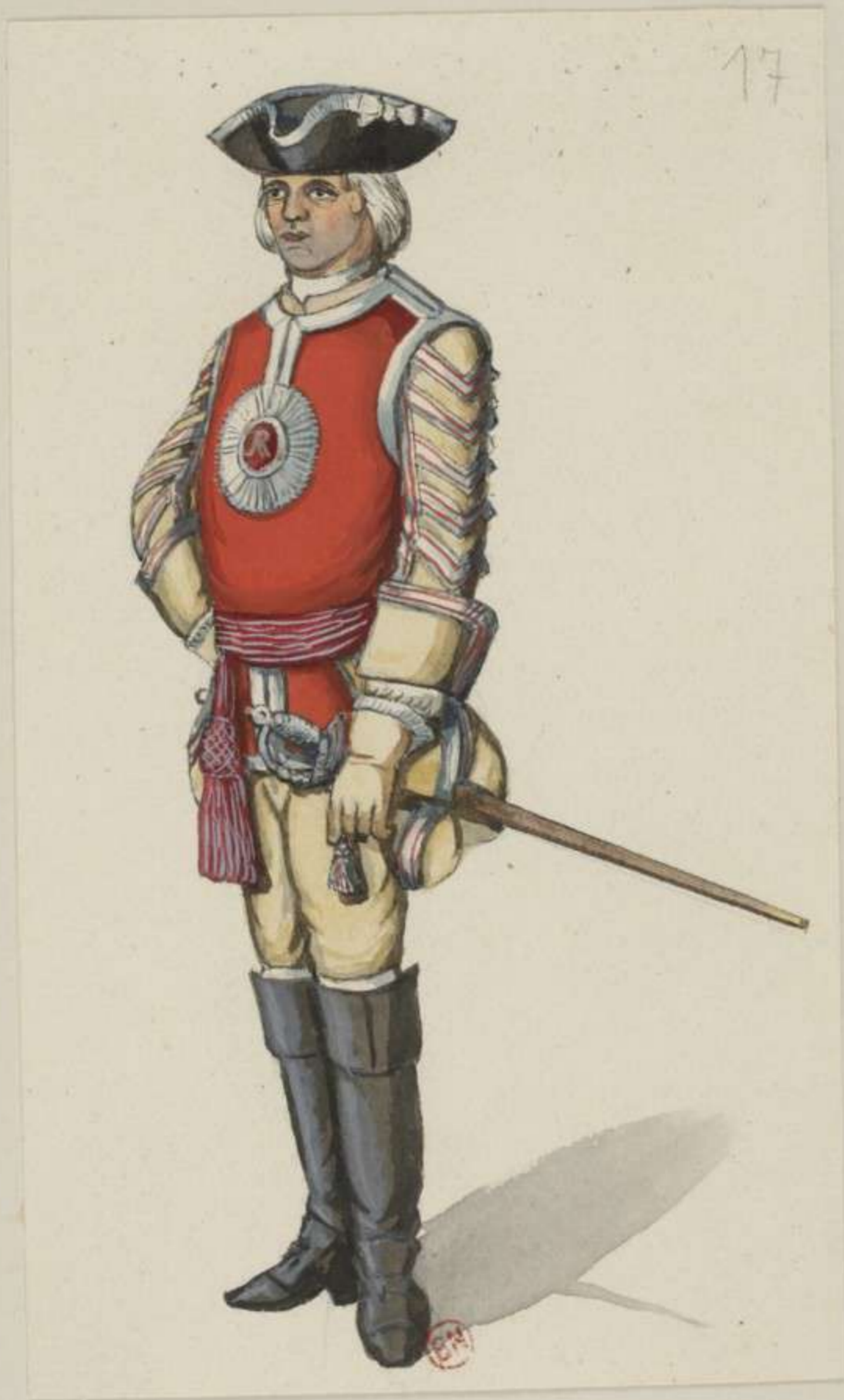
17°- Grands Mousquetaires - Officier in Gala