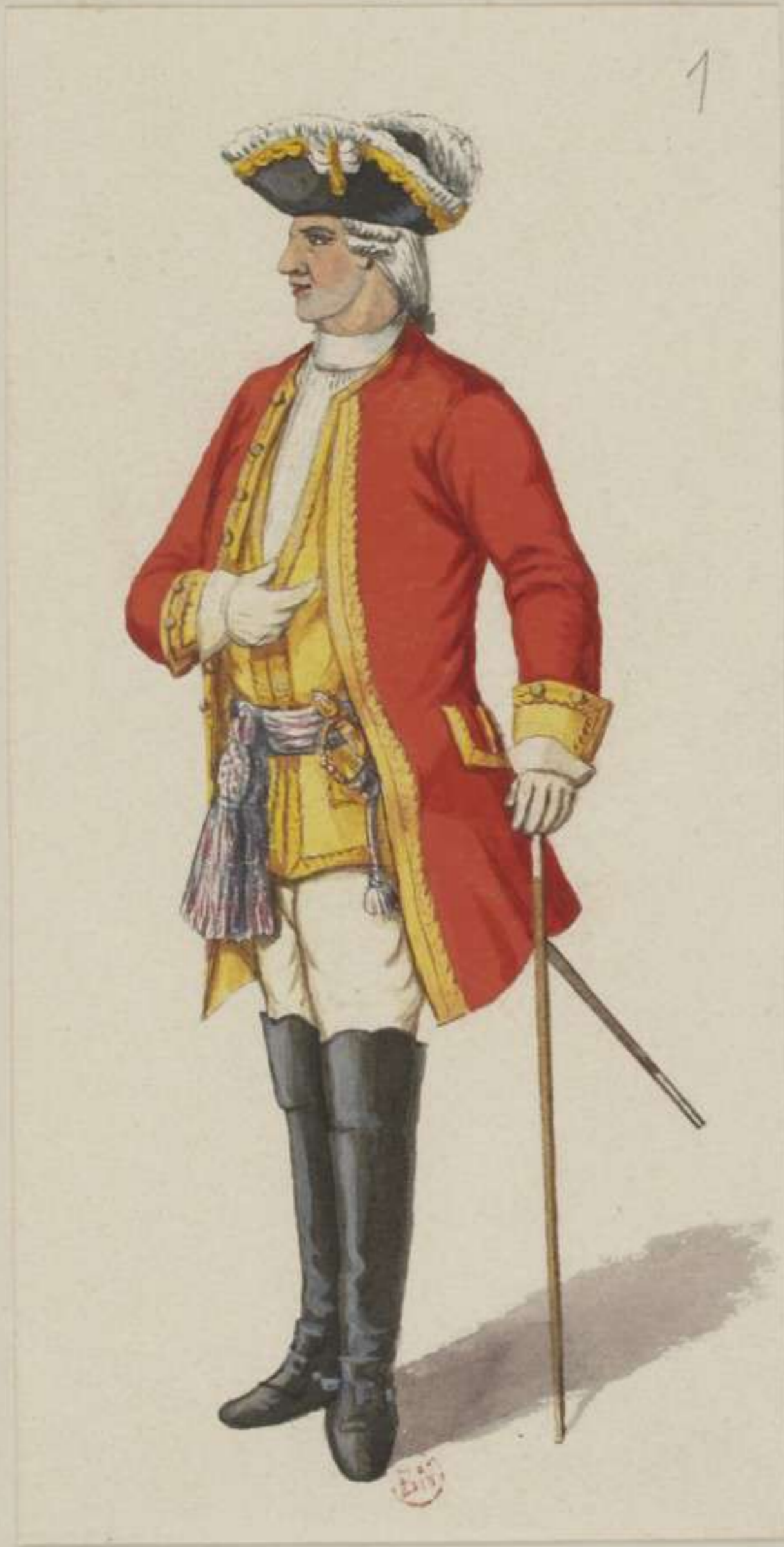
I° - General - 1756