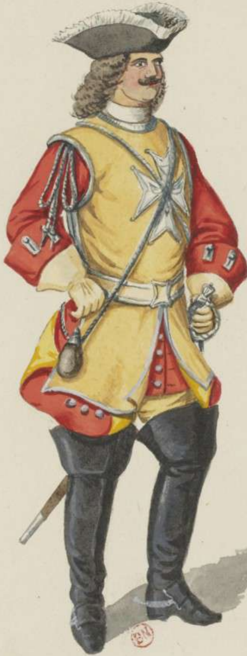
22° - Grand Mousquetaire - 1715