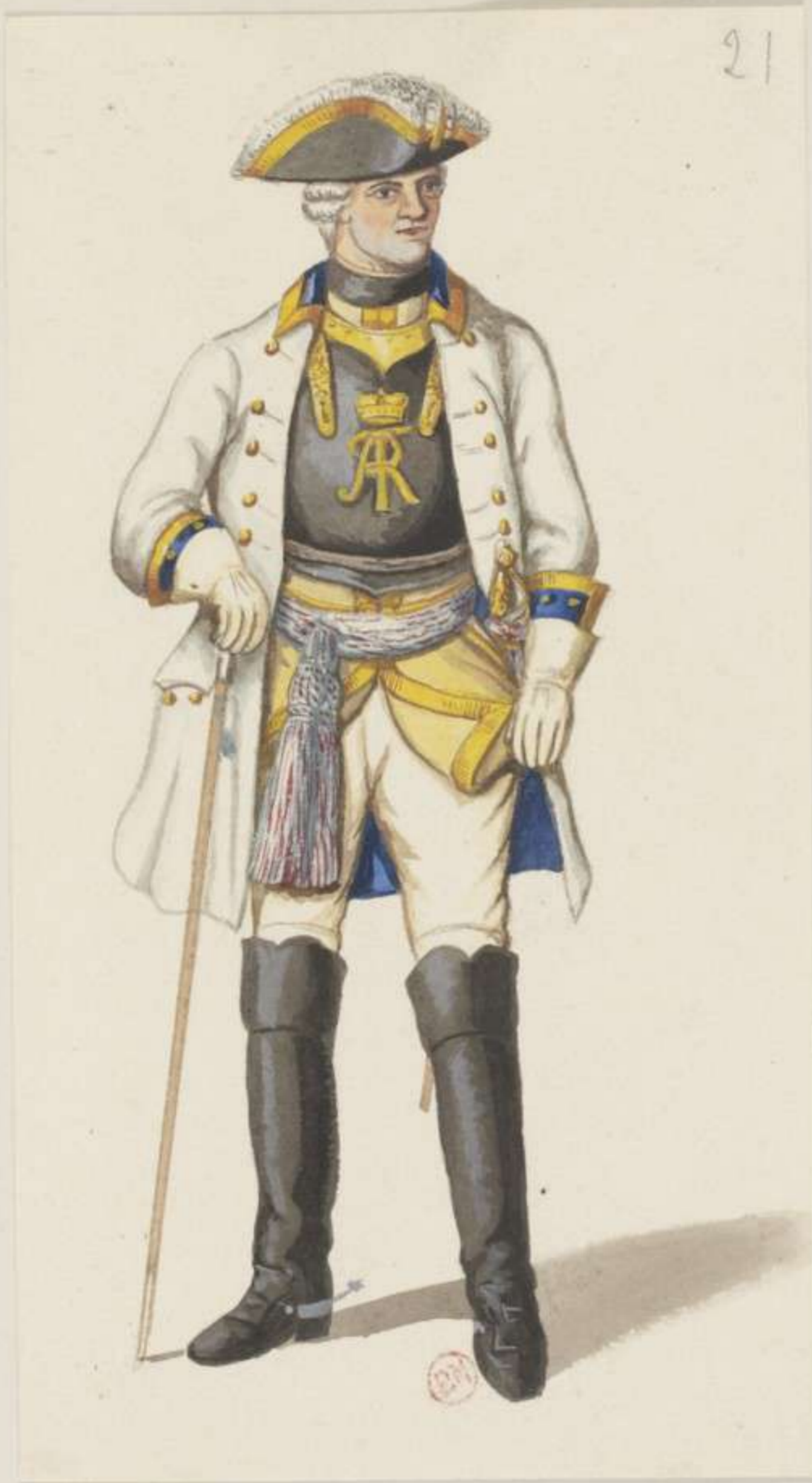
21°- Oberst vom Cürassier Regiment von Vitzthum - 1746