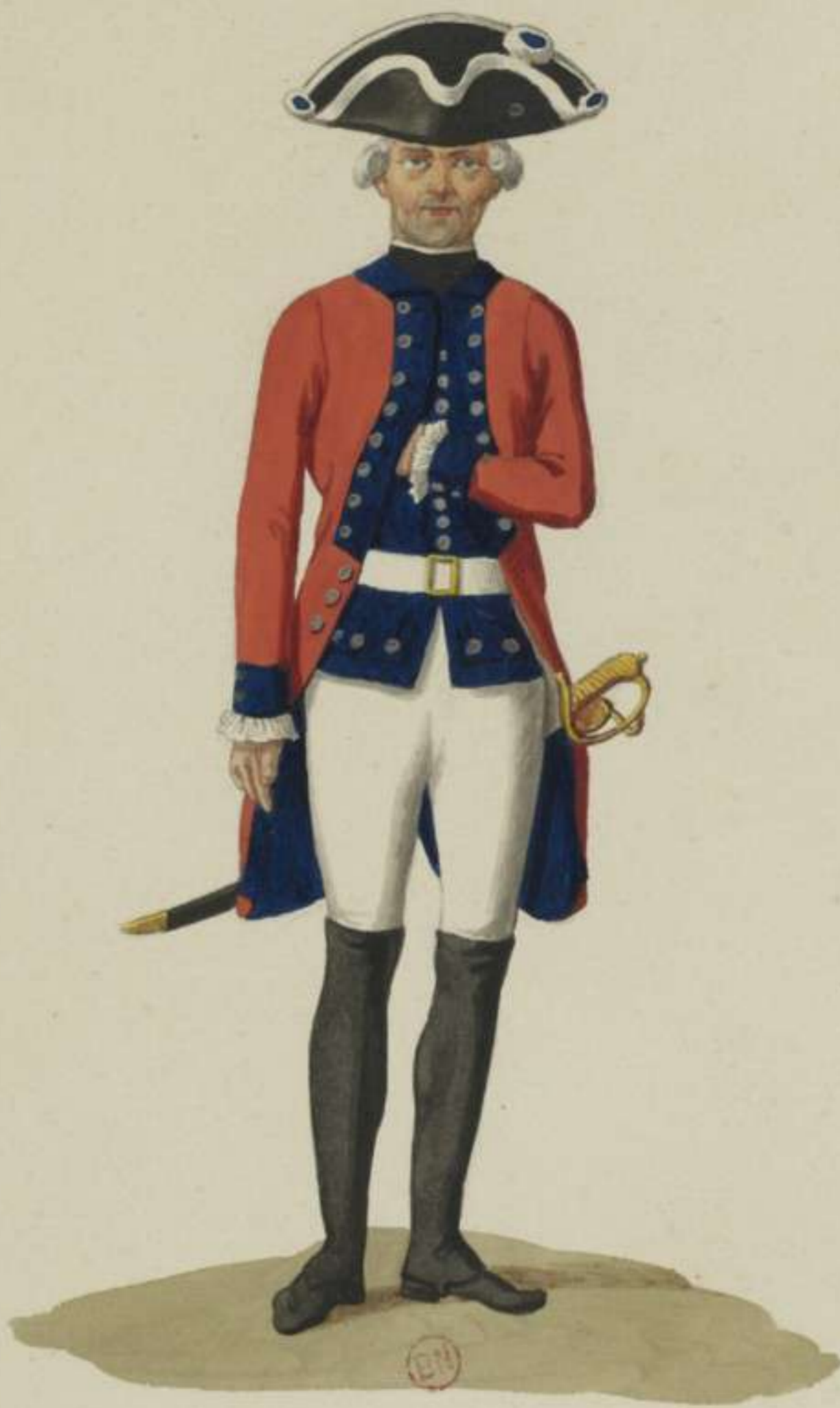
32°- Halb Invaliden Compagnie