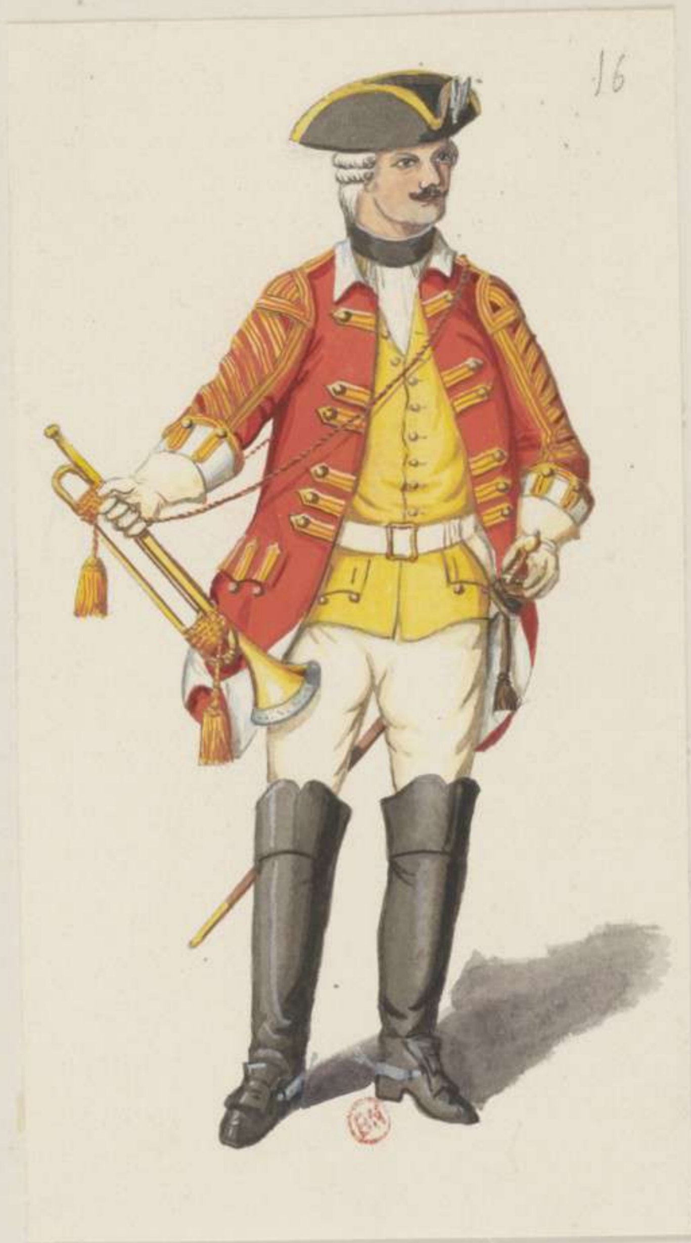
16°- Carabinier Garde - Trompeter - 1744