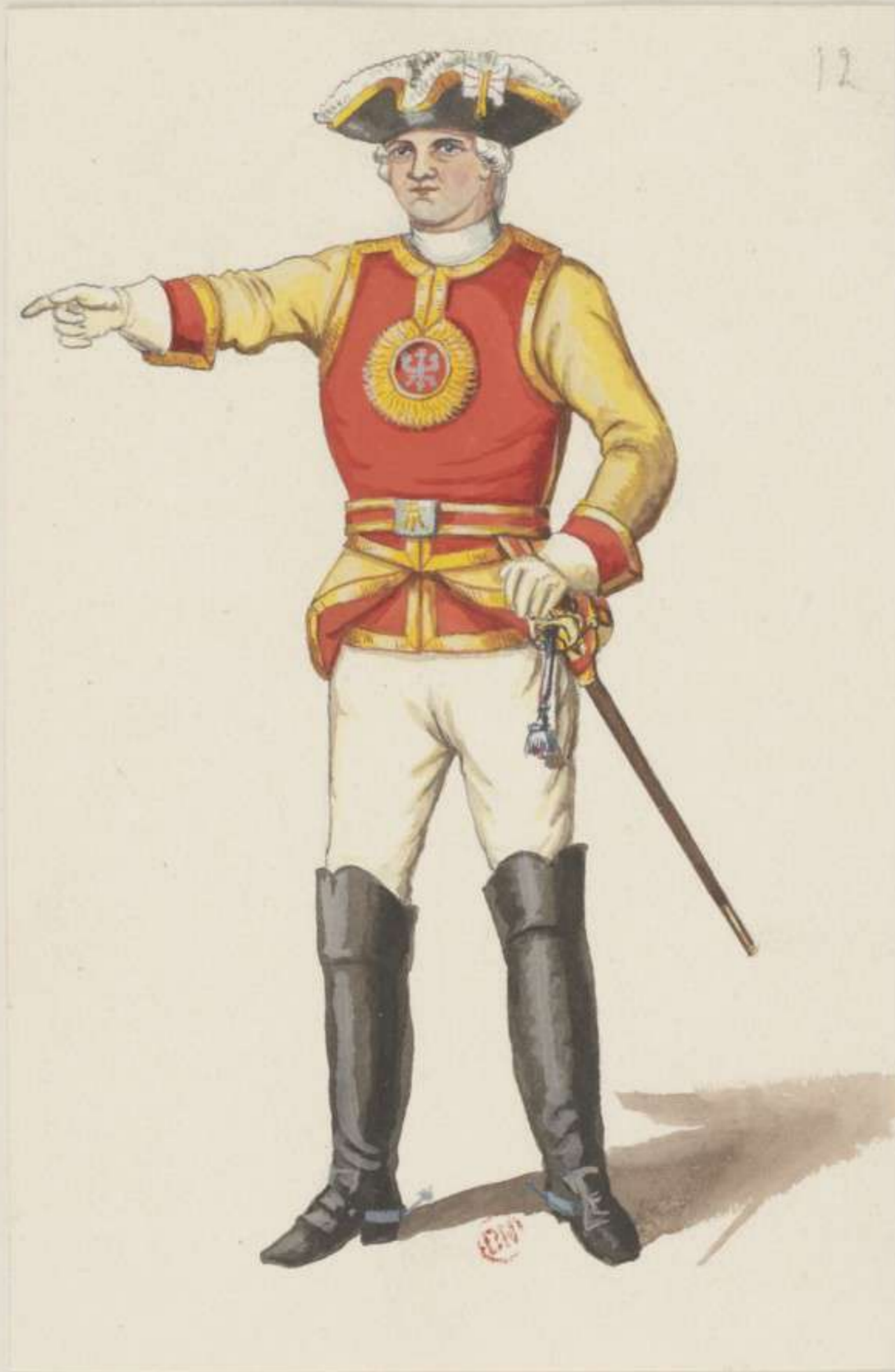
12°- Garde du Corps - Officier in Gala - 1745