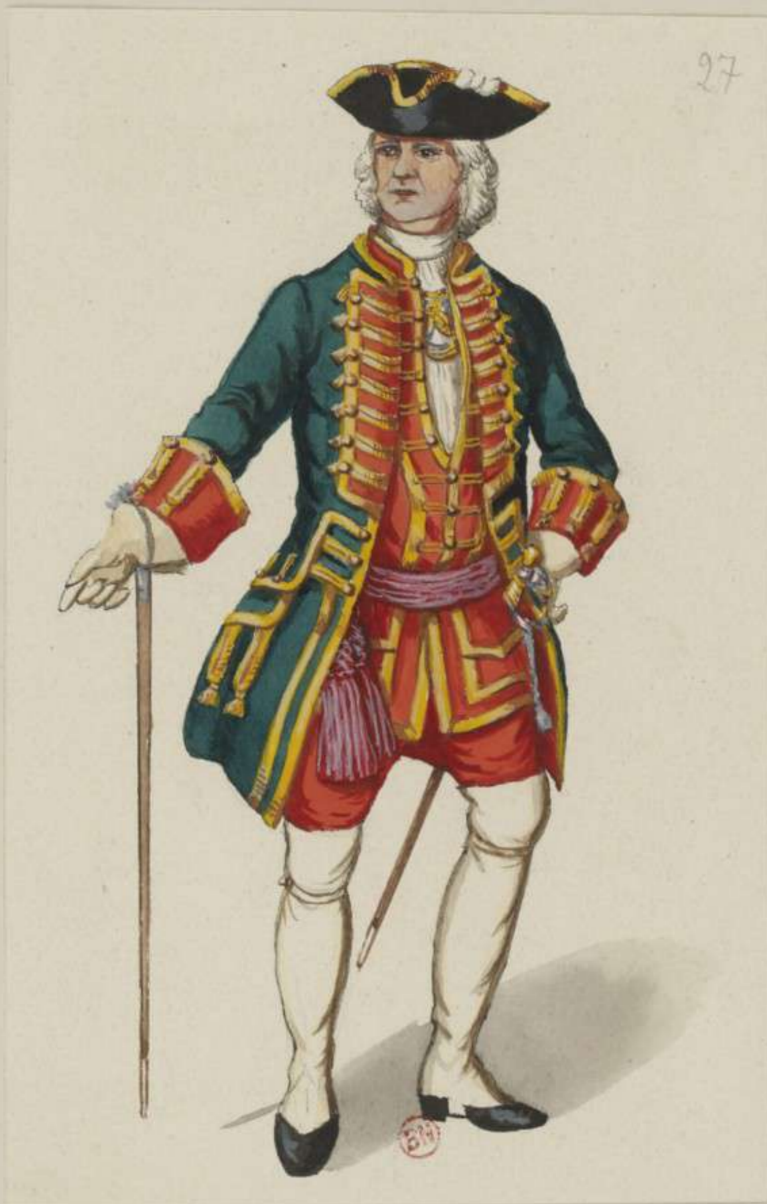
27 o - Artillerie Oberst