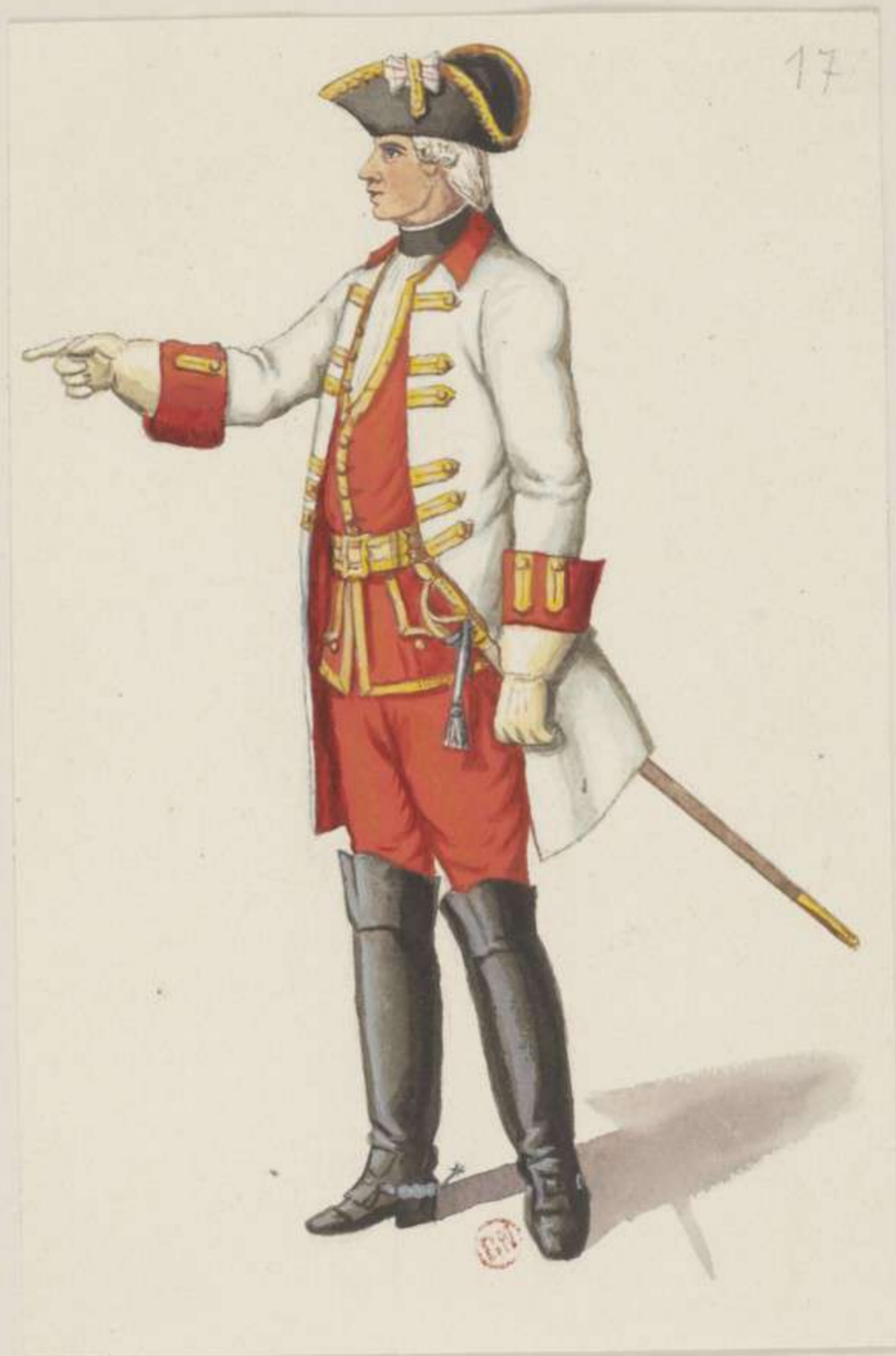
17°- Carabinier Garde - Officier - 1738-1754