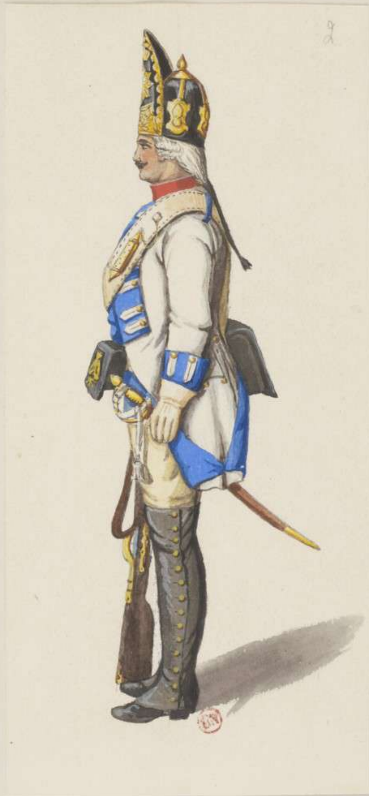
2° - Leibgrenadier Garde - Dienst Uniform, Ordinär Mütze - 1740