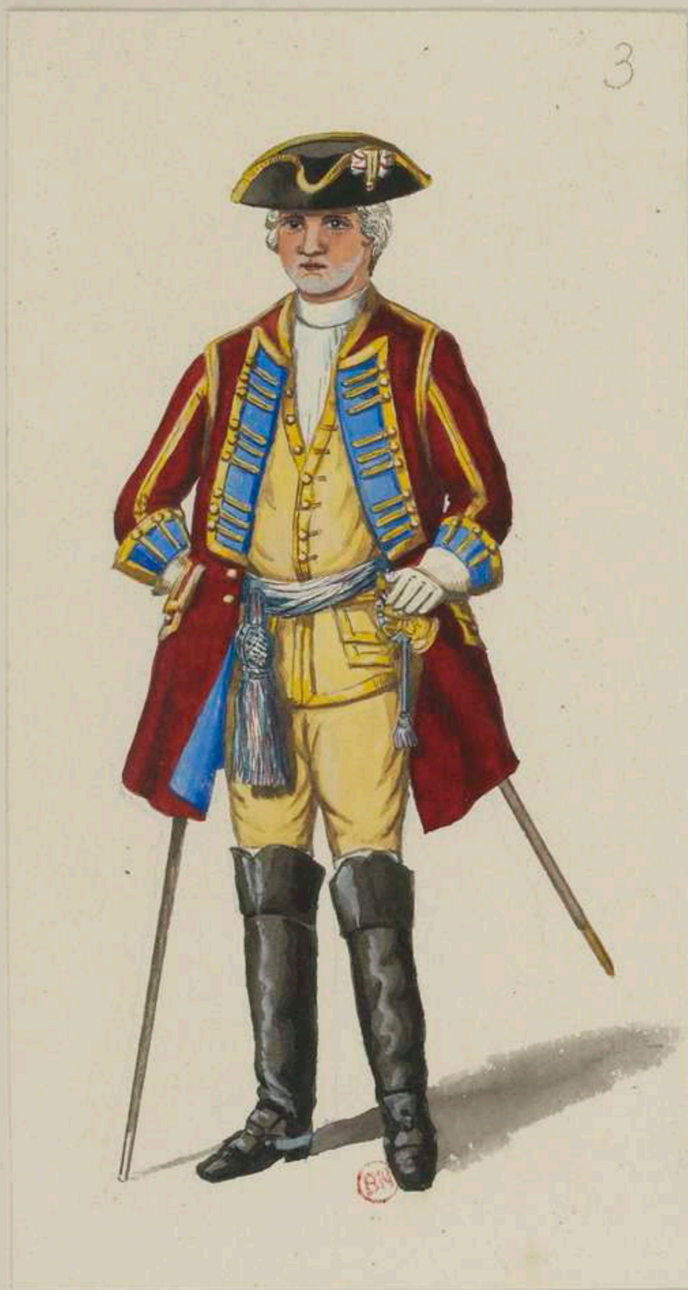
3° - Garde du Corps - Officier - 1734-1738