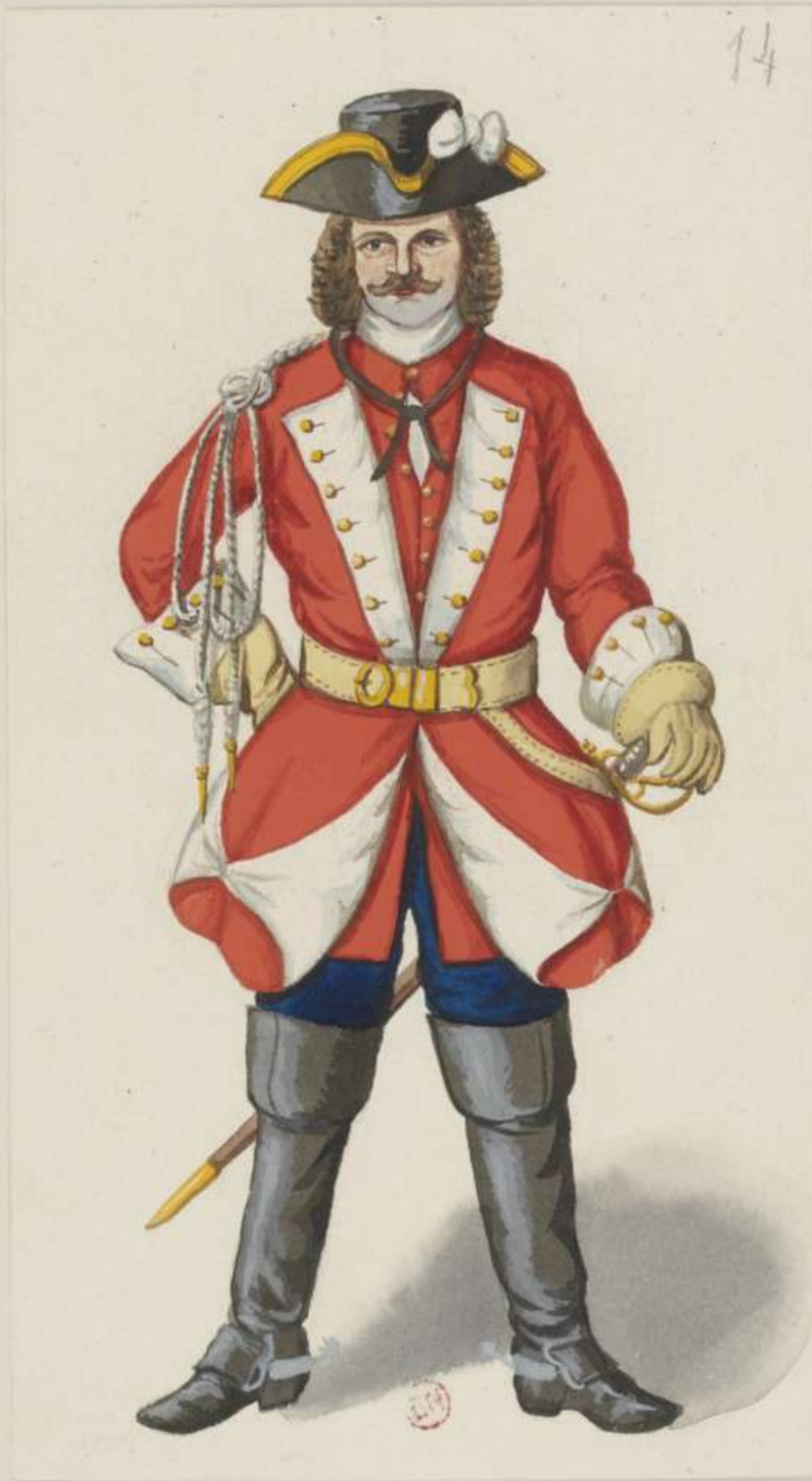
I4 o - Wachtmeister vom Leib Dragoner Regiment in Gala - I706