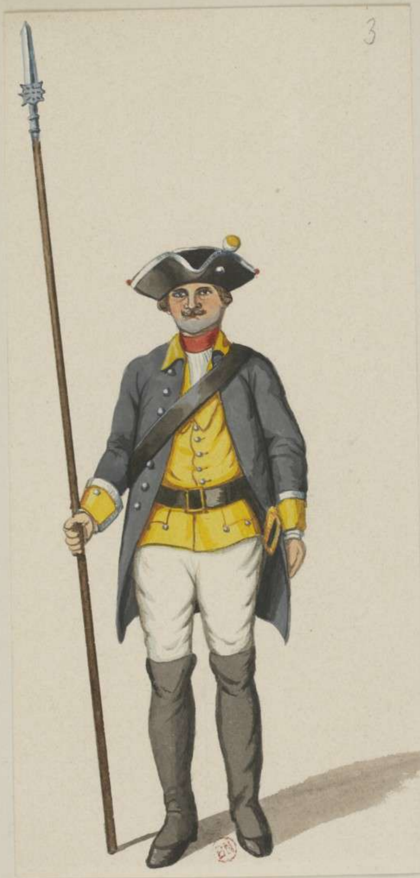
3° - I. Kreis Regiment Brutzen - 1748-1763