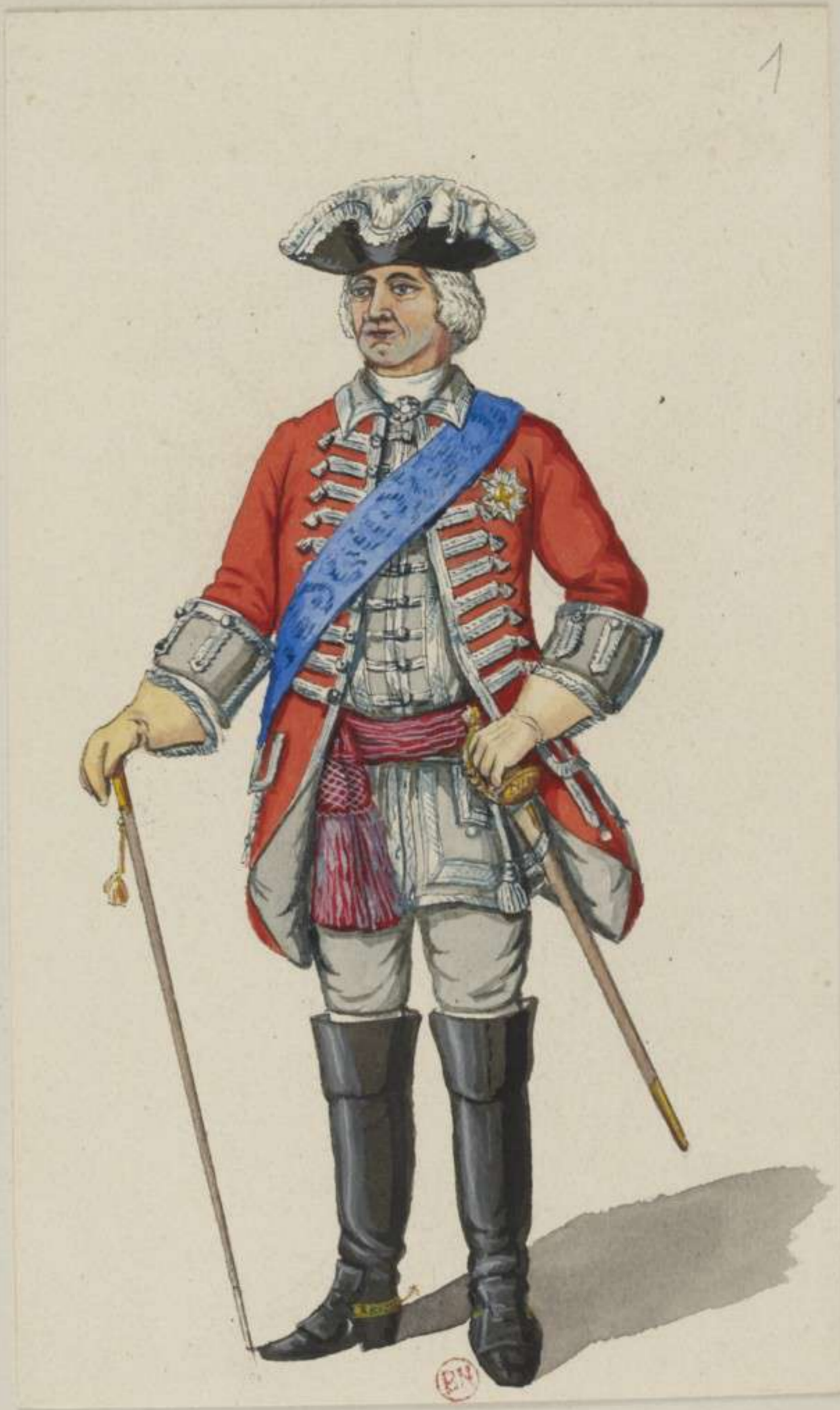
I° - Churfürst August II König von Polen