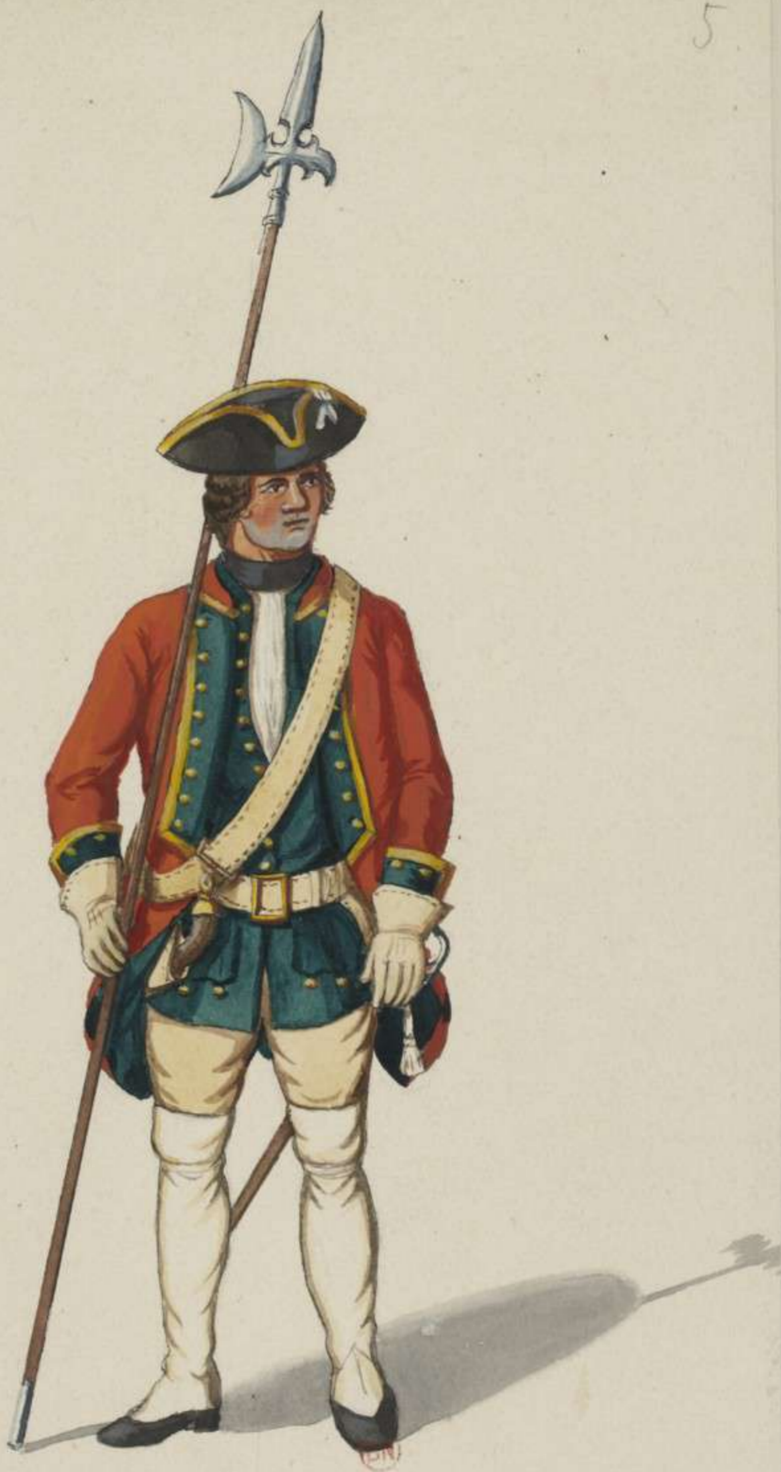
5° - Musketier Unterofficier vom Regiment Sachsen Weimar