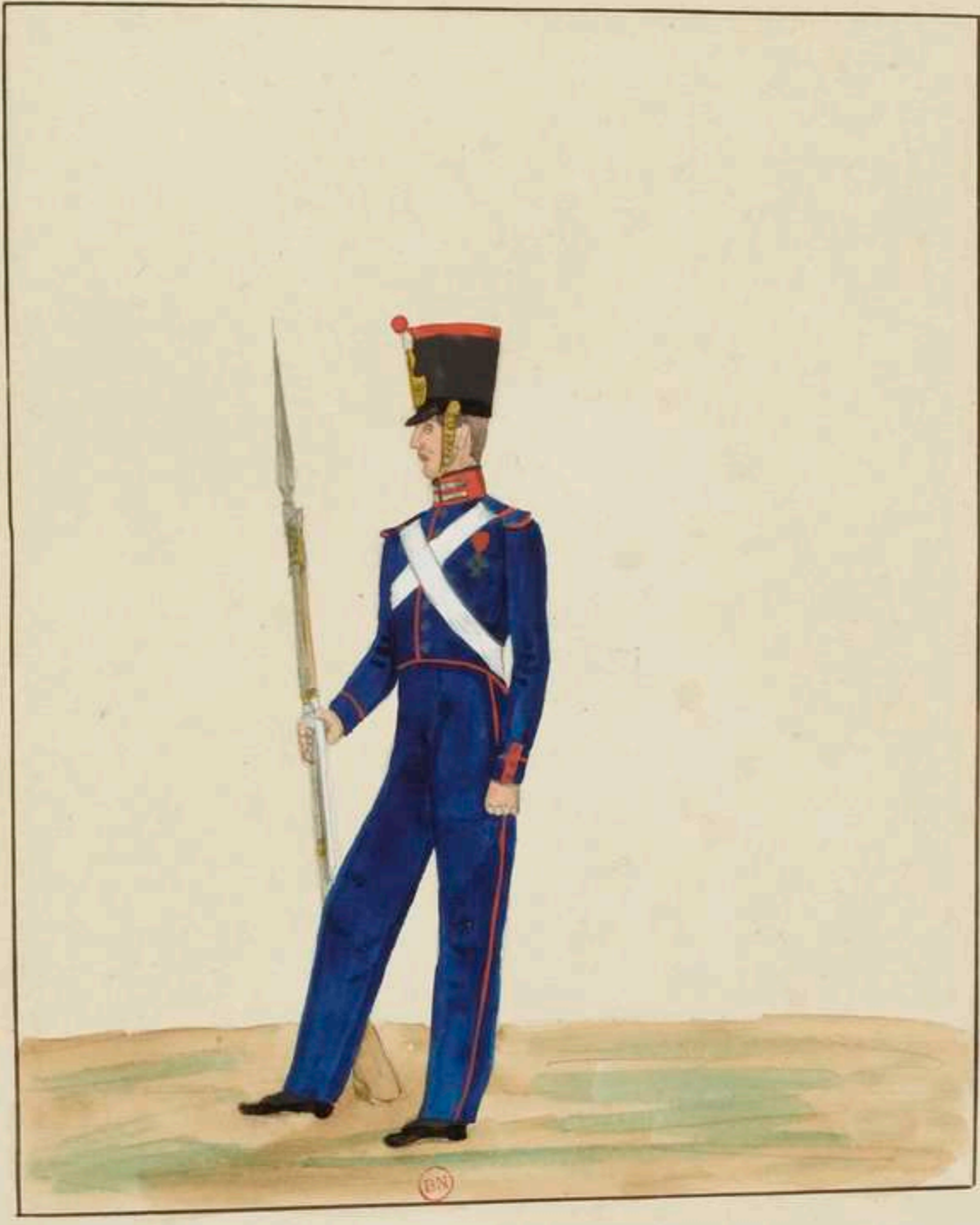
Troupes Françaises Restauration.