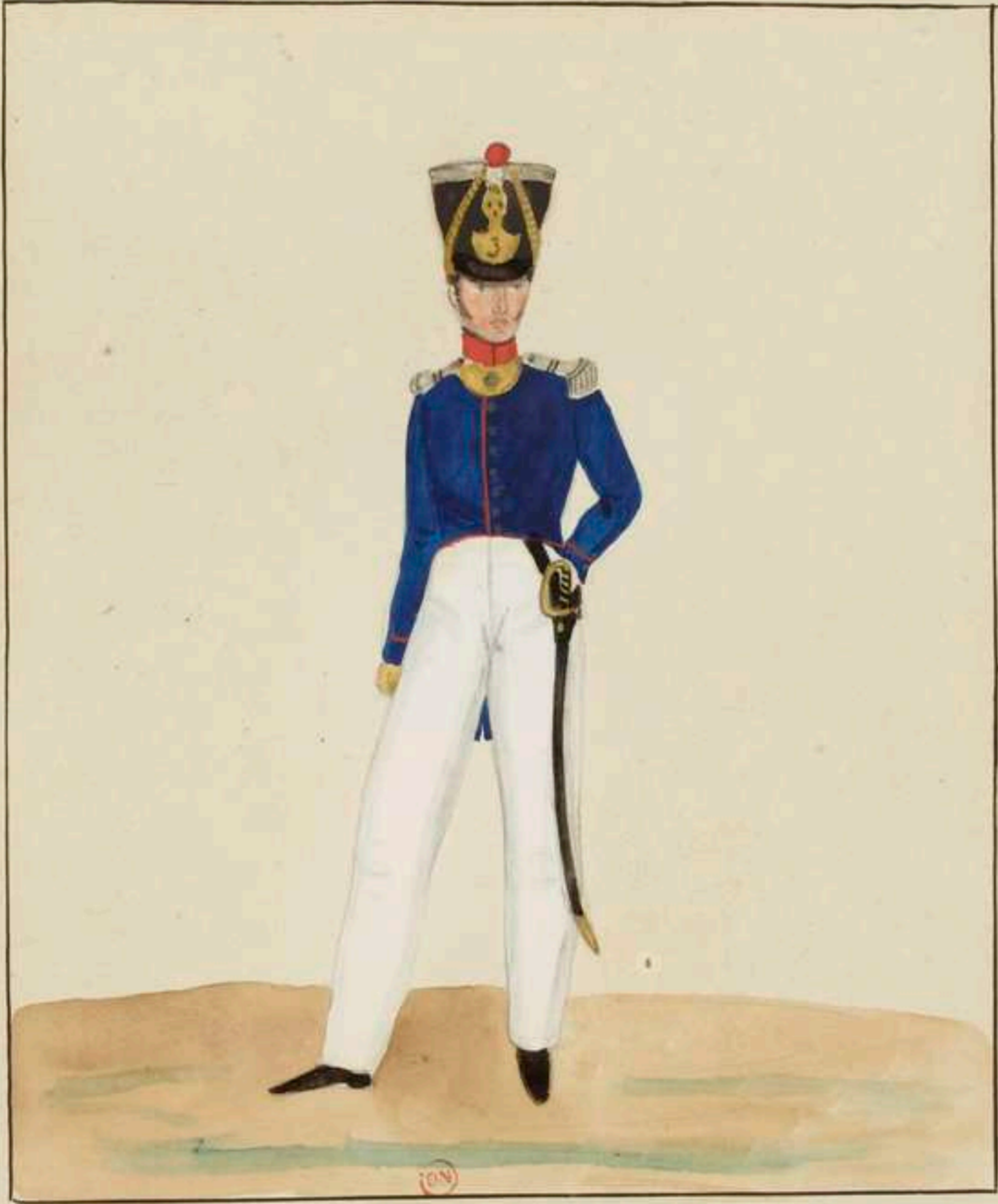
Troupes Françaises. Restauration officier de vétérans. Tenue d'été.