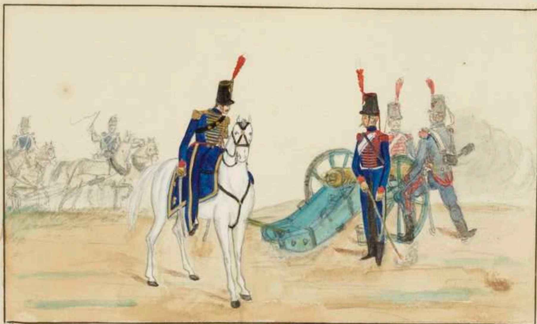
Croupes Françaises 1823-1828 Artillerie Légère Grande Toune