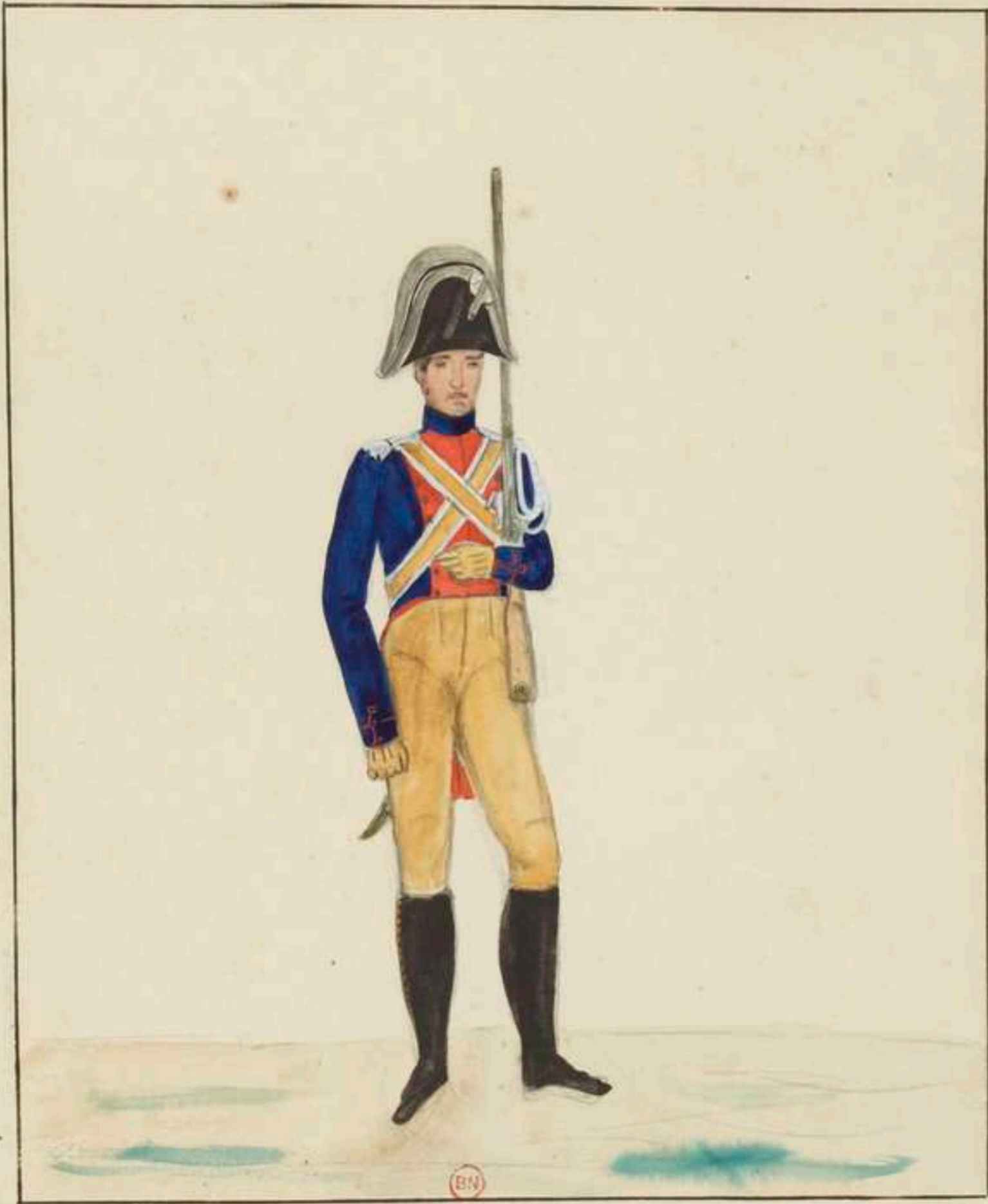
Troupes Françaises Restauration Gendarme à pied grande tenue