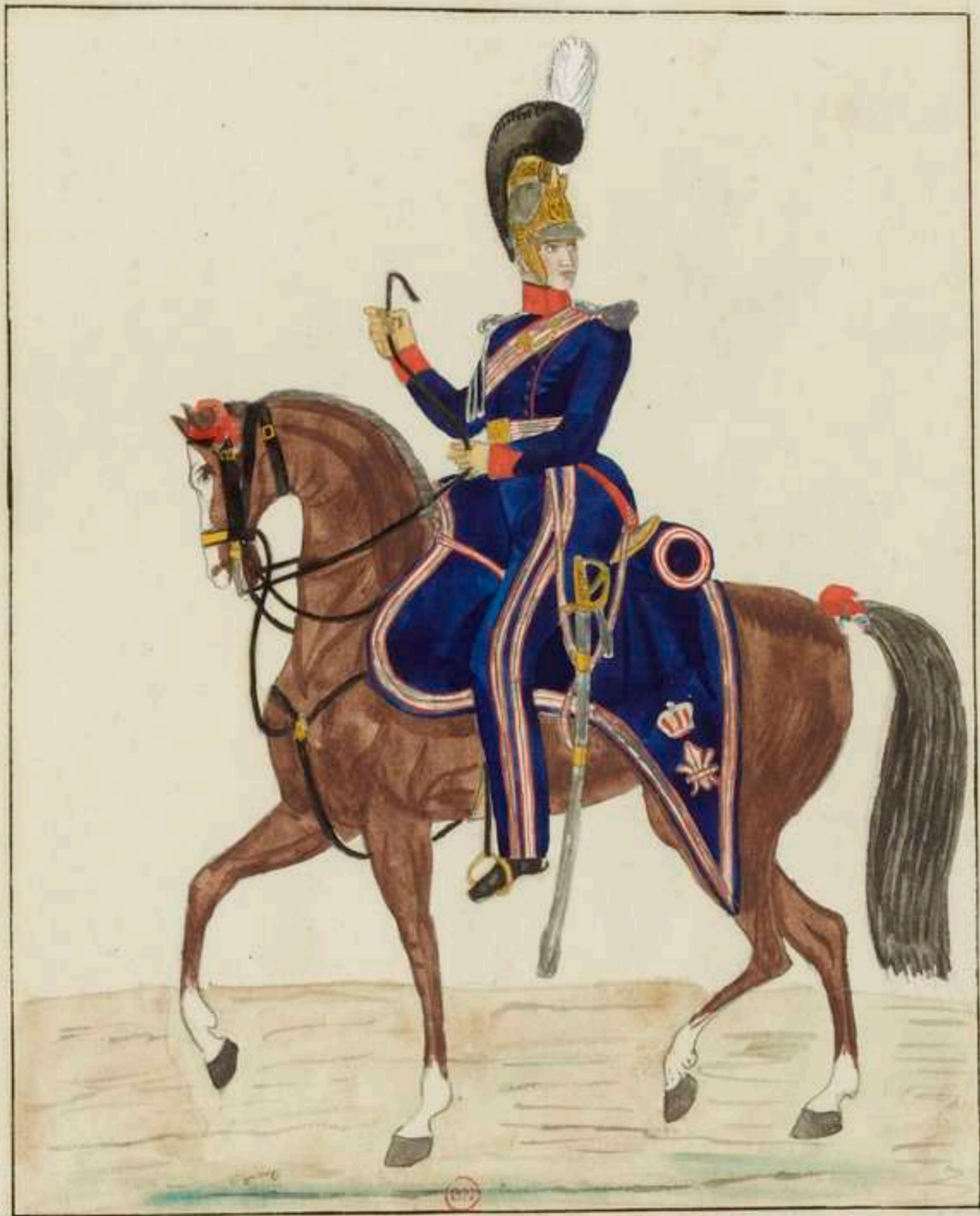
Croupes Français 1816 Garde Nationale à cheval, De Paris