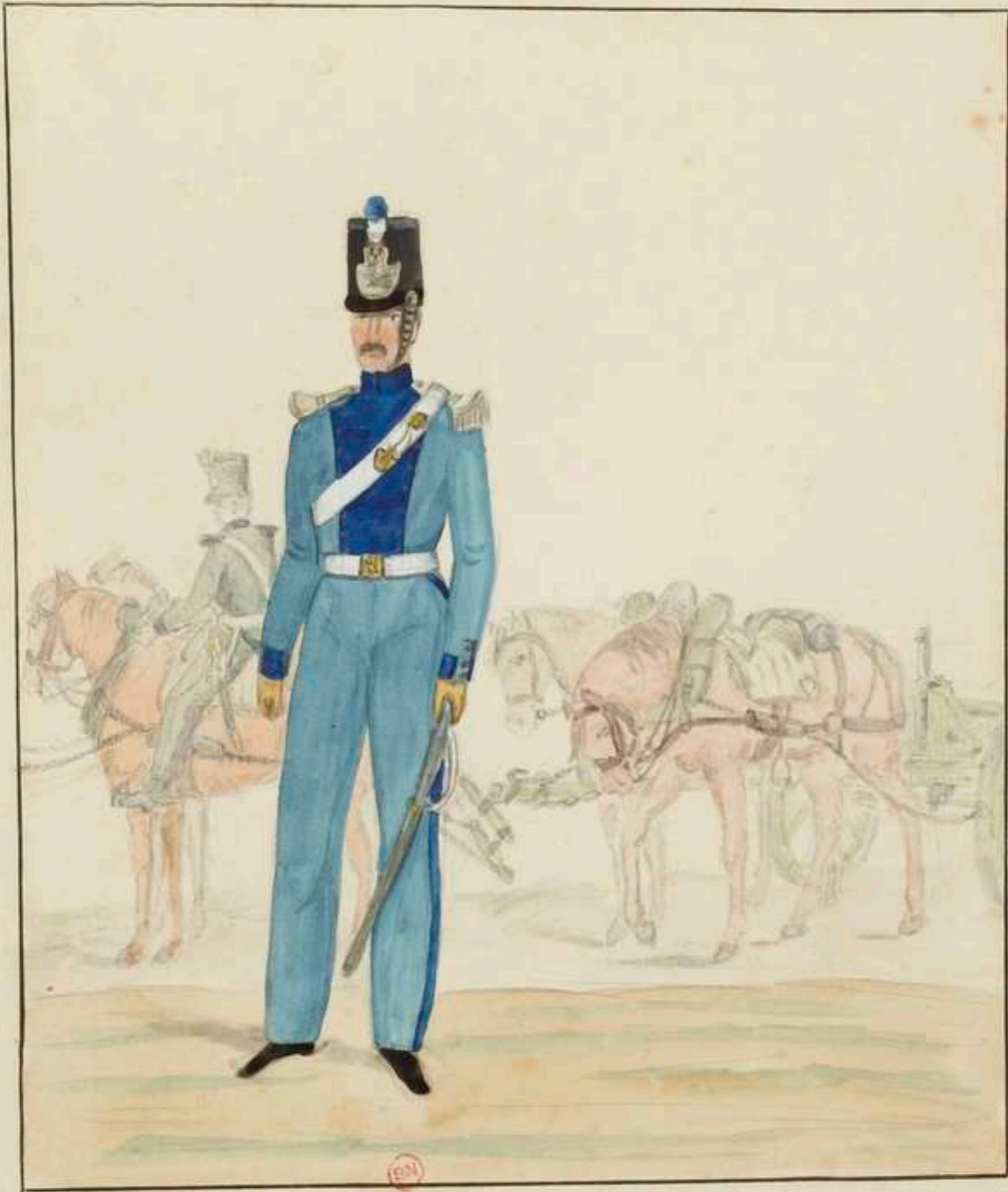
Troupes Françaises Restauration. officier du Train d'Artillerie.