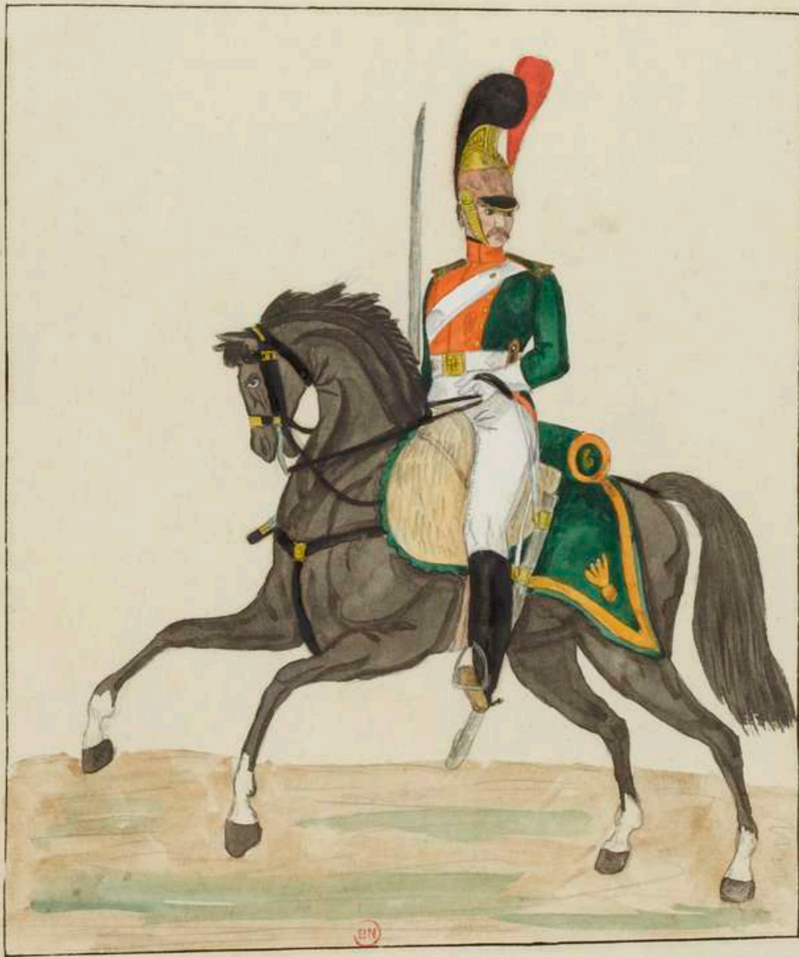
Croupes Françaises 1816 Dragon de la Loire 6 me Régiment Grande Lance