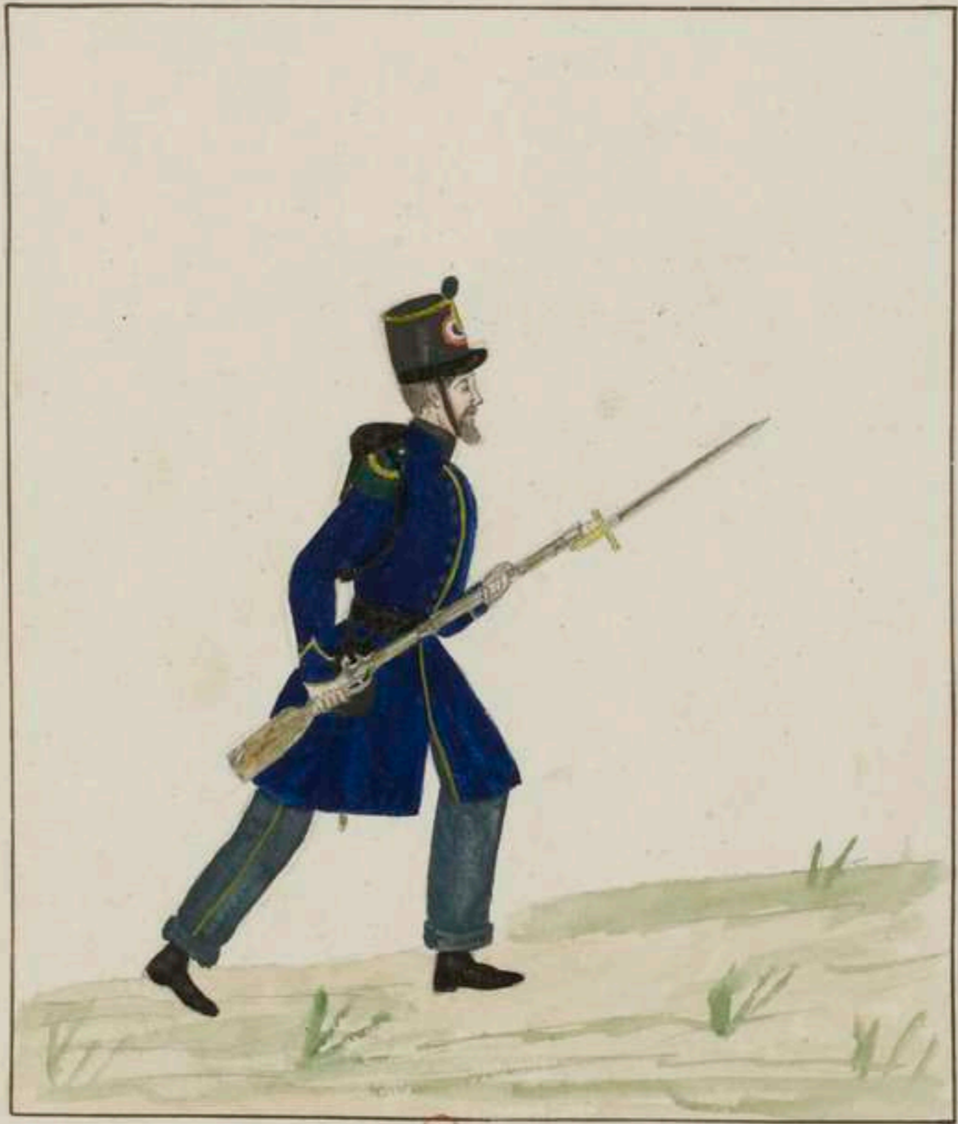
BN Troupes Françaises 1841 Chasseur - Tirailleurs d'Afrique