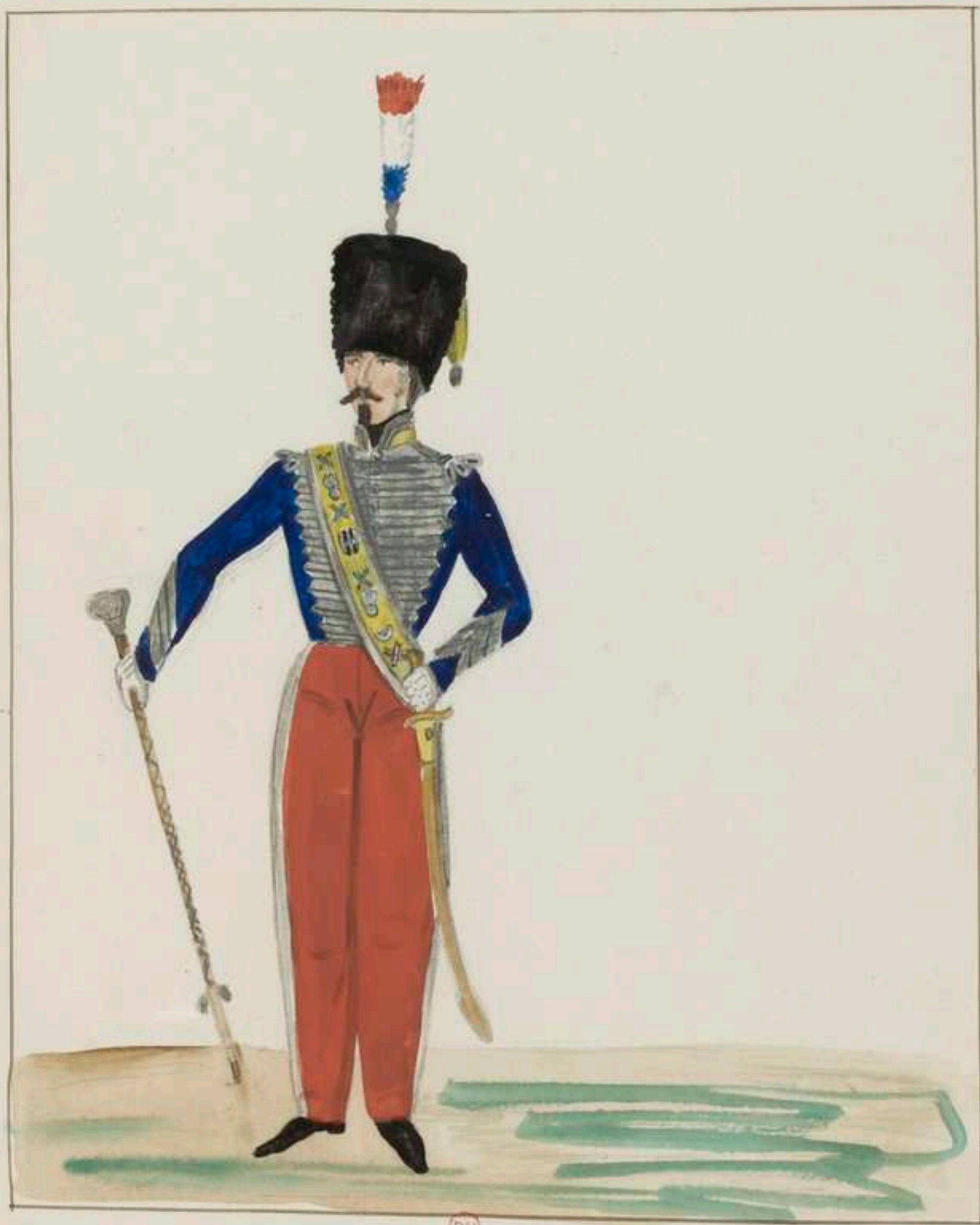
Troupes Françaises 1842 Tambour major d'infanterie légère grande tenue