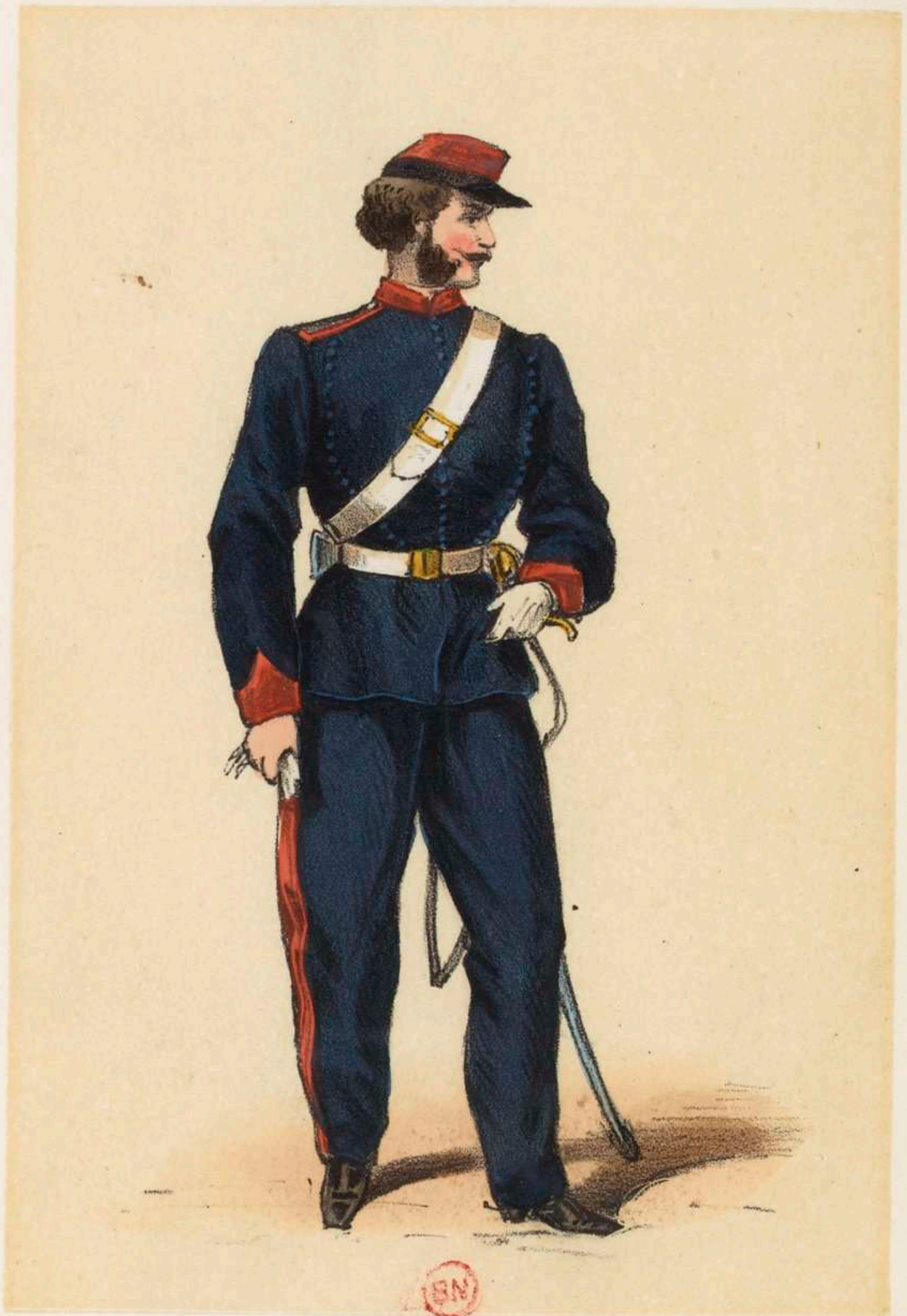
Eclaireur a cheval de la Seine