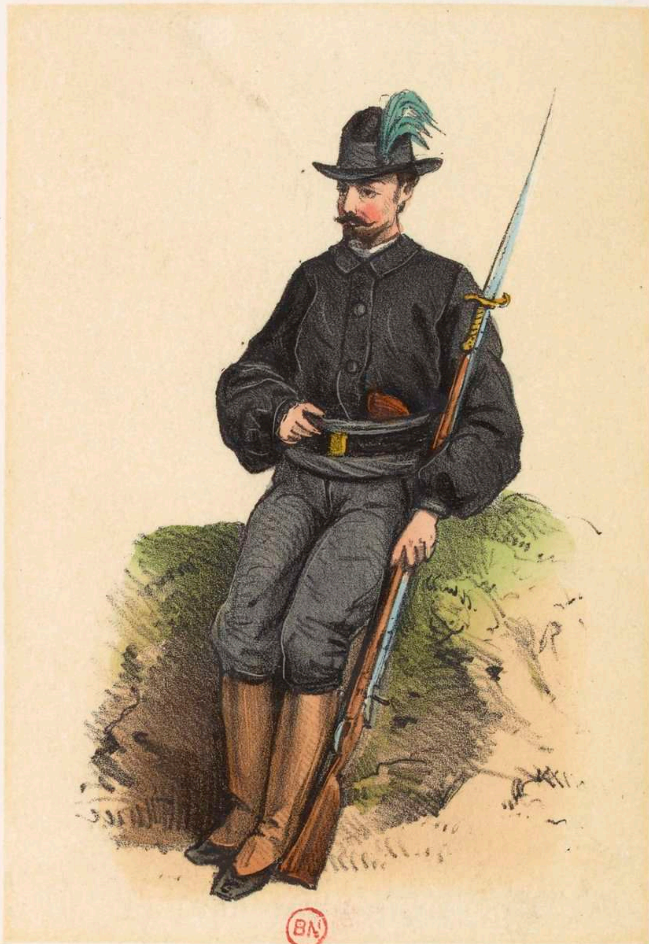
Franc-Tireur de la G de Nationale