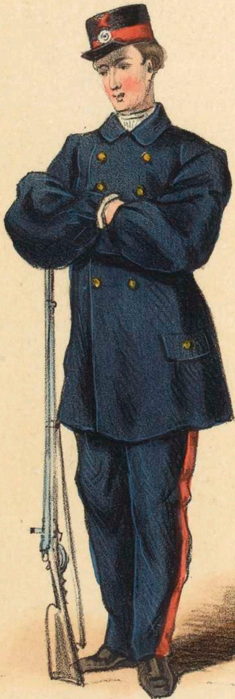
Canotier de la Seine.