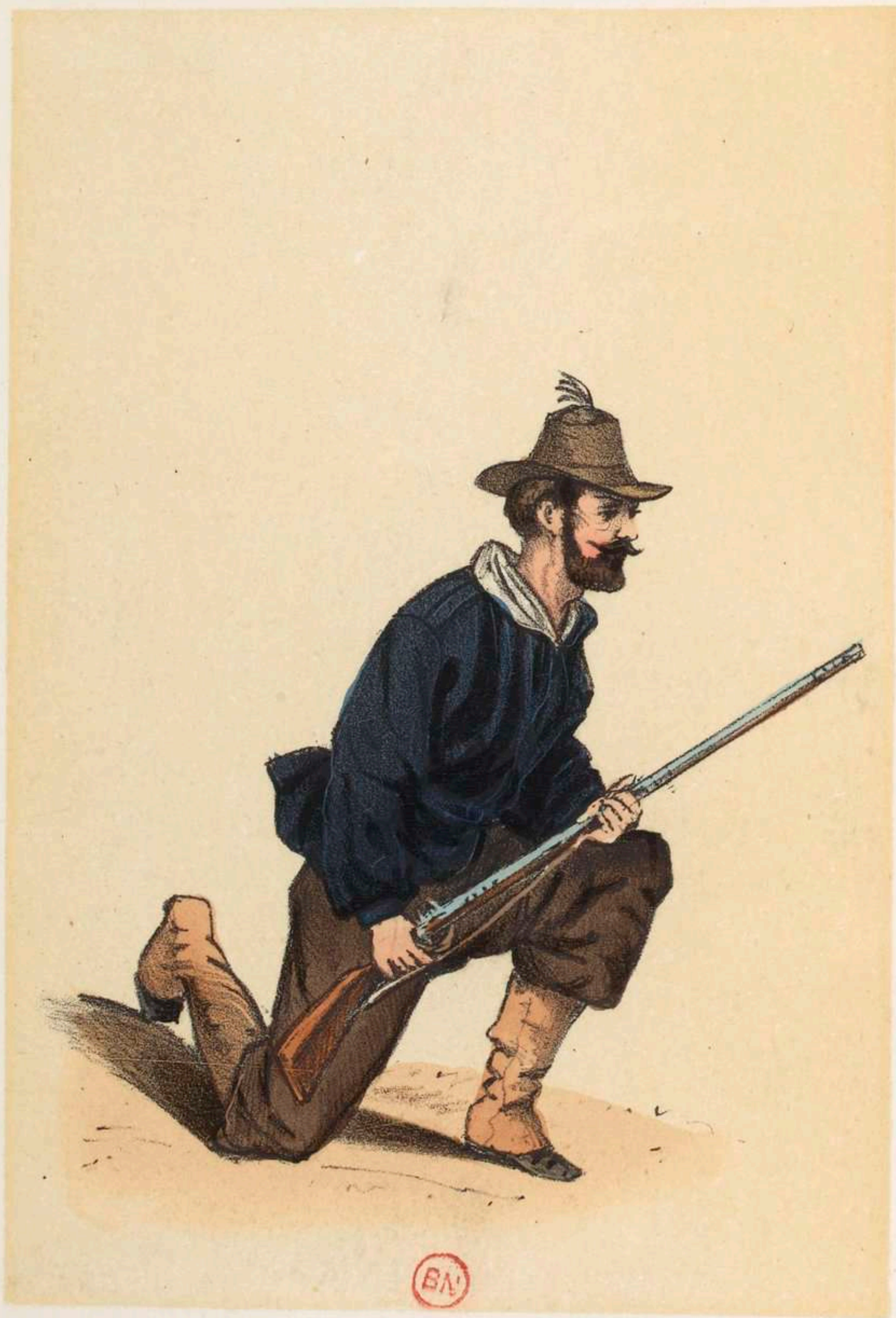
Franc-Tireur des Ternes