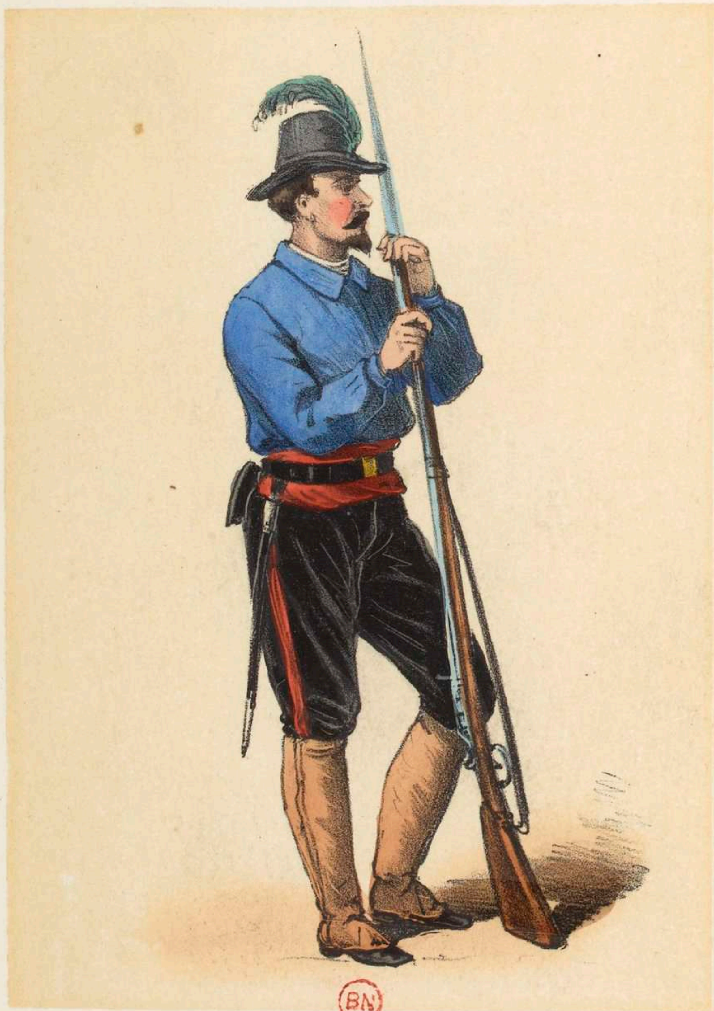
Guérillas de la Seine