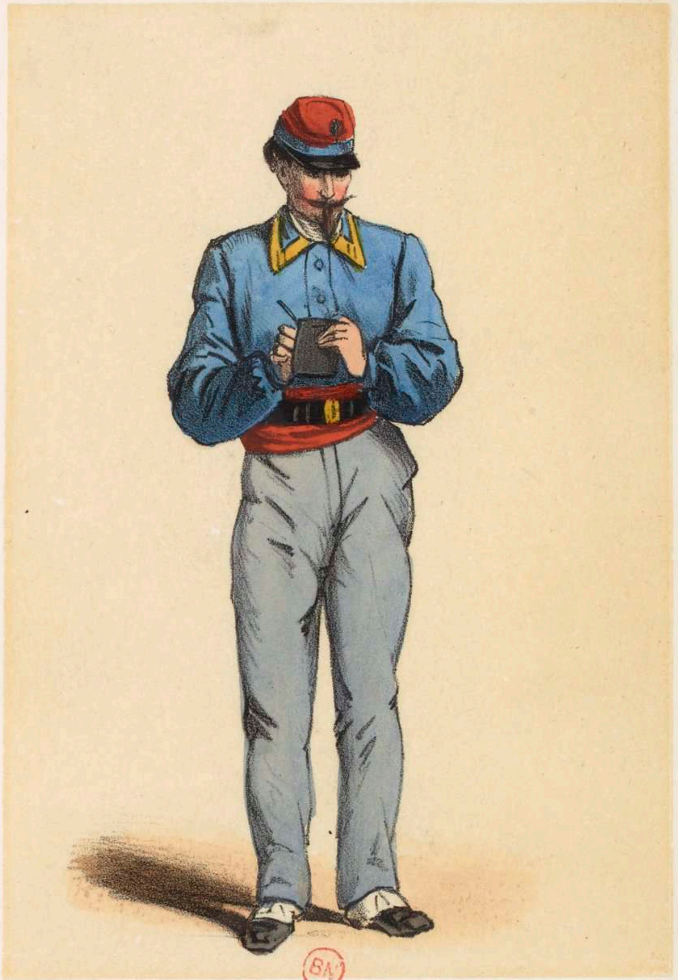
Employé des Chemins de fer .