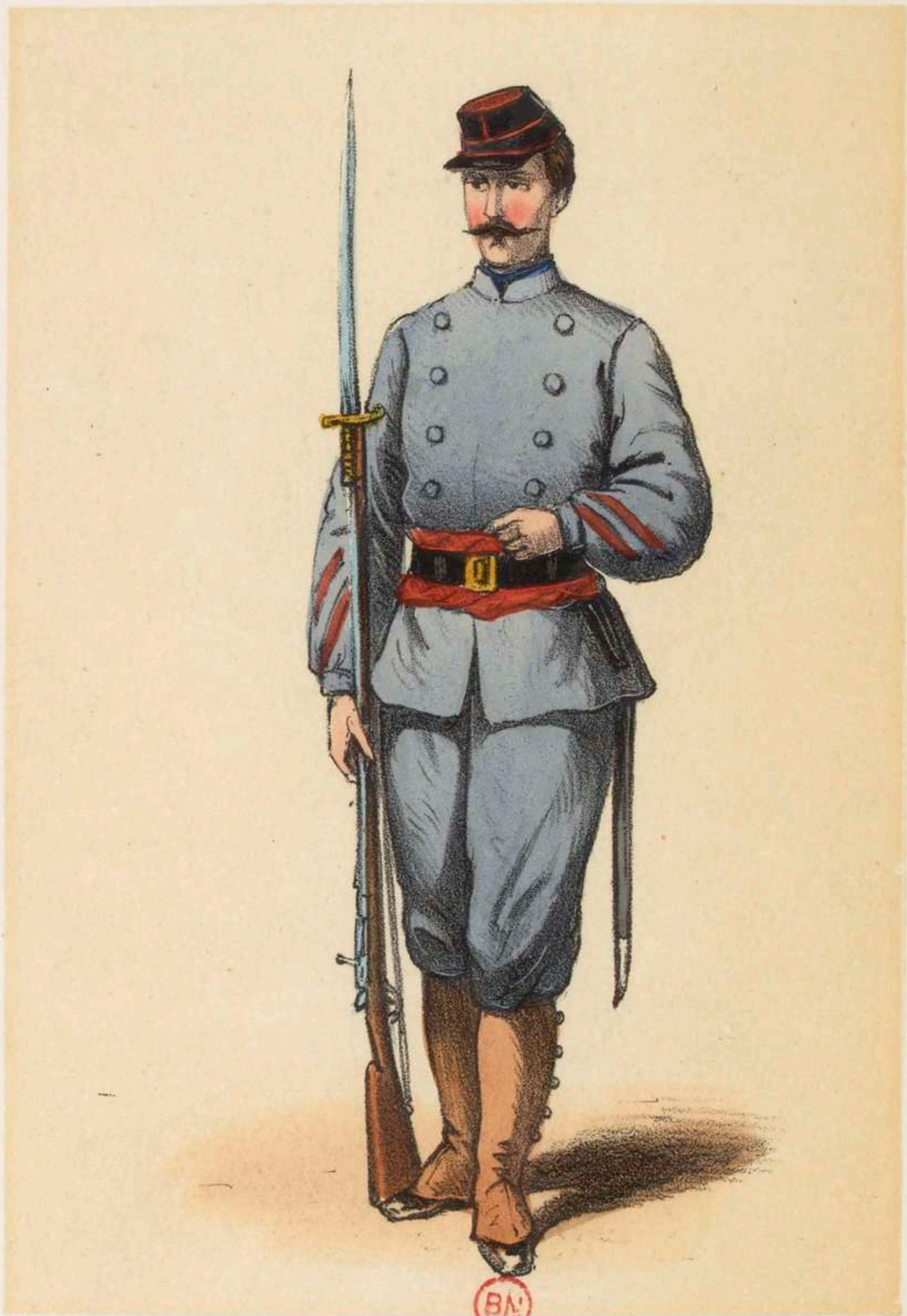
Eclaireur de la Seine