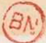
Franc-Tireur Ile de France