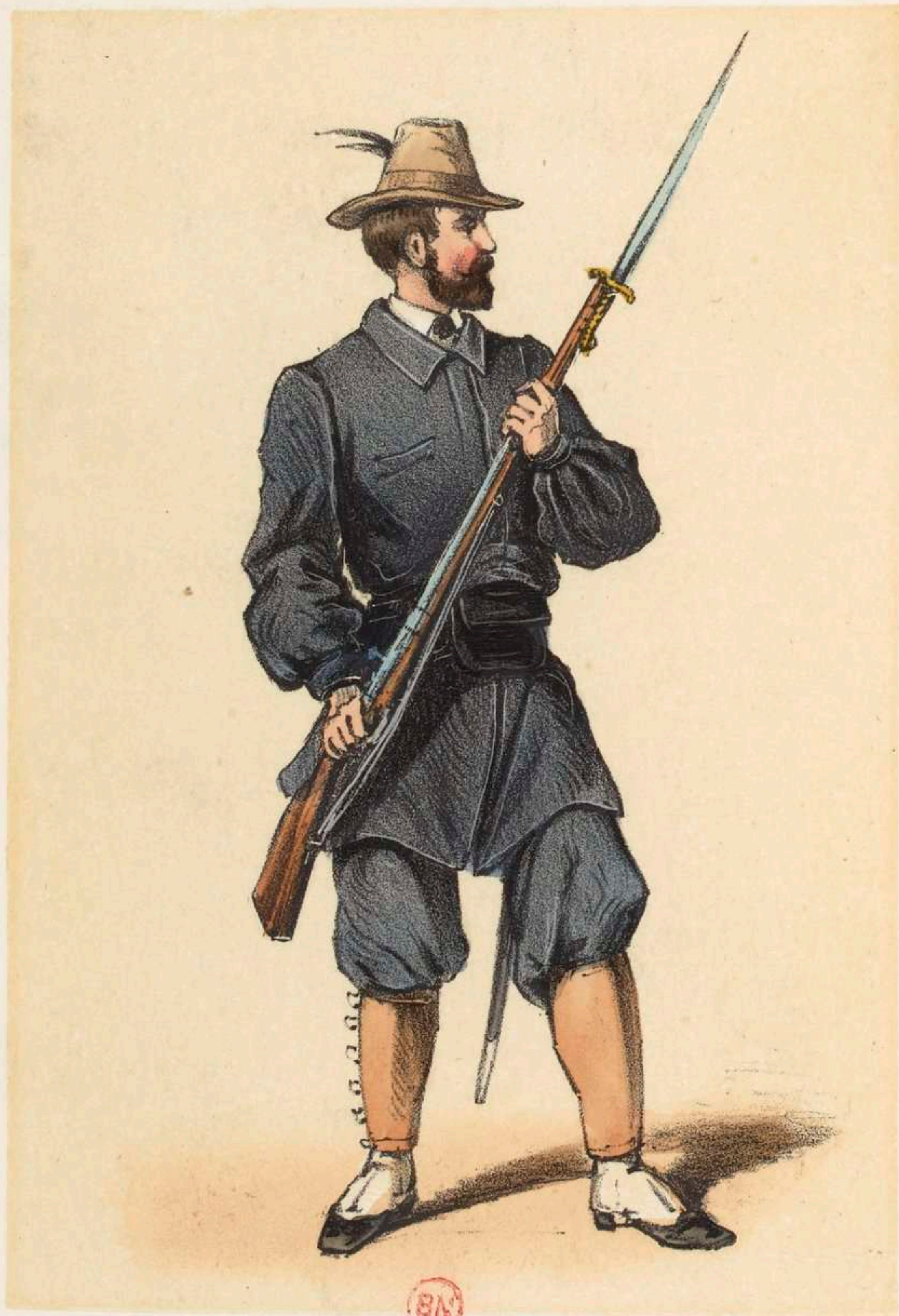
Franc-Tireur des Vosges