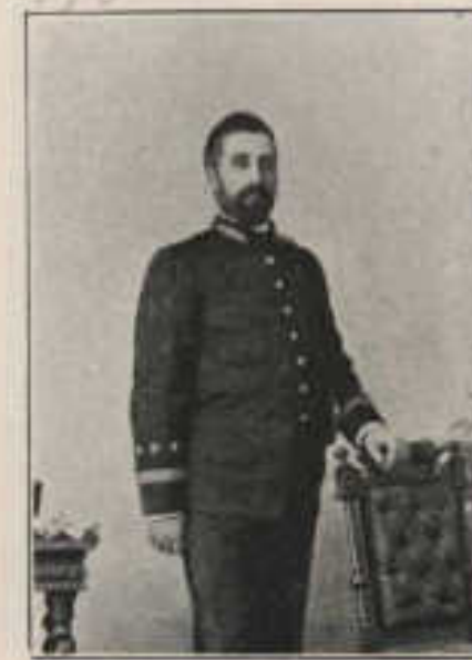
516—194—D. PEDRO SÁENZ DE SICILLA Y CONCHA.