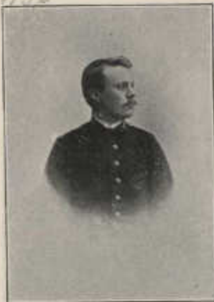
457—135—D. JESÚS DE SAN JUSTO Y SAN CIRIACO.