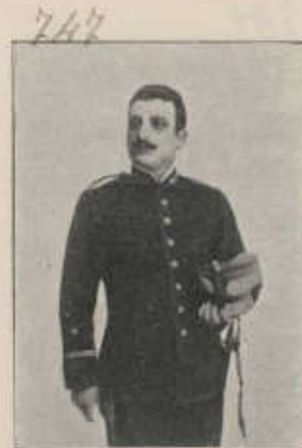
129-38—D. JESÚS RODRÍGUEZ DE LA FUENTE.