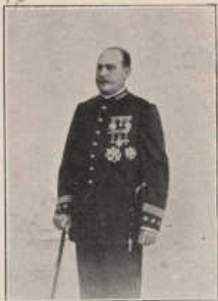
17—5—D. JOSÉ BATLLE PLATY.