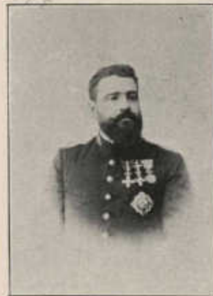
500—178—D. GERMAN SORRI PESET.

R. 1.º — 2.º R. 1.º p.º — Procedo de jurato contradictorio. 2.º M. de C. (2 años).