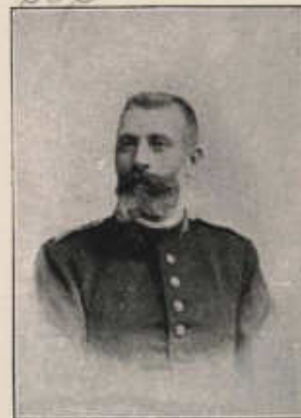
18-7-D. MANUEL PUIGVERT BORRELL.