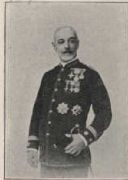
184—105—D. RAFAEL BALBÍN VALDÉS.