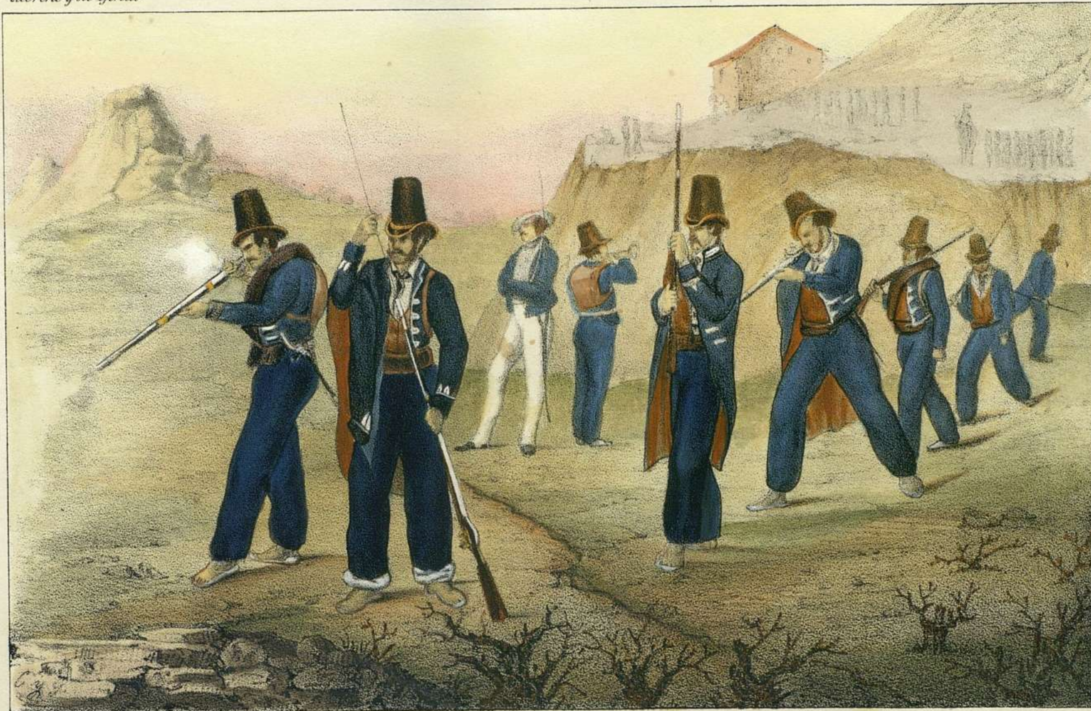
Lit. de los Artistas Madrid