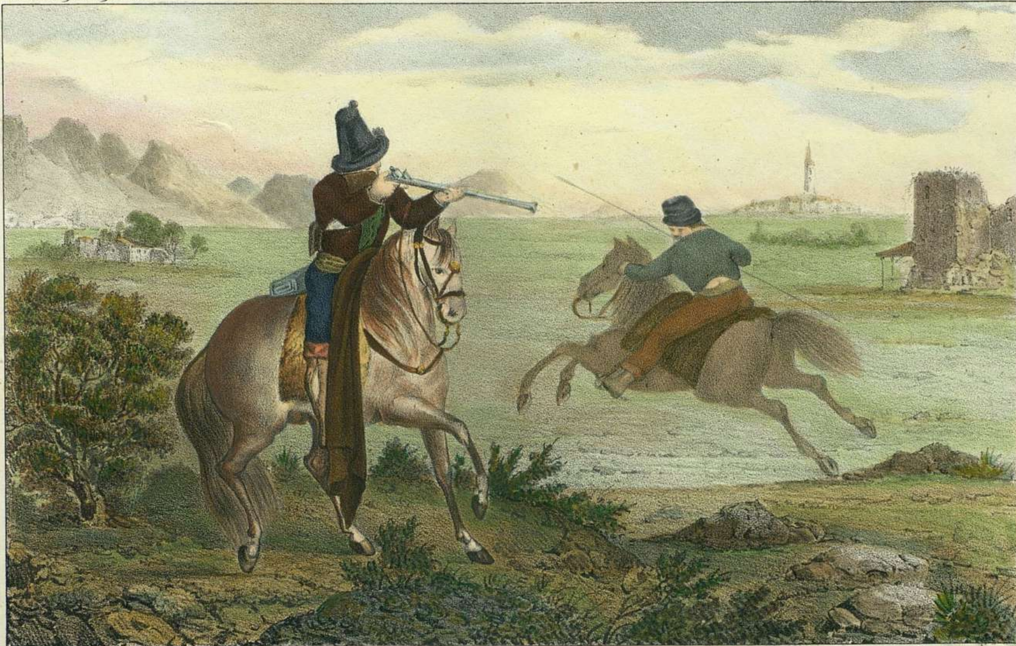
J. A. Lopez las fig. Pie el país