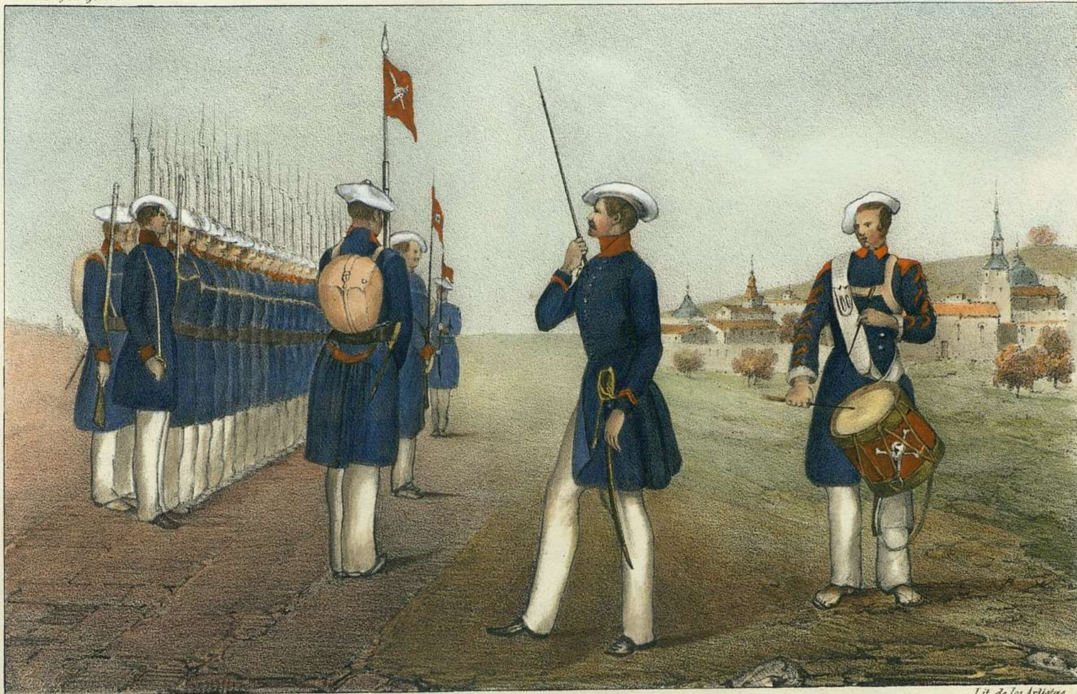
J.A. Lopez las fig. Pto el pais