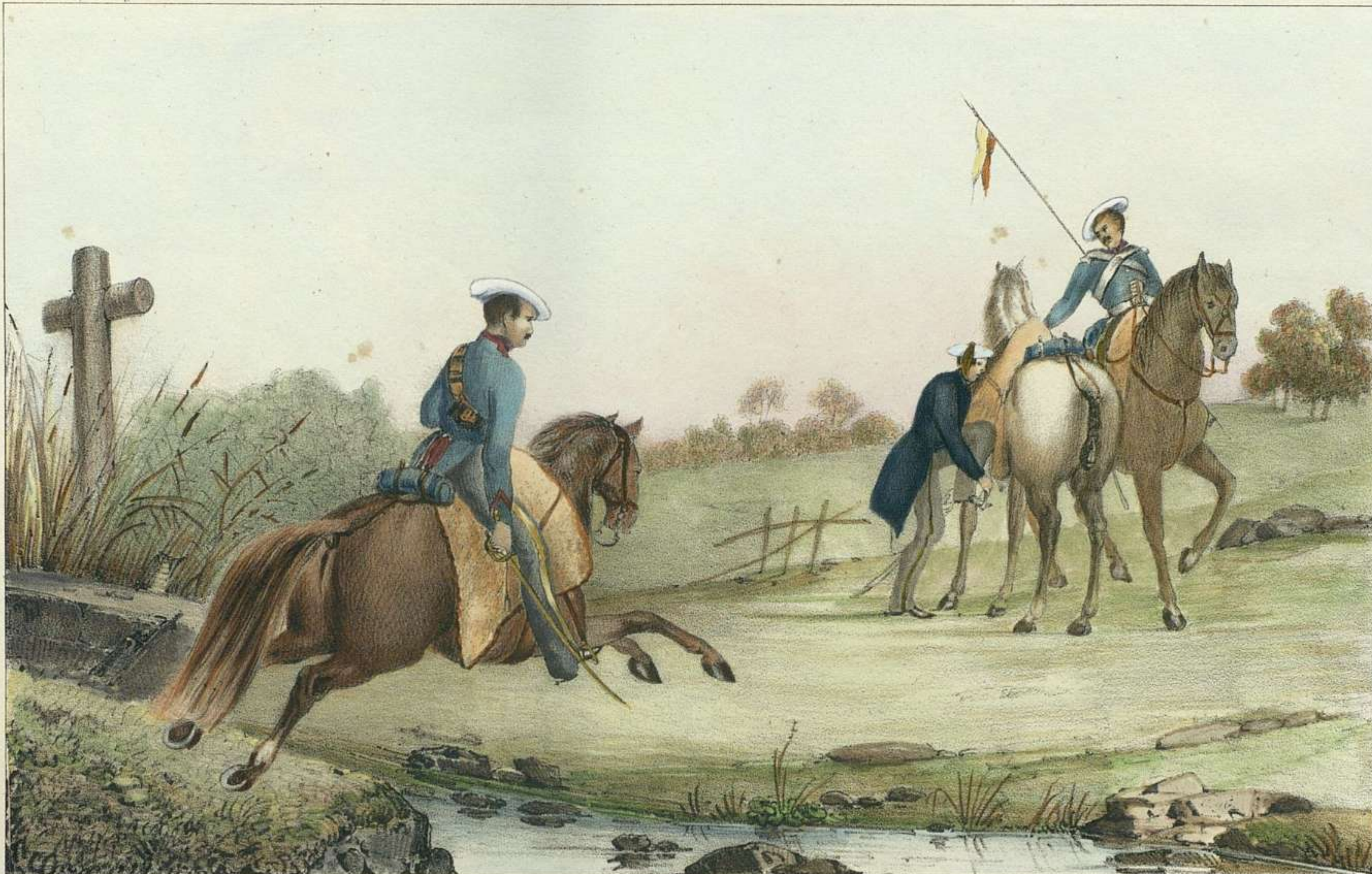
J. A. Lopez las lig. Pie el país.