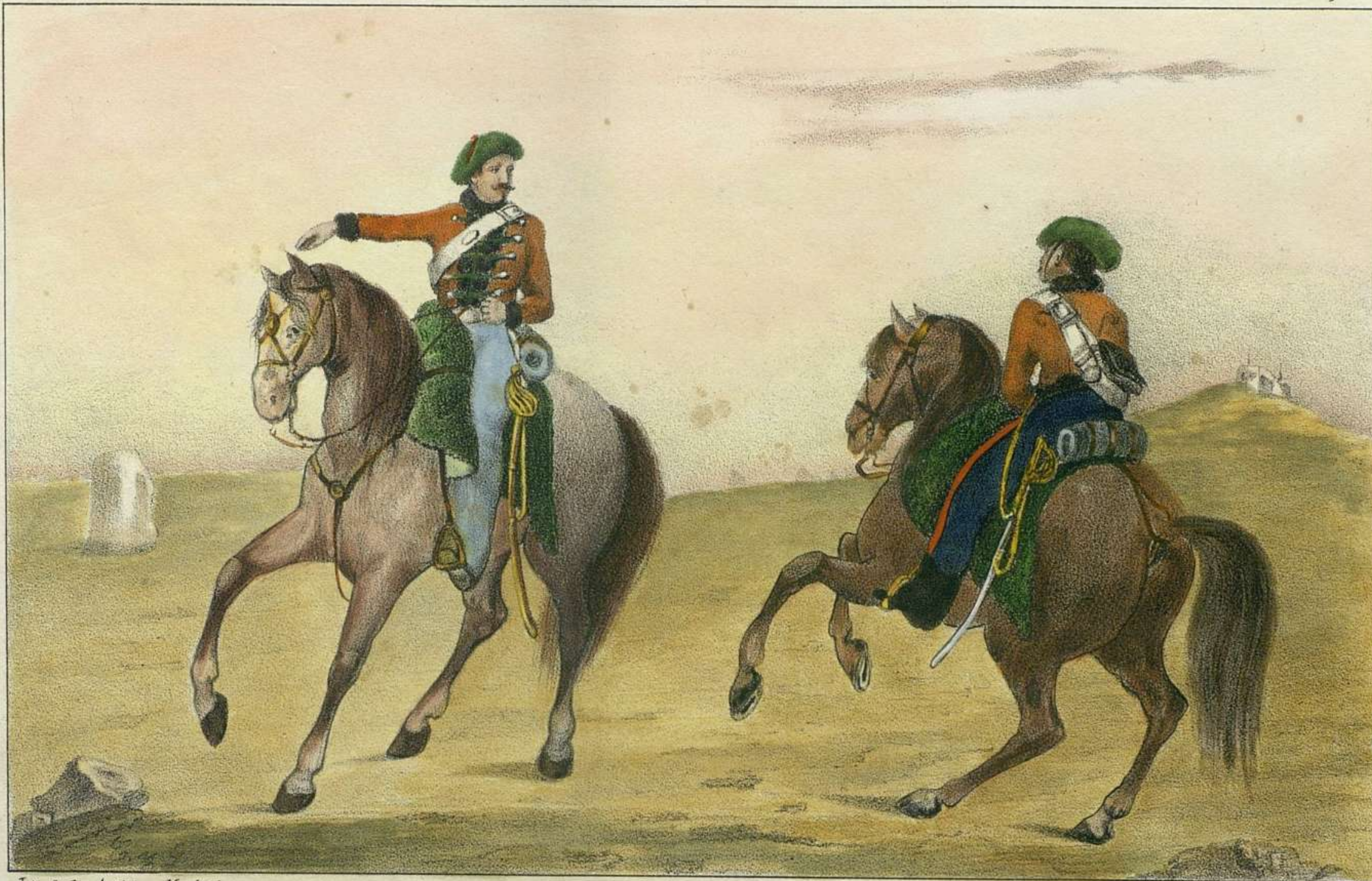
Lit. de los Artistas Madrid.