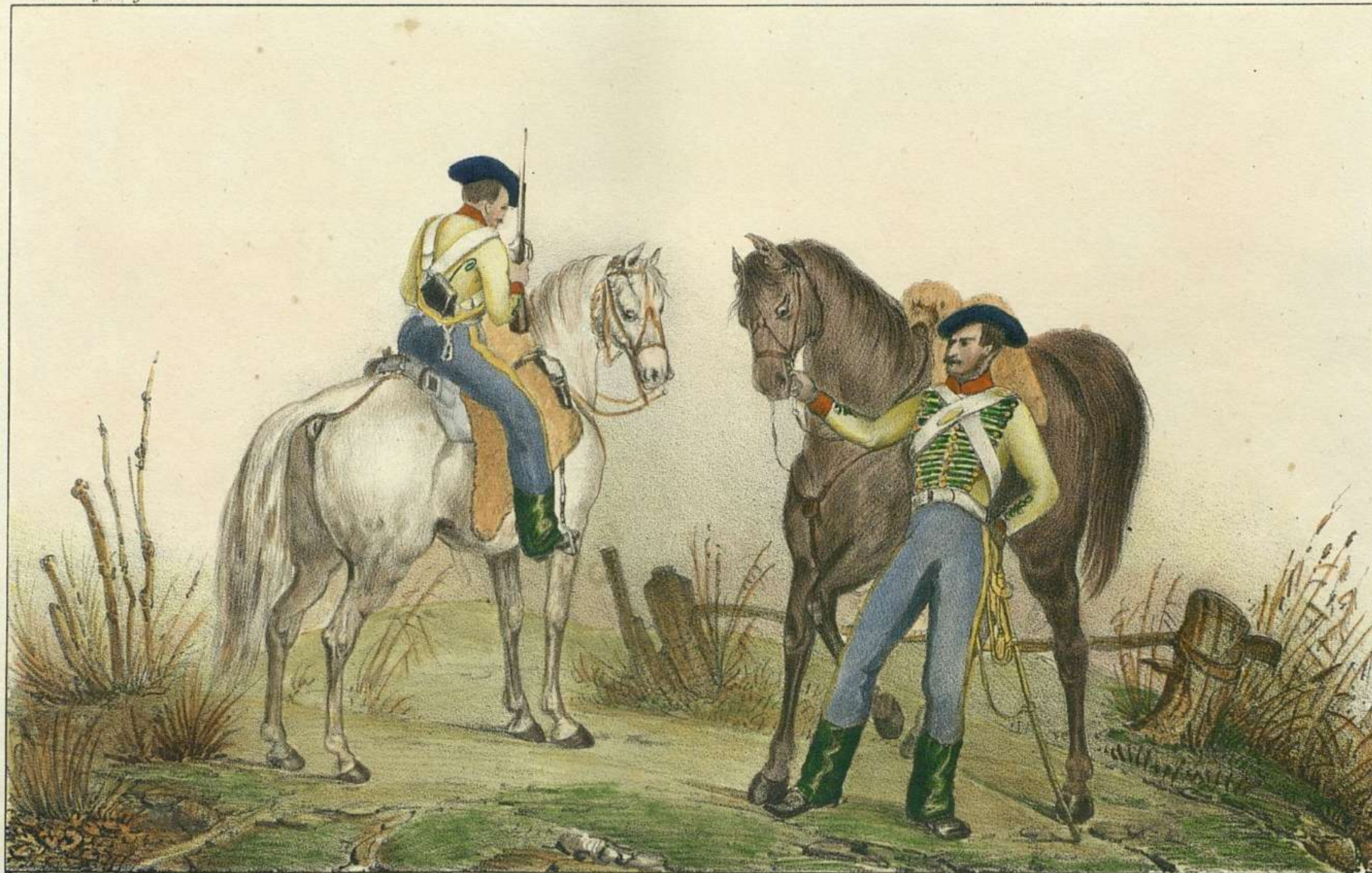
J. A. Lopez las fig. Pto el país.