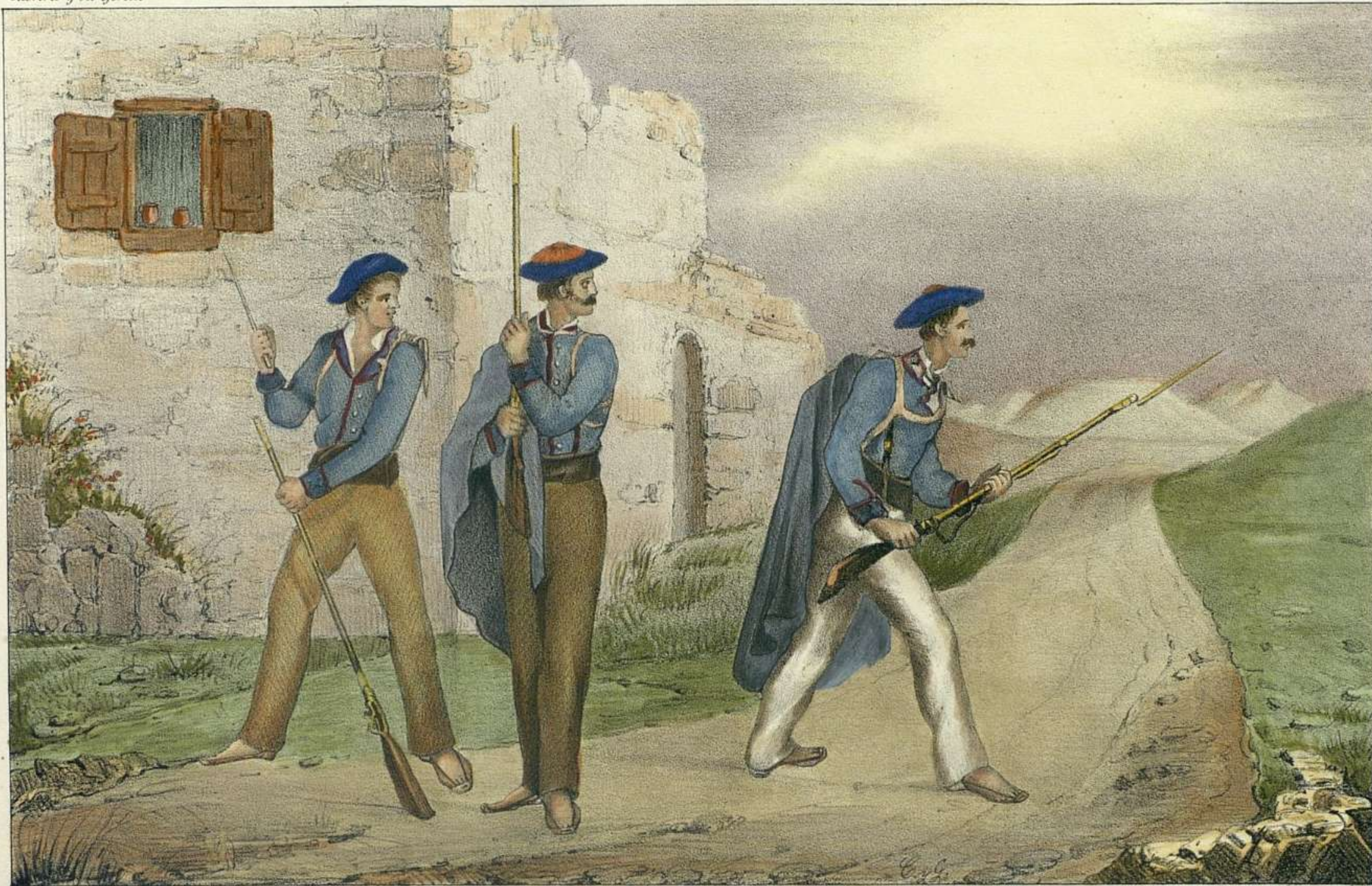
J. A. Lopez las fig. Pto. el pais