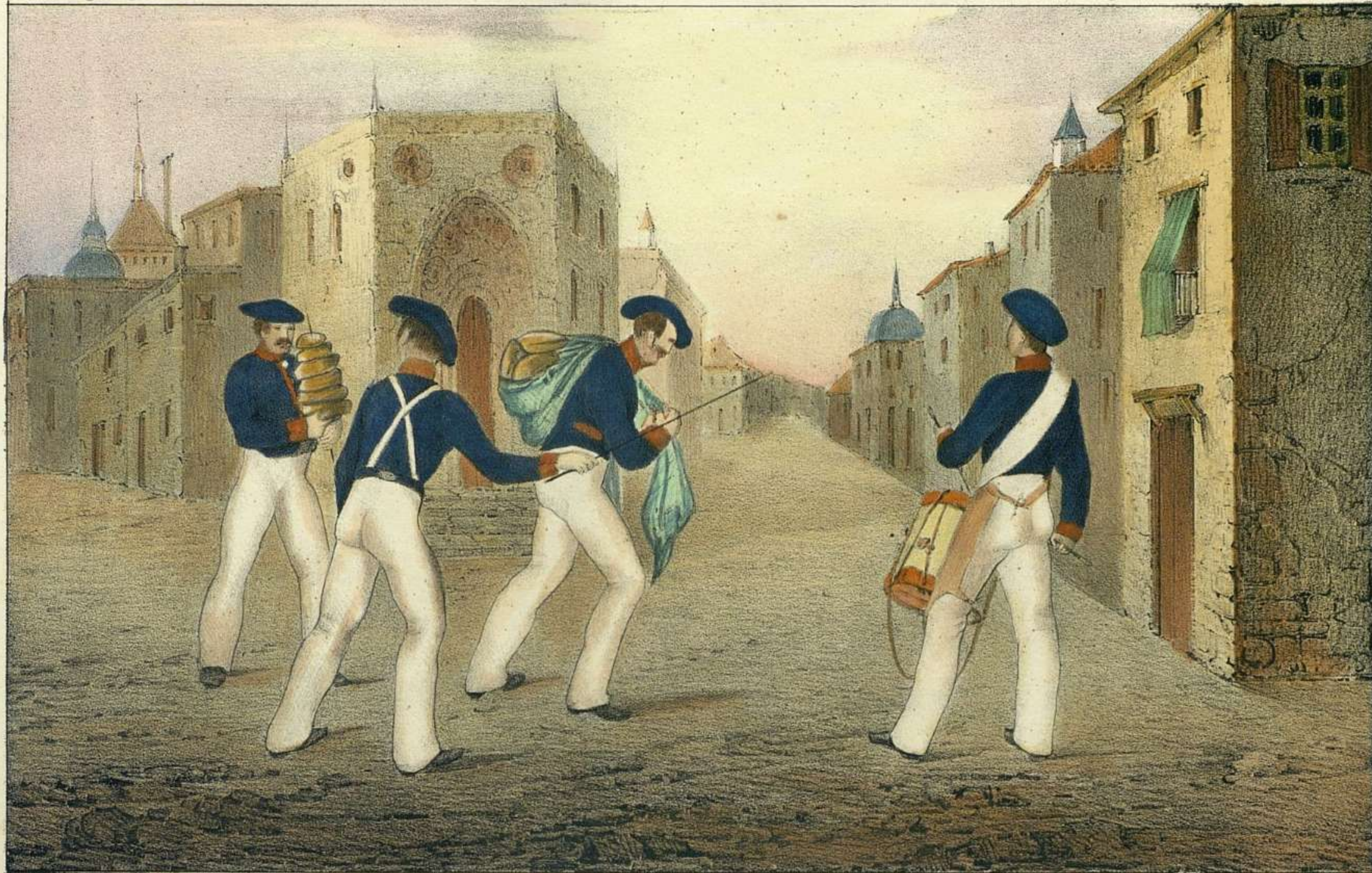
J. N. Lopez las fig. No el país.