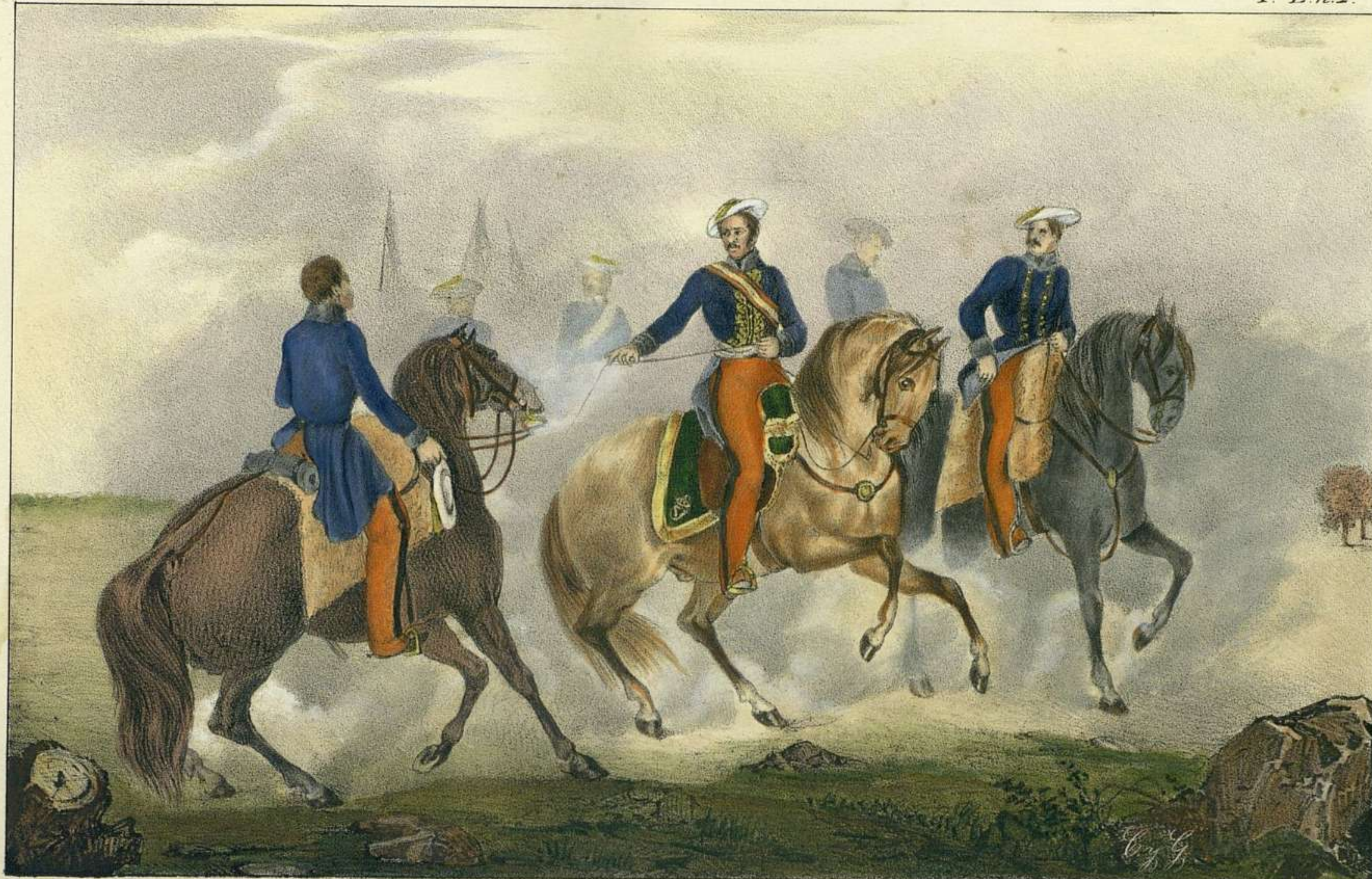
J.A. Lopez las Fig. Pto el país.