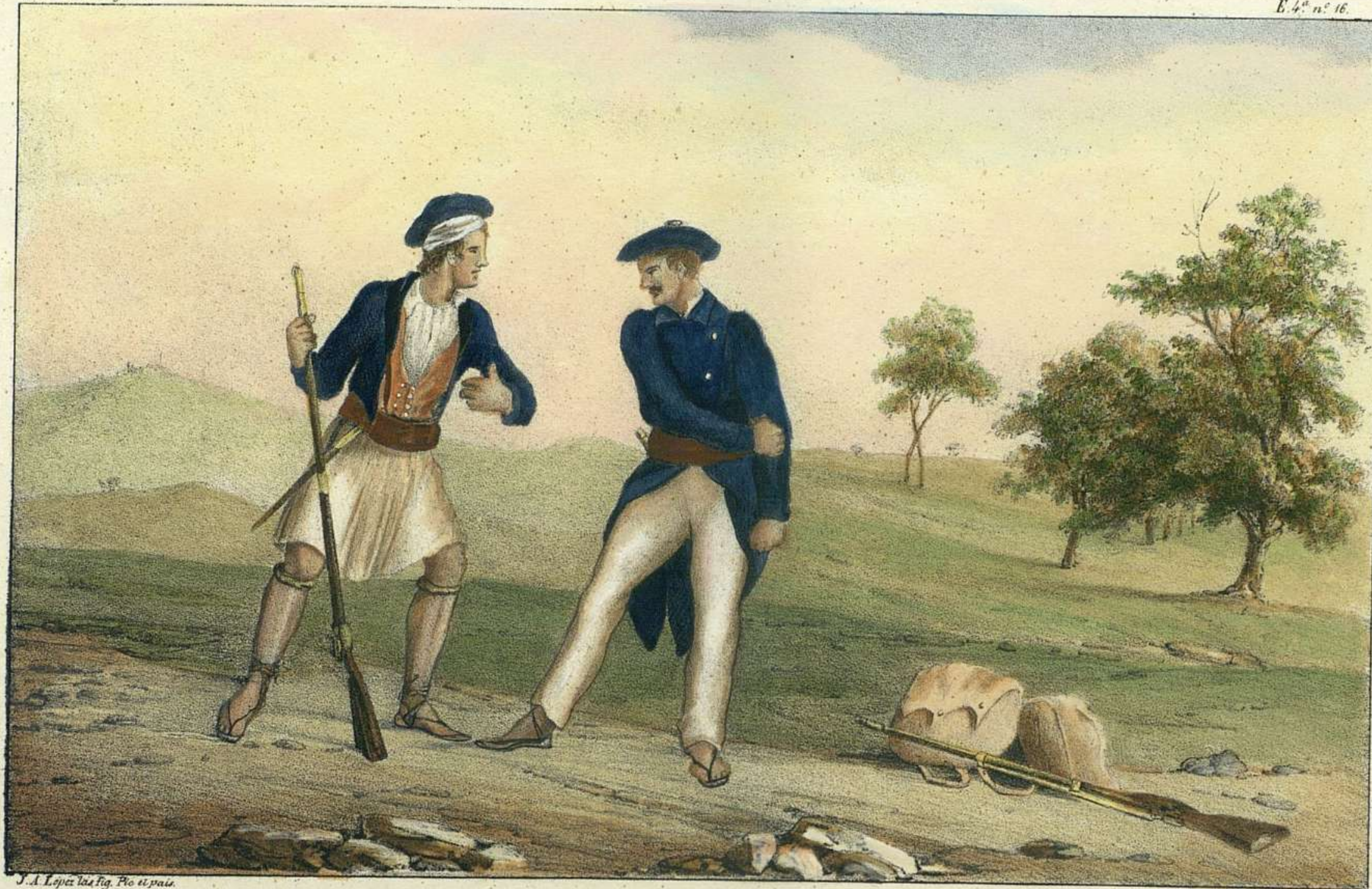
J. A. Lopez las Fig. Pro el pais.