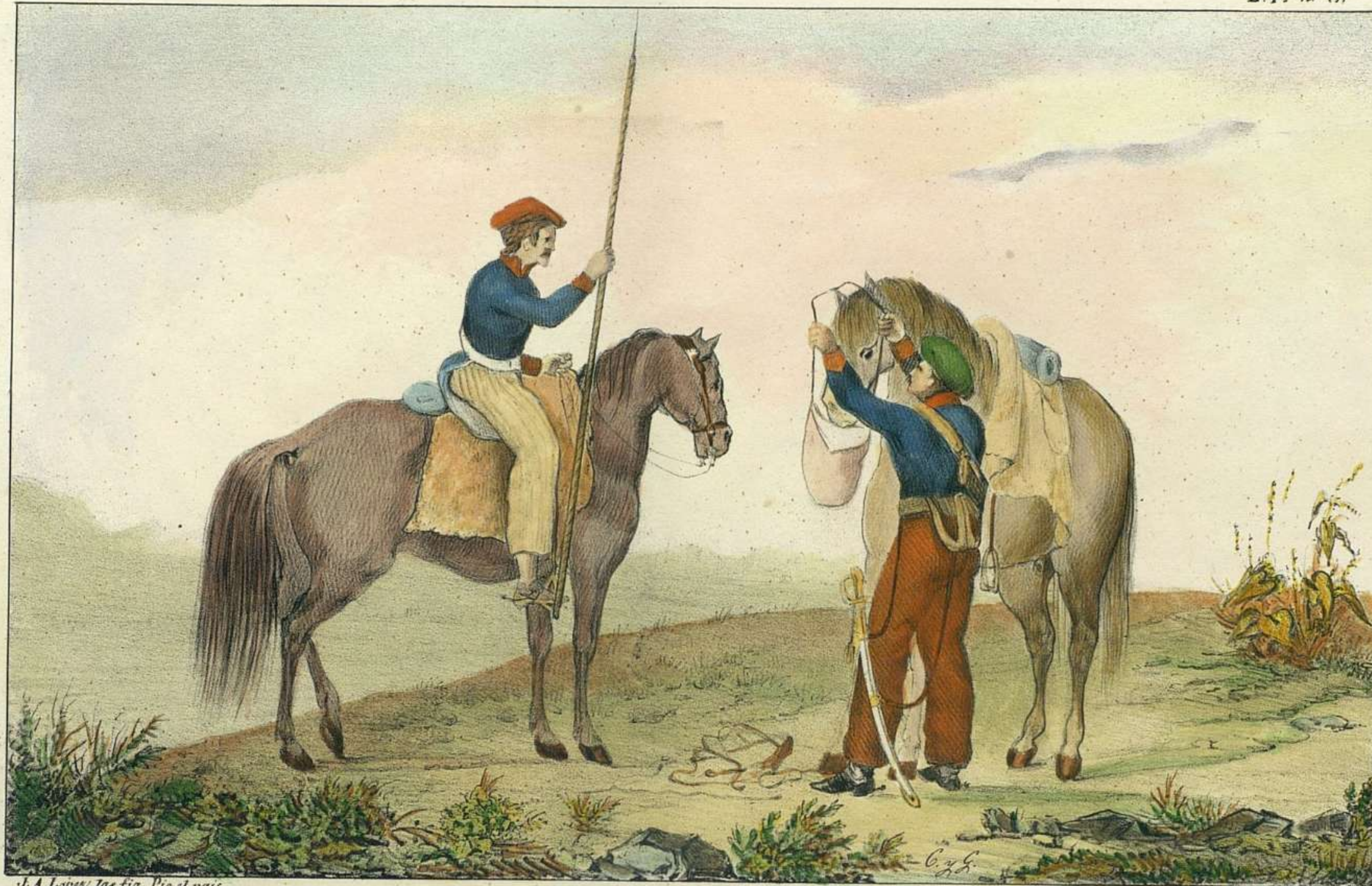
J. A. Lopez las fig. Pío el país.