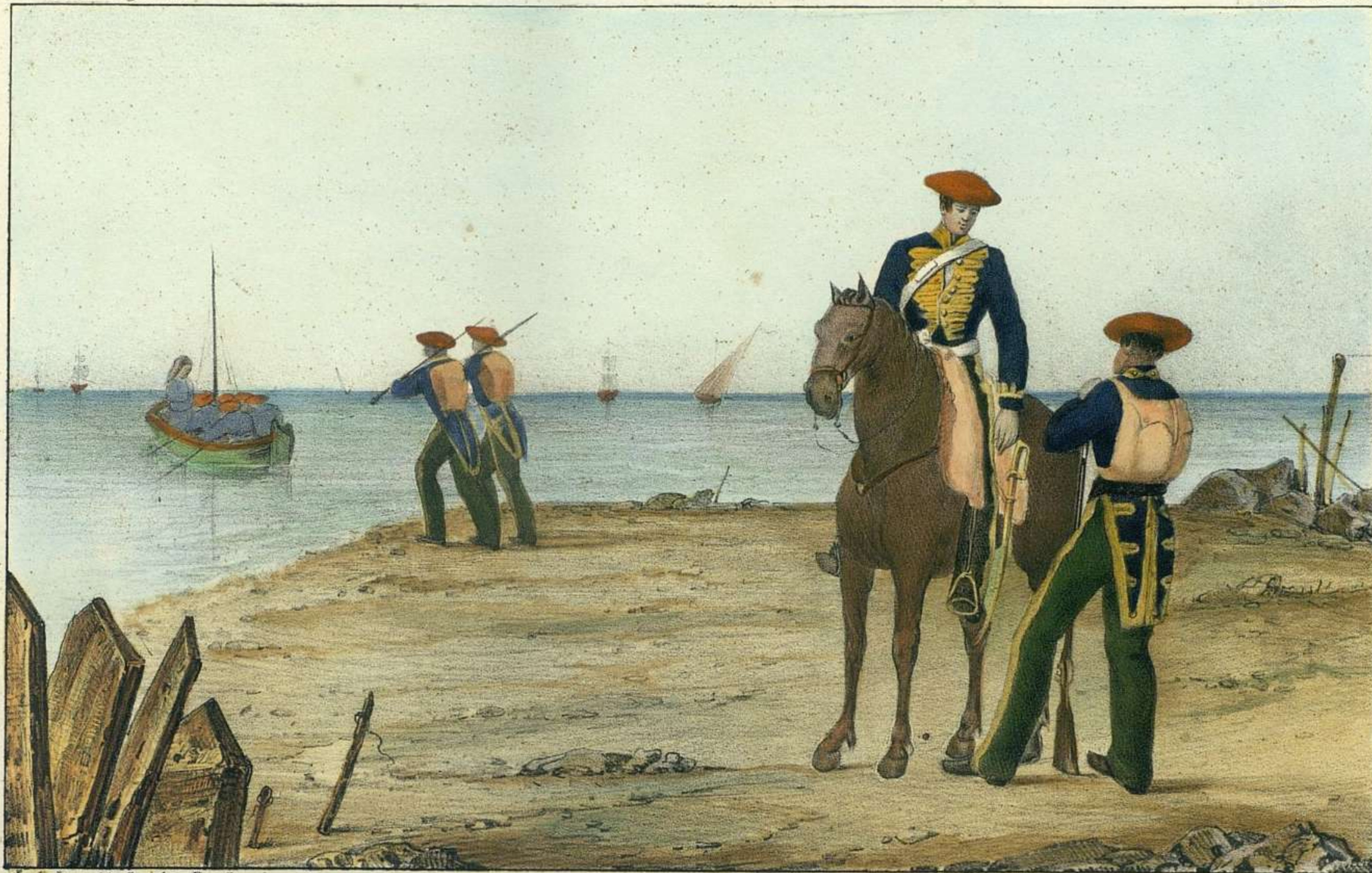
J. A. Lopez del las fig. Pto el país.