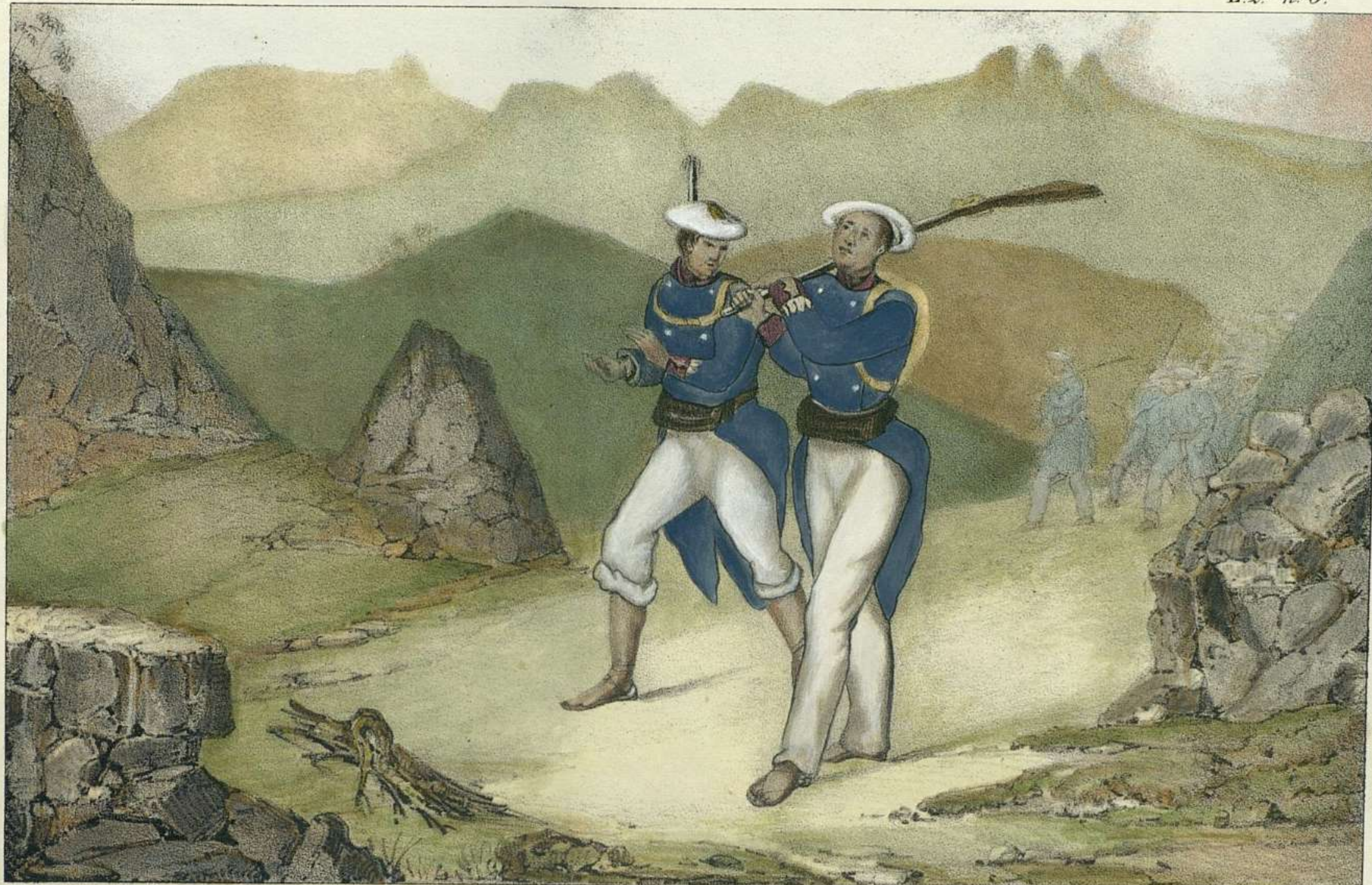
J. A. Lopez las fig. Pic el pais.