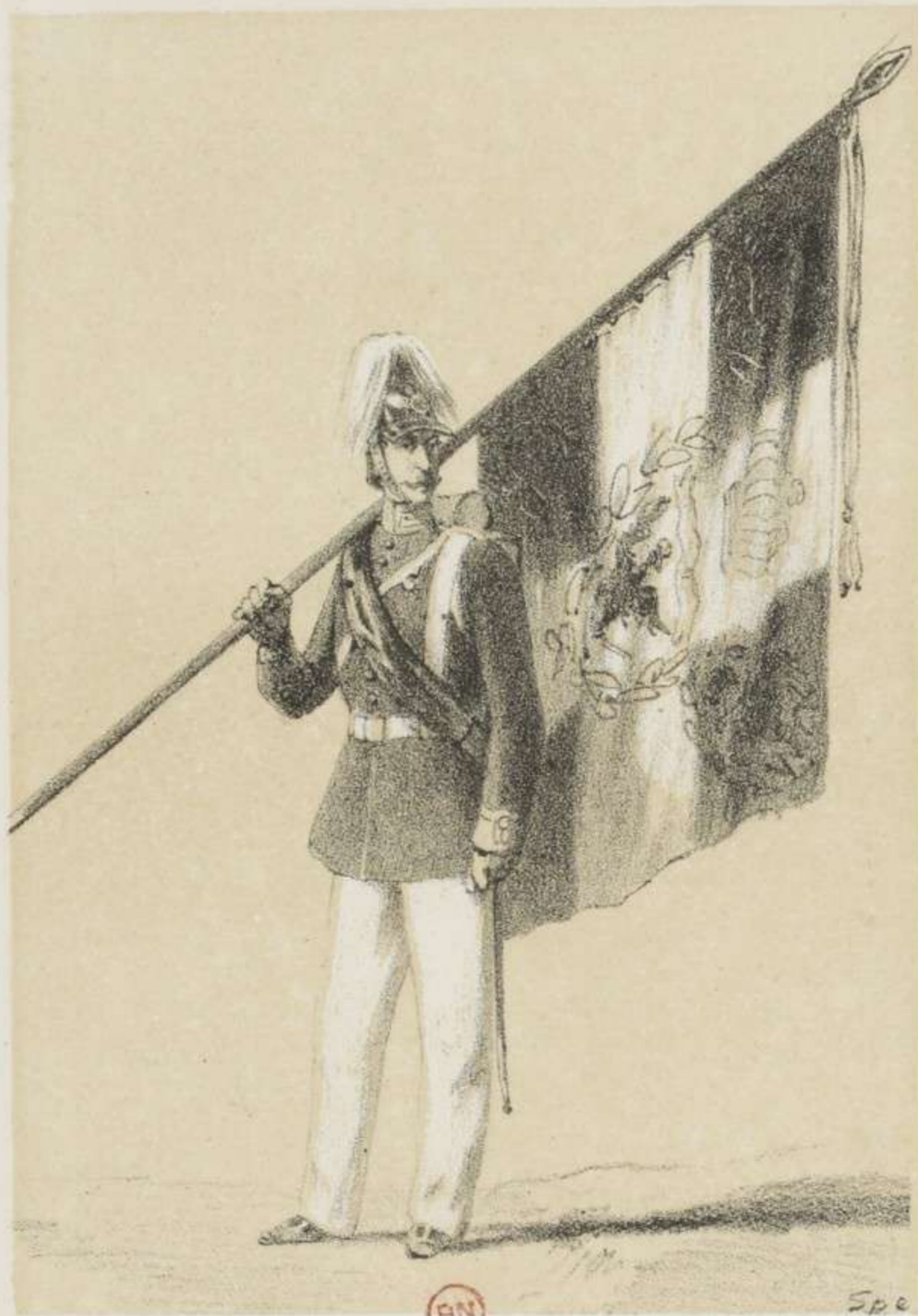
GARDE-LANDWEHR - INFANTERIE.