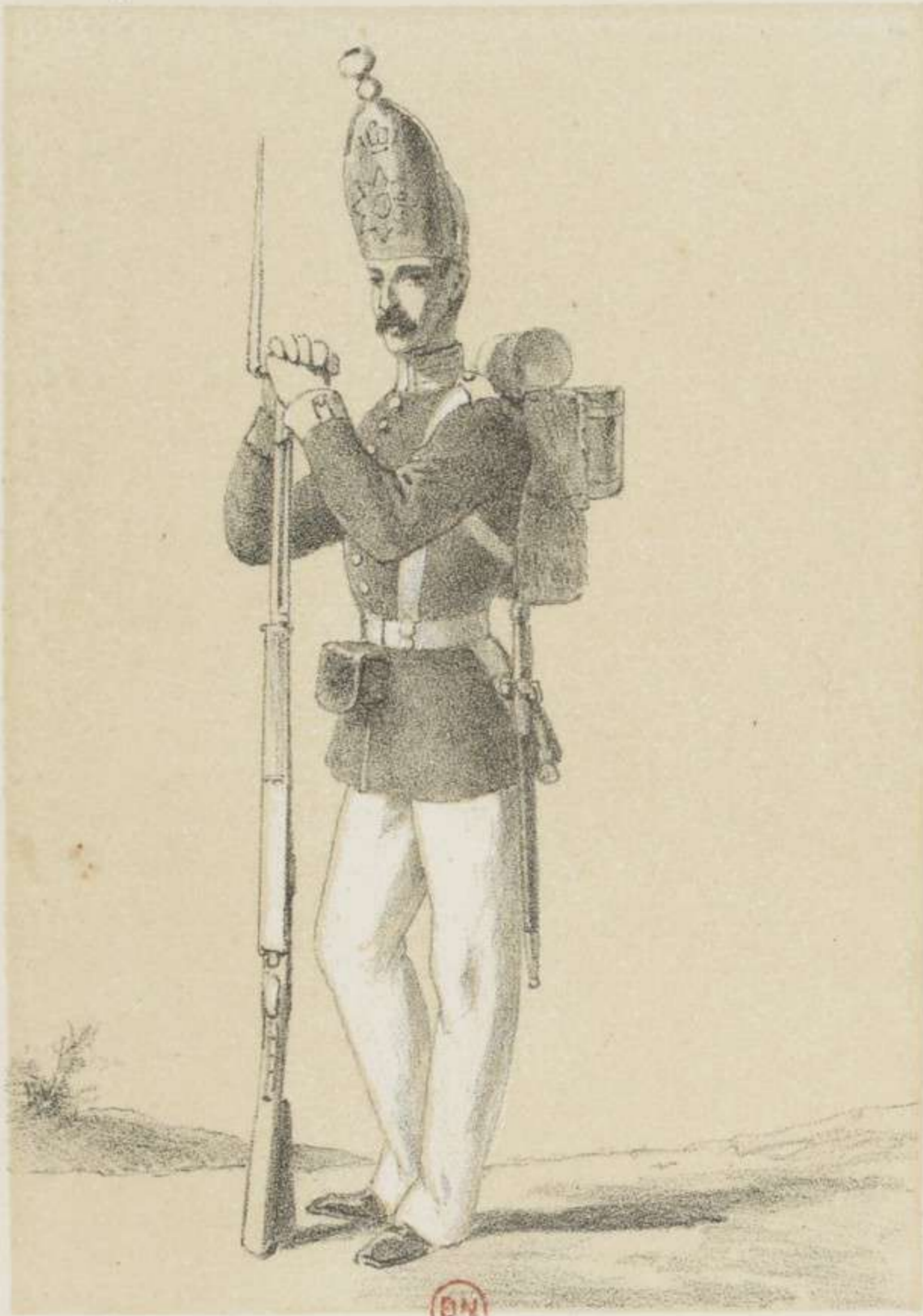
INFANTERIE DE LA GARDE.