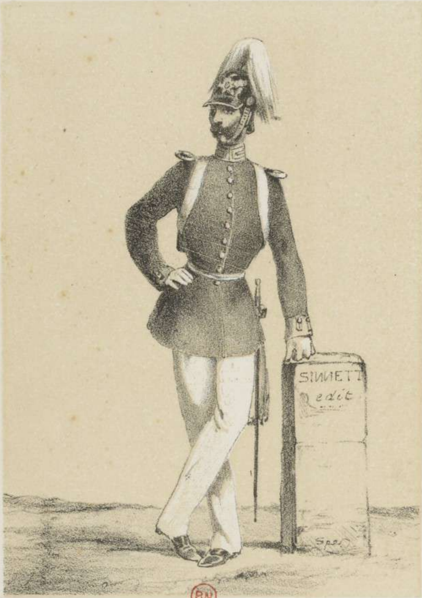
OFFICIER. INFANTERIE DE LA GARDE.