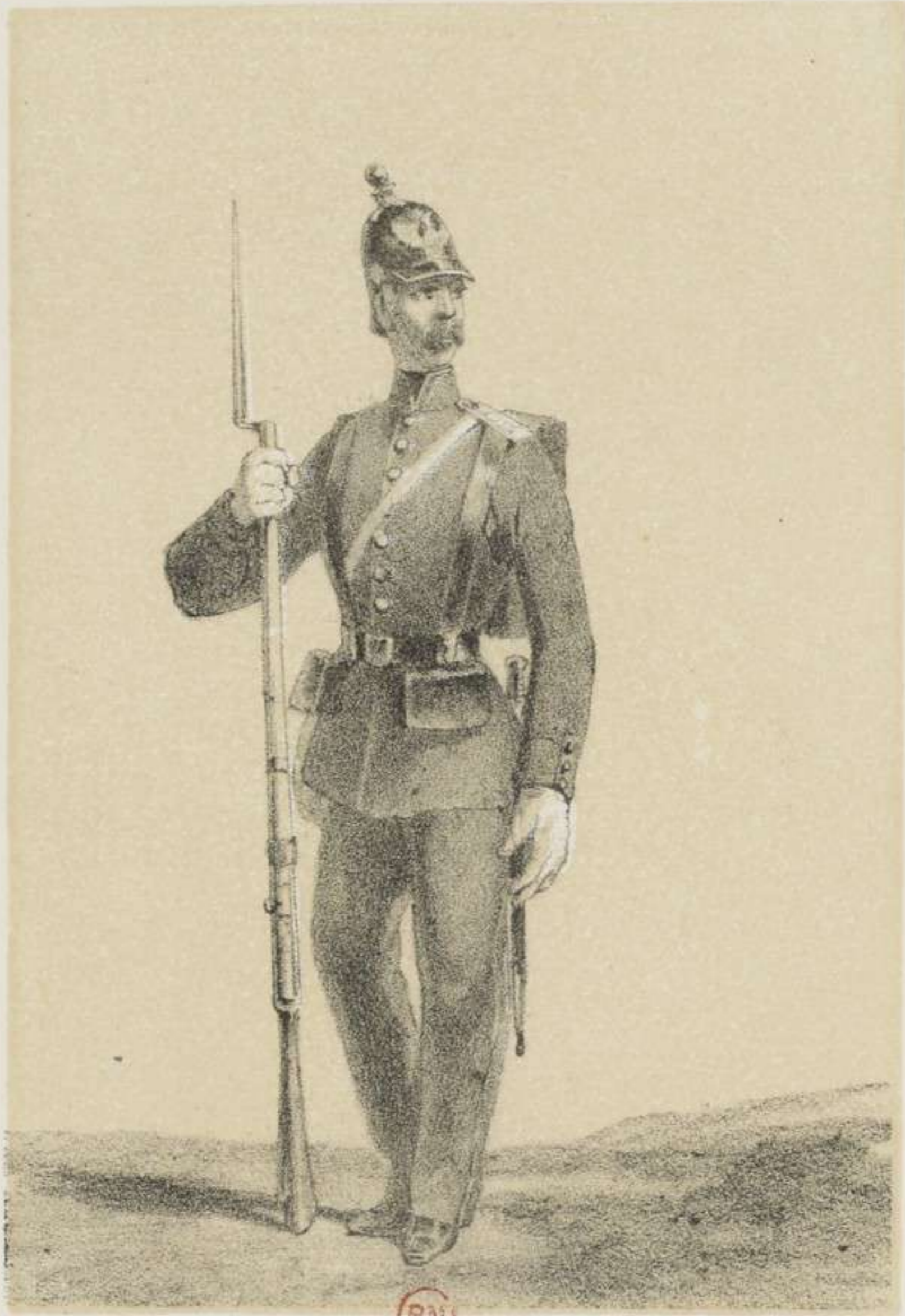
SOLDAT DE LA MARINE.