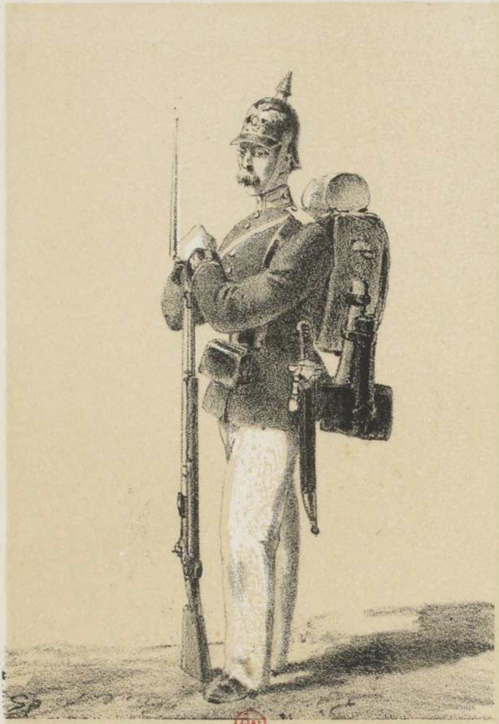
PIONIER DE LA GARDE.