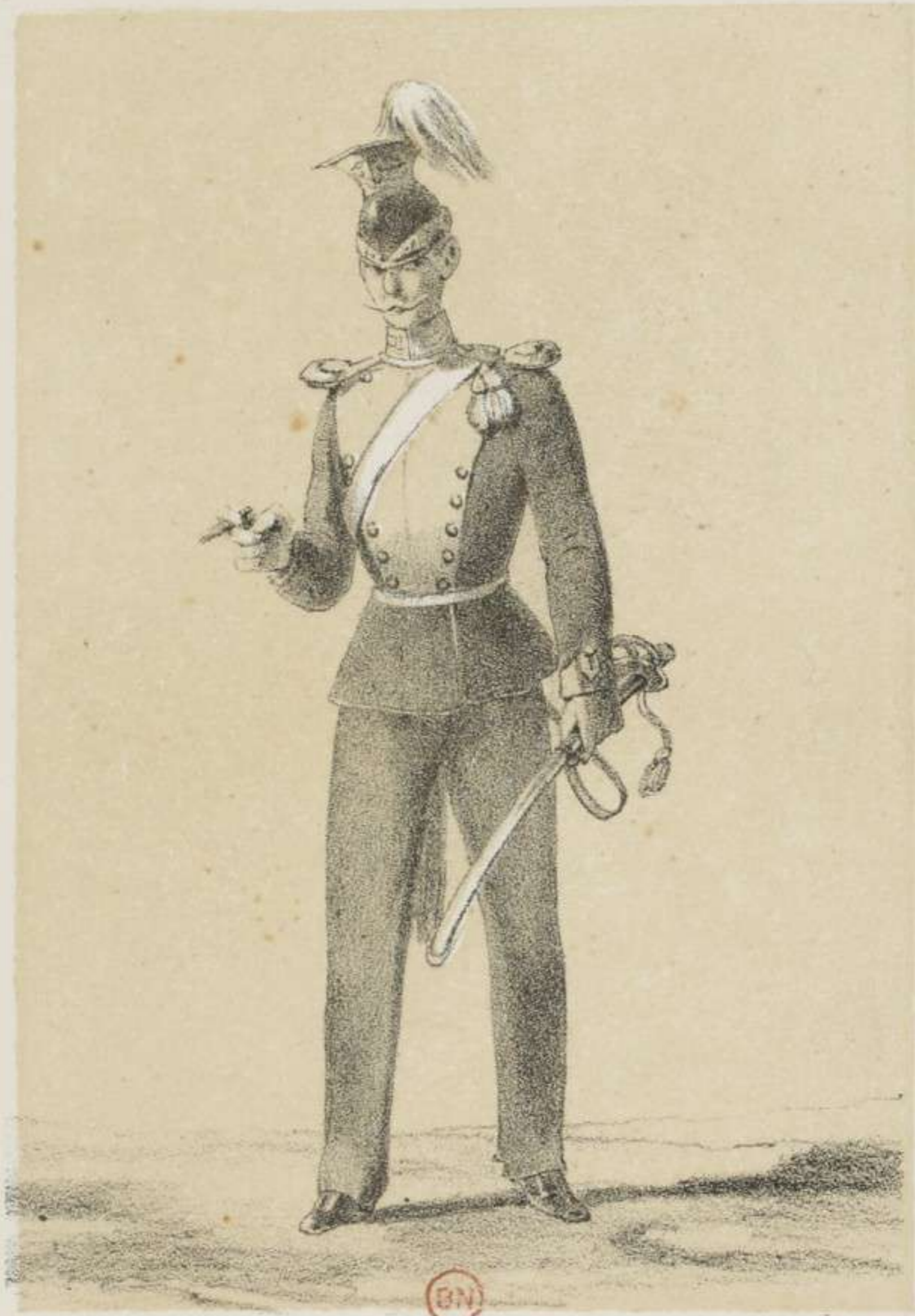
OFFICIER DES UHLANS.