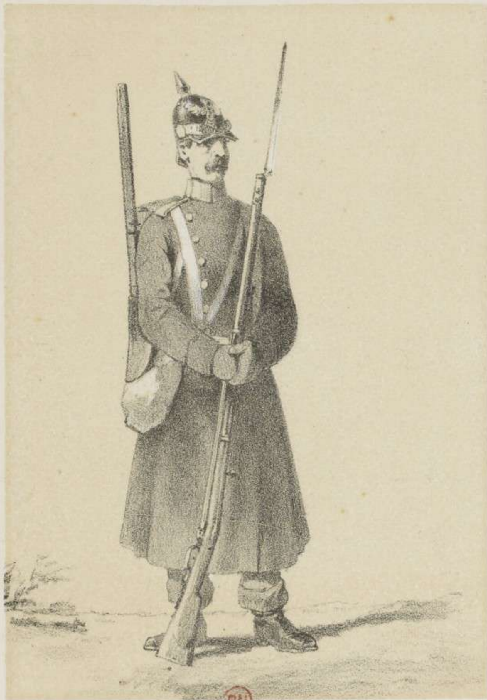
INFANTERIE - TENUE DE CAMPAGNE.