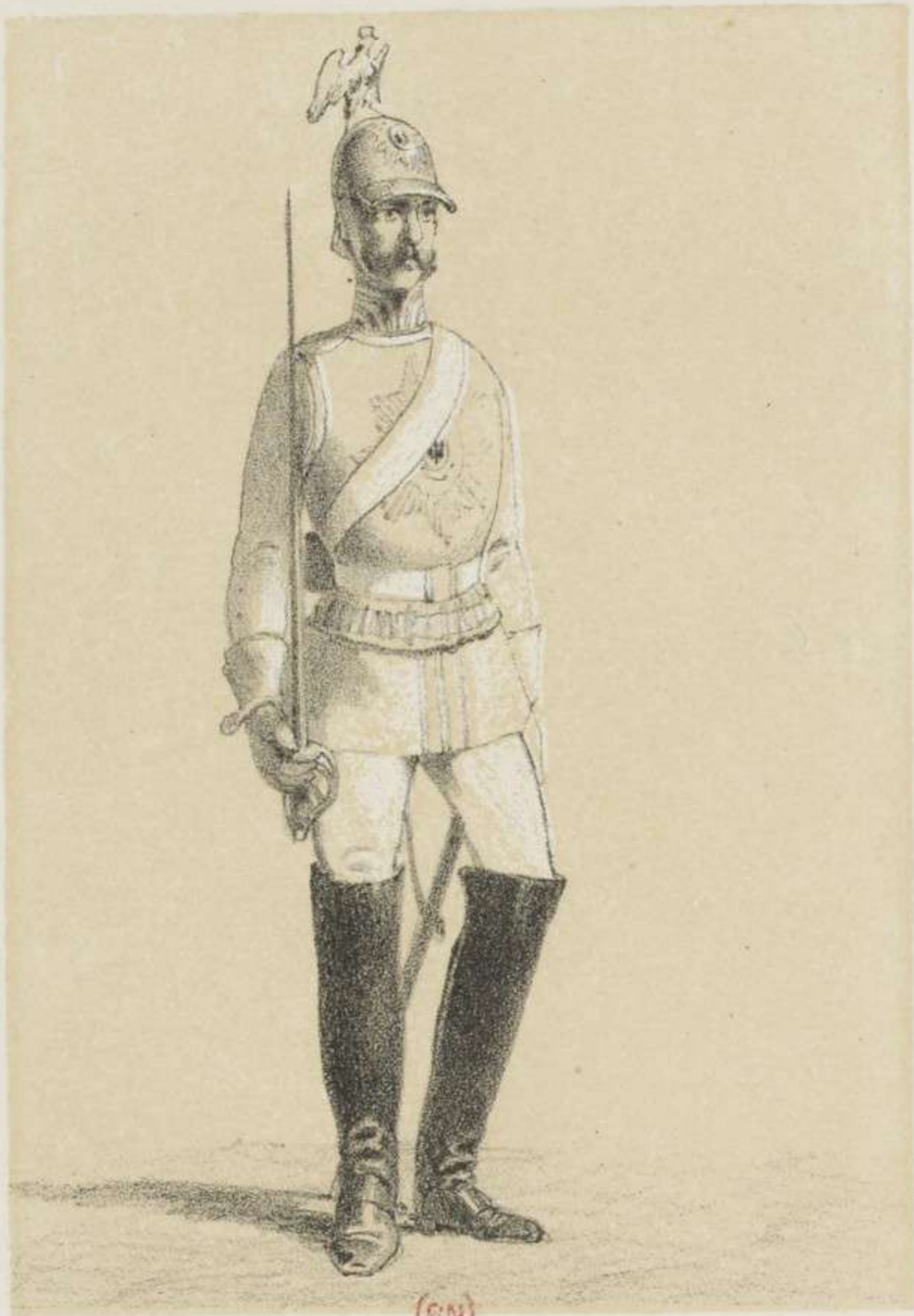
(BN) GARDE DU CORPS.