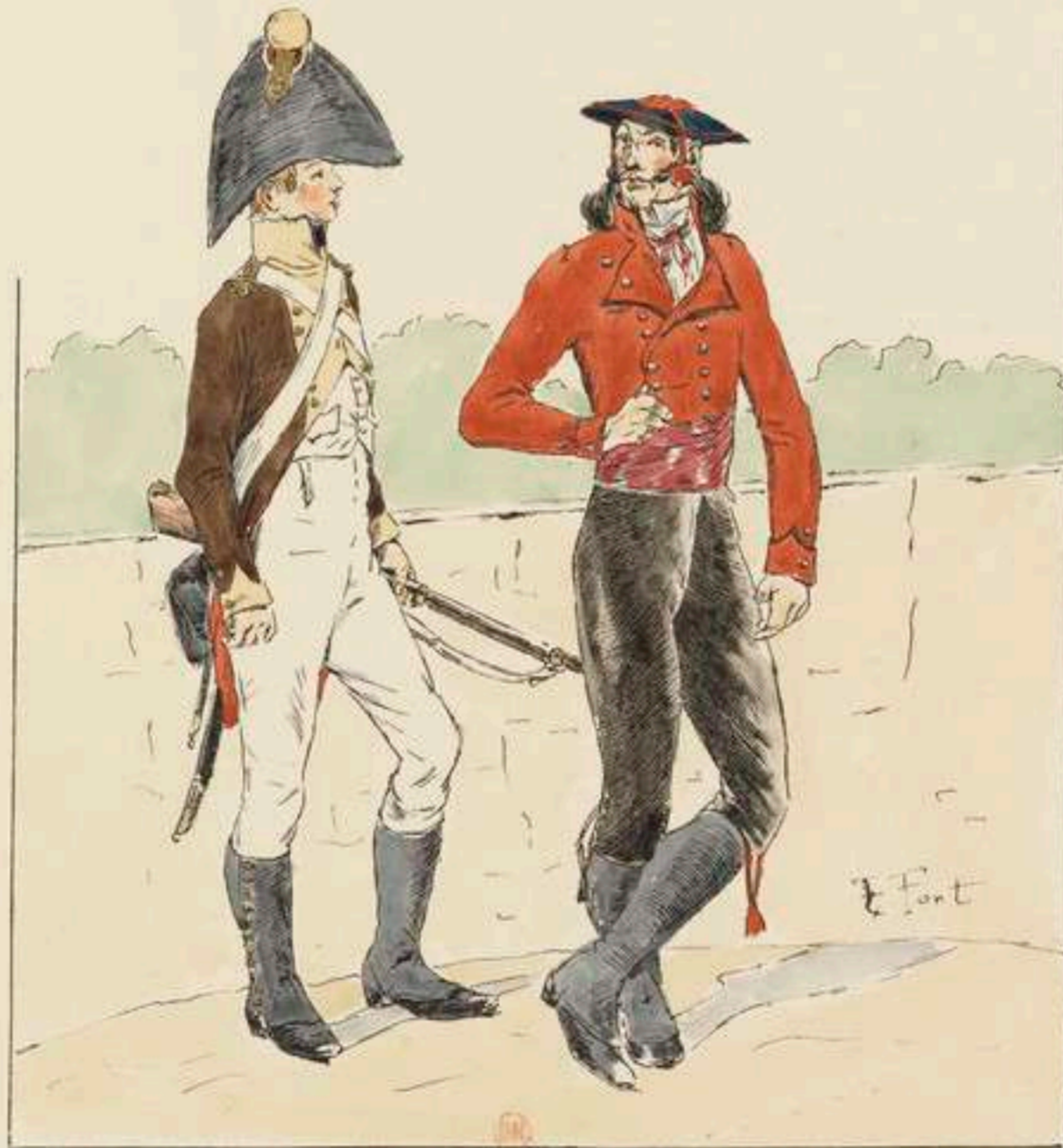
GARDE D'HONNEUR DE PAU GARDE D'HONNEUR BASQUE EN PETITE TENUE