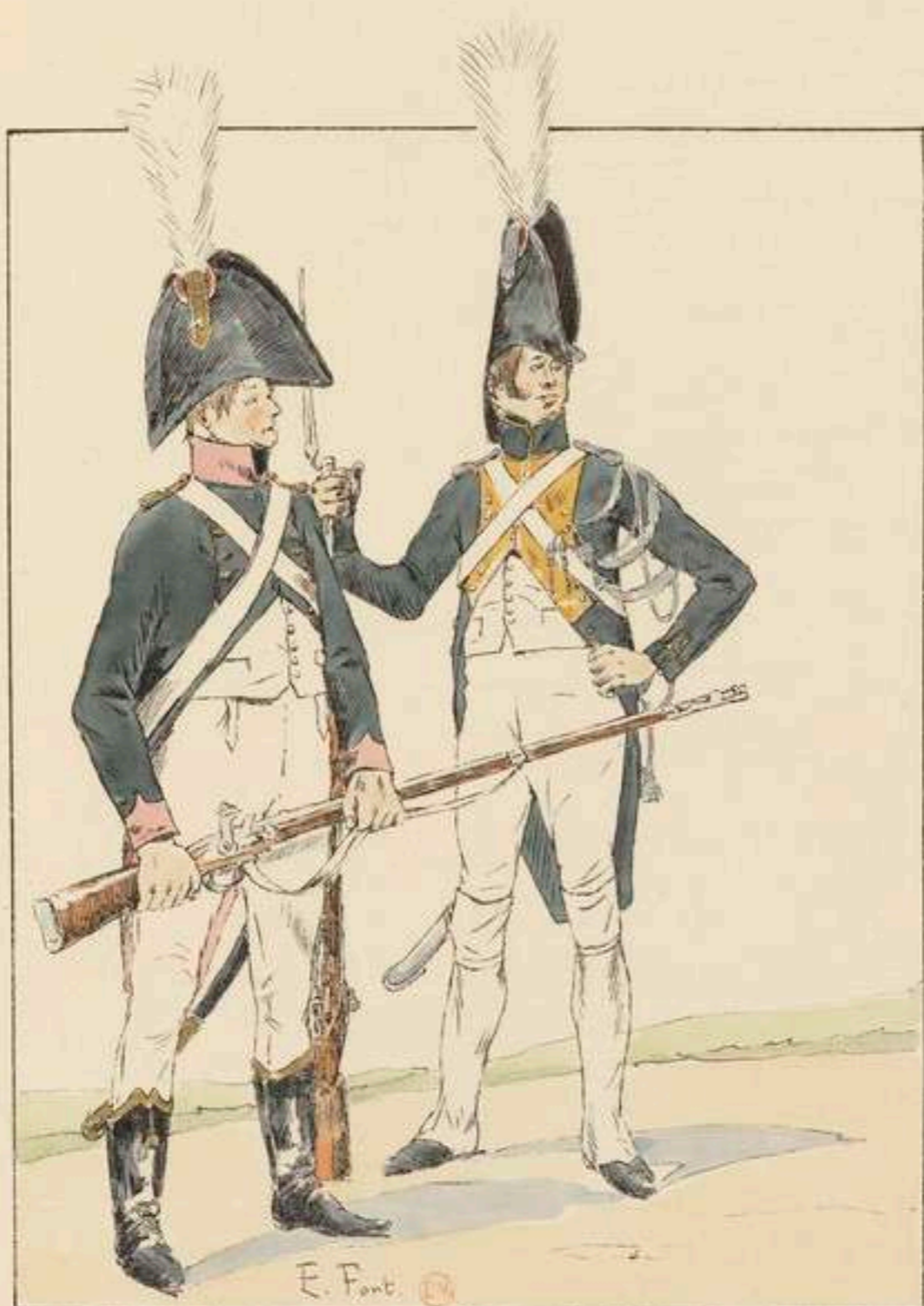
GARDE D'HONNEUR DE RENNES 1 re COMPAGNIE 2 me COMPAGNIE