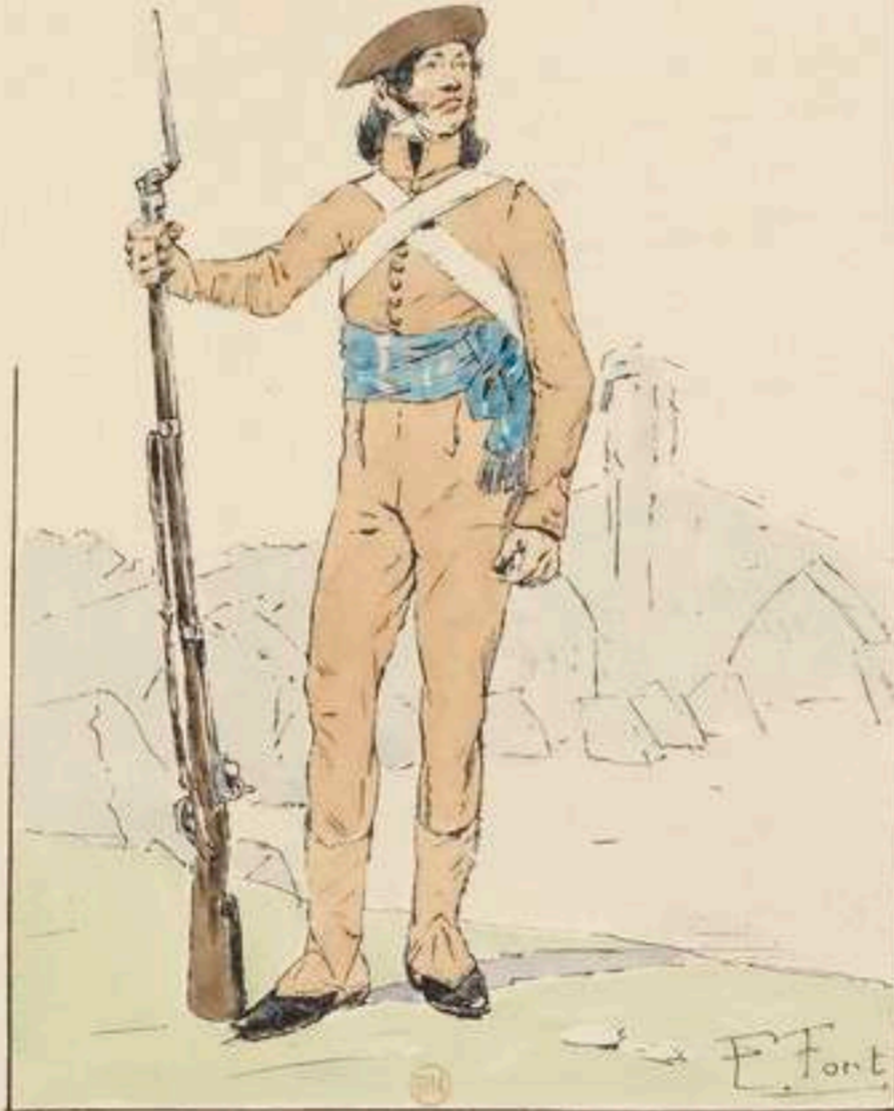
GARDE D'HONNEUR D'ORTHEZ