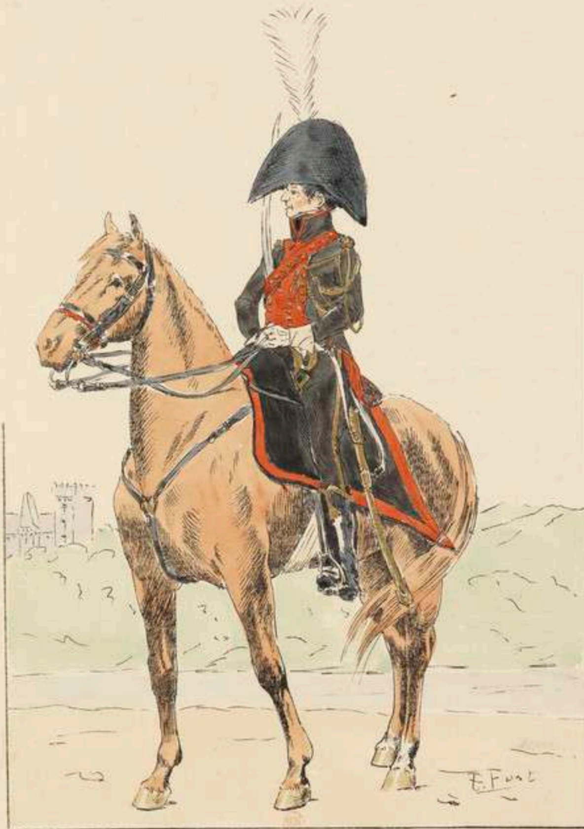
GARDE D'HONNEUR DE PAU