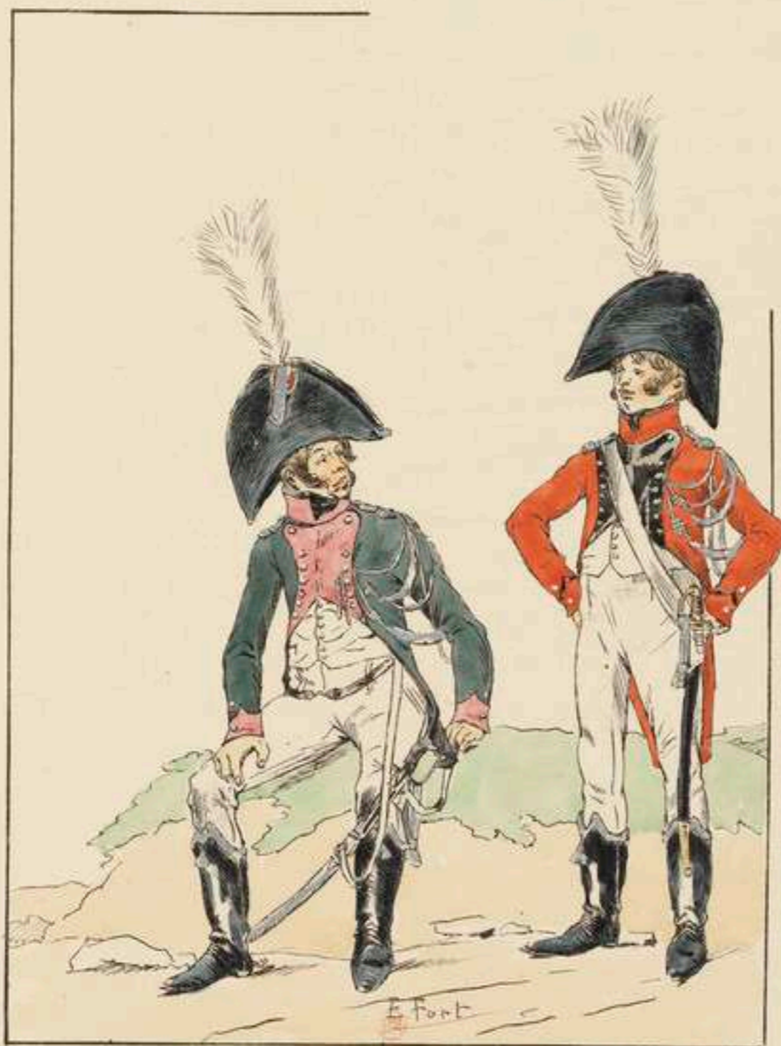
GARDE D'HONNEUR DE ST-MALO