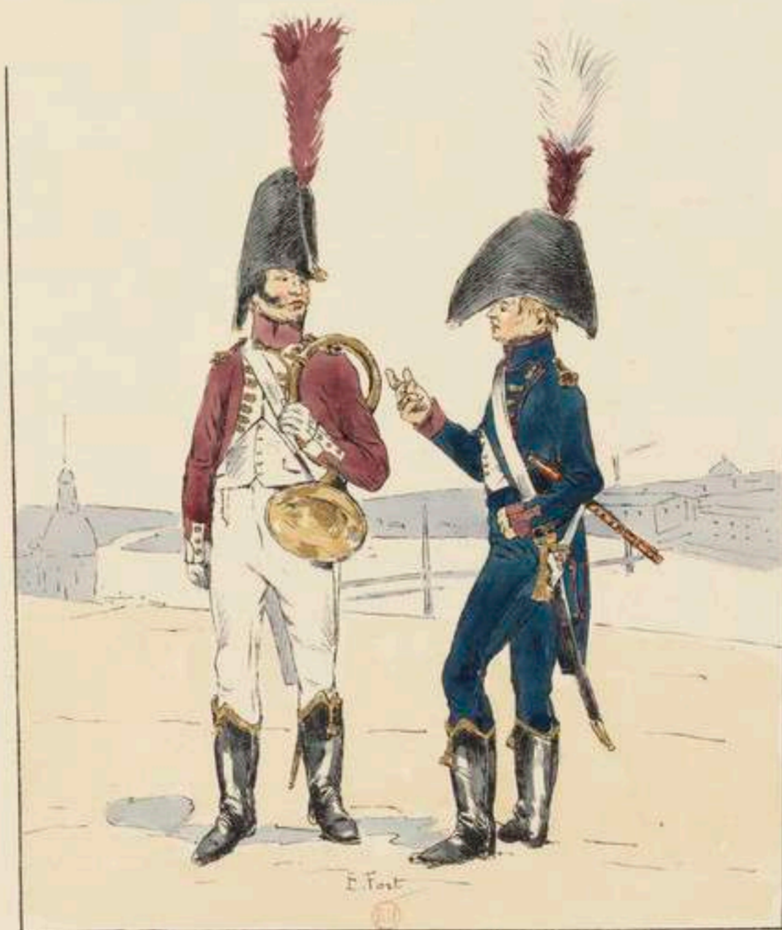
GARDE D'HONNEUR A PIED DE TOULOUSE MUSICIEN FIFRE