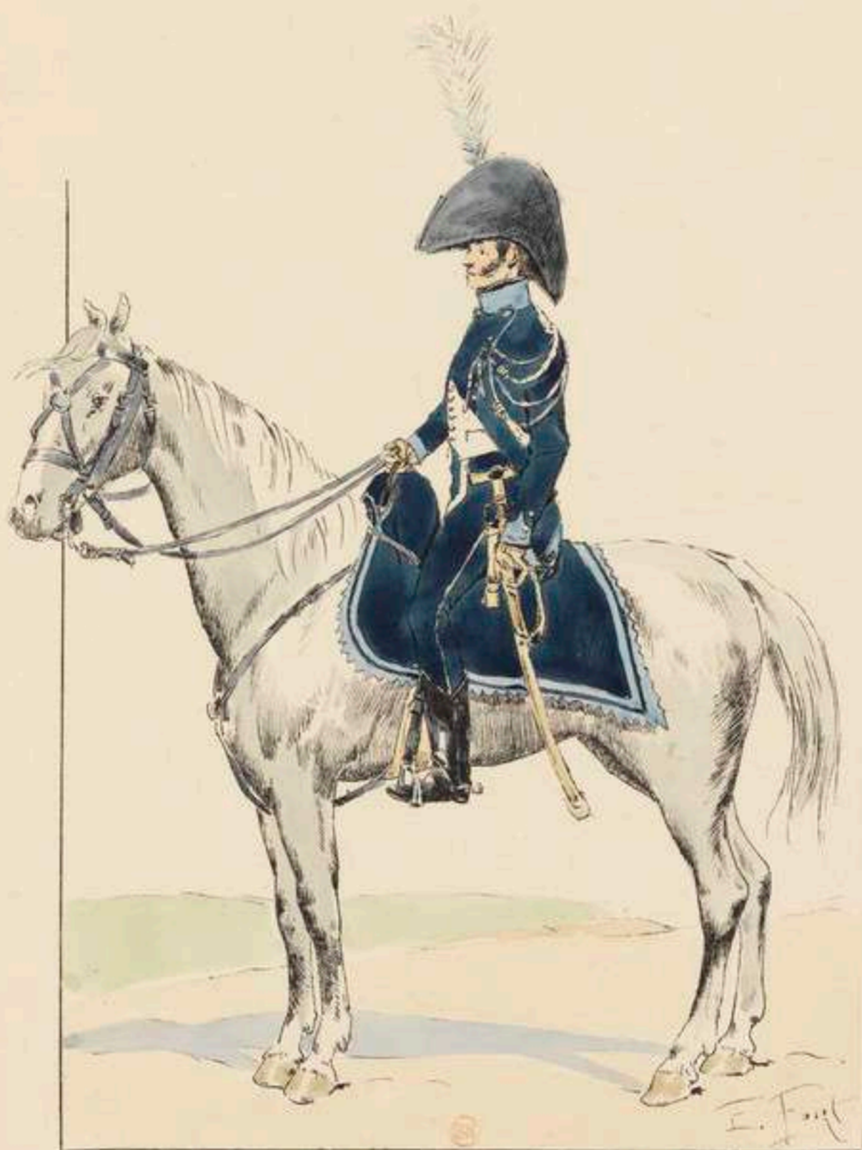
GARDE D'HONNEUR A CHEVAL D'AUCH