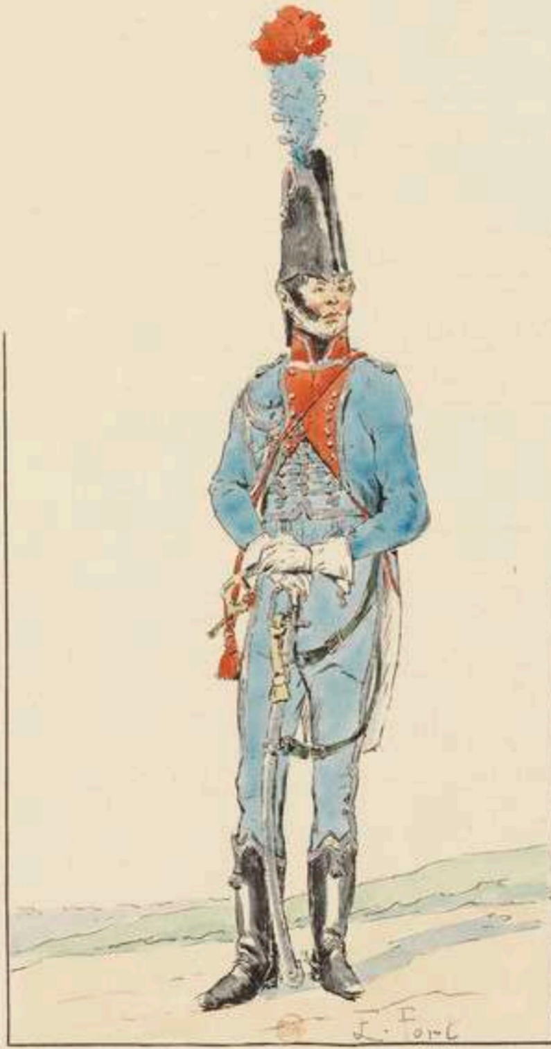
TROMPETTE DE LA GARDE D'HONNEUR DES LANDES