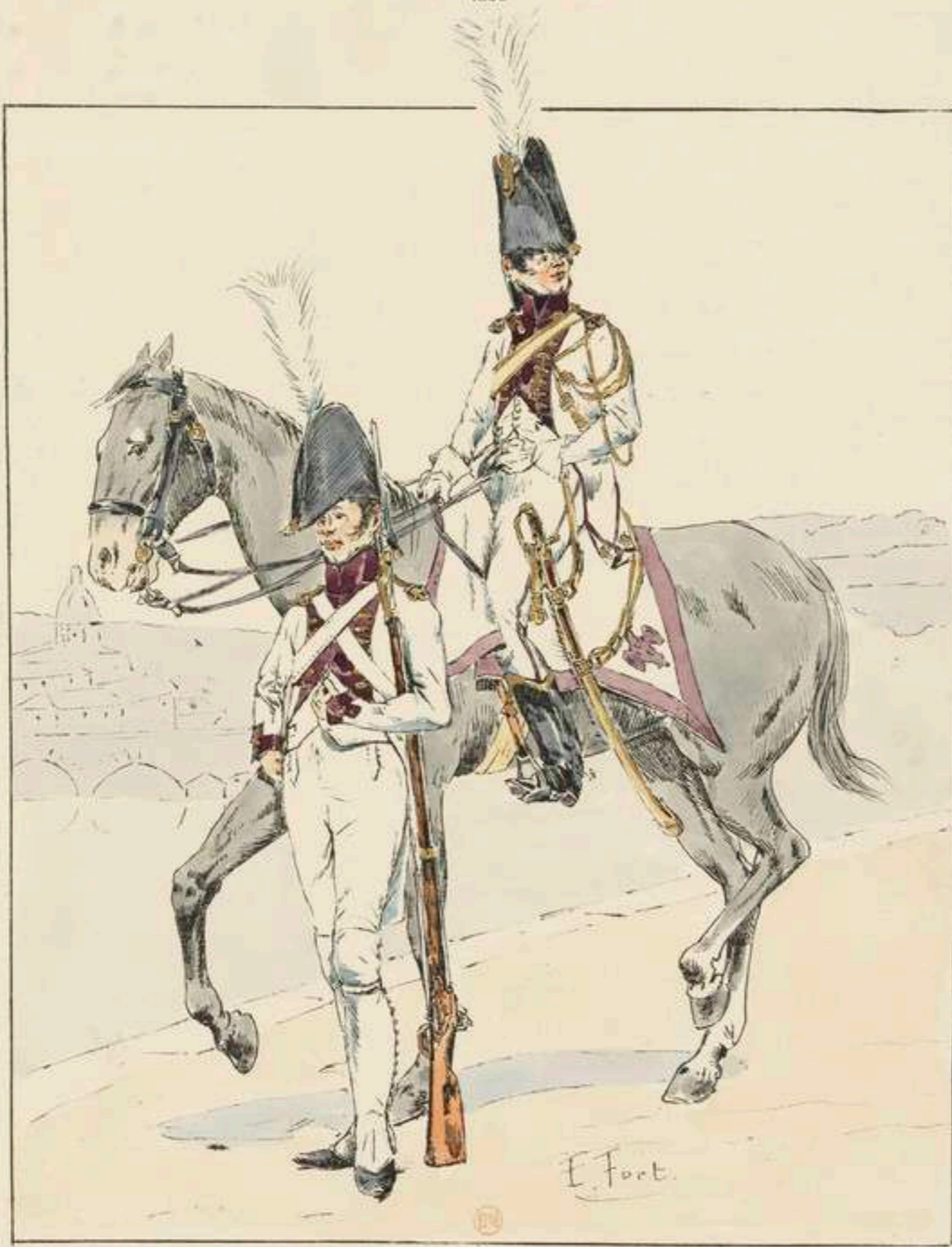
GARDE D'HONNEUR DE TOULOUSE.