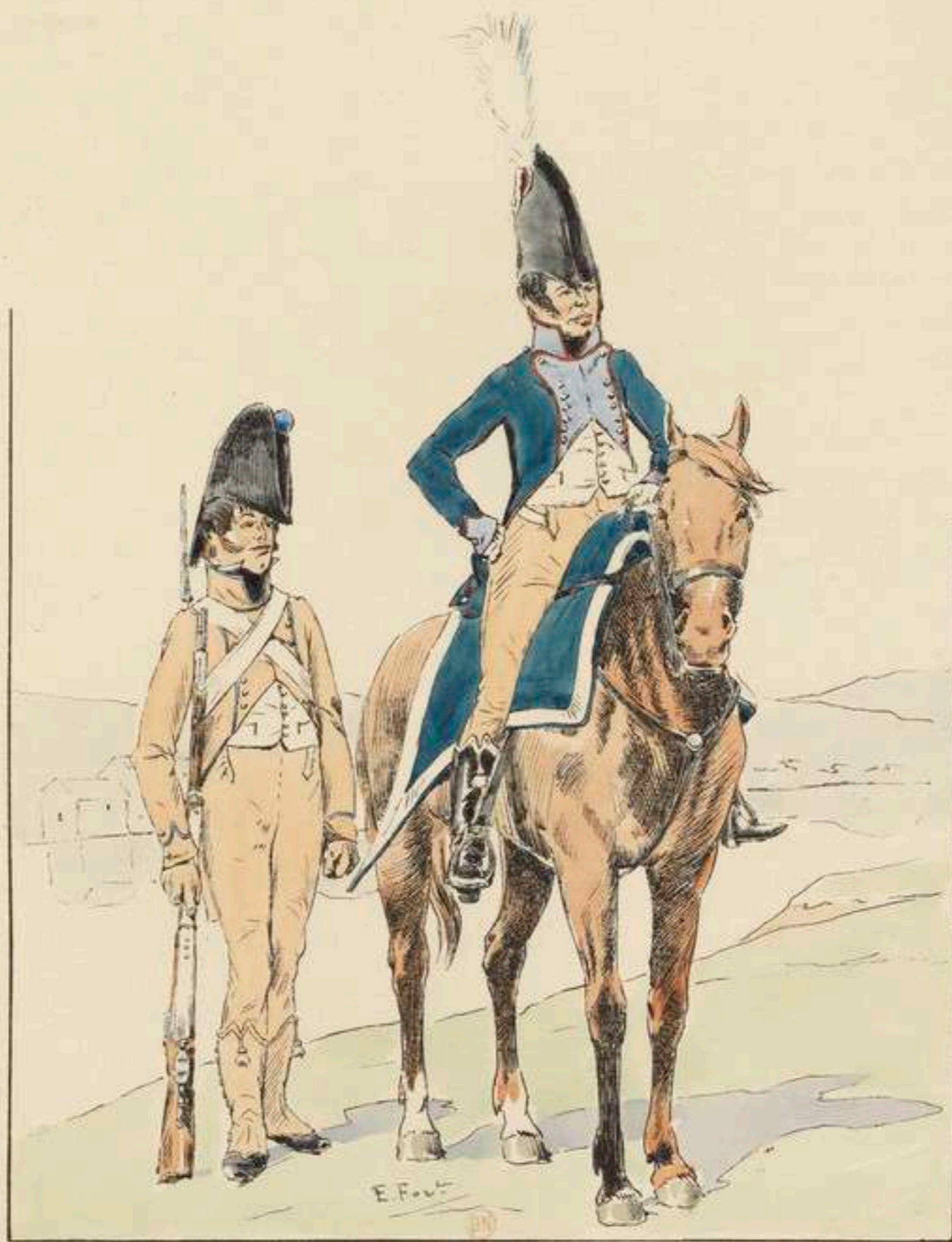
GARDE D'HONNEUR DE MOISSAC