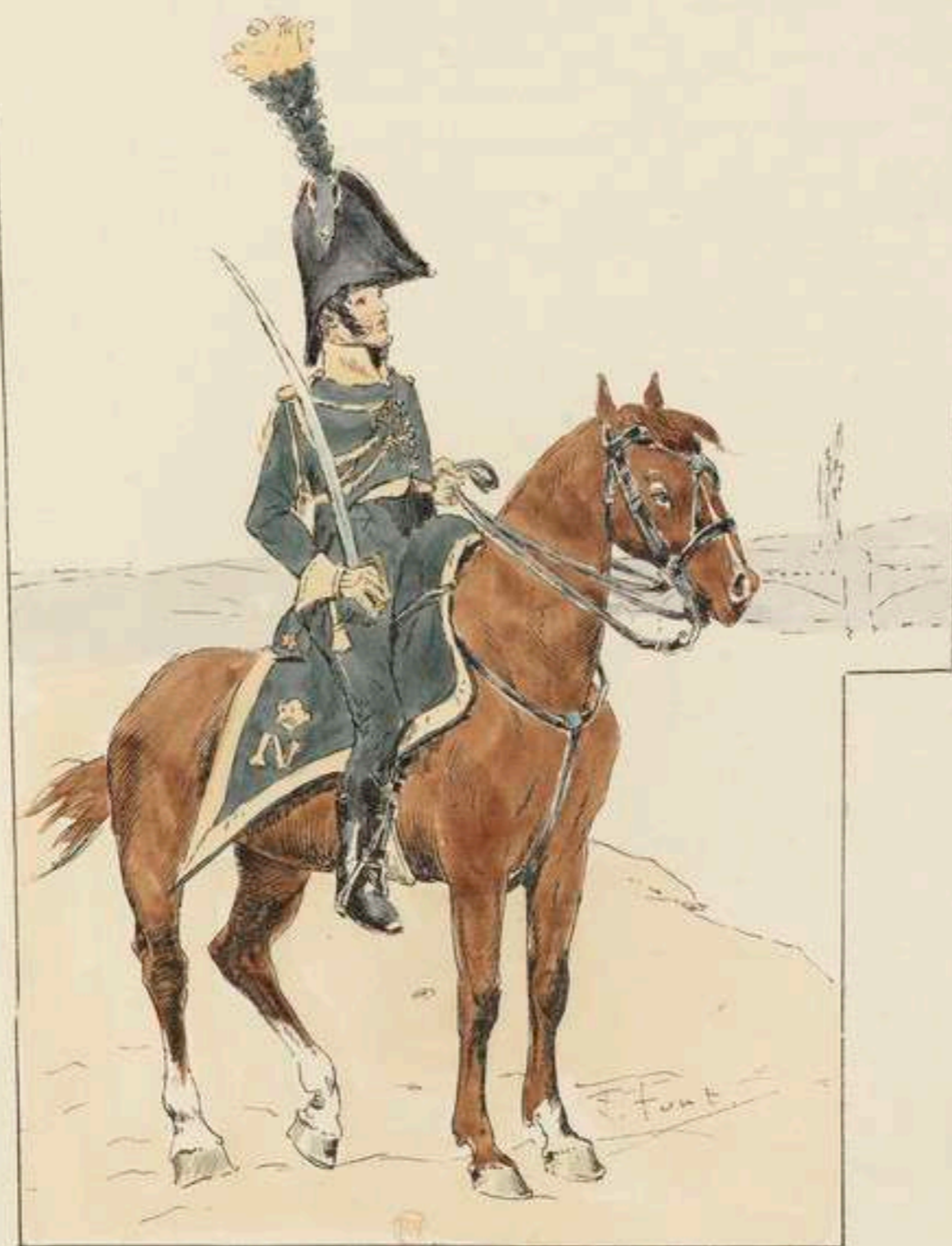
GARDE D'HONNEUR A CHEVAL DES LANDES.