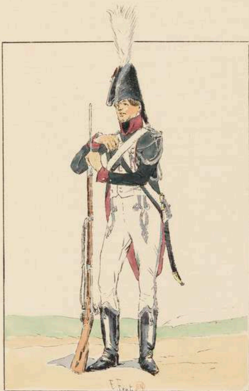
GARDE D'HONNEUR DE NIORT