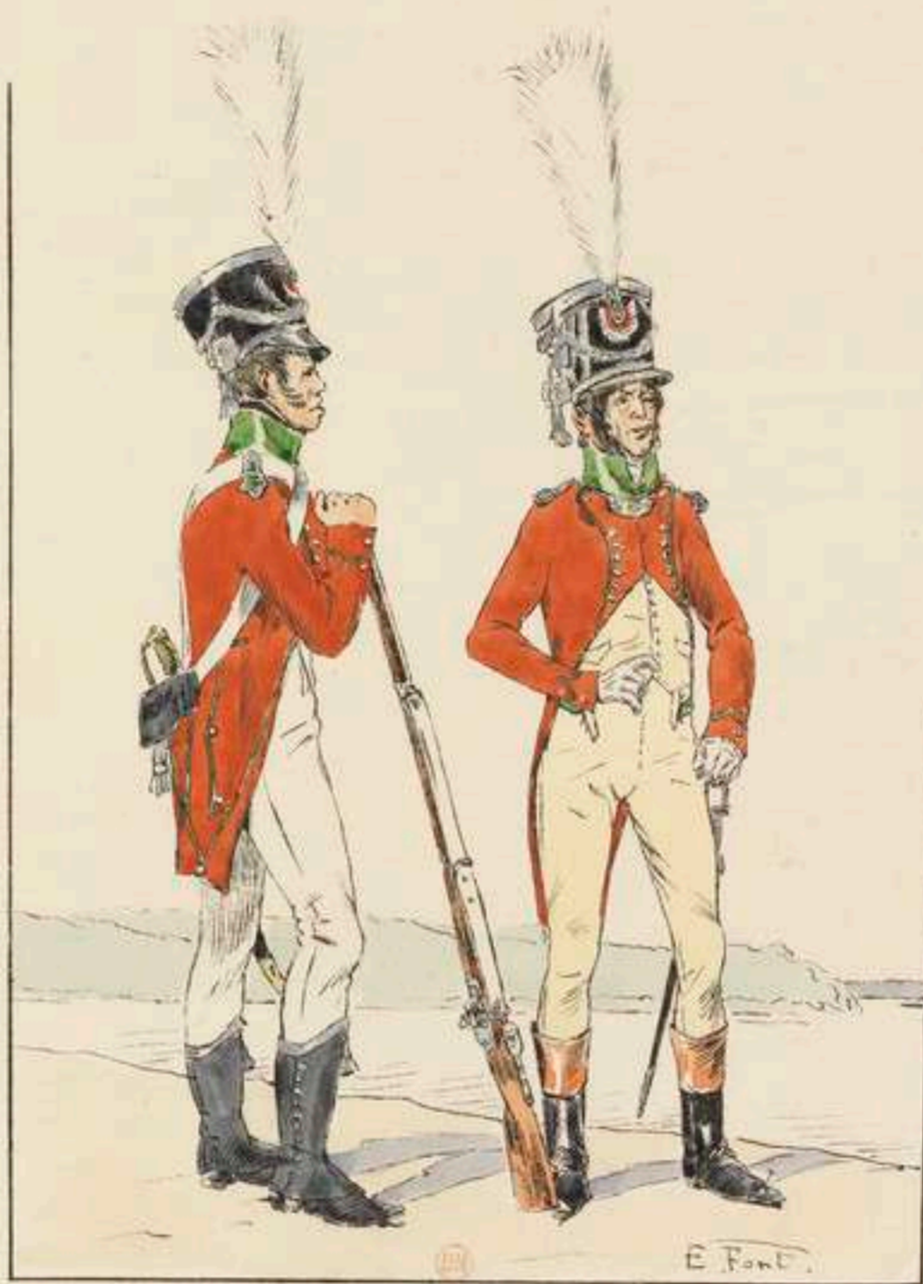
GARDE D'HONNEUR A PIED DE BAYONNE SOLDAT CAPITAINE-COMMANDANT