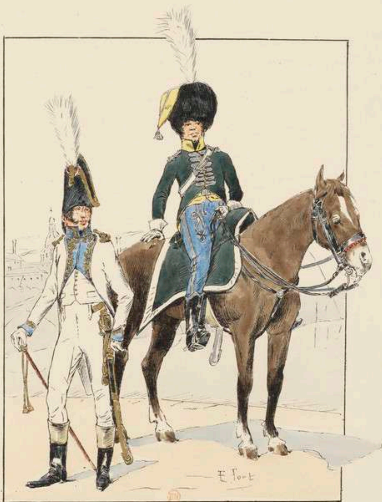
GARDE D'HONNEUR DE BORDEAUX OFFICIER DE LA GARDE A PIED GARDE A CHEVAL