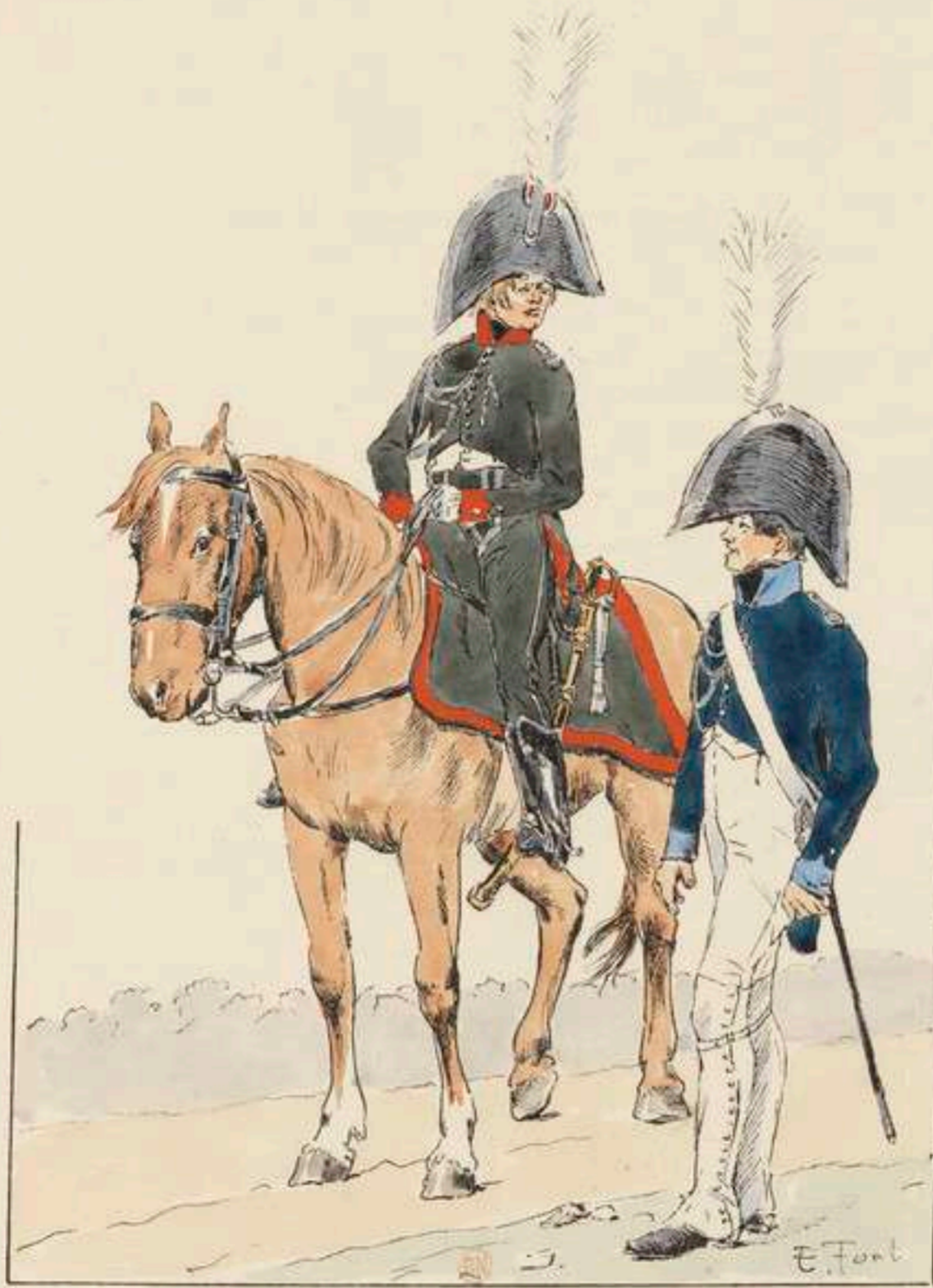
GARDE D'HONNEUR DE TARBES