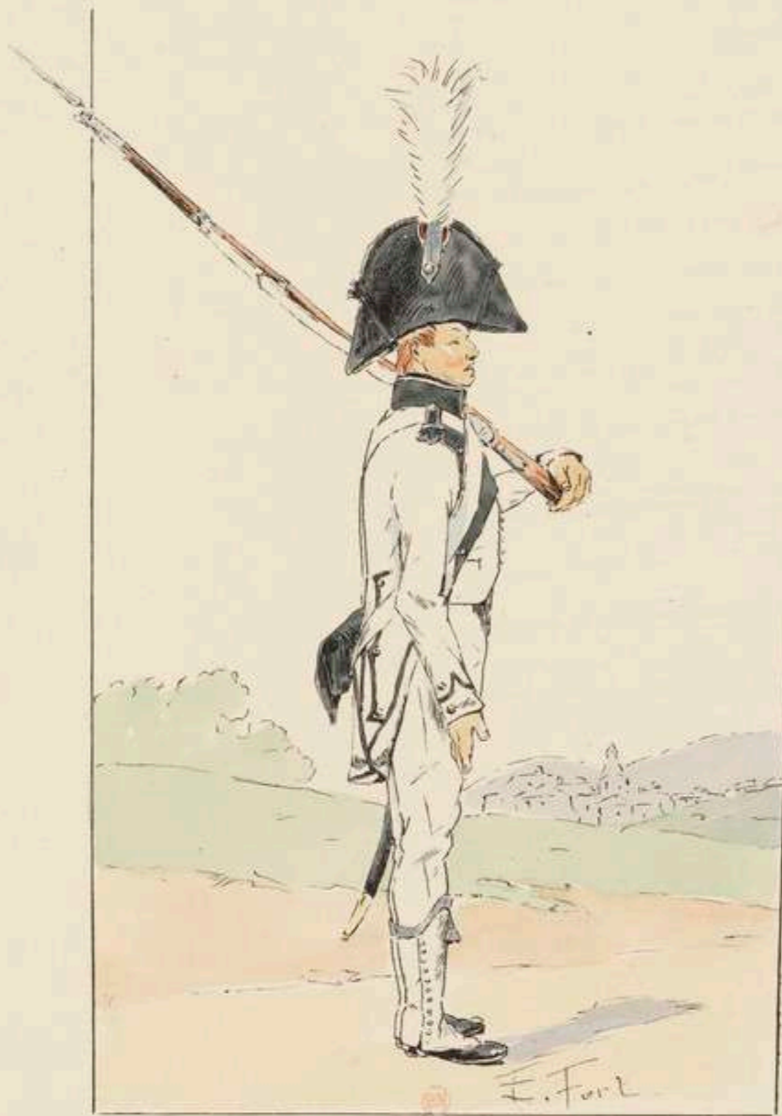
GARDE D'HONNEUR A PIED D'AGEN