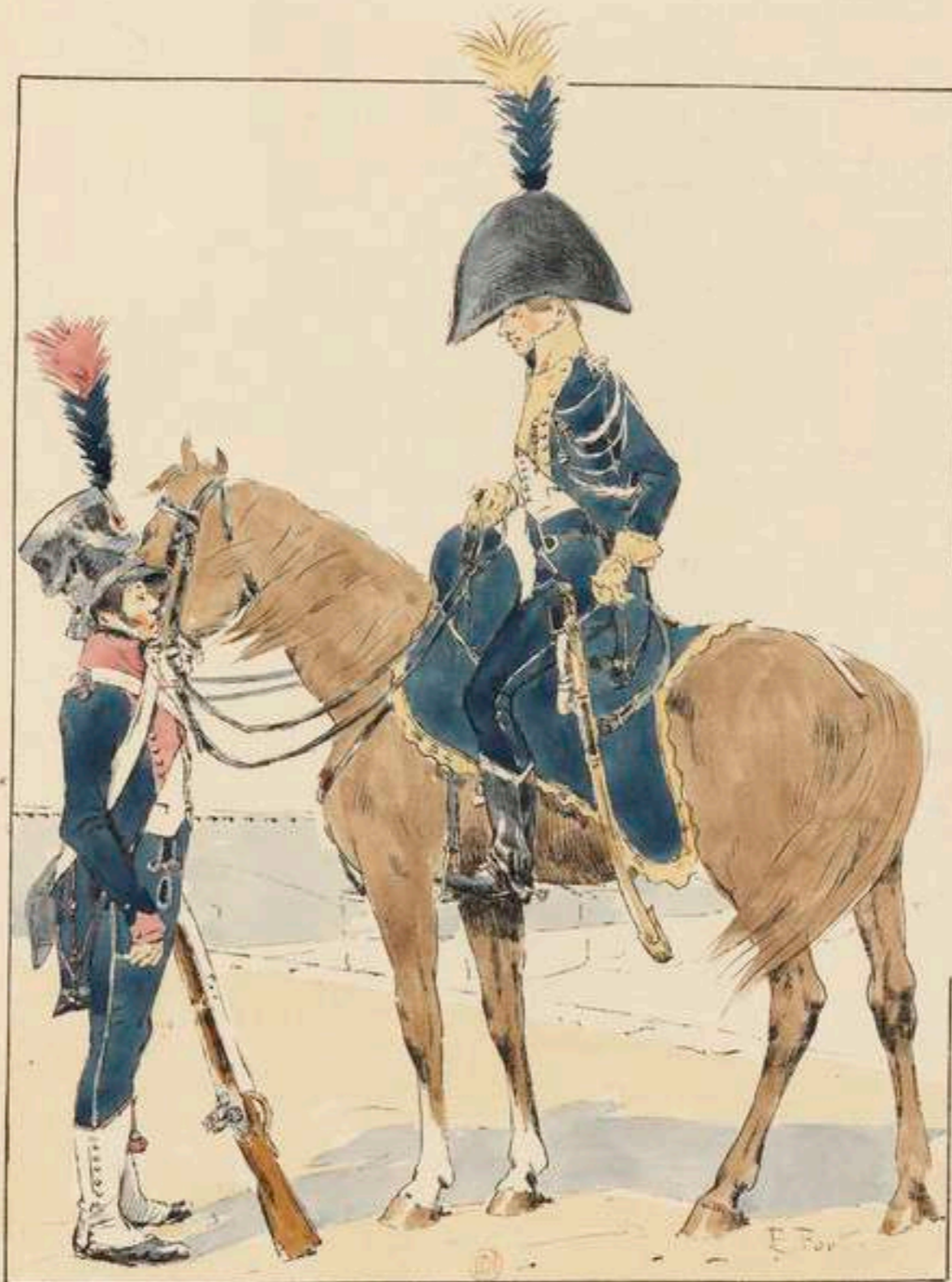
GARDE D'HONNEUR DE ROCHEFORT