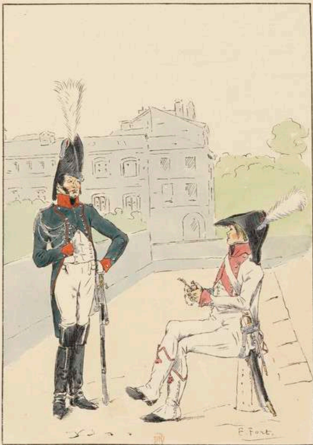
GARDE D'HONNEUR DE SAINTES CAVALERIE INFANTERIE