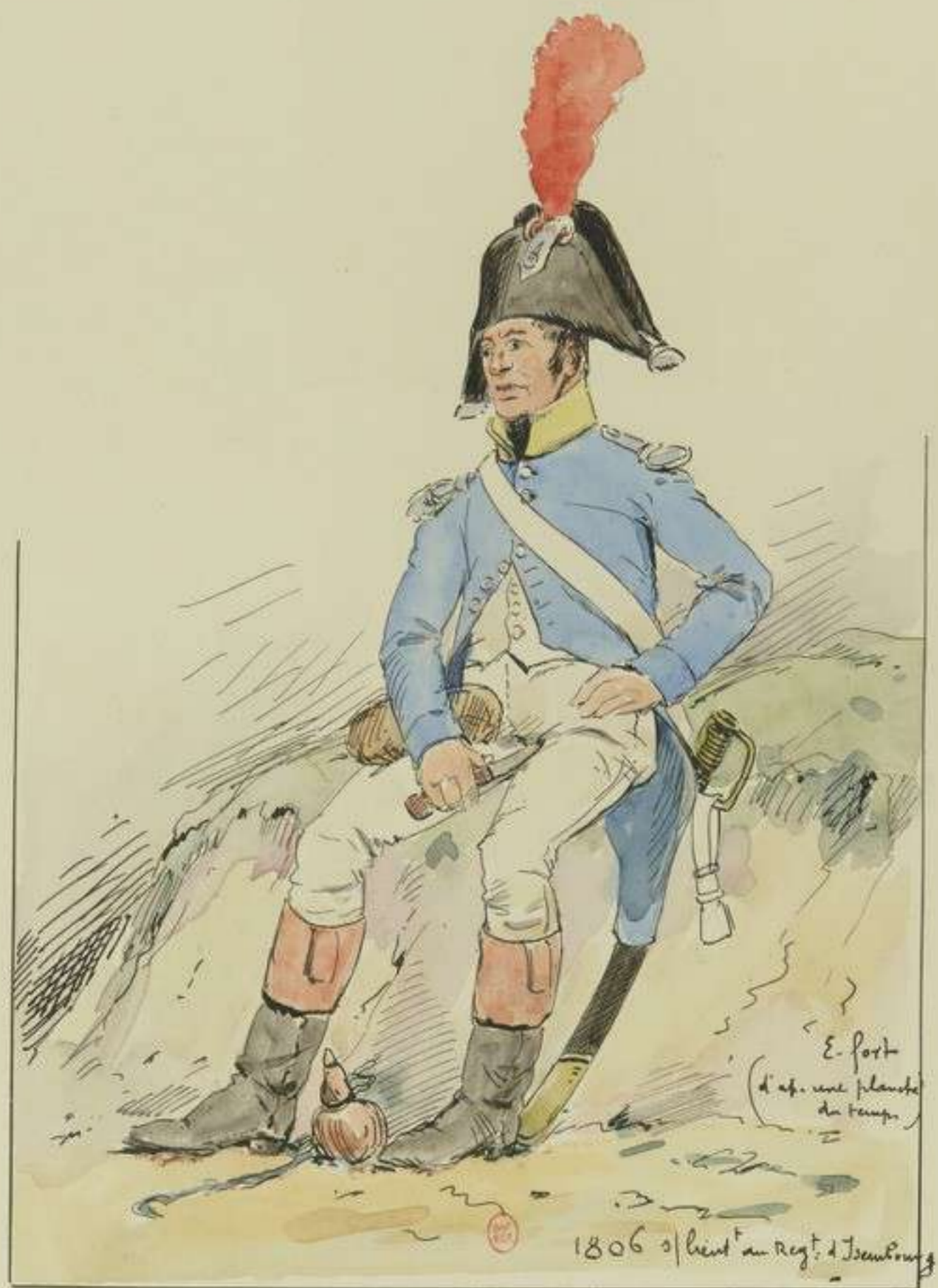
8° - 1806 - Sous-lieutenant au Régiment d'Isembourg d'après une planche du temps