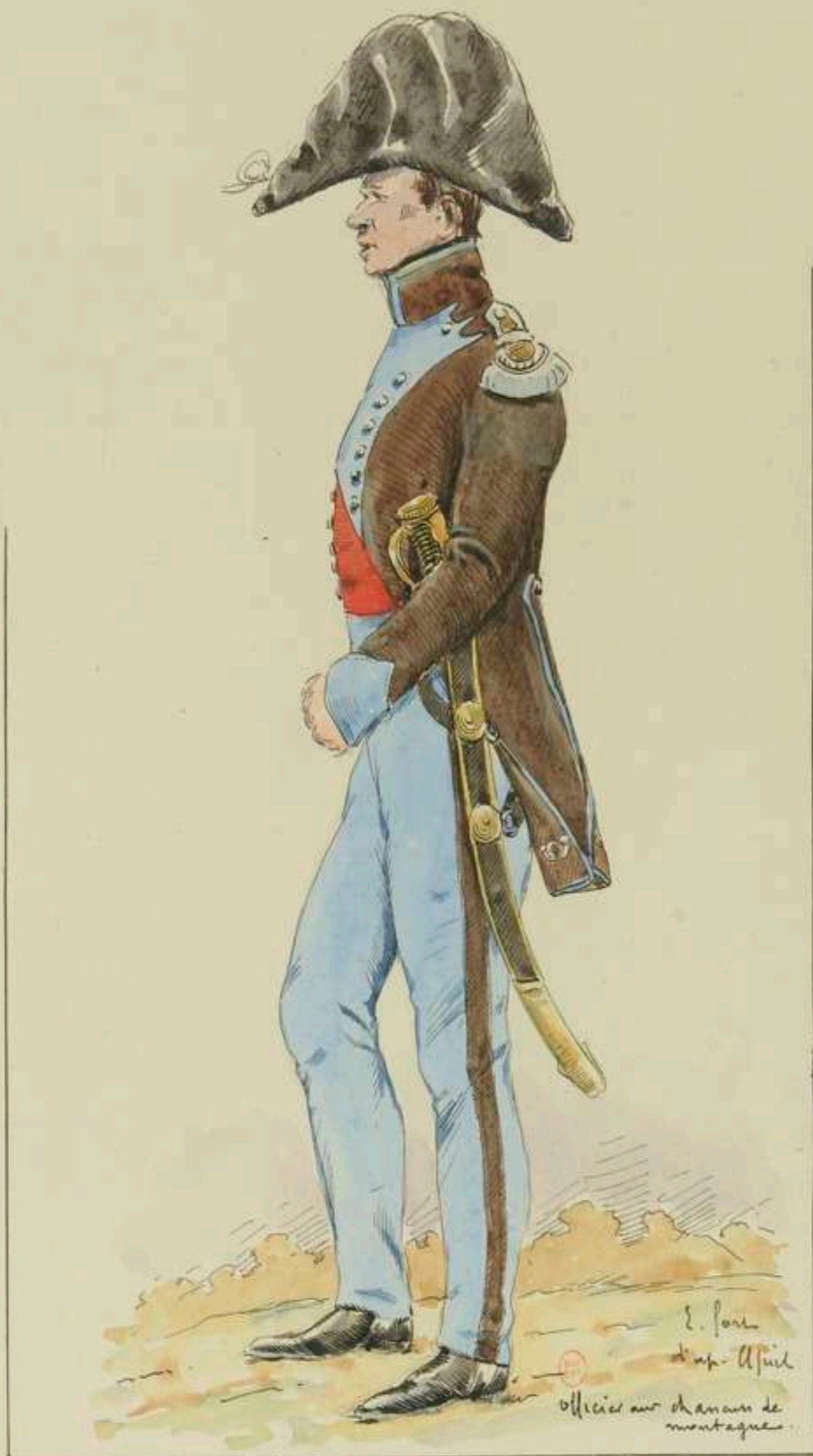
1° - Officier aux Chasseurs de montagne d'après El Guil