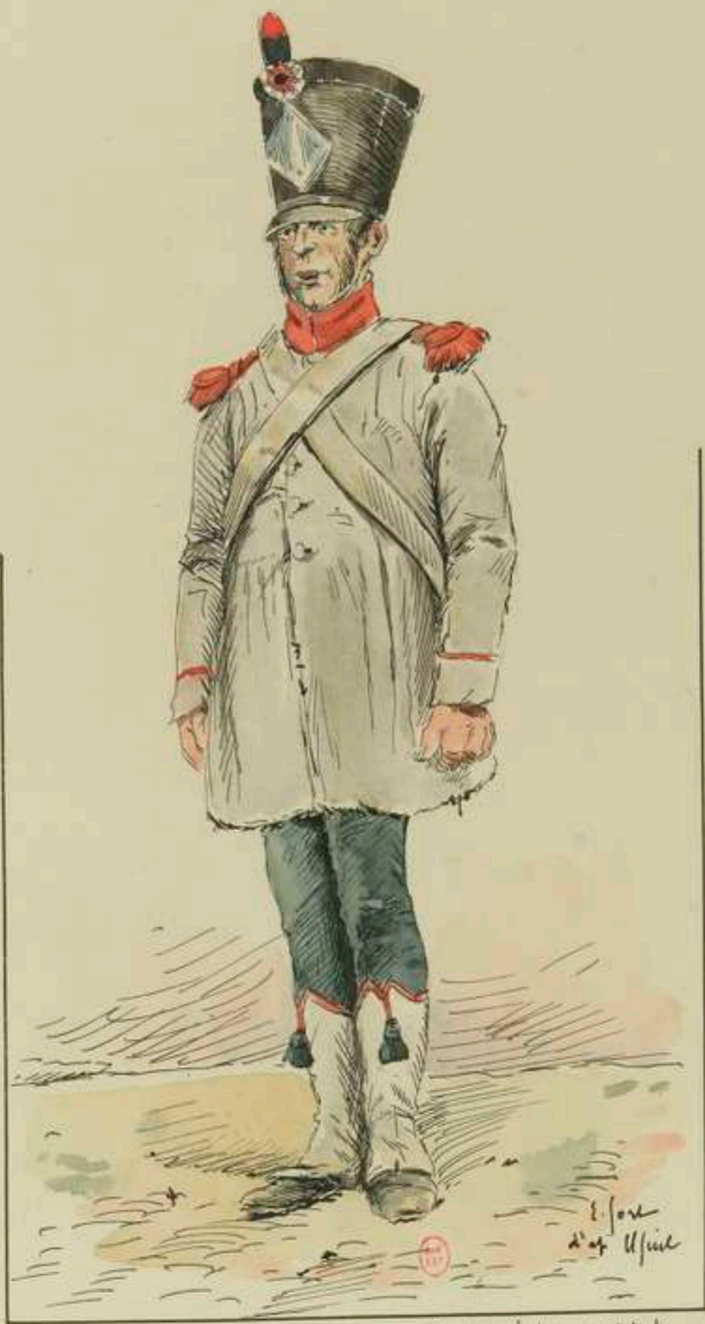
1814 Douanier en petite tenue - Campagne d'Espagne .