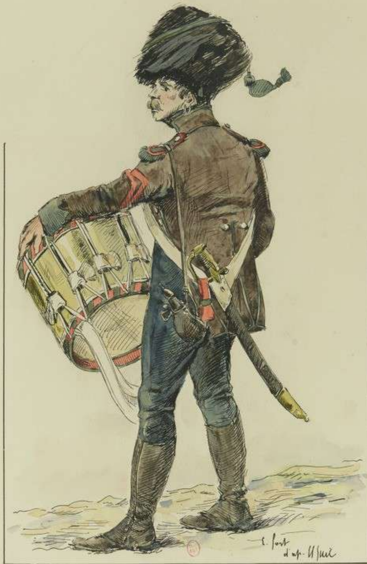
1813 Tambour des Chasseurs de montagne.