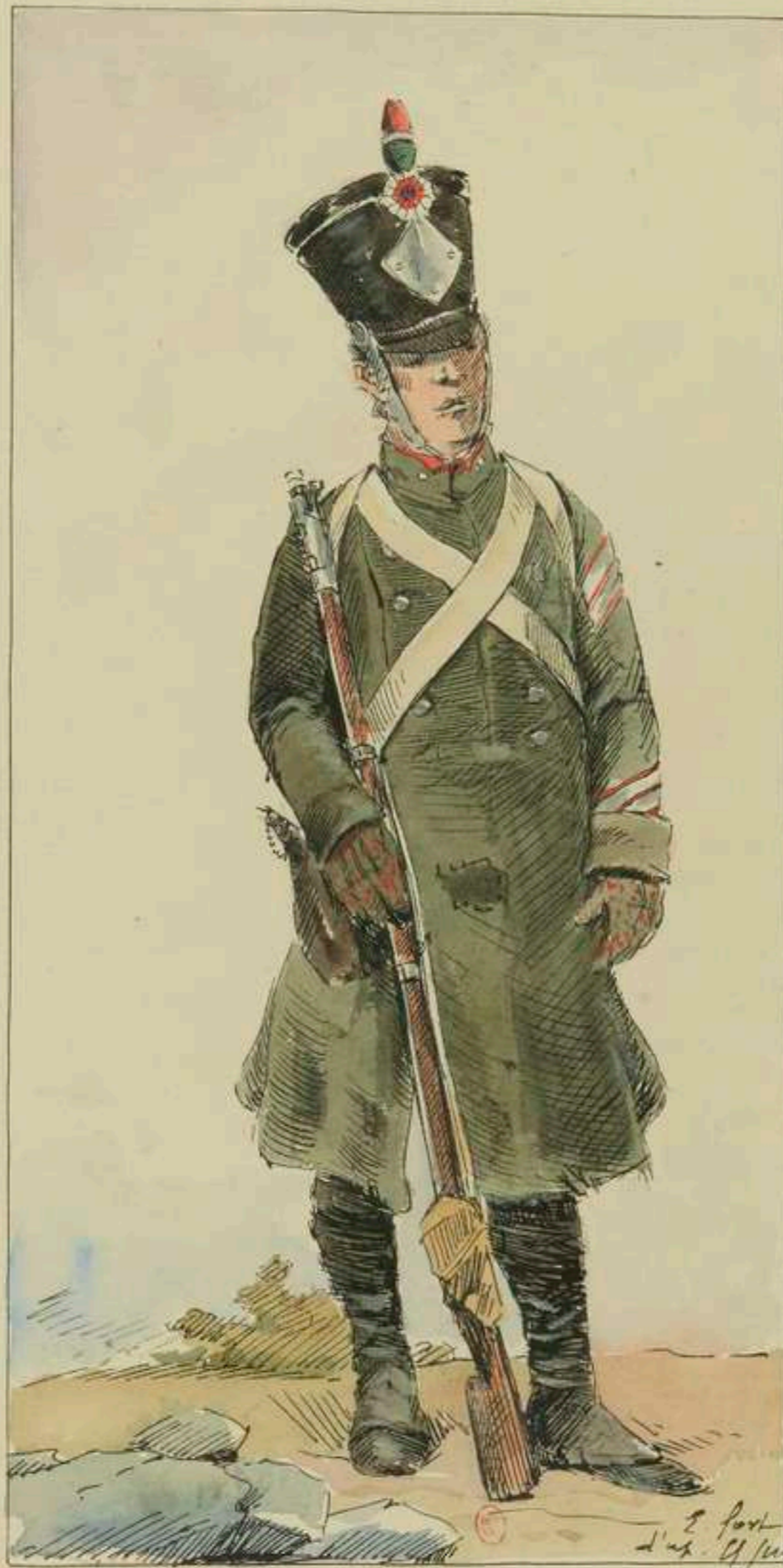
Brigadier des Douanes. Campagne d'Espagne.