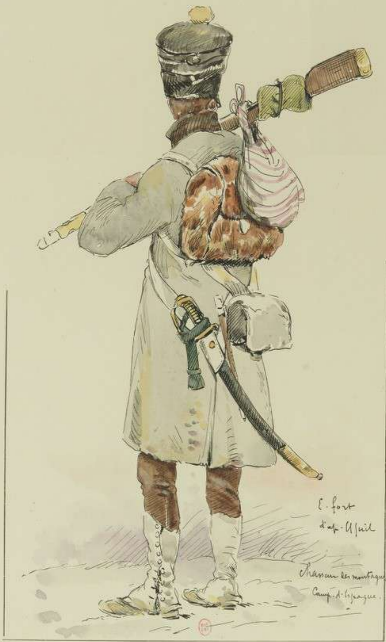
3° - Chasseur de montagne pendant la campagne d'Espagne d'après El Guil