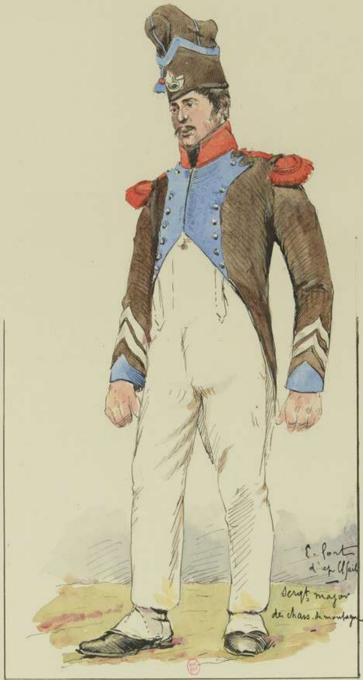
2° - Sergent-major des Chasseurs de montagne d'après El Guil