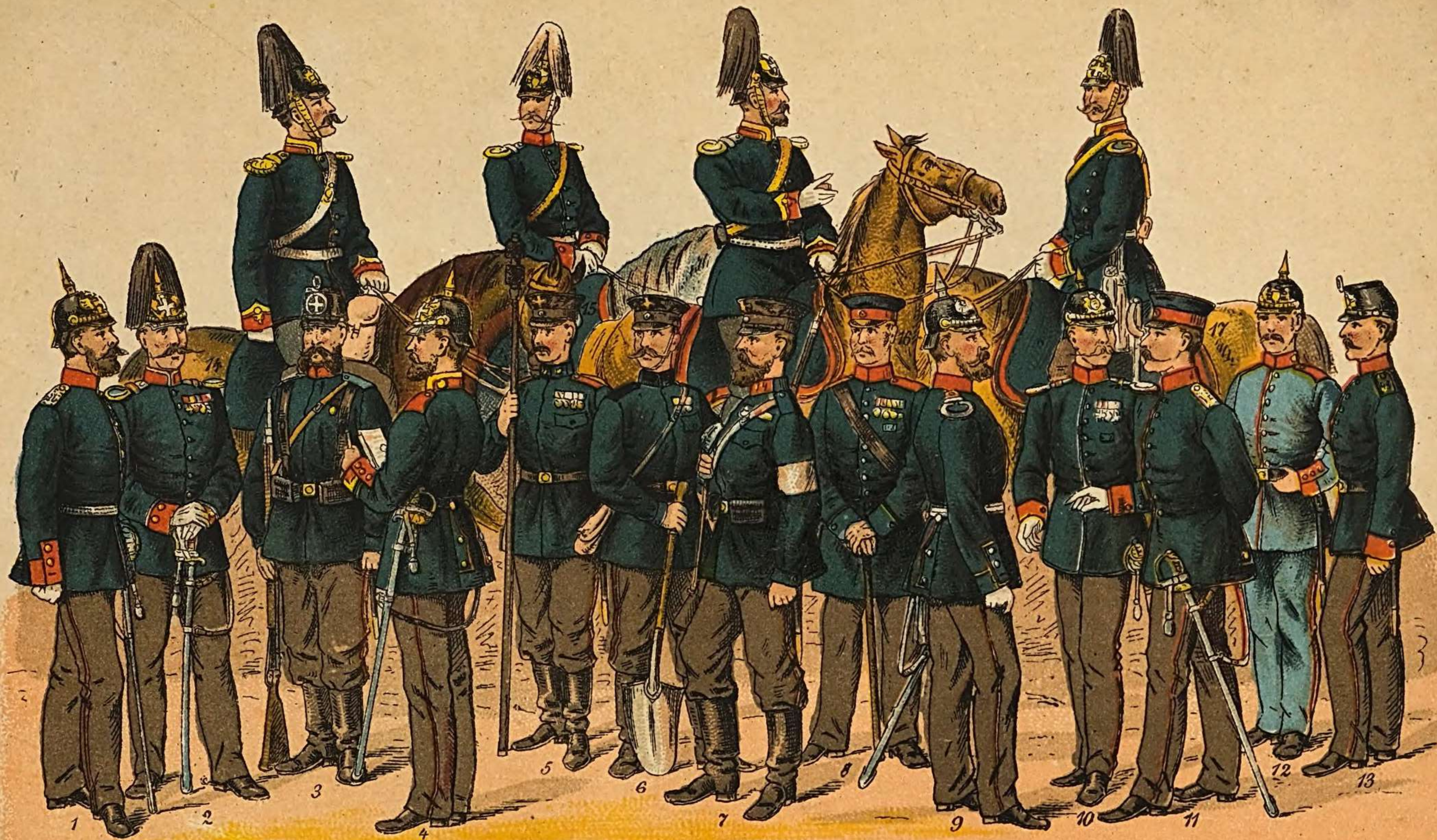
1., Off. d. Landw.-Inf. — 2., Offizier a. D. i. Landw.-Cav.-Armeeunif. — 3., Landwehr (Preussen). — 4., Landwehr-Feldwebel. — 5., Landsturm-Artillerie. — 6., Landsturm-Pionier. — 7., Landsturm-Infanterie. — 8., Invalid. (Preussen). — 9., Inval.-Offizier (Preussen). — 10., Offizier v. d. Cav. u. v. Train in d. Armeeunif. (Sachs.) — 11., Landw.-Inf.-Offizier (Sachs.) — 12., Landwehr (Bayern). — 13., Landwehr (Sachsen). — 14., Landwehr-Cav.-Offizier (Sachsen). — 15., Offizier v. d. Cav. u. v. Train in d. Armeeunif. — 16., Landwehr-Cav.-Offizier (Preussen). — 17., Landwehr-Cav.-Offizier (Württemberg).