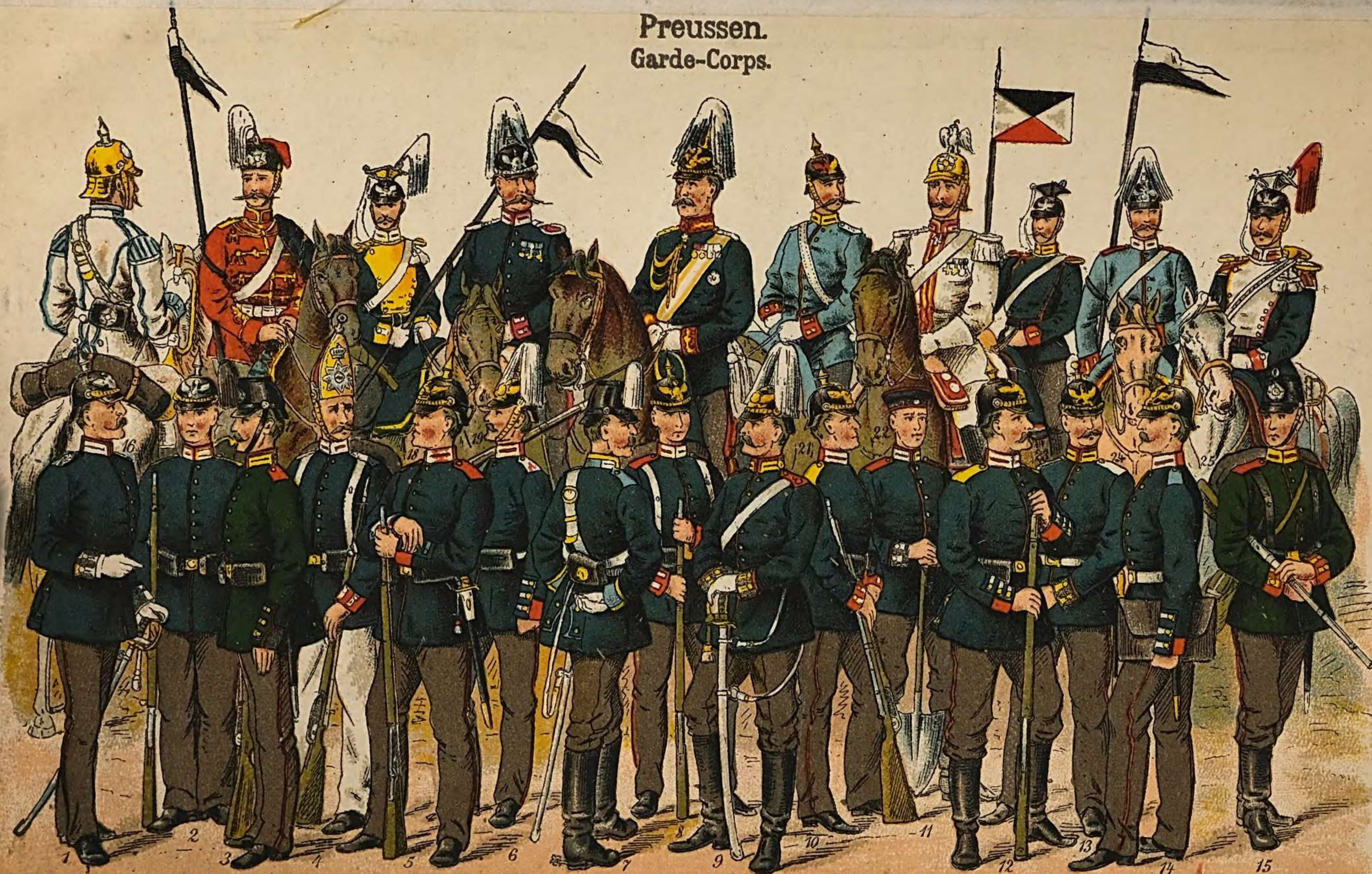
1. Eisenbahn-Reg. — 2. Garde-Füs.-Reg. — 3. Garde-Schützen-Bat. — 4. 1. Garde-Reg. zu Fuss. — 5. Kaiser Franz-Garde-Grenadier-Reg. No. 2. — 6. Kaiser Alex. Garde-Gren.-Reg. No. 1. — 7. Garde-Train-Bat. — 8. 2. Garde-Reg. zu Fuss. — 9. 1. Garde-Feld-Art.-Reg. — 10. 3. Garde-Reg. zu Fuss. — 11. Garde-Pion.-Bat. — 12. 3. Garde-Gren.-Reg. Königin Elisabeth — 13. G.-Fuss-Art.-Reg. — 14. Königin Augusta-G.-Gren.-Reg. No. 4. — 15. Garde-Jäg.-Bat. — 16. G.-Cür.-Reg. — 17. Leib-G.-Hus.-R. — 18. 3. G.-H.-Reg. — 19. Generalstabs-Offizier. — 20. General. — 21. 1. G.-Drag.-Reg. — 22. Reg. Garde de Cavalerie No. 1. — 23. 2. G.-Drag.-Reg. — 24. 3. G.-Drag.-Reg. — 25. 4. G.-Drag.-Reg.