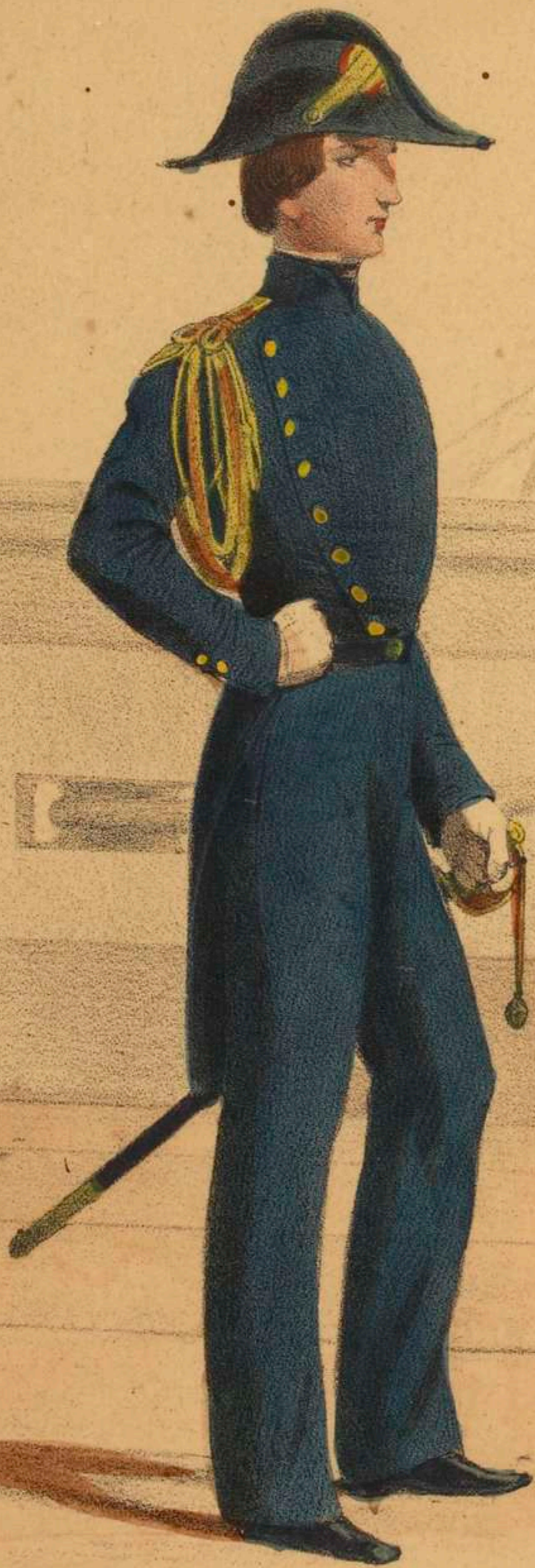
ASPIRANT ( Grande tenue ).