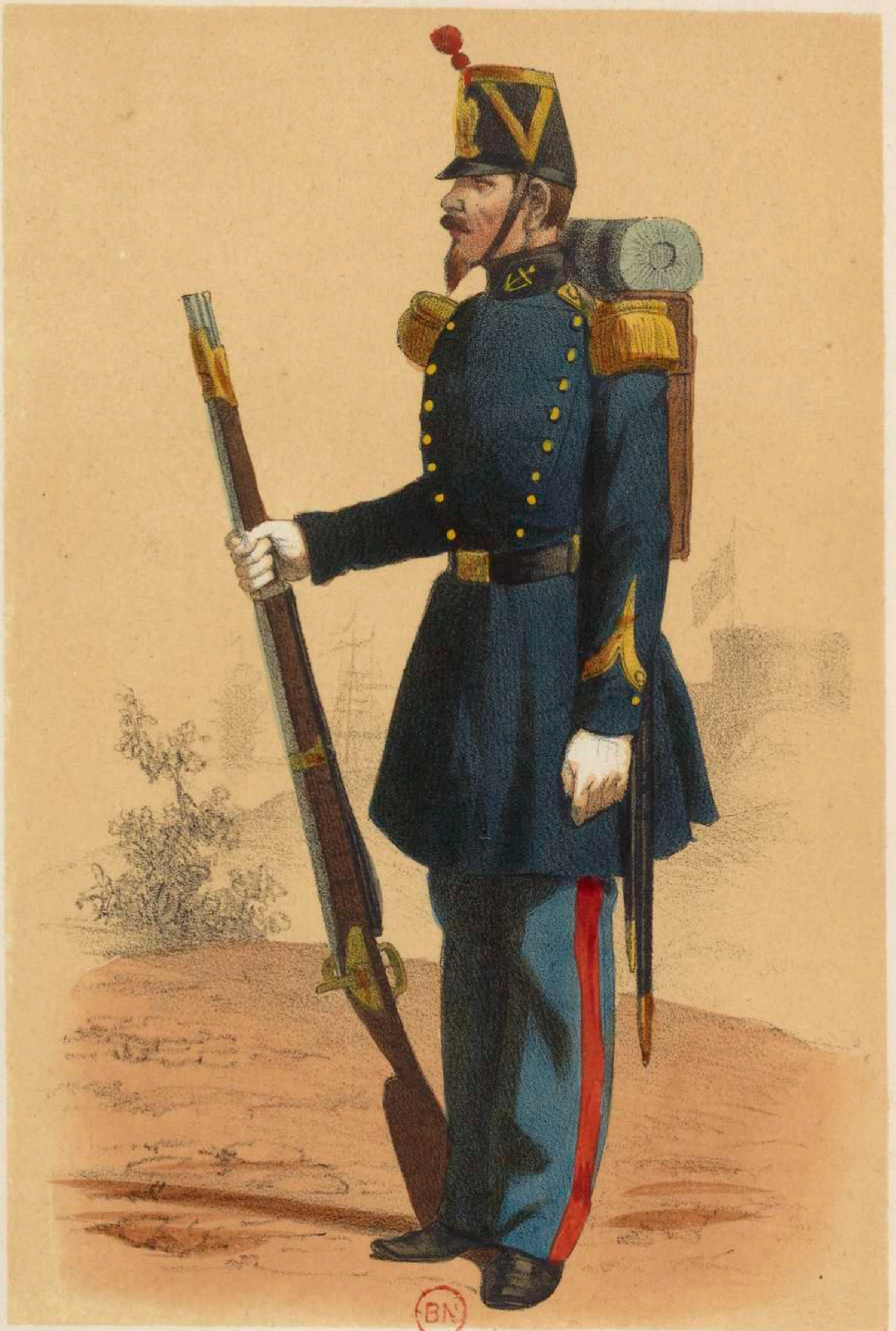
INFANTERIE DE MARINE.