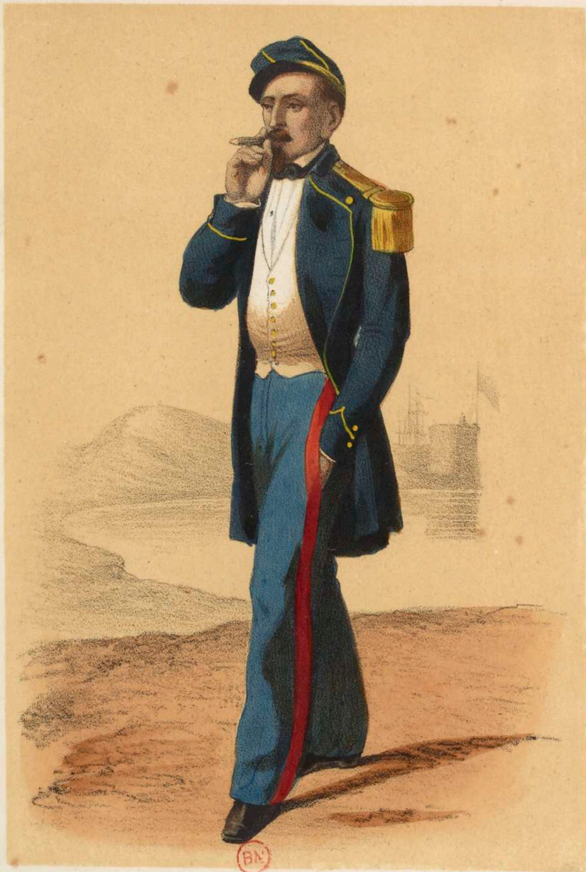
INFANTERIE DE MARINE (Petite tenue).