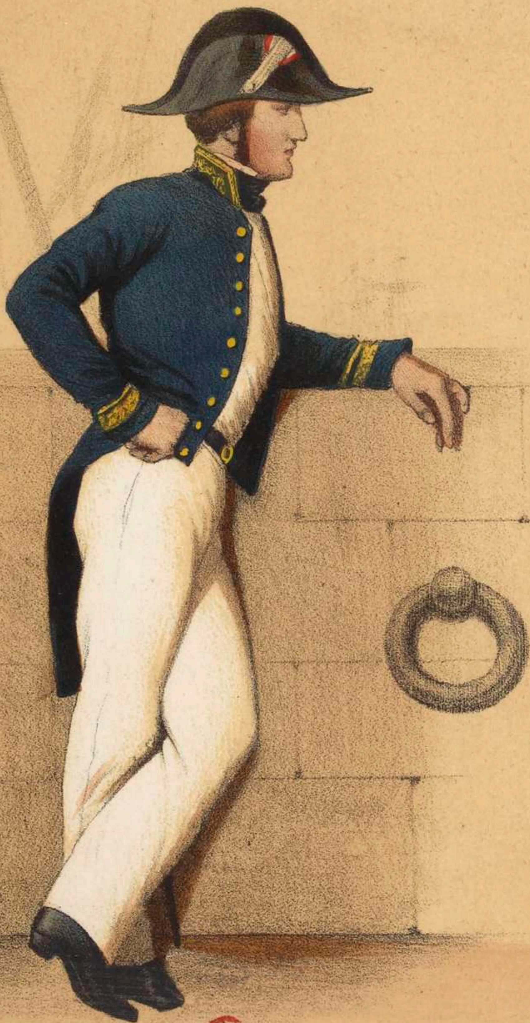
OFFICIER DU GÉNIE.