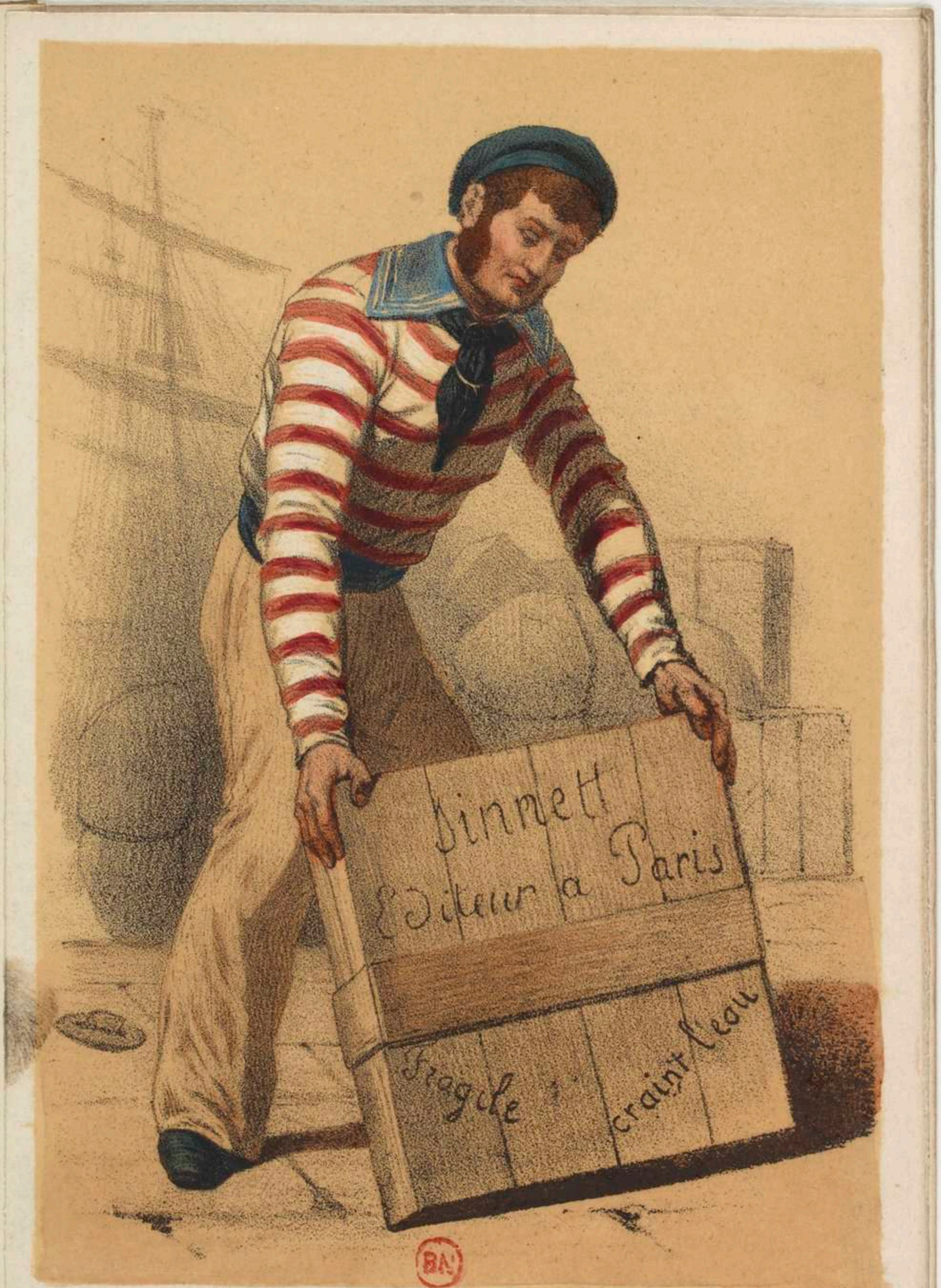
MATELOT DU COMMERCE.