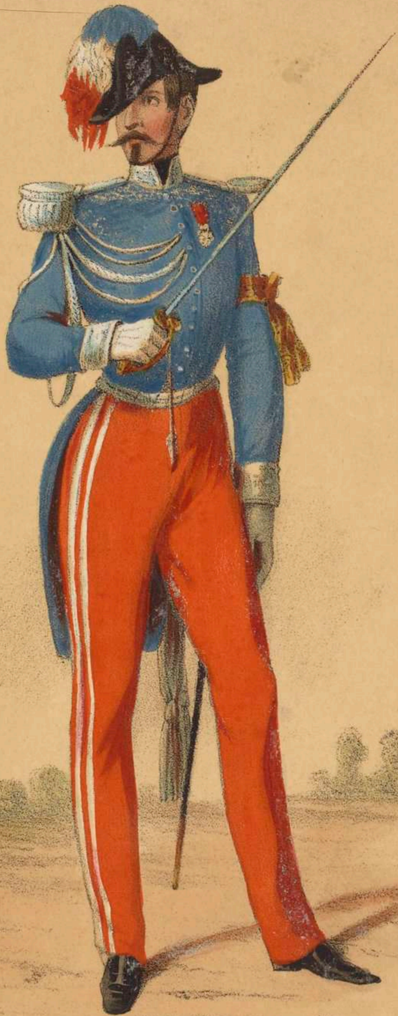
OFFICIER D'ORDONNANCE DE S.M.