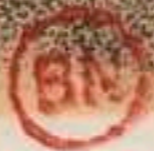
PRÉFET MARITIME .