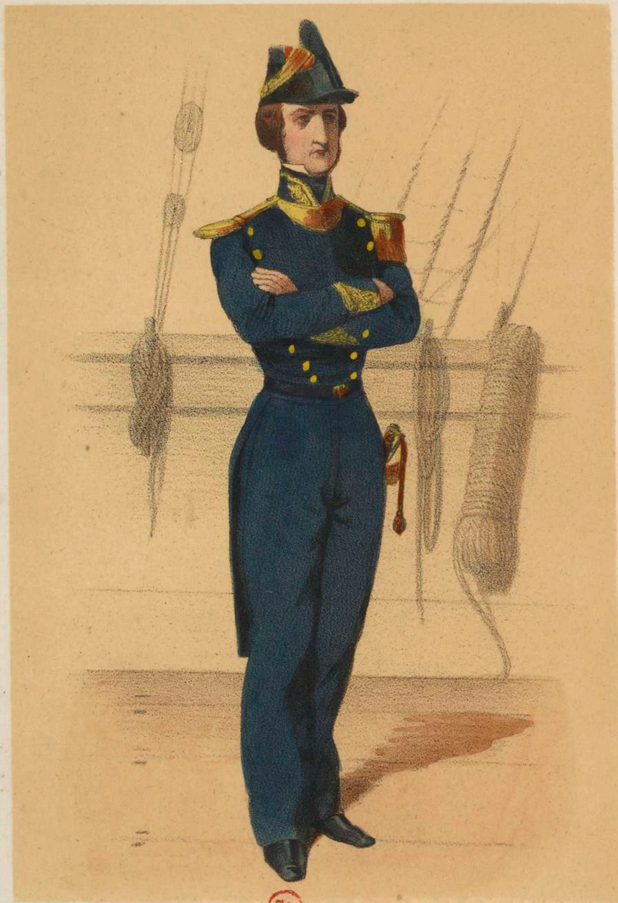
ENSEIGNE (Tenue de garde).