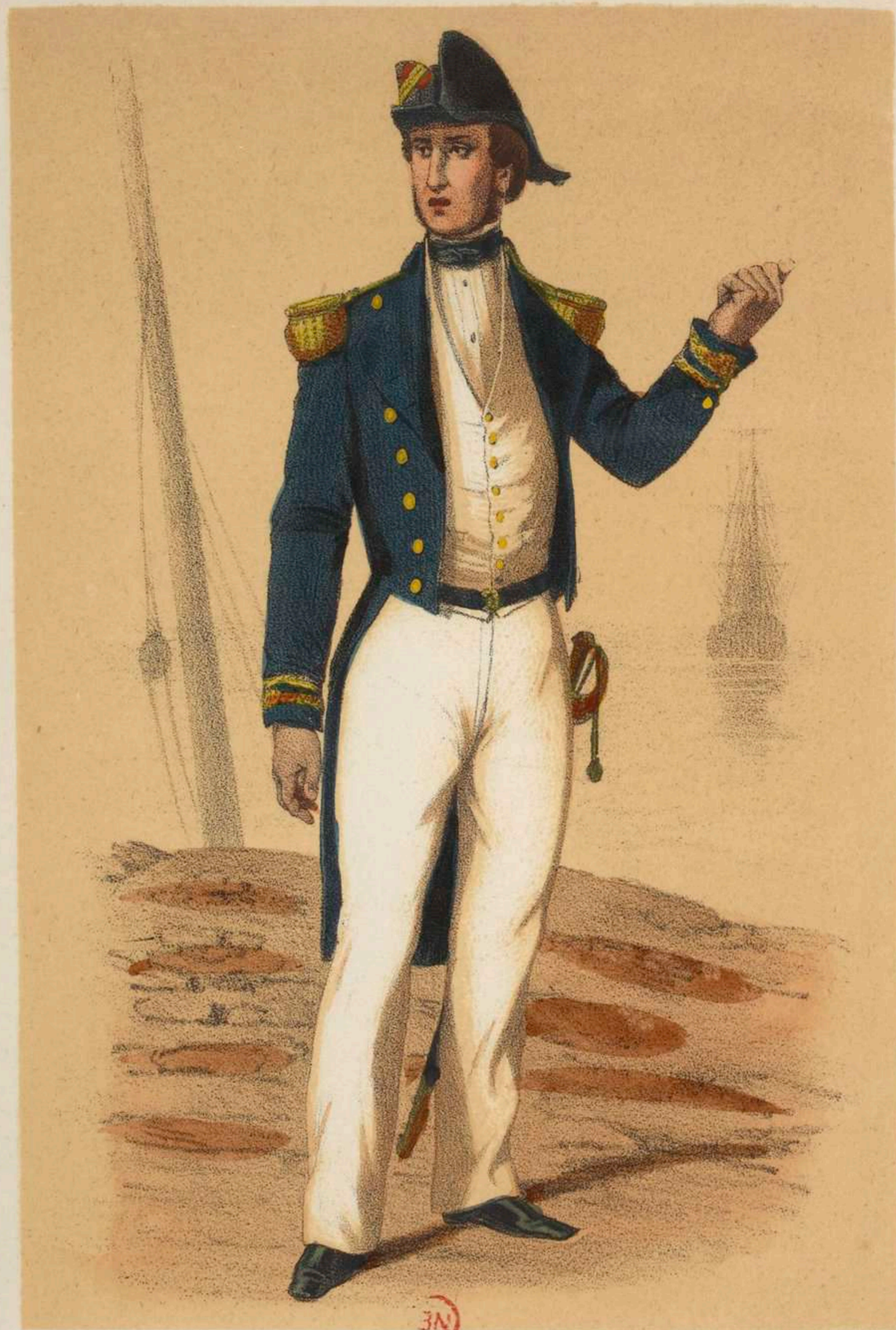
CAPITAINE (Tenue d'Eté) .