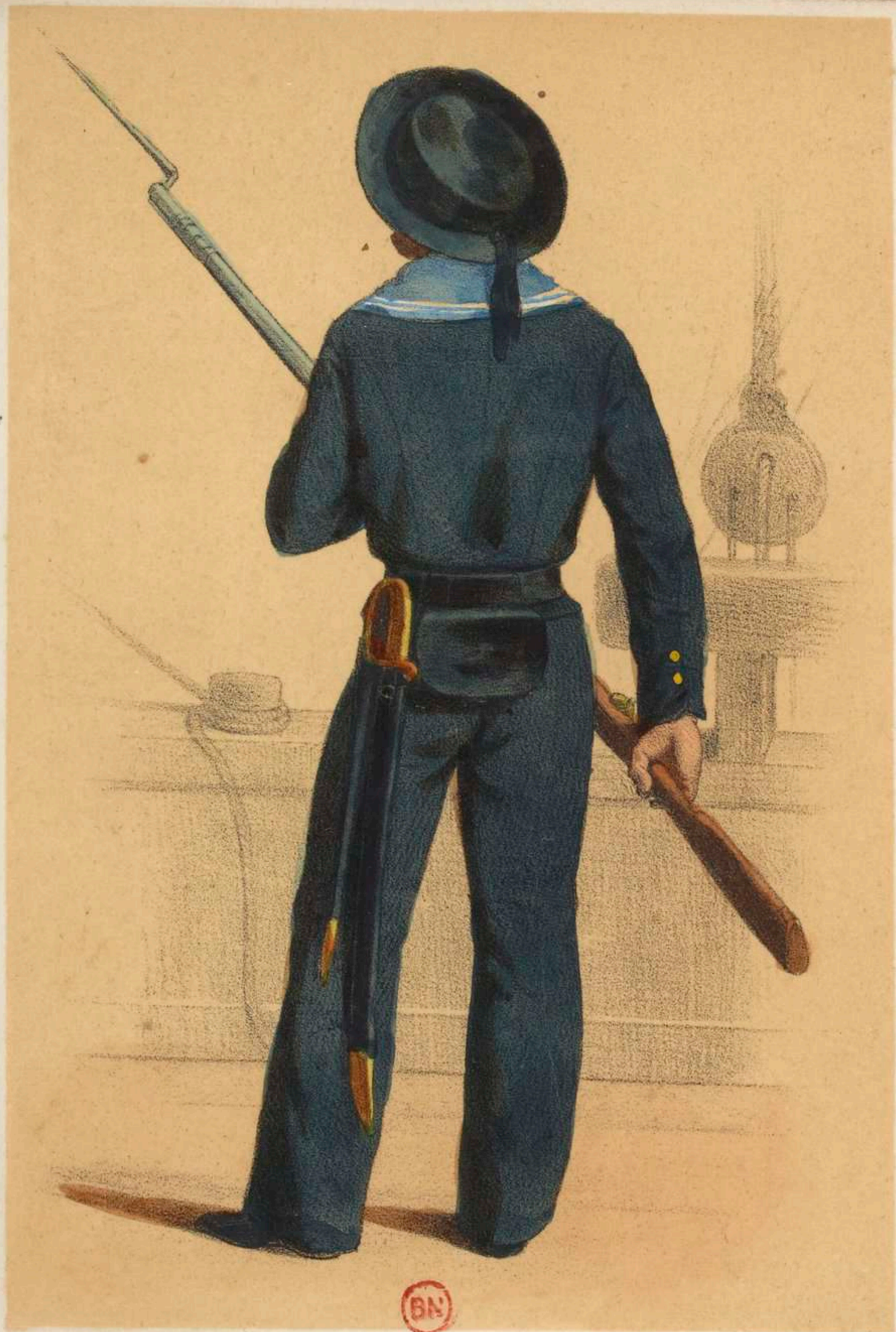
MATELOT ( Tenue de combat ).