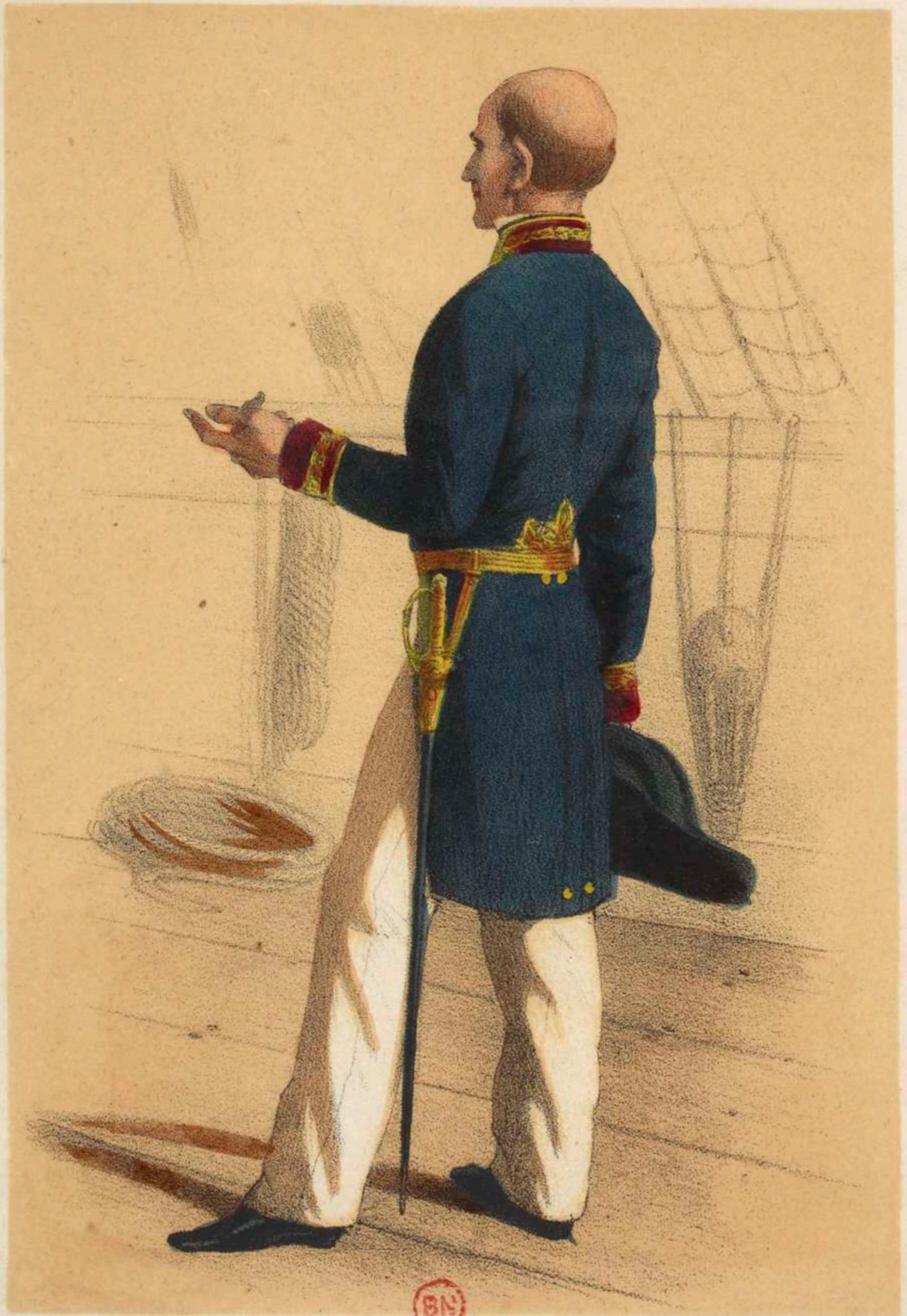
OFFICIER DE SANTÉ.