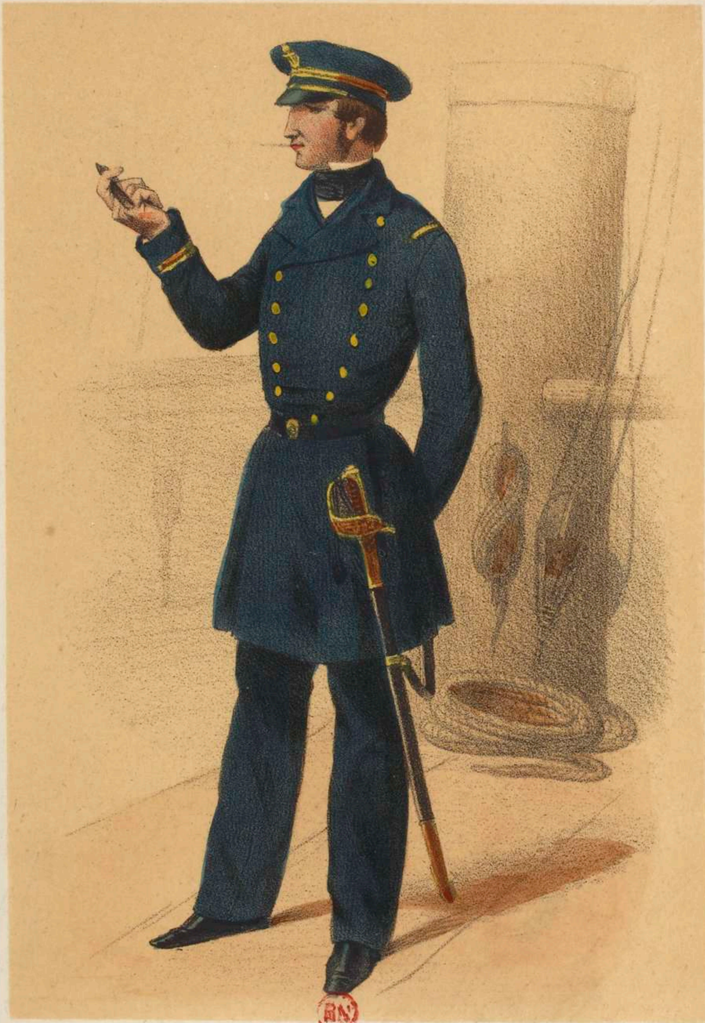
ENSEIGNE (Petite tenue de bord.)